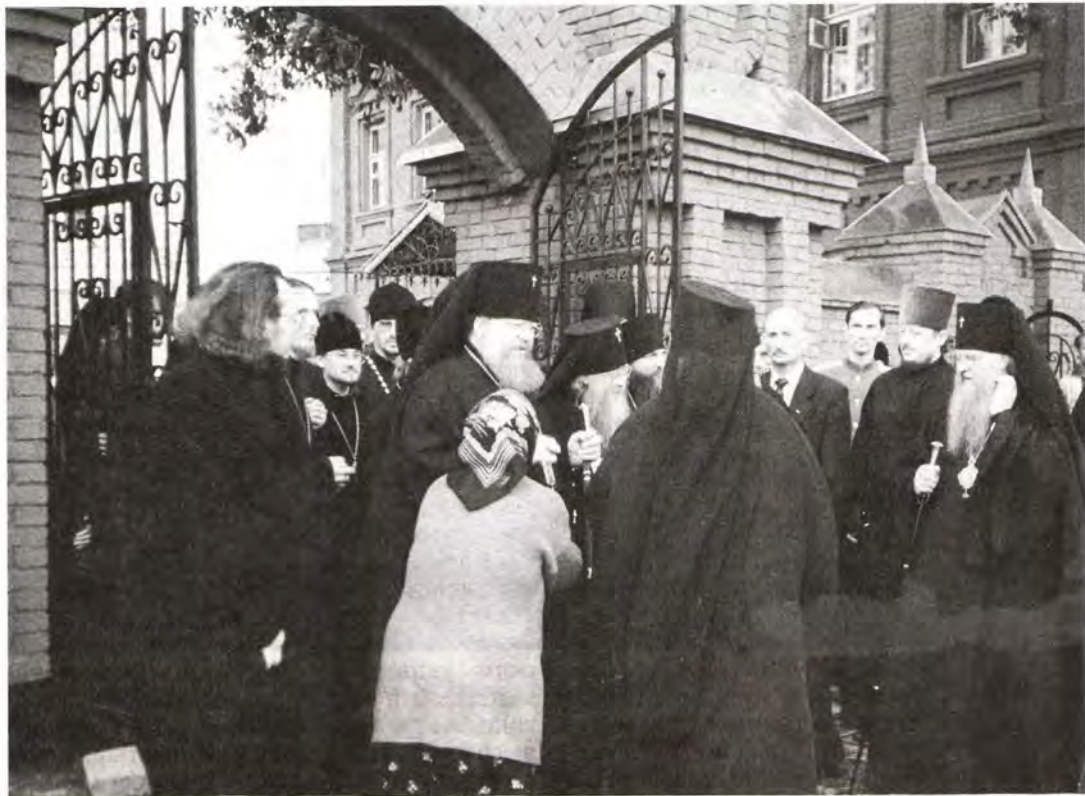
Посещение архипастырями Свято-Иоанно-Богословского монастыря

десантного училища имени генерала Маргелова, исполнивший российский гимн «Славься...» М. И. Глинки.