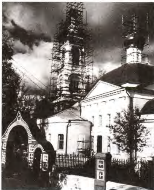
Церковь Покрова Пресвятой Богородицы в Кудинове. 1997 год

уничтожение монастыря. Впоследствии все это вылилось в два больших судебных процесса. По сути это было судилище над Православием и расправа с ним. Участь монастыря давно уже была предрешена совершившими октябрьский государственный переворот. Планы по его закрытию были составлены в недрах 8-го, так называемого ликвидационного, отдела Народного комиссариата юстиции во главе с заместителем наркома П. А. Красиковым.