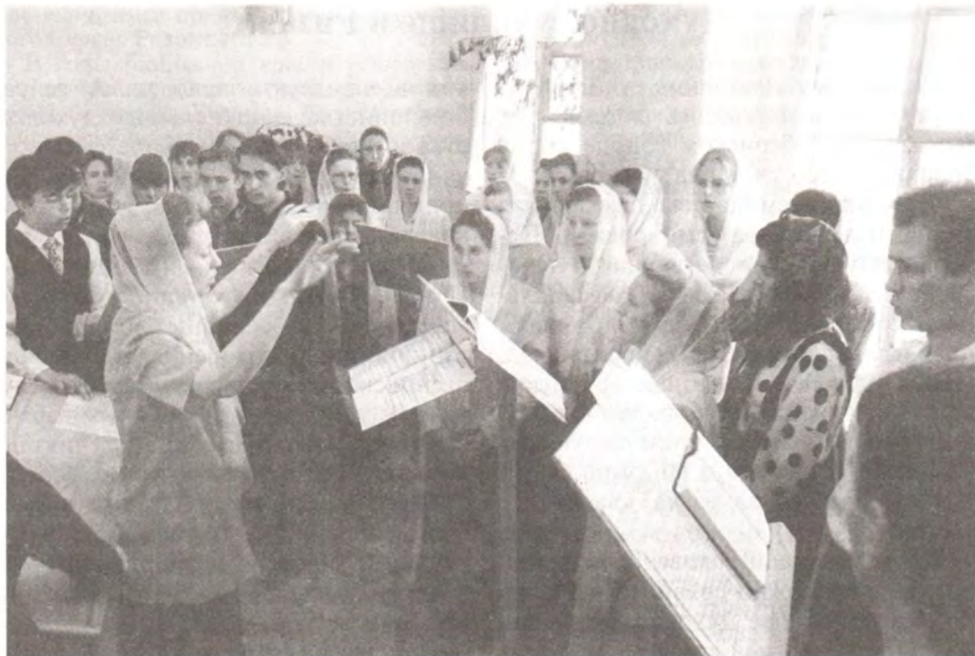
Хор воспитанников Духовного училища