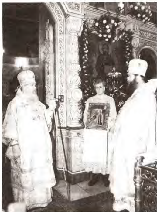
Вручение иконы Божией Матери «Целительница» Святейшему Патриарху Алексию

Ваше Святейшество! Приветствую Вас от имени клириков и прихожан храма Всех святых, Вашего Патриаршего подворья. Мы рады, что в этот день Вы принесли нам сугубую радость своим посещением и богослужением. Мы очень нуждаемся в Ваших молитвах, в Вашем Первосвятительском благословении. Все святые сегодня взирют с неба на нас, предстоящих и моля-