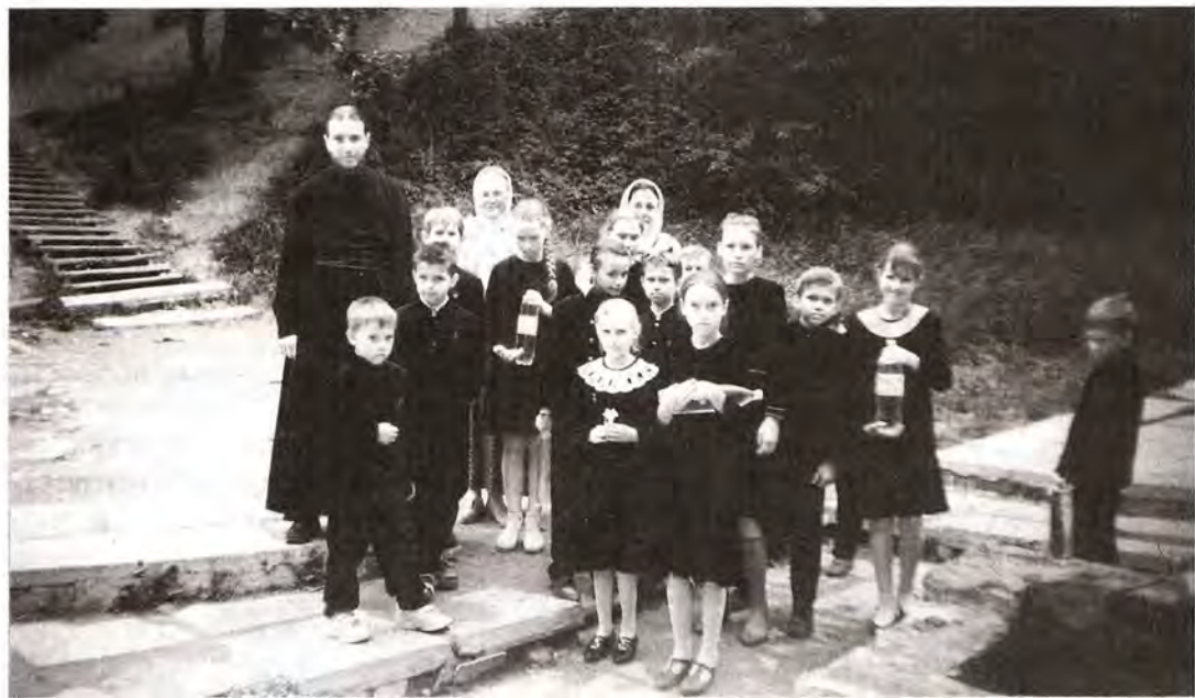
У святого источника в Иоанно-Богословском монастыре

В России в течение десятилетий целенаправленно уничтожалось духовное сословие. Но, когда смотришь на рязанских гимназистов, этих мальчиков и девочек в зеленых сюртучках и платьицах, у которых все ясно впереди, невольно вспоминается: «Господь из камней сих может воздвигнуть детей Аврааму». Мы, родители, – камни. Хоть и верующие, но почти все пришли в храм поздно... А наши дети в храм не пришли – они там родились и растут. И радуют нас своим ростом, осиянным Божией благодатью.