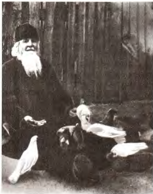
Архимандрит Ефрем. 1930-е годы

Старенькому отцу Ефрему верующие приносили в сторожку еду, кто сколько мог. С большой благодарностью принимал он эти дары, понимая, как им самим трудно прокормить свои семьи. В стране в ту пору была карточная система. Но даже в этом тяжелом положении отец Ефрем умудрялся помогать другим. Он «перераспределял» приносимые ему продукты, раздавая их приходившим к нему более бедным людям. А тем, кто позажесточнее, он делал упреки (святые упреки!) в том, что «уж не голодом ли они хотят его уморить?» Эти люди недоумевали: ведь чуть ли не день назад они принесли много еды, — но не обижались и несли еще и еще, не подозревая, что совершают большое богоугодное дело.