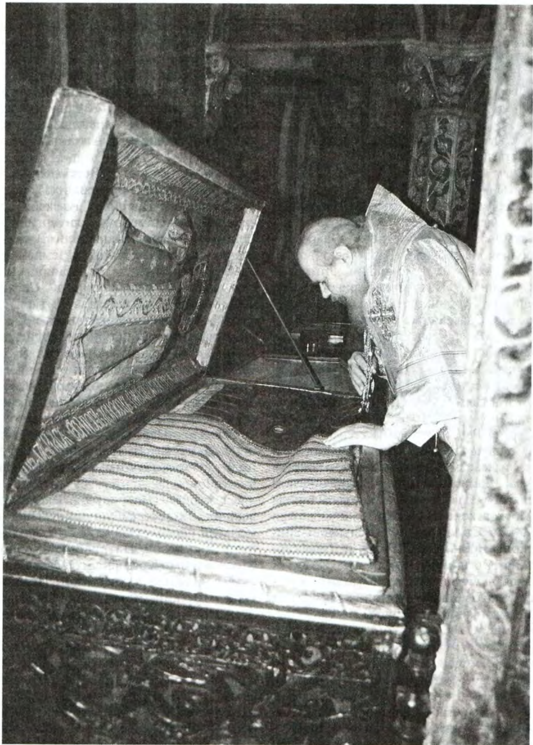
Святейший Патриарх Алексий у мошей святого благоверного царевича Димитрия в день его памяти. Архангельский собор Московского Кремля, 16 июня 1998 года