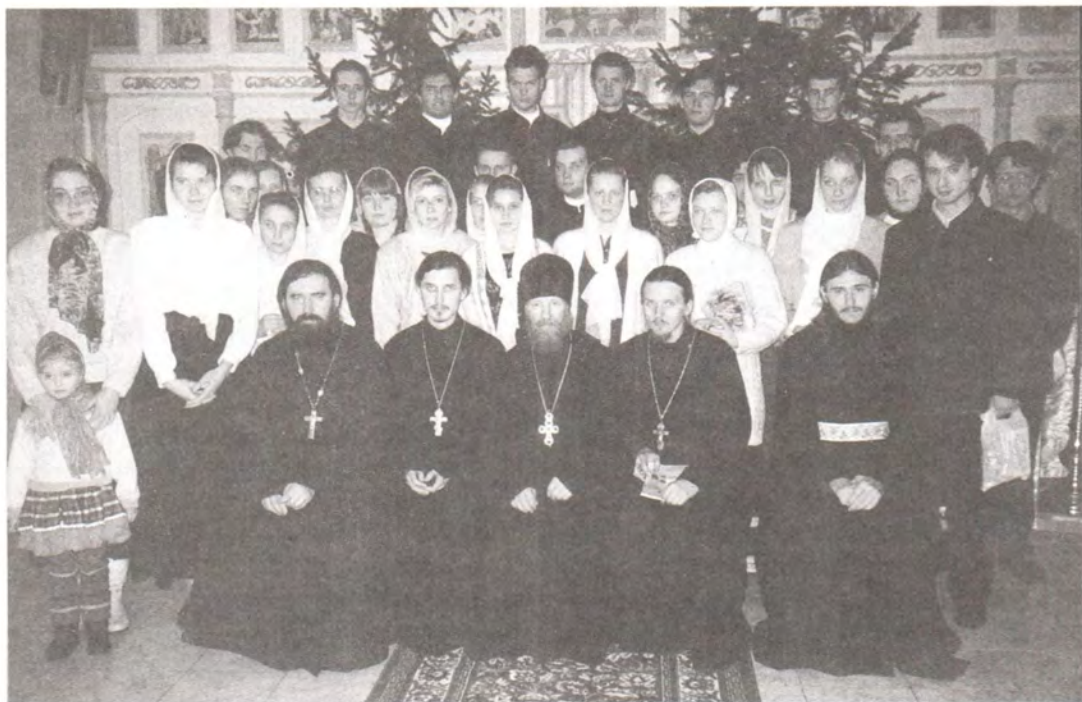
Учащиеся и преподаватели Духовного училища в день Рождества Христова 1998 года