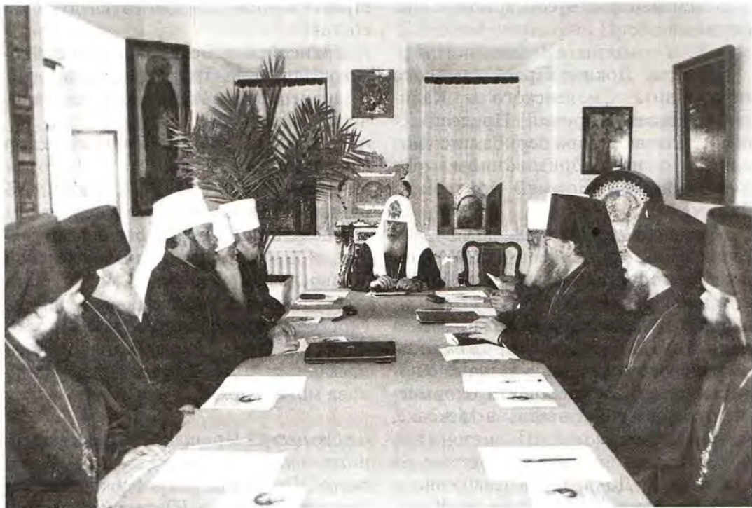
Заседание Священного Синода Русской Православной Церкви 17 июля 1998 года