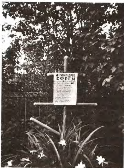
Могила архимандрита Ефрема. Кудиново

Не умрет веками Пастырь наш родной, В русском человеке Светлый образ твой. Верит Русь Святая, Что еще сильнее Ты в селеньях Рая Молишься о ней. Помнит Бог моленья Жаркие твои. Даст Он утешенье Для родной земли.