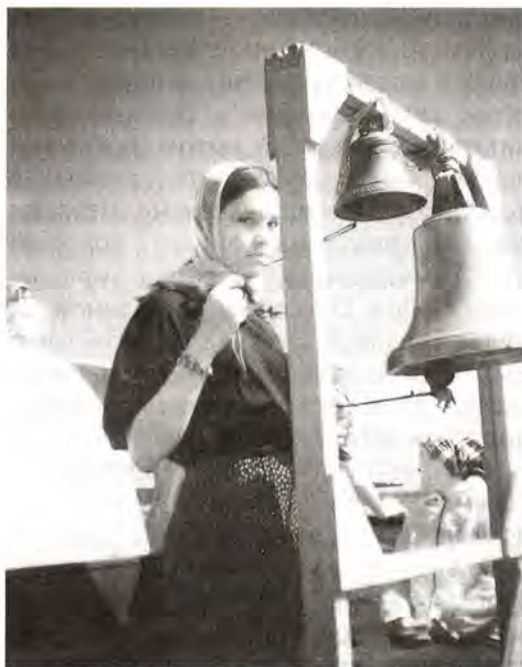
Звени, звени, колокол!

О том, как жизнь в православном лагере влияет на состояние души, рассказывали и девочки-подростки из старшего отряда (некоторые из них отдыхают в «Озерном» не впервые). Вспоминали, как возмущались поначалу их сверстницы из нецерковных семей по поводу того, что в лагере нет дискотек, телевизора... А потом просили родителей привезти им нательные крестики, начинали ходить вместе со всеми на утреннее и вечернее правило, участвовать в крестных ходах. И увозили с собой домой частичку впервые познанной Божией благодати.