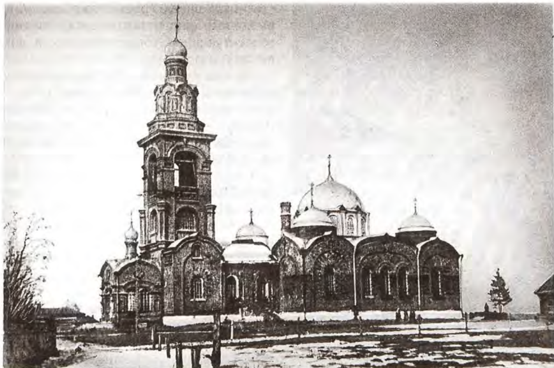
Церковь Святой Троицы в Каменке. Конец 1930-х годов (1938)

Монашеский постриг принял 8 марта 1886 года. 23 августа того же года был рукоположен в иеродиакона, а через 10 лет – 8 августа 1896 года – в иеромонаха.