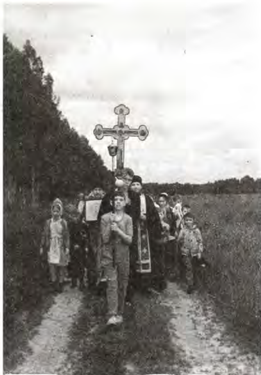
Крестный ход в летнем детском лагере

Нынешним летом в третий раз прошла в детском лагере «Озерный», расположенном в живописном сосновом бору неподалеку от старого русла Оки, православная смена. Многие воспитанники гимназии поехали отдыхать бесплатно, а вот для остальных цена на путевку была сравнима со стоимостью отдыха где-нибудь на Лазурном берегу Средиземноморья (что, конечно, вызвано не желанием извлечь какую-то прибыль, а необходимостью покрыть расходы – благоустройство в лагере находится на высоком уровне). Тем не менее, претендентов на путевки – в основном, конечно, москвичей – было более чем достаточно. Родители знают: в православ-