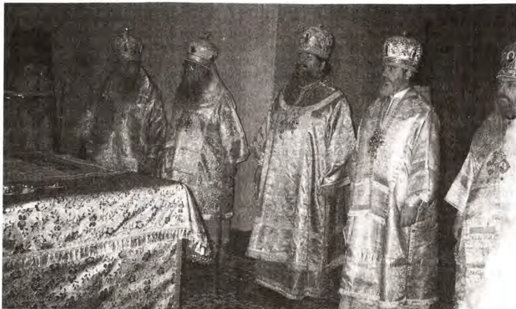
Праздничное богослужение в Успенском соборе Рязанского кремля 22 июня 1998 года