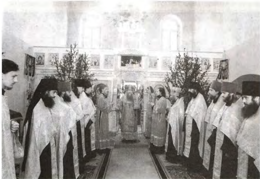
Божественная литургия в день выпускного акта

В подготовке к празднованию 800-летия епархии училищу было отведено одно из основных мест: воспитанники шили облачения, разучивали песнопения к архиерейскому богослужению, убирали и украшали к торжествам Успенский собор. В училище проходила и трапеза высоких гостей: с 1996 года оно располагается в бывшей «гостинице знати» Рязанского кремля и является официальной резиденцией архиепископа Рязанского и Касимовского Симона. Владыка часто бывает здесь еще и потому, что препода-