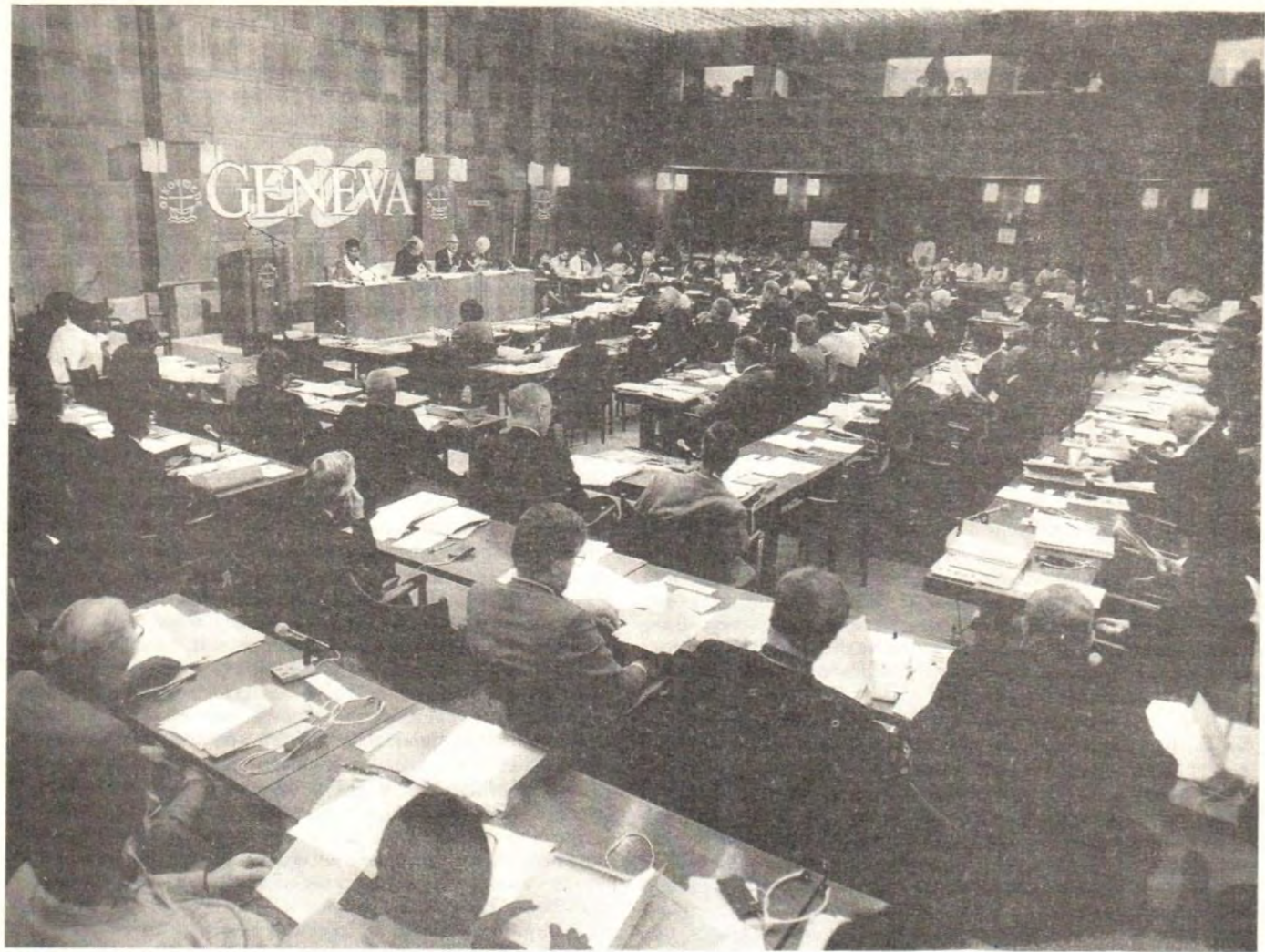
В зале заседаний Всемирной конференции «Справедливость, мир и целостность творения»

всех и несет в себе обетование жизни в полноте и гармонии человеческих отношений. В ответ на завет Божий мы исповедуем нашу веру в Троидного Бога, в Котором и возможно общение людей.