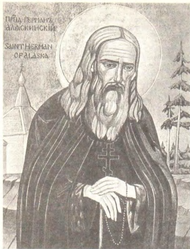
Преподобный Герман Аляскинский