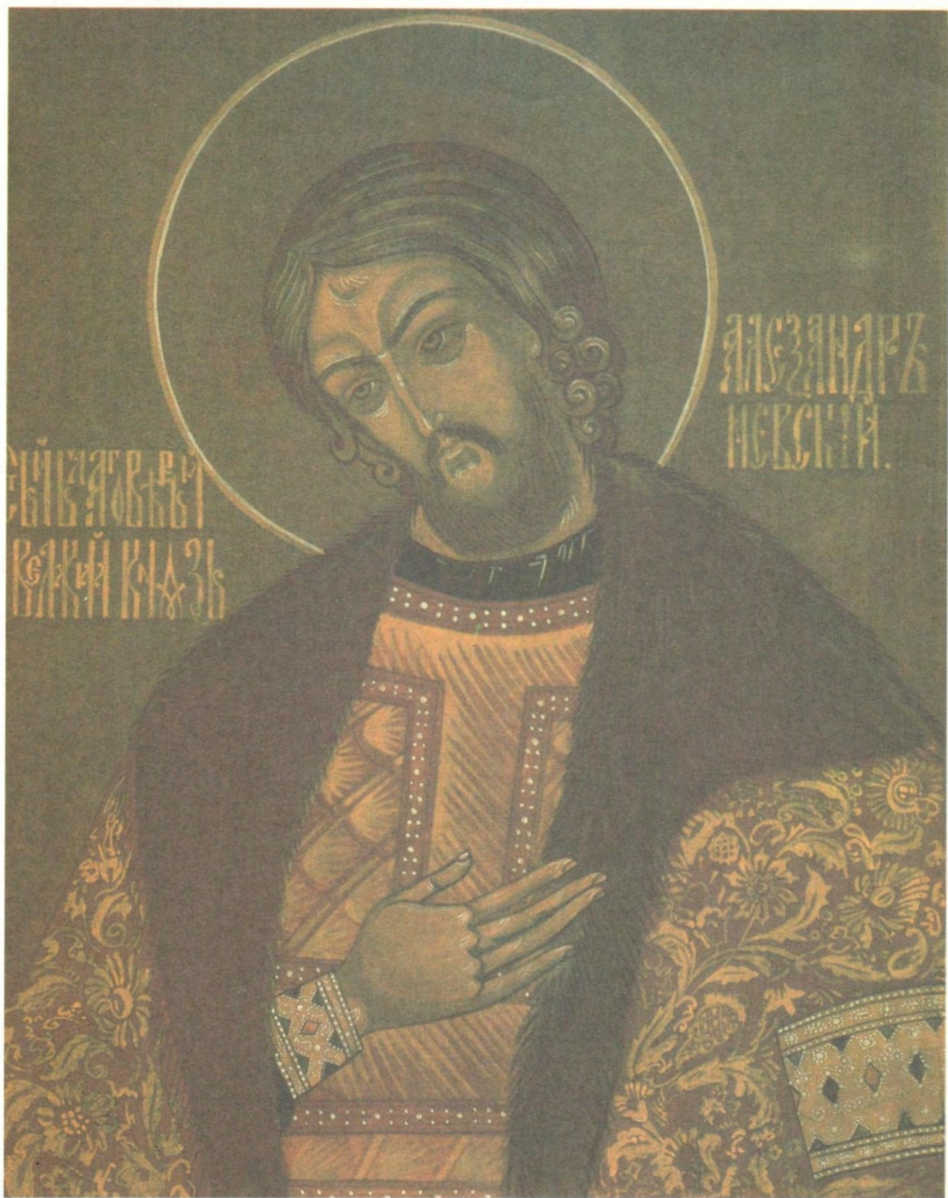
СВЯТОЙ БЛАГОВЕРНЫЙ КНЯЗЬ АЛЕКСАНДР НЕВСКИЙ

Икона из Троицкого собора Александро-Невской Лавры