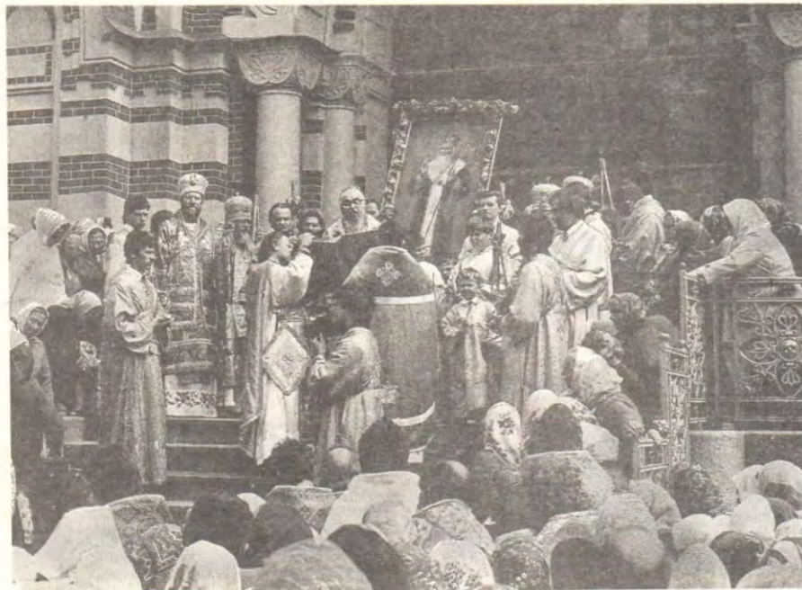
Крестный ход в день памяти святителя Афанасия, Патриарха Цареградского

Божественную литургию в день памяти святителя, 15 мая, а накануне — всенощное бдение совершили митрополит Харьковский и Богодуховский Никодим, архиепископ Свердловский и Курганский Мелхиседек, епископы Познанский и Лодзинский Симон (Польская Православная Церковь), Орловский и Брянский Паисий, Калининский (ныне Тверской) и Кашинский Виктор.