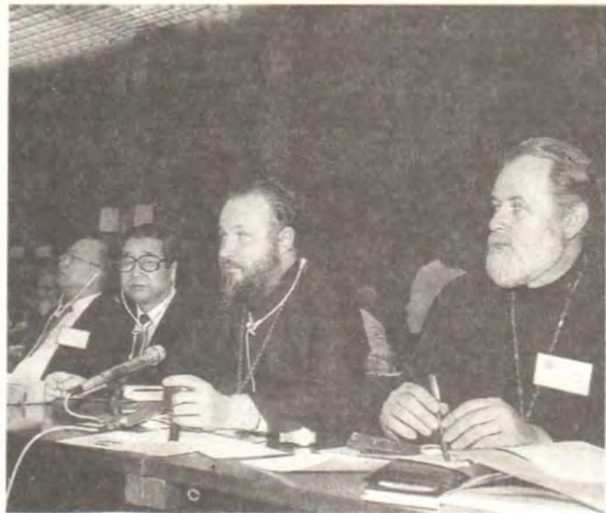
В президиуме Всемирной конференции «Справедливость, мир и целостность творения», Сеул

Библейскими повелениями — например, владычествуйте и обладайте землею — злоупотребляли веками, оправдывая разрушительные действия по отношению к творению. Раскаиваясь в этом злоупотреблении, мы признаем, что люди, сотворенные по образу Божию, должны заботиться о творении и жить с ним в гармонии.