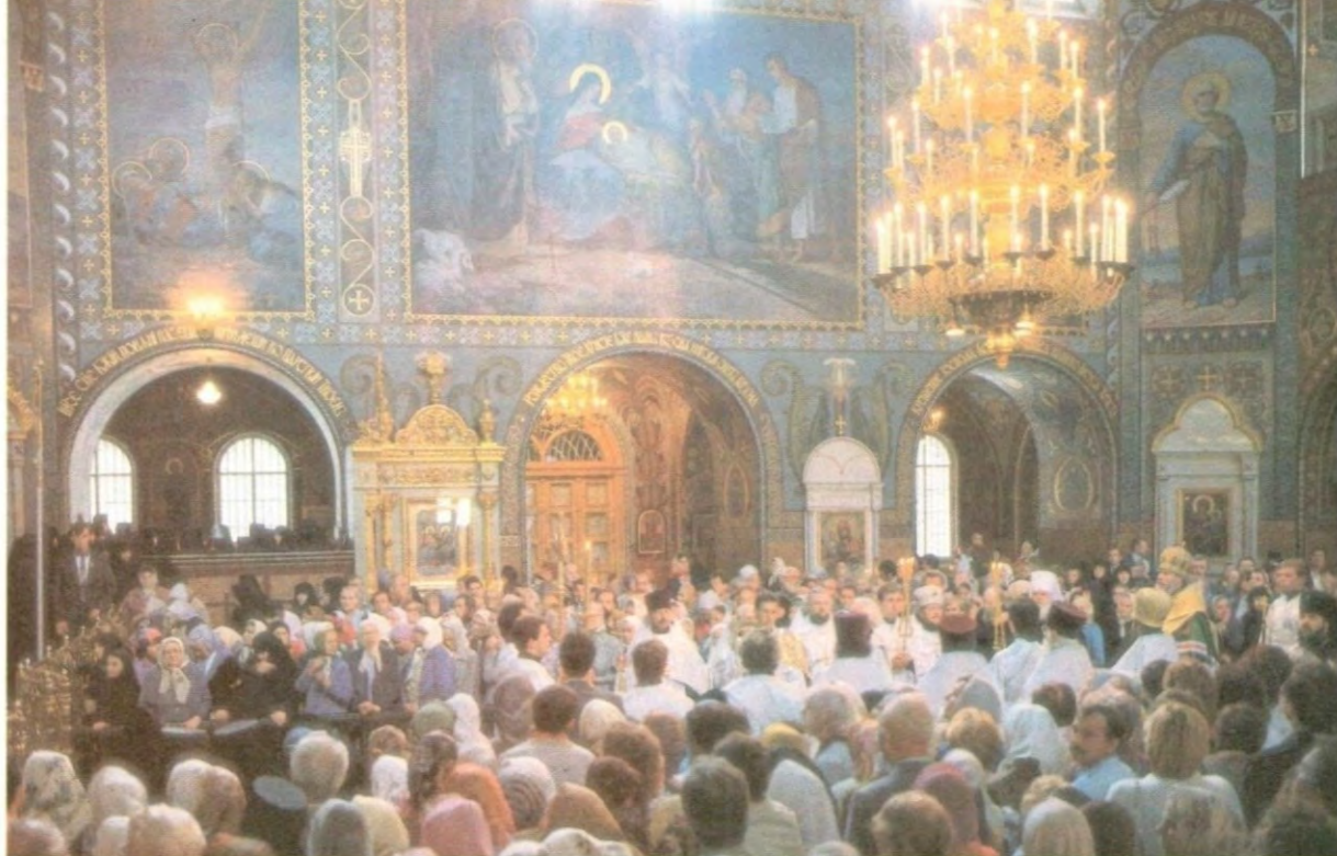
Молебен в Никольском храме Покровского монастыря в г. Киеве 31 июля совершает Святейший Патриарх Алексий II