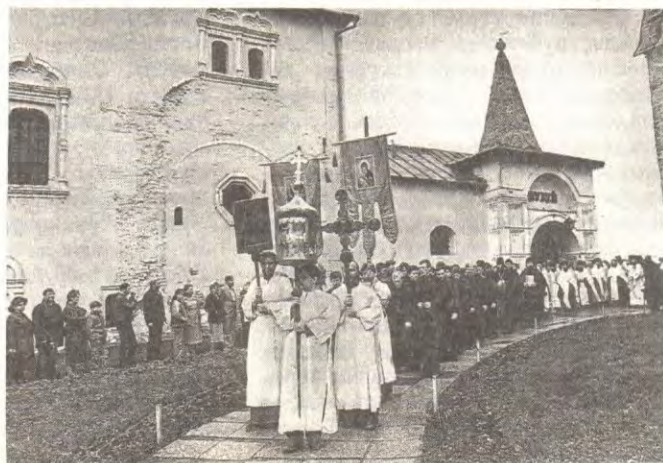
Крестный ход вокруг собора Рождества Богородицы Суздальского кремля

«Веселися, святой доме Божией Матери, радуйся, древняя Владимирская земле, имеющи в себе сокровище многоценное» — эти слова, написанные к недавнему (в 1984 году) прославлению Собора Владимирских святых, могут выразить и суть нынешних торжеств во Владимире. Но христианство в этом крае на нынешнем историческом витке пришло как бы к своему началу. Если во многих областях России перестройка в отношениях государства и Церкви уже идет полным ходом и приносит свои плоды, то необходимость как бы заново креститься, о которой сказал Святейший Патриарх Алексий, здесь ощущается особенно остро. Накануне своего 1000-летия Владимирская епархия оказалась втянутой в конфликт, с одной стороны, с представителями местной власти, пресекающими всякую попытку возро-