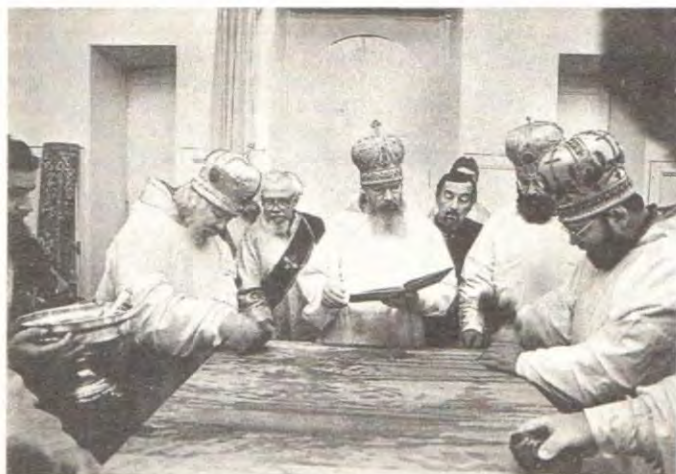
Святейший Патриарх Алексий с иерархами освящает храм в честь Казанской иконы Божией Матери в г. Зеленогорске Ленинградской митрополии

11 августа в Князь-Владимирском соборе Ленинграда состоялось торжественное всенощное бдение, за которым Святейшему Патриарху Алексию II сослужили митро-