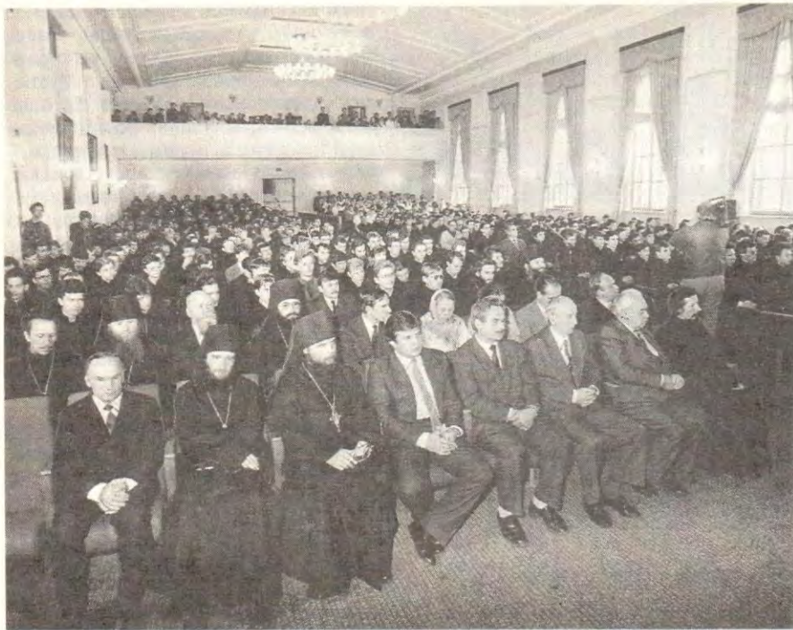
В Большом актовом зале перед началом учебного года

на заслонять для вас ее повседневной, скромной, но в то же время спасительной миссии. Своим небесным ликом Церковь обращена к конкретному человеку, она снижается к нему даже туда, где веет холод непонимания, где человек живет бездуховно, безнравственно, ничего не исповедуя, никого не уважая, никому не помогая и ни о ком не проявляя заботы. Следствием взаимной отчужденности является остро ощущаемый дефицит доверия и благожелательности.