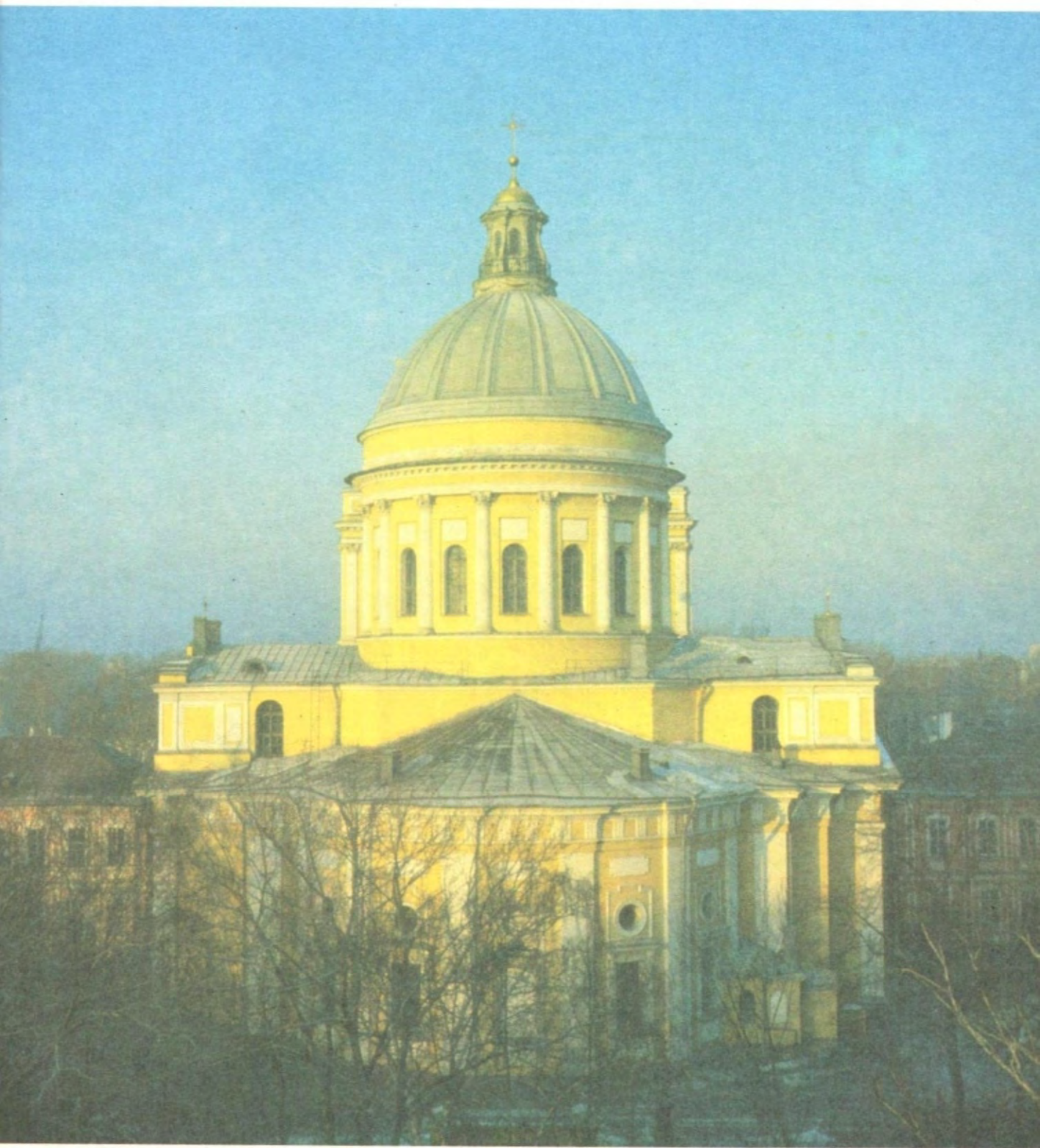
ТРОИЦКИЙ СОБОР АЛЕКСАНДРО-НЕВСКОЙ ЛАВРЫ, ГДЕ ПОКОЯТСЯ МОЩИ СВЯТОГО БЛАГОВЕРНОГО КНЯЗЯ АЛЕКСАНДРА НЕВСКОГО