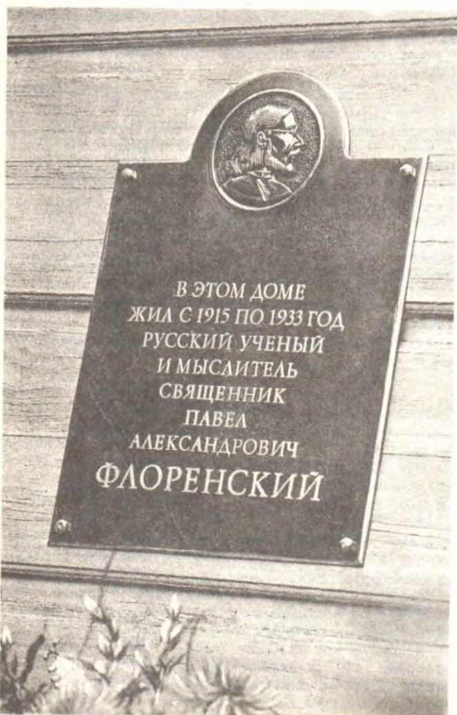
Мемориальная доска установлена на доме Пионерской ул., 19 г. Загорска 12 июля 1990 года