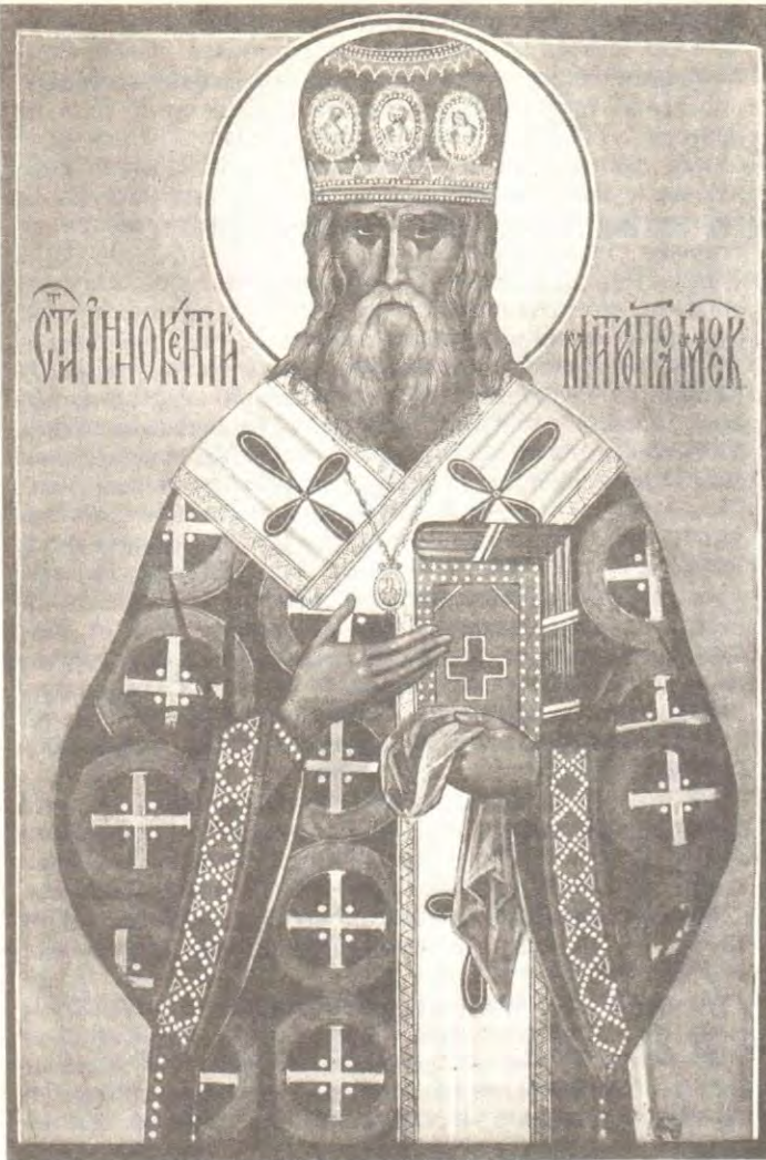
Святитель Иннокентий, Митрополит Московский

ка Иркутской Духовной Семинарии. Он пробыл на этом острове десять лет, живя среди алеутов, и, изучая их язык, перевел на него Божественную литургию, катихизис и Евангелие от Матфея. Его лингвистические, антропологические, этнографические, географические и метеорологические труды были отмечены русскими и иностранными академиями и учеными 3 . Он также был изощрен в ремеслах, построил церковь собственными руками и крестил все население острова. После десяти лет упорной работы на Уналашке и ближайших островах отец Иоанн Вениаминов перешел в Ситку, где продолжал свою миссионерскую деятельность среди местных индейских племен. В 1839 году он отправился в Санкт-Петербург для подготовки к изданию своих трудов по алеутскому языку. Во время пребывания отца Иоанна в Санкт-Петербурге из Иркутска пришла печальная весть о кончине его жены.