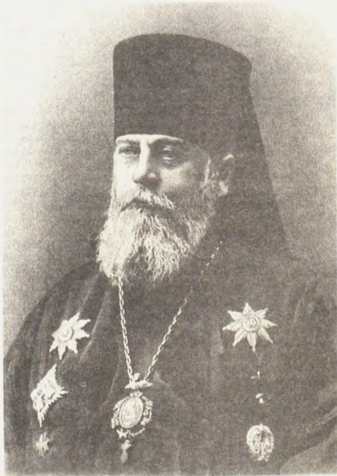
Епископ Серафим (Чичагов)

В Бозе почивший, дорогой нам всем отец Иоанн Кронштадтский, великий праведник и всероссийский молитвенник, истинный друг всех страждущих и обремененных, всегда останется близким сердцу русского народа и чистейшим источником вдохновения для служителей и предстателей у Престола Божия. Столь исключительные люди, как отец Иоанн, всегда пользуются при жизни более народной любовью, чем земной славой, так как против нее восстают явные и тайные силы, но после кончины они особенно возвеличиваются потомством того просвещенного общества, которое не могло своевременно распознать их духа по разным причинам, но больше по своему малому духовному развитию. Для большинства образованных людей, чуждых заповеди апостольской о необходимости уметь различать людей по их духу и избирающих более легкий способ познания, почти