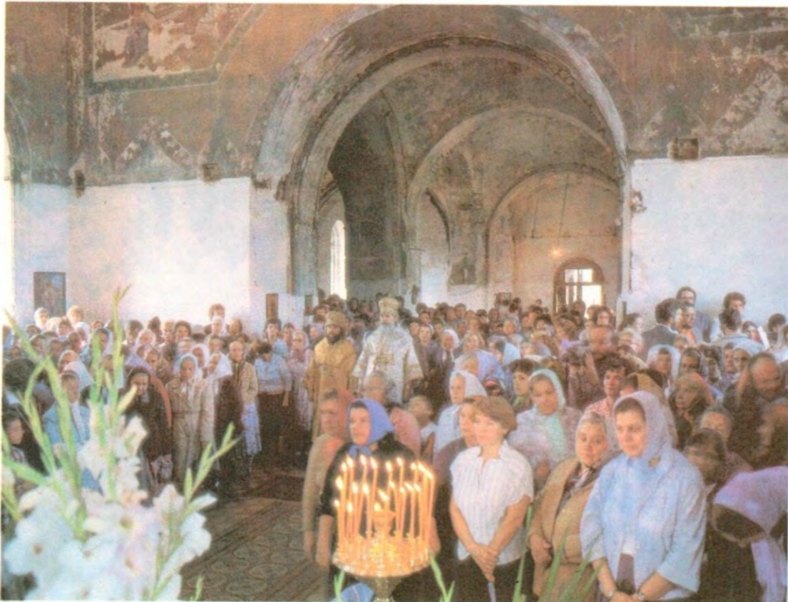
Святейший Патриарх Алексий II совершает богослужение в Валаамской обители