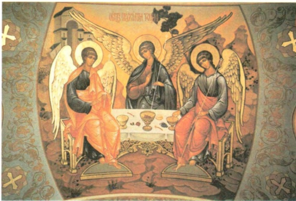
Фрагмент новой росписи в Екатерининском соборе в г. Краснодаре. Мастерская С. А. Спирина, 1989 год