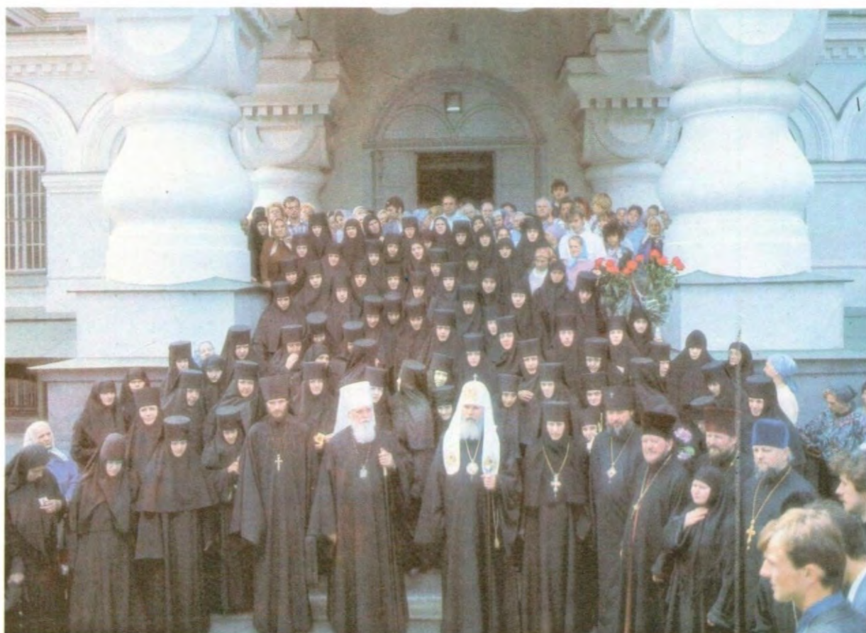
Святейший Патриарх Алексий II и митрополит Киевский и Галицкий Филарет, Патриарший Экзарх всей Украины, с насельницами Покровского монастыря