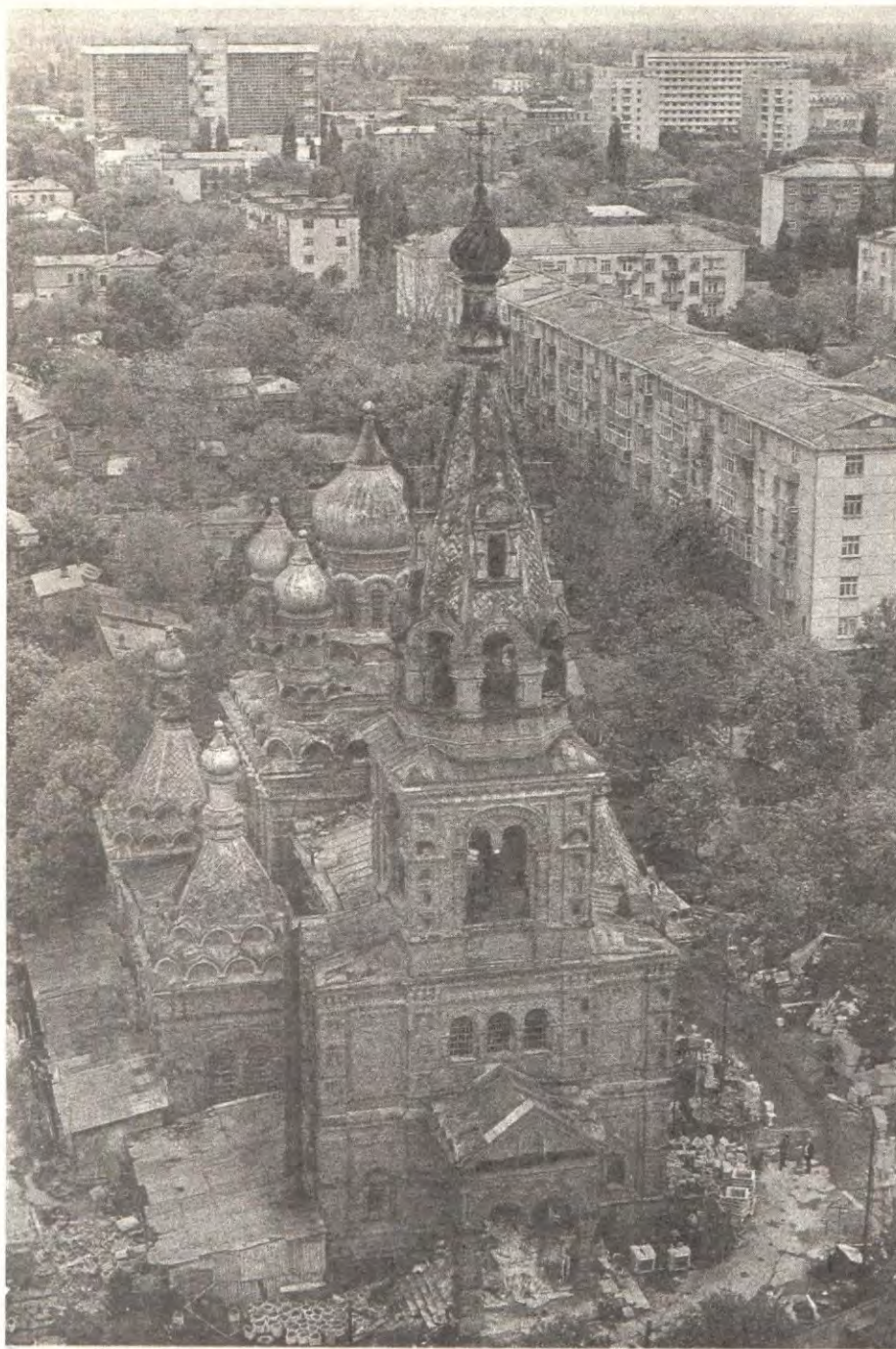
Троицкий храм г. Краснодара, недавно возвращенный Церкви