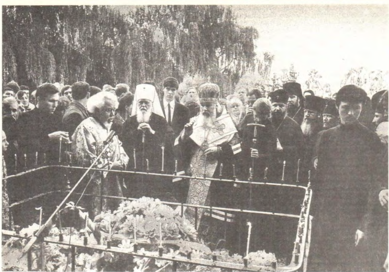
Святейший Патриарх Алексий совершает заупокойную литию у казачьих могил близ Почаева

Приветствуя в соборе Святейшего Патриарха, архиепископ Житомирский и Овручский Иов отметил, что впервые за всю церковную историю Житомирскую кафедру посещает Предстоятель Церкви как раз в тот весьма трудный для Православной Церкви на Украине момент, когда земля Житомирская переживает великую скорбь из-за поражения многих районов радиацией после черновильской катастрофы.