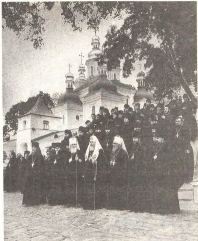
Святейший Патриарх Алексей, иерархи и братья Киево-Печерской Лавры

Святейший Патриарх, архиереи, духовенство посетили Ближние и Дальние пещеры, приложились к мощам лаврских подвижников. Затем в доме наместника состоялась беседа с братией Лавры. Владыка Экзарх показал Святейшему Патриарху комплекс монастыря, здание