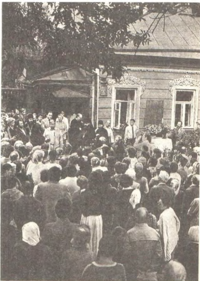
Возле дома отца Павла Флоренского в день установления мемориальной доски

* Хотя последние данные фактически неправильны, но они чрезвычайно характерны в передаче того глубокого благоговения, которым было окружено имя отца Павла даже в лагере.