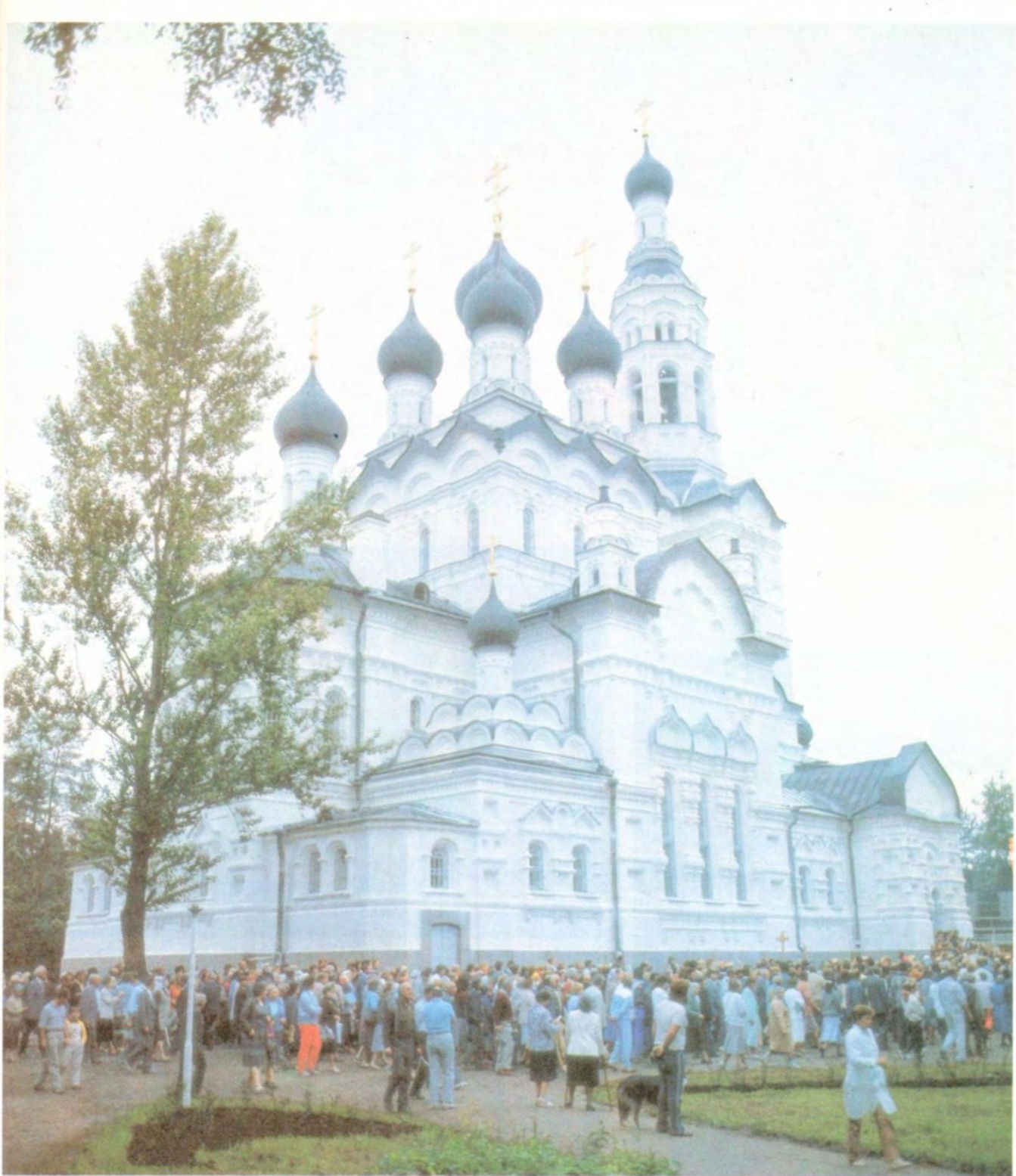
Казанский храм в г. Зеленогорске, освященный Святейшим Патриархом Алексием II