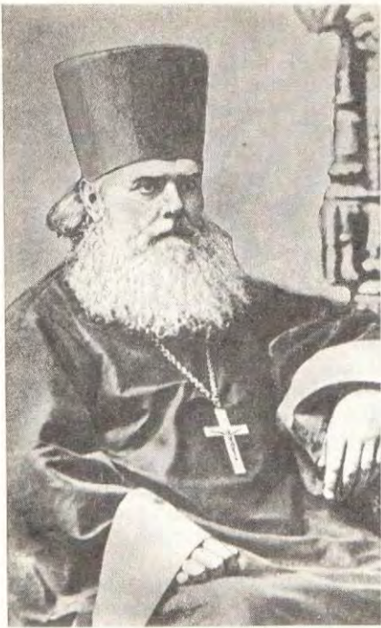
Ректор Московской Духовной Академии протоиерей Сергей Смирнов

А. П. Лебедев, В. О. Ключевский, В. Д. Кудрявцев.