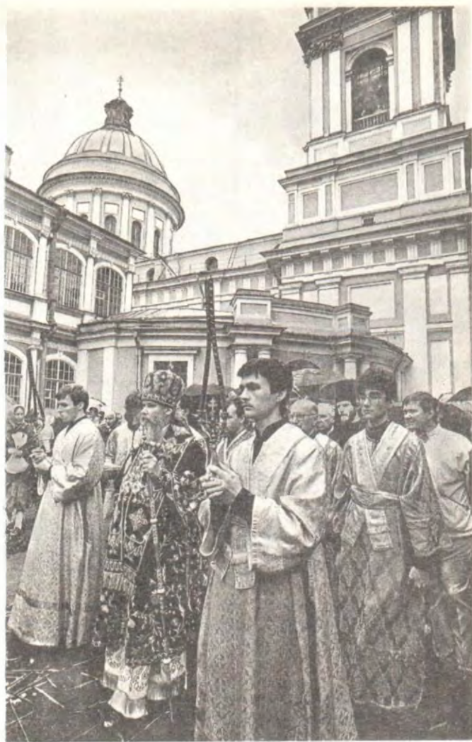
Шествие Святейшего Патриарха Алексия с крестным ходом в Александро-Невской Лавре в день 750-летия Невской битвы, 15 июля

сия по ликвидации последствий чернобыльской аварии. Три республики, Украина, Белоруссия и Россия, пострадали от нее. Надо создавать реабилитационные центры для детей. Международные организации, такие, как Всемирный Совет Церквей, Конференция Европейских Церквей, проявили готовность оказать материальную помощь, чтобы через Русскую Православную Церковь помочь ликвидировать последствия аварии».