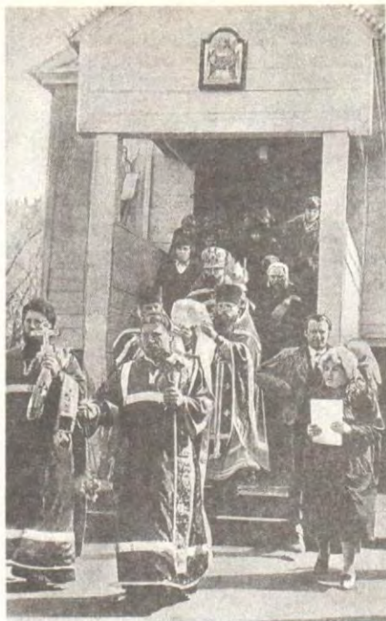
Крестный ход на источник в селе Ташла Куйбышевской епархии

С тех пор прошло много времени, но милостью Своей Царица мира не