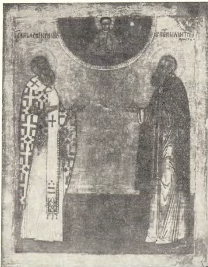
Преподобный Андрей Критский и преподобный Димитрий Прилуцкий.

Через сто лет иконопочитание было окончательно восстановлено. В то время жители Ри-