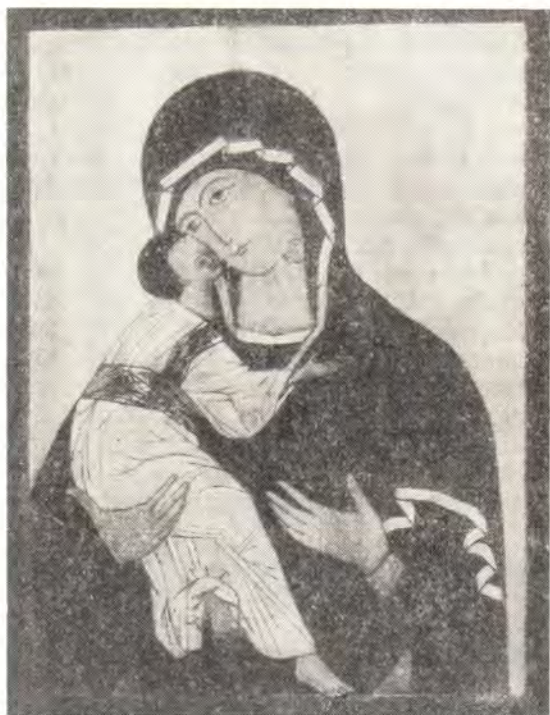
Владимирская икона Божией Матери из Троицкого собора Троице-Сергиевой Лавры (средник иконы)

На Руси святым иконам была оказана достойная встреча: для иконы Богоматери «Пирогоща» построили церковь в 1130—1131 гг., а икону «Владимирскую» поместили в княжеском