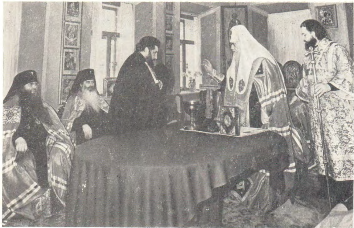
Наречение архимандрита Мефодия во епископа Иркутского и Читинского. Святейший Патриарх Пимен преподает благословение архимандриту Мефодию.