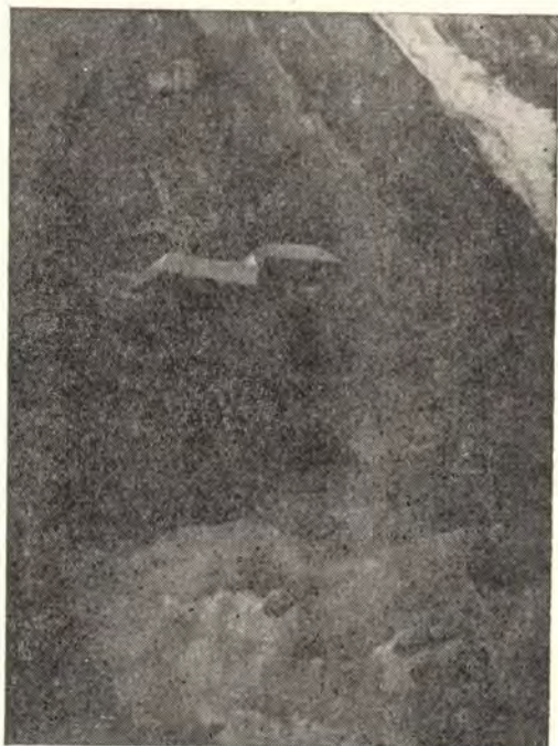
Молитва святогорца о мире всего мира

имеет форму креста. Далеко на северо-западе, за Солунским заливом, выступает снежная шапка горы Олимп, славившейся в древности, как и Афон, своими подвижниками и монастырями. Здесь же, на северных крутых склонах горы, растет неувядаемый «Богородичен цветок» — иммортель, с маленькими бело-розоватыми цветками, которые всегда очень ценились богомольцами как благословение Святой Горы. Многие монахи-смелчаки тут положили жизни свои, собирая этот цветок на гладких отвесных мраморных скалах над пропастью.