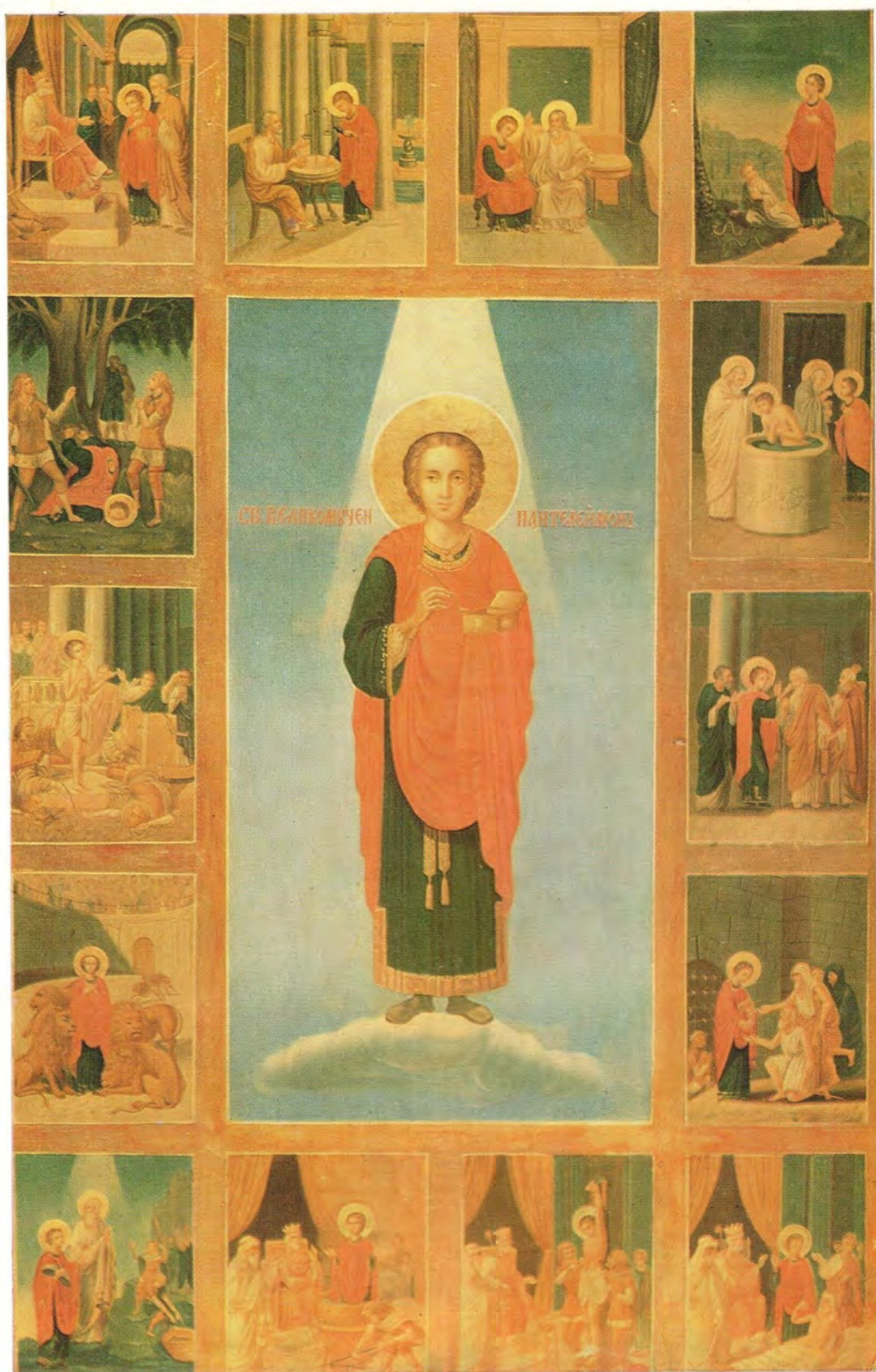
Икона СВЯТОГО ВЕЛИКОМУЧЕНИКА ПАНТЕЛЕИМОНА С ЖИТИЕМ Из храма Афонского Пантелеимонова подворья в с. Лукино под Москвой