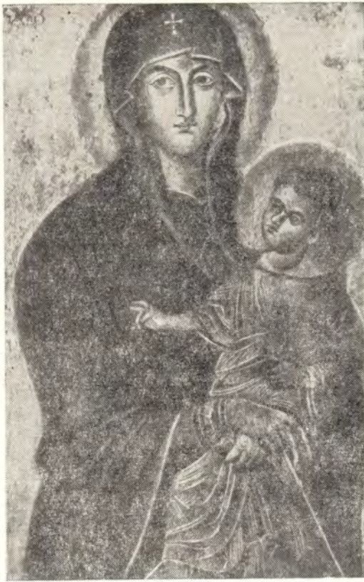
Образ Божией Матери «Римской»,

об этой иконе говорится], а уверившись в истинности, он удивился этому, но больше ничего не предпринял 3 .