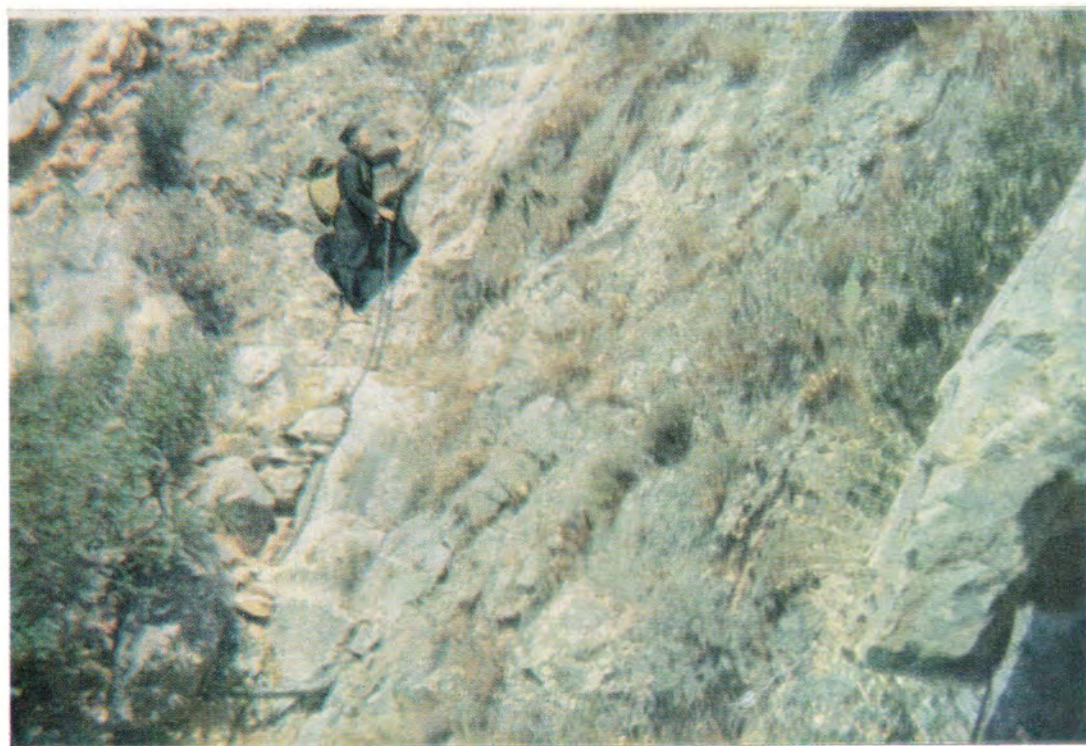
Афонские иноки и богомольцы у храма Преображения Господня на вершине горы Афон. Подъем на вершину Афона