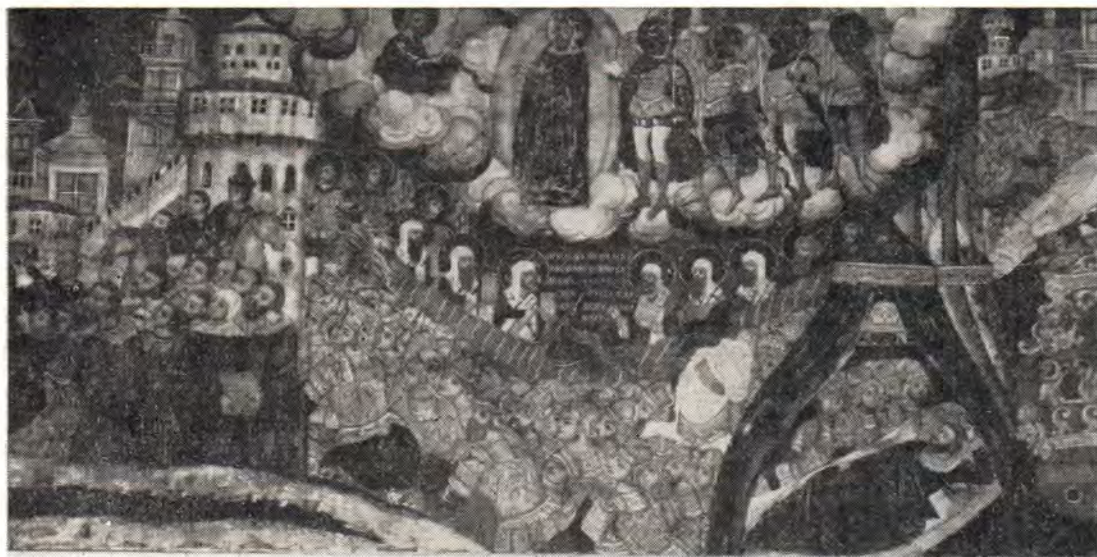
Фрагмент фрески «Явление Божией Матери Темир-Аксаку с предупреждением о гибели, если продолжит покорение Земли Русской». (Из Феодоровской церкви г. Ярославля, 1715 г.)