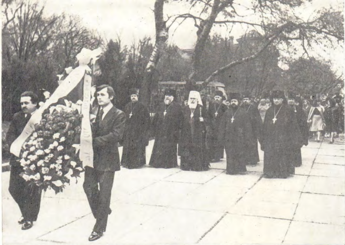
Одесса, 8 мая 1980 года. Митрополит Одесский и Херсонский Сергей с представителями клира и мирян возлагает венок к обелиску Неизвестного матроса