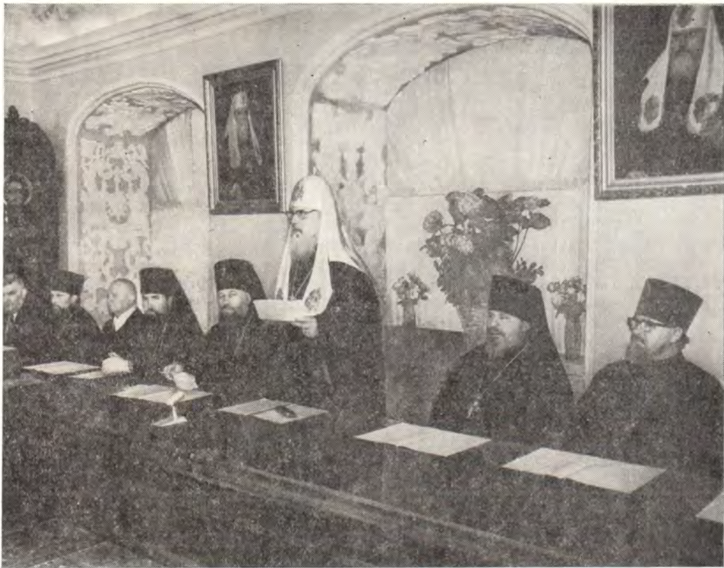
26 мая 1980 года. Святейший Патриарх Пимен произносит слово на выпускном акте Московских Духовных академии и семинарии

добрые плоды для паствы, Церкви, Родины и для него самого.