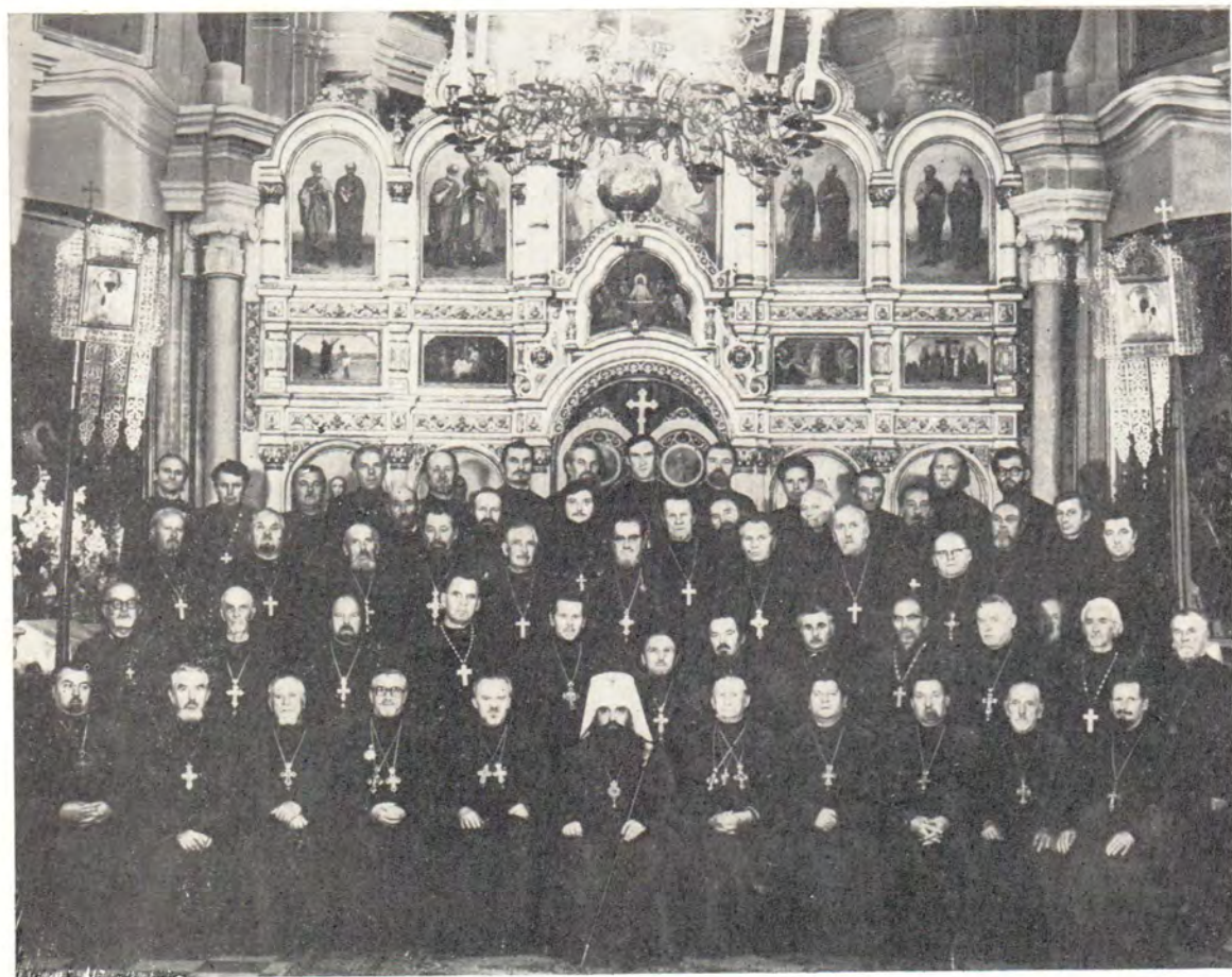
31 августа 1979 года. Участники совещания духовенства Минской области