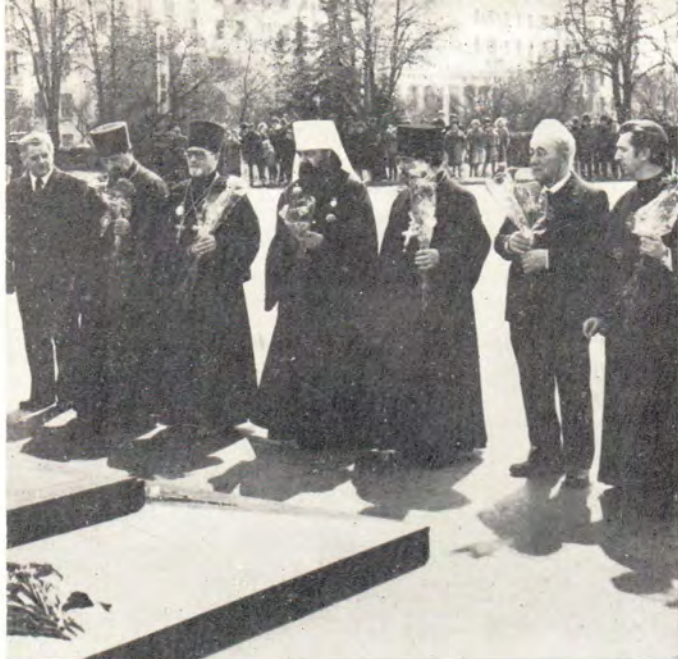
Минск, 4 мая 1980 года. Митрополит Минский и Белорусский Филарет, Патриарший Экзарх Западной Европы, с представителями клира и мирян Минской епархии возлагает венок к Памятнику Победы.