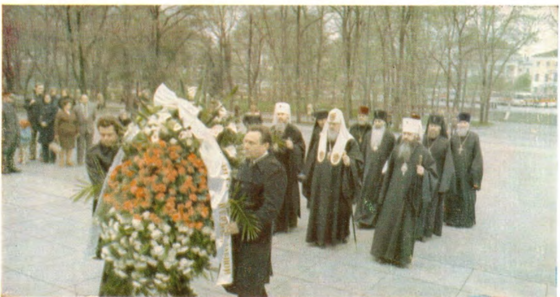
Возложение венка Святейшим Патриархом Пименом от имени епископата, клира и мирян Русской Православной Церкви к могиле Неизвестного солдата у Кремлевской стены 12 мая 1980 года.