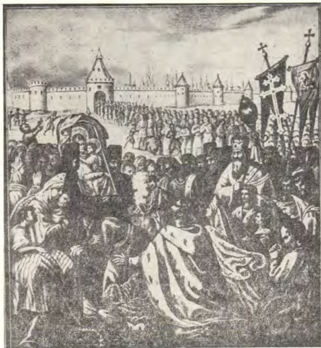
Перенесение иконы Божией Матери из Владимира в Москву в 1395 году

Еже слышав великий князь Василий Дмитриевич, собравоя своя и поиде к граду Коломне. Оттуда шед ста на берегу Оки реки, ополчася противу супостатов. А Темираксак стояше на едином месте пятнадесят дний. Уведав же великий князь и все христианское воинство великую силу царя нечестиваго, с тмочисленными полки пришедшаго и намерение того злое слышав, возде руды на небо с всеми вой своими и моляшеся с слезами к Богу и к Пречистой Божией