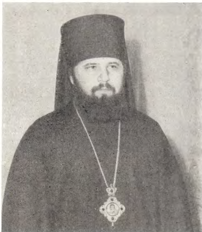
Преосвященный МЕФОДИЙ, епископ Иркутский и Читинский

От юности своей я всегда и везде чувствовал на себе промыслительную десницу Божию. Всё, что со мной ни