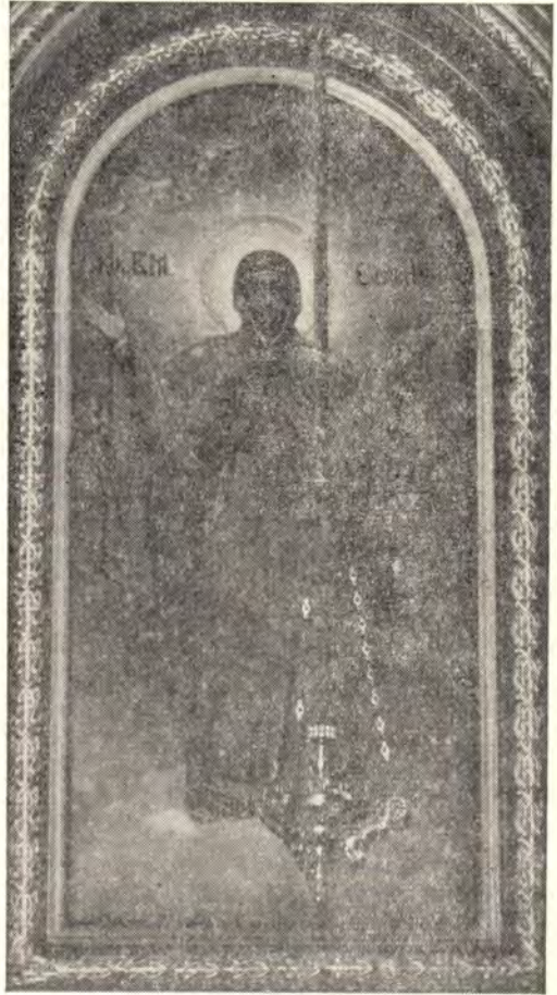
Икона Божией Матери «Елецкая» из храма Вознесения Господня в г. Ельце, Воронежская епархия

Публикуется к 150-летию со дня рождения автора — 21 января 1830 года.