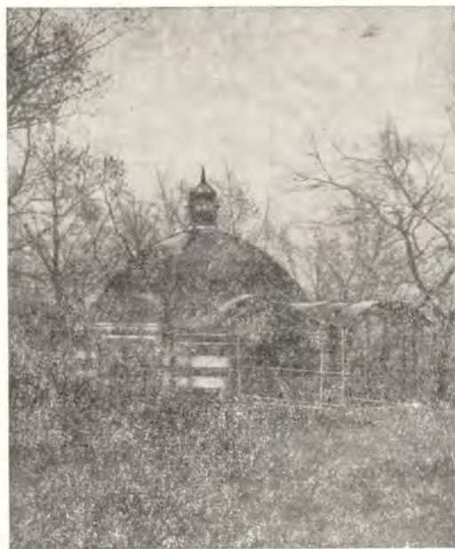
Часовня над могилой русских воинов, павших в битве с войском Тамерлана в 1395 году. Часовня находится близ храма в честь Вознесения Господня в г. Ельце

Иго было свергнуто, но Россия, граничившая на юго-востоке с разделившимися татарскими ордами, еще часто подвергалась их нападениям, и в этих несчастиях продолжала помогать ей Матерь