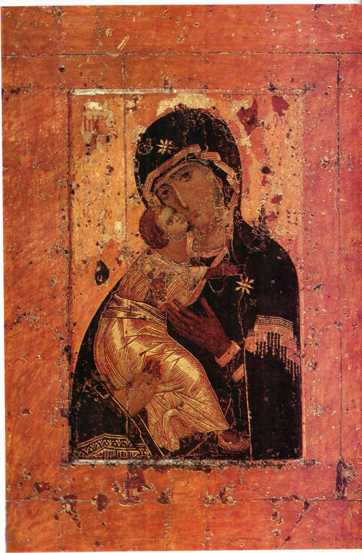
ВЛАДИМИРСКАЯ ИКОНА БОЖИЕЙ МАТЕРИ