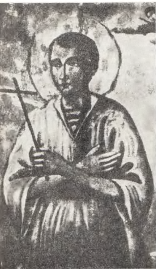
Святой праведный Иоанн Русский

на раба твоего немилосердно, отреш их силою Креста, человеколюбными предстательства твоими.