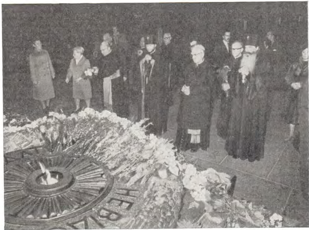
Венгерская церковная делегация у вечного огня славы Неизвестному солдату в Киеве

Вторая часть нашей поездки — это посещение Литвы. Здесь интересно будет вспомнить об отношениях между Венгрией и Литвой. Папа Иоанн Павел II писал венгерскому епископату о том, что польский народ получил в дар от венгерского народа в лице Ядвиги (1372—1399) великую женщину и святую. Она жила в трудное время, и судьба ее была не из легких. Владислав Ягайло (великий князь литовский в 1377—1392, король польский с 1386 года. — Ред. ) просил Ядвигу стать его женой и обещал, что станет христианином и поведет свой народ ко Христу. И несмотря на то, что у Ядвиги был жених, она пожертвовала своими личными чувствами, выйдя замуж за Ягайло. Она основала епархии, построила храмы; всем известно ее милосердие к больным и бедным. Итак, цветок нашего народа расцвел здесь. Польский король (с 1576) Стефан Баторий в