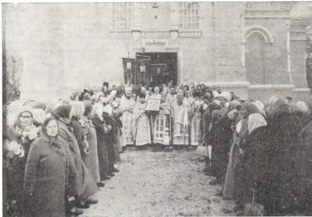
Архиепископ Симферопольский и Крымский Леонтий с клириками и прихожанами в день храмового праздника у Казанского храма в г. Феодосии

Хабаровская епархия. В день празднования Церковью памяти святого апостола и евангелиста Марка 8 мая/25 апреля 1979 года исполнилось три года со дня освящения вновь восстановленного храма во имя Святителя Николая, архиепископа Мир Ликийских, в г. Вла-