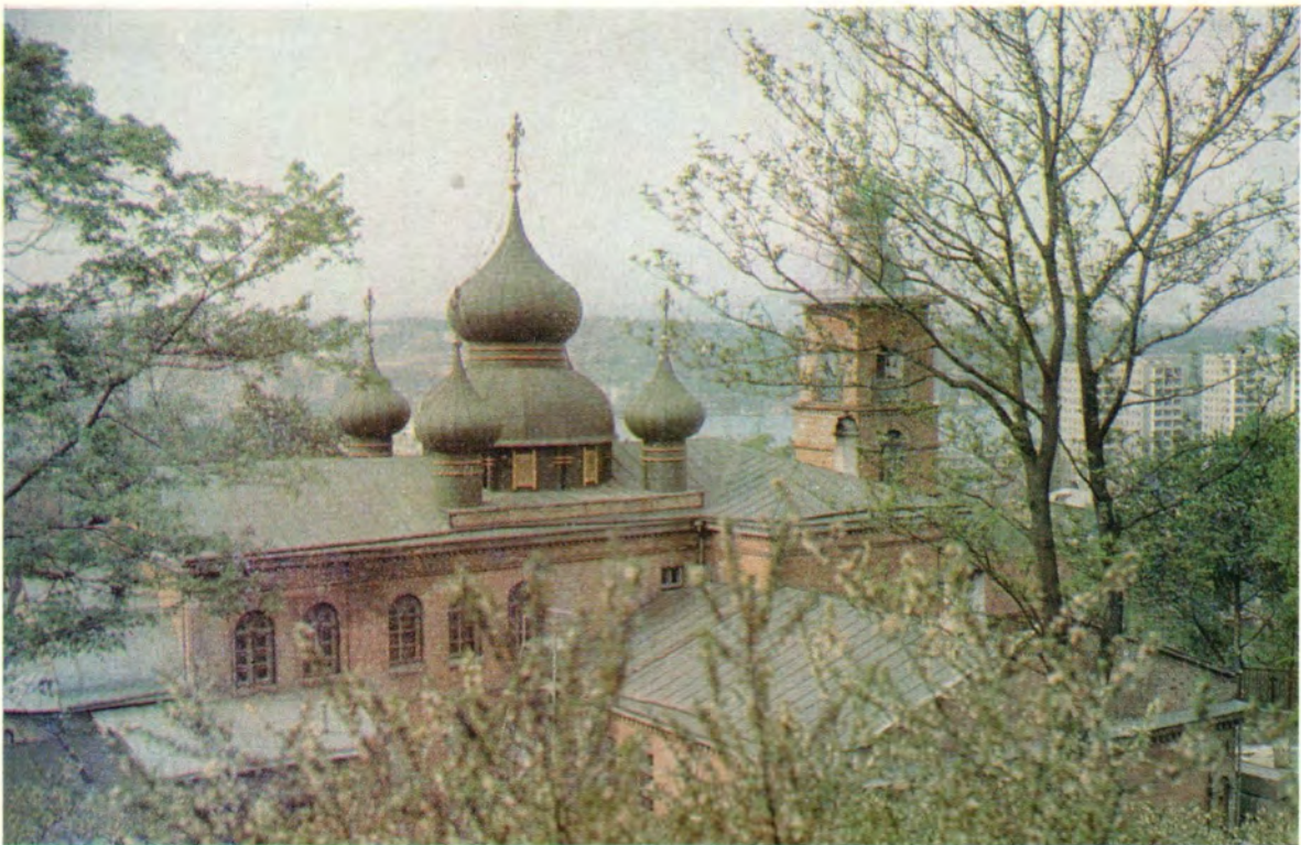
Свято-Николаевский храм в г. Владивостоке [освящен 8 мая 1976 г.] (Хабаровская епархия)