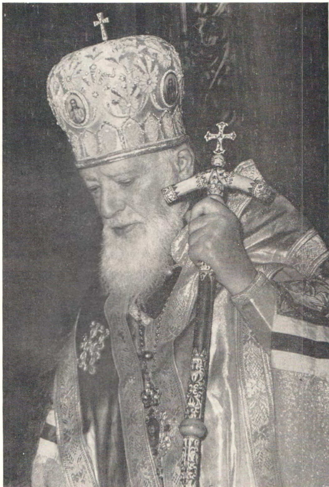
Святейший Патриарх Московский и всея Руси Алексий (1877—1970)