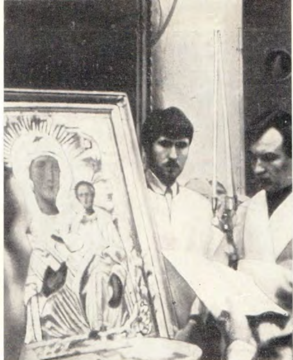
Храм в честь Казанской иконы Божией Матери в г. Устюжна Вологодской епархии. Праздник в честь Смоленской иконы Божией Матери 10 (23) августа и крестный ход в день праздника (внизу).