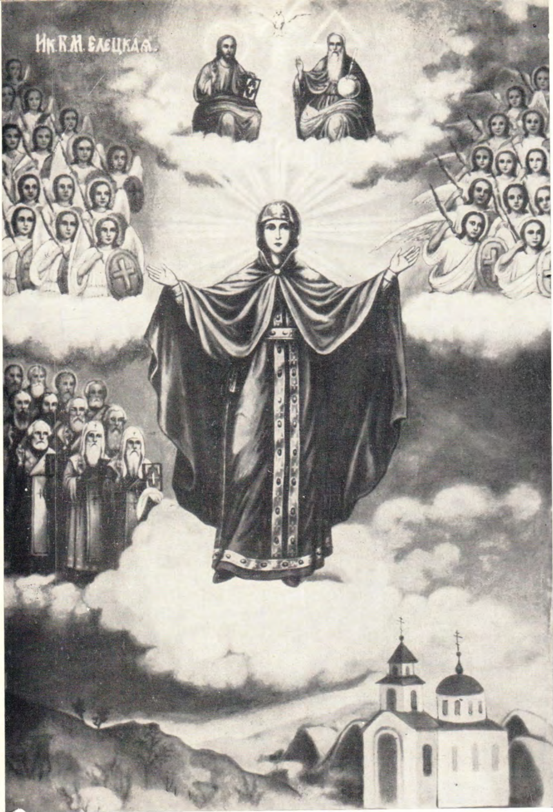
ЕЛЕЦКАЯ ИКОНА БОЖИЕЙ МАТЕРИ (Празднование 28 августа/8 сентября)