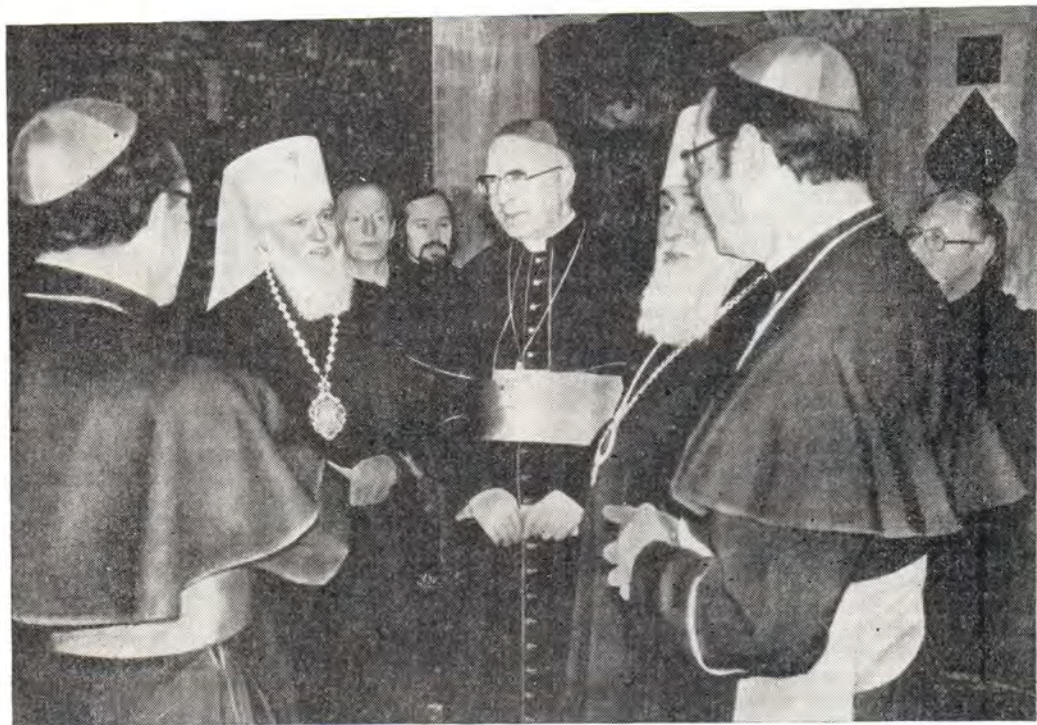
Участники V Богословского собеседования на торжественном приеме в покоях митрополита Одесского и Херсонского Сергия 14 марта 1980 года

Внутри церковной общины в настоящее время в Русской Православной Церкви, как и в Римско-Католической Церкви, всё большее число женщин выполняют самые различные церковные послушания, особенно в деле воспитания в христианской вере будущих поколений и в осуществлении взаимопомощи в общине. Во всяком случае обе Церкви считают од-