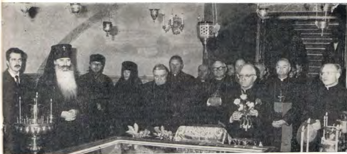
Венгерская церковная делегация у святынь Свято-Духовского монастыря в Вильнюсе

Мы прибыли из небольшой европейской страны Венгрии. Наш народ уже 900 лет назад имел добрые отношения с Киевской Русью. Наш первый король святой Стефан (по-венг. — Иштван I, правил в 997—1038, осуществил христианизацию Венгрии. — Авт.) имел дружественные отношения с Киевским князем Ярославом Мудрым (ок. 978—1054), и оба они ценили эти связи. Отношения между Россией и Венгрией развивались на религиозной почве.