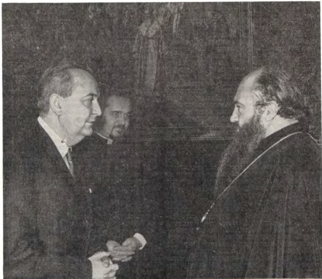
Москва. Начало 1973 года. Президент Христианской Мирной Конференции митрополит Ленинградский и Новгородский д-р Никодим [† 1978], генеральный секретарь, ныне президент ХМК, д-р Кароли Тот и член Международного секретариата ХМК протоиерей Павел Соколовский [† 1973]

полным правом можно охарактеризовать как величайшее революционное преобразование в истории человечества. Революционный процесс в Советском Союзе наиболее глубоко, по сравнению с предшествовавшими революционными процессами, затронул экономические корни и структуры общества; целью его является формирование у людей нового сознания. В связи с этим мы постараемся напомнить, насколько высокой оценки заслуживают при этом деятельность Церкви и роль митрополита Никодима в такой деятельности.