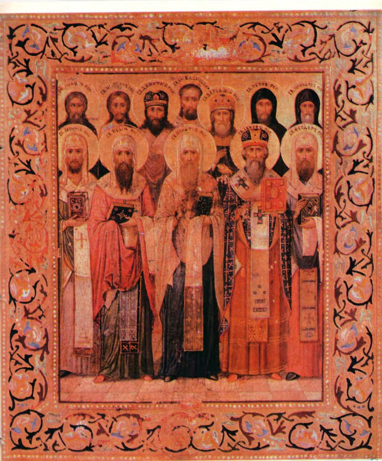
Икона «Собор Ростово-Ярославских святых» (празднование 23 мая)