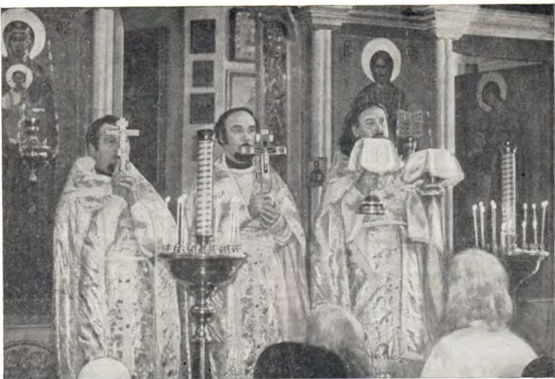
За богослужением в Никольском храме в г. Владивостоке

двустоке. С того времени по сей день ведутся работы по благоукрашению этого храма.