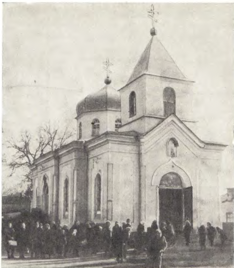
Александр- Невский собор в г. Мелитополе (Днепропетровская епархия).