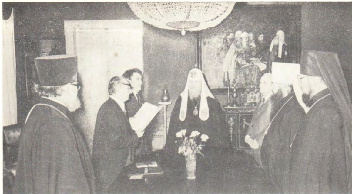
21 декабря 1979 года в московской резиденции Святейшего Патриарха Пимена состоялось вручение Его Святейшеству грамоты от Советского Комитета защиты мира. Грамоту вручил Б. Н. Полевой, председатель Советского Фонда мира.