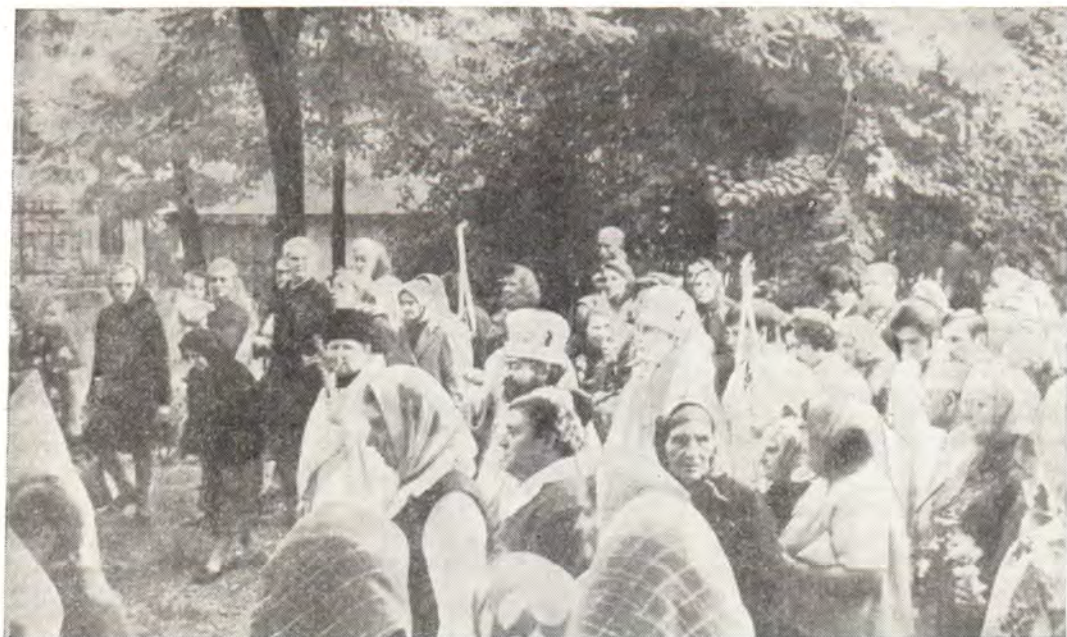
Митрополит Одесский и Херсонский Сергий с клириками и мирянами совершает крестный ход вокруг храма в честь Рождества Пресвятой Богородицы в г. Одессе (на Слободке) 21 сентября 1979 года

Похоронен отец Николай близ храма в с. Хмелево.