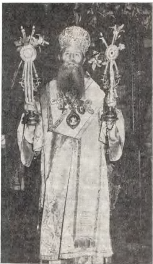
11 июня 1979 года, День Святого Духа. Святейший Патриарх Сербский Герман за Божественной литургией в русском Патриаршем подворье в Белграде