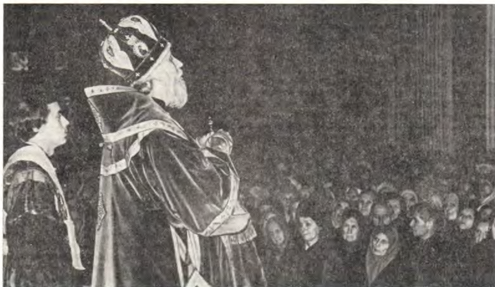
6 декабря 1979 года. Митрополит Ленинградский и Новгородский Антоний проповедует в Свято-Троицком соборе в Александро-Невской Лавре в Ленинграде

В слове перед праздничным молебном митрополит Антоний подчеркнул, что святой князь Александр был «примерным гражданином, проявлял постоянную заботу о своем