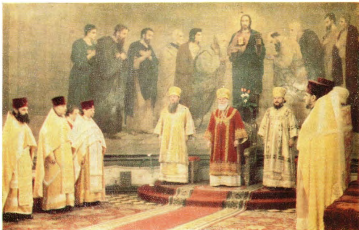
25 февраля 1979 года, день памяти святителя Мелетия, архиепископа Харьковского. Митрополит Киевский и Галицкий Филарет, Патриарший Экзарх Украины, архиепископ Харьковский и Богодуховский Никодим, архиепископ Симферопольский и Крымский Леонтий за Божественной литургией в Благовещенском кафедральном соборе в г. Харькове, где почивают честные мощи святителя Мелетия (см. «ЖМП», 1979, № 11, с. 21).