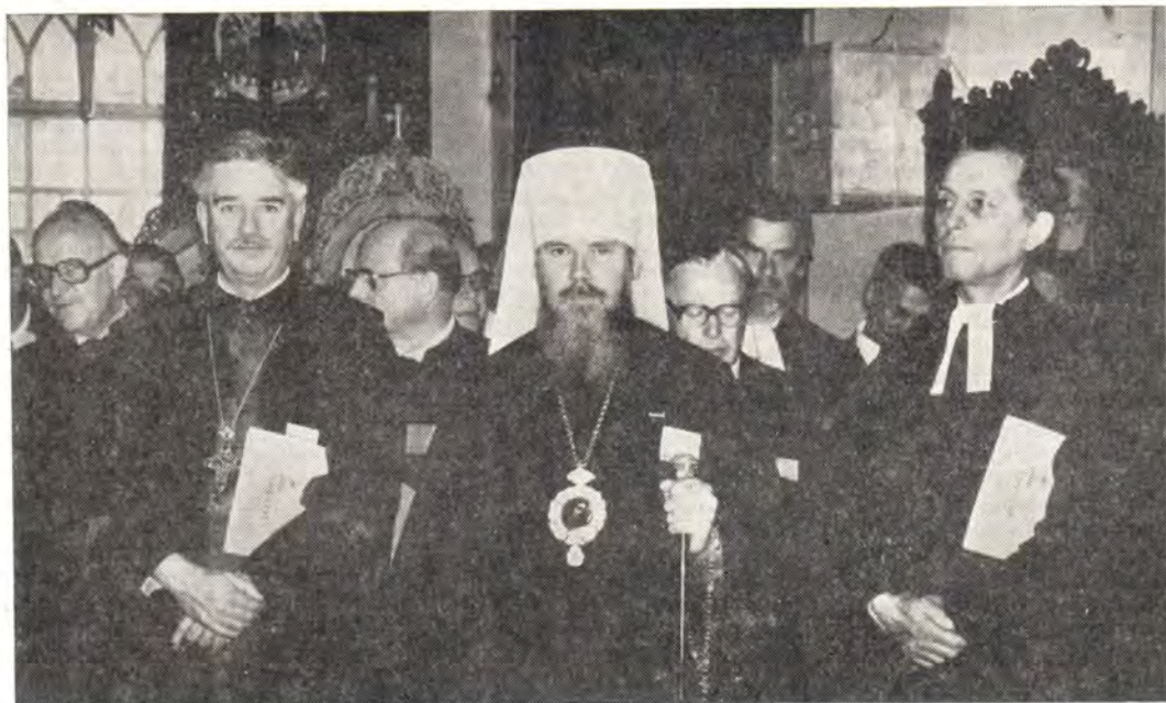
На торжественном молебне в храме Святителя Николая в г. Ханья в день открытия на Крите VIII Генеральной Ассамблеи Конференции Европейских Церквей

земле жизнь и мир! К достижению этого высшего блага и направлено миротворческое служение Конференции Европейских Церквей.