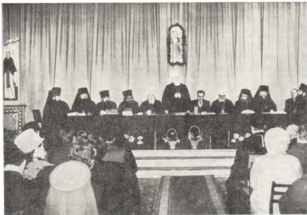
13 декабря 1979 года. Митрополит Киевский и Галицкий Филарет, Патриарший Экзарх Украины, произносит слово на годичном акте в Одесской духовной семинарии

Христу в своей жизни, мы должны руководствоваться только любовью. Эта заповедь о любви доступна и понятна всем.