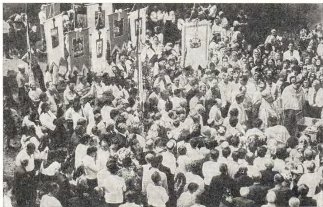
22 мая 1979 года. Архиепископ Ивано-Франковский и Коломыйский Иосиф с собором клириков совершает крестный ход в ограде храма в с. Залуччя Снятинского района

* В декабре 1979 года протоиерей Иосиф Фреев скончался. Вечная память почившему пастырю Церкви Христовой!