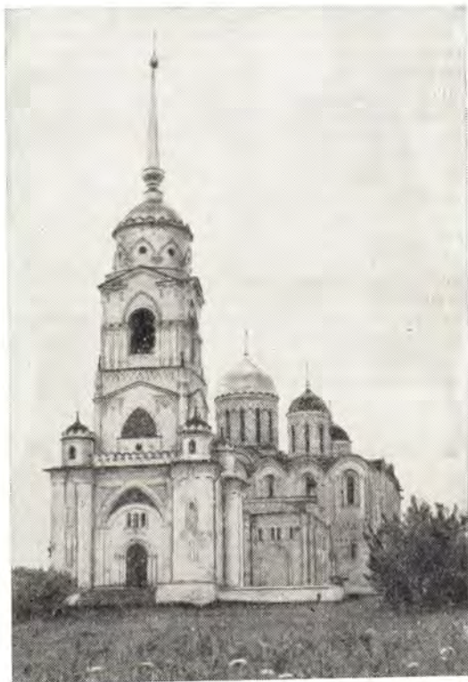
Успенский кафедральный собор (до начала реставрационных работ)