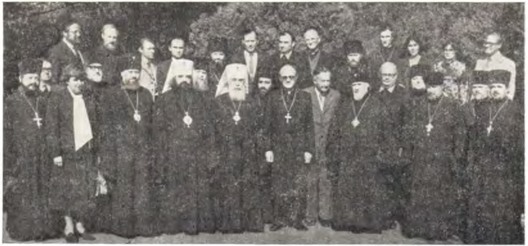
Участники Богословского собеседования «Арнольдсхайн-VIII» в Одессе

было совершено членами делегации Евангелической Церкви в Германии.