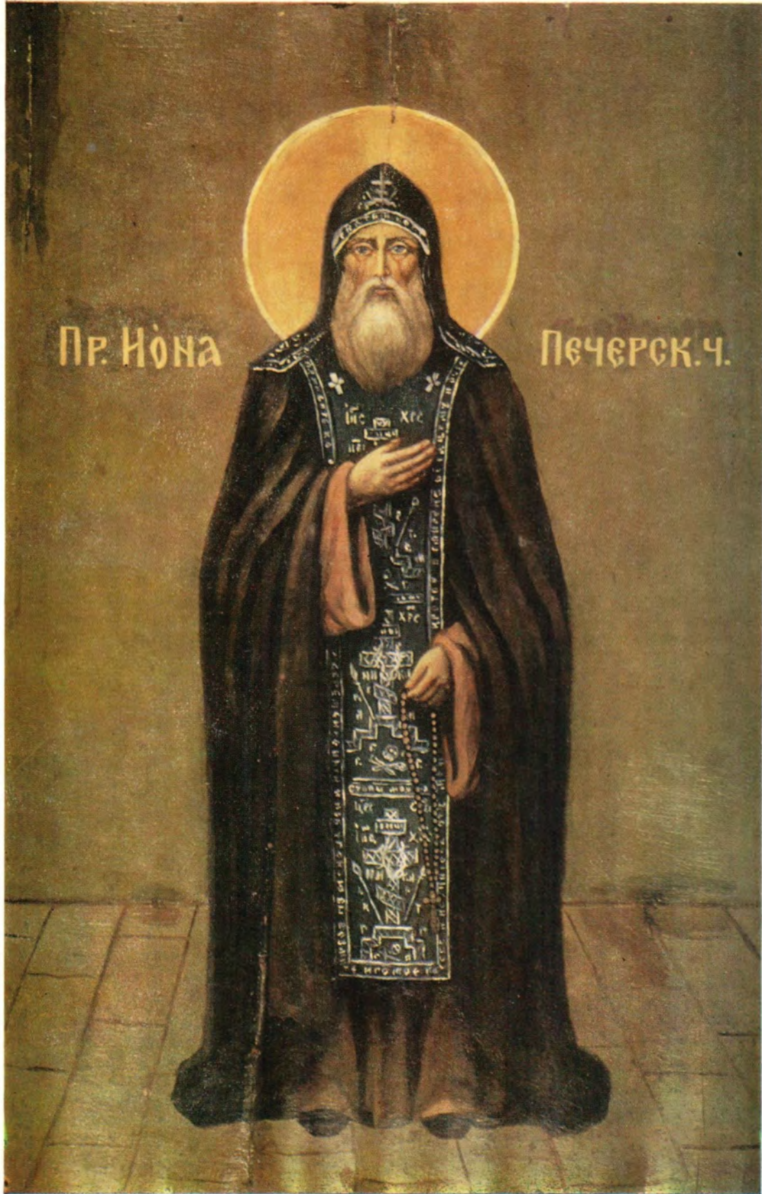
ПРЕПОДОБНЫЙ ИОНА ПСКОВО-ПЕЧЕРСКИЙ (†1480; память 29 марта) К 500-летию со времени преставления