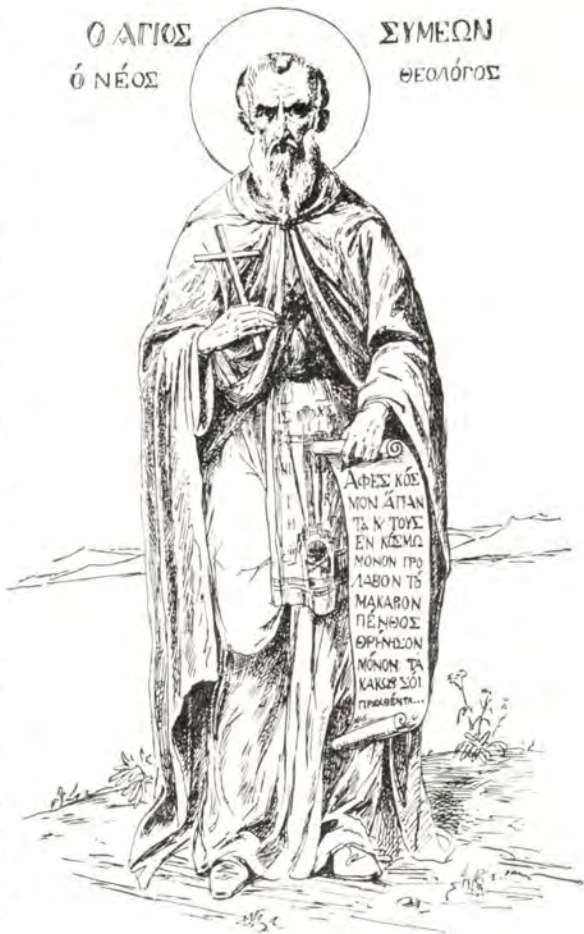
Преподобный Симеон Новый Богослов († 1021; память 12 марта). Рисунок художника М. Боскина, выполненный по древней фреске в монастыре Пантократора на Святой Горе Афон

го того, что ведет к вечному спасению. Послужившие Богу исполнением заповедей окажутся в час смерти душевно свободными от всякой мирской и плотской страсти (с. 125), кто не познал благодати, присущей его душе, тщетно носит имя христианина. Он одинаков с неверными, если не ищет пути получения благодати прежде всего другого. У всякого, желающего спастись, целью лишений, злостраданий, целью Крещения, Покаяния и самоуничтожения должно быть получение или возвращение Божией благодати, этой Божией милости, даруемой за веру. Цель подвигов — стяжать благодать Святого Духа. В этом-то и заключается таинство Христова, сокровенное от начала мира.