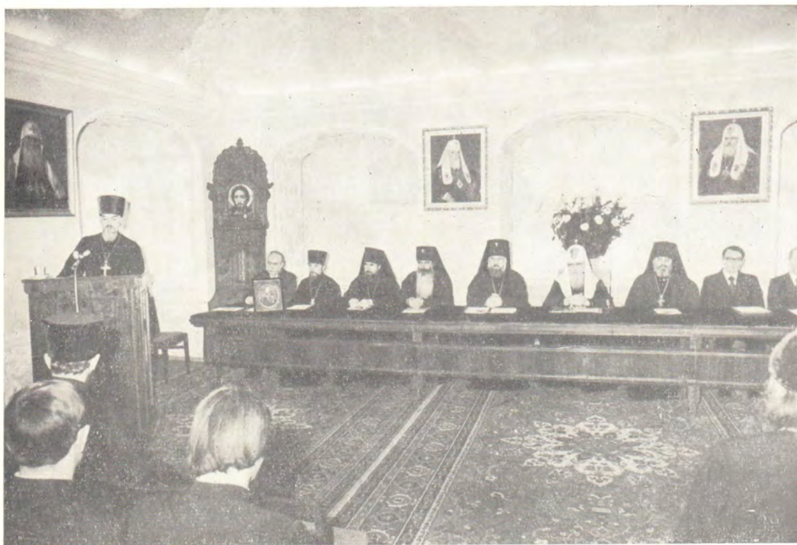
14 декабря 1979 года. В Актовом зале Московской духовной академии на юбилейном собрании, посвященном 100-летию со дня преставления святителя Московского Иннокентия.