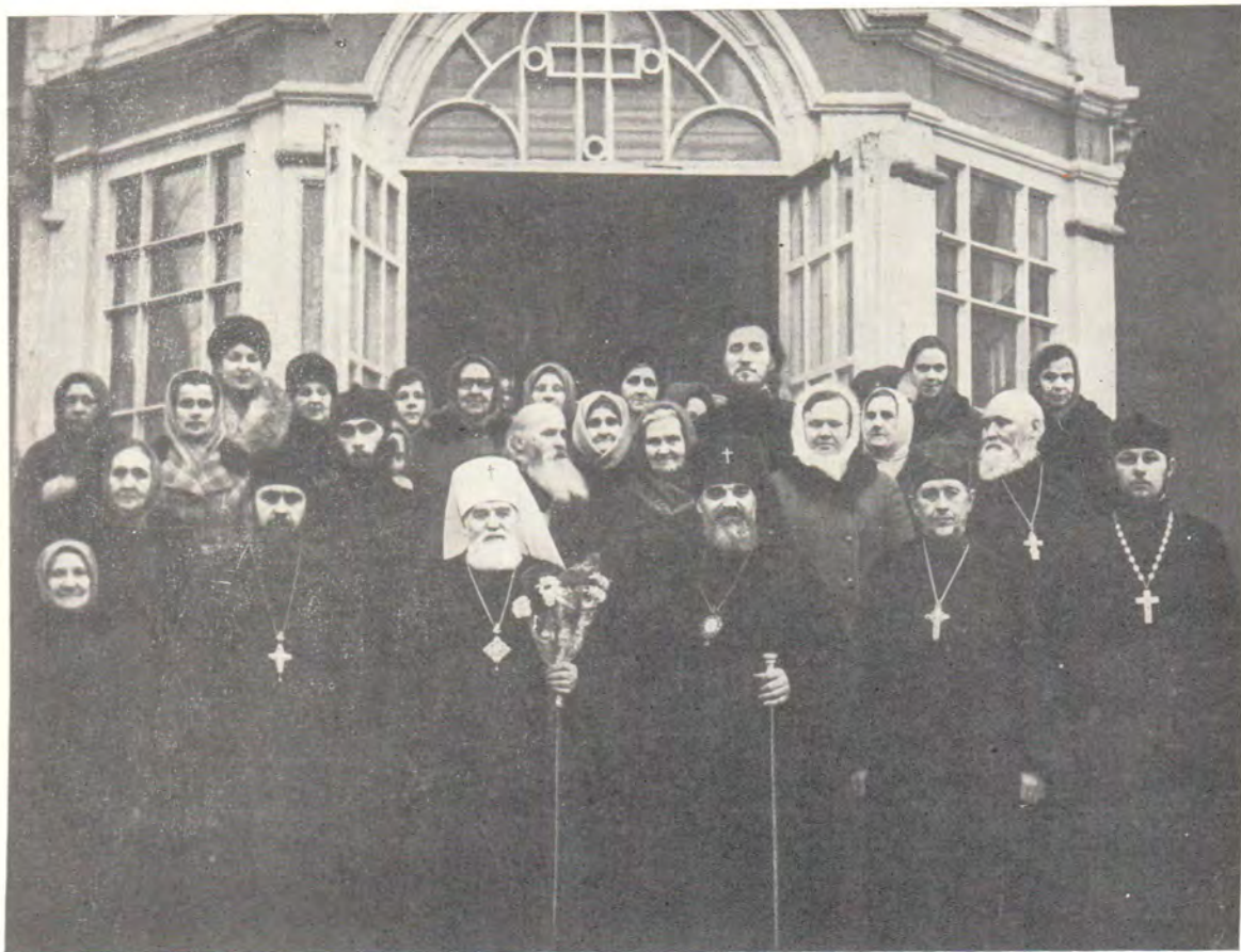
28 ноября 1979 года. Блаженнейший Митрополит Пражский и всей Чехословакии Дорофей, архиепископ Смоленский и Вяземский Феодосий с клириками и мирянами у входа в Успенский кафедральный собор в г. Смоленске.