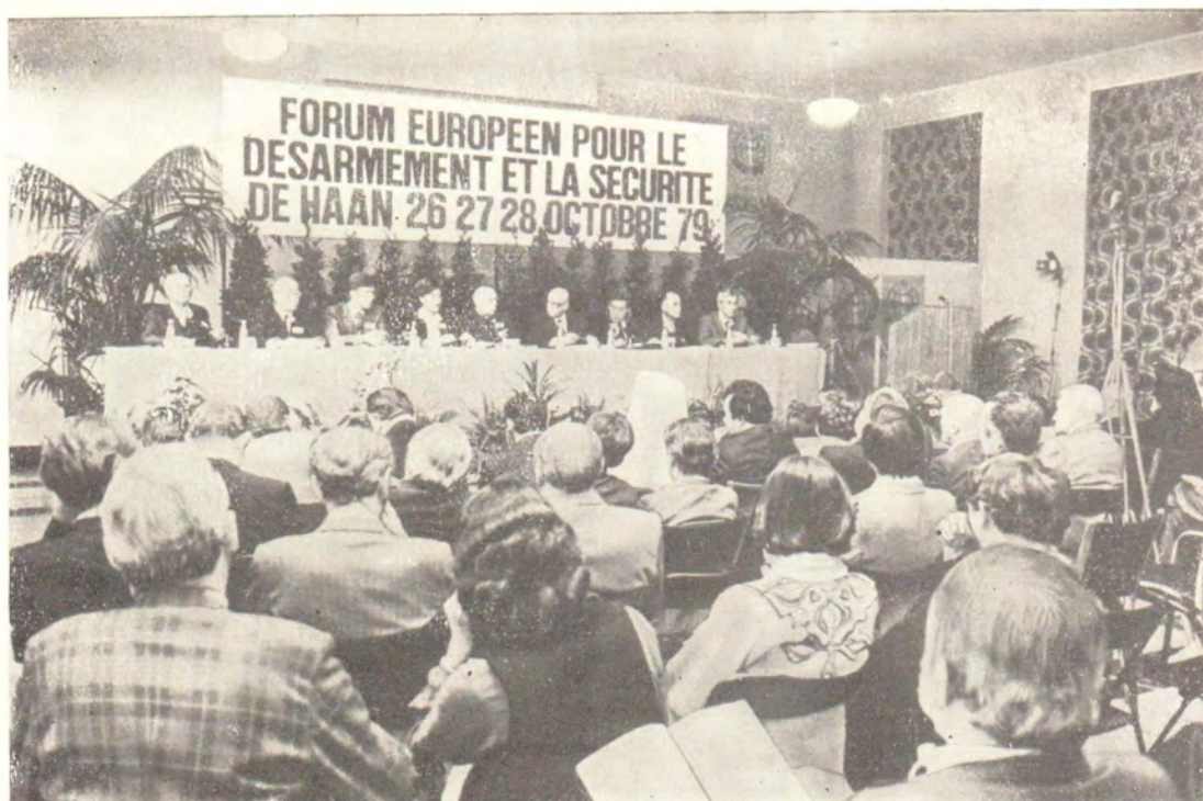
В зале заседаний Европейского форума по разоружению и безопасности 26—28 октября 1979 года.