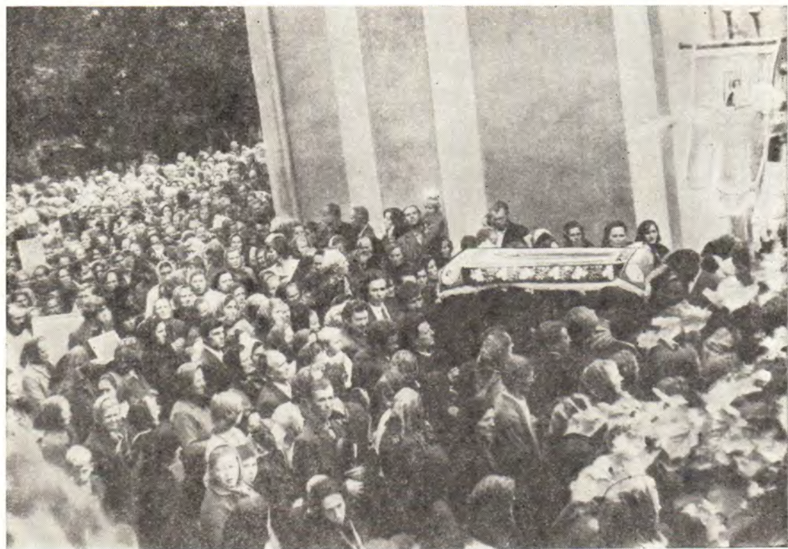
28 августа 1979 года. Крестный ход в Свято-Николаевском женском монастыре в г. Мукачево.