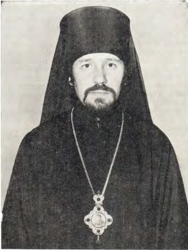
Преосвященный ИЛИАН, епископ Солнечногорский

Я вспоминаю свои детские и юношеские годы на родной уральской