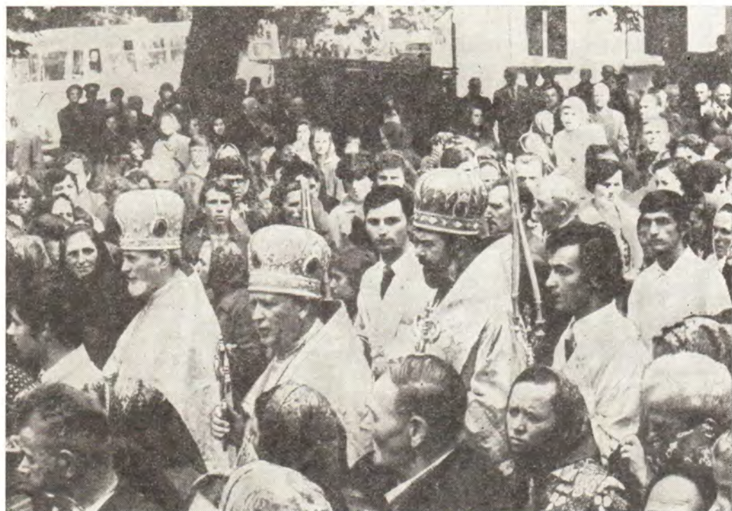
Епископ Мукачевский и Ужгородский Савва с клириками и мирянами совершает крестный ход вокруг Успенского кафедрального собора в г. Мукачево.