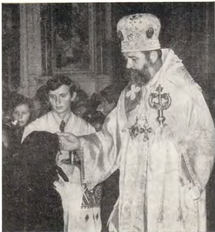
4 сентября 1979 года. Епископ Мукачевский и Ужгородский Савва помазывает богомольцев освященным елеем за всеобщим бдением в Успенском кафедральном соборе в г. Мукачево

При многотысячном стечении верующего народа в Мукачевском Свято-Николаевском монастыре на Чернечей горе греко-католическое духовенство принял в отеческие объятия добрый и мудрый православный архипастырь Высокопреосвященный Макарий, архиепископ Львовский и Тернопольский и Мукачевско-Ужгородский (†2 марта 1961). Здесь же, в обите-