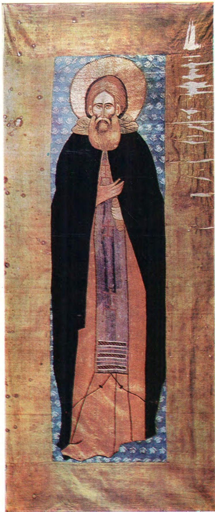
ПРЕПОДОБНЫЙ СЕРГИЙ, ИГУМЕН РАДОНЕЖСКИЙ И ВСЕЯ РОССИИ ЧУДОТВОРЕЦ