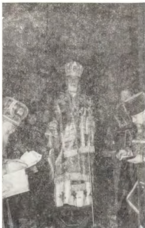
28 июля 1979 года. Архиепископ Пермский и Соликамский Николай за богослужением в Свято-Троицком кафедральном соборе в г. Перми

Затем были возглаголены уставные многолетия.