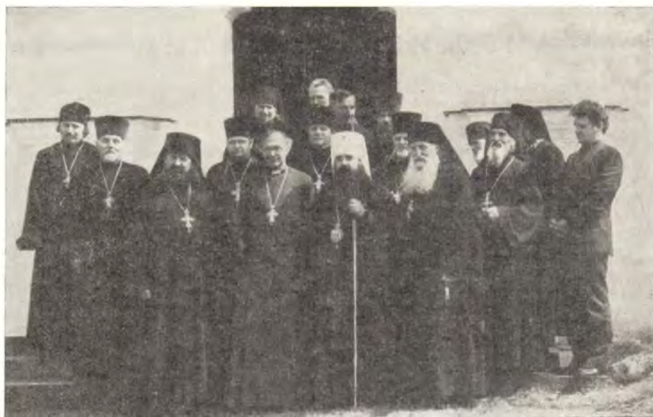
5 июня 1979 года, день празднования Обретения мощей святителя Леонтия, епископа Ростовского. Митрополит Минский и Белорусский, Патриарший Экзарх Западной Европы, Филарет и епископ Сент-Олбанский Роберт Ранси [Церковь Англии] с братией Успенского мужского монастыря в пос. Жировицы [Гродненская область]