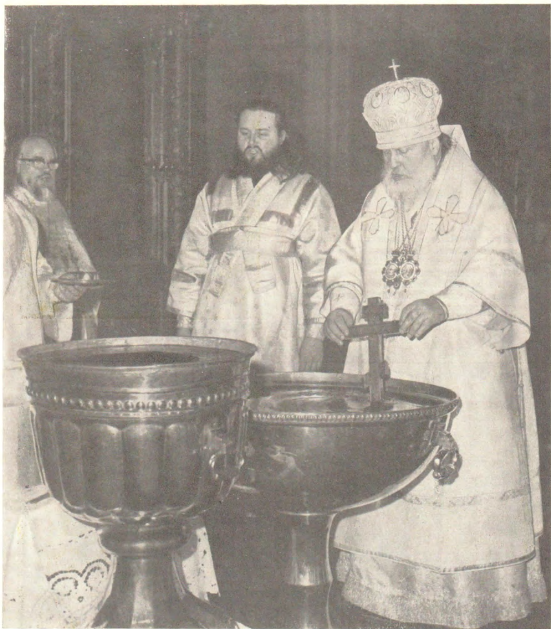
Богоявленский патриарший собор. Святейший Патриарх Пимен совершает великое освящение воды в праздник Богоявления, Крещения Господня