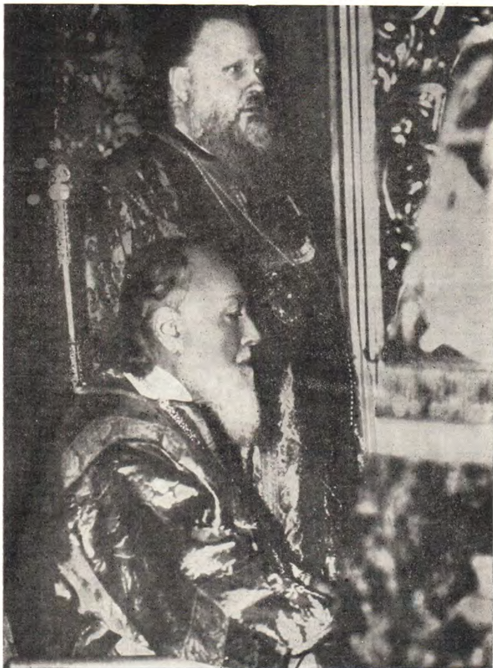
Святейший Патриарх Алексий и митрополит Крутицкий и Коломенский Пимен (ныне — Святейший Патриарх) за богослужением в Богоявленском патриаршем соборе [1969 г.]

возраст. Несомненно, это было благословение и особая милость. Божия не только к самому Святейшему Алексию, но и к Русской Церкви, которую он окормлял.