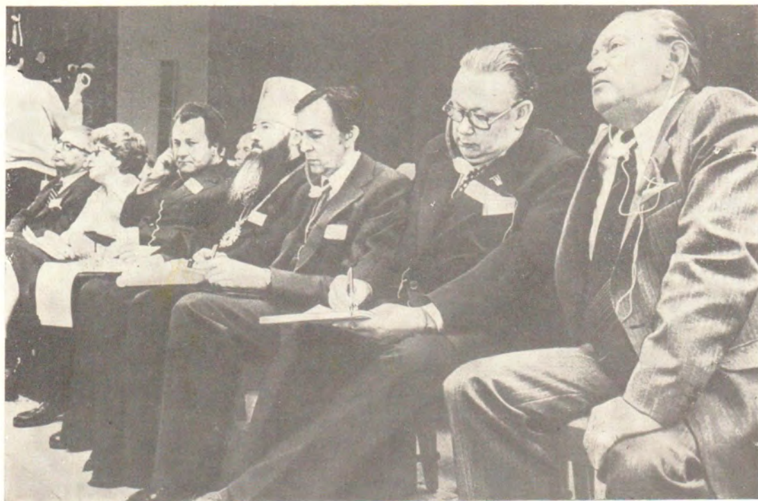
Митрополит Ювеналий среди членов Советской делегации на Европейском форуме по разоружению и безопасности.