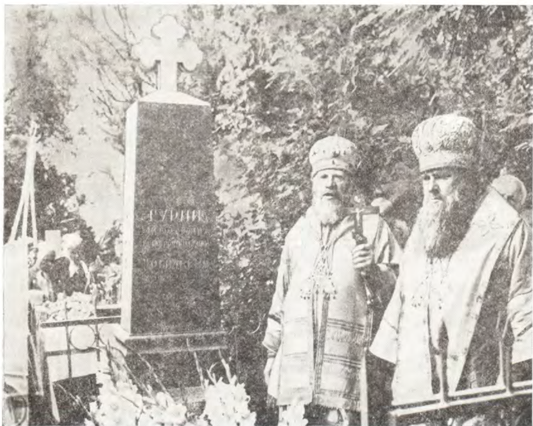
12 июля 1979 года. Митрополит Ярославский и Ростовский Иоанн и архиепископ Симферопольский и Крымский Леонтий у могилы митрополита Гурия в ограде Всехсвятского храма в г. Симферополе

В конце богослужения митрополит Иоанн и архиепископ Леонтий обменялись словами при-