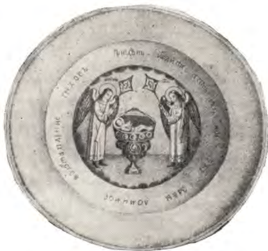
Деревянный диск Преподобного Сергия Радонежского

Эта молитва могла быть записана самим Преподобным Сергием, могла передаваться из поколения в поколение по устному преданию, наконец, могла быть открыта по Божественному Промыслу и в XVII веке, но так или иначе духовный опыт Троицкой обители являет ее как молитву самого Преподобного Сергия, и ныне предстоящего Престолу Пресвятой Троицы и молящегося о нас.