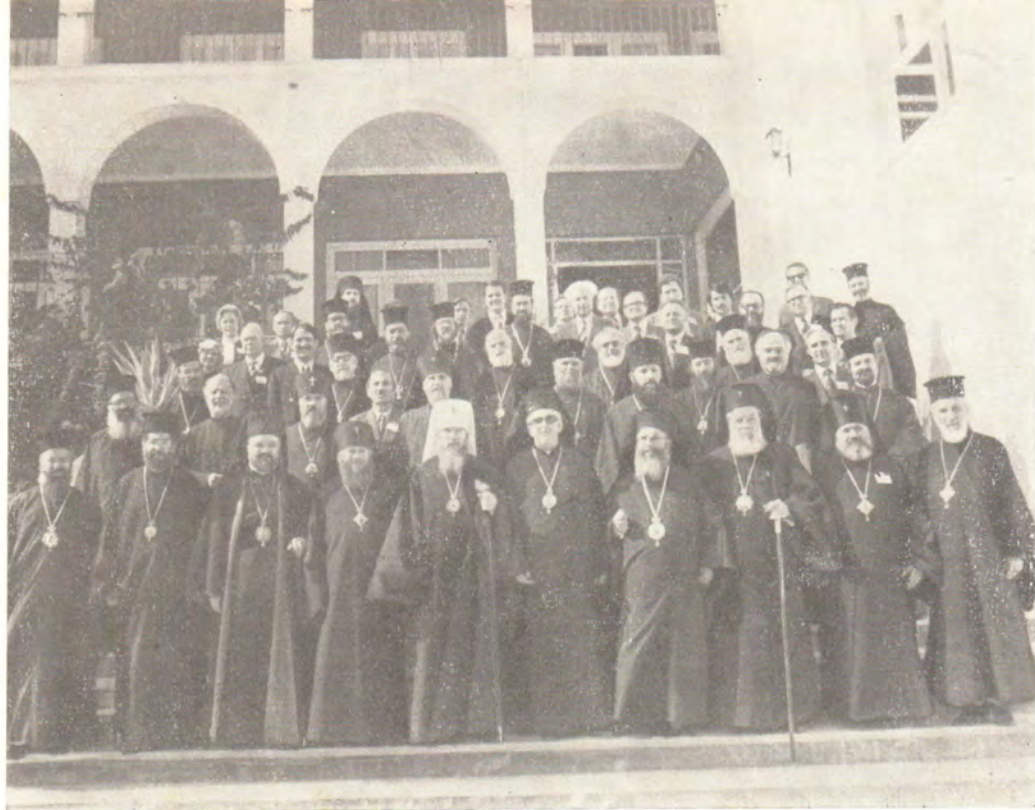
Представители Православных Церквей — участники VIII Генеральной Ассамблеи Конференции Европейских Церквей, проходившей на Крите, Греция, 18—25 октября 1979 года, у здания Православной академии на Крите.