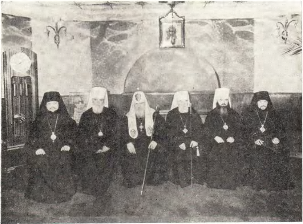
25 ноября 1979 года после Божественной литургии в Богоявленском патриаршем соборе. Справа налево: епископ Солнечногорский Илиан, митрополит Крутицкий и Коломенский Ювеналий, Блаженнейший Митрополит Пражский и всей Чехословакии Дорофей, Святейший Патриарх Московский и всея Руси Пимен, митрополит Киевский и Галицкий Филарет, Патриарший Экзарх Украины, епископ Зарайский Иов

«Господи! Пошли другого, кого можешь послать» (Исх. 4, 13), — хочется воскликнуть мне сейчас, когда возлагается на меня непосильное, по человеческим меркам, бремя архиерейства. Смогу ли я, малый и юный от братии моей, достойно нести это церковное послушание, смогу ли быть «образцом для верных в слове, в жизни, в любви, в духе, в вере, в чистоте» (1 Тим. 4, 12)?