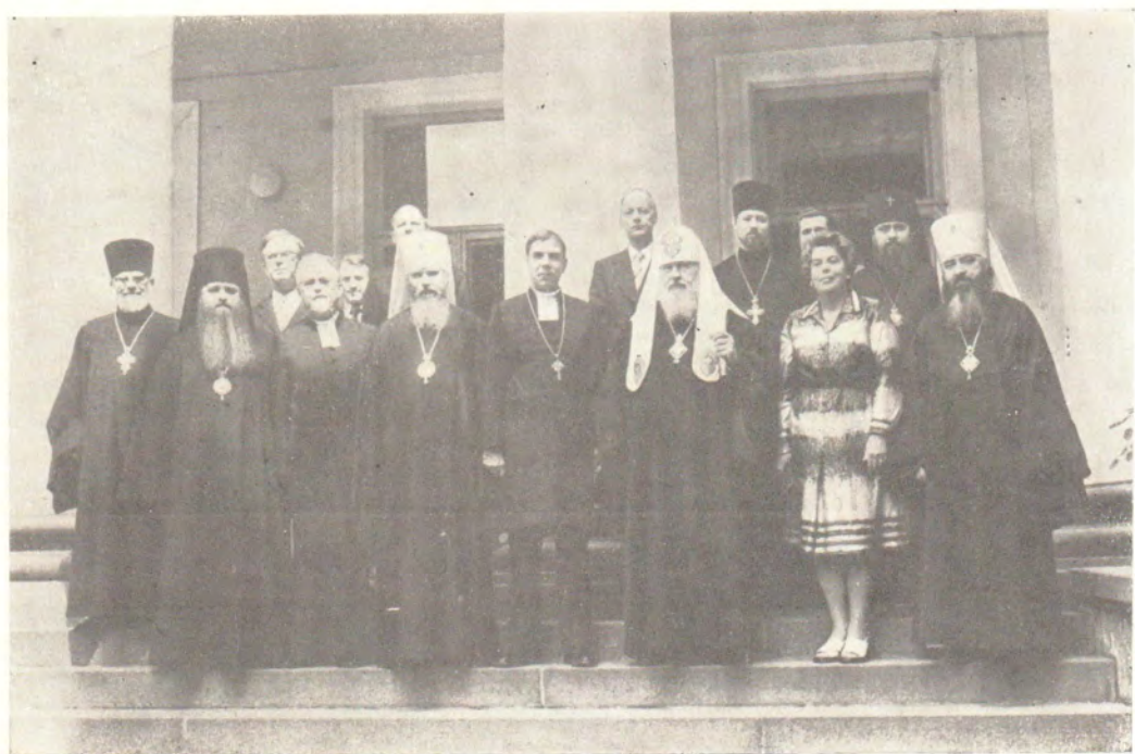
Святейший Патриарх Московский и всея Руси Пимен с делегацией Евангелическо-Лютеранской Церкви Финляндии во главе с Архиепископом д-ром Микко Юва, июль 1979 года.