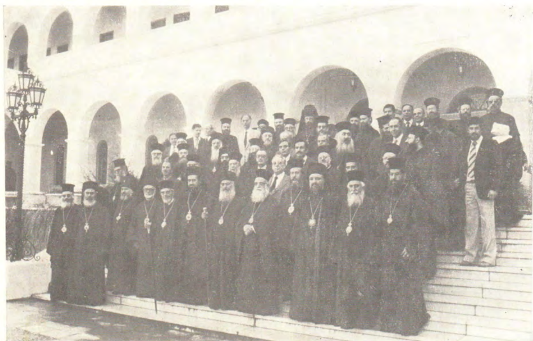
Афины. Участники Межправославного богословского симпозиума, посвященного памяти св. Василия Великого, с Блаженнейшим Архиепископом Афинским Серафимом.