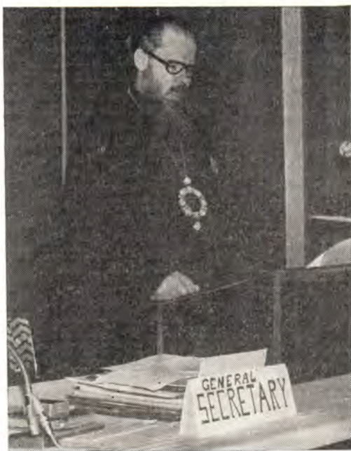
Президент КЕЦ митрополит Таллинский и Эстонский Алексей выступает с основным докладом на Генеральной Ассамблее

6.4. При важности и необходимости всех Таинств в Церкви, одно из них выделяется своей особой значимостью в «собрании» Тела Христова 34 . Само слово «Церковь» — «Экклесия» означает «собрание», «созывание». Это «собрание» всех во единое Тело осуществляется в святейшем Таинстве Евхаристии. О нем преподобный Симеон Новый Богослов (949—1032) говорит: Поскольку «невозможно Ему опять воплощаться и рождаться телесно в каждом из нас, то... ту самую пренепорочную плоть, которую принял Он от Пречистой Марии Богородицы... преподает нам в таинстве... и соединяется с существом и еством нашим неизречно и нас обоготворяет, так как