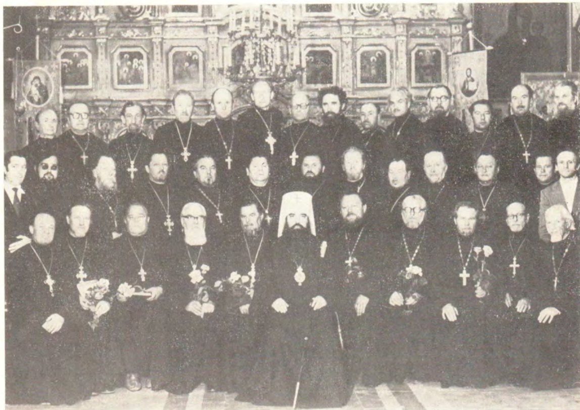
4 июня 1979 года в Казанском храме в г. Витебске состоялось собрание духовенства Витебского благочиния Минской епархии. На снимке: митрополит Минский и Белорусский Филарет, Патриарший Экзарх Западной Европы, с клириками Витебского благочиния.