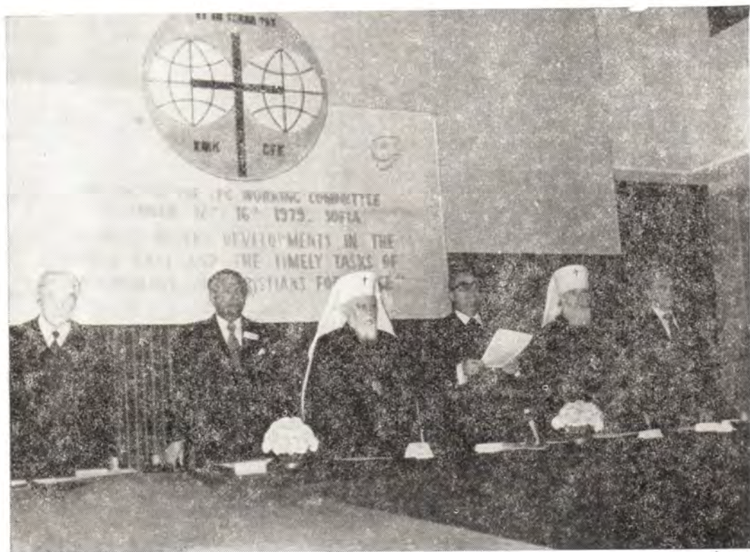
Молитва при открытии сессии Рабочего комитета ХМК в Софии. В центре — Святейший Патриарх Болгарский Максим

Рабочий комитет заслушал доклады о деятельности континентальных и региональных комитетов, дал оценку работе Движения со времени последнего заседания Рабочего комитета в Хельсинки весной этого года и принял планы дальнейшей деятельности.