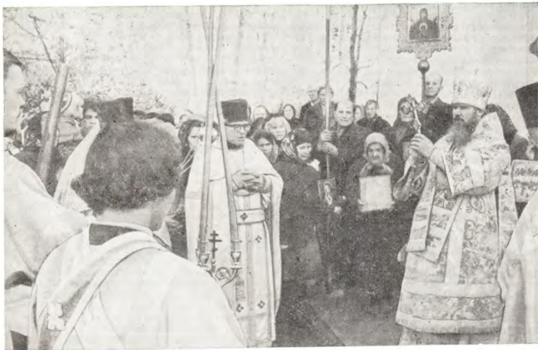
Митрополит Таллинский и Эстонский Алексей совершает крестный ход в приходе Покрова Пресвятой Богородицы в с. Нина 14 октября 1978 года, в день празднования 150-летия со дня освящения храма