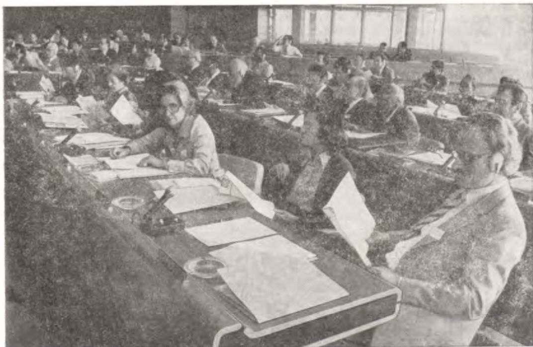
В зале заседаний Генеральной ассамблеи. Во втором ряду — митрополит Киевский и Галицкий Филарет, Патриарший Экзарх Украины

Христианскую Мирную Конференцию на ассамблее представляли президент ХМК епископ д-р Кароли Тот, вице-президент ХМК пастор Ришар Андриаманджато, председатель Комитета продолжения работы ХМК митрополит Киевский и Галицкий Филарет, Патриарший