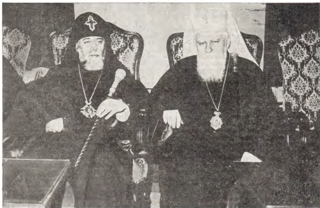
Святейший Католикос-Патриарх Илия и Святейший Патриарх Максим в Синодальной палате 10 мая 1979 г. после вручения наград

Святейший Патриарх Максим обратился к Святейшему Патриарху Илию с словом приветствия. В своем слове Святейший Патриарх Максим отметил духовное значение равноапостольного подвига святых солунских братьев для славянских Церквей и восстановления патриаршества для Болгарской Церкви. Святей-