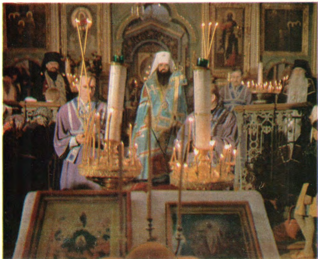
Митрополит Минский и Белорусский Филарет, Патриарший Экзарх Западной Европы, за богослужением в Успенском мужском монастыре в Жировицах.