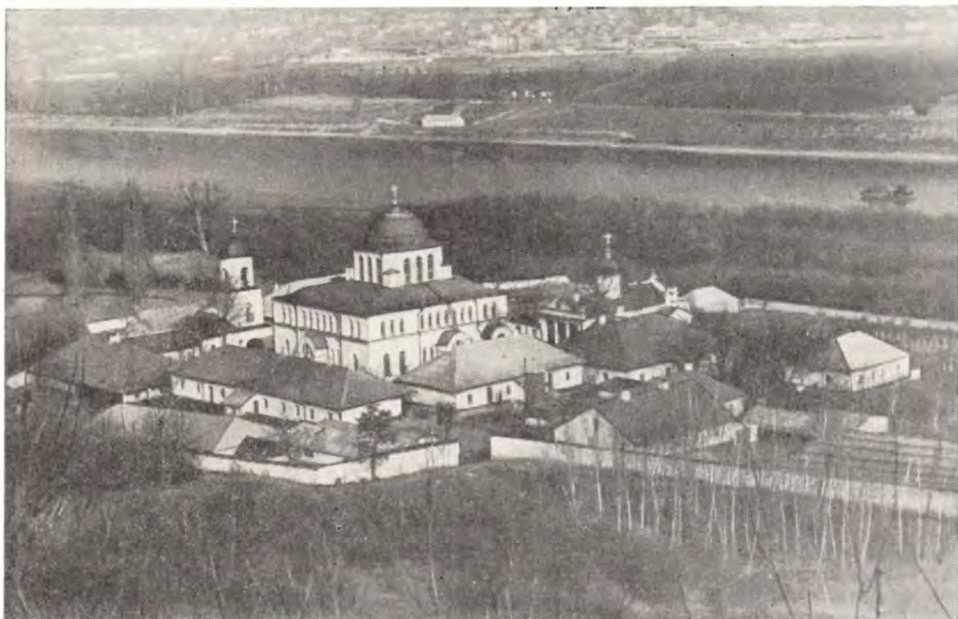
Жабский Вознесенский женский монастырь (Каменский район Молдавской ССР)

17 сентября, в Неделю 13-ю по Пятидесятнице, архиепископ Ионафан совершил Божественную литургию в Свято-Троицком храме в с. Гратиешты, что под Кишиневом. На малом входе Владыка возложил на настоятеля протоиерея Константина Степана патриаршую награду — митру. После молебна архипастырь произнес поучение на слова апостольского послания (1 Кор. 16, 13—14) и поздравил настоятеля с высокой патриаршей наградой.