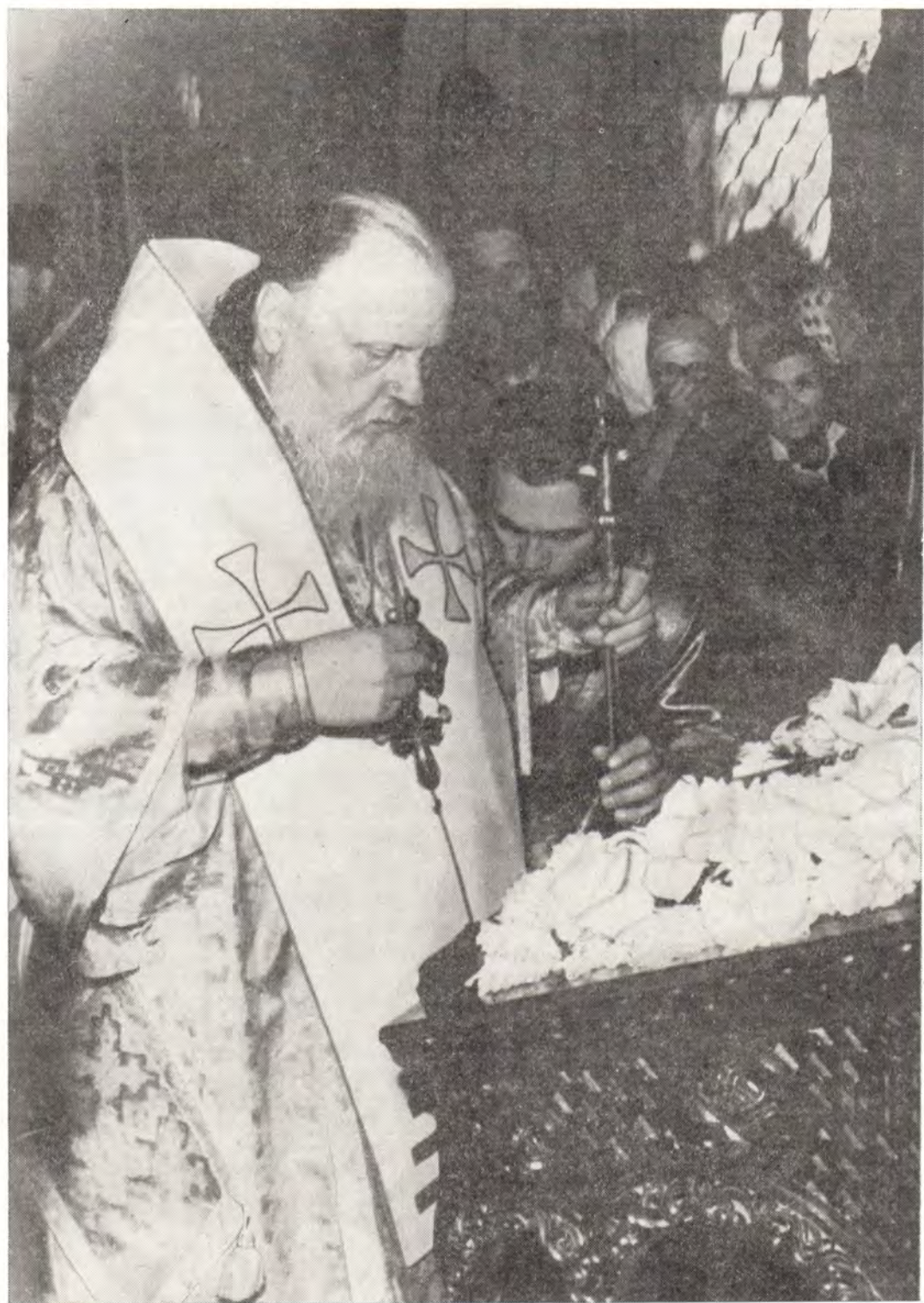
10 августа 1979 года, в праздник Смоленской иконе Божией Матери «Одигитрии», в Успенском храме в Новодевичьем монастыре Пречистой Одигитрии в Москве. Святейший Патриарх Пимен по окончании богослужения прикладывается к праздничному образу