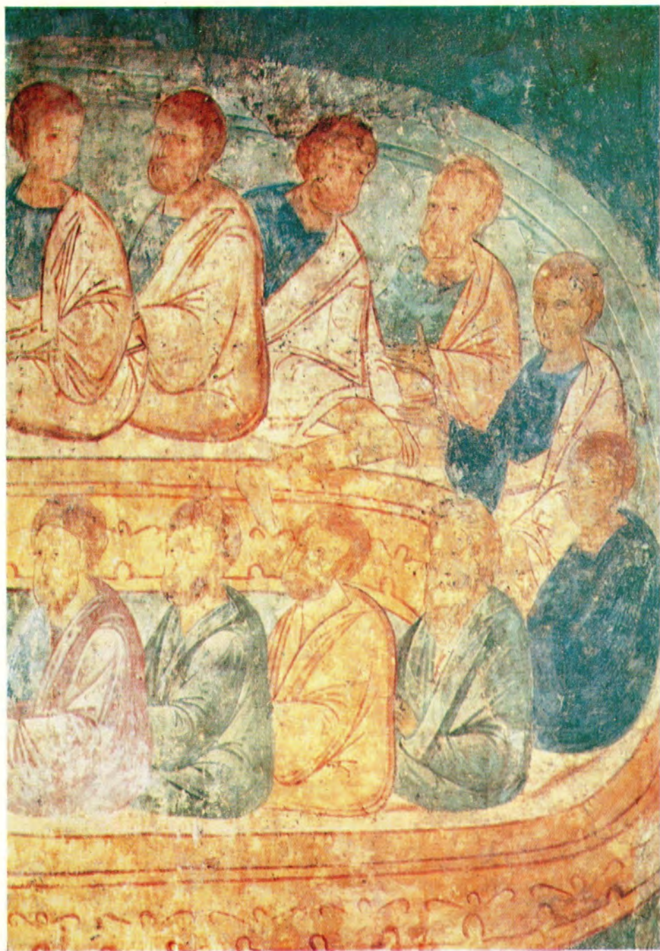
Вновь расчищенные росписи [фрески] XVI века в храме Рождества Пресвятой Богородицы, что на Возмище города Волоколамска.