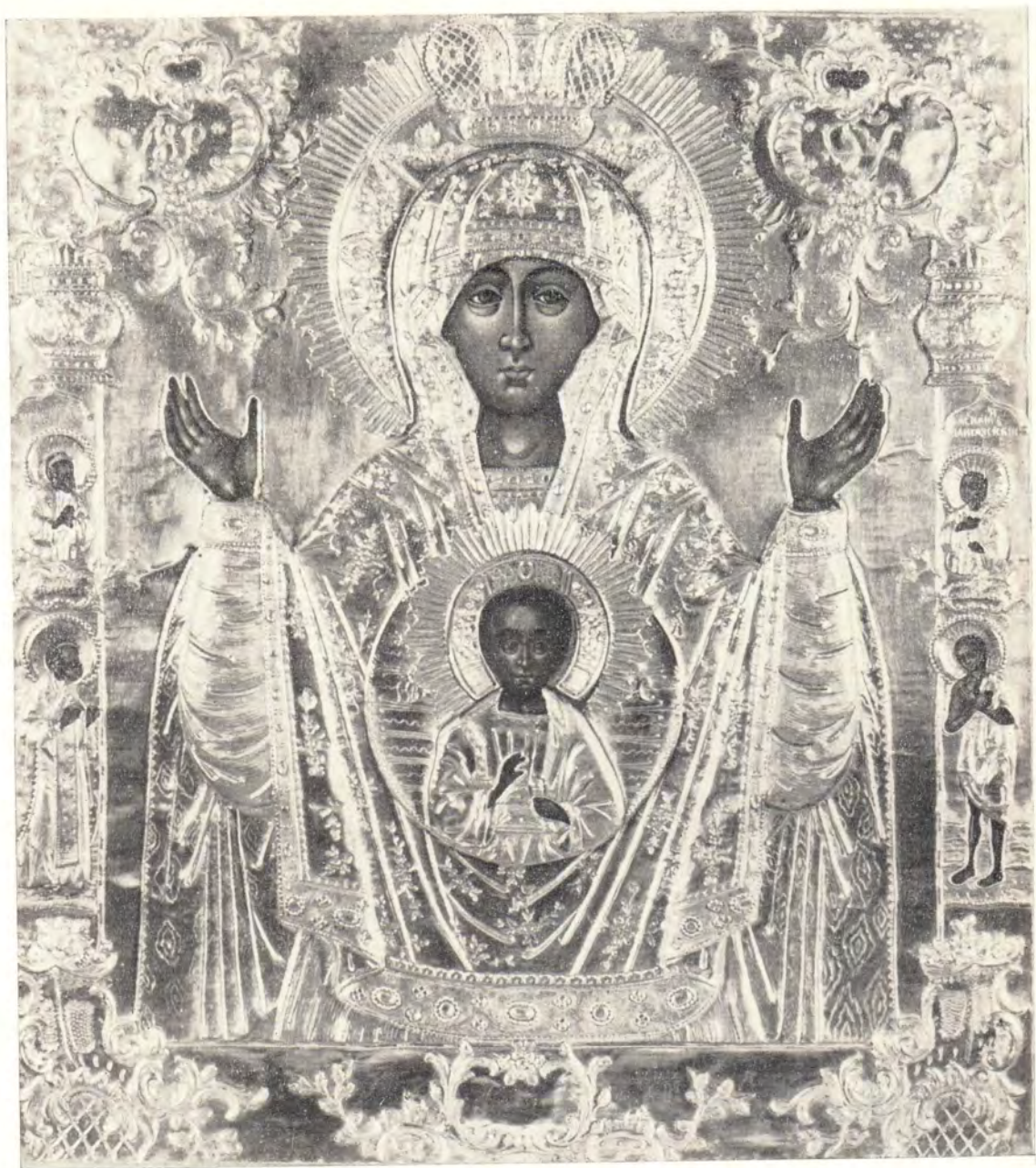
Абалацкая икона Божией Матери. На полях: праведный Симеон Верхотурский и святитель Николай — слева, мученик Василий Мангазейский и преподобная Мария Египетская — справа. Из храма Воскресения Слоущего, что на Успенском Вражке, Москва.