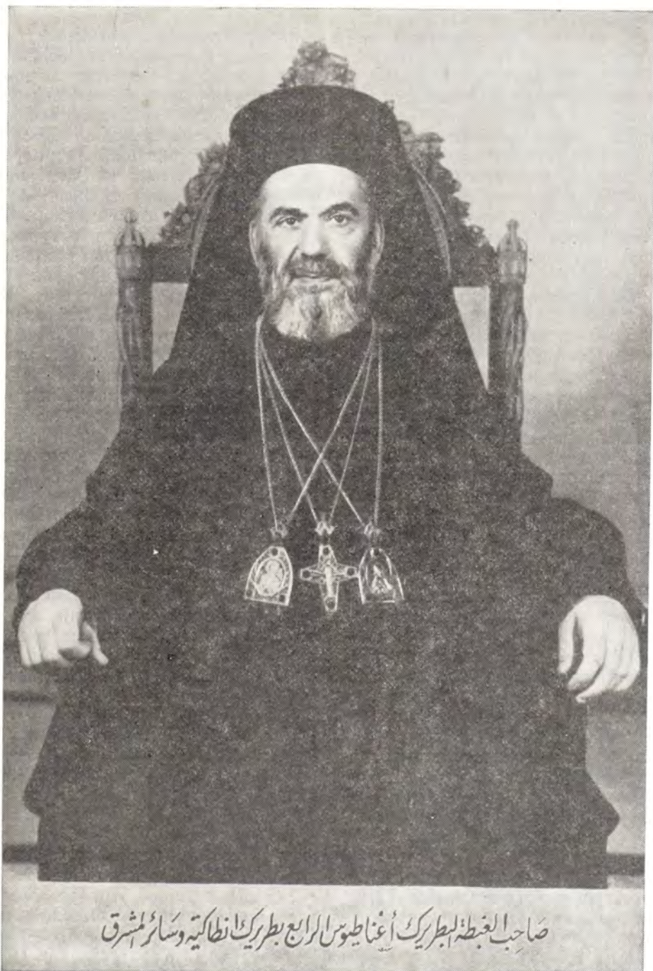
صاحب الغبطة بطريرك أنطاكية وسائر المشرق

ване. Среди многочисленных представителей христианских исповеданий в соборе находились апостольский прунций в Сирии монсеньор Анджело Педрони, греко-католический мелхитский Патриарх Блаженнейший Максим V Хаким, ассирийский сиро-яковитский Патриарх Иаков-Игнатий III, представитель Маронитского Патриарха Антония Хорейша — Ролан Абу-Жодий,