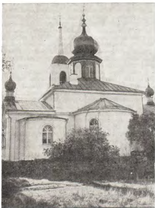
Храм в честь Покрова Пресвятой Богородицы в с. Нина [Таллиннская епархия]

лишь центральная часть. Главный престол трех- престольного храма освящен во имя пророка Божия Илии. После освящения храма митро- полит Алексей в сослужении клириков Нарв-