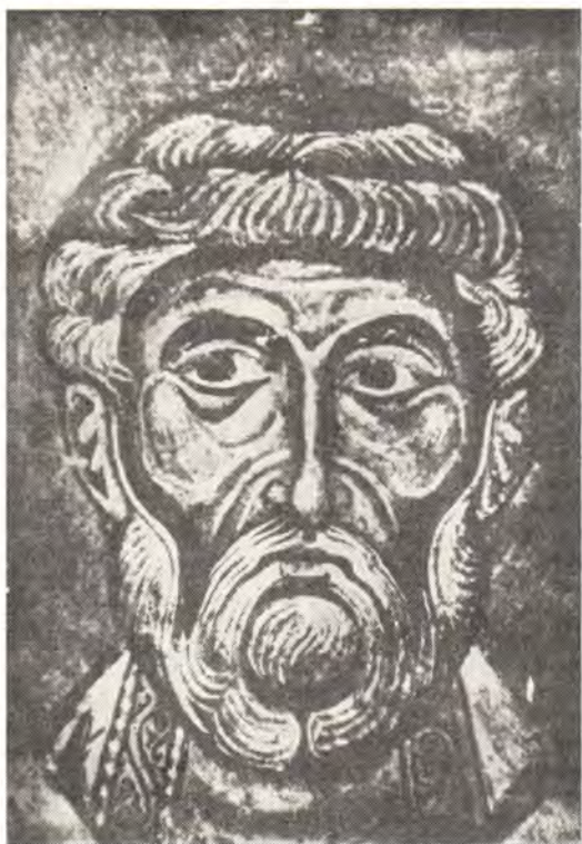
Фреска священномученика Петра Александрийского

Из храма Спаса-Нередицы в Новгороде, XII в.