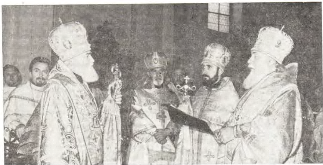
К 100-летию со дня рождения епископа-мученика Горзда. Митрополит Одесский и Херсонский Сергей оглашает приветственное Послание Святейшего Патриарха Пимена по случаю юбилея (К статье в «ЖМП», 1979, № 9, с. 43)

(По материалам бюллетеня «Епископсис», № 210, 15.5.79)