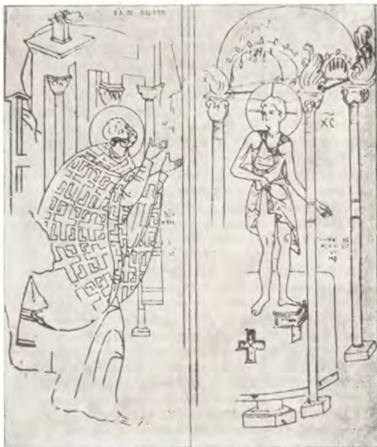
Видение святителю Петру Александрийскому Из нартекса храма митрополии в Мистре

На Руси явление Петру было распространено в составе изображения Первого Вселенского Собора. Самое раннее изображение — это фреска Дионисия из храма Рождества Пресвятой Богородицы в Ферапонтовом монастыре XV века 24 , более поздние — таблетка новгородского Софийского собора конца XV — начала XVI века 25 , икона XVI века из Ростовского музея 26 , две иконы XVII века Московской школы иконописи 27 . В Новгородском иконописном подлиннике в описании иконы I Вселенского Собора сказано и о священномученике Петре: «Первый Собор Вселенский овы собор на Ариа. Спас явися Петру Александрийскому младенцем, в раздранней ризе, на престоле. Престол кеноварь, над ним покровец, завеса кеноварь. Петр сед, плешив, брада аки Николина, пал на колени, зрит на Него и руцы молебны» 27а . Роспись в соборе Ярославского Спасо-Преображенского монастыря была сделана в 1781 году, но она повторяла фреску 1563 года, сделанную при Иване Грозном и митрополите Макарии 28 . На южной стене собора представлено изображение Никейского Собора. Аналогична и стенопись Ярославского храма Николая Мокрого. Первый Вселенский Собор передается там следующим образом: «Храм с тремя маковицами; в нем на возвышенном троне — император Кон-