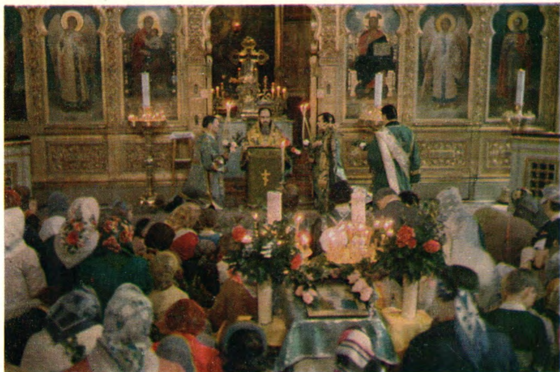
Митрополит Таллинский и Эстонский Алексей за богослужением в Александро-Невском кафедральном соборе в г. Таллине 10 июня 1979 года в день Святой Троицы.