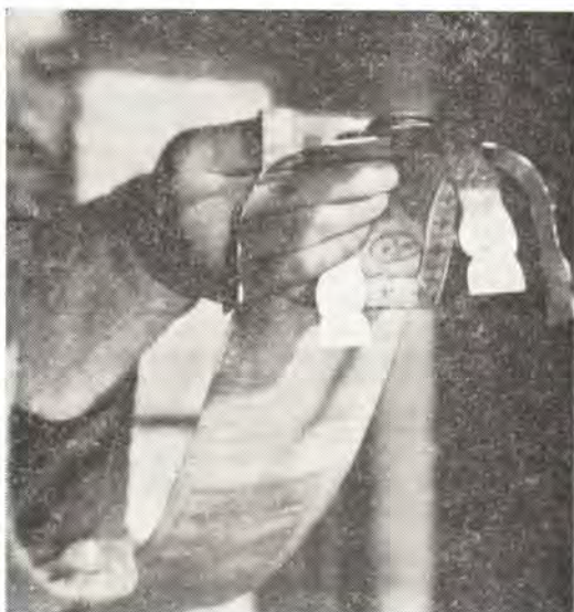
Победную песнь поюще... Диакон звездицею творит образ креста над диском

Если же священник служит с диаконом, то диакон, стоя у северной (левой) стороны престола, осеняет себя крестным знамением и целует престол. Затем правой рукой, держащей конец ораля, при возгласном произношении священником слов: Победную песнь поюще... , взяв «святую звездицу от святого диска, творит креста образ веру его (диска)» (Служебник), как бы воспроизводя благословение священника. Далее диакон складывает звездицу, целует ее и полагает в верхней стороне анти-