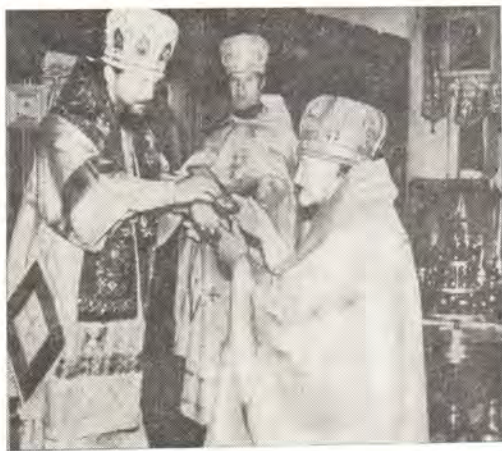
24 июня 1979 года. Архиепископ Харьковский и Богодуховский Никодим вручает орден Преподобного Сергия Радонежского II степени архимандриту Гермогену [Черкашину]