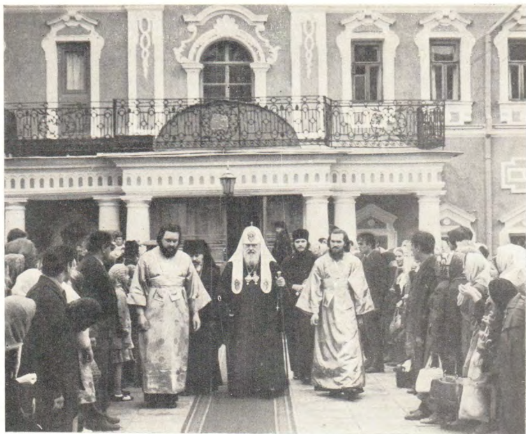
18 июля 1979 года, праздник Обретения мощей Преподобного Сергия. Святейший Патриарх Пимен направляется из патриарших покоев в Троицкий собор Троице-Сергиевой Лавры для совершения Божественной литургии