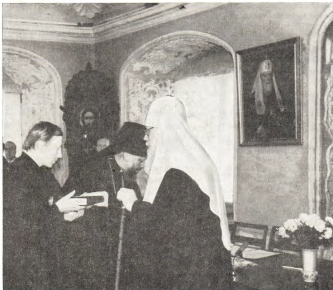
Святейший Патриарх Пимен на выпускном акте Московских духовных академии и семинарии вручает выпускникам дипломы и аттестаты

Теплоты и сердечности были исполнены вы-