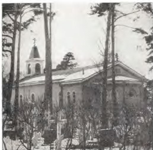
Храм Никольской Патриаршей общины в г. Хельсинки

ден Святого Агнца I степени. Получили орден и другие члены делегации.