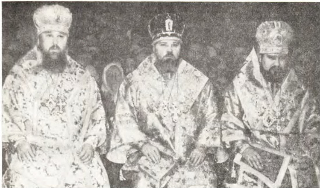
Слева направо: архиепископ Новосибирский и Барнаульский Геден, архиепископ Краснодарский и Кубанский Гермоген и епископ Ставропольский и Бакинский Антоний в Свято-Екатерининском кафедральном соборе в г. Краснодаре за богослужением в храмовый праздник 7 декабря 1978 года

Пензенская епархия. 27 октября 1978 года Пензенская епархия встречала своего архипастыря — епископа Пензенского и Саранского Серафима.