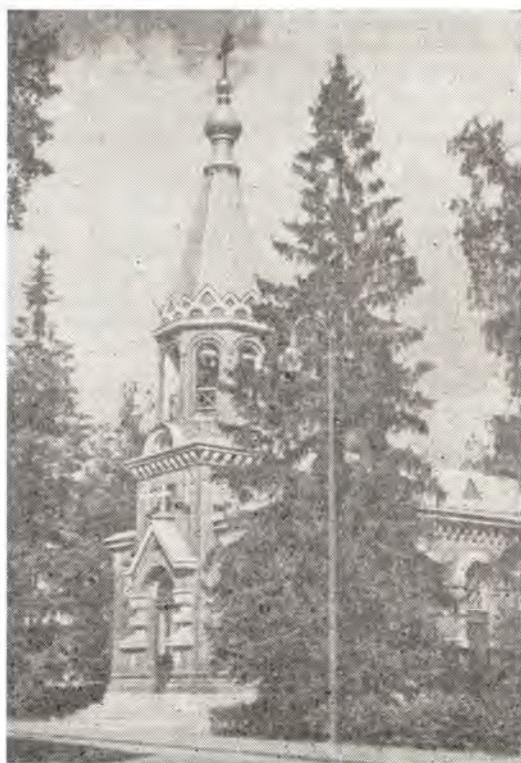
Храм во имя святителя Николая в г. Хельсинки

В XVIII в. митрополит Новгородский и Санкт-Петербургский Гавриил вызвал на Валаам из Саровской пустыни старца Назария, славившегося духовной опытностью, и назначил его настоятелем монастыря. Будучи постриженником и воспитанником Саровской пустыни, старец Назарий, «быв наполнен впечатлениями этой обители, осуществлял их... в