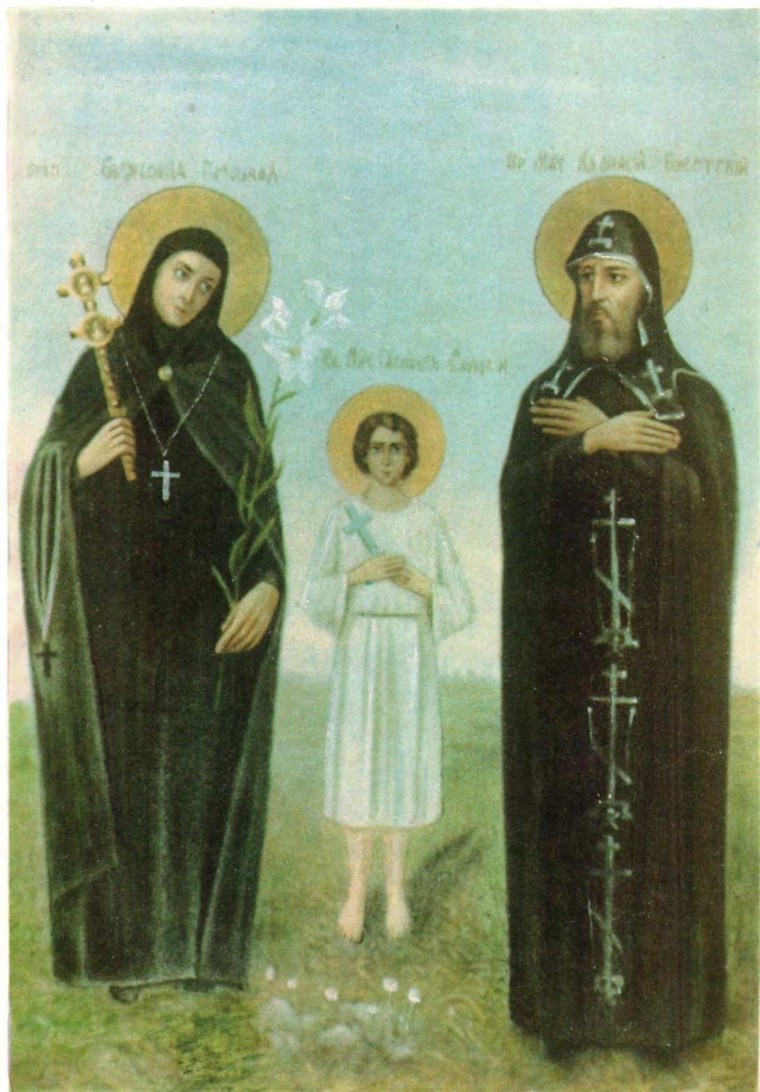
Собор Белорусских святых: преподобная Евфросиния, игуменья Полоцкая (память 23 мая), мученик младенец Гавриил Белостокский (память 20 апреля), преподобномученик Афанасий Брестский (память 5 сентября и 20 июля).

Из настенных росписей Успенского собора Жировицкого монастыря