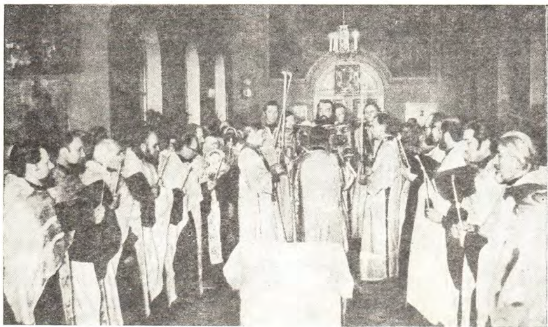
Суббота 24 февраля 1979 года. Митрополит Минский и Белорусский Филарет, Патриарший Экзарх Западной Европы, за всеобщим бдением в Никольском храме в г. Гомеле