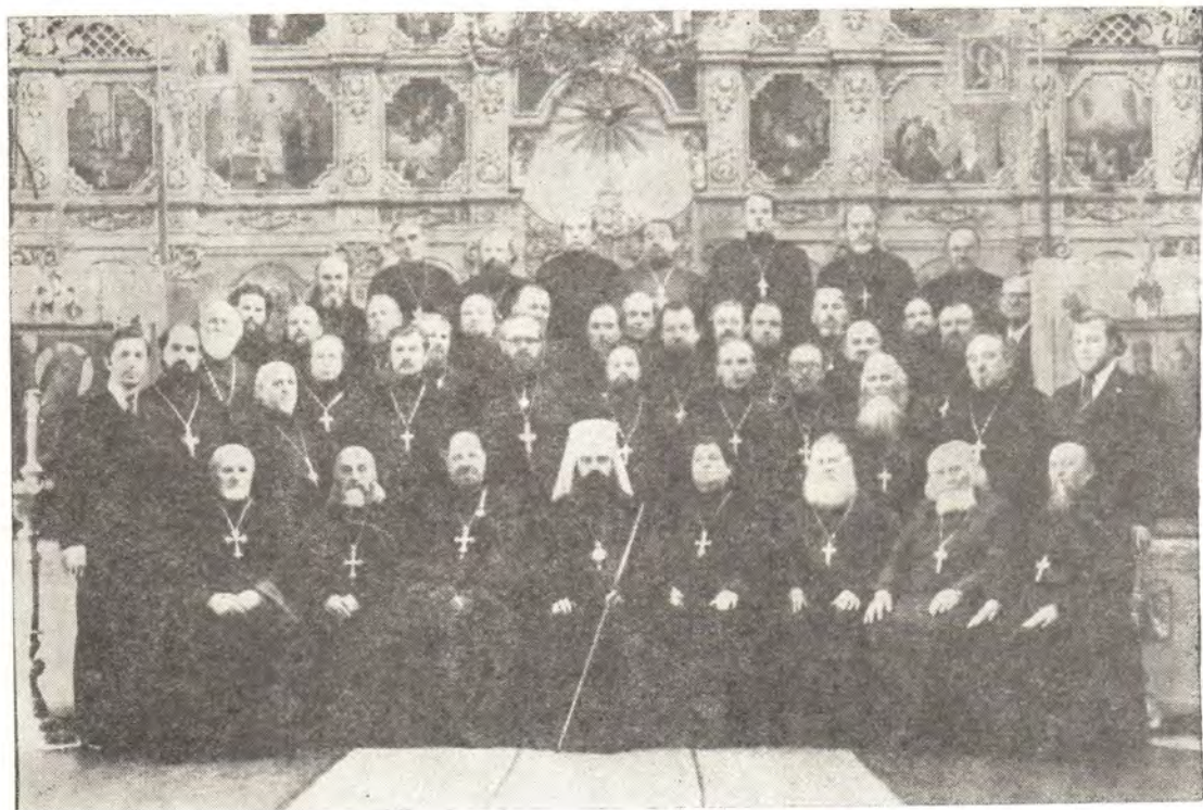
Митрополит Минский и Белорусский Филарет, Патриарший Экзарх Западной Европы, на встрече с клириками Гомельского благочиния 26 февраля 1979 года