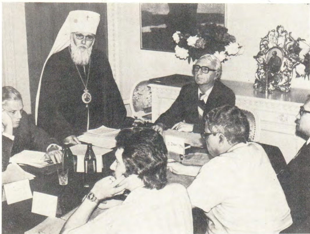
Региональное заседание Комиссии Церквей по международным делам ВСЦ. На верхнем фото: митрополит Филарет приветствует участников заседания. Председательствует модератор КЦМД посол Олле Даллен (Швеция)