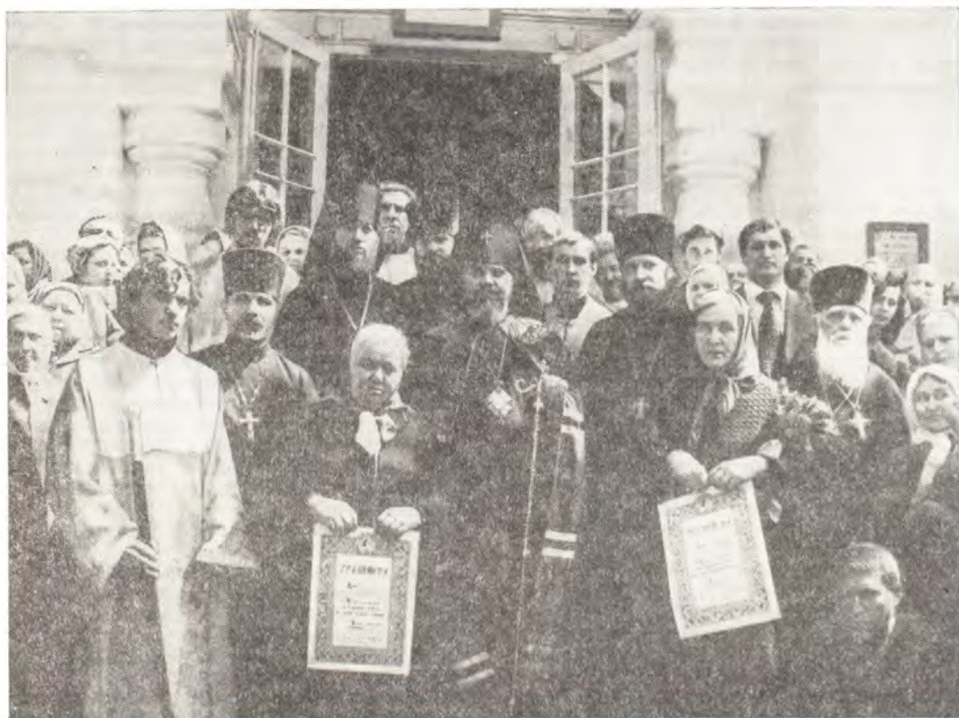
23 сентября 1978 года. Архиепископ Краснодарский и Кубанский Гермоген с клириками и мирянами после богослужения в Михаило-Архангельском соборе в г. Сочи

27 декабря Владыка Гермоген посетил приходы в г. Усть-Лабинске и г. Кропоткине. С настоятелями и исполнительными органами архипастырь провел беседу и преподал наставления.