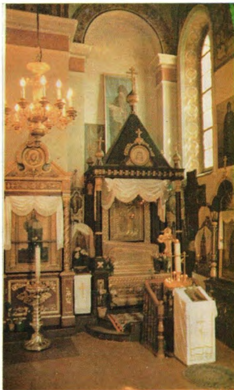
Минская епархия. Брестский собор во имя преподобного Симеона Столпника. Вверху слева: внешний вид собора; справа — рака преподобномученика Афанасия Брестского. Внизу: всенощное бдение в праздник святителя Николая Мирликийского 22 [9] мая