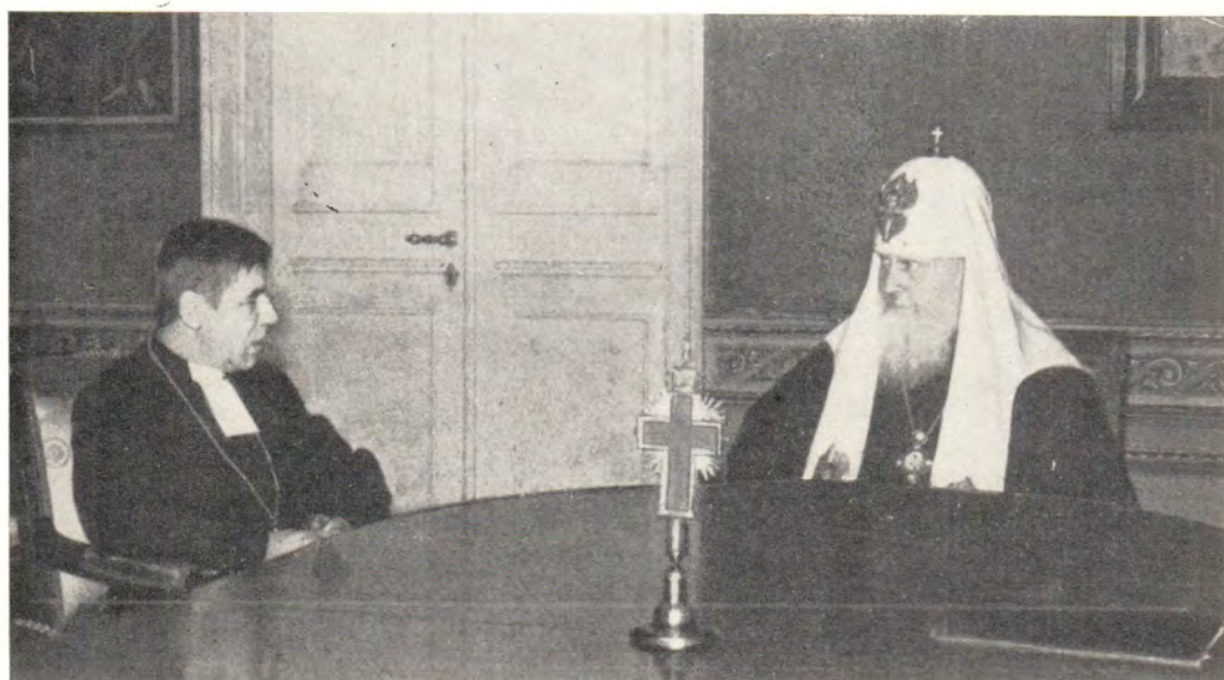
Архиепископ Евангелическо-Лютеранской Церкви Финляндии д-р Микко Юва на приеме у Патриарха Московского и всея Руси Пимена 16 июля 1979 года