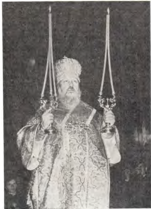
«Благодать Господа нашего Иисуса Христа...» Божественную литургию совершает Святейший Патриарх Пимен

Священник, согласно древнему обычаю, обращается к народу со словами апостола Павла: Благодать Господа нашего Иисуса Христа и любви (любовь) Бога и Отца и причастие (здесь — общение) Святаго Духа буди со всеми вами (2 Кор. 13, 13). Этим благословением священнослужитель желает молящимся ниспослания от Престола Пресвятой Троицы высших духовных даров — благодати, любви и общения. При этом при словах «буди со всеми вами» священник осеняет народ крестным знаменем и обращается к престолу. Хор от лица молящихся на благословение священника отвечает взаимным духовным благопожеланием: И со духом твоим! , то есть и его душе желают тех же благ и даров от Вседержителя Бога. «Это взаимное моление служителя алтаря о находящихся в храме, — и наоборот, — показывает дух братского единства христиан, доступность всякой усердной молитвы к Богу и одинаковое значение всех верующих пред Лицом Святейшего Судии» 5 .