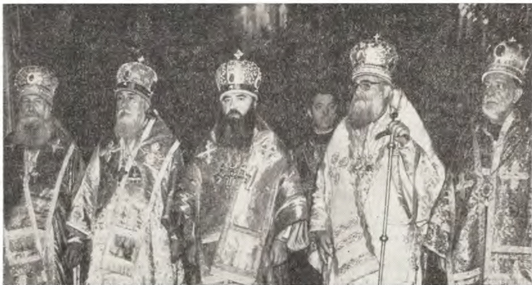
18 июля 1979 года. Блаженнейший Папа и Патриарх Александрийский Николай VI с иерархами Александрийской и Русской Церквей в Успенском соборе Троице-Сергиевой Лавры