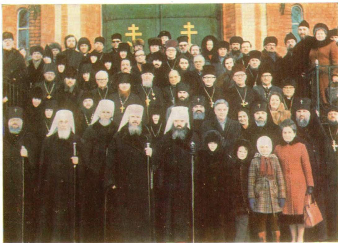
Участники юбилейных торжеств, посвященных 50 летию со дня рождения митрополита Таллиннского и Эстонского Алексея, в Пюхтицкой обители 23 февраля 1979 года.