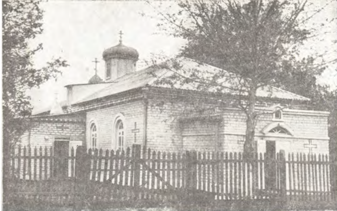
Введенский храм в городе Еманжелинске [Челябинская епархия]