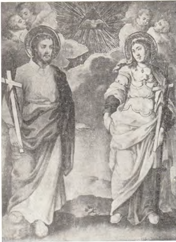
Святые мученик Назарий и мученица Иулиания Икона середины XVIII века из Борисоглебского храма

лась Бельничская икона Божией Матери, трудно судить. По одному преданию, ушедшие из Киева после нападения на него Батые в XIII веке монахи остановились в лесу, на горе, у притока Днепра — реки Друти. Здесь они основали монастырь с храмом во имя пророка Божия Или и поставили в нем принесенную с собою византийских писем икону Божией Матери.