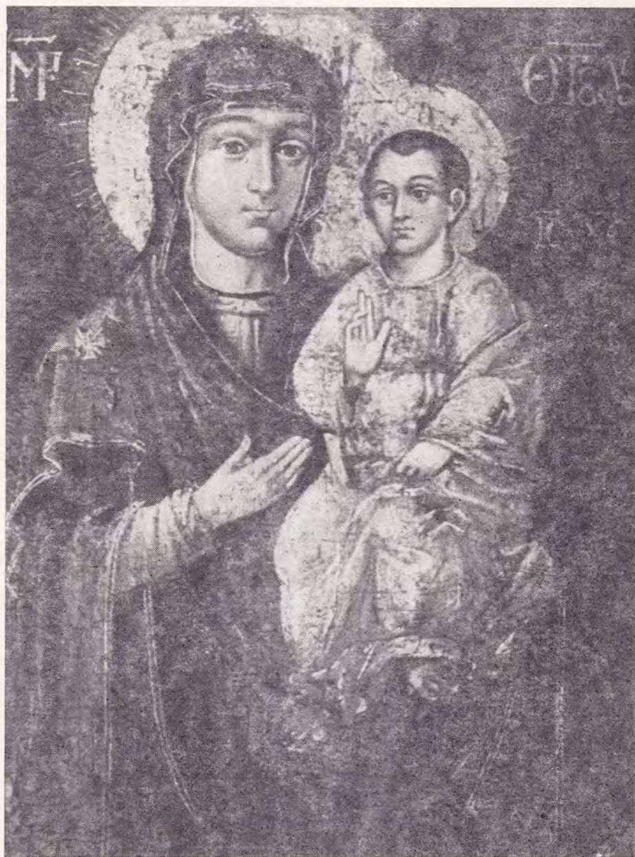
ЯВЛЕННАЯ МОГИЛЕВО-БРАТСКАЯ ИКОНА БОЖИЕЙ МАТЕРИ из Борисоглебского храма г. Могилева