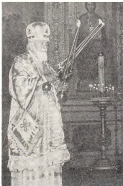
Архиепископ Пермский и Соликамский Николай за богослужением в кафедральном соборе в г. Перми

19 декабря, в день памяти Святителя Николая, Преосвященный Савва совершил Божественную литургию и проповедал в Мукачевском женском монастыре по случаю престольного праздника. После праздничного молебна были возгланы уставные многолетия.