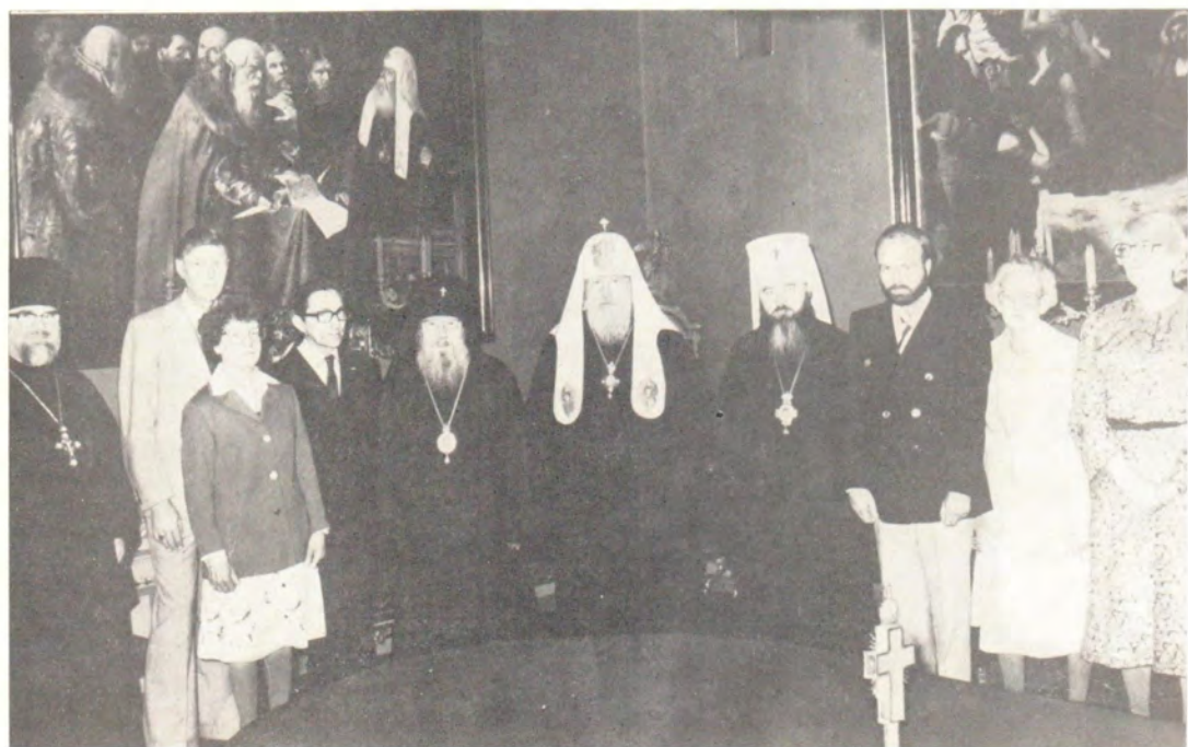
14 июня 1979 года Святейший Патриарх Московский и всея Руси Пимен принял архиепископа Гаагского и Нидерландского Иакова с группой паломников Нидерландской епархии