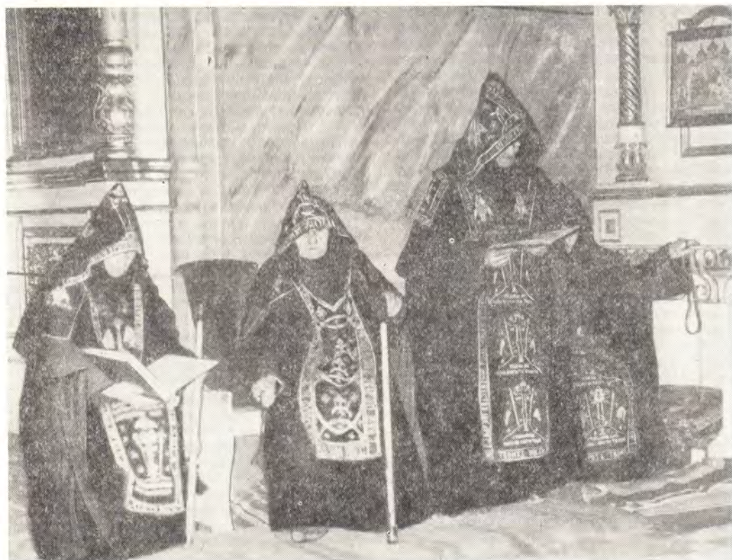
Схимницы за богослужением в храме Корецкого Свято-Троицкого монастыря

Монашеской одеждой считались, прежде всего, куколь, передняя часть которого имела изображение Креста, и мафорий (наплечник), покрывавший шею и плечи монаха. Нижним платьем инока был коловий, или хитон. У стро-