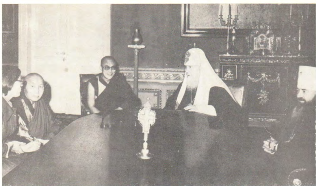
12 июня 1979 года Святейший Патриарх Московский и всея Руси Пимен принял Далай-ламу, верховного главу буддистов Тибета, бывшего в Москве проездом в Улан-Батор для участия в V Генеральной конференции буддистов за мир.