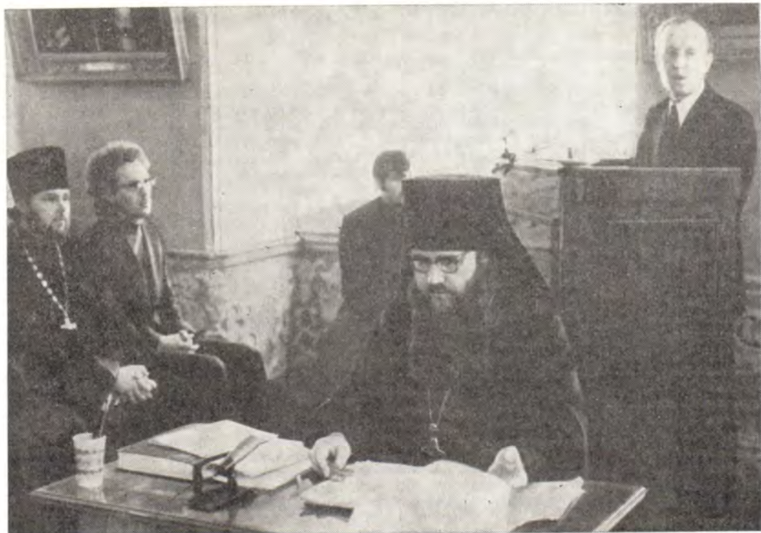
На диспуте. В центре — архимандрит Евлогий. Справа — выступает профессор К. Е. Скурат

нием в монастыре, однако, как показывает диссертант, монашество возможно и вне монастыря. Главное — стяжать в полноте духовный опыт христианского жителства, внутренне познать истину Божию и жить ею. Величайшие подвижники — отшельники и иноки общежительных монастырей иноческое житие и служение миру осуществляли при самых различных обстоятельствах и выражали в различных формах, сохраняя при этом незабываемую самую сущность монашеского подвига.