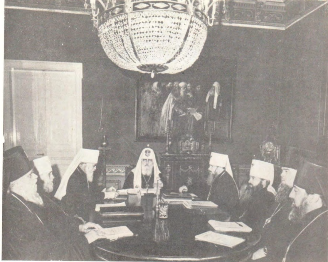
Заседание Священного Синода Русской Православной Церкви 20 июня 1979 года