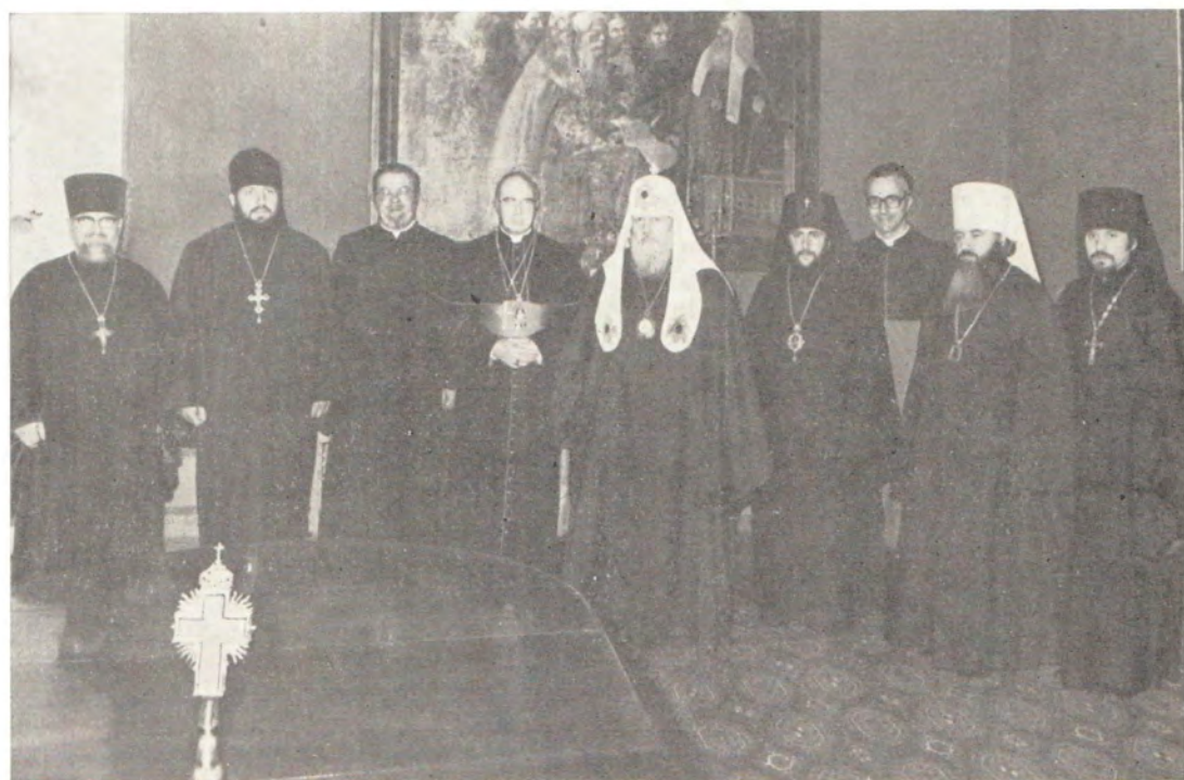
15 марта 1979 года. Кардинал Иоанн Виллебрандс на приеме у Святейшего Патриарха Московского и всея Руси Пимена