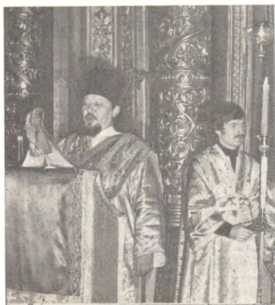
11 марта 1979 года, Неделя 1-я Великого поста, торжество Православия. Святейший Патриарх Пимен в сослужении митрополита Крутицкого и Коломенского Ювеналия, архиепископа Волоколамского Питирима, епископа Зарайского Иова и клириков совершает в патриаршем соборе молебное пение Недели Православия