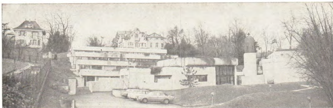
7—11 февраля 1979 года в Шамбези, Швейцария, в православном центре Константинопольской Патриархии (вверху) проходило заседание Межправославной комиссии по диалогу с Древними Восточными Церквами. На фото: участники заседания перед Божественной литургией 11 февраля; на встрече с Главой Коптской Церкви Шенудой III; общая группа комиссии