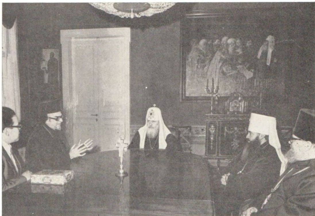
19 февраля 1979 года Святейший Патриарх Московский и всея Руси Пимен принял митрополита Мирского Хризостома (Константинопольская Церковь).