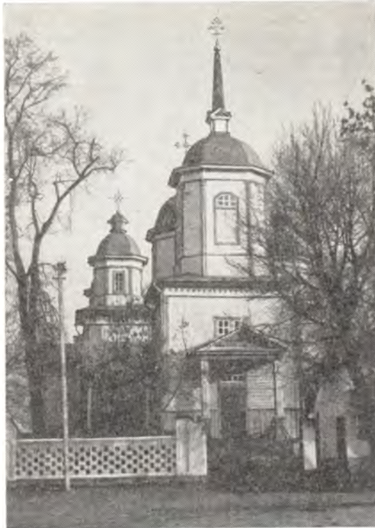
Архистратиго-Михаиловский храм в с. Головеньки Борзнянского района Черниговской области