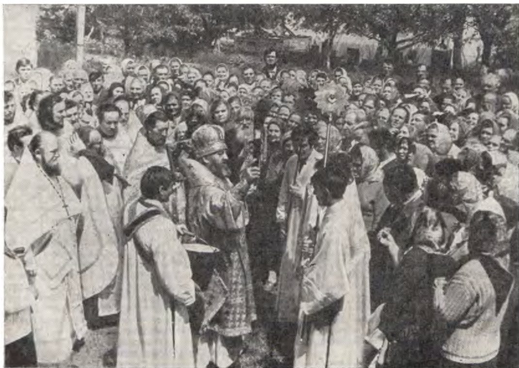
Крестный ход вокруг Свято-Николаевского кафедрального собора в г. Черновцы в день престольного праздника — Перенесения мощей Святителя Николая

После совершения богослужений епископ Варлаам, по обычаю, проповедовал и благословлял богомольцев. В иные воскресные и праздничные дни Преосвященный Варлаам совершал богослужения и проповедовал в кафедральном соборе.