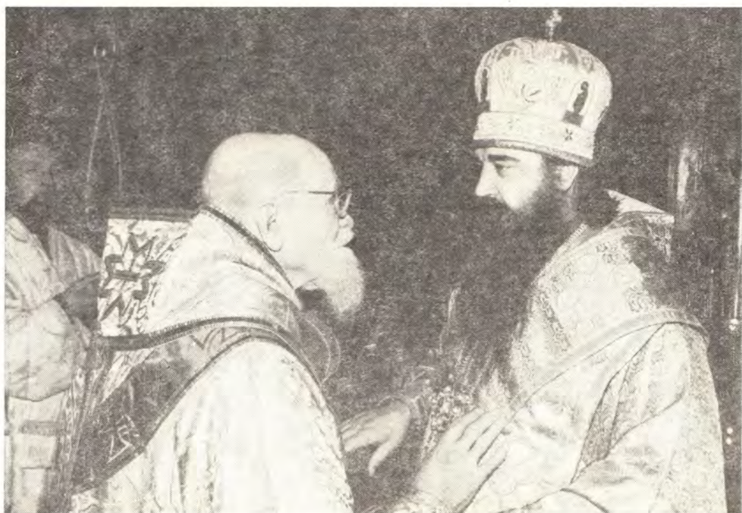
Внизу: митрополит Филарет и митрополит Николай (Ерёмин), бывший Экзарх Патриарха Московского в Западной Европе, по окончании Божественной литургии в Трехсвятительском подворье