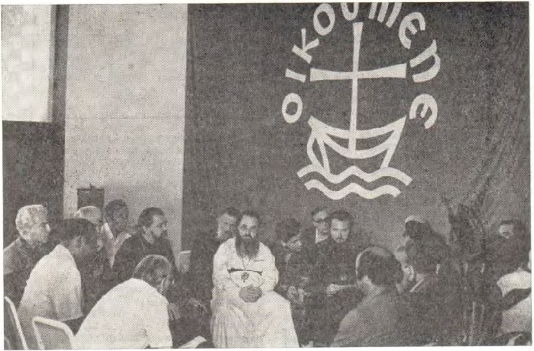
Встреча православных участников сессии ЦК ВСЦ на Ямайке с должностными лицами Всемирного Совета Церквей

— первое заседание в Женеве в январе 1979 года Комитета ООН по разоружению;