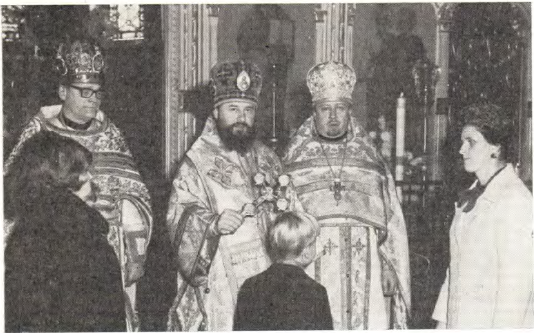
Епископ Серпуховской Ириней преподает молящимся крест после богослужения в день празднования 75-летия Петропавловского храма в г. Пассейнке, США

В тот же день епископ Ириней имел братскую встречу с представителями баптистов и других христианских исповеданий, которые тепло и сердечно приветствовали Владыку. Встречу организовал д-р Клифтон Робинсон, международный директор Всемирного Библейского общества.