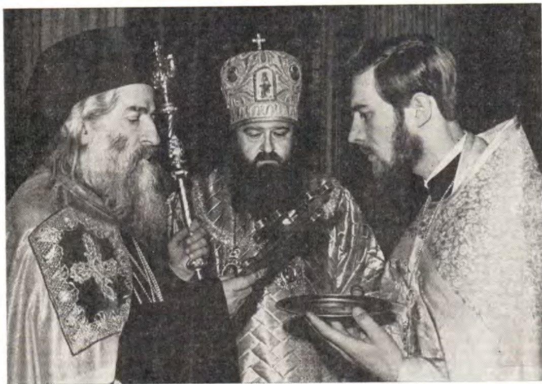
Митрополит Ленинградский и Новгородский Никодим и Блаженнейший Патриарх Святого Града Иерусалима и всей Палестины Венедикт I в Ленинграде в июне 1968 года

По мнению митрополита Никодима, восстановление христианского единства, возвращение к нормам духовной жизни первохристианского братства, образ которого начертан на страницах книги Деяний святых апостолов, есть процесс длительного врачевания и благодатного обновления. Плотской мудрости и обычных усилий ума и воли недостаточно для успешного достижения этой высокой цели. Однако, будучи оптимистом в экуменическом делании, митрополит Никодим говорил: «Невозможное у че-