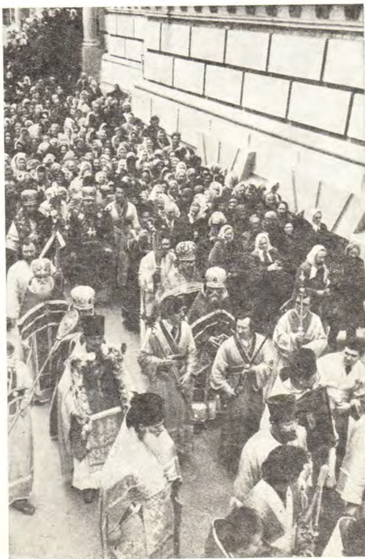
Архиепископ Харьковский и Богодуховский Никодим и архиепископ Черниговский и Нежинский Антоний во время крестного хода вокруг Благовещенского кафедрального собора в г. Харькове