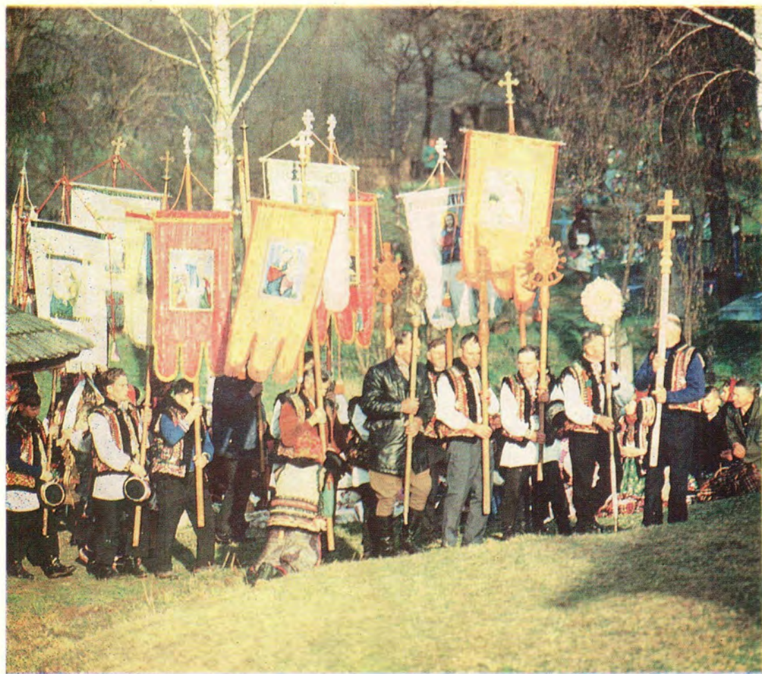
Пасха Христова на Ивано-Франковщине, Косовский район. Вверху: пасхальный крестный ход в приходе села Криворивня; внизу: перед освящением пасхальных куличей и краше-ных яиц в приходе села Яворив