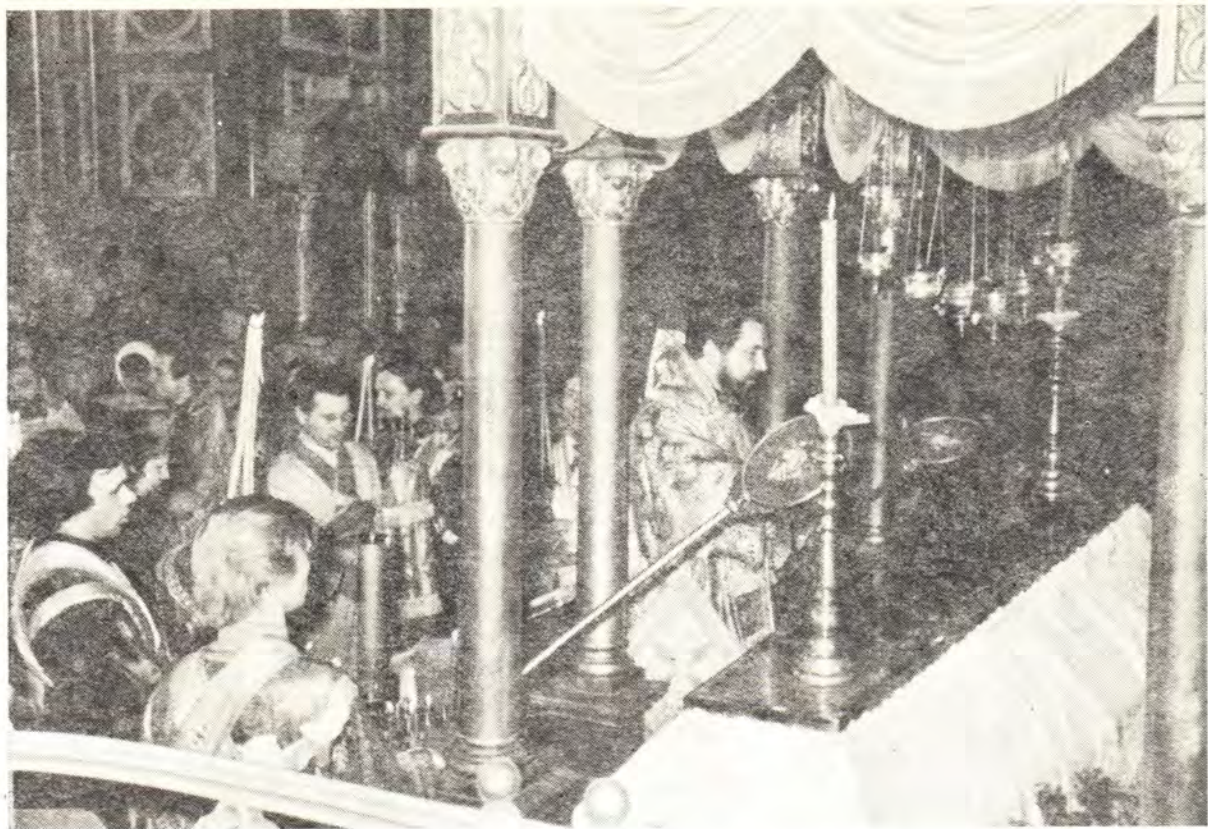
Архиепископ Харьковский и Богодуховский Никодим у гробницы свяителя Харьковского Мелетия в Благовещенском кафедральном соборе в г. Харькове.