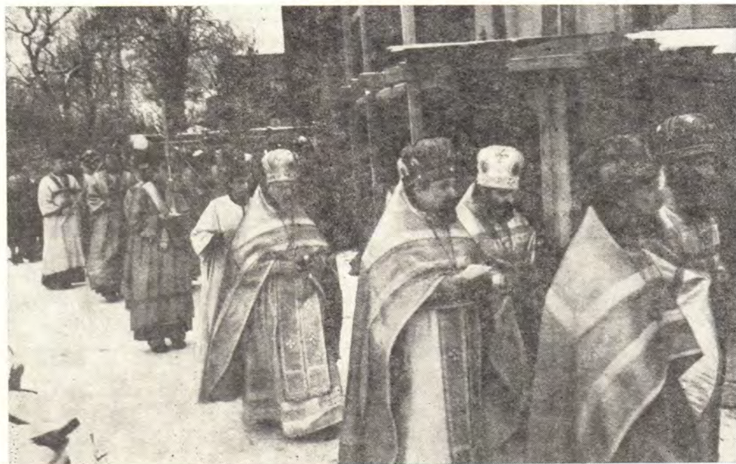
Торжественное перенесение святых мощей из Филипповского храма в новоосвященный Никольский храм