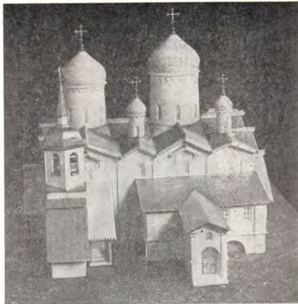
Храм во имя апостола Филиппа (справа) и сопредельный ему храм во имя Святителя Николая в Новгороде (макет, реконструкция)

С того времени Никольский храм стал теплым. Полаты в Никольском храме были устро-