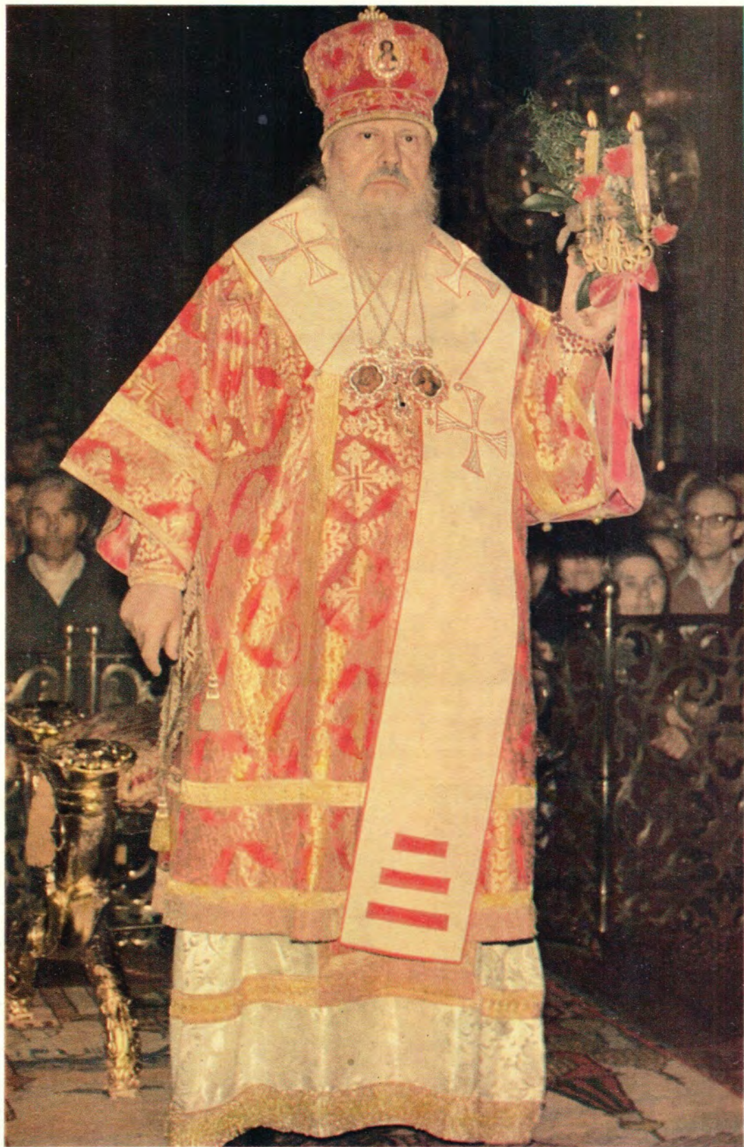
Святейший Патриарх ПИМЕН во время пасхального богослужения в Богоявленском патриаршем соборе в Москве