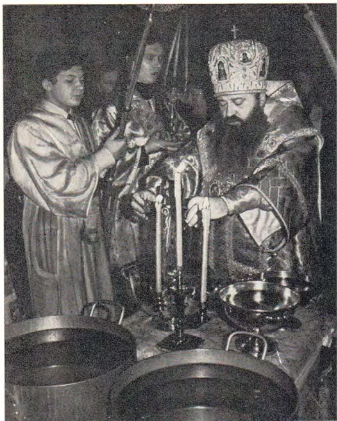
Митрополит Ленинградский и Новгородский Никодим совершает великое освящение воды в праздник Богоявления