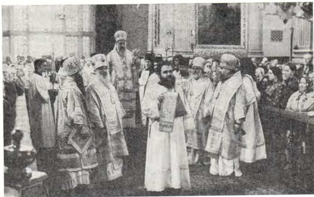
Блаженнейший Архиепископ Кипрский Хризостом с иерархами и клириками Русской и Кипрской Церквей за богослужением в Успенском кафедральном соборе в г. Смоленске