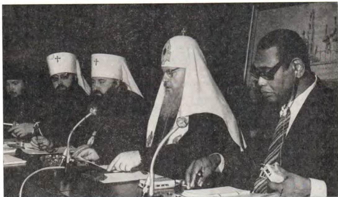
Во время визита Святейшего Патриарха Пимена во Всемирный Совет Церквей на общественной встрече 17 сентября 1973 года. Справа налево: д-р Филип Поттер, генеральный секретарь ВСЦ, Святейший Патриарх Пимен, митрополит Ленинградский и Новгородский Никодим, митрополит Тульский и Белевский Ювеналий, архимандрит Кирилл, представитель Русской Православной Церкви при ВСЦ в Женеве

Вполне естественно, что ближайшая, непосредственная задача христианина-мироотворца заключается в восполнении проповеди мира личным деятельным служением ближнему. Однако христианин не должен вопрошать: «Кто мой ближний?», а иметь искреннюю любовь ко всем людям, независимо от их взглядов и убеждений, и если он видит, что «оковы неправды» (Ис. 58, 6) столь крепки, что индивидуальное служение нуждам ближнего становится каплей в море человеческих страданий, то дух евангельских призывов и наставлений властно требует от мироотворцев их усилий в солидарном служении миру и справедливости. Миру на Земле, справедливому для всех народов, противостоят настойчивые действия тех, кто в своих интересах хотел бы сохранить несправедливые