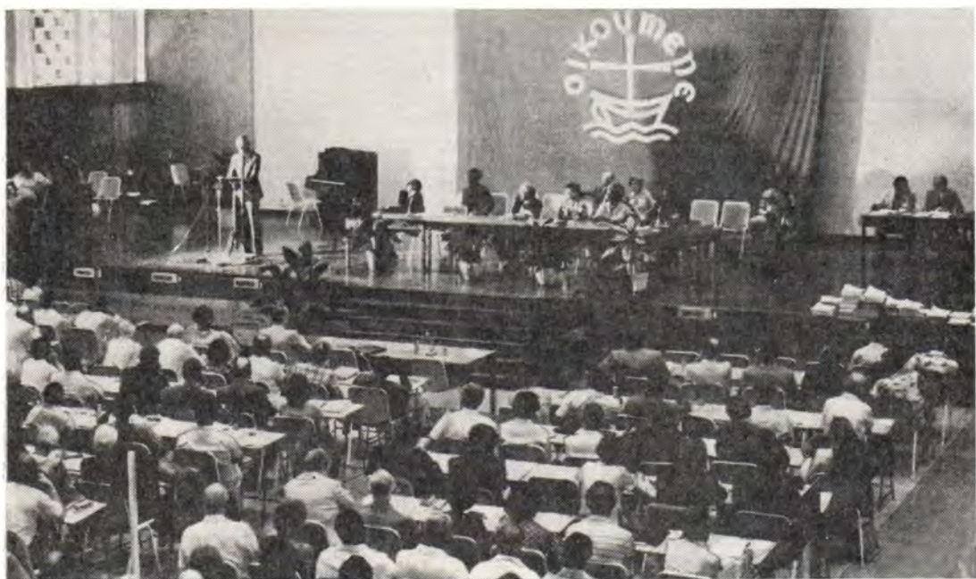
В зале заседания

ям, и строительству больших баз ядерных подводных лодок США в Микронезии.