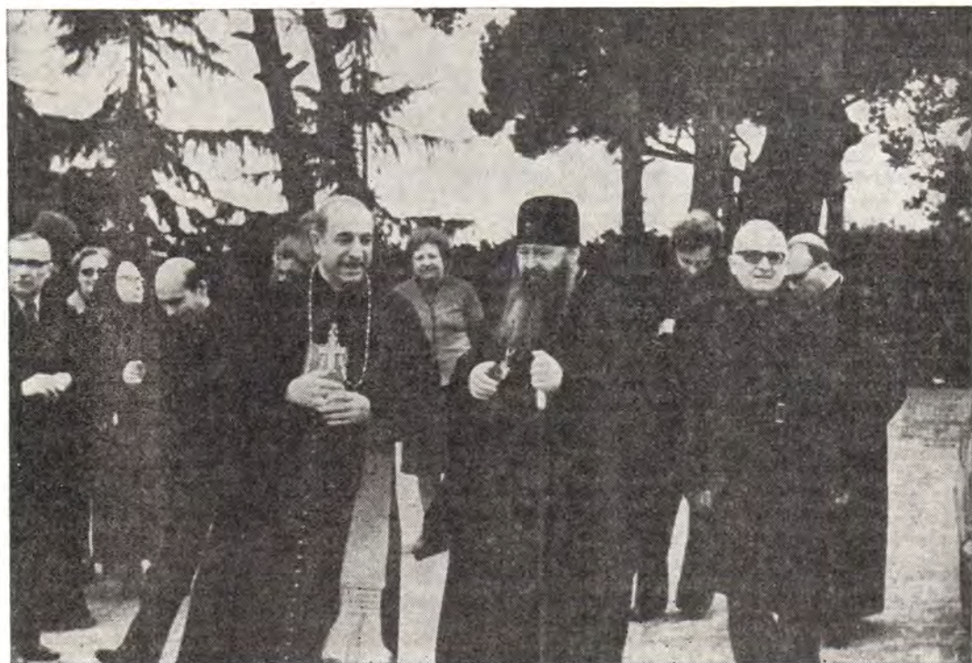
Митрополит Ленинградский и Новгородский Никодим и архиепископ Неаполя кардинал Корrado Урси во время посещения Неаполя митрополитом Никодимом в ноябре 1977 года

О чем же еще сказать сейчас? Пусть молчат уста, ибо устами не выразить в переживаемые ныне минуты всего величия этого человека. Можно лишь только в сердце своем вознести пламенную молитву к Начальнику жизни и смерти об упокоении нашего отца и великого иерарха. И просить смиренно Господа, чтобы Он соделал его, Своего верного и ревностного служителя, молитвенником и предстателем за всех тех, кто служит Русской нашей Церкви, величию и славе преблагословенного имени Господа нашего Иисуса Христа. Аминь.