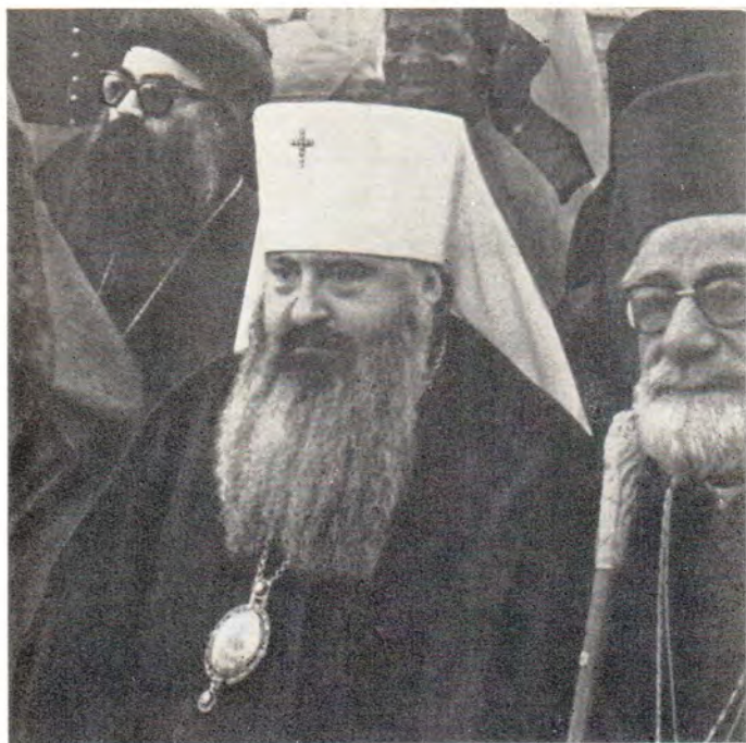
Митрополит Ленинградский и Новгородский Никодим в Ватикане среди делегаций на торжественной мессе по случаю начала понтификата Папы Иоанна Павла I (последний прижизненный портрет)