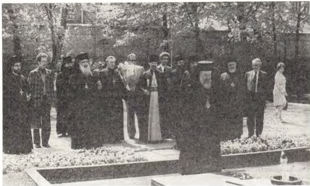
Блаженнейший Архиепископ Кипрский Хризостом у памятника героям Великой Отечественной войны 1941—1945 гг. в Смоленске

Перед отъездом из Смоленска и Преосвященный Марк, и Преосвященный Петр оставили записи в книге почетных посетителей собора. Они выражали большую радость от посещения богослужения в соборе Успения Пресвятой Богородицы, а также благодарили Владыку Феодосия за теплый прием.