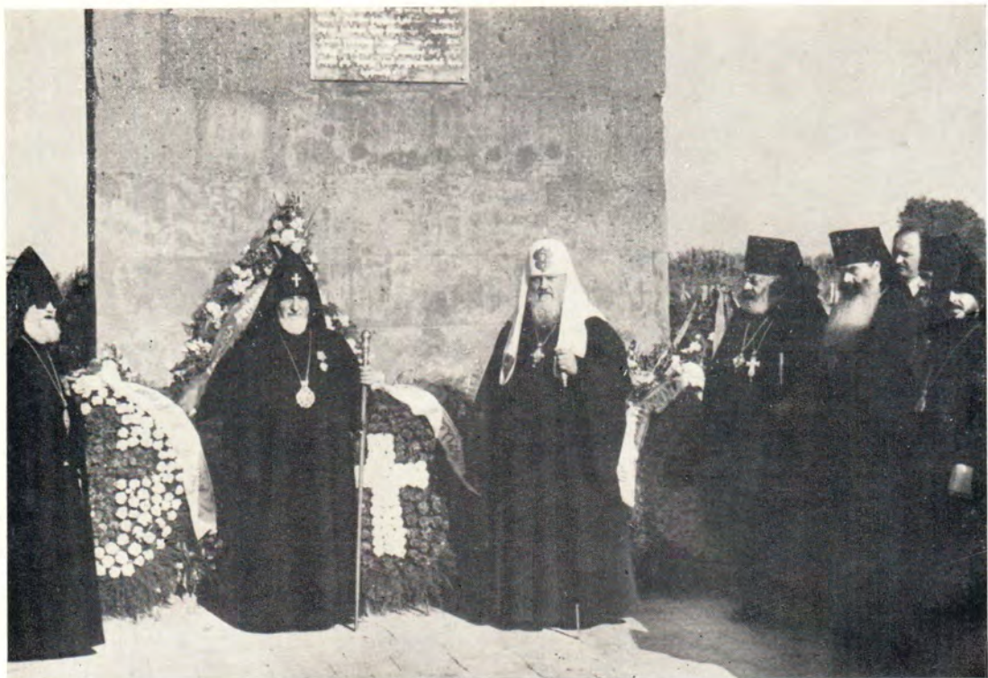
Святейший Патриарх Пимен и Святейший Патриарх-Католикос Вазген I после возложения венков к памятнику русским воинам на Ошаканском поле. Внизу: Святейший Патриарх Пимен и Святейший Патриарх-Католикос Вазген I в президиуме торжественного заседания 2 октября 1978 года