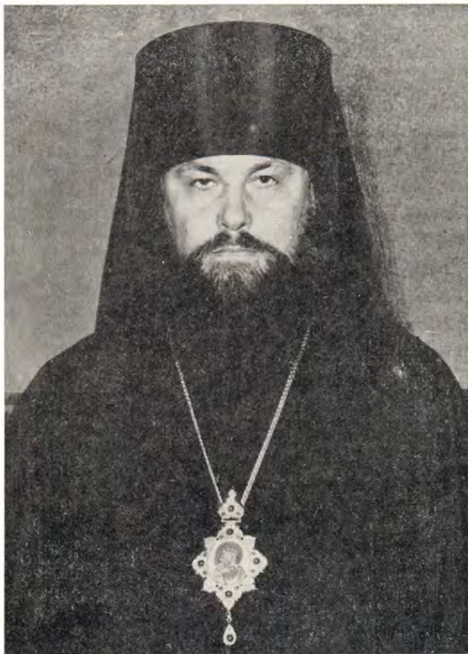
Преосвященный СЕРАФИМ, епископ Пензенский и Саранский

С глубоким смирением и смущением я воспринял решение Вашего Святей-