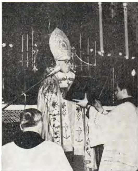
Епископ Юлиан Вайводс читает молитву в алтаре Рижского кафедрального собора

Архиепископ Леонид вручил юбиляру также подарок — чеканный образ Спасителя «Се, стою у двери и стучу» (Откр. 3, 20).