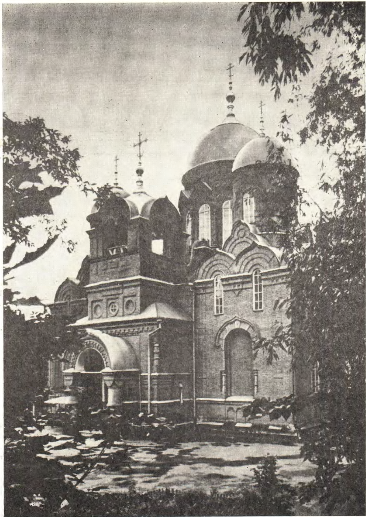
Успенский кафедральный собор в г. Пензе