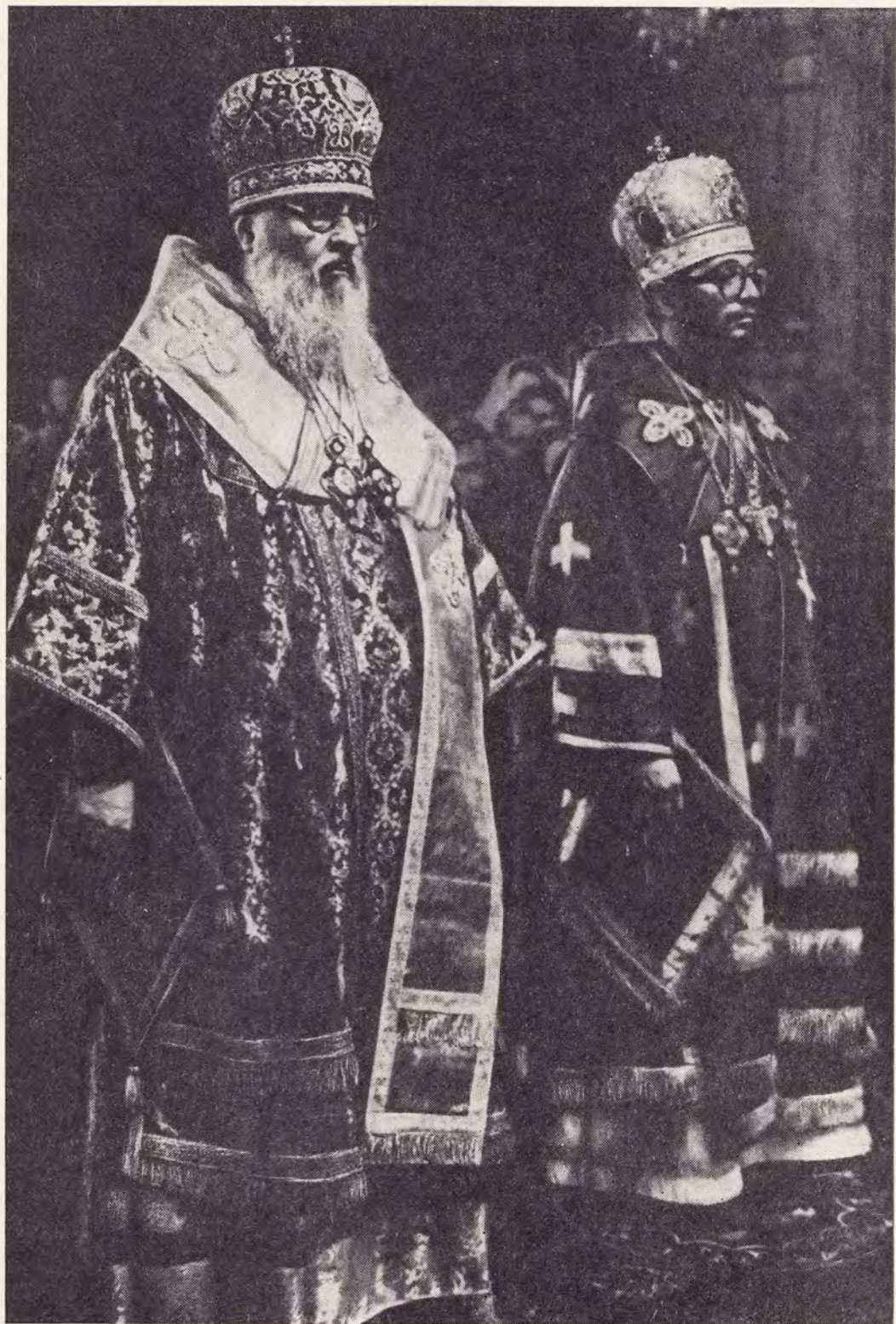
Воскресенье 8 октября 1978 года — день памяти Преподобного Сергия Радонежского. Святейший Патриарх Пимен и Блаженнейший Митрополит Феодосий, Предстоятель Автокефальной Православной Церкви в Америке, за Божественной литургией в Троицком соборе Троице-Сергиевой Лавры