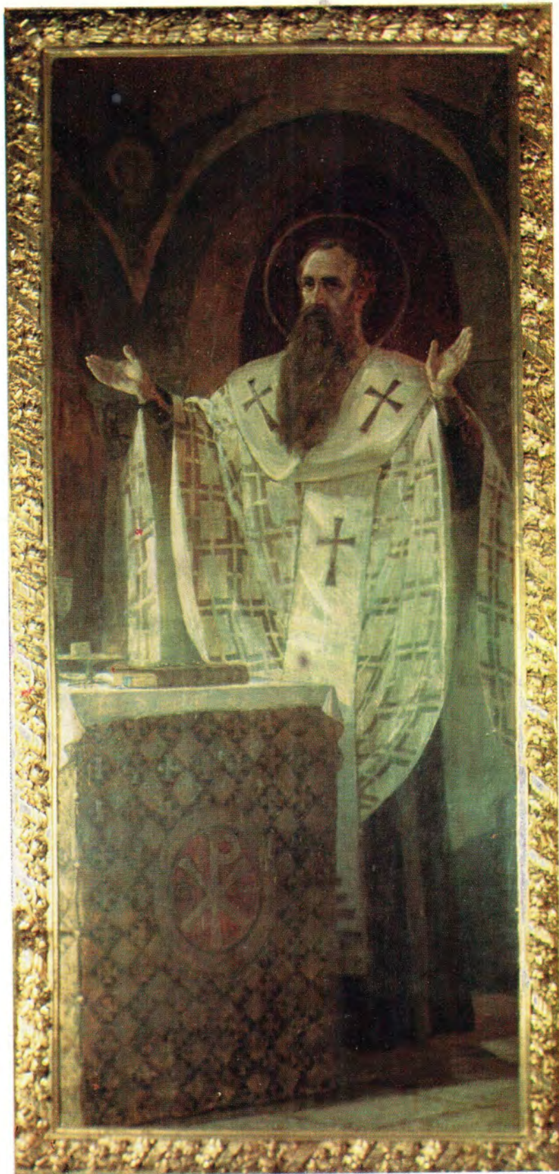
СВЯТИТЕЛЬ ВАСИЛИЙ ВЕЛИКИЙ, АРХИЕПИСКОП КЕСАРИЙСКИЙ

Из алтарных росписей Богоявленского Патриаршего собора