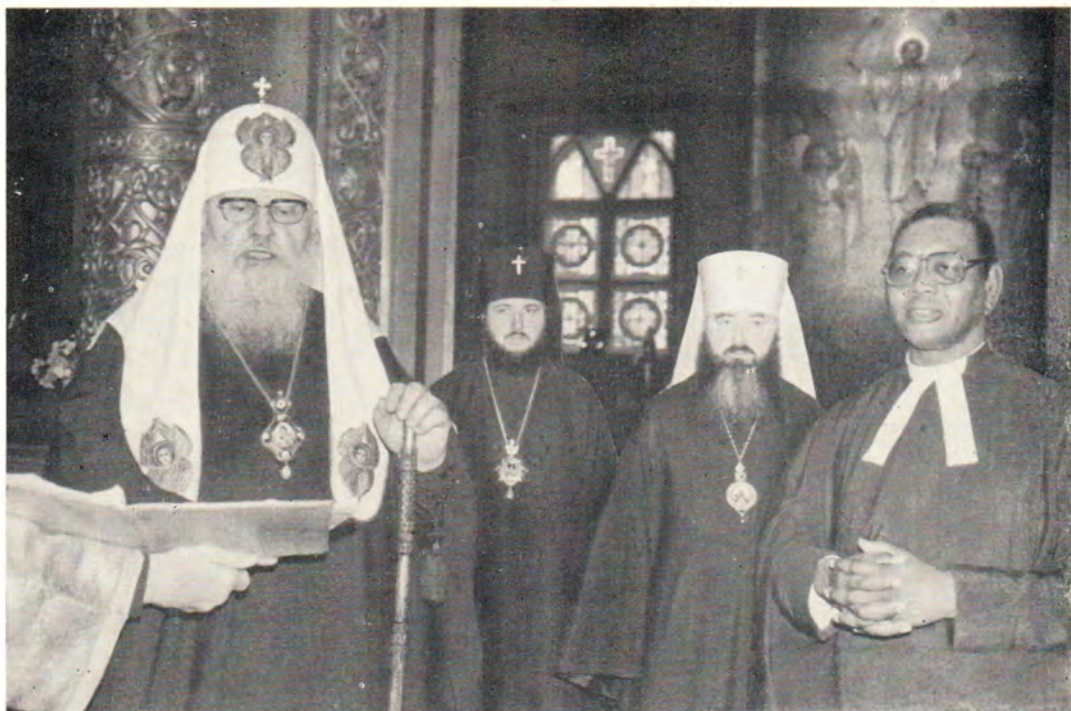
Святейший Патриарх Пимен обращается с приветственным словом к генеральному секретарю ВСЦ д-ру Филипу Поттеру в Богоявленском соборе в Москве 15 октября 1978 года. К стр. 60