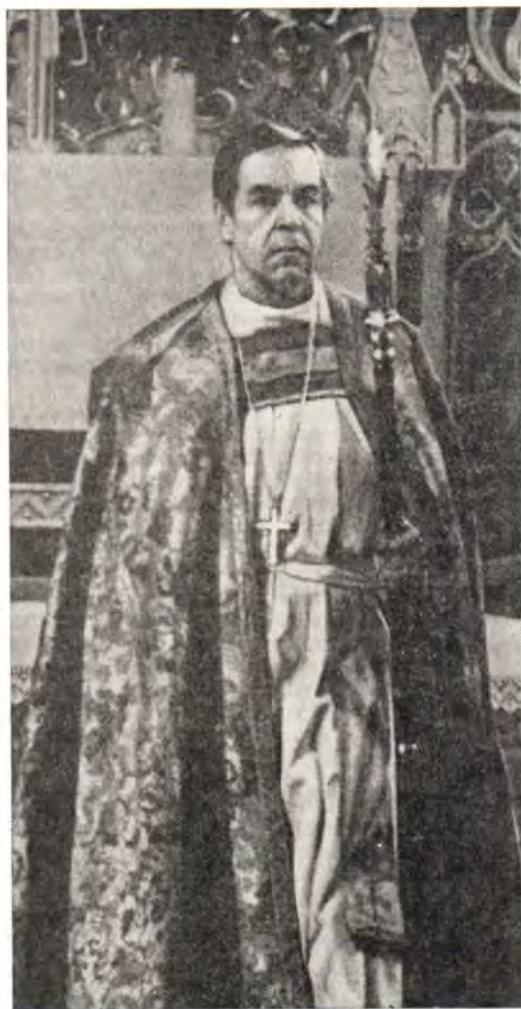
Архиепископ д-р Микко Юва

ра финской истории в университете Турку, с 1957 по 1962 год — ординарный профессор этого университета. В 1962 году он становится профессором Хельсинкского университета по кафедре церковной истории Скандинавии и Финляндии. С 1971 года — ректор того же университета, а с 1973 года до назначения на должность Архиепископа — канцлер Хельсинкского университета.