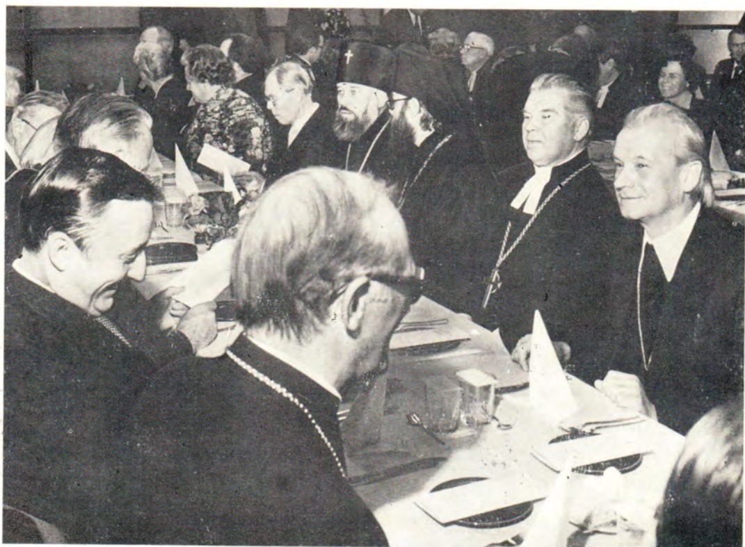
На праздничном приеме в честь Архиепископа д-ра Микко Юва. Во втором ряду в центре — архиепископ Дмитровский Владимир, ректор МДА, справа от него — игумен Лонгин, Архиепископ Янис Матулис и епископ Золдан Калди.