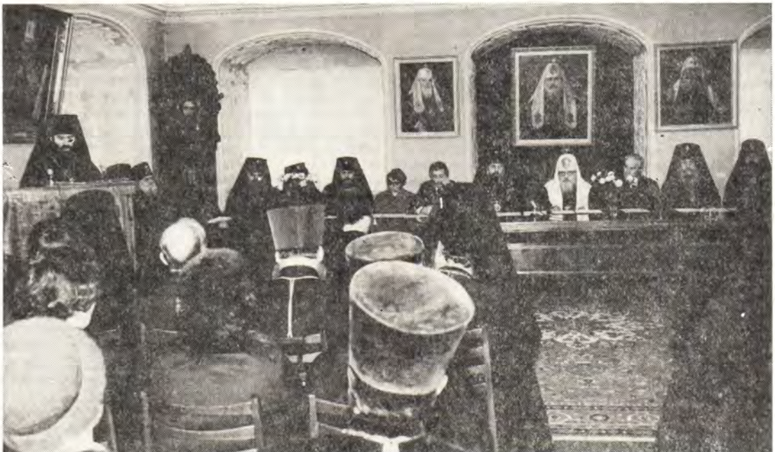
14 октября 1978 года на торжественном акте в Актовом зале Московских духовных академии и семинарии

В Актовом зале собрались Преосвященные архиереи, учащие и учащиеся Московских духовных школ, представители духовных учебных заведений Ленинграда и Одессы, другие гости. При пении тропаря празднику в зал вошел Святейший Патриарх Пимен. Его Святейшество открыл торжественное собрание.