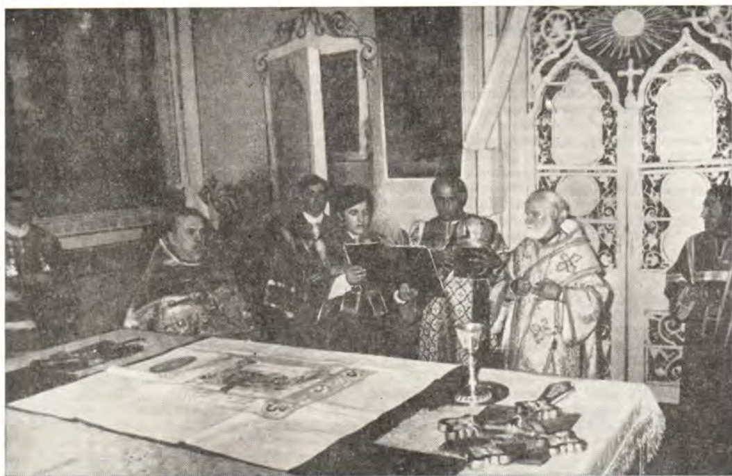
Корецкий женский монастырь. Архиепископ Волынский и Ровенский Дамиан совершает освящение антиминса

был препровожден «со славой» в заполненный верующим народом храм, где его встречало духовенство. Архиепископу Дамиану сослужили монастырские и прибывшие из многих приходов клирики. Проповедовал протоиерей Ярослав Антонюк. После литургии был совершен крестный ход вокруг храма.