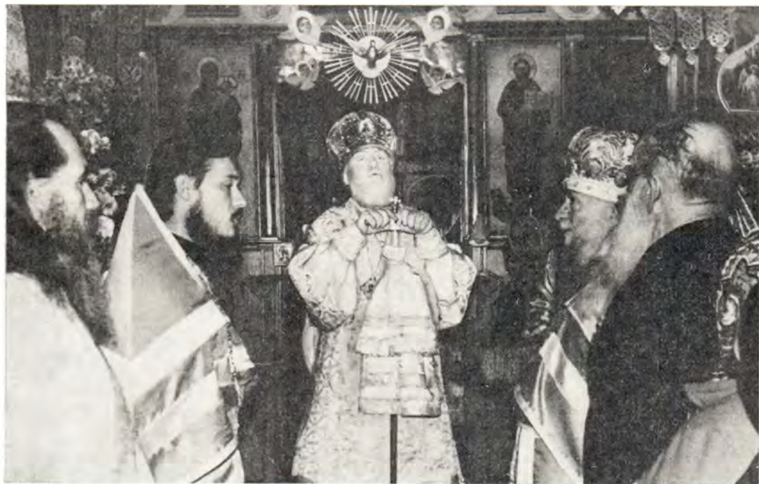
Епископ Алма-Атинский и Казахстанский Серафим произносит проповедь в храме в честь Покрова Пресвятой Богородицы в г. Джамбуле