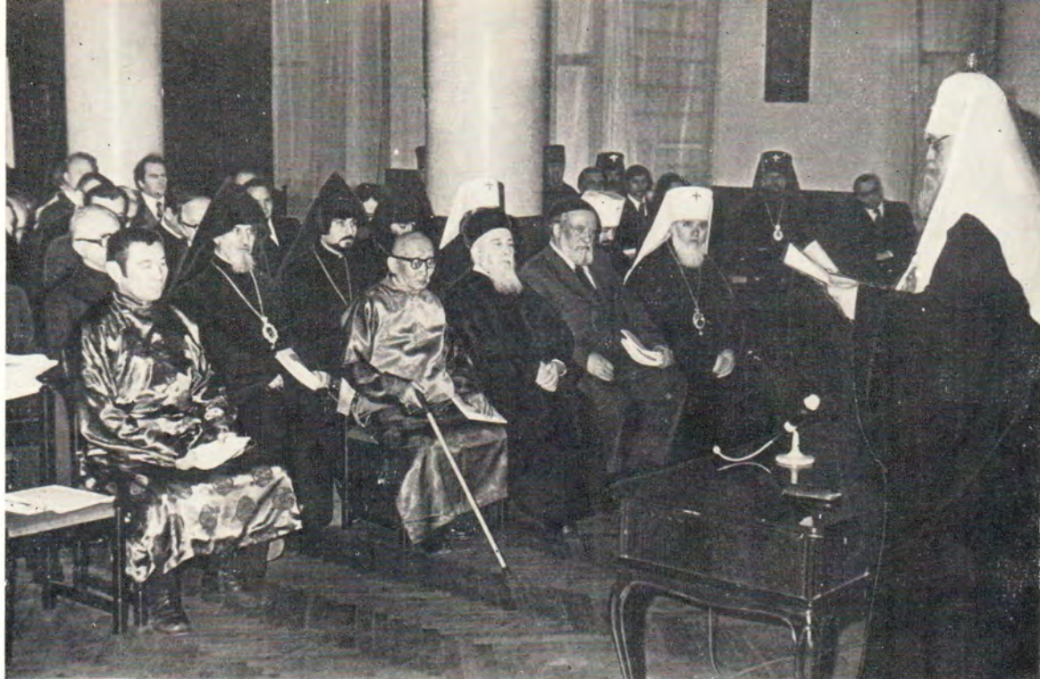
14—16 ноября 1978 года в Москве проходила Всесоюзная религиозная конференция по итогам V Всехристианского Мирного Конгресса [22—27 июня 1978 года, Прага]. Вверху: Святейший Патриарх Московский и всея Руси Пимен открывает конференцию. Внизу: в зале заседаний и встречи в перерывах между заседаниями