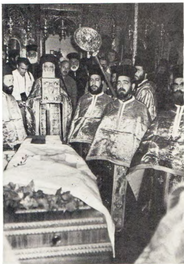
Слева: вход в крипту, где находится гробница Архиепископа Макария. Справа: заупокойная лития в храме Киккского монастыря. Внизу: иерархи и другие члены церковных делегаций после погребения Архиепископа Макария на вершине горы.