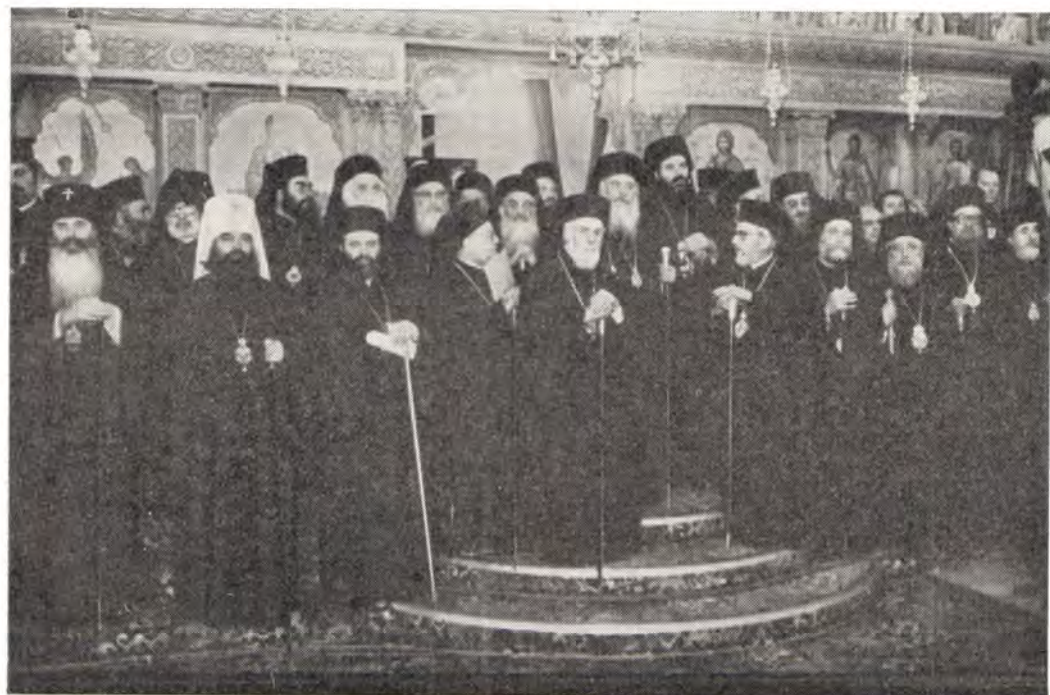
Церковные делегации в храме Благовещения на погребении Архиепископа Макария. В первом ряду слева — митрополит Берлинский Филарет и архиепископ Волоколамский Питирим

Около трех часов кортеж автомашин достиг Киккского монастыря. Гроб с телом Архиепископа внесли через святые ворота в монастырскую церковь, где Местоблюститель и духовенство монастыря вновь совершили Трисагион. Затем процессия направилась на вершину горы, в 5 километрах от монастыря, это — высшая