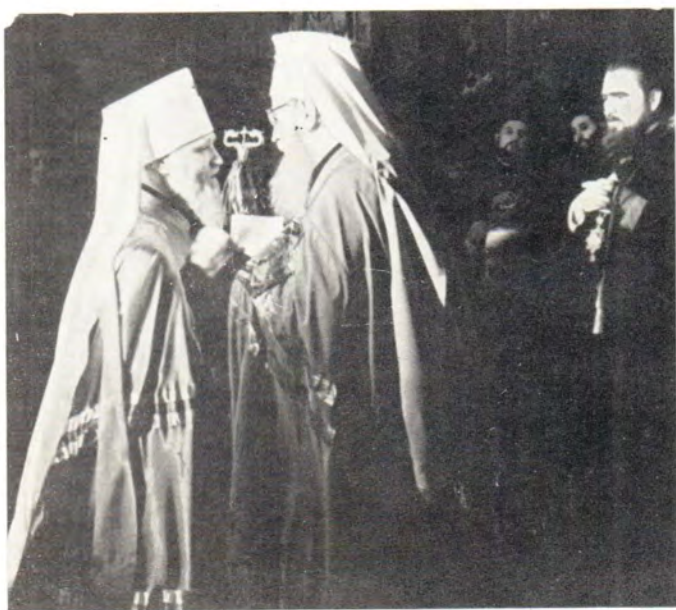
Глава делегации Русской Православной Церкви митрополит Киевский и Галицкий Филарет приветствует нового Предстоятеля Румынской Православной Церкви Блаженнейшего Иустина