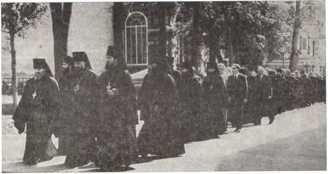
Торжественное шествие учащихся и учащихся Московских духовных школ 1 сентября 1977 года

ской деятельности в новом учебном году. Патриарх Пимен».