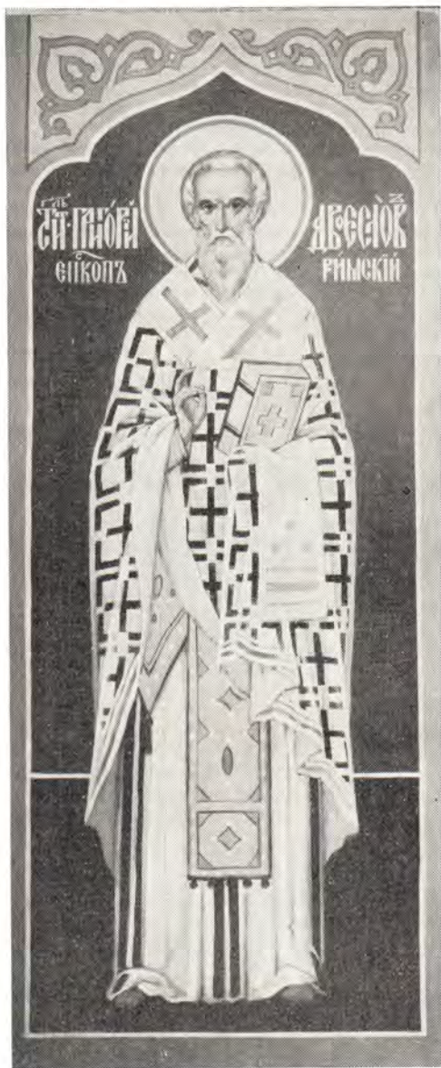
Святитель Григорий Двоеслов, епископ Римский († 12 марта 604 г.)

Продолжение. Начало см. в «ЖМП», 1977, № 9, 10. Печатается по: «Руководство для сельских пастырей», 1871, т. 1, № 6, с. 183—192.