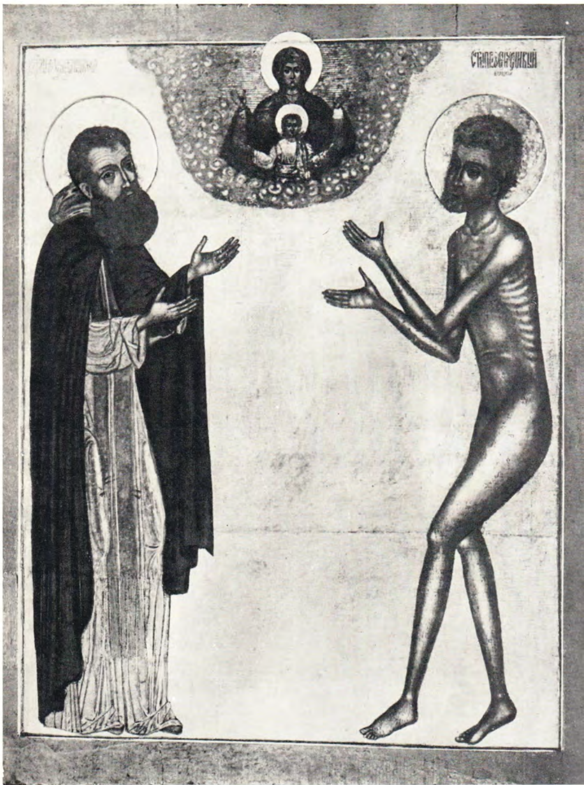
Икона преподобного Трифона, архимандрита Вятского, и блаженного Прокопия Вятского, предстоящих пред иконой Божией Матери Знамение