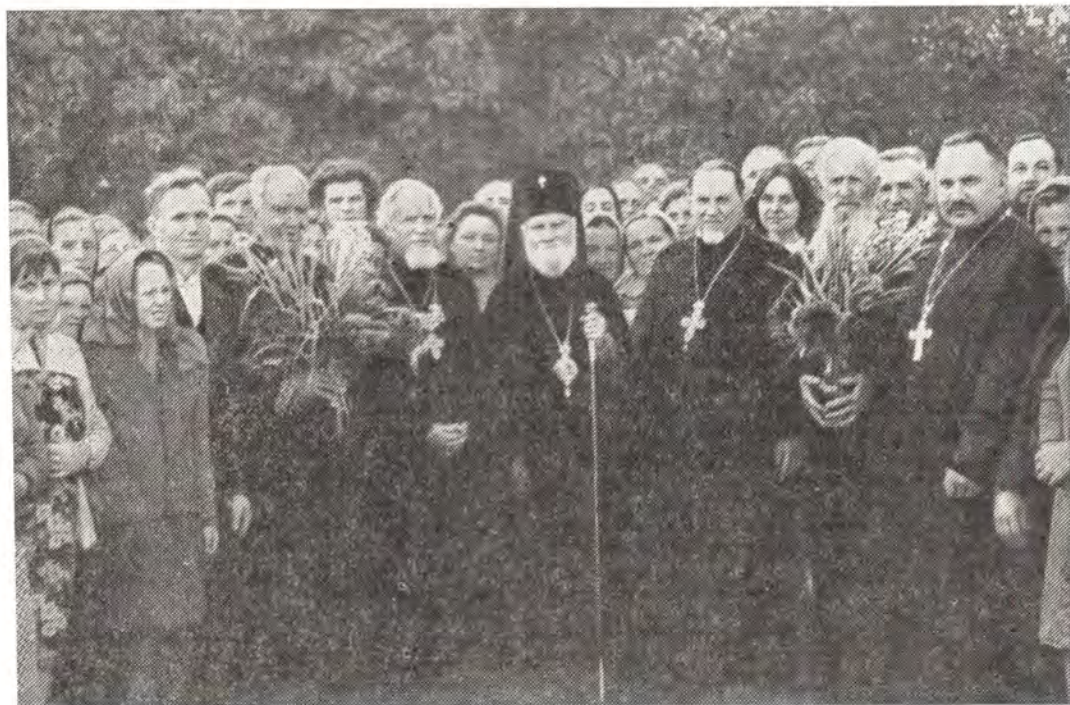
Архиепископ Волынский и Ровенский Дамиан с клириками и мирянами после посещения Покровского прихода в г. Сарны.

О земной жизни Господа Иисуса Христа, Его Пречистой Матери и пророка Божия из Фесвы знает «издетска» каждый христианин. Их высочайший земной подвиг — благой пример, начало и основание монашеского образа жизни, заключающего в себе ненарушимые обеты послушания, молитвы, поста, любви к Богу и ближнему, обет самоотверженного служения своему народу и Отечеству. Земное житие Господа Иисуса Христа было выше ангельского; Божия Мать «ангельски пожила на земле»; «человек Божий» пророк Илия Фесвитянин был «ангелом во плоти». Принимающий же иноческие обеты облачается в «ангельский образ» и, отвергая плотской образ жизни,