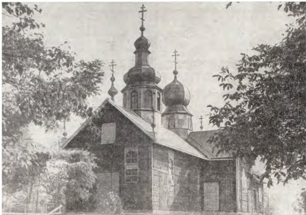
Вознесенский храм с юго-западной стороны

над западным входом в храм. С востока, севера, запада и юга храм увенчан также четырьмя небольшими главками с крестами. С южной стороны алтаря — пономарка, с северной — ризница. Храм по-монашески прост, не имеет привычных архитектурных украшений (но это, впрочем, в большой мере характерно для большинства деревянных храмов Закарпатья, в том числе и для памятников архитектуры). И тем не менее силуэт его четок, а после ремонта приобрел некоторую выразительность благодаря обновленным куполам и венчающим их православным восьмиконечным крестам.