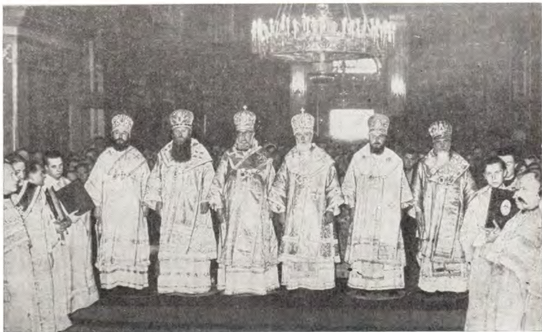
Почаевская Лавра. Митрополит Киевский и Галицкий Филарет и Преосвященные архиереи за Божественной литургией в Успенском соборе 5 августа 1977 года

Первым получил исцеление от этой иконы родной брат Гойской — Филипп Козинский, прозревший после природной слепоты. Анна Гойская созвала иноков и священников, кото-