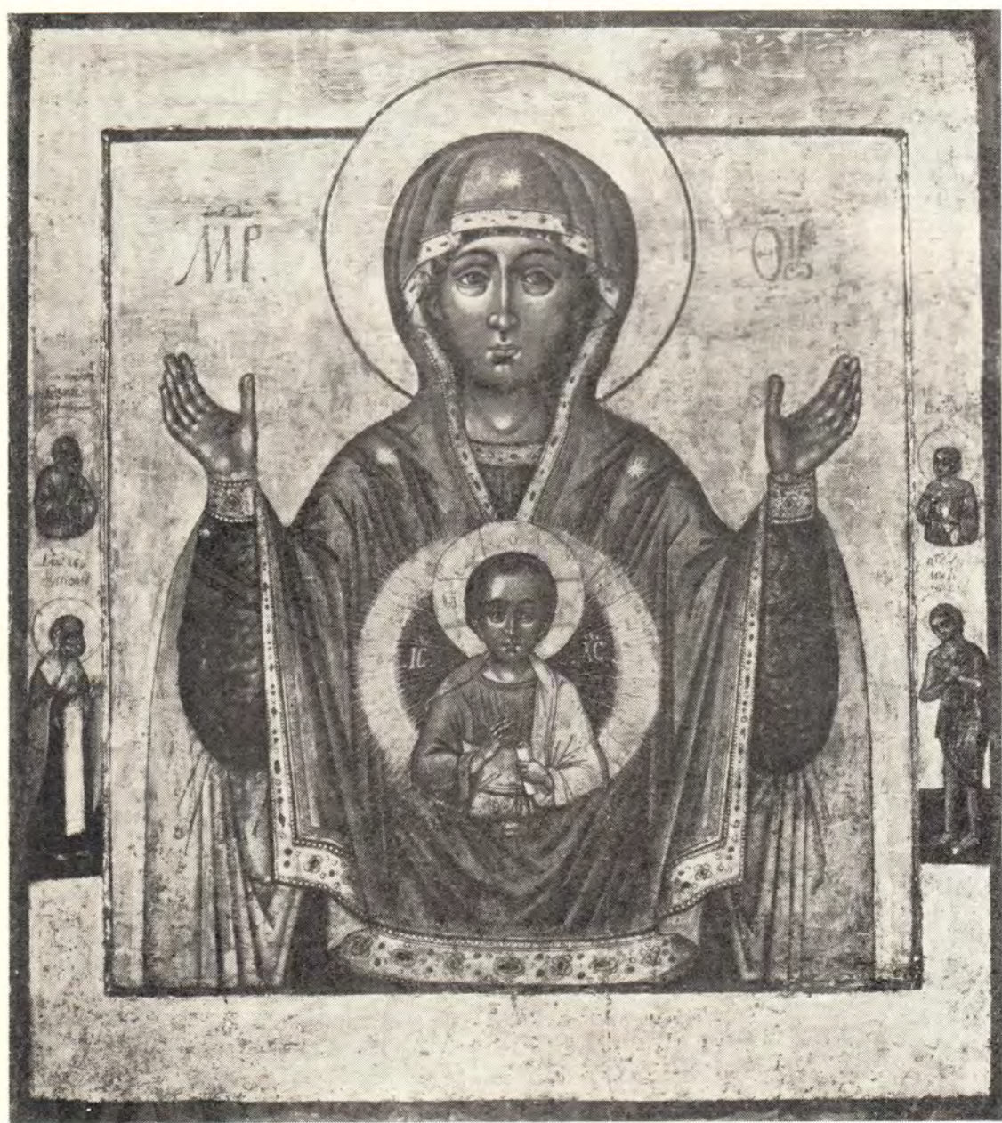
Абалацкая икона Божией Матери с предстоящими святыми: праведным Симоном Верхотурским, Святителем Николаем Мирликийским, праведным Василием Мангазейским и преподобной Марией Египетской (из храма Воскресения Слоущего, что на Успенском Вражке в Москве)