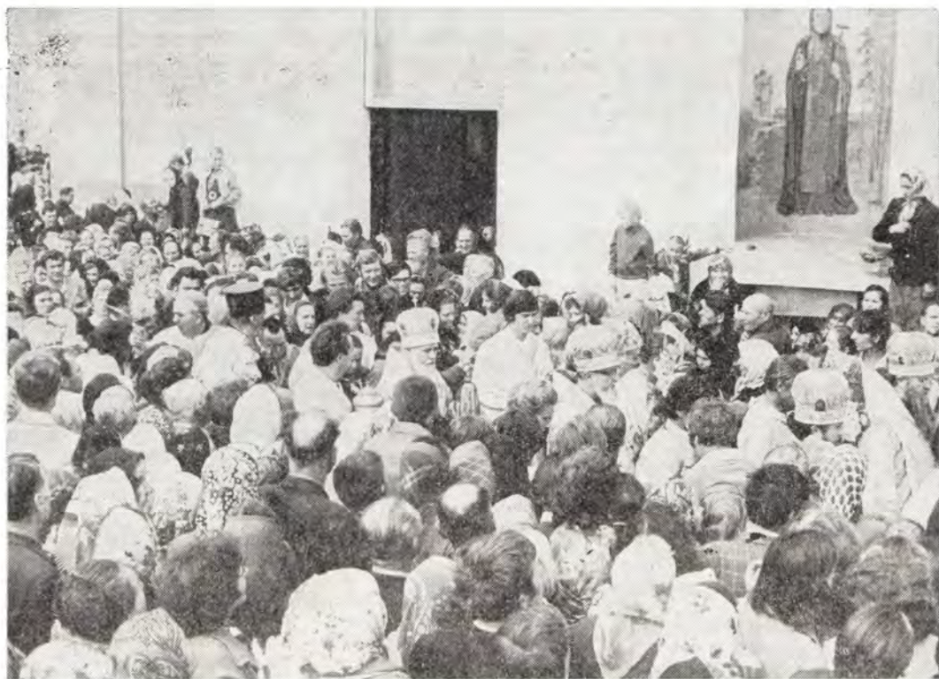
Почаевская Лавра. Крестный ход вокруг Успенского собора в день празднования Почаевской иконе Божией Матери 5 августа 1977 года

рые по совершении торжественного богослужения крестным ходом перенесли икону на Почаевскую гору, и «там в пещере обитающим инокам отдала оную на вечное хранение». Впоследствии эта икона прославилась многими знаменами, о которых говорится в книге «Гора Почаевская».