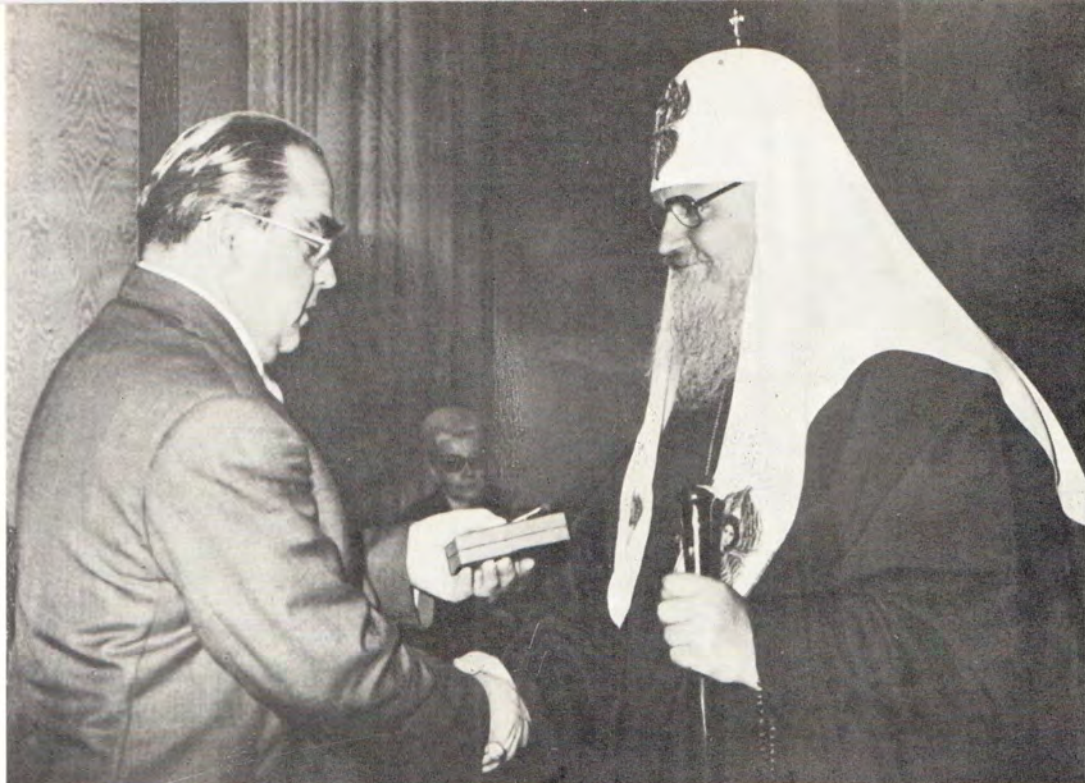
31 августа 1977 года в Кремле заместитель Председателя Президиума Верховного Совета СССР Махмадула Холов вручил орден Трудового Красного Знамени Святейшему Патриарху Московскому и всея Руси Пимену. Внизу: Святейший Патриарх Пимен в день награждения орденом Трудового Красного Знамени