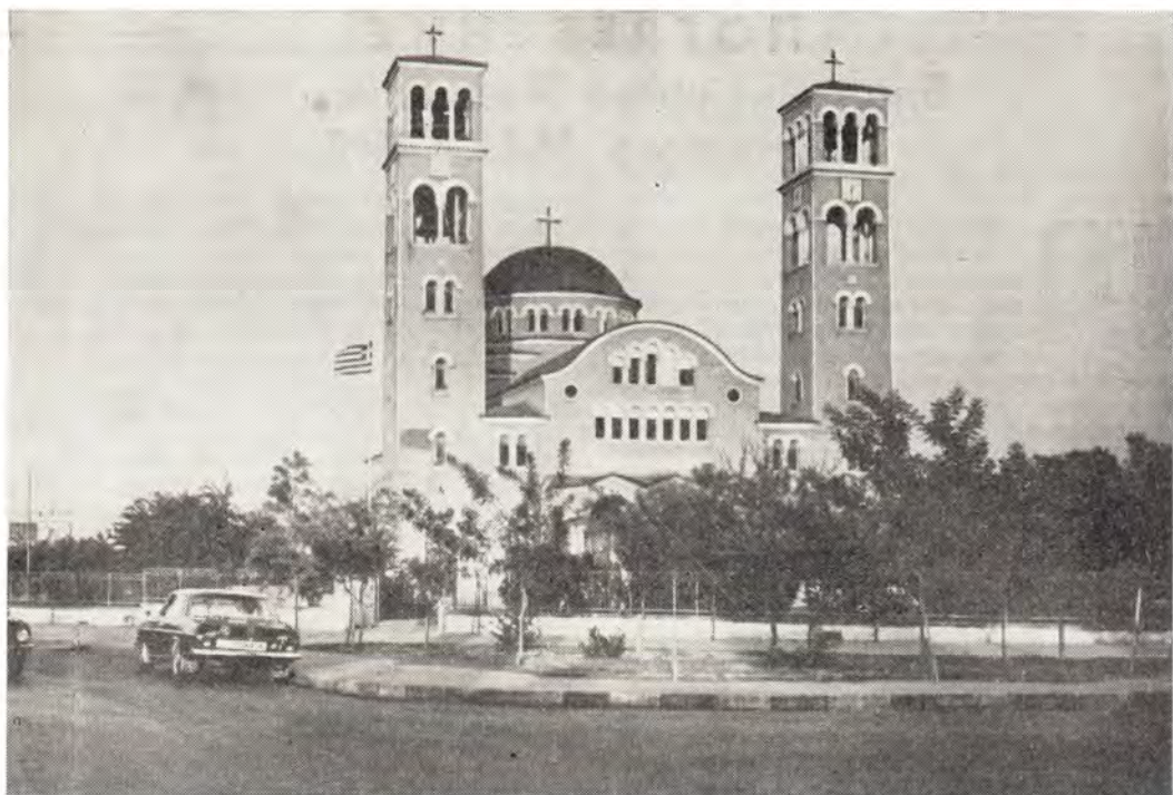
Храм Благовещения в Никозии

тое). После этого мы нанесли краткий визит Местоблюстителю Архиепископского престола Митрополиту Пафскому Хризостому в резиденции Архиепископа, чтобы выразить сочувствие постигшему Кипрскую Церковь горю от лица Святейшего Патриарха Пимена, иерархов и всей Полноты Русской Православной Церкви.