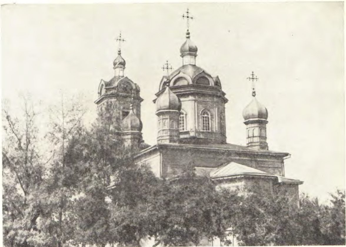
Храм во имя Святителя Николая Чудотворца в с. Оськино Куйбышевской епархии Внизу: богослужение в этом храме