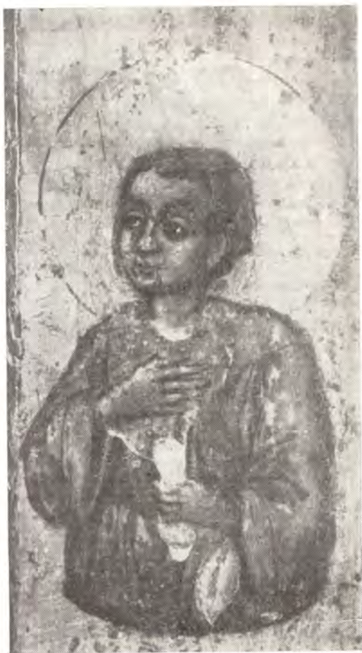
Святой праведный Василий Мангазейский. Фрагмент Абалацкой иконы Божией Матери (см. 2-ю страницу обложки)

тыя и Живоначалныя Троицы на усть Нижней Тунгуски по своему обещанию. А приедучи сказал тоя же обители Святыя и Живоначалныя Троицы архимандриту Гавриилу еже о Христе з братею: (л. 75) «Жил де я Иоанн в Ыркуцком городе семь годов, а ходил в те годы по сторонным рекам для соболиного промыслу. А в прошлом де во 199-м году [1691], августа в 4 числе во страдное время посещением Божиим, а моих ради грехов, нападе на мя внезапно страх велик. И в то время аз многогрешный Иоанн, от того великого страха лежа на земли велми изнемог и в беспамятство прииде; ни Молитвы Иисусовы сотворити, ни рукою своего лица своего (л. 75 об.) прекрестити возмог, мя себе во уме что всем телом моим одряхлел. И лежащу ми на земли и не помнящу, как на землю паде, и найде на мя сон. И во сновидении виде над собою близ мене стояща святаго великомученика Василиа. И не ведущу