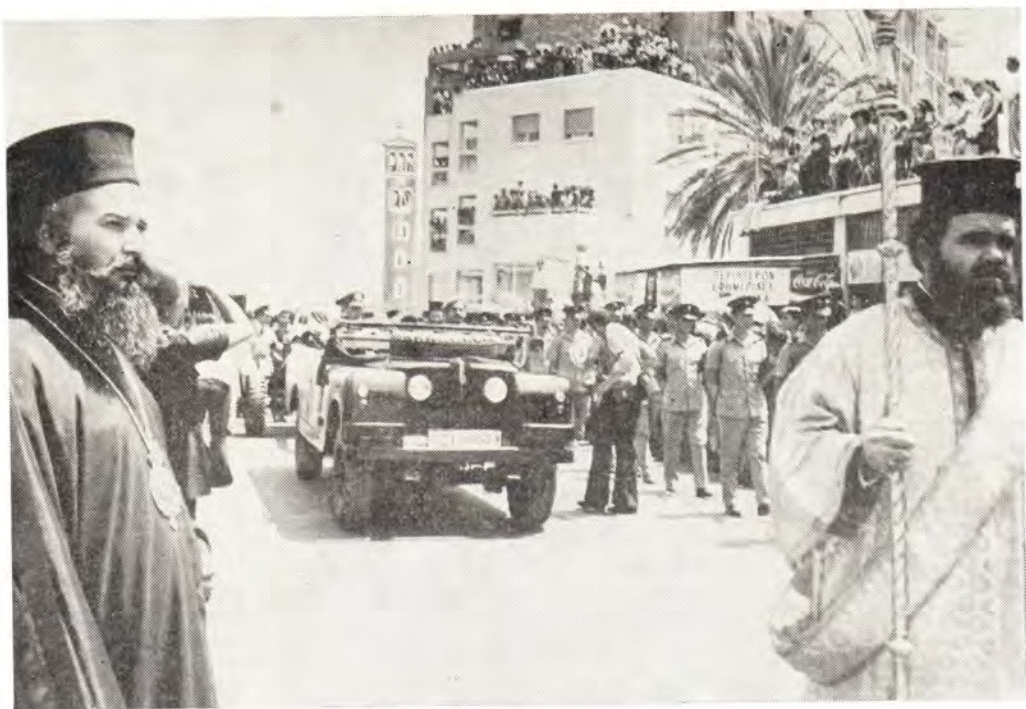
Траурный кортеж в Никозии

точка горного хребта Троодос. Такова была воля Архиепископа. Он говорил: «Я хочу, чтобы меня положили там, откуда я смог бы видеть весь Кипр...» И действительно, в ясную погоду с вершины Троодос можно видеть дальние берега острова.