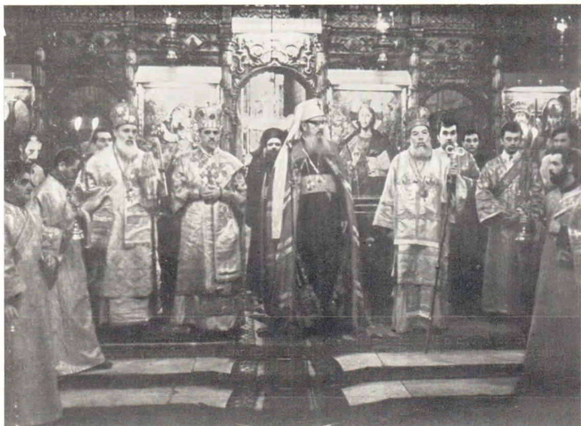
19 июня 1977 года, Бухарест. На торжествах интронизации Блаженнейшего Патриарха Румынского Иустина