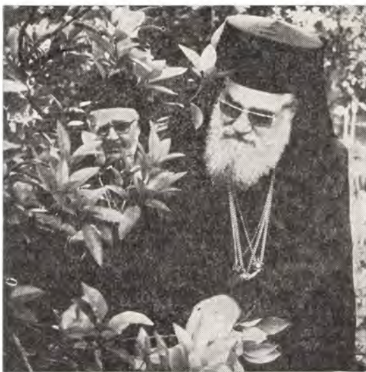
Сочи, 30 июня 1977 года. Папа и Патриарх Николай VI делают прививку на дереве Дружбы