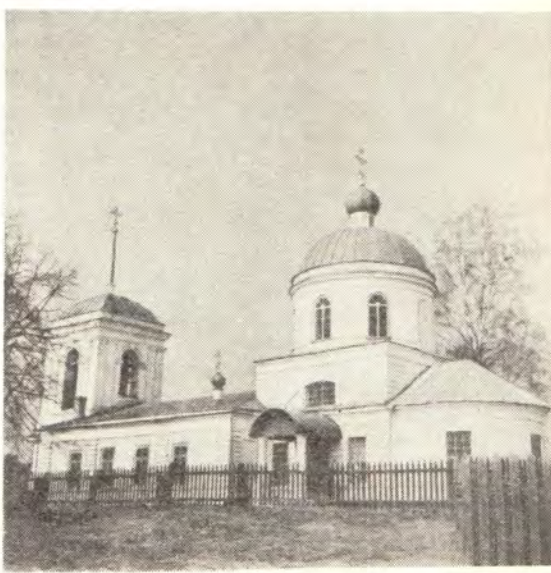
Храмы Казанской епархии (Марийская АССР, Горно-Марийский район). Верхний ряд: храм в честь Владимирской иконы Божией Матери в селе Владимирском и храм в честь Рождества Пресвятой Богородицы в с. Сумки. Второй ряд: храм во имя первоапостолов Петра и Павла в селе Кузнецово и храм в честь Рождества Иоанна Предтечи в с. Коротня. Внизу: храм в честь Святой Троицы в селе Емелево