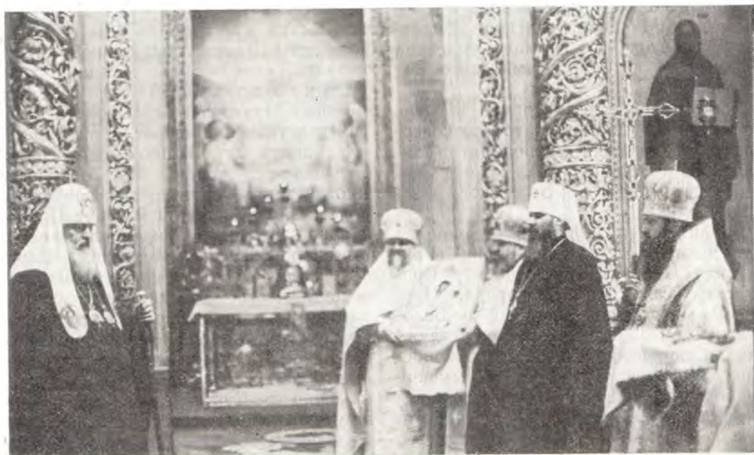
3 июня 1977 года в Богоявленском патриаршем соборе митрополит Таллинский и Эстонский Алексей произносит слово приветствия и преподносит Святейшему Патриарху Пимену икону Божией Матери

5 июня (23 мая), в Неделю 1-ю по Пятидесятнице, Всех святых, Божественную литургию в патриаршем соборе совершали Блаженнейший Папа и Патриарх Александрийский и