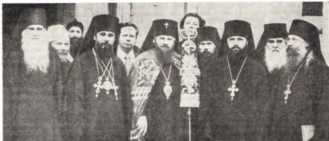
Русские паломники во главе с архиепископом Пензенским Мелхиседеком (рядом с ним — архимандрит АVELЬ, настоятель Русского Пантелеимонова монастыря) и братья Пантелеимонова монастыря

Было неизъяснимое чувство отрешенности от всего земного и близости к горнему. Так было все дни. Бдение окончилось около 1 часа ночи.