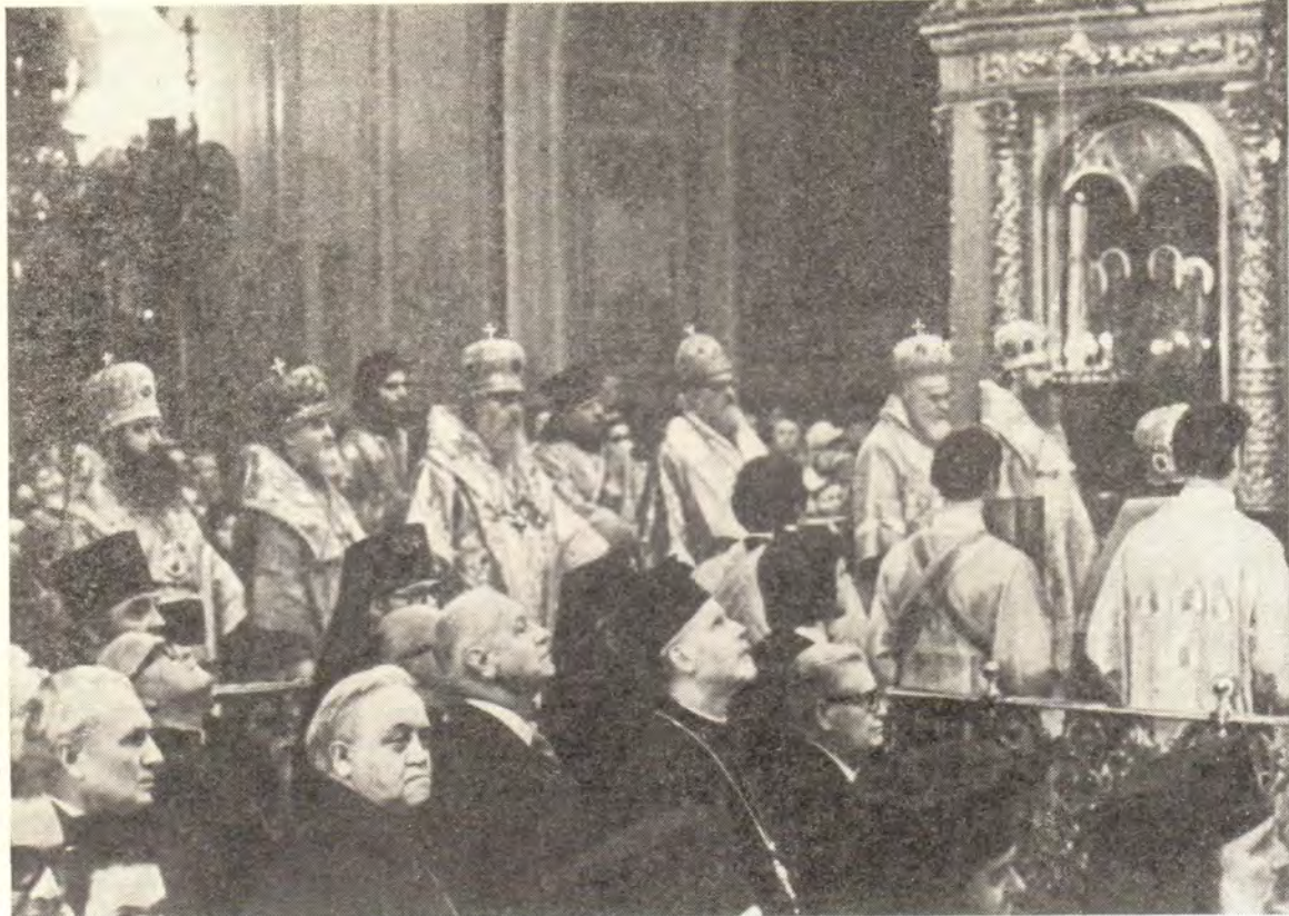
На воскресном богослужении в Богоявленском патриаршем соборе 5 июня 1977 года присутствовали участники открывшейся 6 июня Всемирной конференции: Религиозные деятели за прочный мир, разоружение и справедливые отношения между народами. На нижнем фото: Предстоятели Православных Церквей — Святейший Патриарх Московский и всея Руси Пимен и прибывшие на Конференцию Блаженнейший Папа и Патриарх Александрийский и всей Африки Николай VI, Святейший Патриарх Болгарский Максим, Блаженнейший Митрополит Пражский и всей Чехословакии Дорофей