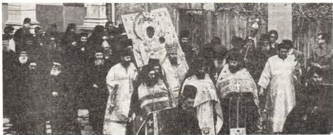
Святая Гора Афон. Крестный ход с чудотворной Иверской иконой Божией Матери

(Из 27-й беседы на Послание к Римлянам. «Собрание поучений на дни воскресные, праздничные и дни Святой Четыредесятницы», т. I. Киев, 1855, с. 184—188)