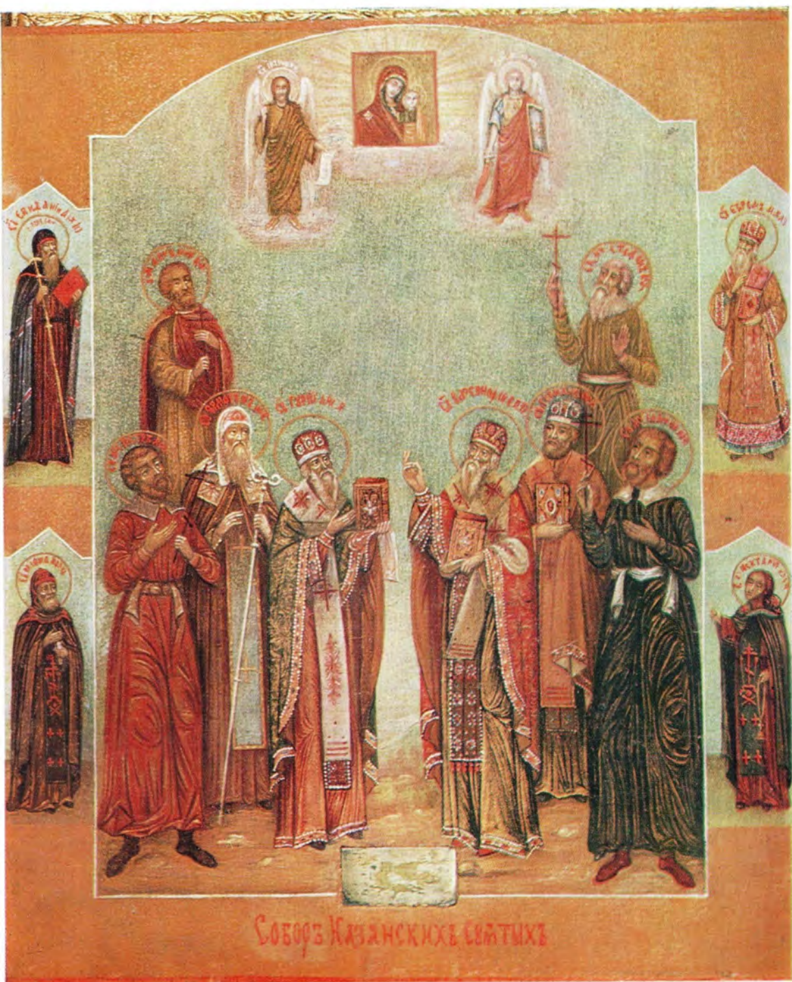
СОБОРЪ КАЗАНСКИХЪ СВЯТЫХЪ