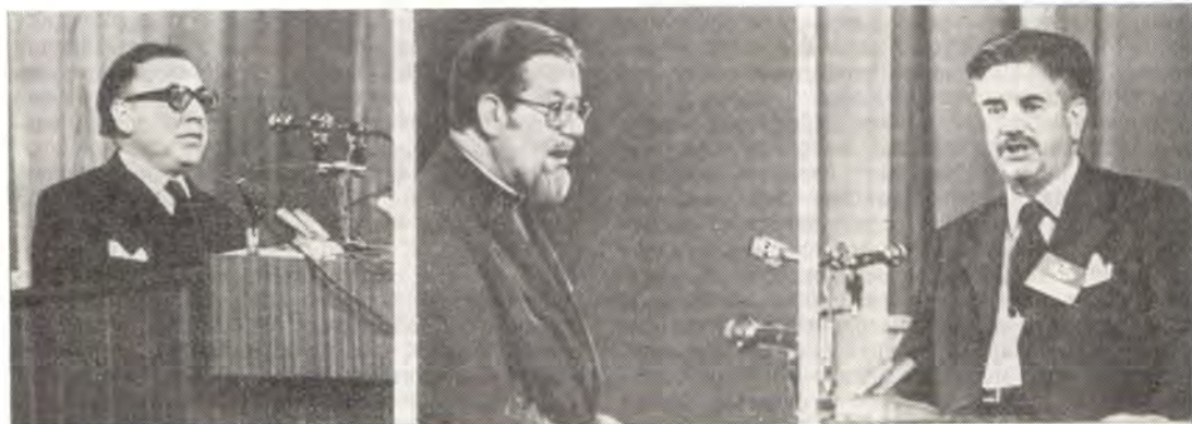
С приветствиями Всемирной конференции выступают: Сантьяго Кихано-Кабальеро — от имени д-ра К. Вальдхайма, Генерального секретаря ООН; иеромонах Иоанн Лонг, представитель Святого престола; д-р Глен Гарфильд Вильямс, генеральный секретарь Конференции Европейских Церквей