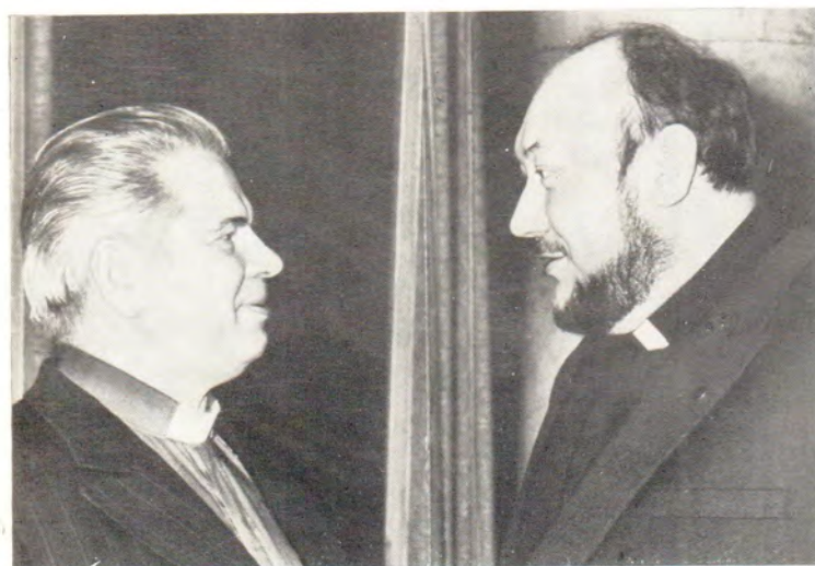
Заседание Международного подготовительного комитета Всемирной конференции: Ре- лигиозные деятели за проч- ный мир, разоружение и спра- ведливые отношения между народами. Москва, 15—17 марта 1977 года