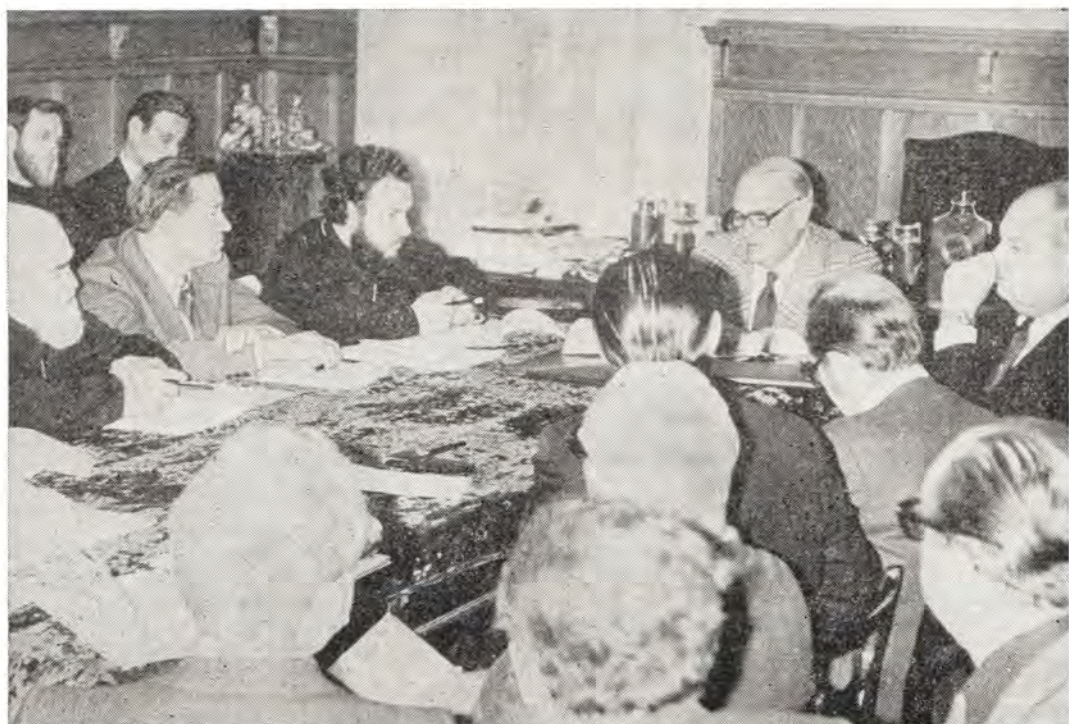
Второе православно-реформатское собеседование в Ленинграде

единократным приношением на Голгофе; б) как служение вечного Первосвященника, Ходатая пред Богом Отцом за всех.