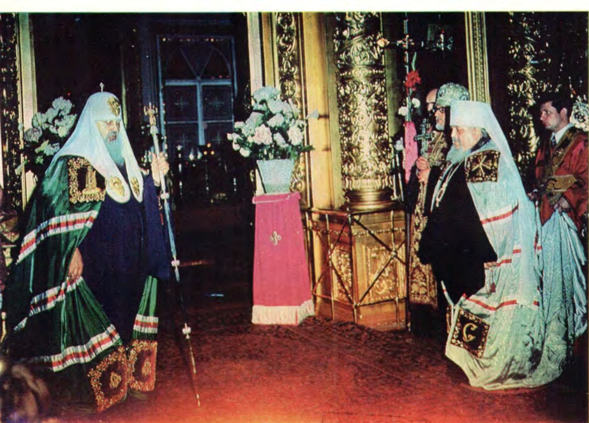
Пасха Христова в Богоявленском патриаршем соборе. Митрополит Крутицкий и Коломенский Серафим (справа) приносит Святейшему Патриарху Пимену праздничное поздравление от имени епископата, клира и мирян Московской епархии. На снимках внизу: Великая Суббота, канун праздника Светлого Христова Воскресения. Традиционное ссвящение куличей и пасох в Воскресенском храме в Сокольниках в Москве