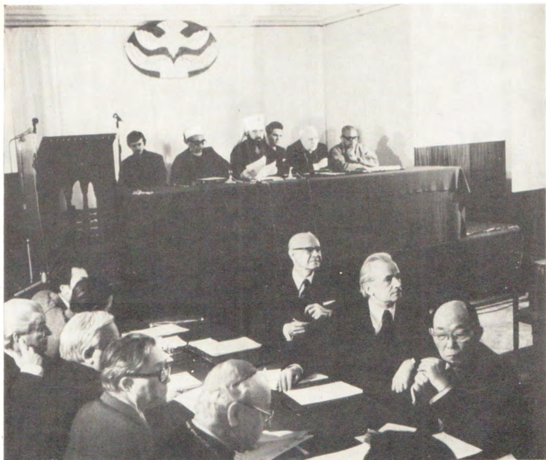
Заседание Международного подготовительного комитета Всемирной конференции: Религиозные деятели за прочный мир, разоружение и справедливые отношения между народами. Москва, 15—17 марта 1977 года