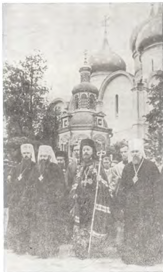
Посещение Тр-ице-Сергиевой Лавры Блаженнейшим Архиепископом Макарием