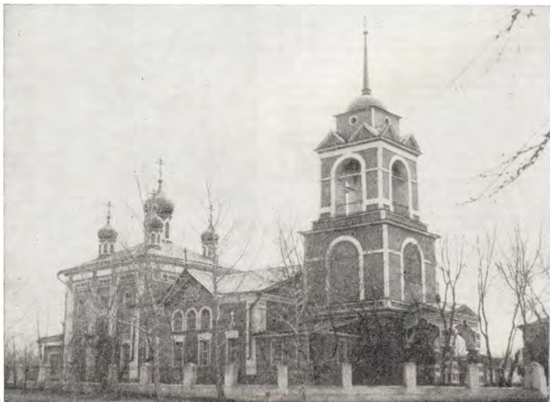
Храм во имя святых мучеников Флора и Лавра в г. Кашире Московской епархии

21 ноября, Собор Архистратига Божия Михаила, митрополит Серафим совершил Божественную литургию в Свято-Троицком храме в пос. Удельная. На торжественной встрече