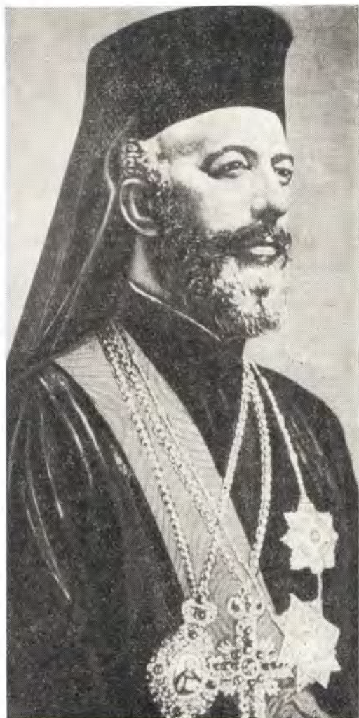
Блаженнейший Макарий, Архиепископ Новой Юстинианы и всего Кипра, президент

Уже в середине второго тысячелетия до Р. Х. Кипр был известен как самостоятельное государство. Впоследствии Кипр находился почти в непрерывной зависимости от чужезмцев: сначала от Египта (XV—XIV вв. до Р. Х.), затем от хеттов (с XIII в. до Р. Х.), с конца VIII в. — от Ассирии, с конца VI в. — от персов. В конце IV в. до Р. Х. был включен в империю Александра Македонского. До 78 г. до Р. Х., когда Кипром завладели римляне, он входил в состав государства Птолемея. После разделения Римской империи Кипр вошел в состав Восточной Римской империи, а затем