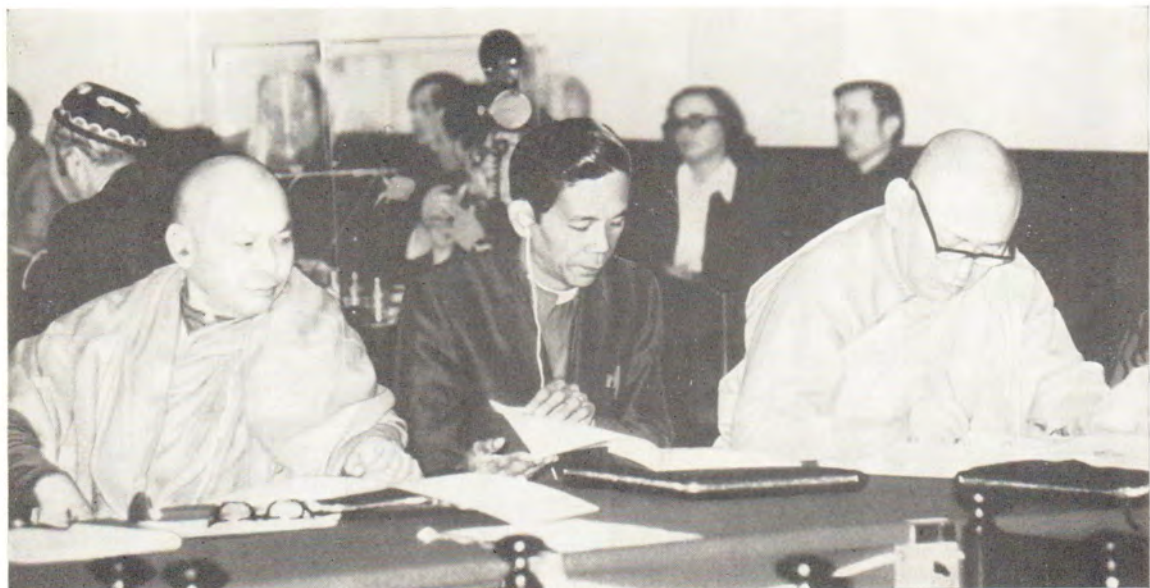
Заседание Международного подготовительного комитета Всемирной конференции: Религиозные деятели за прочный мир, разоружение и справедливые отношения между народами.