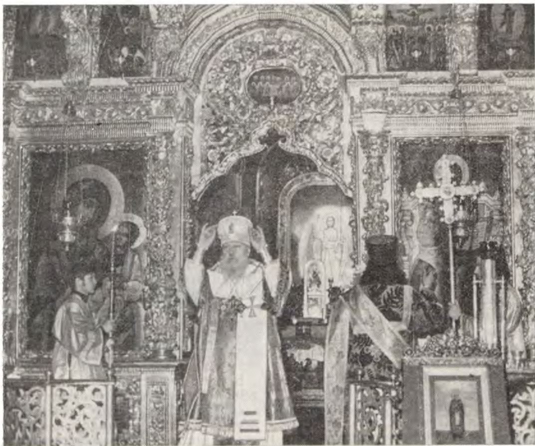
30 ноября 1976 года. Патриаршее служение в обновленном Сергиевском трапезном храме. Его Святейшество совершает осенение молящихся во время «похвалы» за Божественной литургией