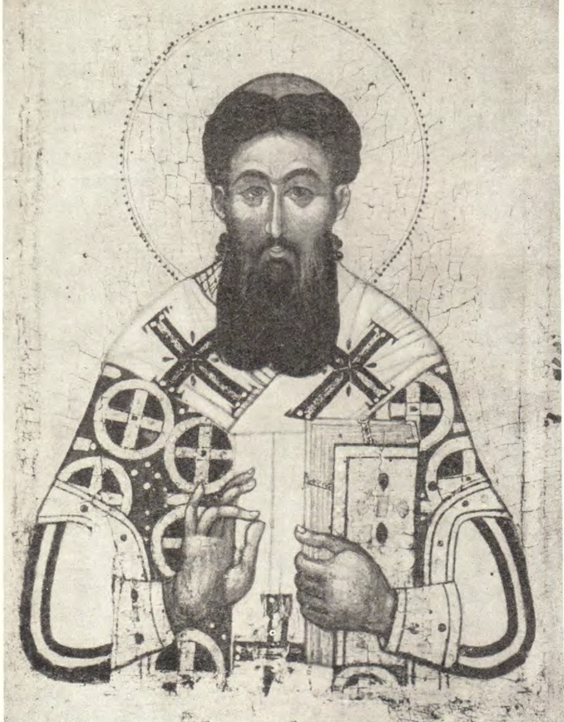
СВЯТИТЕЛЬ ГРИГОРИЙ ПАЛАМА, Архиепископ Фессалоникийский (Икона XIV в.)

Тропарь, гл. 8. Православия светильниче, Церкви утверждение и учителю, монахов доброто, богословов поборниче непреборимый, Григорие Чудотворче, Фессалоникская похвало, проповедниче благодати, молися присно спастися душам нашим.