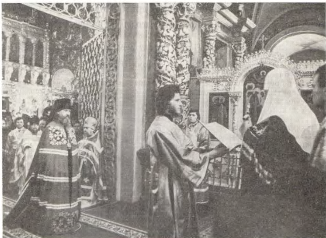
30 ноября 1976 года. Святейший Патриарх Пимен произносит слово при вручении архиерейского жезла епископу Чебоксарскому и Чувашскому Варнаве

жения, произносит посреди храма перед лицом рукополагающих архиереев и перед верующими архиерейское исповедание и обещание. В исповедании он излагает основы православной веры — как он верует. В обещаниях говорит о необходимости хранить и соблюдать каноны святых апостол и святых отец, предания и установления церковные благочестивых семи Вселенских Соборов, а также уставы и чины Кафолической Восточной Православной Церкви. Обещает неукоснительно повиноваться Патриарху Московскому и Преосвященным архиереям, любовь духовную вседушно к ним иметь и как братию почитать.