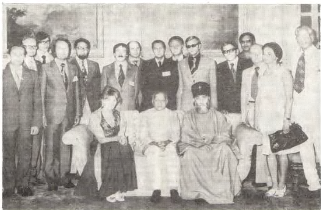
Члены Богословской комиссии ХМК на приеме у президента Индии Шри Фахруддина Али Ахмеда

миссия ХМК приглашение Индийского регионального комитета ХМК провести в 1976 году свое очередное ежегодное заседание в Бангалоре, столице штата Карнатака, с 14 по 19 сентября.