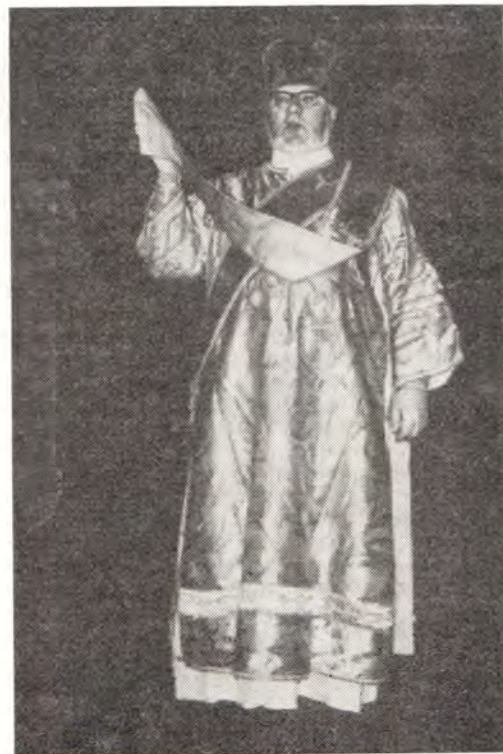
Великая, или мирная ектения за Божественной литургией: «Миром Господу помолимся...»

Великая ектения отличается прежде всего тем, что диакон вначале призывает всех обратившихся в храм совершать моление в мире, тишине и спокойствии духа, с чистой совестью, свободными от суетности, в единодушии и вза-