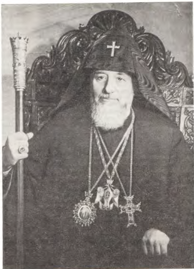
Святейший Верховный Патриарх-Католикос всех армян ВАЗГЕН I

Годы патриаршества Верховного Католикоса Вазгена I — это годы великих устроений в сфере церковной, экуменической, миротворческой, партийно-государственной деятельности Его Святейшества.