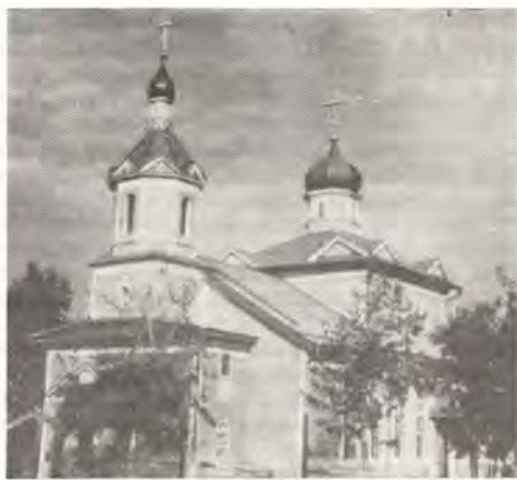
Храм в честь Вознесения Господня в г. Белово Кемеровской области