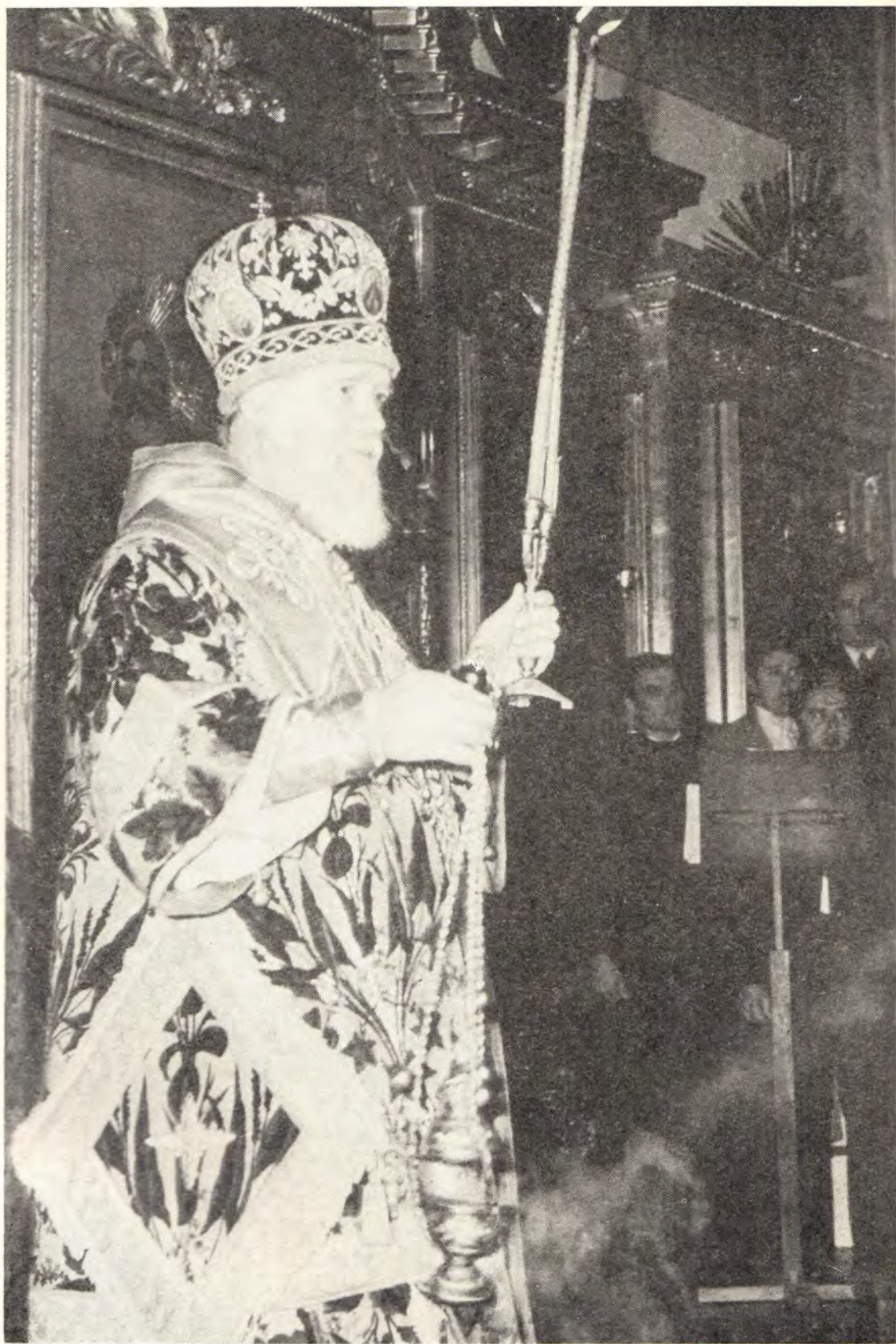
Митрополит Киевский и Галицкий Филарет за Божественной литургией в храме Ленинградской духовной академии 9 октября 1976 года