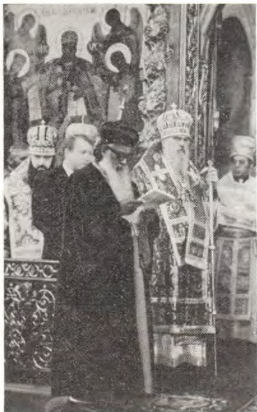
Святейший Патриарх-Католикос Василий Мар Фома Матфей I отвечает на приветствие Святейшего Патриарха Пимена в Успенском соборе Троице-Сергиевой Лавры

служивших ему иерархов Антиохийской, Болгарской и Русской Православных Церквей и многочисленного духовенства — зарубежных гостей, прибывших на праздник. В конце литургии Святейший Патриарх Пимен в приветственном слове отметил радость совместной молитвы, содействующей христианскому братскому общению и единству в любви о Господе Иисусе Христе.