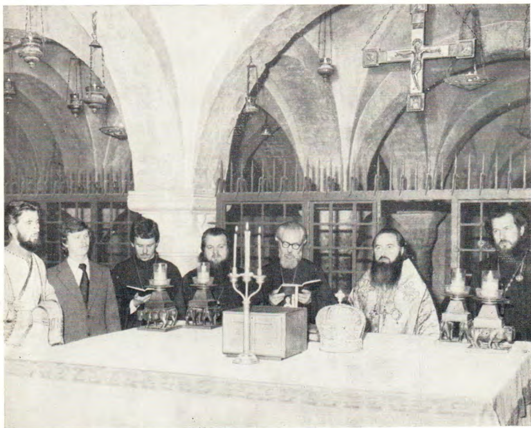
Внизу: Паломники Тульской епархии во главе с митрополитом Тульским и Белевским Ювением читают акафист Святителю и чудотворцу Николаю над его святыми мощами в соборе Святителя Николая в г. Бари, Италия