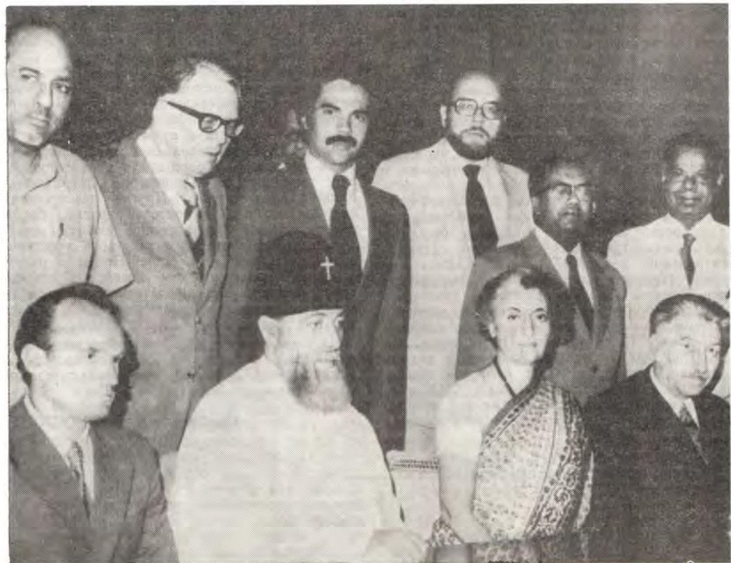
Члены Богословской комиссии ХМК на приеме у премьер-министра Индии г-жи Индиры Ганди

В завершающий день работы комиссии ее члены имели возможность и более близкого и непосредственного контакта с общественностью Бангалора, преимущественно теми, кто своим трудом и вниманием создал столь благоприятную атмосферу для работы прибывших христианских гостей. Организационный комитет во главе с пастором К. Абрахамом устроил в честь Богословской комиссии большой прием в одном из отелей города. Новые