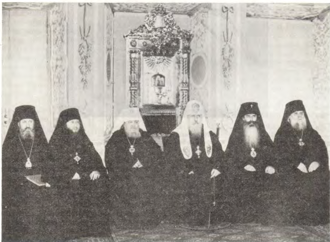
30 ноября 1976 года в патриарших покоях в Троице-Сергиевой Лавре. Слева направо: епископ Чебоксарский и Чувашский Варнава, епископ Рязанский и Касимовский Симон, митрополит Крутицкий и Коломенский Серафим, Святейший Патриарх Пимен, архиепископ Волоколамский Питирим, епископ Орловский и Брянский Глеб

В том же году Святейшим Патриархом Пименом награжден орденом святого князя Владимира II степени.