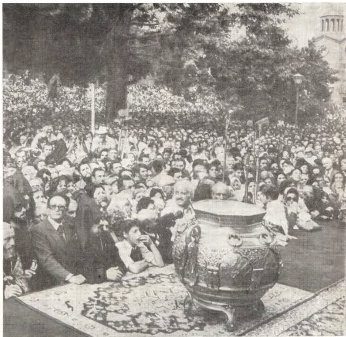
На площади св. Эчмиадзина перед началом мироварения

С первых дней Вашего патриаршества армянский народ полюбил Вас. У Вас большой опыт в деле обновления Армянского Патриархата, процветания Эчмиадзина и Вашего Отечества. Как достойный Предстоятель Армянской Церкви Вы стимулируете свой народ уже 20 лет, согревая его своей любовью. Вы направляете паломников за рубеж, посылая через них свое благословение армянской пастве, находящейся в рассеянии, уча ее любить свою Мать-Церковь, св. Эчмиадзин и свою возрожденную Родину. Эти чувства являются золотой рекой, которая как бы орошает сердца детей Армянской Церкви, живущих под небом рассеяния. Святой Эчмиадзин — не только бастион нашей веры, но и золотой мост, соединяющий армян рассеяния с Родиной.