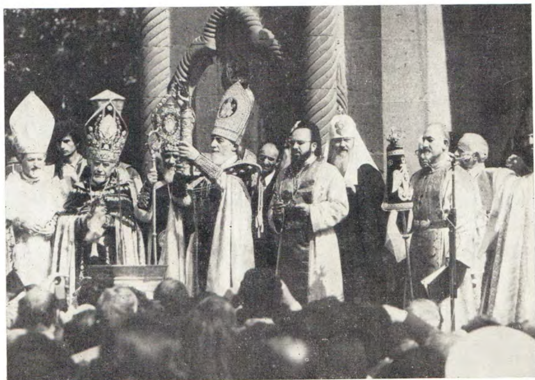
Внизу: Святейший Верховный Патриарх-Католикос всех армян Вазген I десницей св. Григория Просветителя благословляет св. миро