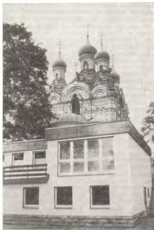
Новый приходский дом при храме преподобного Симеона Дивногогорца в Дрездене

Торжественной процессией Преосвященные архиереи, клирики, гости, прихожане направились из храма к приходскому дому. На крыльце у входа в дом были установлены на столе чаша со святой водой и икона Божией Матери с лампадой перед ней. После освящения митрополит Филарет передал настоятелю Тихвинскую икону Божией Матери как благословение новому приходскому дому. Настоятель храма обратился с словом благодарности ко всем, кто принял участие в строительстве приходского дома. Он особо благодарил Матерь-Церковь за средства для строительства, Владыку Филарета — за отеческое попечение о дрезденском приходе, представителей городских властей, епископа Мейсенского Герхарда Шаффрана и всех инославных верующих — за экуменическую поддержку и помощь. Настоятель поблагодарил