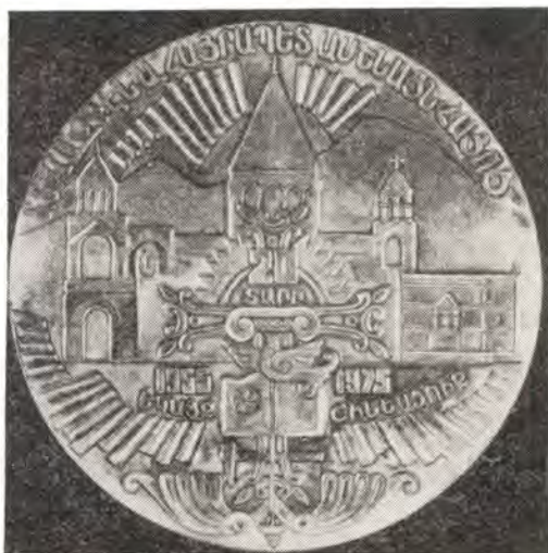
Памятная медаль в честь 20-летия Патриаршества Верховного Католикоса Вазгена I

Чтобы получить наглядную картину армяно-русских церковных взаимоотношений последних лет, надо прибавить ко всему вышеизложенному многочисленные поздравления, послания,