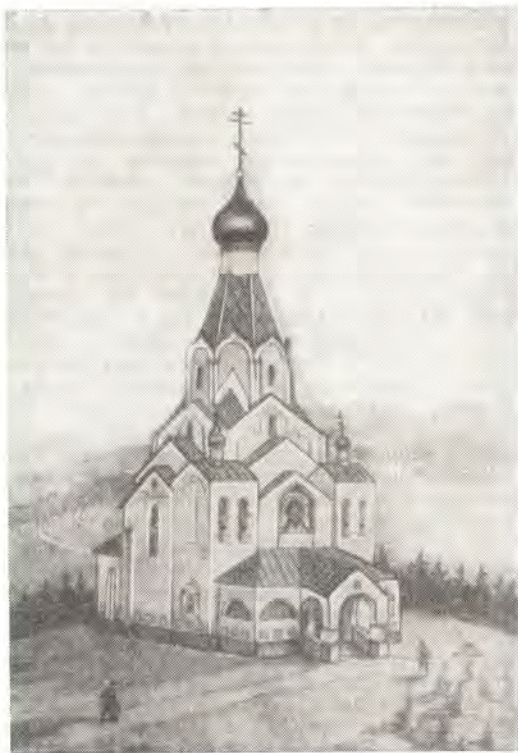
Храм-памятник в Лаборцах