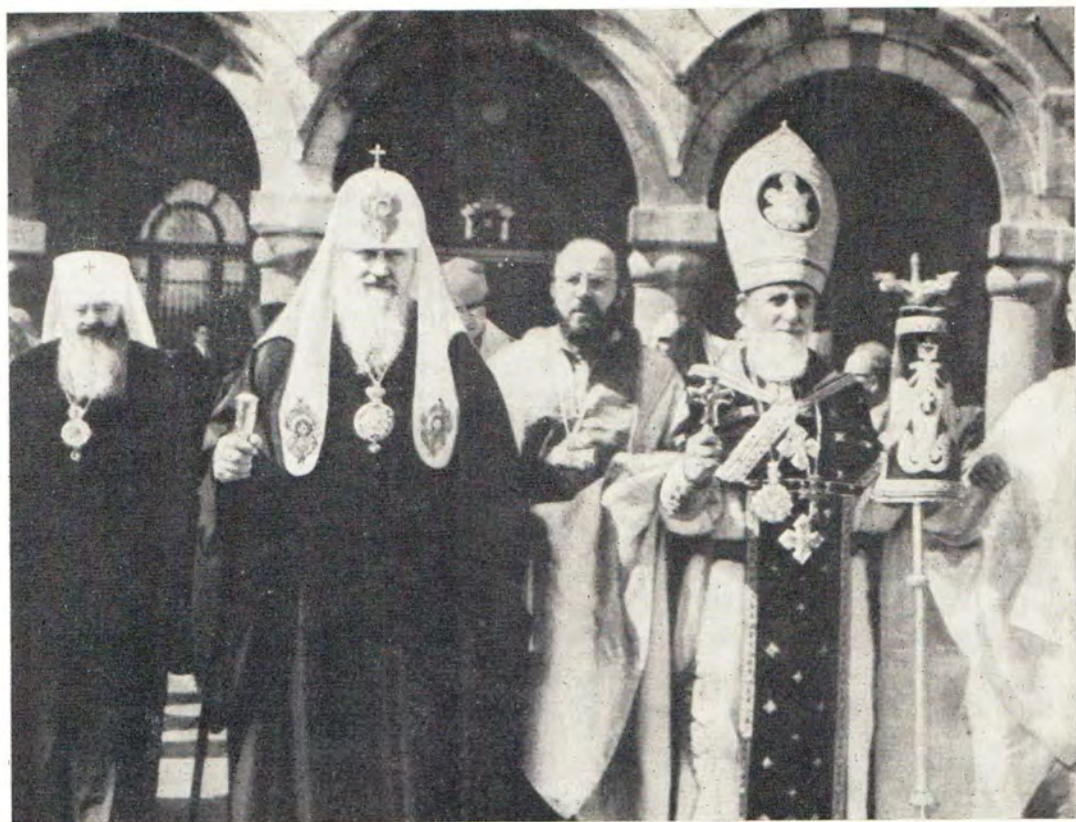
26 сентября 1976 года на торжестве освящения мира в Эчмиадзине (справа налево): Святейший Верховный Патриарх-Католикос всех армян Вазген I, Святейший Патриарх Московский и всея Руси Пимен, митрополит Ленинградский и Новгородский Никодим, Патриарший Экзарх Западной Европы. К стр. 53