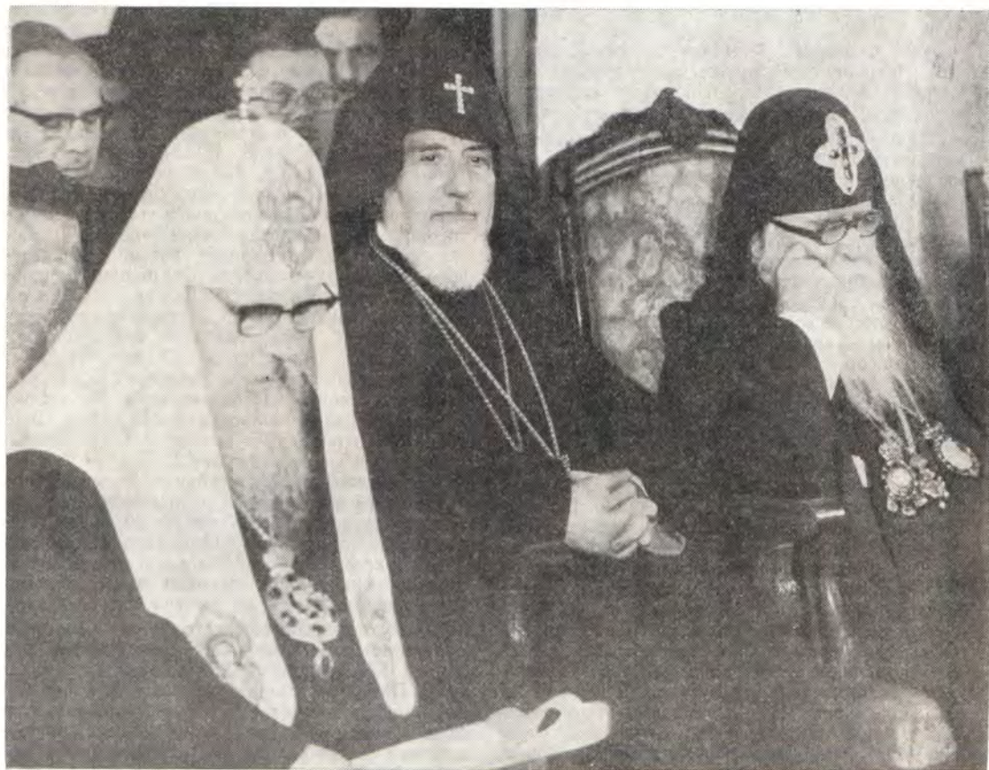
На юбилейных торжествах в св. Эчмиадзине. Слева направо: Святейший Патриарх Московский и всея Руси Пимен, Святейший Верховный Патриарх-Католикос всех армян Вазген I, Святейший Католикос-Патриарх всей Грузии Давид V

Из Еревана Святейший Патриарх Пимен с членами делегации в сопровождении Святейшего Верховного Патриарха-Католикоса Вазгена I и других иерархов, принимавших участие во встрече, направился в духовный