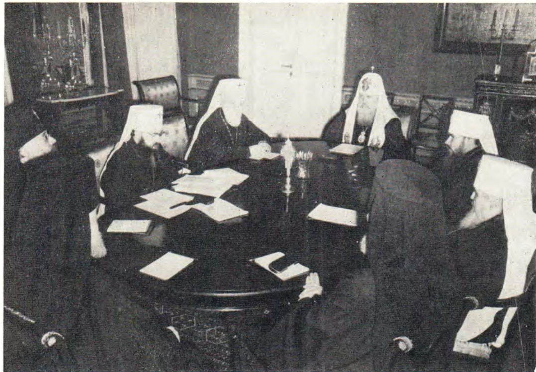
Заседание Священного Синода Русской Православной Церкви 18 ноября 1976 года.

Внизу: 30 ноября 1976 года, день памяти преподобного Никона Радонежского, чудотворца, в Сергиевском трапезном храме в Троице-Сергиевой Лавре. Святейший Патриарх Пимен совершает входные молитвы перед началом Божественной литургии.