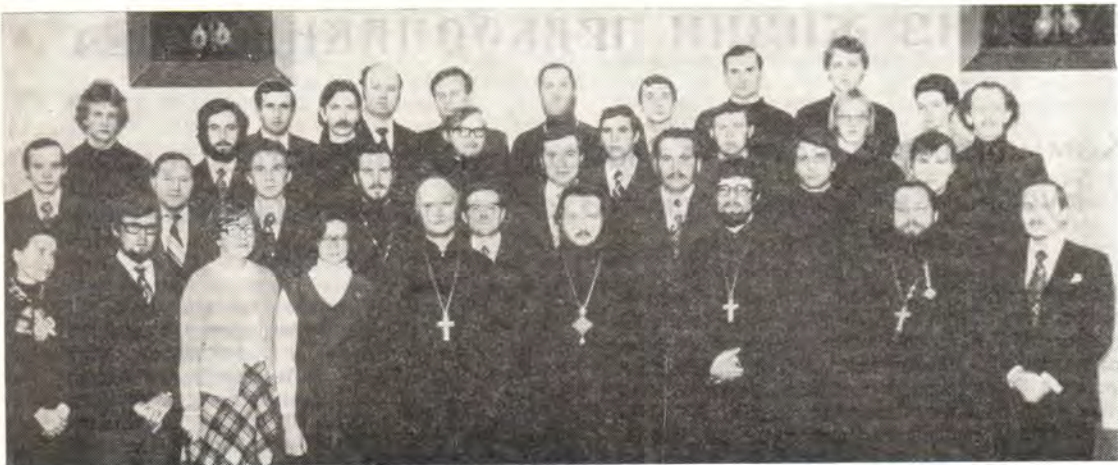
Участники семинара Синдесмоса в Ленинградской духовной академии

го комитета Синдесмоса, состоявшееся в Ленинградской духовной академии 14—17 сентября 1976 года.