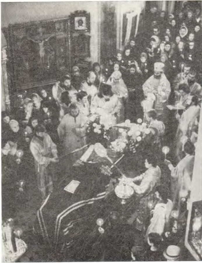
В Свято-Троицком храме на Пятницком кладбище в Москве во время отпевания архиепископа Михаила 23 октября 1976 года

дом с могилой архиепископа Рязанского Бориса (Соколова; † 21 февраля 1928). (Летом 1975 года, вскоре по приезде в Москву, архиепископ Михаил побывал на Пятницком кладбище, сравнительно недалеко от которого находится дом, где жил Владыка. Обходя храм, он остановился у могилы архиепископа Бориса. Думал ли в ту минуту Пресвященный Михаил, что ему суждено будет именно здесь обрести вечный покой? Тогда он лишь заметил: «Я знал Владыку Бориса. Он вместе с моим отцом оканчивал Петербургскую духовную академию. В Москве мне часто приходилось с ним встречаться и беседовать. Прекрасный был человек и великий архипастырь».)