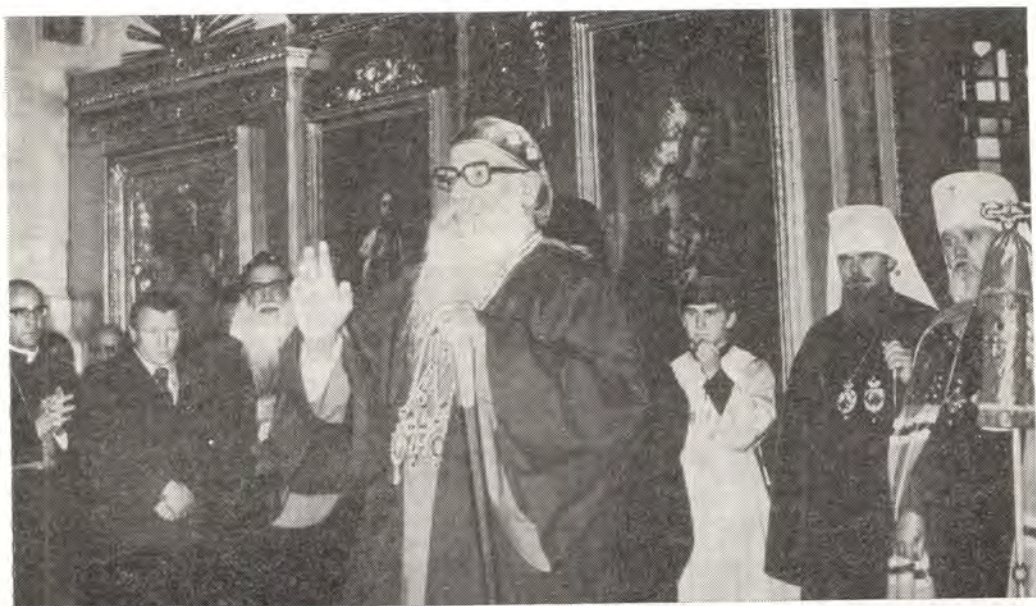
Святейший Патриарх-Католикос Василий Мар Фома Матфей I преподает благословение в храме Ленинградской духовной академии 9 октября 1976 года