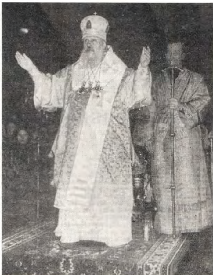
Святейший Патриарх Пимен совершает чтение молитвы «Царю Небесный...» перед началом Божественной литургии в патриаршем Боговладенском соборе в день празднования Казанской иконе Божией Матери 4 ноября 1976 года

Готовясь начать священнодействие литургии, священник, сотворив три посясных поклона, с молитвой «Боже, очисти мя, грешного», возвысив руки, молится: «Царю Небесный, Утешитель, Душе истины, Иже везде сый и вся исполняй, Сокровище благих и жизни Подателю, прииди и вселися в ны, и очисти ны от всякия