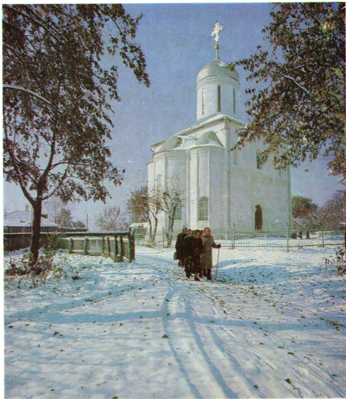
Храм Успения Пресвятой Богородицы в г. Звенигороде, воздвигнут по благословию преподобного Саввы Сторожевского князем Георгием Дмитриевичем в начале XV в. В росписях храма участвовал знаменитый иконописец Преподобный Андрей Рублев