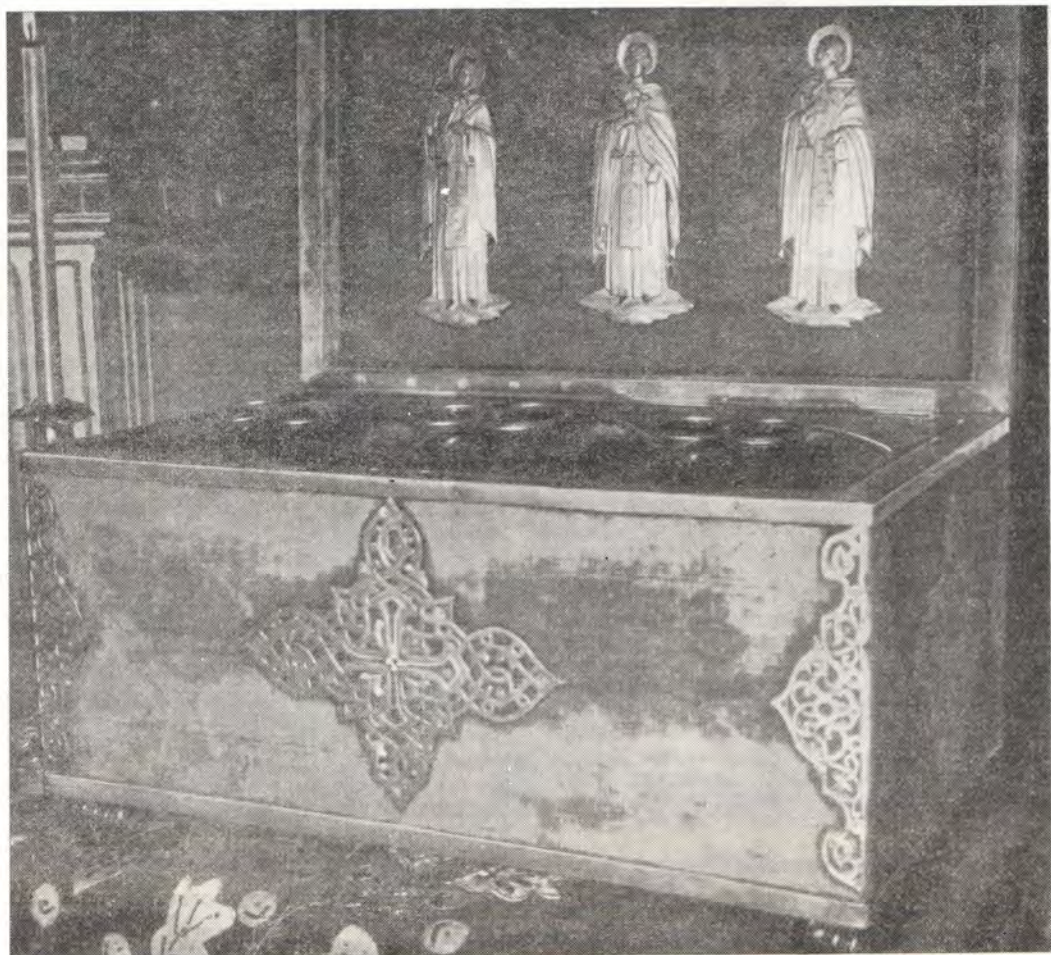
Ковчег с святыми главами преподобномучеников Евфимия, Игнатия и Акакия в Русском Пантелеимоновом монастыре на Афоне

Служба преподобномученикам на славянском языке была издана в Петербурге в 1871 году.