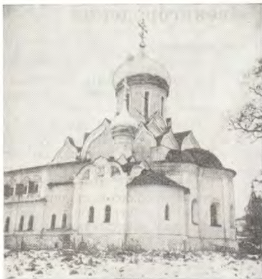
Собор в честь Рождества Богородицы с приделом во имя преподобного Саввы. Звенигородский район Московской области

Рождества Пресвятой Богородицы и недалеко от нее — малую келлию для себя. В 1399 г. он основывает общежительный монастырь для ищущих безмолвного жития. За стенами обители, под горою, преподобный Савва сам ископал колодец, откуда носил на плечах своих воду, являя братии пример трудолюбия, смирения и кротости. В 1399 г. князь Юрий Дмитриевич должен был по повелению брата своего, великого князя московского Василия Дмитриевича, выступить против Волжских Болгар. Преподобный Савва преподал ему свое благословение и пророчески предрек победу. Вернувшись со славой победителя на родину, князь Юрий Дмитриевич поспешил в обитель, чтобы поблагодарить Преподобного за молитвенное вспоможение в одолении супостатов и сделал крупный вклад на устройство монастыря: церковь была украшена, глава ее обита листами позолоченной меди, а обитель обнесена оградой. Вскоре Юрий Дмитриевич задумал вместо деревянной церкви построить каменную и для сего дал «блаженному злата довольно и села многа и имения довольно на строение монастырское» 5 . Когда преподобный Савва достиг глубокой старости, то назначил своим преемником одного из ближайших учеников, тоже по имени Савва. Прощаясь с иноками, Преподобный завещал им иметь бра-