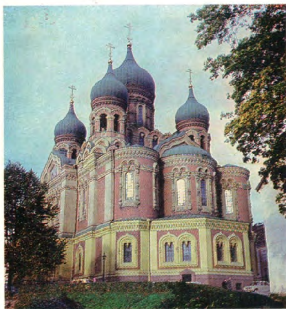
Кафедральный собор во имя святого благоверного князя Александра Невского в г. Таллине (на фото вверху — со стороны западного входа, на нижнем снимке — с восточной стороны)