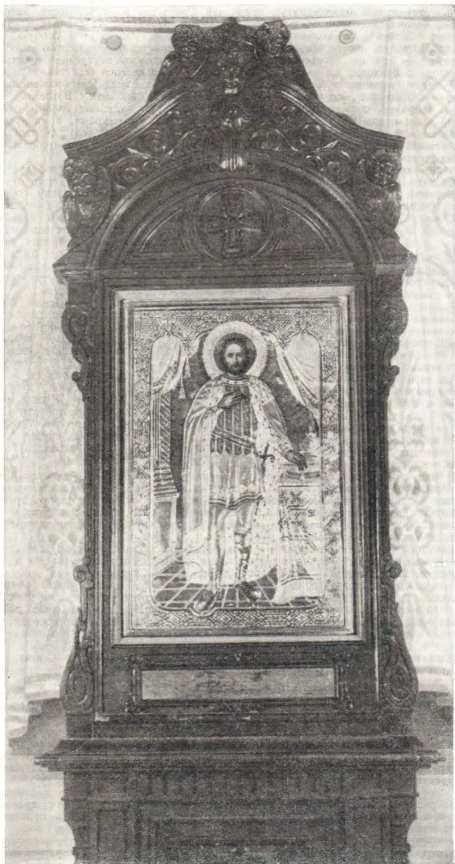
Святой благоверный князь Александр Невский Храмовой образ кафедрального собора в г. Таллине