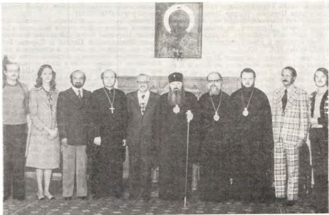
Члены Исполкома Синдесмоса на приеме у митрополита Ленинградского и Новгородского Никодима

Взаимные визиты молодежных делегаций, участие в юбилейных актах и торжествах, чтение докладов, участие молодежи в богослужениях — все это становится традиционным, свидетельствуя о крепких узах братства, связывающих молодежь обеих соседних Церквей.