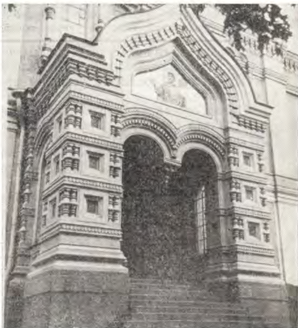
Южный портал с мозаичным изображением святого князя Александра Невского

Окончилось торжество. Но в памяти современников оживают страницы сравнительно недавнего прошлого. Напомним, что описания величественного Александро-Невского собора были напечатаны в «Журнале Московской Пат-