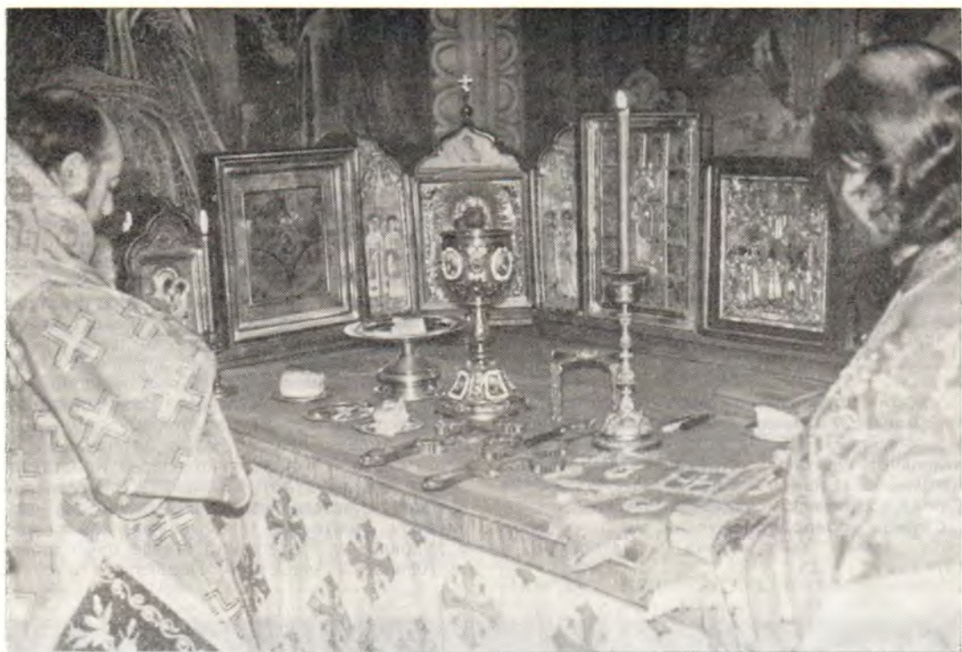
У святого жертвенника в Покровском соборе Русского Пантелеимонова монастыря

святой Анны, в Дохиарской, Есфигменской и Иверской обителях, на пирге Ставроникитского монастыря и в скиту святого Иоанна Предтечи.