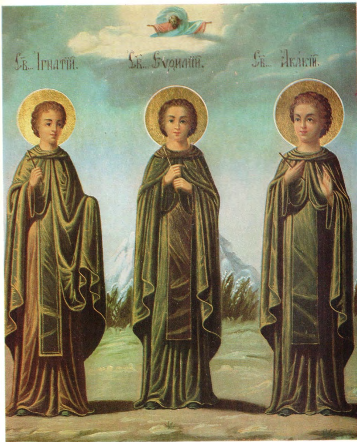
Икона Афонских новомучеников. Благословение Русского Пантелеимонова монастыря