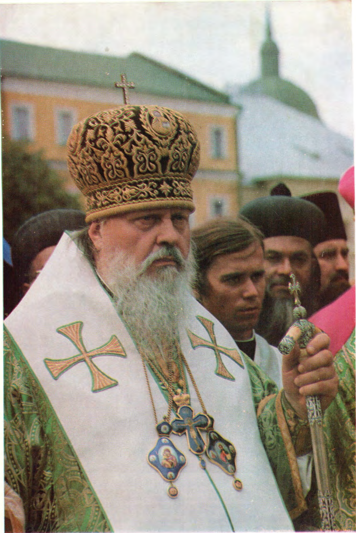
Святейший Патриарх Московский и всея Руси ПИМЕН (К 20-летию со дня архиерейской хиротонии, 1957—1977)