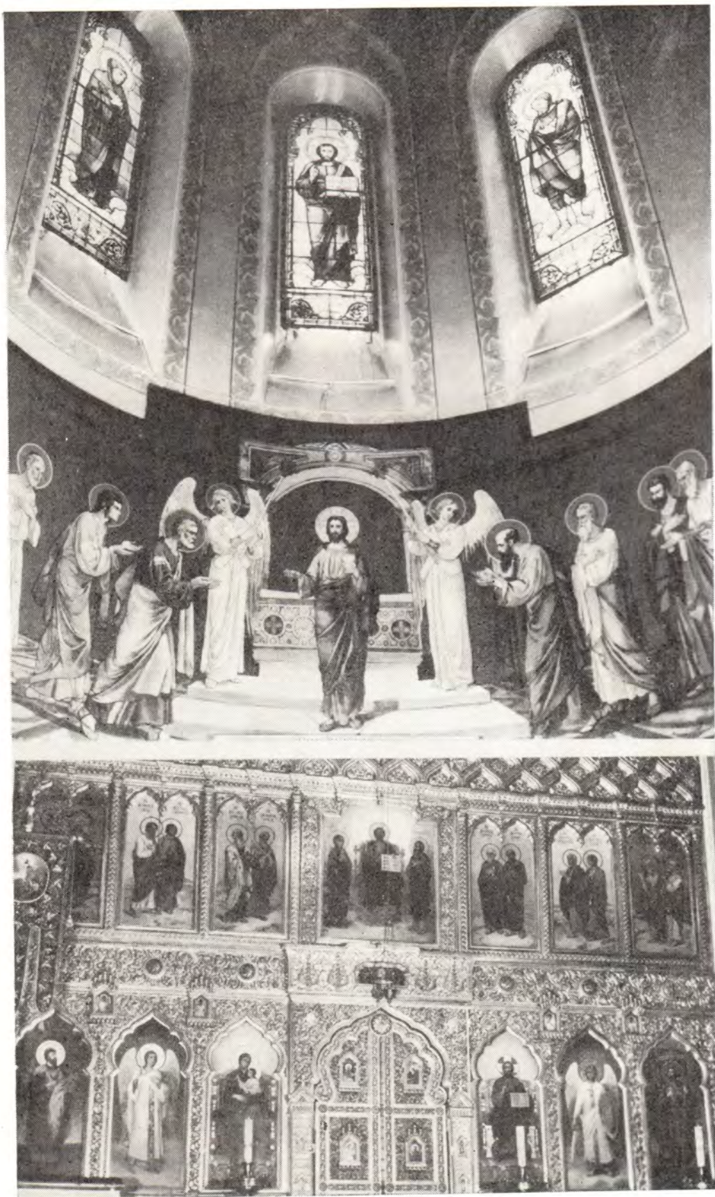
Александрo-Невский кафедральный собор в г. Таллине. На верхнем снимке — витражи и роспись над горним местом в главном алтаре; внизу — иконостас главного алтаря