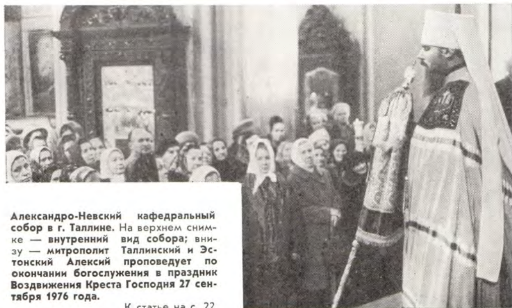
Александровский кафедральный собор в г. Таллине. На верхнем снимке — внутренний вид собора; внизу — митрополит Таллинский и Эстонский Алексей проповедует по окончании богослужения в праздник Воздвижения Креста Господня 27 сентября 1976 года.