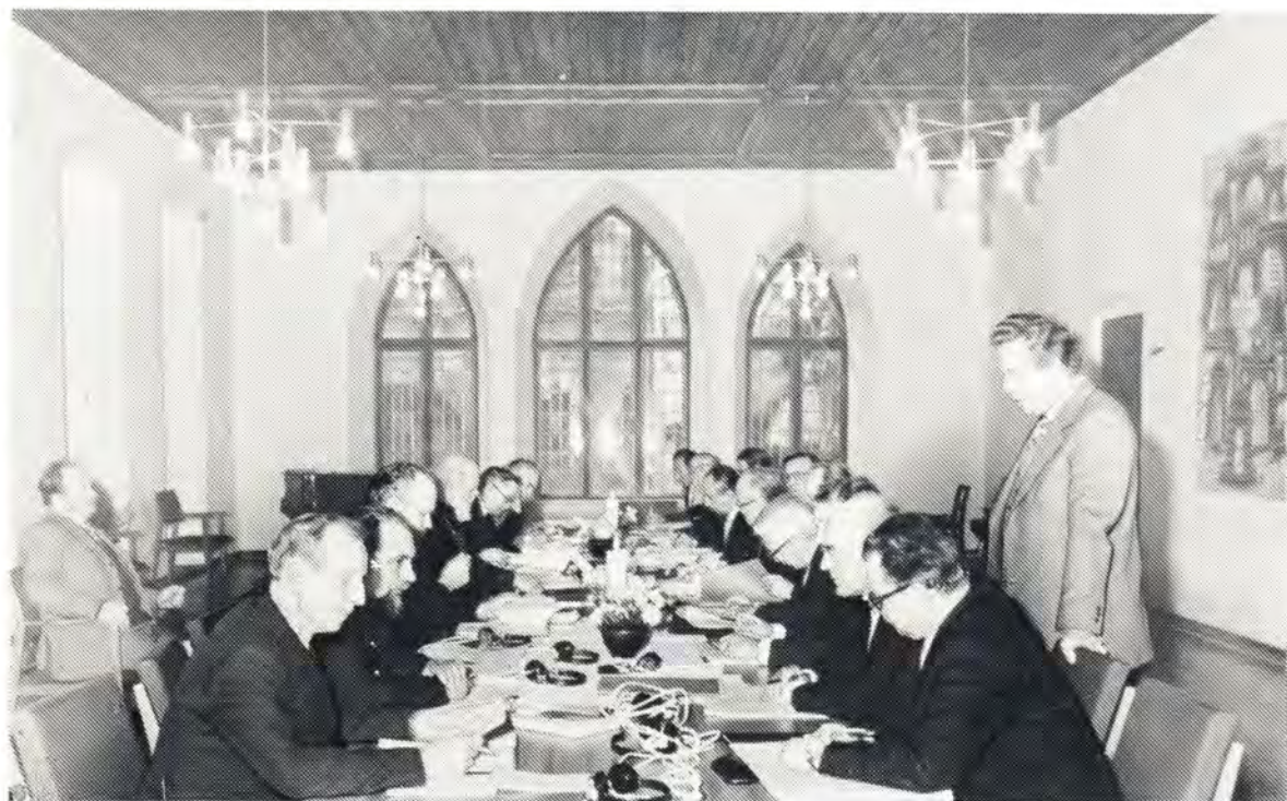
Второе богословское собеседование представителей Русской Православной Церкви и Союза Евангелических Церквей в ГДР состоялось в Эрфурте с 12 по 16 сентября 1976 года. На верхнем снимке: в зале заседаний. Внизу: участники богословского собеседования в Августинском монастыре г. Эрфурта.