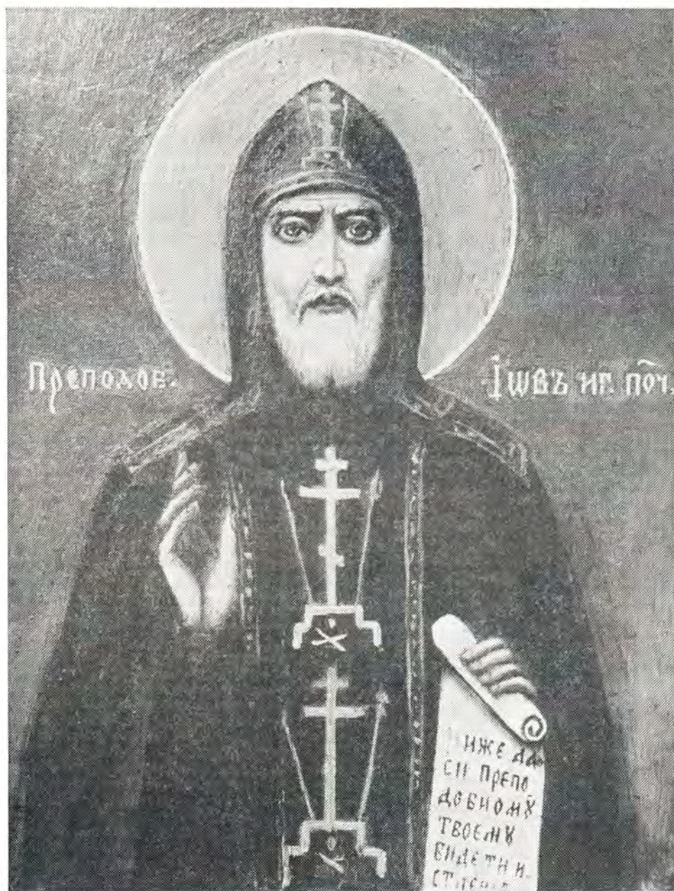
Преподобный ИОВ, игумен Почаевский

Тропарь, глас 4. Многострадальнаго праотца долготерпение стяжав, Крестителю воздержанию уподобляясь, Божествен- ныя же ревности обою приобщаяся, тех имена достойно прияти сподобился еси, и истинныя веры был еси проповед- ник безбоязнен, темже монахов множество ко Христу привел еси, и вся люди в Православии утвердил еси, Иове препо- добне отче наш, моли спастися душам нашим.