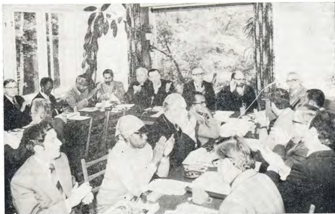
Заседание Рабочего комитета ХМК в Бад-Саарове

Борьба за социальный прогресс сегодня концентрируется вокруг различных задач, связанных с установлением, сохранением и упрочением мира во всем мире и с достижением социальной справедливости. ХМК с начала своего существования стояла на стороне людей доброй воли независимо от того, к какой религии или к какому мировоззрению они принадлежат. Поэтому ХМК поддерживает также и инициативу Его Святейшества Патриарха Русской Православной Церкви Пимена созвать с 6 по 10 июня 1977 года в Москве Всемирную Конференцию: Религиозные деятели за прочный мир, разоружение и справедливые отношения между народами и призывает все Церкви и всех христиан к такого же рода под-