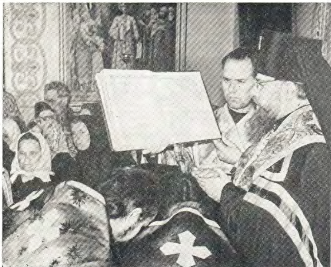
20 апреля 1976 года, в Воскресенском кафедральном соборе в г. Чернигове. Архиепископ Черниговский Антоний читает молитву перед награждением клириков епархии

Черниговская епархия. 20 апреля 1976 года, в Великий Вторник, архиепископ Черниговский и Нежинский Антоний за литургией Преждеосвященных Даров в Воскресенском кафедральном соборе в г. Чернигове возложил на клириков епархии награды Святейшего Патриарха Пимена ко дню Святой Пасхи. Архиепископ сердечно поздравил награжденных и призвал их к еще более ревностным и плодотворным трудам на ниве Христовой.