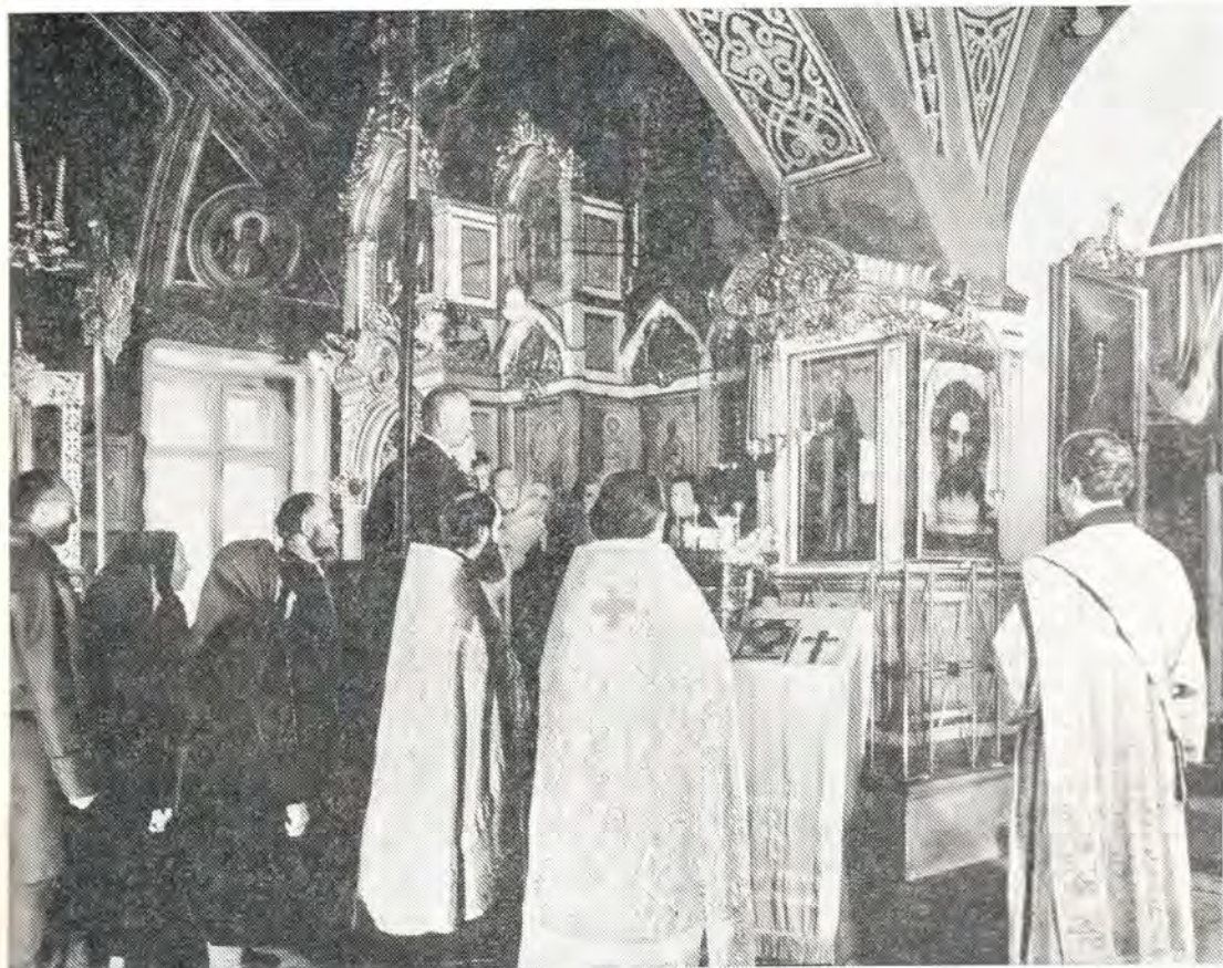
Молебен преподобному Иоанну Дамаскину в храме Покрова Божией Матери в Москве

Утром старец сказал Иоанну: «О, чадо послушания Христова! Открой уста твои и возвести вселенной, что Дух Святой начертал на твоём сердце, ибо много славного мне сказала о тебе Богоматерь. Меня же, молю, прости за то, что я тебе был препятствием по своему неведению» (там же). И святой воспел дивные ирмосы Царице, Преподобной Владычнице Богородице: «Отверзу уста моя, и наполнятся духа...»