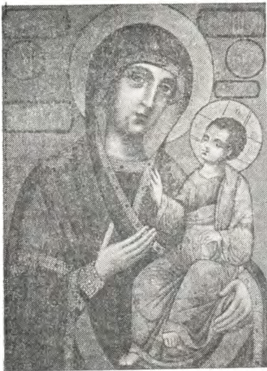
Иверская икона Божией Матери

Верх храма перекрыт сомкнутым сводом, в котором расположен световой, круглый в плане барабан. В северной стене четверика сохранился, но с переделками, портал. Был портал и с южной стороны, но в XIX веке на его месте устроили окно. Храм соединен с приделами арочным проемом и двумя небольшими арочными окнами с кубчатыми решетками, заложеными в XIX веке при перестройке приделов (окна расположены по бокам проема). Эти окна способствовали лучшей слышимости, когда богослужение совершалось у главного престола.