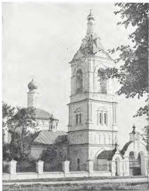
Казанский храм в с. Шеметово (с северо-запада), внизу: внутренний вид храма

В плане храм имеет вид креста. Древняя его часть — с престолом в честь Казанской иконы Божией Матери. Она имеет полукруглую апсиду с тремя окнами. От храма алтарь отделен кирпичной преградой, прорезанной тремя арочными проемами. Двухсветный чет-