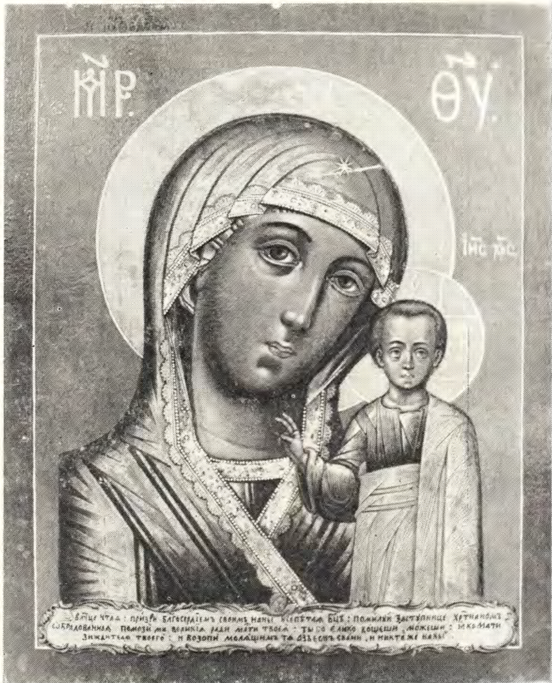
КАЗАНСКАЯ ИКОНА БОЖИЕЙ МАТЕРИ