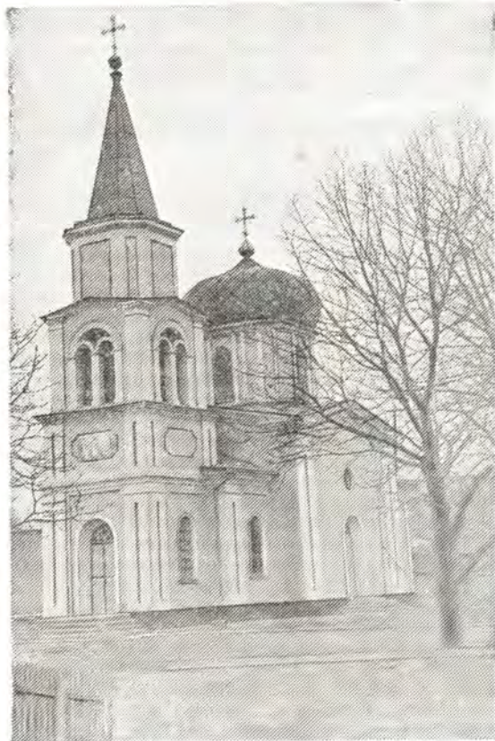
Свято-Василиевский храм в г. Единцы Кишиневской епархии