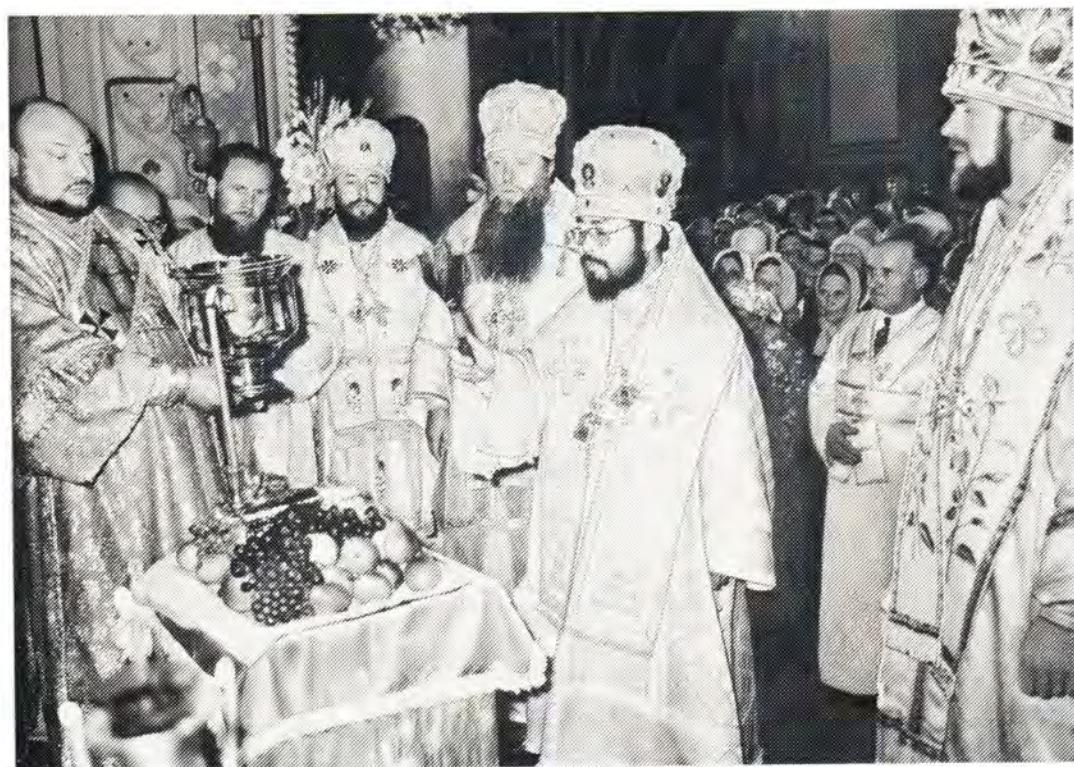
Александровский собор в г. Ялте Симферопольской епархии. Высокопреосвященный Феодосий, Архиепископ Токийский, Митрополит всей Японии, совершает освящение плодов в день праздника Преображения Господня, 19 августа 1976 года. (О пребывании в нашей стране Митрополита Феодосия см. стр. 2—3)