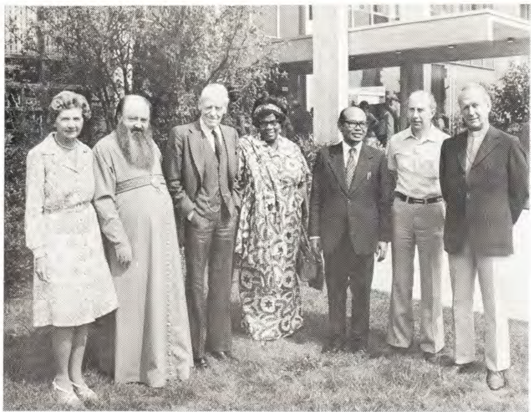
10—18 августа 1976 года в Женеве проходило 29-е заседание Центрального комитета Всемирного Совета Церквей. На верхнем фото — президенты ВСЦ — г-жа Синтия Видэл, Патриарший Экзарх Западной Европы митрополит Ленинградский и Новгородский Никодим, почетный президент ВСЦ В. А. Виссерт-Хуфт, г-жа Анни Джагге, Т. Б. Симатуланг, Х. Мигуес-Бонино, Архиепископ Церкви Швеции Олоф Сандби. На нижнем фото — в зале пленарных заседаний. Во втором ряду первый слева — епископ Выборгский Кирилл, третий слева — митрополит Тульский и Белевский Ювеналий