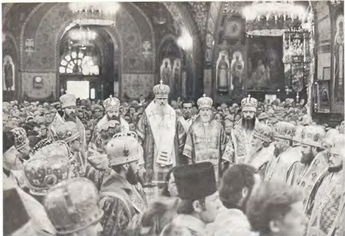
Празднование памяти преподобного Пимена Великого — Дня тезоименитства Предстоятеля Русской Православной Церкви — 9 сентября 1976 года в Свято-Троицком (Пименовском) храме в Москве. На снимке: праздничный молебен по окончании Божественной литургии. К стр. 8