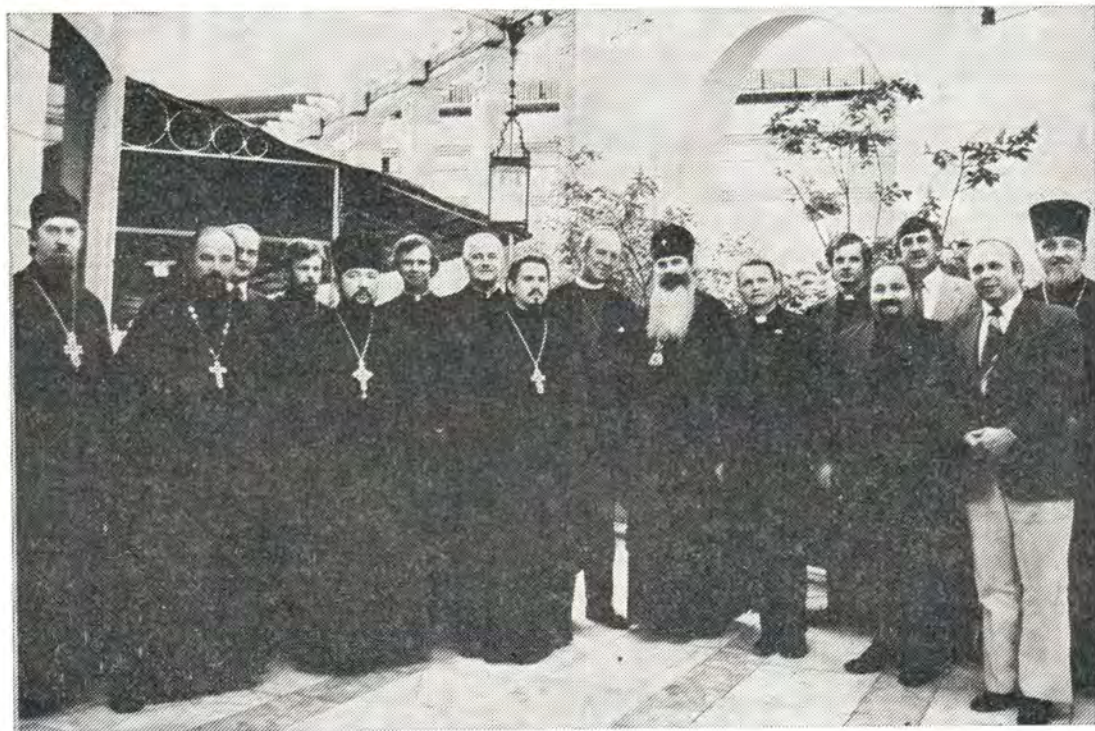
Делегация Англиканской Церкви Австралии на прощальном приеме 24 июня 1976 года. В центре — архиепископ Волоколамский Пителир и лорд-епископ Иан Шевилл

Впечатлениями об экуменической деятельности Русской Православной Церкви поделился священник Алан Николс. Будучи членом Всемирного Совета Церквей, сказал он, Англиканская Церковь Австралии в лице своих пред-