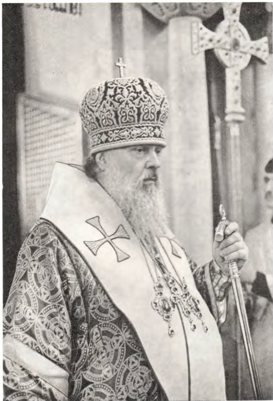
Святейший Патриарх Московский и всея Руси ПИМЕН за богослужением в Пименовском храме в Москве 9 сентября 1976 года, в день памяти преподобного Пимена Великого К стр. 8