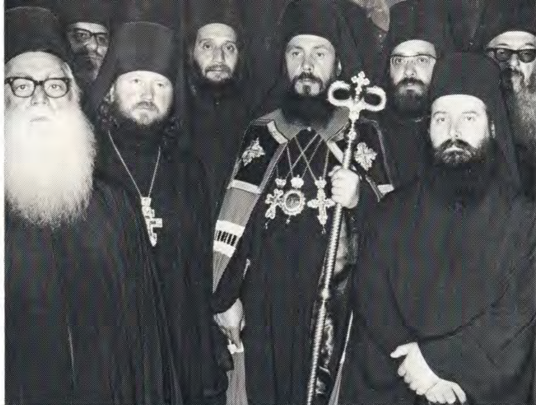
19 июля 1976 года. Настоятель монастыря святого великомученика и целителя Пантелеимона на Святой Горе Афон архимандрит Авель с группой иноков-святогорцев, посетивших Русскую Православную Церковь, после богослужения в подворье Пантелеимоновского монастыря в с. Лукино под Москвой. Внизу: по окончании приема в честь игумена архимандрита Авеля и посла Греции в СССР г-на Александра Деметропулоса 9 августа 1976 года