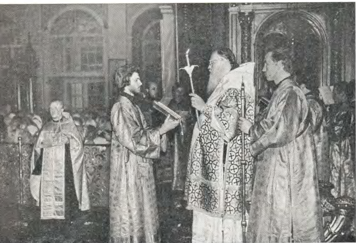
патриаршем соборе чин Погребения Божией Матери. На снимке: Его Святейшество читает

21(8) сентября, в день праздника Рождества Пресвятой Богородицы, Святейший Патриарх Пимен совершил в патриаршем соборе Божественную литургию в сослужении митрополита Тульского и Белевского Ювеналия и епископа Ладожского Марка, а накануне — всенощное бдение в сослужении тех же иерархов.