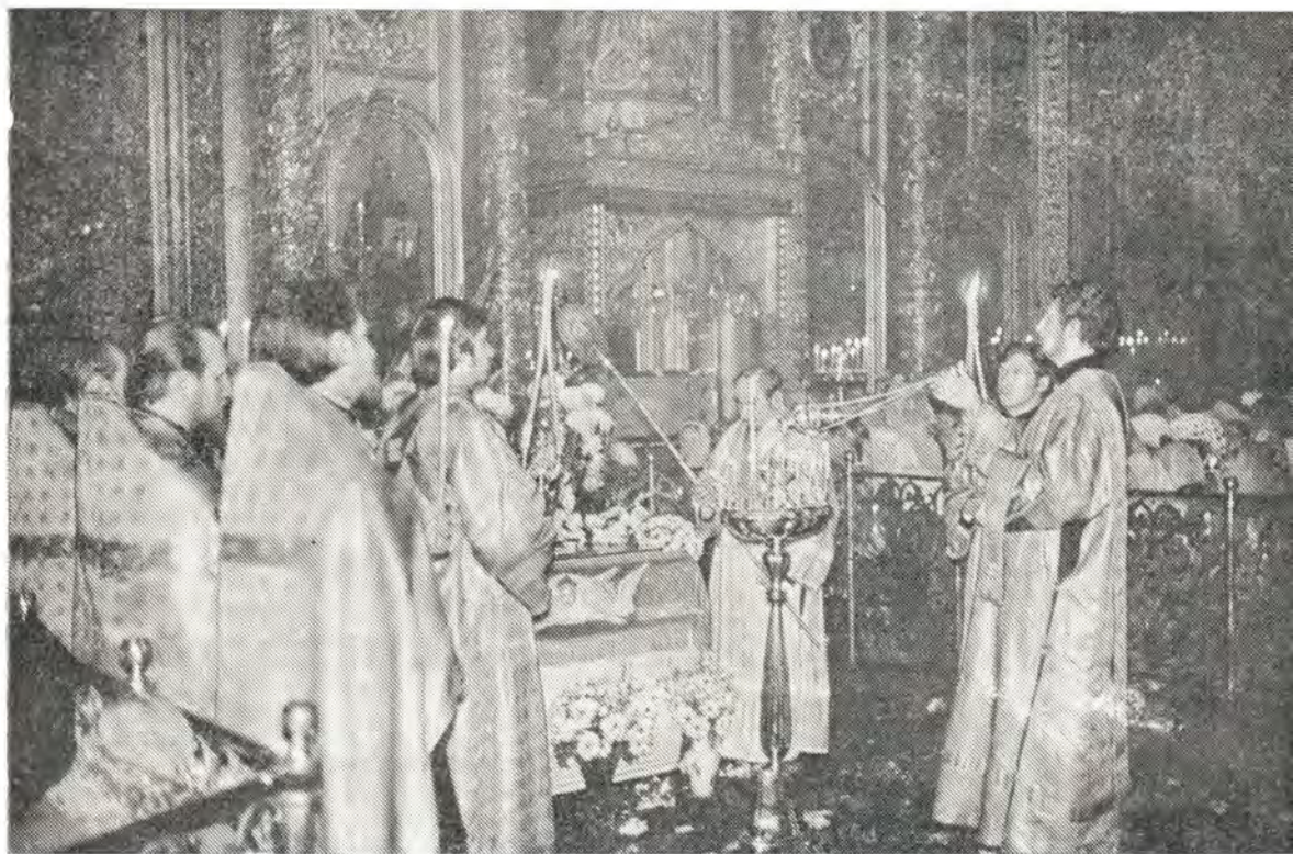
29 августа 1976 года вечером Святейший Патриарх Пимен, по обычаю, совершил в Богоявленском соборе чин погребения

5 сентября (23 августа), в Неделю 12-ю по Пятидесятнице, Святейший Патриарх Пимен совершил Божественную литургию в храме в честь Рождества Христова, что в Измайлове в Москве. За литургией Святейший Патриарх в ознаменование 300-летия храма наградил митрой настоятеля протоиерея Бориса Цепенникова.