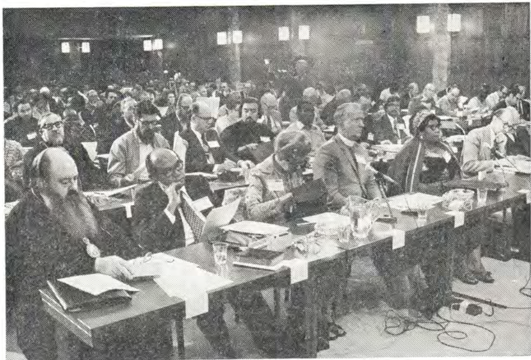
В зале пленарных заседаний. В первом ряду первый слева митрополит Ленинградский и Новгородский Никодим, Патриарший Экзарх Западной Европы, за ним, во втором ряду профессор протопресвитер Виталий Боровой

так называемого «хиринга» («прослушивание»), во время которого были обсуждены два вопроса: 1. приход и его роль в экуменическом движении и 2. поиски более справедливого, демократического, самообеспечивающегося общества.