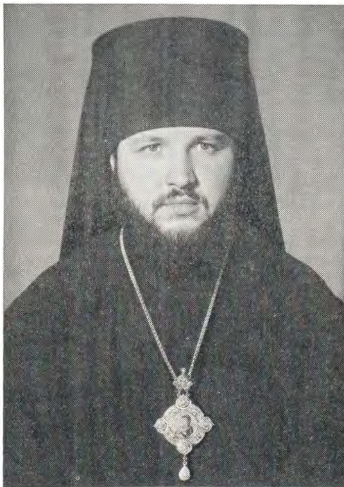
Преосвященный КИРИЛЛ, епископ Выборгский

содержанию служение епископское. Епископ — предстоятель Поместной Церкви, блюститель веры и нравственности, раздаятель благодати Божией, преемник апостолов. Сколь значительно служение это для спасения человеческого, если святой Киприан Карфагенский дерзнул сказать, что Церковь — во епископе и епископ в Церк-