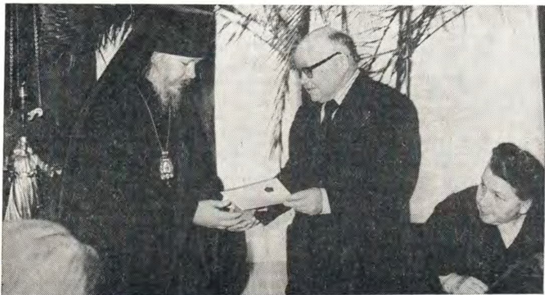
Награждение епископа Куйбышевского и Сызранского Иоанна