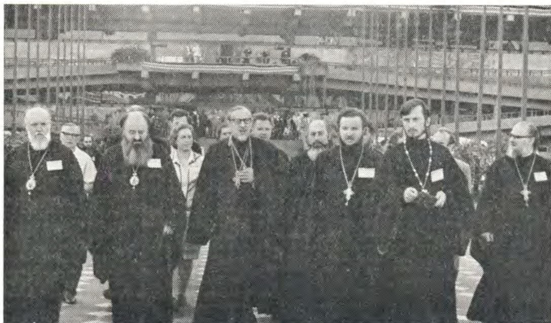
Члены делегации Русской Православной Церкви на V Ассамблее ВСЦ в Найроби