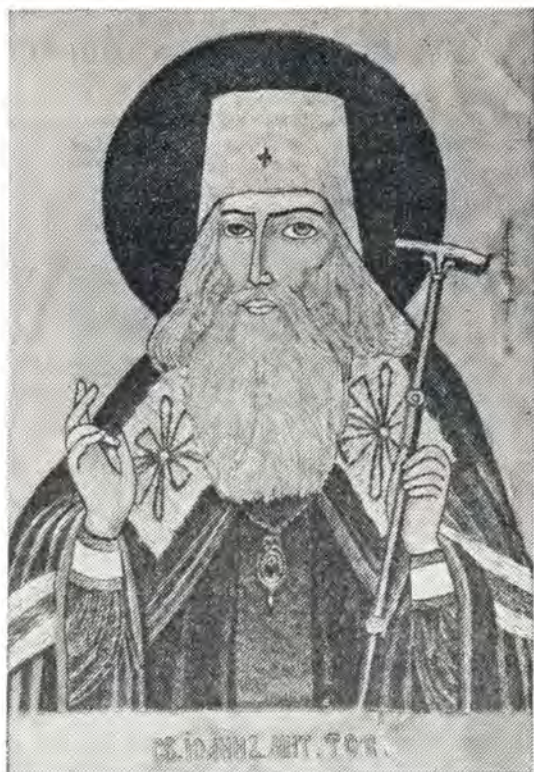
Святитель Иоанн Тобольский

О горе нам! Зачем мы, немощные, дерзаем противиться Богу и добровольно не утвердим нашу волю в Божественной воле? Ибо мы не по одному, но по многим отношениям к Богу принадлежим Ему и должны, хотим ли, или не хотим, подлежать Его власти как своему Создателю, как вдохнувшему в нас душу живу, как обновившему нас, рожденных во грехе первородном, во святом Крещении, в котором умерли мы для греха и ожили со Христом для жизни вечной и блаженной.