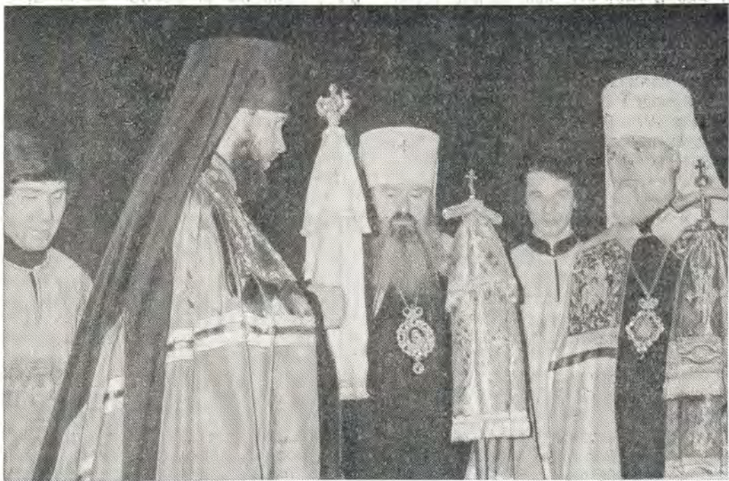
Вручение архиерейского жезла епископу Выборгскому Кириллу. В центре — митрополит Ленинградский и Новгородский Никодим, справа — митрополит Киевский и Галицкий Филарет

неизменно в основах веры и благочестия, но вместе с тем в каждое время необходима открытость к современной жизни, нужно осмысливать и освещать светом веры всё, что происходит в мире. Доброжелательное внимание должно иметь и при наблюдении течения богословской мысли сегодня, отмечая всё новое, доброе, раскрывающее вечную правду, данную откровением Бога для всех народов.