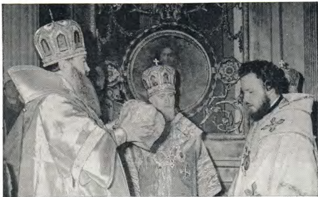
14 марта 1976 года. Митрополит Ленинградский и Новгородский Никодим вручает митру новохиротонисанному епископу Выборгскому Кириллу

копа Выборгского совершили те же Преосвященные архиереи, которые участвовали в наречении, а также архиепископ Дмитровский Владимир.