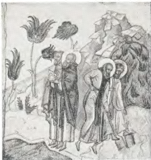
Преподобные Кирилл и Ферапонт у Сиверского озера Фрагмент иконы XVI в.

90 лет, по слову одного из жизнеописателей его, «в маститой старости, исполненный дней и деяний, как великое светило, после долгого летнего дня познавшее запад свой», за год до смерти своего друга и наставника преподобного Кирилла 15 . Вероятнее всего предположить, что преподобный скончался 27 декабря — в этот день в Лужецком монастыре издревле местно совершалась его память 16 , а празднование 27 мая установлено так же, как и празднование костромскому подвижнику преподобному Ферапону Монзенскому (XVI в.) ради тезоименитства со священномучеником Ферапонтом, епископом Сардийским (III в.). Местное почитание Ферапонта Белозерского как святого началось, несомненно, уже в XV веке и, скорее всего, сначала в Белозерском его монастыре. Здесь же около 1547 года было написано общее Житие преподобных Ферапонта и Мартиниана. Возможно, автором жития был белозерский инок Матфей 17 . Письменная и иконописная традиции сохранили некоторые черты внешнего облика преподобного: он был «подобием стар и сед», с довольно длинными, свисающими ниже ушей волосами, с длинной бородой 18 .