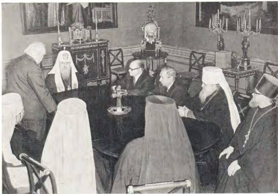
25 марта 1976 года в резиденции Святейшего Патриарха Московского и всея Руси Пимена состоялась вручение Его Святейшеству юбилейной медали Всемирного Совета Мира. Почетный президент ВСМ Н. С. Тихонов поздравляет Святейшего Патриарха