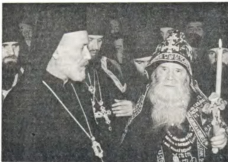
28 сентября 1975 года в Успенском мужском монастыре в Одессе митрополит Калабрийский Емилиан приветствует схиархимандрита Пимена

ком). В конце пения великого славословия старейшие из братии монастыря выходят северными и южными дверями алтаря и направляются в притвор храма, где находится архимандрит Малахия.