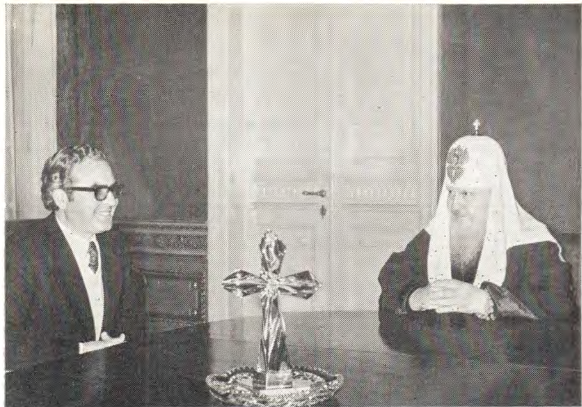
25 марта 1976 года Святейший Патриарх Московский и всея Руси Пимен принял д-ра Андреаса Мицидису, заведующего канцелярией Блаженнейшего Архиепископа Кипрского Макария