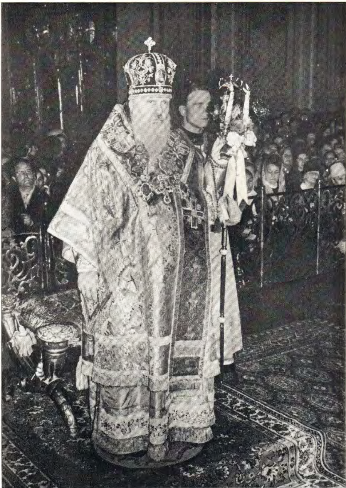
Святейший Патриарх Пимен за богослужением в праздник святой Пасхи в Богоявленском патриаршем соборе в ночь на 25 апреля 1976 года