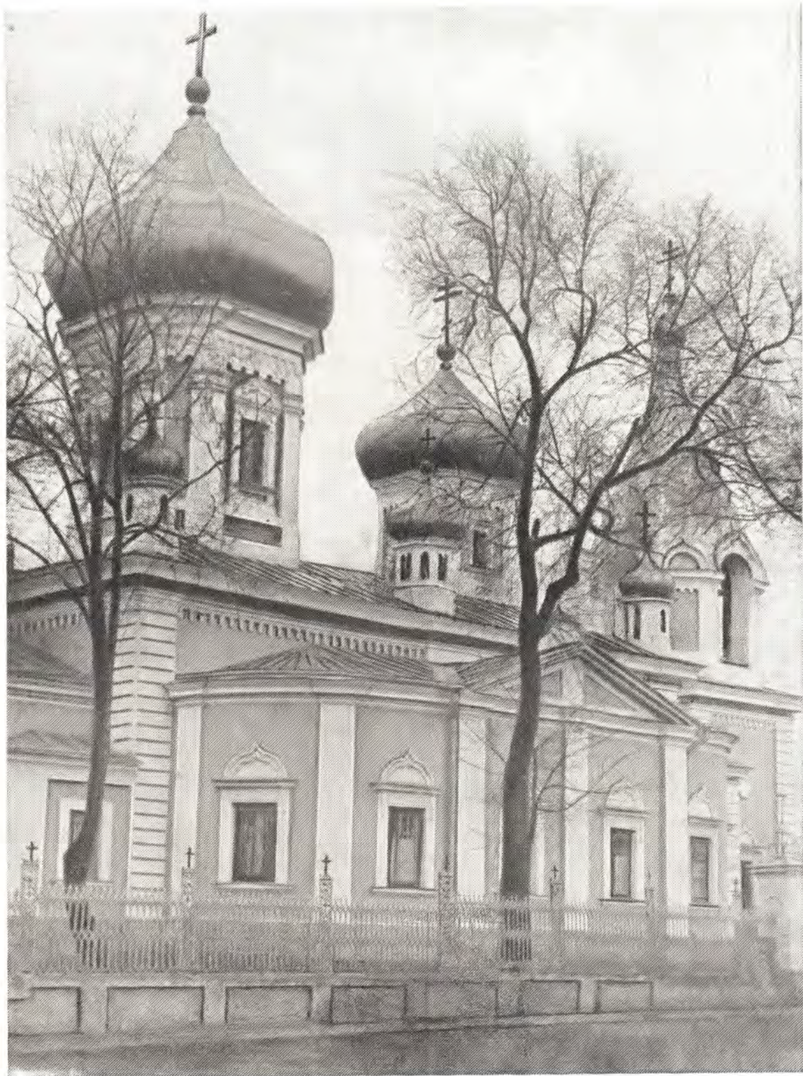
Кафедральный собор во имя святого великомученика Феодора Тирона в г. Кишиневе (с северной стороны) К стр. 15