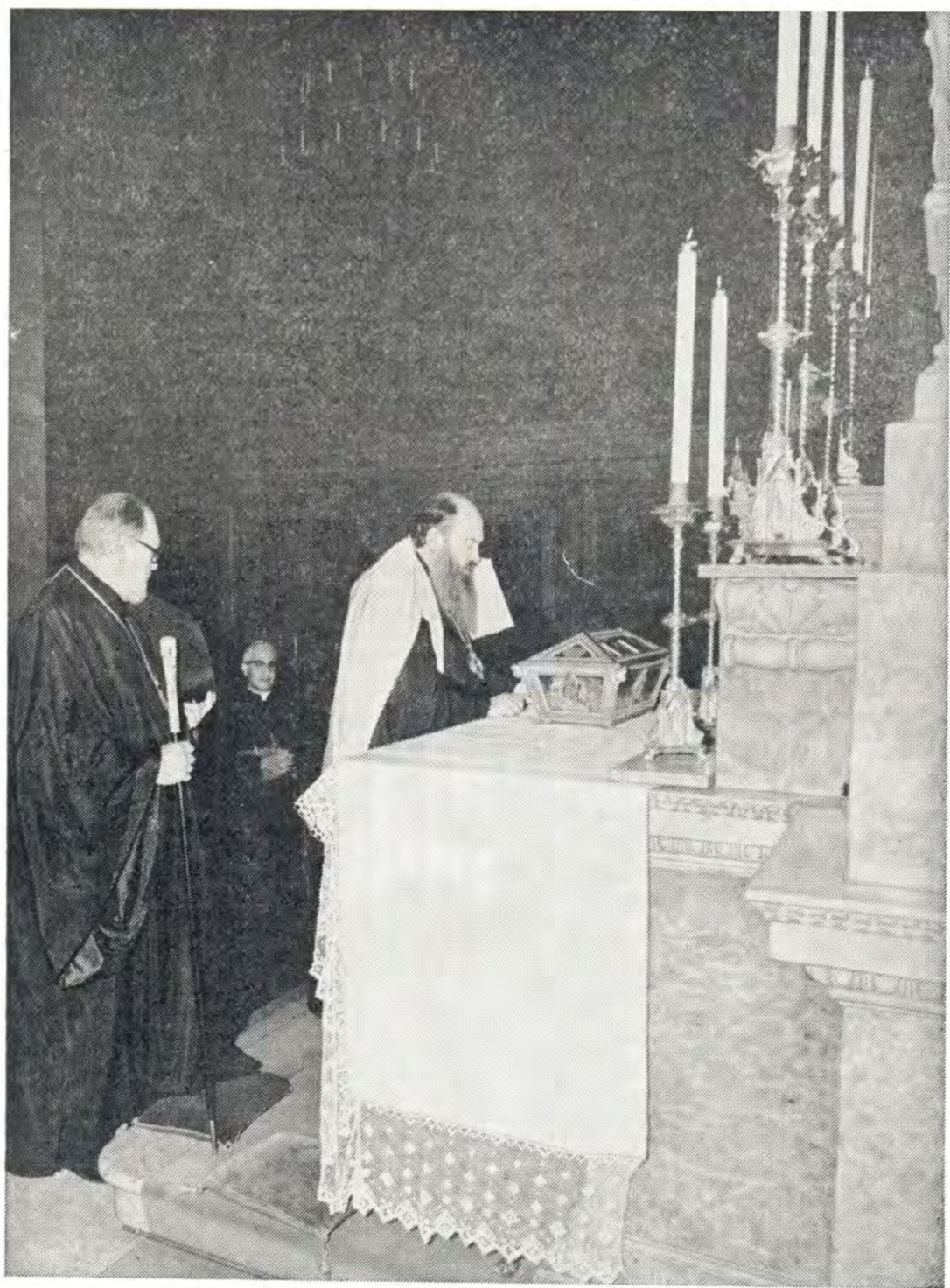
Посещение церкви блаж. Августина, епископа Иппонского (354—430), в г. Павии 16 октября 1975 года. У мощей блаж. Августина. Слева от митрополита Никодима — епископ Павийский Антонио Анджони и епископ Цюрихский Серафим