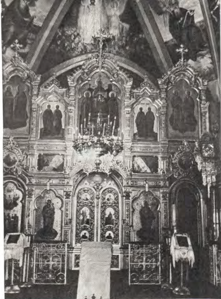
Кишиневский кафедральный собор. Вверху—иконостас главного алтаря; внизу — новый придел в честь Покрова Пресвятой Богородицы