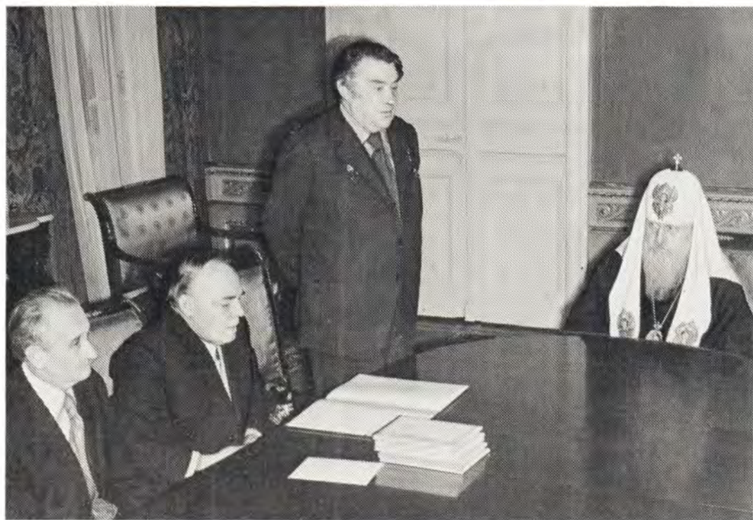
19 февраля 1976 года при вручении памятных подарков Советского Фонда мира Святейшему Патриарху Московскому и всея Руси Пимену и постоянным членам Священного Синода. На фото справа налево: Святейший Патриарх Пимен, председатель Советского Фонда мира Б. Н. Полевой, секретарь Фонда Л. Г. Никонов и сотрудник Фонда Г. Т. Дроздов