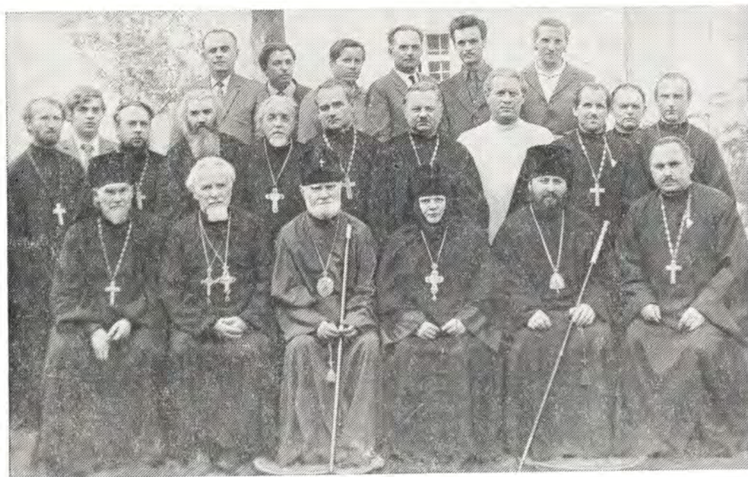
После богослужения в монастырском храме Корецкой женской обители 9 августа 1975 года. В центре: архиепископ Дамиан, настоятельница монастыря игумения Наталия, епископ Иринея

был пропет антифонно — духовенством и двумя иноческими хорами — акафист святым мученикам Адриану и Наталии.