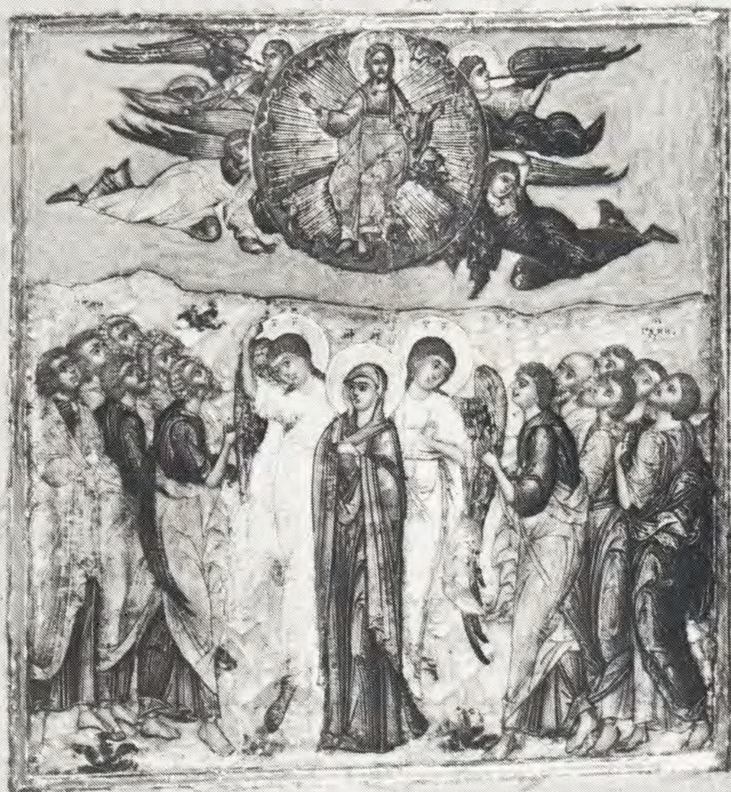
«ВОЗНЕСЕНИЕ ГОСПОДА НАШЕГО ИИСУСА ХРИСТА» Икона из собрания ЦАК МДА