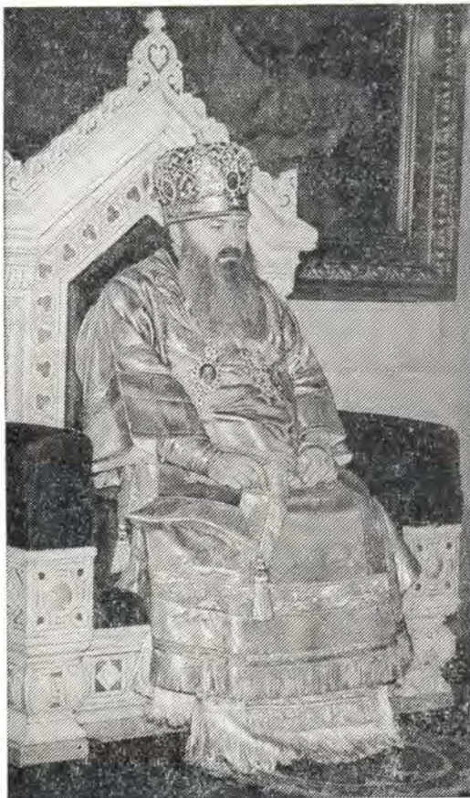
Митрополит Никодим за Божественной литургией в Свято-Троицком соборе Александро-Невской Лавры в Ленинграде

Вечером того же дня в кафедральном соборе Патриарший Экзарх Украины совершил вечерню в сослужении клириков города Киева и епархии. Было оглашено Рождественское послание Патриаршего Экзарха Украины архипастырям, пастырям, честному иночеству и всем верным чадам Украинского Экзархата Московского Патриархата. Затем епископ Варлаам от имени клира и мирян поздравил митрополита Филарета с праздником Рождества