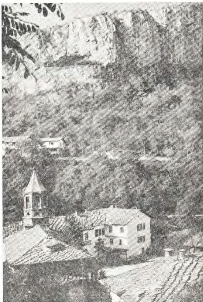
Дрянновский монастырь. Современные постройки XIX в.

Востали болгары в Панагюрище, Батаке, Клисуре, Бане, Стрелче, Севлиеве, Габрове и других местах. Плохо вооруженные отряды