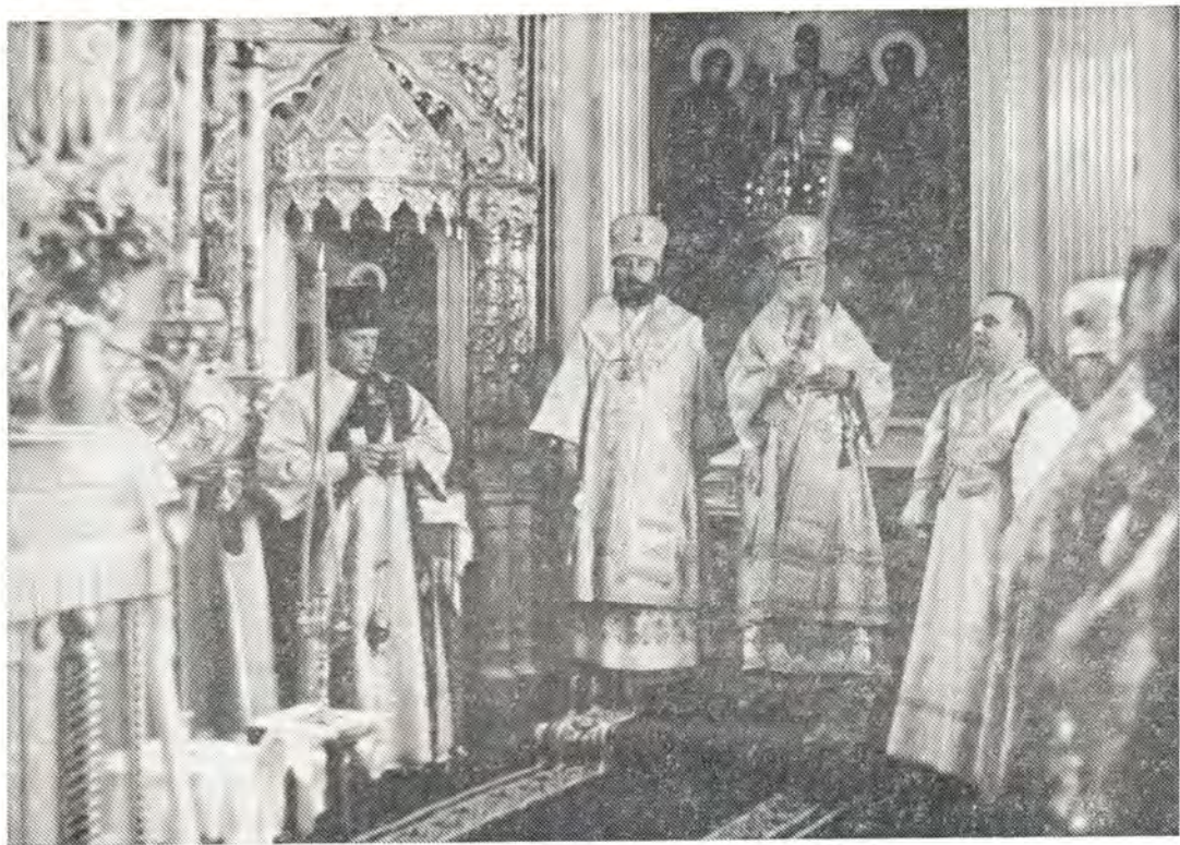
Архиепископ Волинский Дамиан и епископ Уфимский Иринея за богослужением в Корецком женском монастыре 9 августа 1975 года

Христова. Были возглашены уставные многолетия, после чего Владыка митрополит принимал праздничные поздравления от духовенства и православных киевлян и преподавал им благословение. В это время митрополитий хор исполнял рождественские колядки.