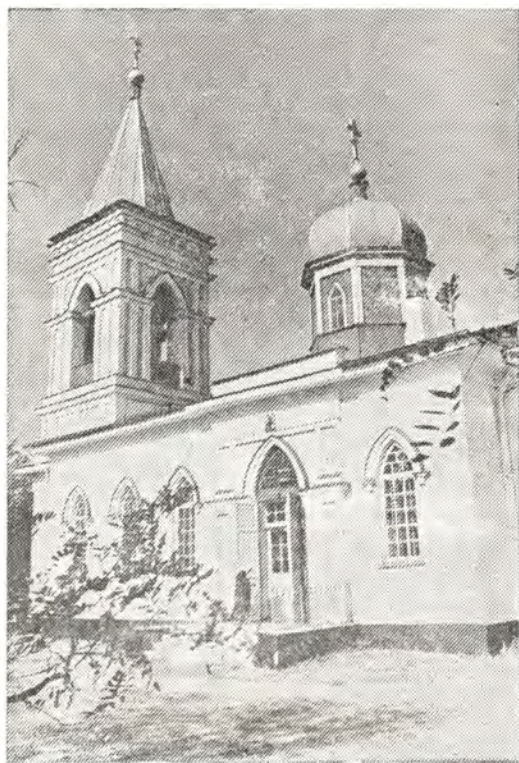
Свято-Николаевская церковь в поселке Игрень Днепропетровской епархии