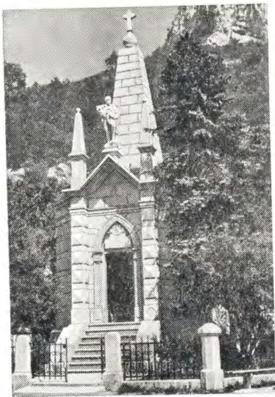
Дряновский монастырь. Усыпальница павших в апрельском восстании

Так организаторы начали подготовку восстания. Особенно оживились тогда потайные дорожки Средней горы. Под навесами скрытно мускулистые руки ковали несложные орудия, называемые по-болгарски «черешевы топчета». Юнаки собирали для них гирь от весов (гюллета), отливали свинцовые пули. Женщины приготавливали сухари, вязали чулки для повстанцев. Панагюрская учительница