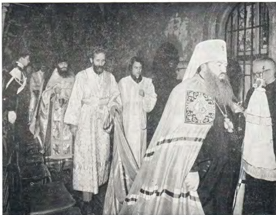
В храме Русской Православной Церкви во имя Святителя Николая в Милане митрополит Ленинградский и Новгородский Никодим возглавил Божественную литургию в праздник Покрова Божией Матери 14 октября 1975 года