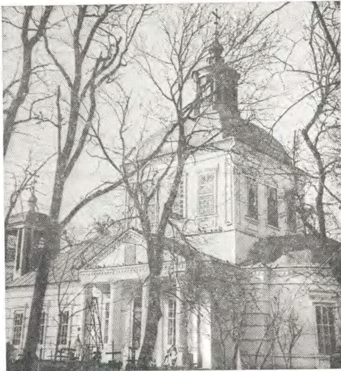
Скорбященский храм в г. Мичуринске Тамбовской епархии