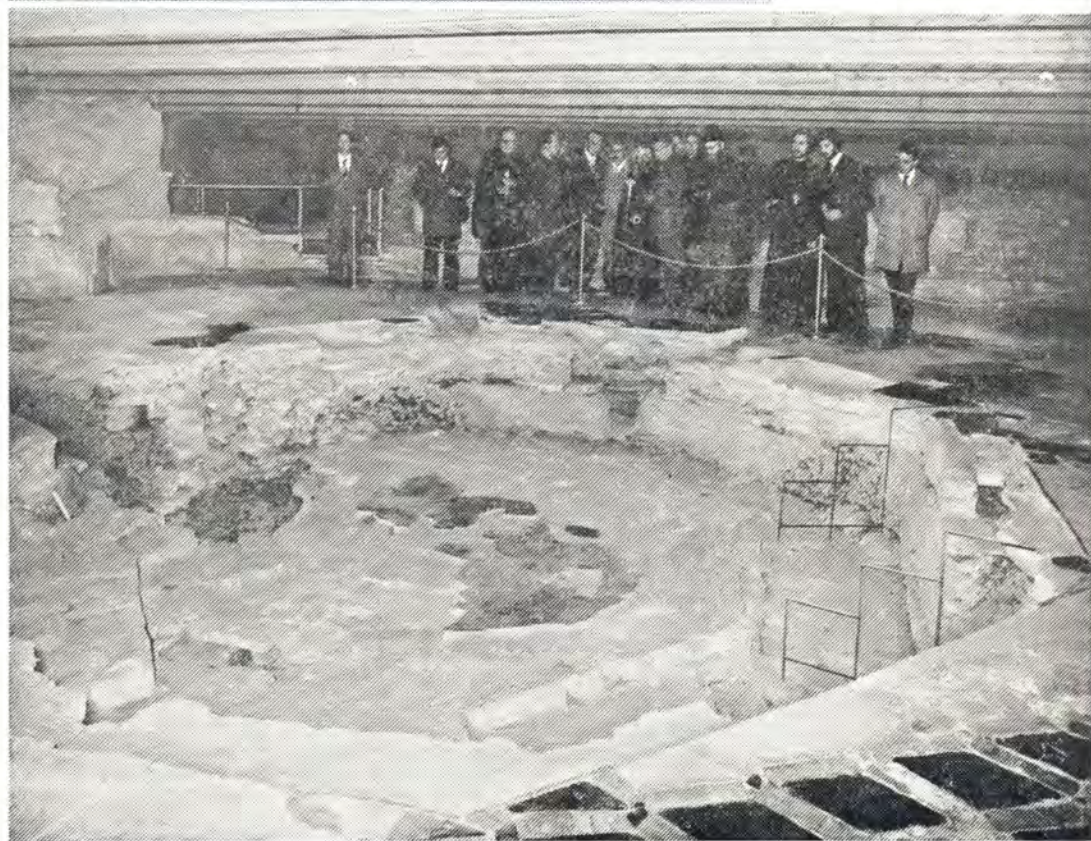
Внизу: осмотр остатков баптистерия св. Амвросия Медиоланского в крипте Миланского кафедрального собора