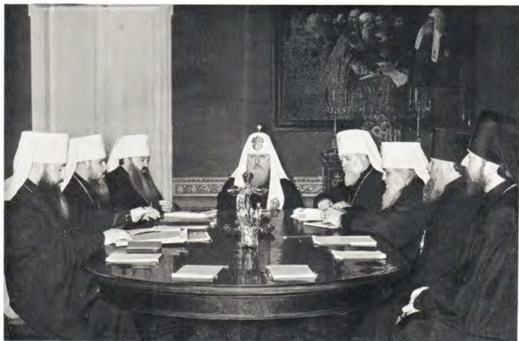
Заседание Священного Синода Русской Православной Церкви 3 марта 1976 года