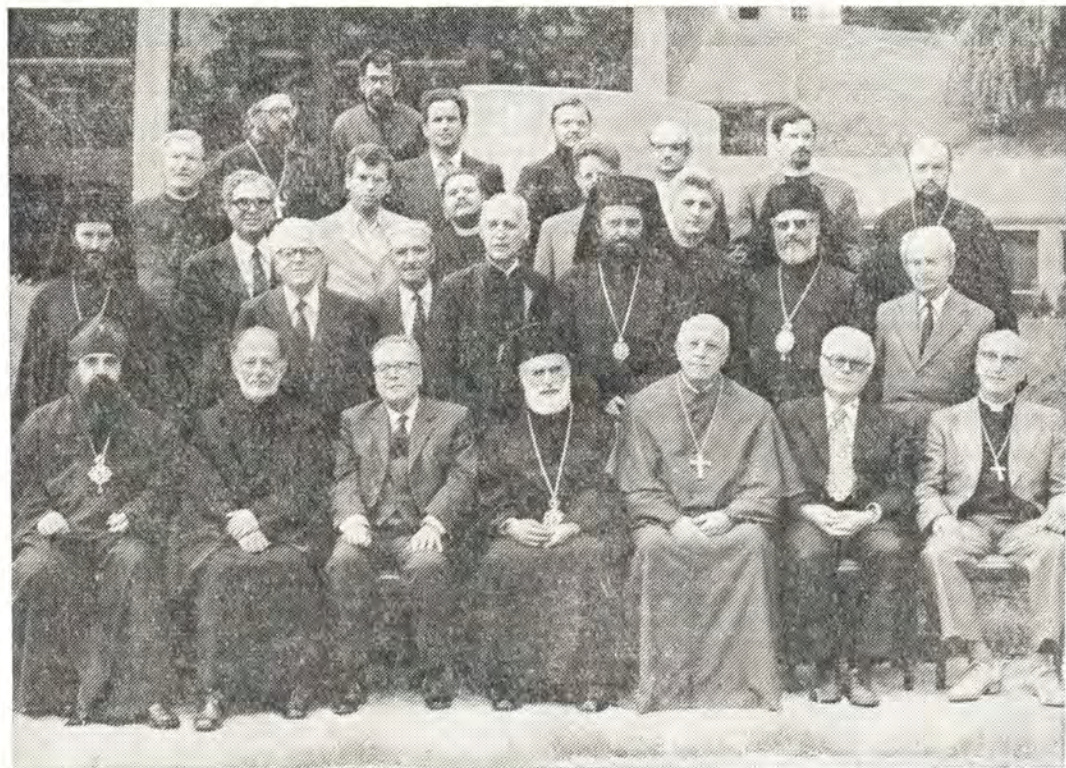
Участники заседания православно-старокатолической Богословской комиссии в Женеве, август 1975 года