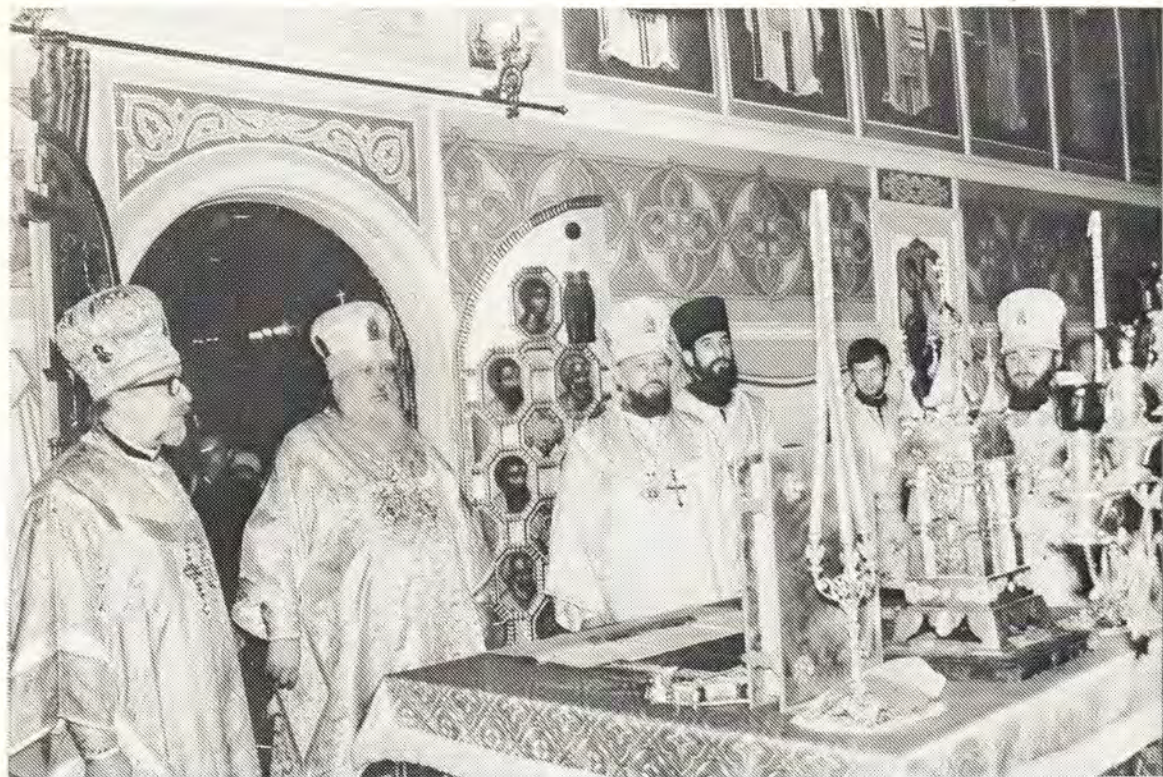
14 октября 1975 года, праздник Покрова Пресвятой Богородицы. За Божественной литургией в Покровском храме Московской духовной академии, слева направо: митрополит Гельсингфорский Иоанн (Финляндская Автономная Православная Церковь), Святейший Патриарх Пимен, ректор архиепископ Дмитровский Владимир