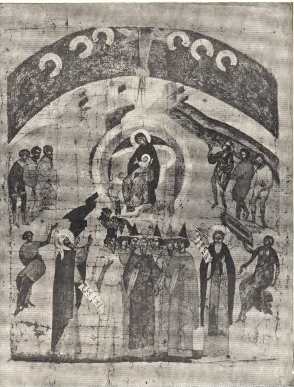
«СОБОР ПРЕСВЯТОЙ БОГОРОДИЦЫ» («Похвала Пресвятой Богородицы») Икона ростово-суздальских писем, XV век