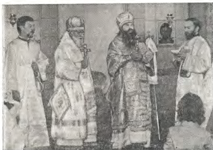
Отпуст Божественной литургии. Слева направо: иеродиакон Марк, архиепископ Дюссельдорфский Алексий, митрополит Берлинский и Среднеевропейский Филарет, иеродиакон Илья (Сербская Церковь)

дача нового центра. Ввиду того, что кардинал Иозеф Хёффнер прибыть не смог, от его имени слово произнес прелат д-р Вильгельм Ниссен. Он подчеркнул значение православного присутствия среди Церквей Запада, что является также духовной помощью этим Церквям в их трудах. Во многом Православная Церковь, благодаря большей близости к древнему христианству, сохранила духовный опыт, которого западным конфессиям иногда остро недостает и который они здесь могут вновь обрести. От Германской Католической епископской конференции выступил замещающий епископа Регенсбургского Рудольфа Грабера секретарь Экуменической комиссии (Отдел Церквей Востока) монсеньор д-р Альберт Раух. Он выразил пожелания благословенного будущего этому дому в его служении христианскому единству и укреплению русского Православия