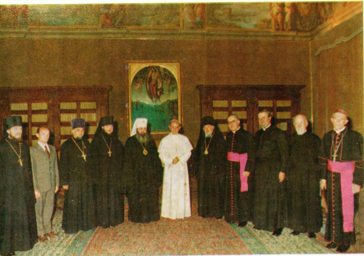
Делегация Русской Православной Церкви во главе с Патриаршим Экзархом Западной Европы митрополитом Ленинградским и Новгородским Никодимом, участвовавшая в богословском собеседовании с представителями Римско-Католической Церкви в Тренто, Италия, на приеме у Его Святейшества Папы Павла VI 3 июля 1975 года