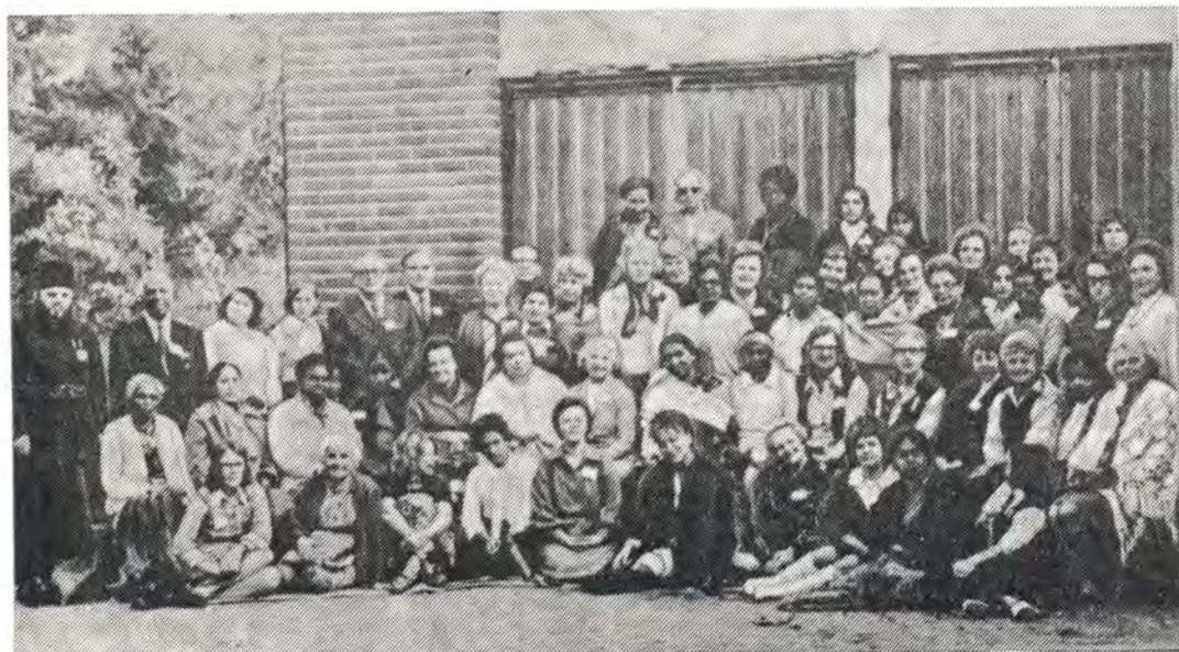
Участники Конференции женщин ХМК в Хаухо, Финляндия, в сентябре 1975 года. Сообщение о конференции опубликовано в «ЖМП», 1975, № 12, с. 47

Однако многие социальные и бытовые особенности древнерусской жизни препятствовали выработке собственного национального идеала женской святости. «Известная социальная приниженность русской женщины, особенно в московский период, очевидно сказалась и в духовной жизни» 1 . Именно этим прежде всего можно объяснить, что среди 381 канонизованных русских святых только около двенадцати женщин. Женская святость на Руси распространялась скорее вширь, чем ввысь. Она создавала ту среду благочестия и чистоты, благотворно укреплявшую семью, из которых вышли наши подвижники. Образы таких матерей проходят через всю русскую церковную историю. Упоминание о благочестивых родителях святых, помещаемое в большинстве житий, надо рассматривать не столько как традиционный агиографический прием, но за этими скудными информацией строками надо видеть глубоко исторически обоснованную реальность, без которой остались бы непонятными и необъяснимыми многие черты характера в обликах наших русских святых. Достаточно вспомнить жития преподобных Стефана Пермского, Сергия Радонежского, Серафима Саровского. Многих русских женщин, пробившихся к свету Христову в самых тяжелых исторических обстоятельствах, можно сравнить с евангельской бедной вдовой, положившей две монетки в сокровищницу храма, о которой Спаситель сказал: «Истинно говорю вам,