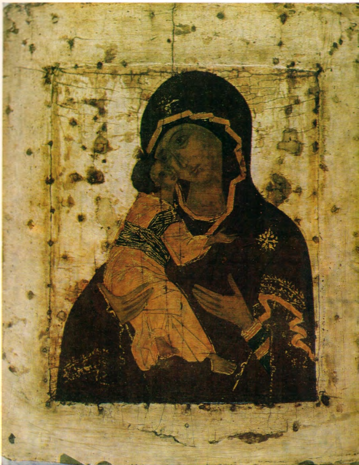
ВЛАДИМИРСКАЯ ИКОНА БОЖИЕЙ МАТЕРИ, XV в.