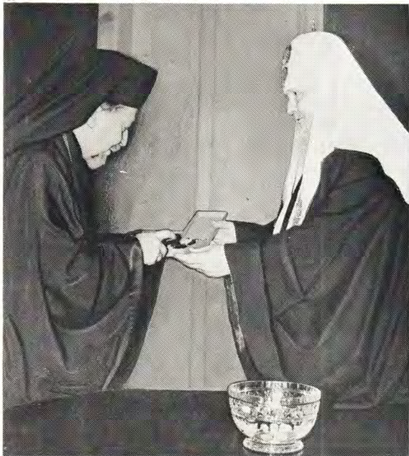
20 октября 1975 года Святейший Патриарх Московский и всея Руси Пимен принял митрополита Гельсингфорского Иоанна [Финляндская Автономная Церковь] и сопровождавших его правительственного советника из министерства просвещения, докладчика по делам Финляндской Православной Церкви Лаури Кярвяя, священника Андрея Карпова и диакона Виктора Порокару. На фото слева: Святейший Патриарх Пимен вручает митрополиту Иоанну панацию.