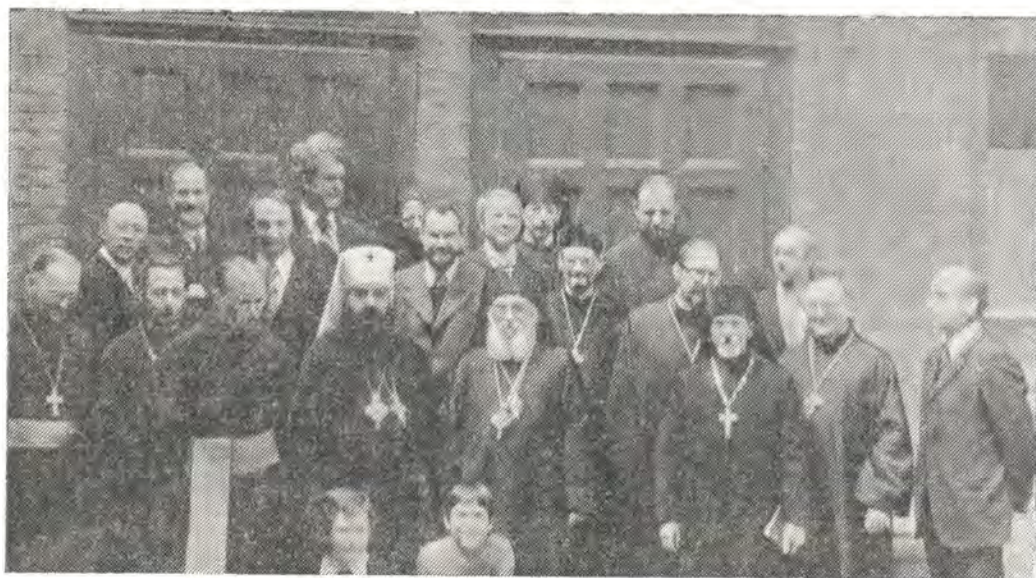
Иерархи, клирики и миряне у входа в храм по окончании Божественной литургии