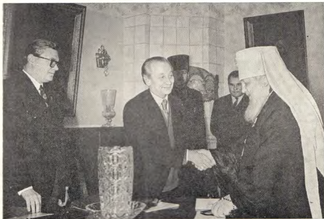
Вручение почетной медали Советского Фонда мира митрополиту Крутицкому и Коломенскому Серафиму 28 октября 1975 года