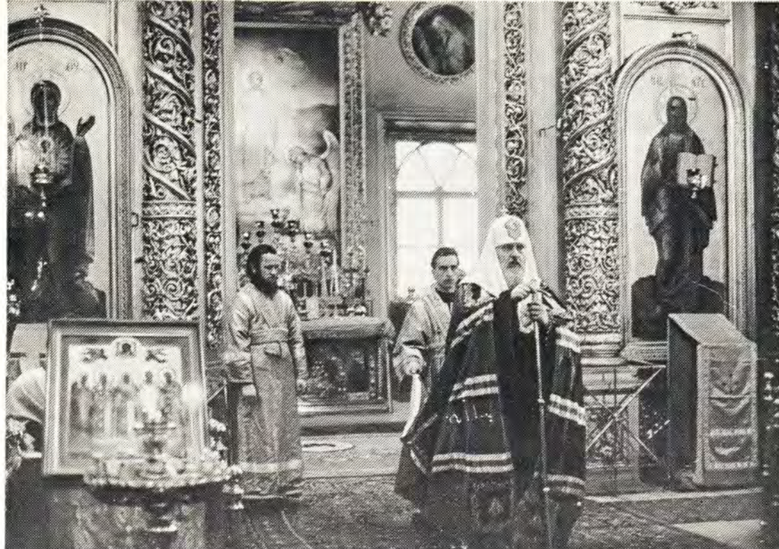
Праздник в честь святителей Московских Петра, Алексия, Ионы, Филиппа и Ермогена, 18 октября 1975 года. Святейший Патриарх Пимен по окончании Божественной литургии поздравляет с праздником прихожан Богоявленского патриаршего собора