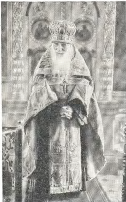
Протоиерей Тихон Пелих

29 августа, в праздник Перенесения Нерукотворного образа Господа нашего Иисуса Христа, митрополит Филарет в сослужении