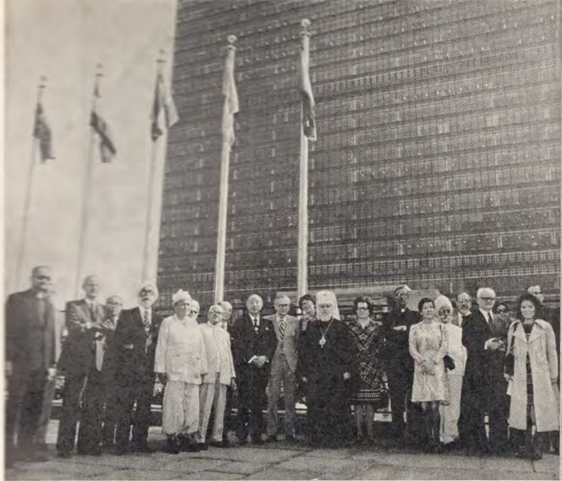
Участники заседания Совета директоров Всемирной Конференции «Религия и мир» перед зданием ООН в Нью-Йорке