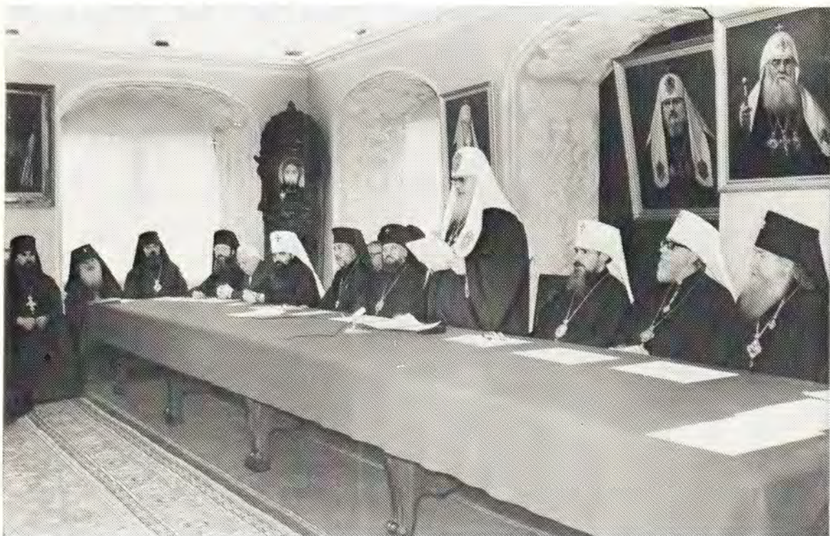
На годовичном акте в Московской духовной академии Святейший Патриарх Пимен произносит приветственное слово (см. стр. 13).