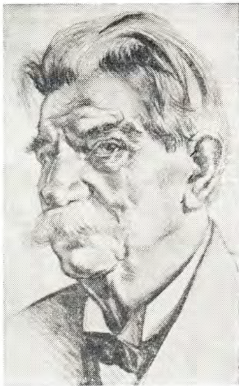
Д-р Альберт Швейцер

27 дней длилось плавание А. Швейцера с супругой в Африку. Наконец, они прибыли в город Центральной Африки Ламбарену (находится в Габонской Республике; население более 500 тысяч человек, по данным 1970 года). Здесь, недалеко от реки Огове, он на свои средства и отчасти собственными руками построил госпиталь для прокаженных. Этот гос-