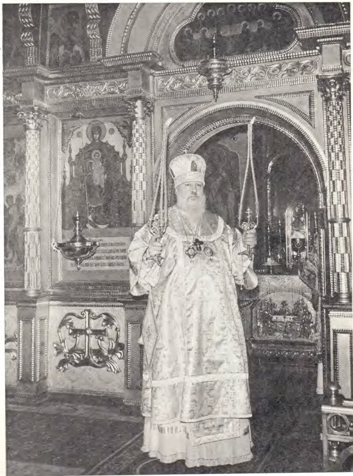
Святейший Патриарх Пимен за Божественной литургией в Покровском храме Московской духовной академии 14 октября 1974 года К статье на с. 17