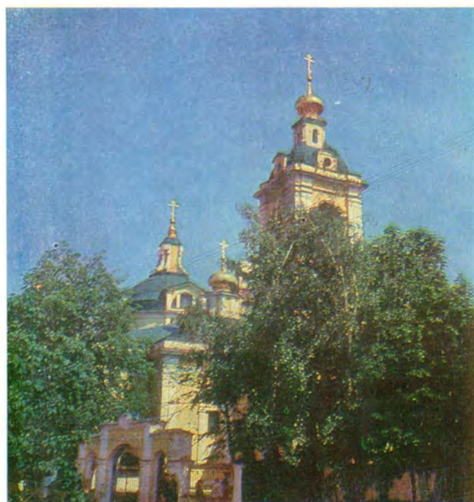
Николо-Кузнецкий храм в Москве с северо-запада