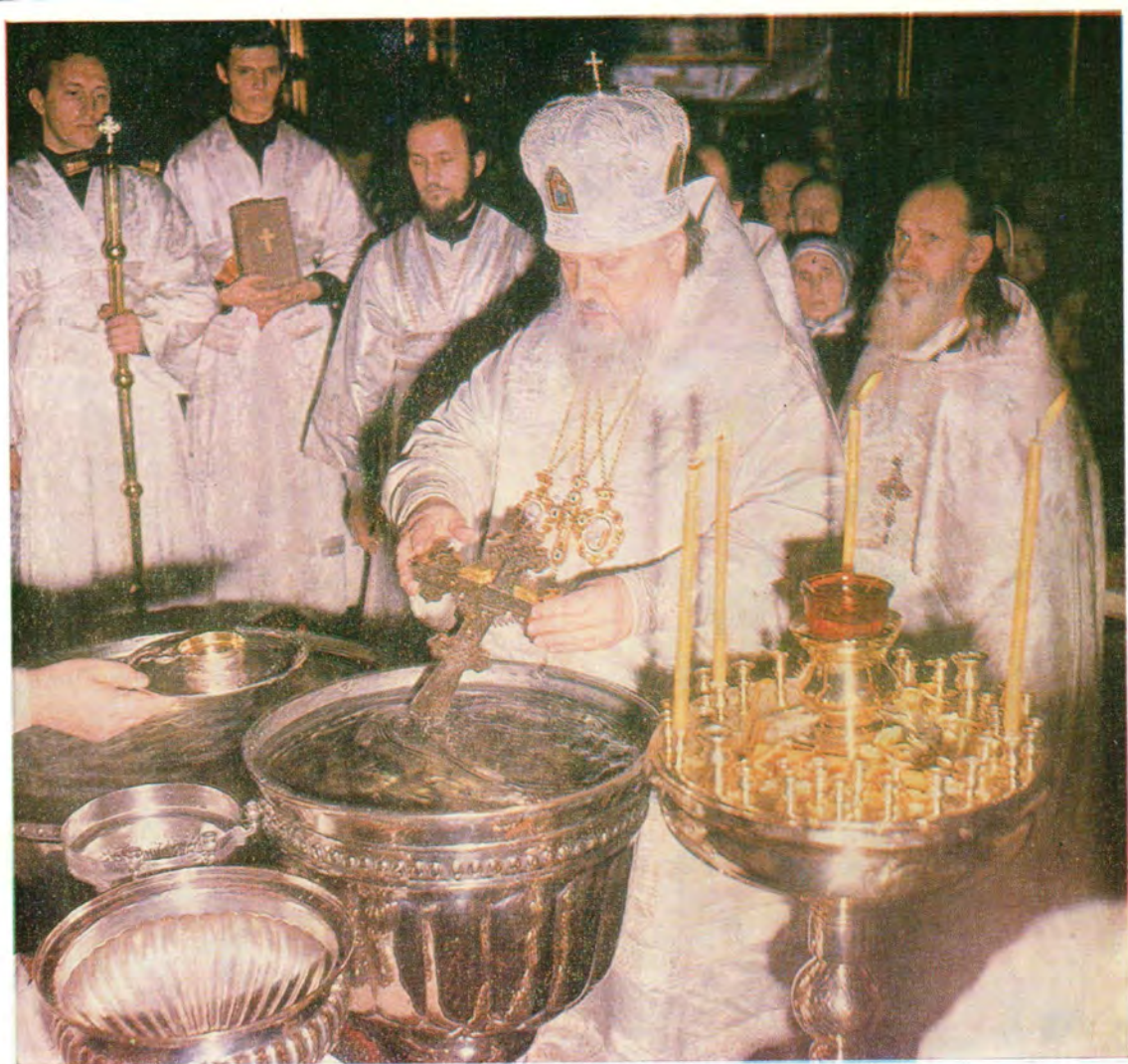
Святейший Патриарх Пимен совершает в Богоявленском патриаршем соборе великое освящение воды в Крещенский сочельник