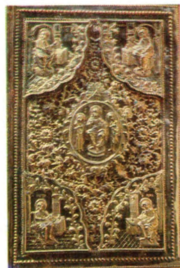
Напрестольное Евангелие из Николо-Кузнецкого храма