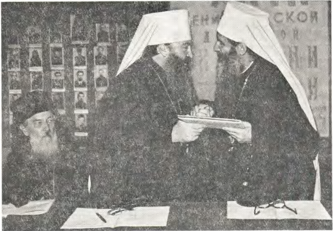
Митрополит Ленинградский и Новгородский Никодим поздравляет Святейшего Патриарха Сербского Германа с присвоением звания почетного члена Ленинградской духовной академии и вручает ему диплом