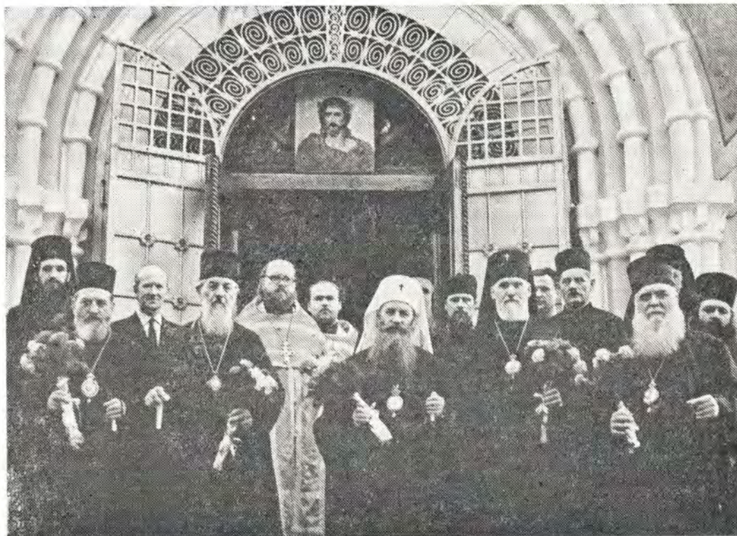
Делегация Сербской Православной Церкви во главе со Святейшим Патриархом Германом у входа в Воскресенский храм в Сокольниках в Москве

Отвечая на приветствие, Святейший Патриарх Герман поблагодарил Святейшего Патриарха Пимена за поднесенную им икону и затем, обратившись к молящимся в храме, сказал о том, что одна ветвь спустившихся с Карпат славян стала называться сербами, о том, как среди этого народа воссияло христианство и какую огромную роль в распространении Православия и внутреннем умиротворении играл Архиепископ Печский святой Савва. Затем наступили черные дни многовекового порабощения, когда, подавив героическое сопротивление возглавлявшихся князем Лазарем сербов, «безбожные агаряне» захватили страну. И в то тяжелое время единственными светочами были монастыри и храмы. Поработители делали всё, чтобы подавить в сербском народе национальное самосознание: они даже сожгли мощи святого Саввы. Но Сербская Церковь стояла на страже национальных интересов и через веру спасла нацию от духовной гибели. И в течение всего этого трудного времени сербский православный народ с надеждой взирал на единокровный и единоверный русский народ, ожидая от него помощи. И русский народ великодушно эту помощь оказывал не только в политическом и