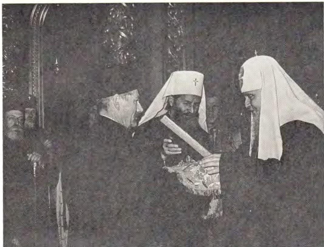
В Богоявленском патриаршем соборе в Москве 6 октября 1974 года. Святейший Патриарх Сербский Герман преподносит икону Божией Матери Святейшему Патриарху Пимену