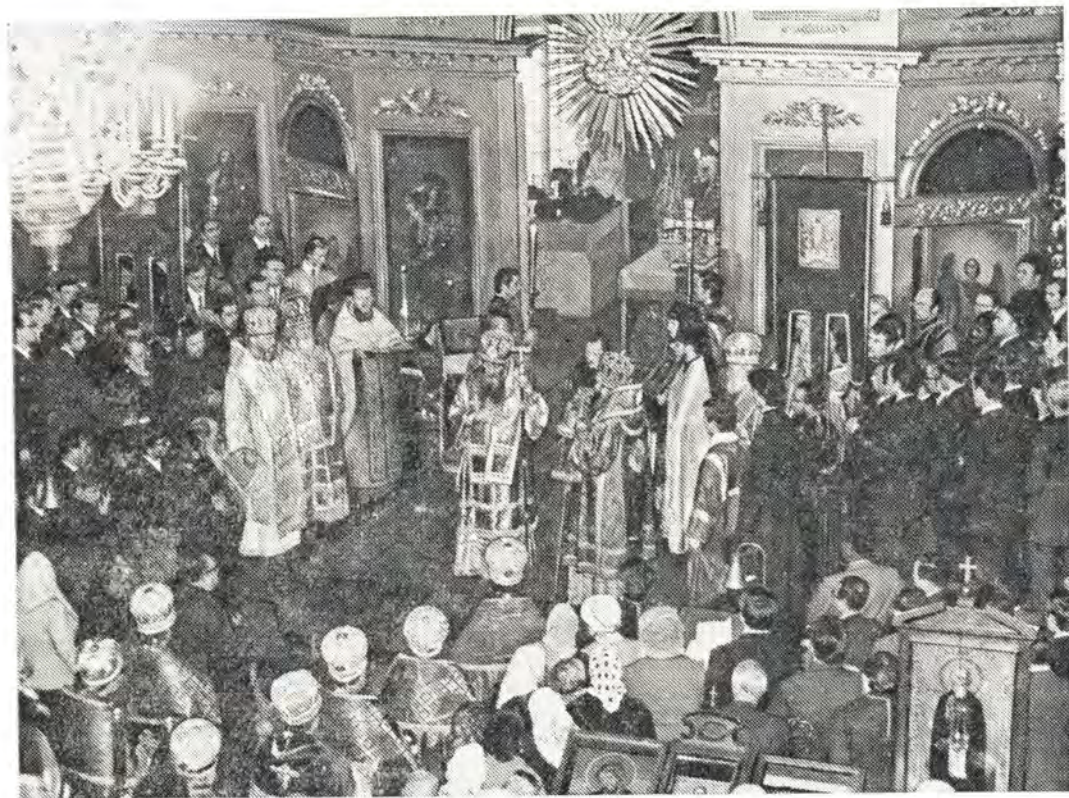
Святейший Патриарх Сербский Герман в храме Ленинградской духовной академии