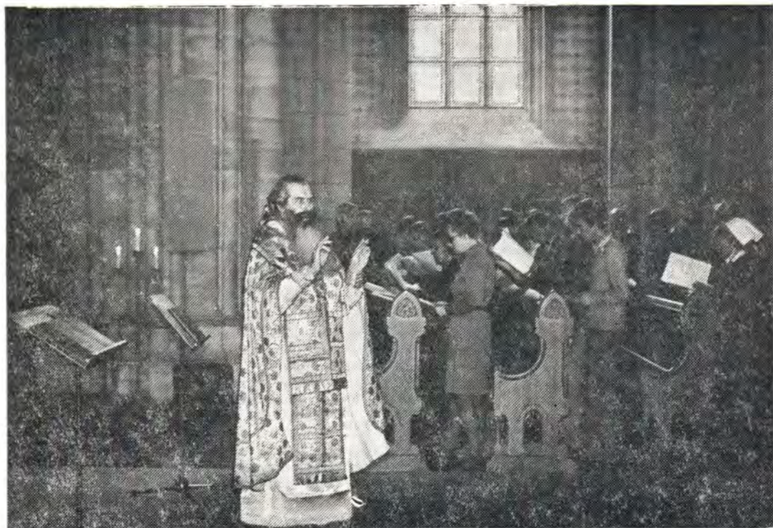
Архиепископ Волоколамский Питирим совершает Божественную литургию в кафедральном соборе г. Уссала

4 и 5 сентября архиепископ Питирим по приглашению профессора д-ра К. Нормана посетил Богословский факультет Лундского университета и выступил в собрании Богословской ассоциации Лунда с информацией о жизни