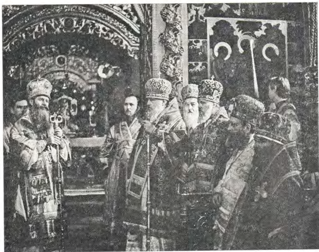
8 октября 1974 года. Святейший Патриарх Сербский Герман отвечает на приветствие Святейшего Патриарха Пимена после Божественной литургии в Успенском соборе Троице-Сергиевой Лавры

государственном плане. Огромное значение имела церковно-просветительная помощь из России. И теперь едва ли найдется сербский православный храм, в котором не было бы книг, напечатанных в Москве или Киеве, не было бы русских предметов церковной утвари или облачений. После освобождения страны эта помощь оказывалась и далее. Россия широко открыла для сербов двери своих учебных заведений, как духовных, так и светских. В заключение Патриарх Герман призвал молящихся хранить верность Святой Православной Церкви, во всяком деле полагаться на всемогущество Божие и делиться с ближними своим духовным опытом.