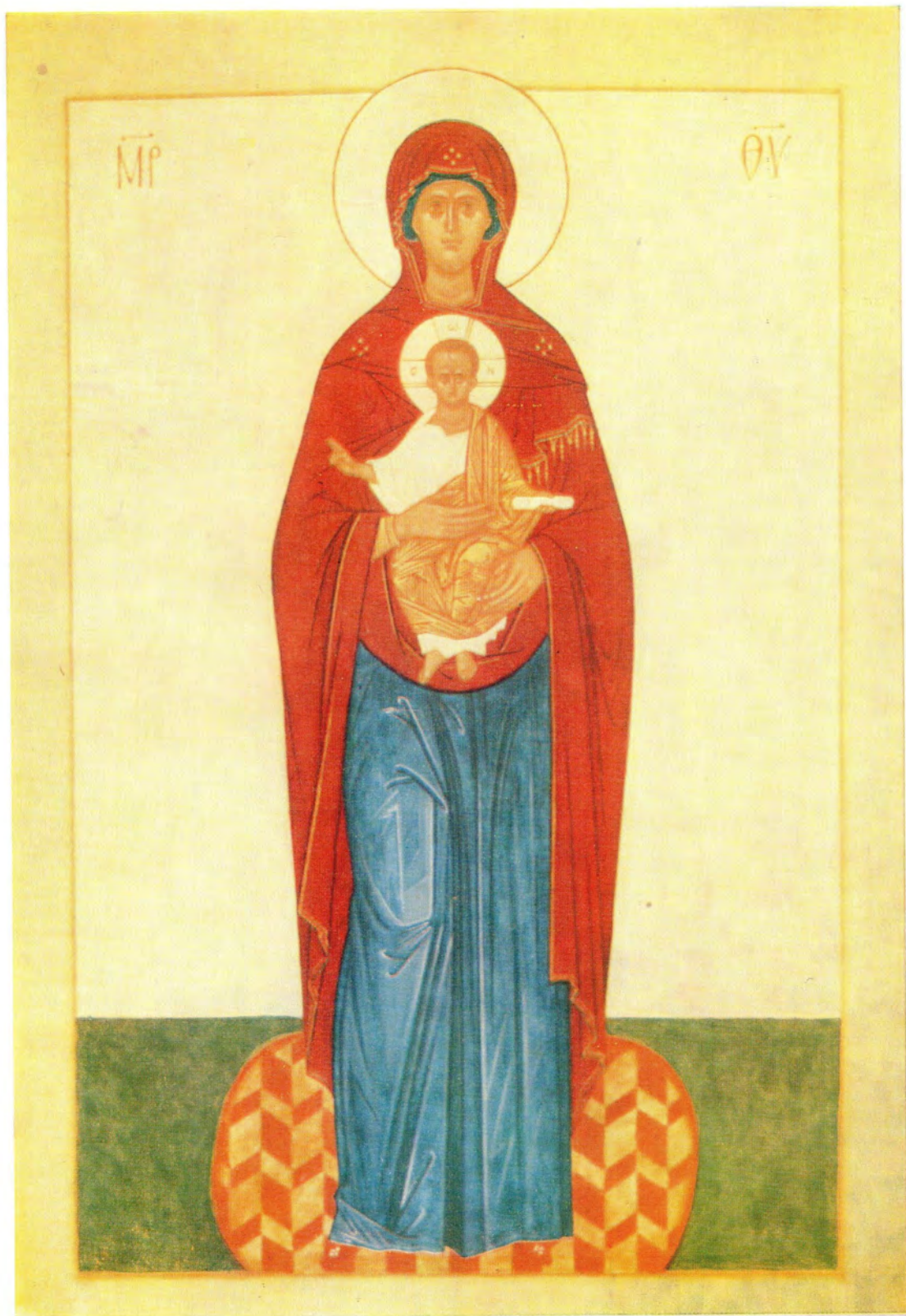
ВАЛААМСКАЯ ИКОНА БОЖИЕЙ МАТЕРИ