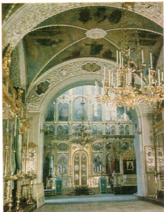
Вид на главный алтарь из трапезной