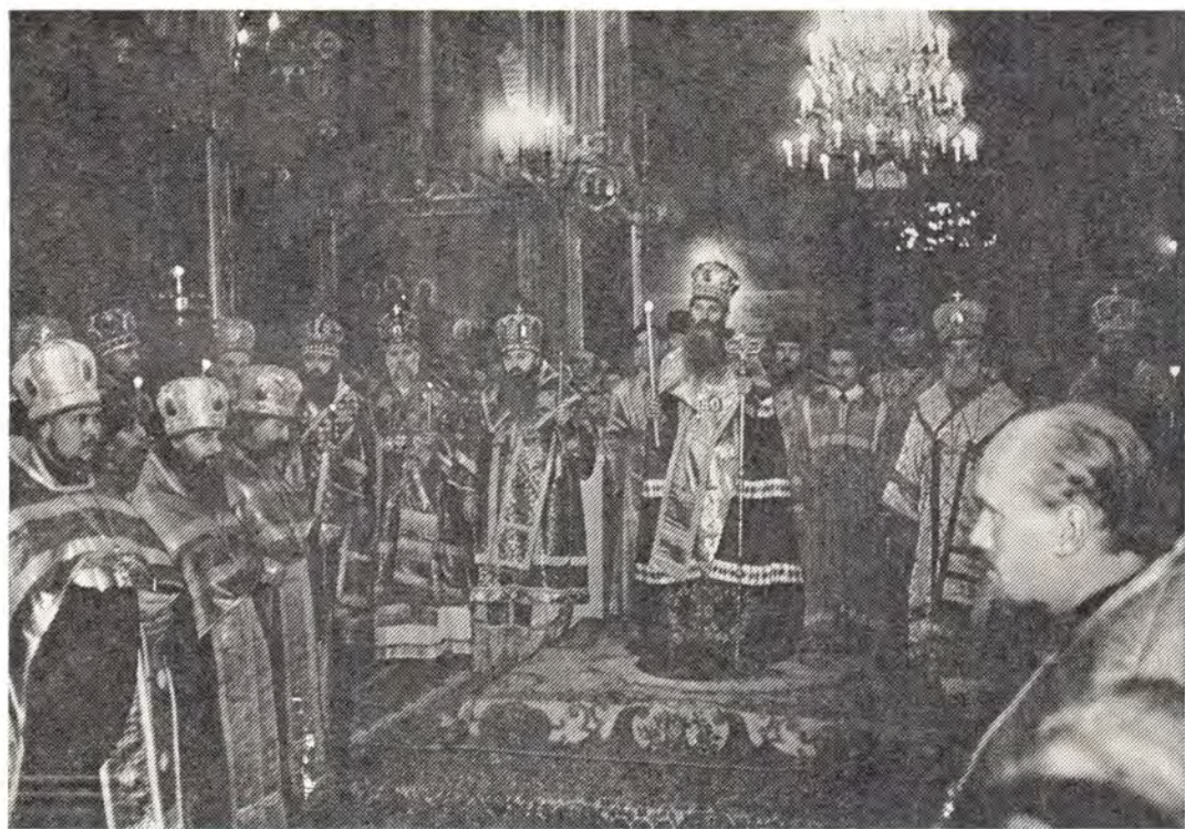
Святейший Патриарх Сербский Герман за всеобщим бдением в Успенском соборе Троице-Сергиевой Лавры 7 октября 1974 года, в канун дня памяти Преподобного Сергия Радонежского