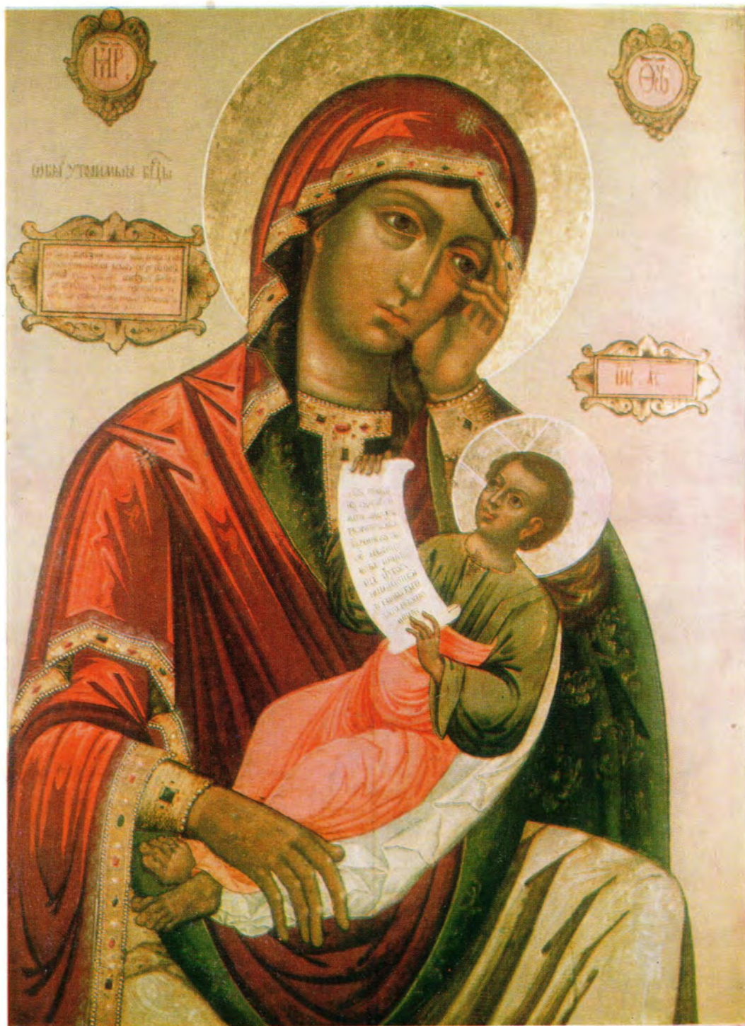
ИКОНА БОЖИЕЙ МАТЕРИ «УТОЛИ МОЯ ПЕЧАЛИ»