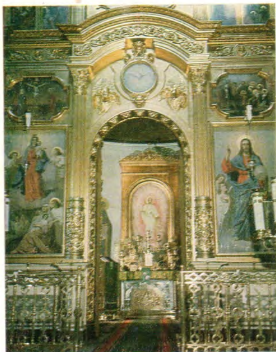
Главный алтарь во имя Святителя и Чудотворца Николая