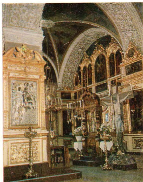
Введенский придел, в глубине — киот с иконой Божией Матери «Утоли моя печали», слева на столпе — Боголюбская икона Богоматери. На фото справа — лепные украшения арок западного нефа в трапезной части храма.