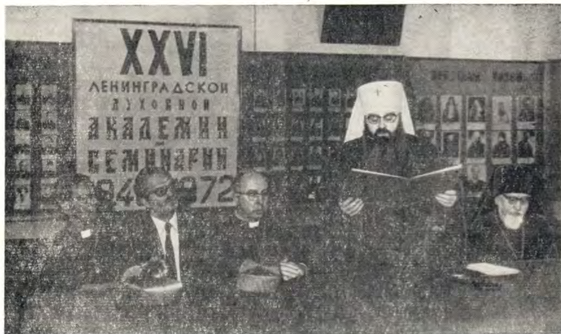
Митрополит Никодим оглашает диплом Совета ЛДА о присуждении кардиналу Иоанну Виллебрандсу степени доктора богословия honoris causa на выпускном акте ЛДА 10 июня 1973 года