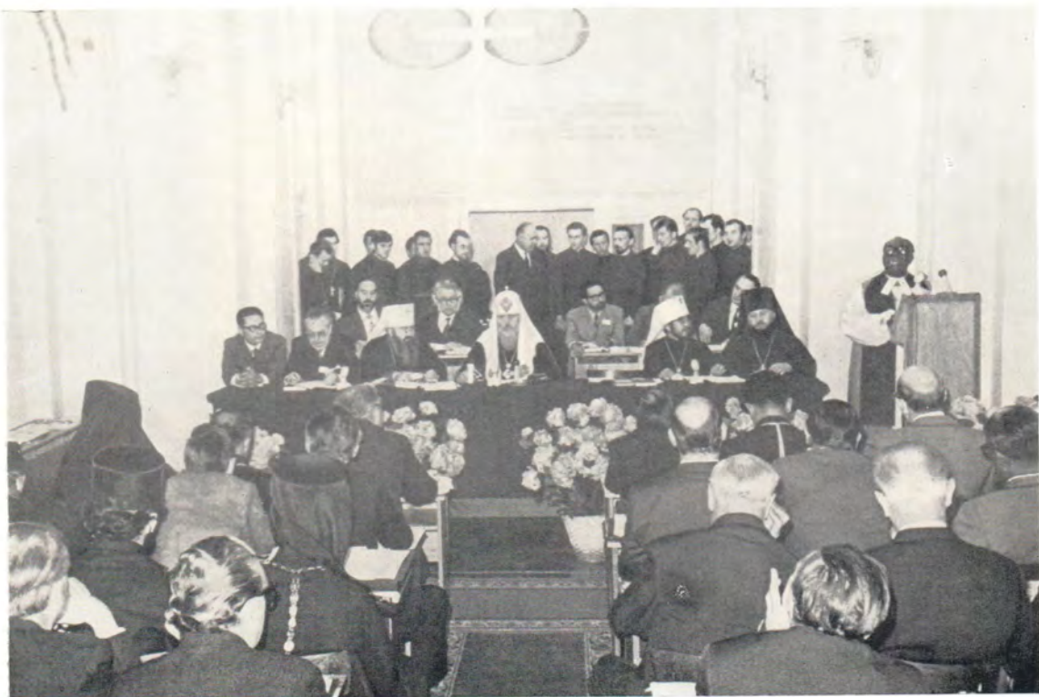
На открытии сессии Комитета продолжения работы ХМК в Загорске 25 мая 1973 года. В президиуме — Святейший Патриарх Московский и всея Руси Пимен