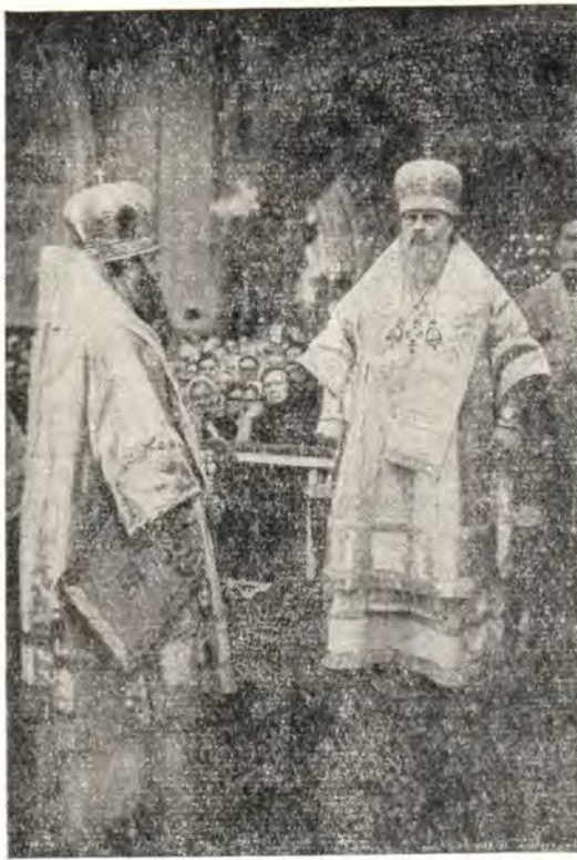
3 июня 1973 года. Митрополит Ленинградский и Новгородский Никодим произносит приветственное слово Святейшему Патриарху Пимену перед началом праздничного молебна в патриаршем соборе

«Днесь светло красуется славнейший град Москва» и вместе с ним радуется и торжествует вся Церковь Русская как в Отечестве нашем, так и в рассеянии сущая.