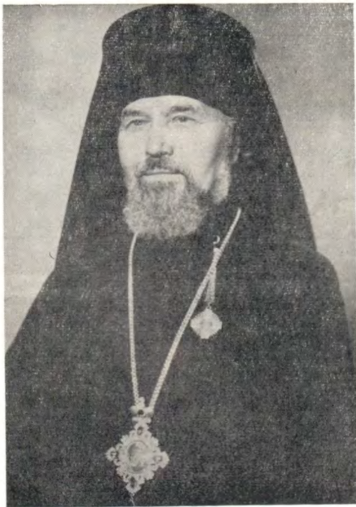
Преосвященный ВИКТОРИН, епископ Пермский и Соликамский

Прежде всего возношу мое сердце к Великому Пастыреначальнику Господу нашему Спасителю с горячей просьбой о помощи и содействующей благодати Божией. В моем пастыр-