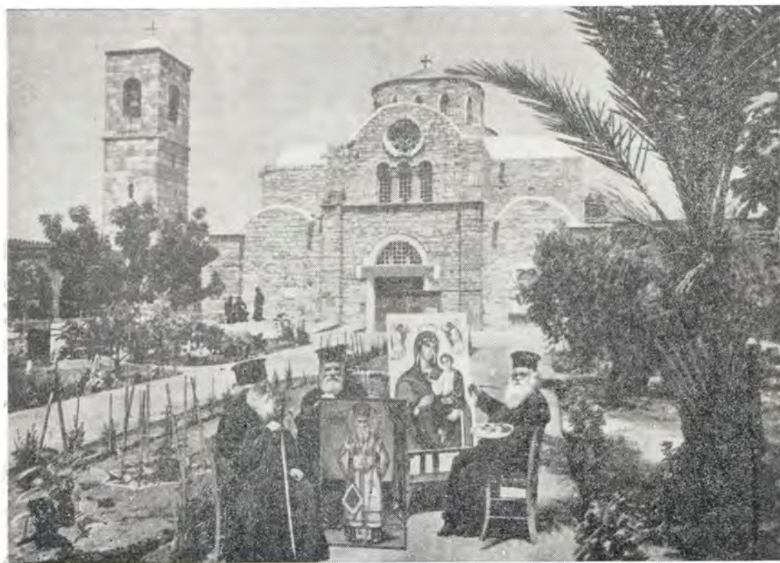
В монастыре апостола Варнавы близ г. Фамагусты

Дух отношений Кипрской Православной Церкви к Старокатолической Церкви можно выразить словами представителя Кипрской Церкви на заседании Межправославной богословской комиссии в Белграде в сентябре 1966 г. по диалогу со старокатоликами архимандрита Хризостома Киккотиса. От лица