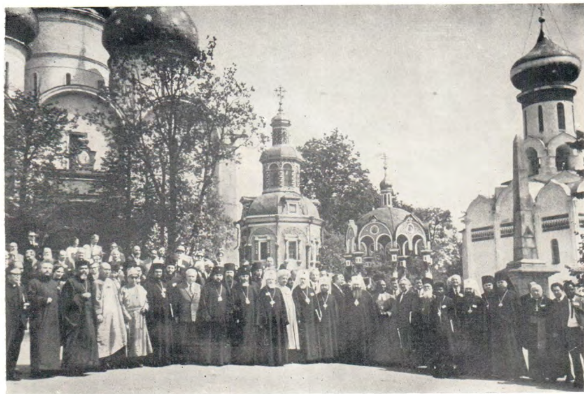
Члены и гости Комитета продолжения работы ХМК в Троице-Сергиевой Лавре