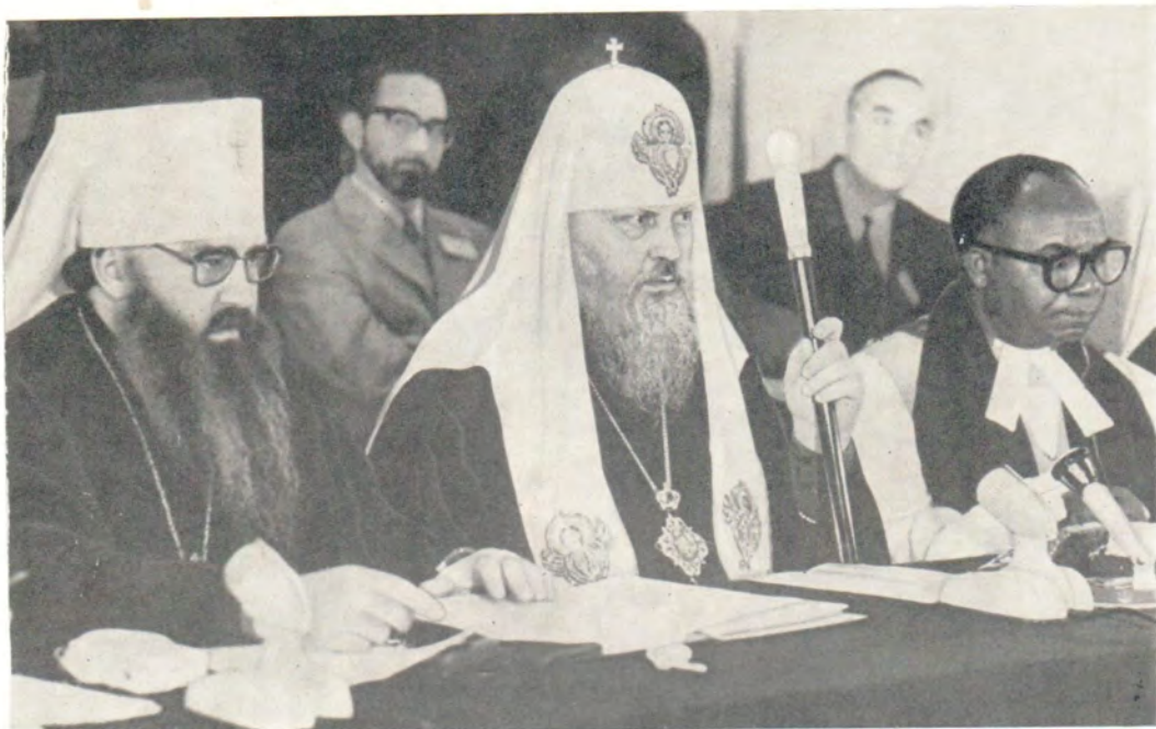
В президиуме первого пленарного заседания КОПра ХМК: митрополит Ленинградский и Новгородский Никодим, президент ХМК; вице-президент проф. Сергио Арце-Мартинес [Куба]; Святейший Патриарх Московский и всея Руси Пимен; вице-президент Януш Маковский [Польша]; епископ Фестус Сегун [Нигерия]