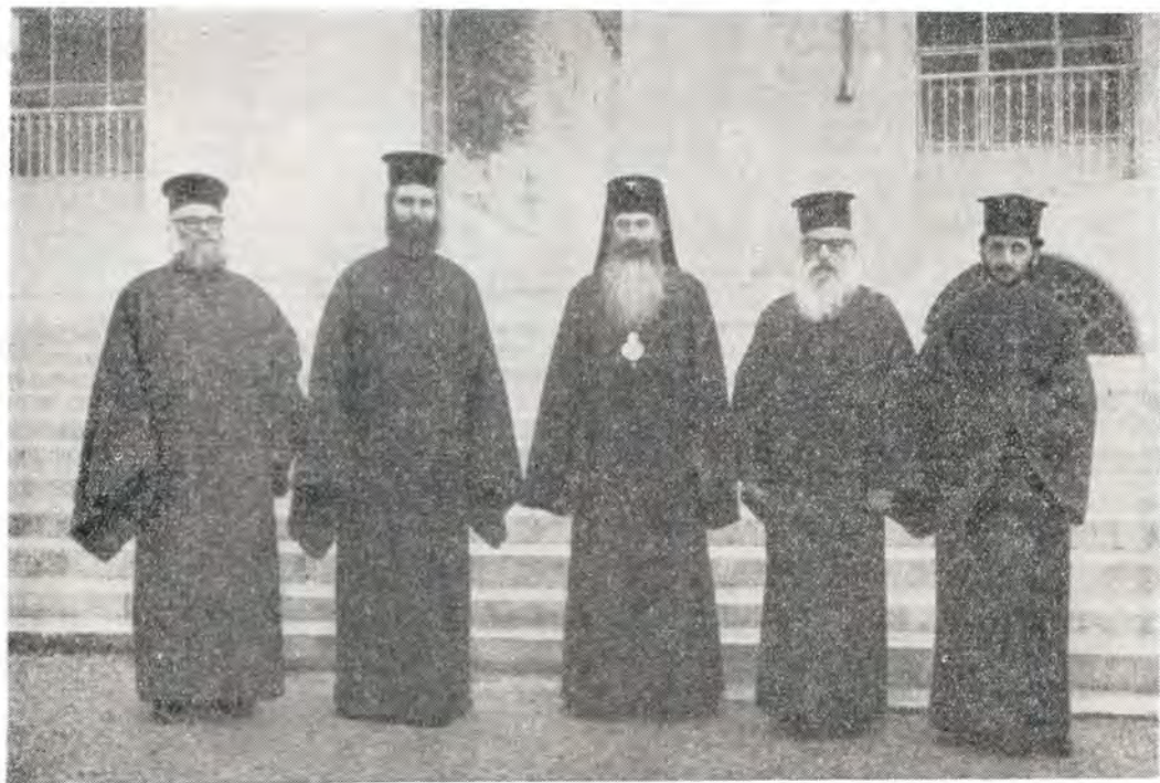
Архиепископ Волоколамский Питирим в Киккском монастыре в Никозии

В 1965 г. в делегации этого Общества, посетившей Кипр, был его тогдашний вице-прези-