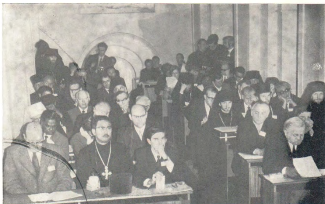
На пленарном заседании КОПра ХМК в Загорске 25 мая 1973 года