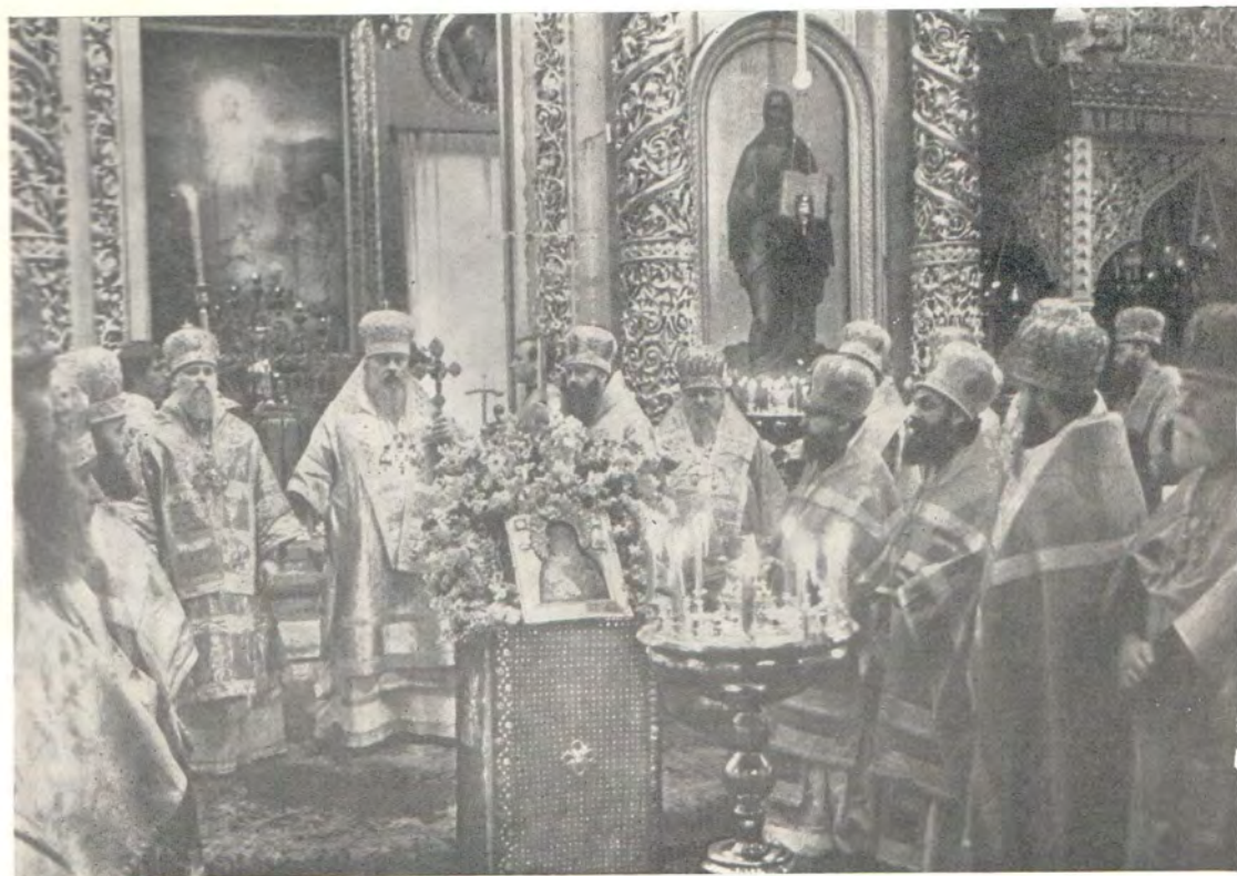
Святейший Патриарх Пимен с иерархами и клириками за богослужением в Богоявленском патриаршем соборе 3 июня 1973 года — в день второй годовщины интронизации