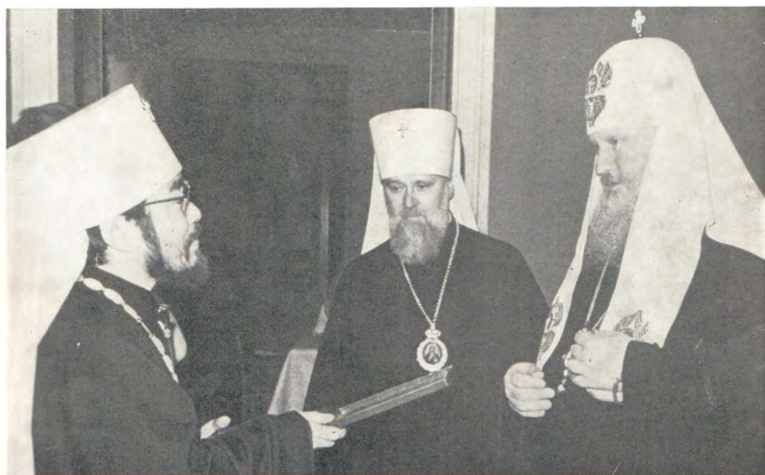
Предстоятель Автономной Японской Православной Церкви Архиепископ Токийский, Митрополит всей Японии Феодосий на приеме у Святейшего Патриарха Пимена в Московской Патриархии 24 мая 1973 года