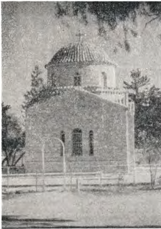
Храм на месте погребения святого апостола Варнавы на Кипре

своей Церкви он заявил тогда в своей речи: «Будем решительными и с верой в успех диалога со старокатоликами не остановимся перед как бы непреодолимыми препятствиями и побочными вопросами, не приносящими вреда вероучению. И, не опуская ни одной йоты из православных догматов, будем стремиться, чтобы лучше познать их и чтобы они нас познали».