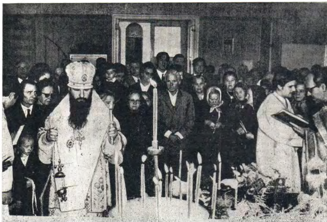
Епископ Максим совершает богослужение Радоницы в Благовещенском соборе в Буэнос-Айресе 16 апреля 1972 года