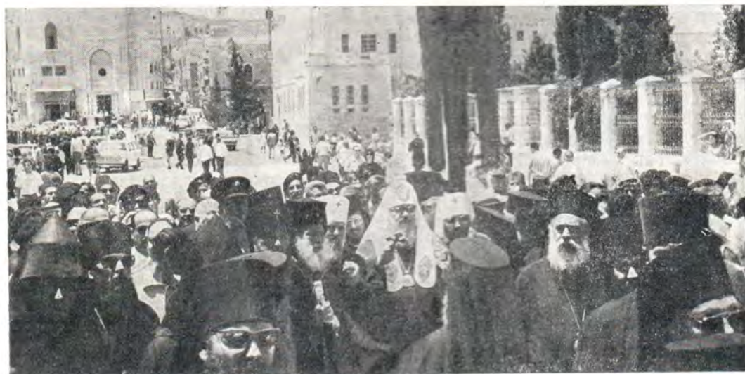
Встреча Святейшего Патриарха Пимена на площади у храма Рождества Христова в Вифлееме, 19 мая 1972 года [к с. 20]