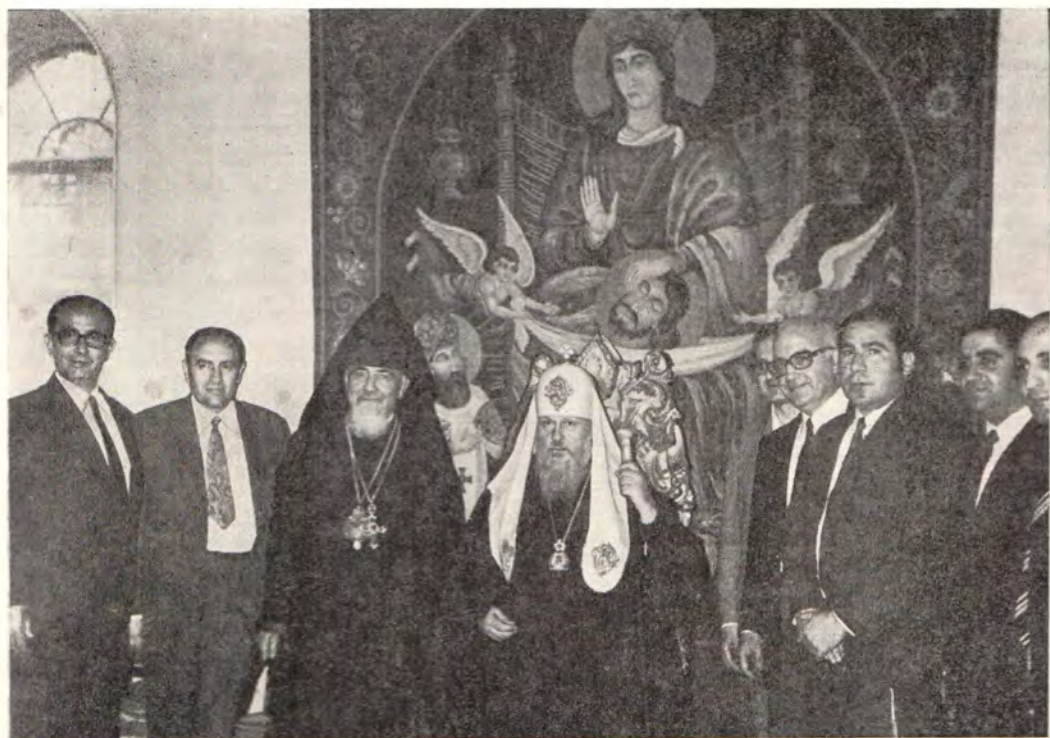
18 мая 1972 года. Святейший Патриарх Пимен в резиденции Блаженнейшего Патриарха Армянского в Иерусалиме Егише Дардаряна. Рядом с Патриархом Пименом — Патриарх Егише Дардарян