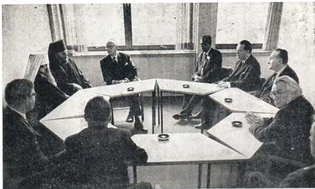
Встреча Президента Финляндии г-на Урхо Кекконена с Президиумом Христианской Мирной Конференции в день открытия заседания Рабочего комитета ХМК в Эспо

призывают подлинно демократические силы во всех странах мира к усилению поисков путей и средств для мирного урегулирования положения во Вьетнаме.