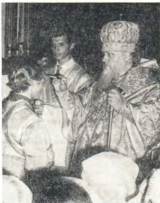
Святейший Патриарх Пимен за всенощным бдением в Успенском кафедральном соборе в Одессе 18 августа 1972 года

18 августа, в канун праздника Преображения Господня, Святейший Патриарх Пимен с собором иерархов совершил праздничное