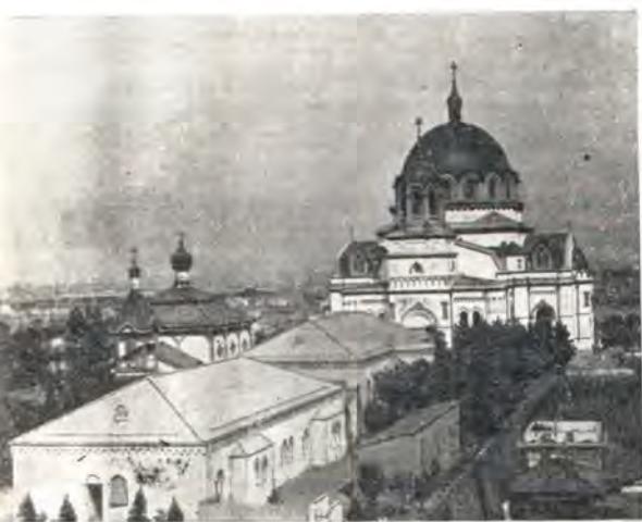
Храм Воскресения Христова в Токио

Возвратившись в Токио, епископ Николай принимается за новый перевод богослужебных книг. Главные части общественного и частного богослужения к тому времени, конечно, су-