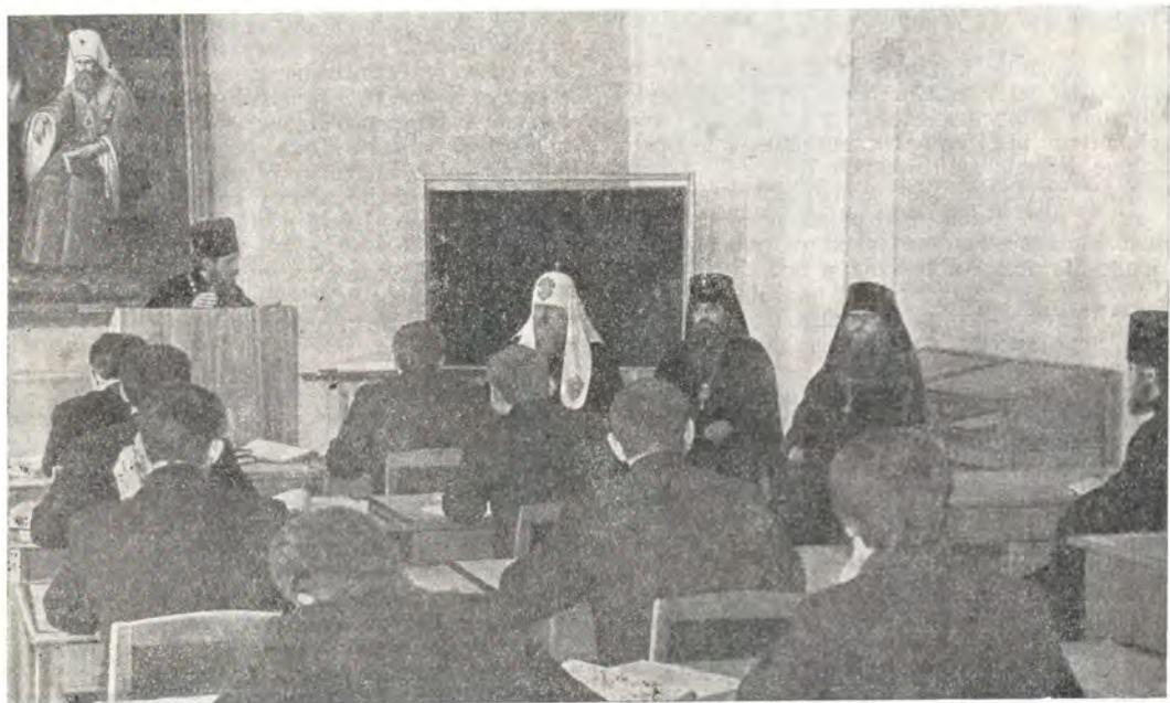
Святейший Патриарх Пимен в Московской духовной семинарии 6 октября 1972 года