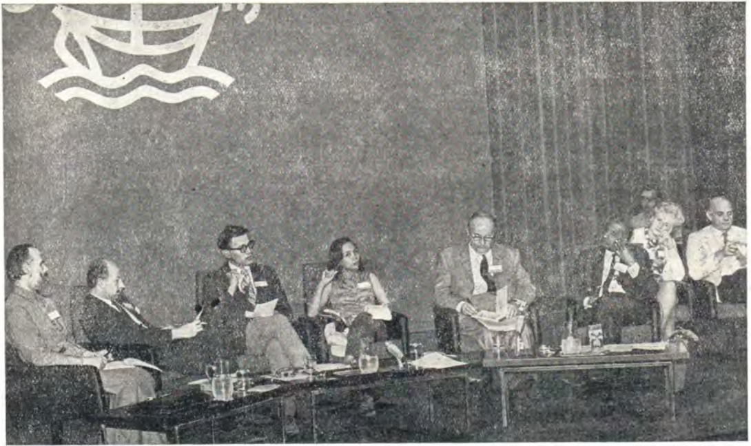
На панельной дискуссии по главной теме сессии Центрального комитета ВСЦ в Утрехте «Обязаны к содружеству». Крайний слева — митрополит Сурожский Антоний

звания. Это включает в себя, с одной стороны, продвижение к «единству в единой вере и единому евхаристическому содружеству», выраженных в «молитве и общей жизни во Христе», и, с другой стороны, — общие действия в деле «продвижения братства, справедливости и мира». Неразрешенный богословский вопрос касается связи между тремя уровнями содружества: соборное содружество, которым мы являемся сейчас; евхаристическое содружество, которое является нашей целью; и братское содружество, или секулярное содружество, которое мы хотим водворить между всеми людьми» (с. 5).