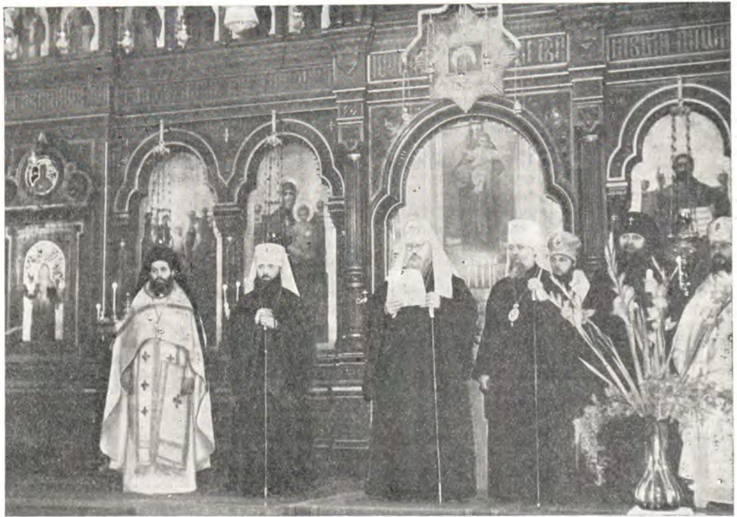
18 мая 1972 года. Святейший Патриарх Пимен произносит слово в Троицком соборе Русской Духовной Миссии в Иерусалиме