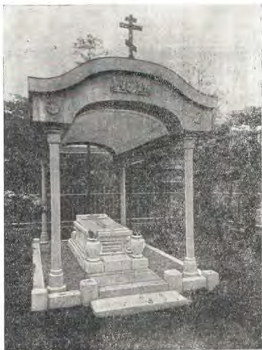
Место погребения апостола Японии в Токио

Итак, совершенная убежденность в величии избранного служения, сознательное вступление на путь неизбежных трудностей и душевных страданий, беззаветная преданность воле Божией