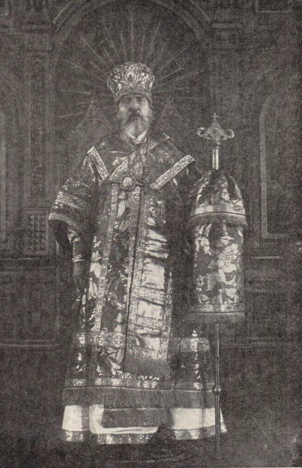
Апостол Японии — Архиепископ НИКОЛАЙ (Касаткин) В связи с 60-летием со дня преставления к Богу