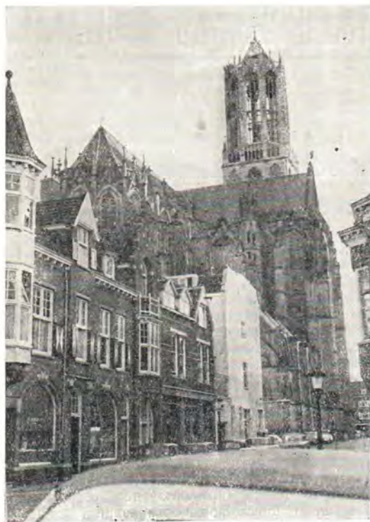
Утрехт, Собор Реформатской Церкви