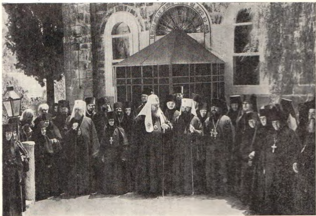
20 мая 1972 года. Горненский женский монастырь близ Иерусалима. Святейший Патриарх Пимен с паломниками и насельницами обители у входа в монастырский храм в честь Казанской иконы Богоматери