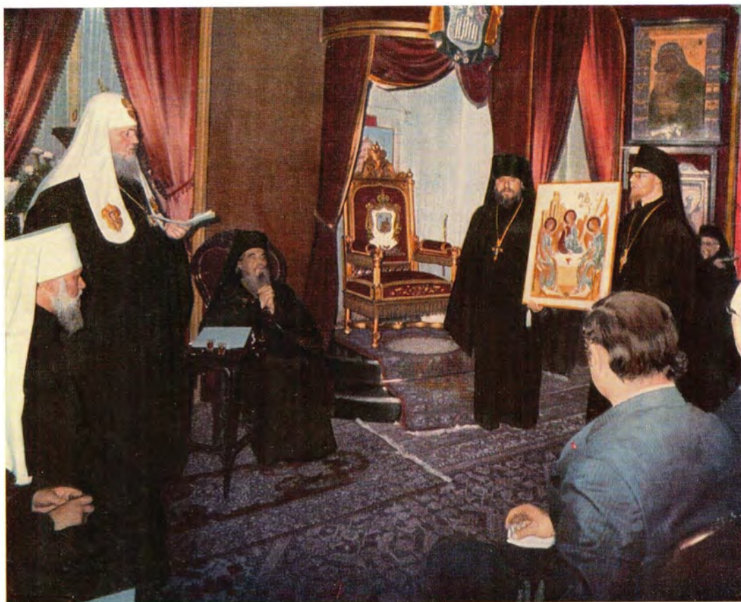
Вверху: Святейший Патриарх Пимен приветствует Блаженнейшего Патриарха Венедикта в тронном зале Иерусалимской Патриархии и преподносит ему в дар икону Живоначальной Троицы. (18 мая 1972 года). Внизу: Святейший Патриарх Пимен со спутниками, Блаженнейший Патриарх Венедикт, иерархи и клирики Иерусалимской Церкви близ храма Вознесения Господня в Малой Галилее