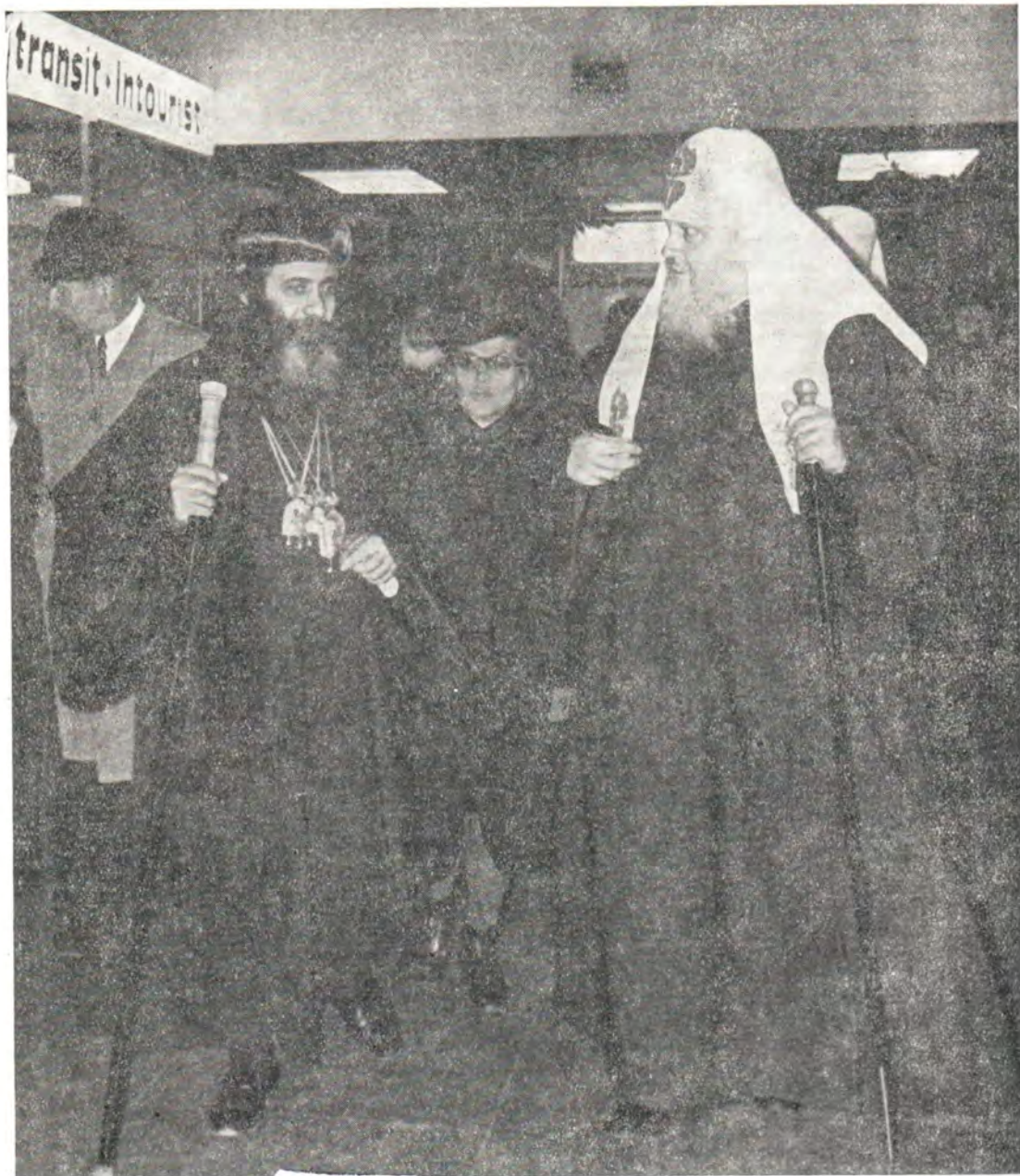
Глава Коптской Церкви Святейший Патриарх Шенуда III и Святейший Патриарх Московский и всея Руси Пимен в аэропорту Шереметьево 3 октября 1972 года

Первоиерарх и прибывшие с ним деятели братской Коптской Церкви посещали московские храмы, молились за богослужениями у русских православных святых, осматривали церковные и исторические памятники, побывали в музеях, библиотеках, на выставках, нанесли визит в Советский комитет солидарности стран Азии и Африки, ознакомились с работой различных учреждений Московской Патриархии.