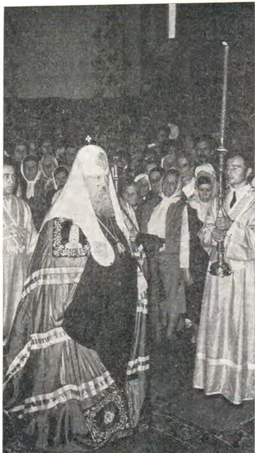
Торжественная встреча Святейшего Патриарха Пимена в Успенском кафедральном соборе в Одессе 11 июля 1972 года

после богослужения поздравил их с праздником и преподал благословение.