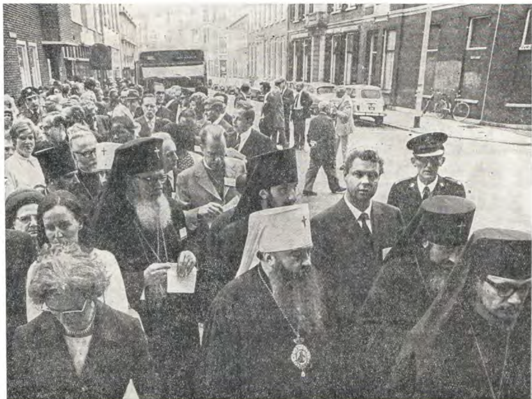
Участники заседания Центрального комитета ВСЦ направляются на экуменическое богослужение перед открытием сессии в воскресенье 13 августа 1972 г.

Другим симптоматичным моментом этого заседания Центрального комитета было признание, хотя и не всеобщее, правоты православных в призыве к неустанному богословским исследованиям для достижения единства в вере и в жизни. Очень важно, что этот призыв исходил прежде всего от лидеров экуменизма. Председатель Исполнительного и Центрального комитетов ВСЦ д-р М. М. Томас в докладе заявил: «Я думаю, что будет более целесообразным сказать несколько слов о различных формах, в которых выразились вопросы о вере и сущность нашего содружества, касающиеся нас, и которые были остро подняты в основной программе деятельности Всемирного Совета за последние два года. Во-первых, я утверждаю, что наша чуткость к проблемам широкого человеческого круга и наше активное участие в этих проблемах — факт для каждого внимательного наблюдателя — побуждают нас вновь открыть веру, которая является основой нашего общего участия... В результате возникает новое сознание потребности выразить нашу общую веру в связи с современными проблемами и участием в них... Совет является «содружеством Церквей», основанным на исповедании Христа и обязывающим их искать вместе выполнение общего при-