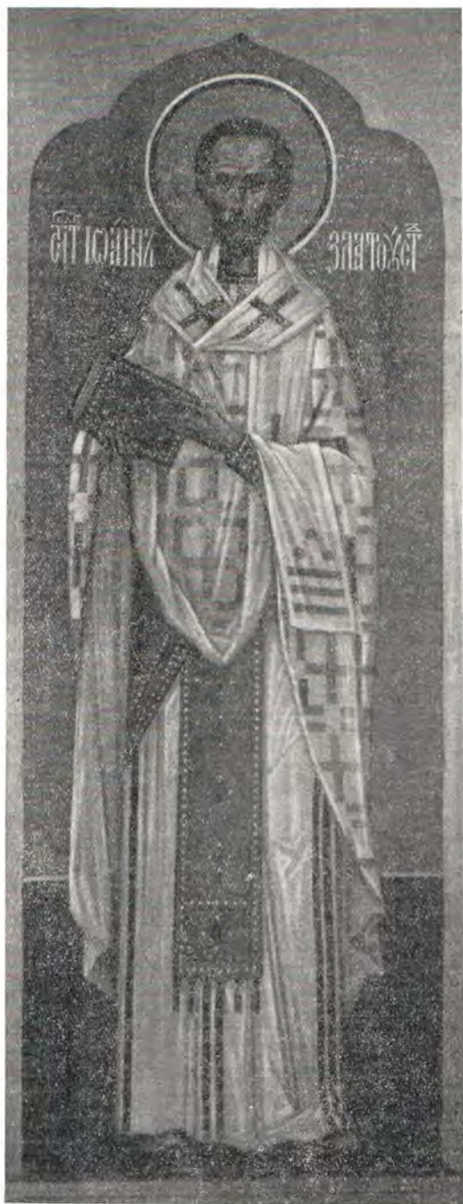
Из алтарных росписей Покровского храма Московской духовной академии

6. И тщеславие, в свою очередь, и безрассудство — это другой вид опьянения, даже еще опаснее пьянства. Ибо поработенный этими страстями и способность суждения, так сказать, самих чувств губит, и ста-