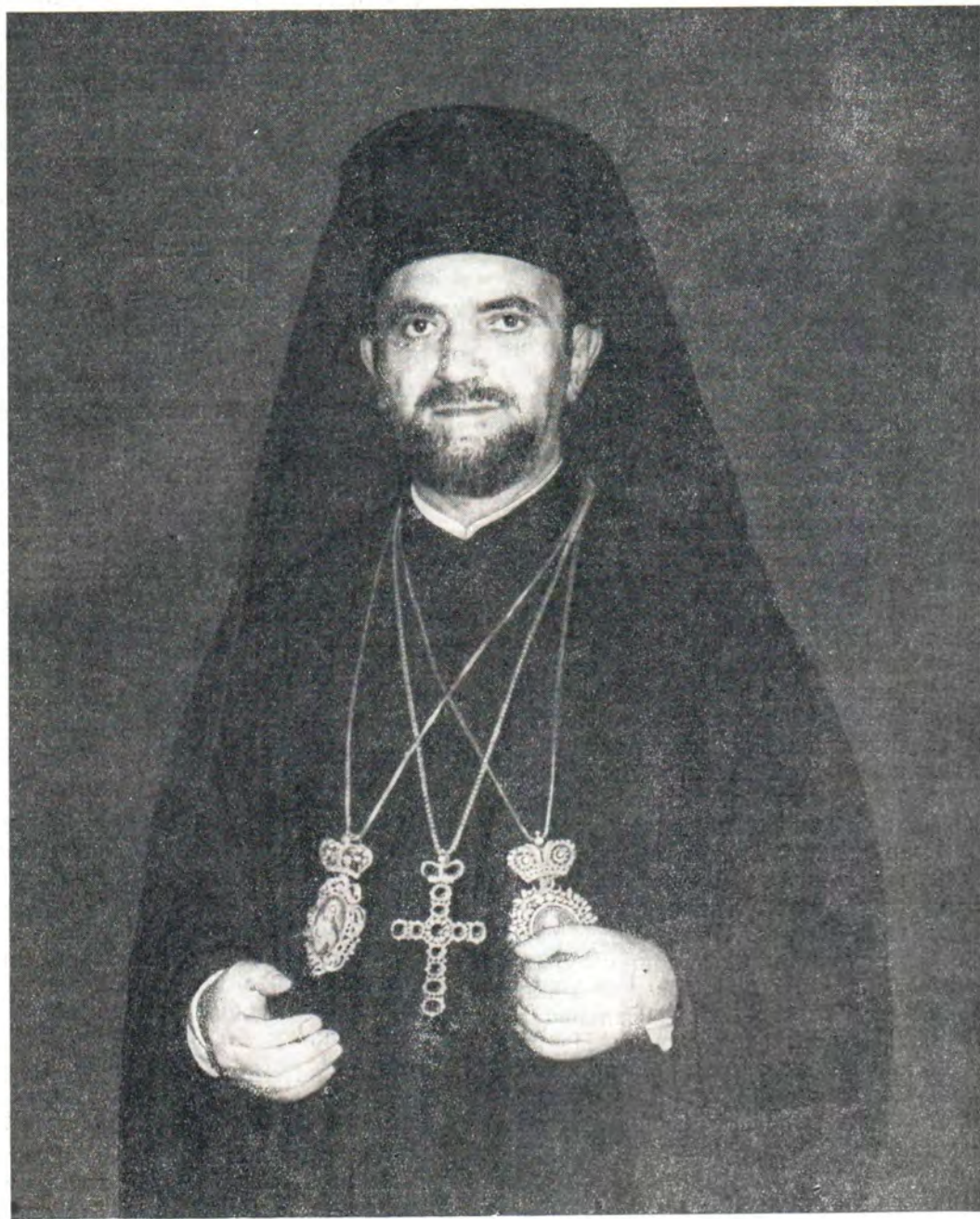
Святейший ДИМИТРИЙ I, Архиепископ Константинополя — Нового Рима и Вселенский Патриарх