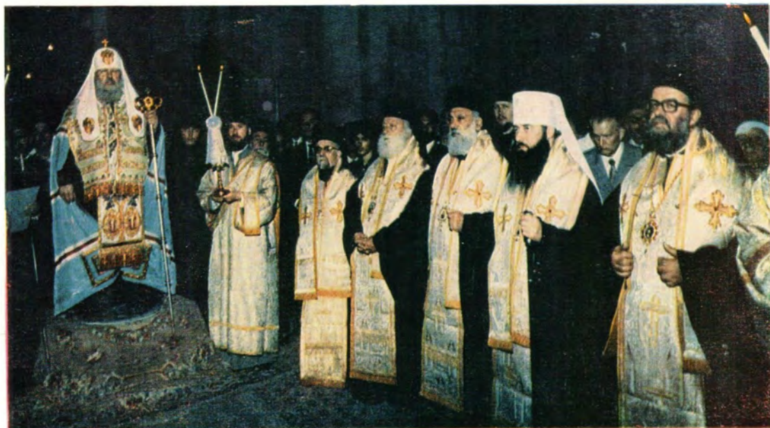
Вверху: Святейший Патриарх Пимен совершает «доксологию» — благодарственный молебен в храме Воскресения Христова в Иерусалиме. Внизу: Святейший Патриарх Пимен входит в храм Рождества Христова в Вифлееме. (19 мая 1972 года)