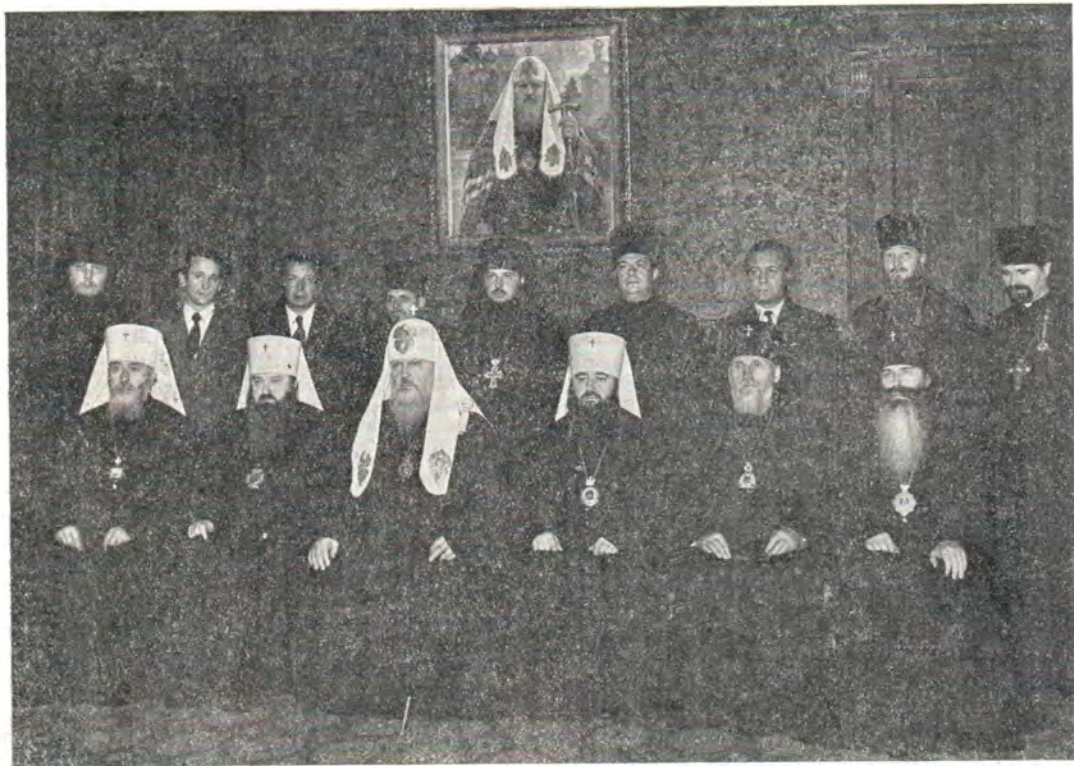
Святейший Патриарх Московский и всея Руси Пимен и сопровождающие его лица перед отъездом

Его Святейшество в этой поездке сопровождают митрополит Ленинградский и Новгородский Никодим, председатель Комиссии Священного Синода по вопросам христианского единства и межцерковных сношений; митрополит Тульский и Белевский