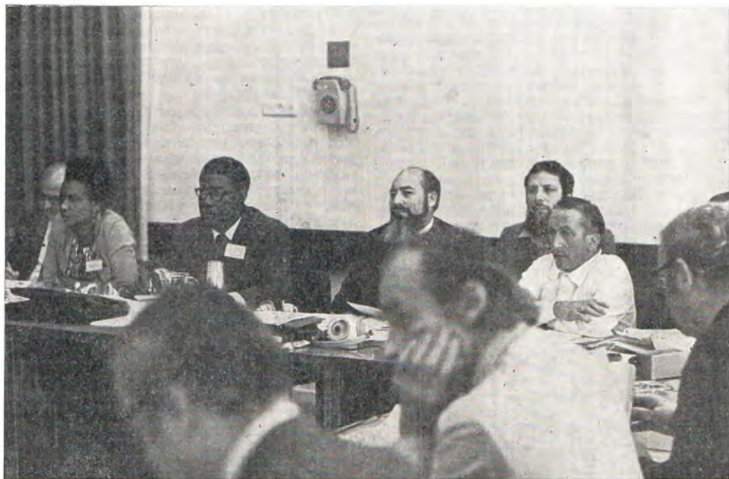
В зале заседания Реферативного комитета III. Четвертый слева — архиепископ Ростовский и Новочеркасский Владимир, заместитель председателя Реферативного комитета