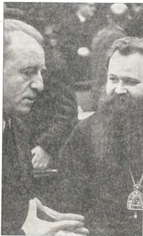
Участники пастырского съезда: епископ Венский и Австрийский Герман и викарий епископ из Линца Алоиз Вагнер

С 28 по 30 декабря 1971 года в Венском университете проходил Австрийский пастырский съезд. Те, кто этим заинтересовались — миряне, священники, члены монашеских орденов, — прибыли из разных концов Австрии и из других стран. Общая тема съезда — «Свобода — грех — искупление» — должна была осветить и разъяснить взаимоотношения современных людей и жизненные ситуации, которые часто бывают сложны и неясны, но из которых мы не можем себя исключить.