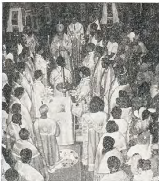
Перед молебном в день выпуска Одесской духовной семинарии

Затем архимандрит Агафангел огласил текст телеграммы, посланной по случаю окончания учебного года Святейшему Патриарху Пимену, в которой испрашивалось первосвя-