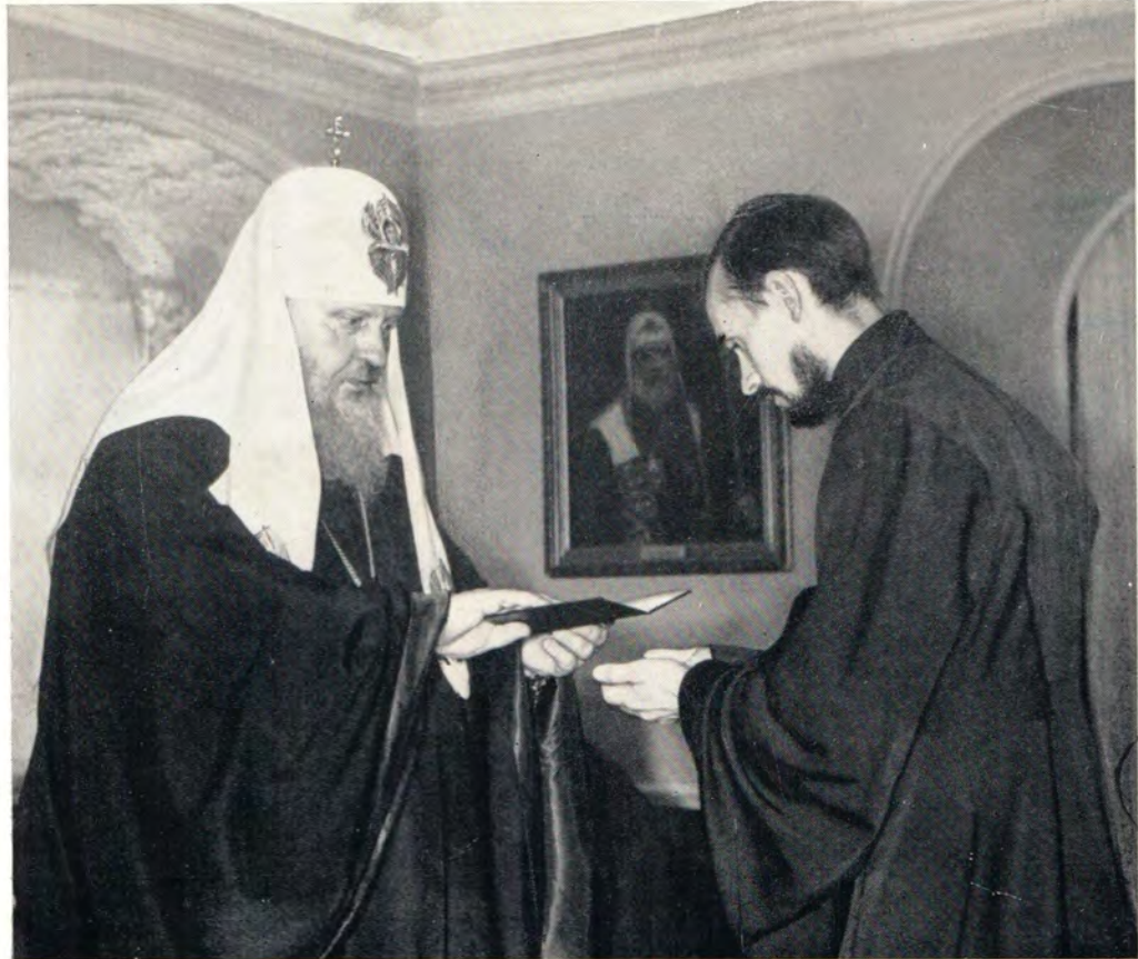
15 июня 1972 года. Выпускной акт в Московских духовных школах. На верхнем фото: Святейший Патриарх Пимен вручает диплом и знак кандидата богословия диакону Михаилу Дивакову. На нижнем фото: от имени выпускников семинарии выступает К. Юшков