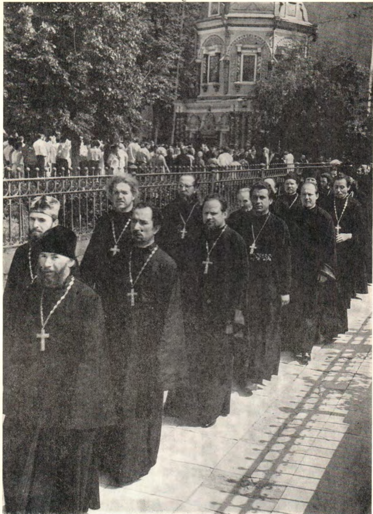
По окончании учебного года выпускники Московских духовных школ идут к Преподобному Сергию за благословением на пастырское служение (июнь 1972 года)