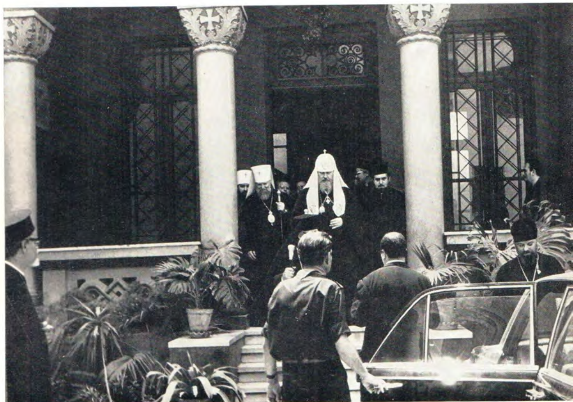
Каир, 3 мая 1972 года. Блаженнейший Патриарх Николай VI и Святейший Патриарх Пимен у здания Александрийской Патриархии