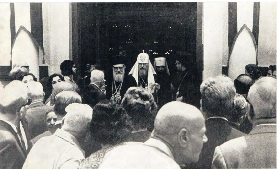
Александрия, 30 апреля 1972 года. Святейший Патриарх Московский и всея Руси Пимен и Блаженнейший Патриарх Александрийский Николай VI выходят из Благовещенского патриаршего собора