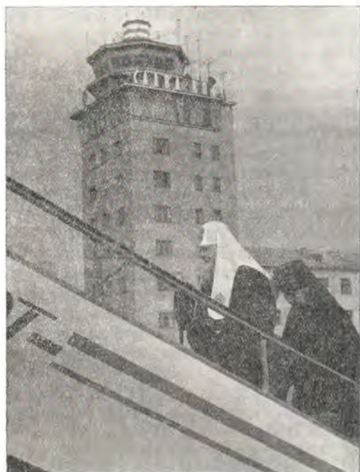
Святейший Патриарх Пимен во Внуковском аэропорту 28 апреля 1972 года

поминания далекого библейского прошлого. Вспоминались всем известные события, связанные с проповедью святых первоверховных апостолов Петра и Павла.