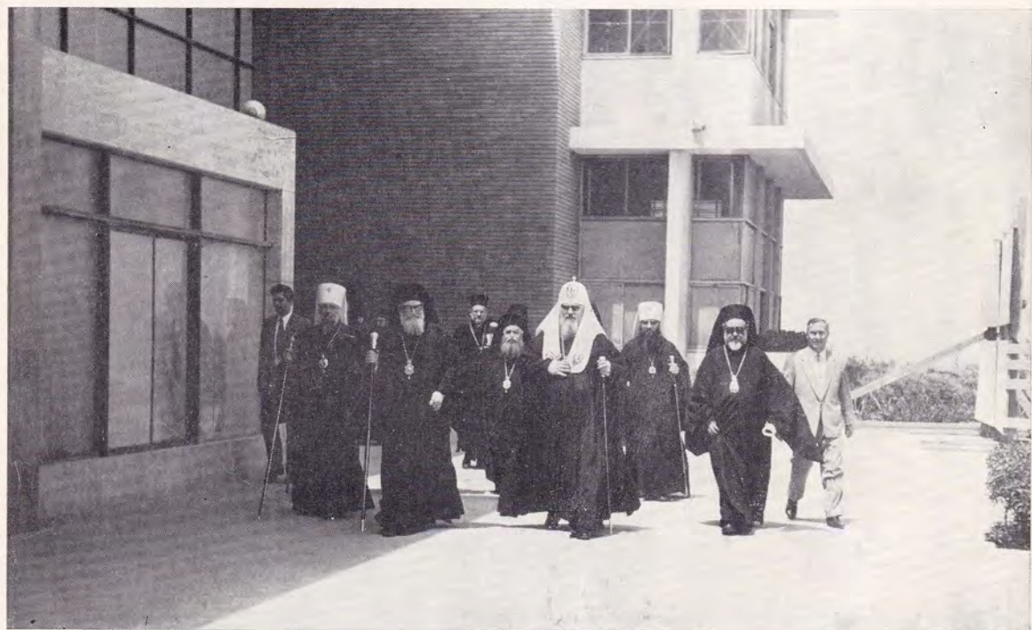
4 мая 1972 года. Проводы в Каирском аэропорту