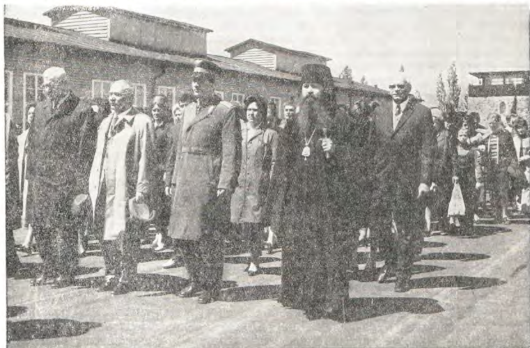
Траурная процессия в Маутхаузене 14 мая 1972 года.

В 1972 г. этот день пришелся на 14 мая. Епископ Венский и Австрийский Герман принял участие в траурной церемонии в Маутхаузене и возложил венок в память погибших в этом концлагере более 200 тыс. советских граждан.