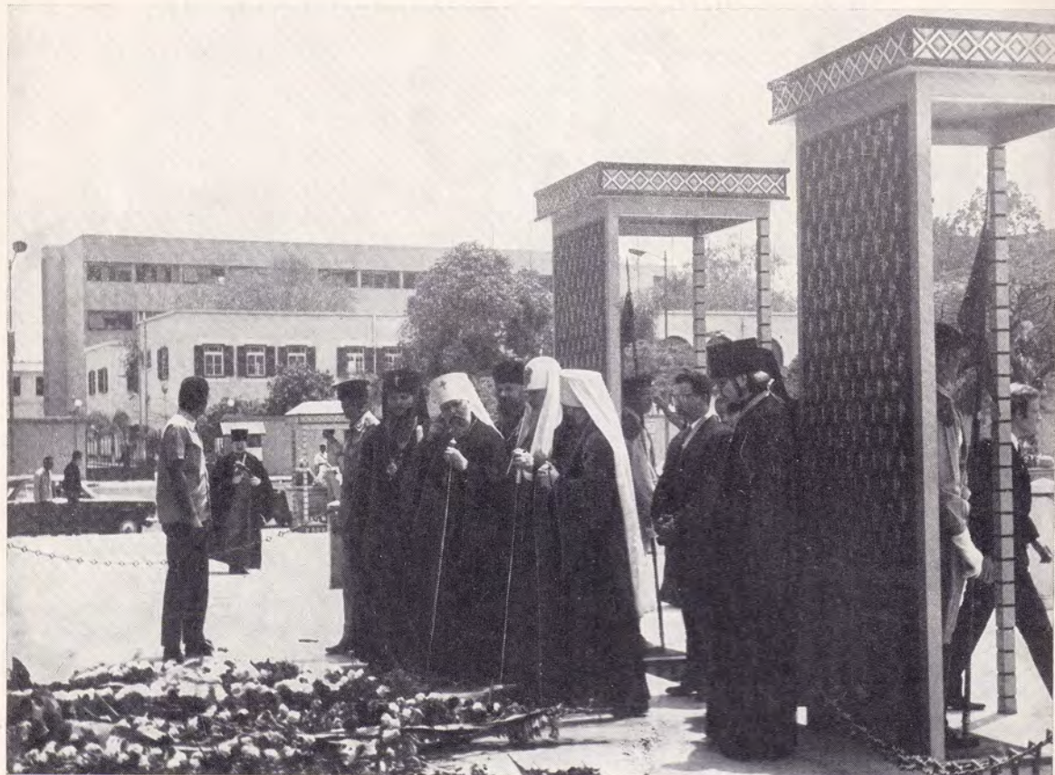
Каир, 3 мая 1972 года. Возложение венка у мавзолея Гамаль Абдель Насера