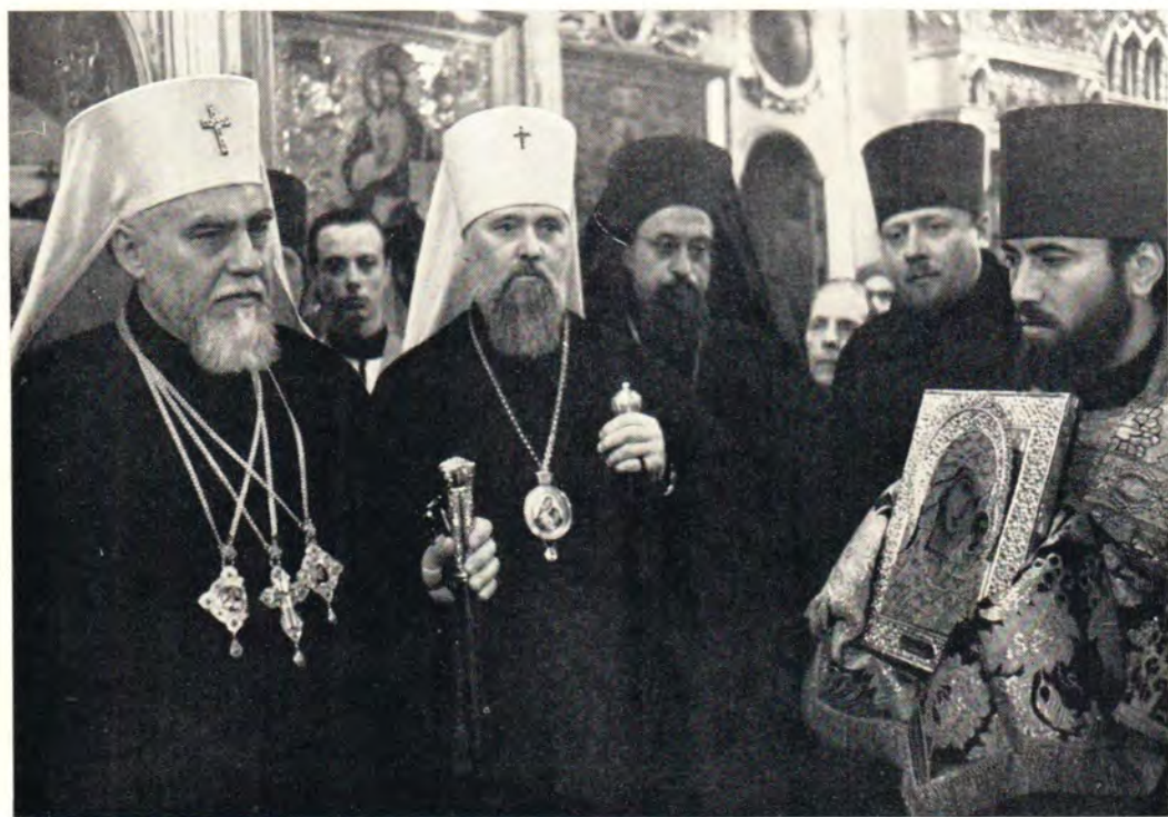
Встреча Святейшего Патриарха Болгарского Максима в Успенском храме Болгарского подворья в Москве перед всенощным бдением 18 марта 1972 года