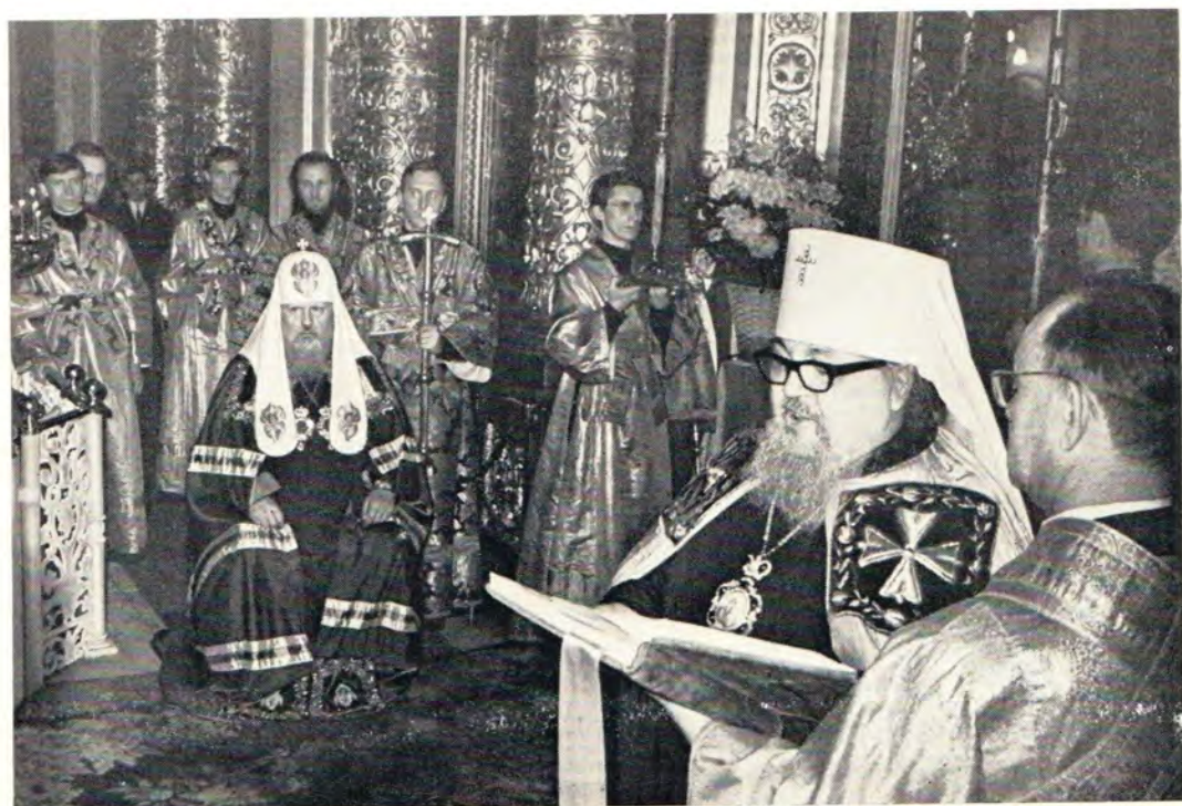
10 апреля 1972 года вечером в Богоявленском соборе. Митрополит Крутицкий и Коломенский Серафим читает Пасхальное послание Святейшего Патриарха Пимена всем верным чадам Русской Православной Церкви