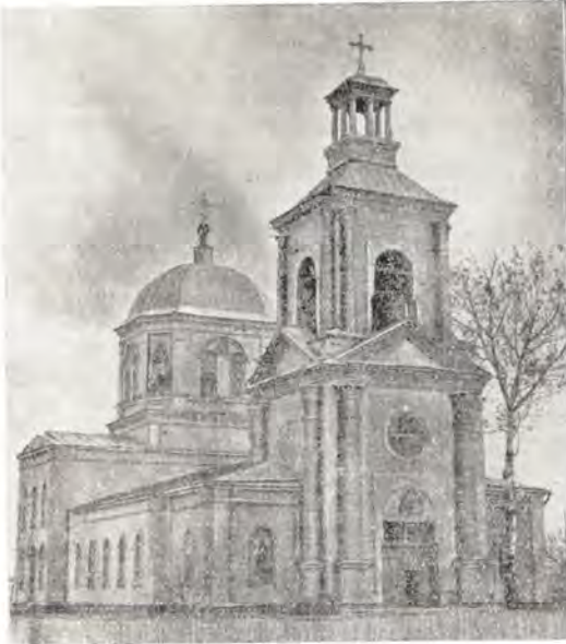
Вознесенская церковь в городе Калач

деле свое христианство, а не на словах, действительно исполнять святые Христовы заповеди о любви, мире, справедливости и милосердии.