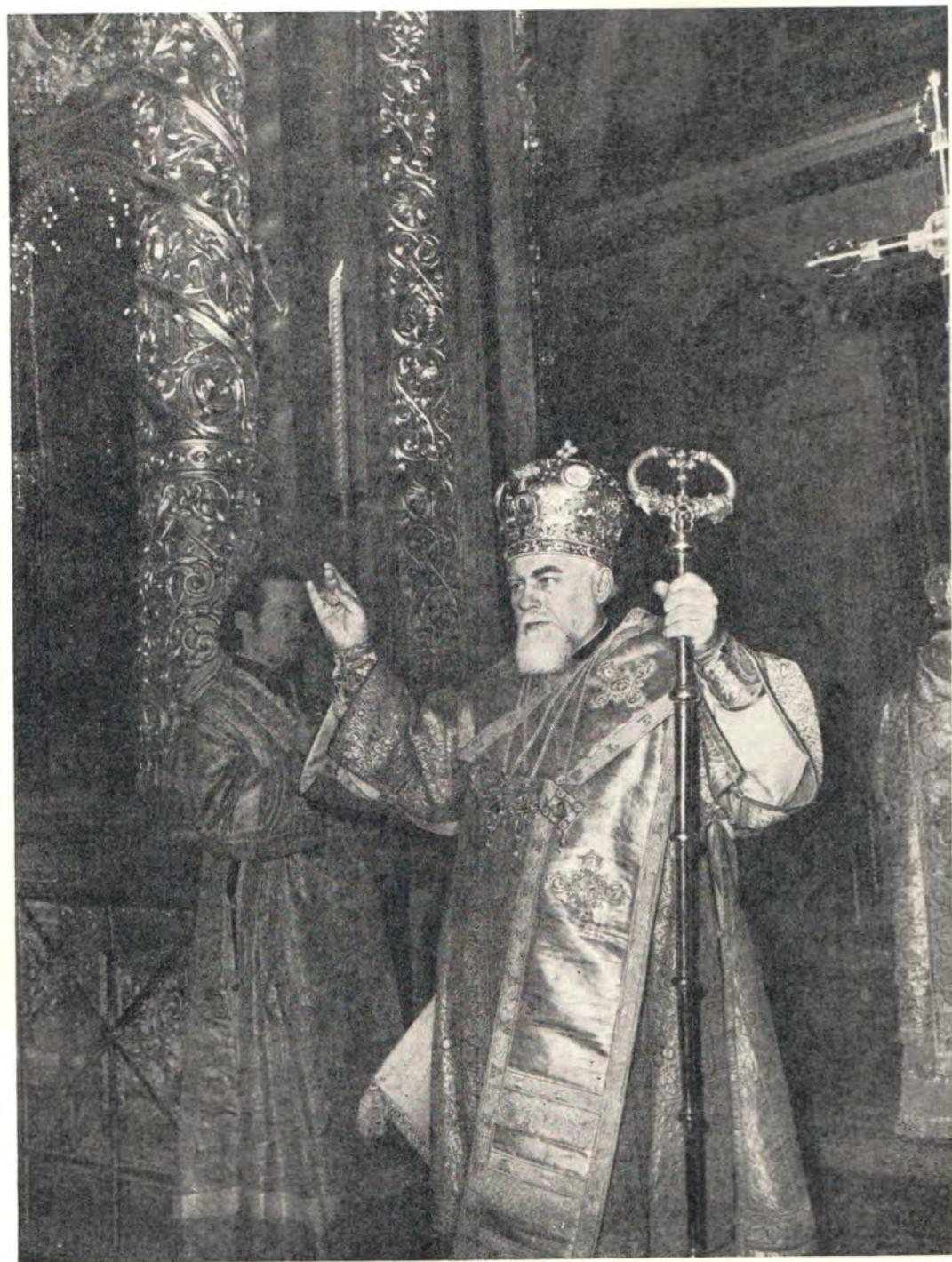
Святейший Патриарх Болгарский Максим за богослужением в Богоявленском патриаршем соборе 19 марта 1972 года