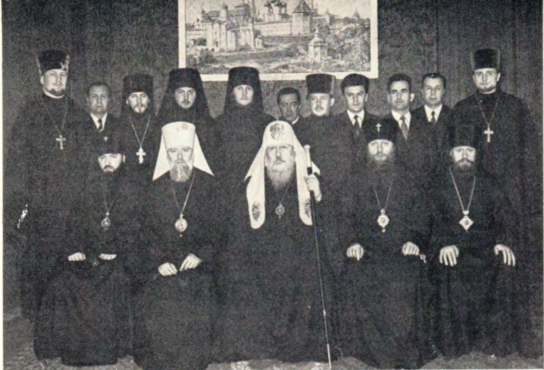
Святейший Патриарх Московский и всея Руси Пимен и сопровождающие его лица перед отъездом в паломническое путешествие [Снимок сделан 27 апреля 1972 года]