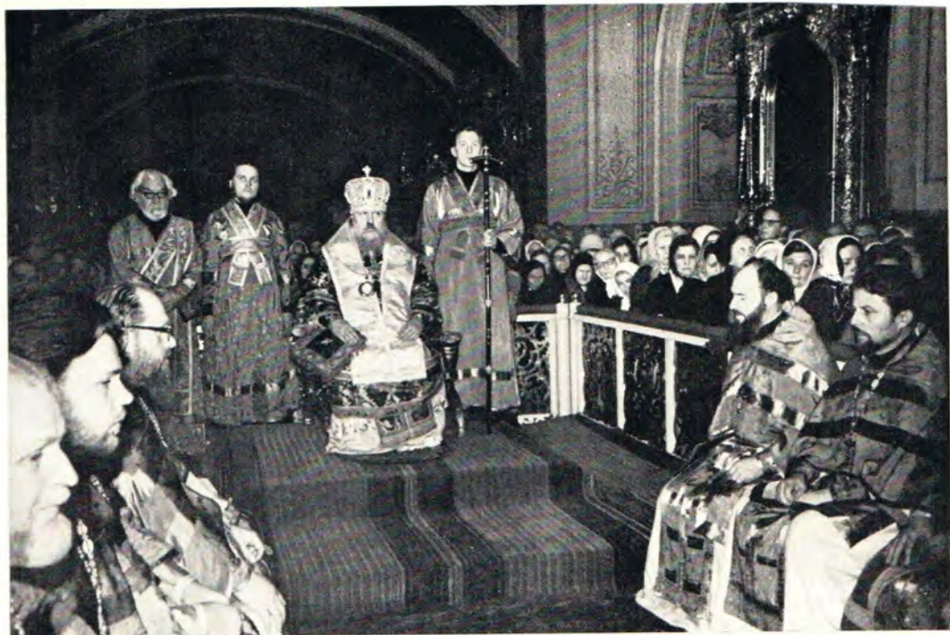
Святейший Патриарх Пимен за богослужением в пасхальную ночь 9 апреля 1972 года в Богоявленском патриаршем соборе