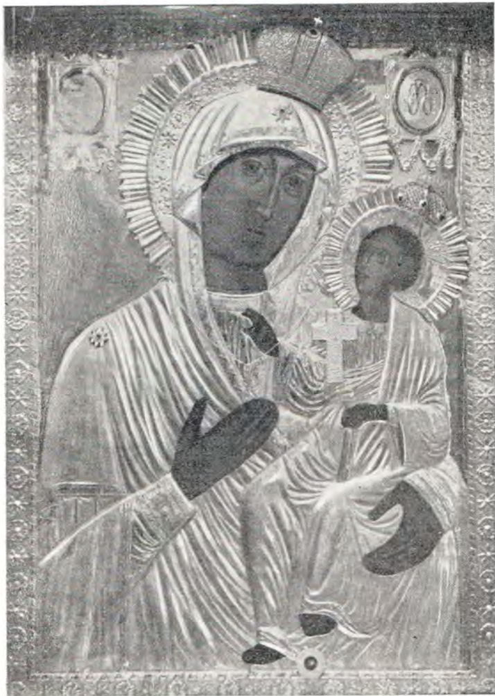
Иверская икона Божией Матери (из храма Воскресения Христова в Сокольниках в Москве)

стили в специально выстроенной для нее часовне у Воскресенских ворот, на месте ее встречи 13 .