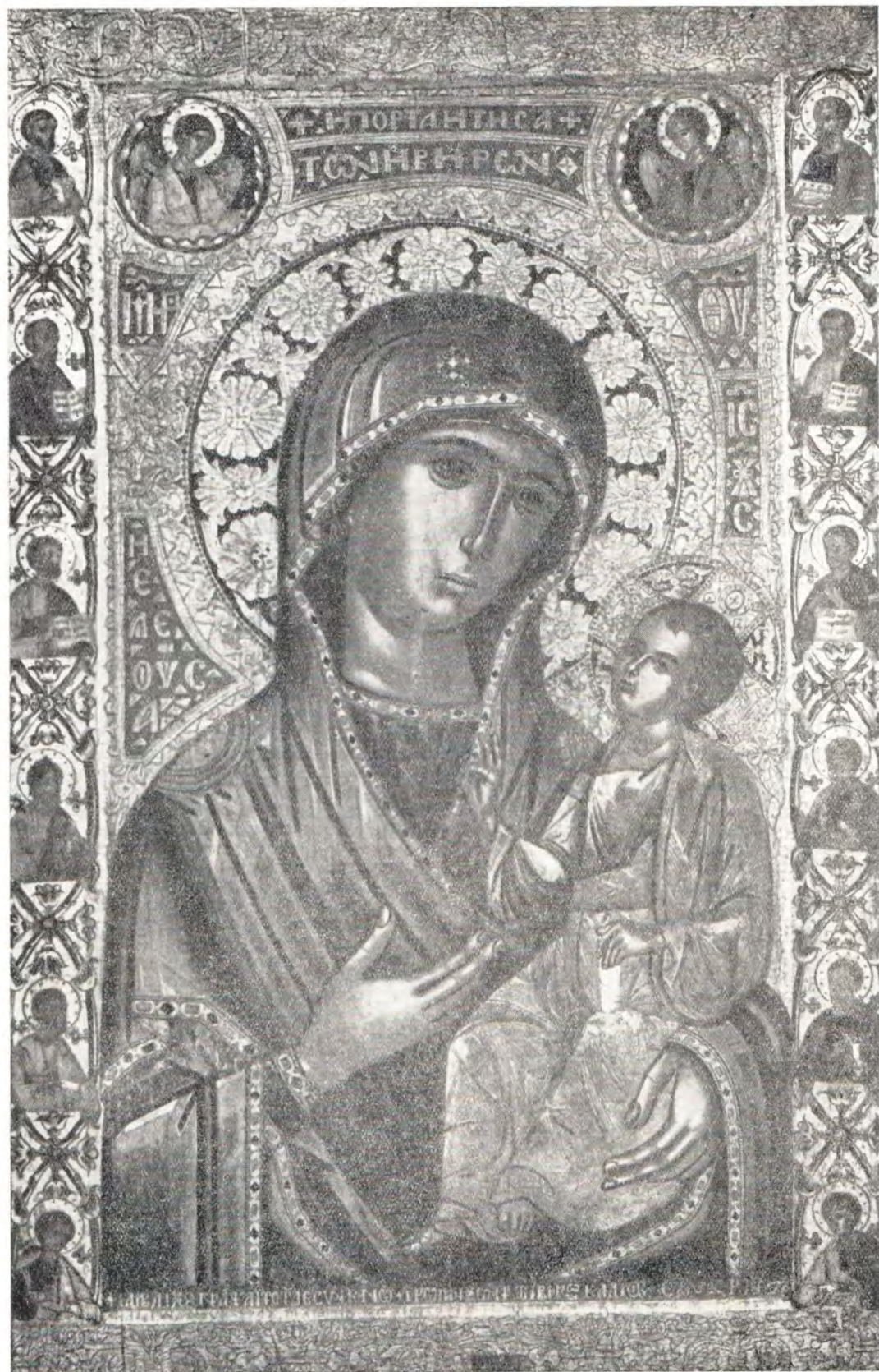
Иверская икона Божией Матери, принесенная в Москву в 1648 году по заказу патриарха Никона. Написана афонским иноком Иамвлихом Романовым