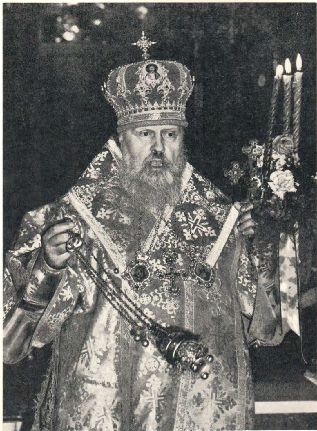
«Христос воскрес из мертвых...» Пением тропаря праздника Пасхи Святейший Патриарх Пимен начинает Божественную литургию в Богоявленском патриаршем соборе в пасхальную ночь 9 апреля 1972 года