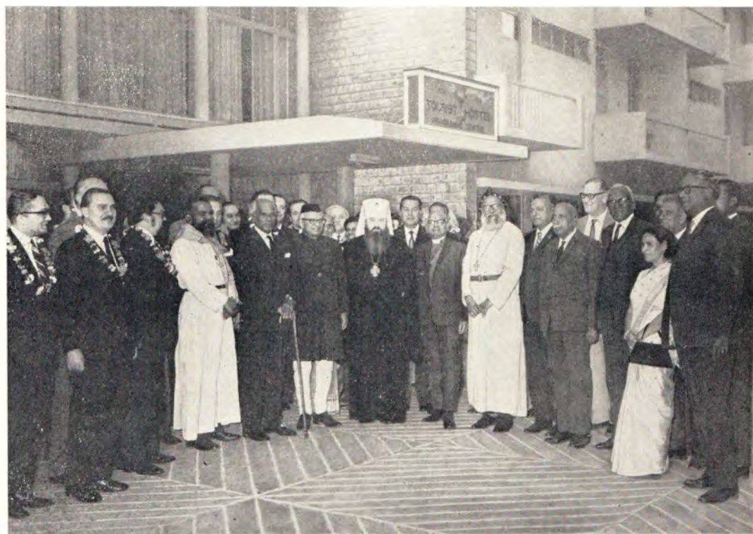
Вице-Президент Индии Шри Г. С. Патак с участниками заседания Рабочего комитета ХМК в Нью-Дели