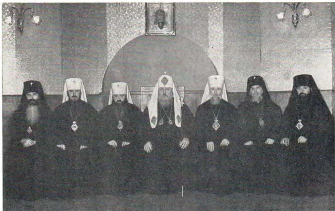
26 марта 1972 года после Божественной литургии в Богоявленском патриаршем соборе. Слева направо: архиепископ Волоколамский Питирим, митрополит Таллинский и Эстонский Алексей, митрополит Ленинградский и Новгородский Никодим, Святейший Патриарх Пимен, митрополит Киевский и Галицкий, Экзарх Украины, Филарет, архиепископ Минский и Белорусский Антоний, епископ Аргентинский и Южноамериканский Максим

20 (7) марта. Празднование иконе Божией Матери, именуемой «Споручница грешных». Святейший Патриарх Пимен совершил литургию Преждеосвященных Даров в храме во имя Святителя Николая, что в Хамовниках в Москве, где есть чтимый образ Божией Матери «Споручница греш-