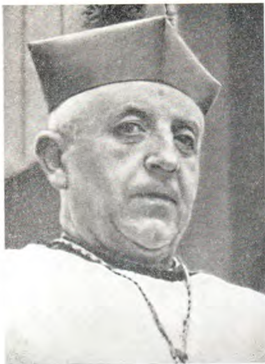
Кардинал Лео Сюэнс

исследовании, подготовленном для второй сессии Комитета встречи между Лютеранской и Реформатской Церквями в Женеве в начале 1971 года. Говоря о возможном будущем Вселенском Соборе, он писал: «Евхаристия — это действительно центр единства Церкви. Если, следовательно, задать себе вопрос, в чем заключаются требования единства, представляемые Церквям для того, чтобы они могли совместно провести Собор, ответ ясен: Церкви должны быть в состоянии вместе совершать Евхаристию. Вопросы для проведения Вселенского Собора совпадают, в сущности, с условиями, которые требуются от всех христиан и всех Церквей для того, чтобы быть способными вместе принимать участие в евхаристическом общении».