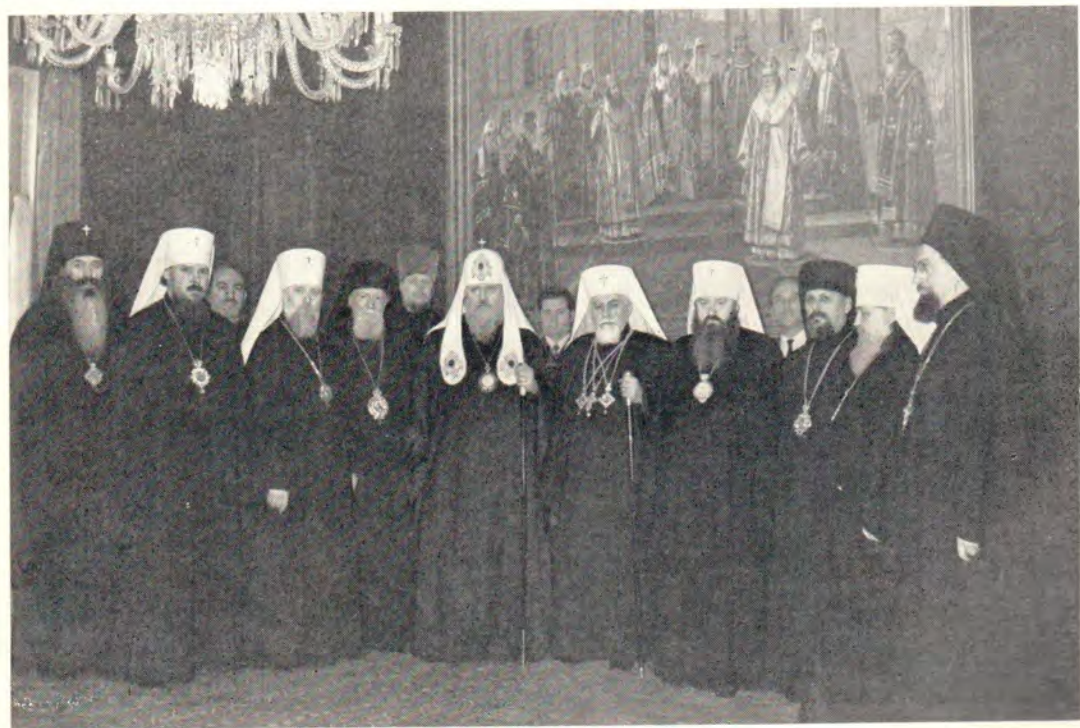
Святейший Патриарх Болгарский Максим и сопровождающие его лица на приеме у Святейшего Патриарха Московского и всея Руси Пимена 15 марта 1972 года