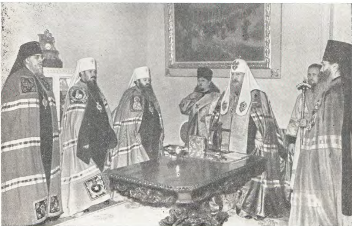
и Южноамериканского в Московской Патриархии 25 марта 1972 года

В 1970 году совершил поездку в Австралию в составе туристической группы по линии Обществ дружбы «СССР—Австралия», «СССР—Новая Зеландия». В 1972 году сопровождал архиепископа Харьковского и Богодуховского, исполняющего обязанности Патриаршего Экзарха в Центральной и Южной Америке, Никодима в его поездке в Аргентину для посещения приходов Южноамериканского Экзархата.