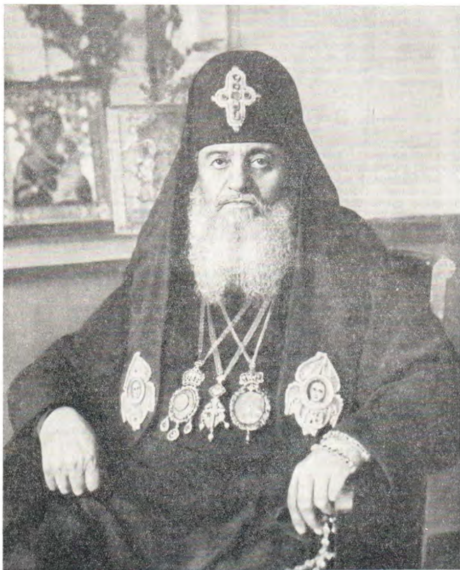
Святейший и Блаженнейший ЕФРЕМ II, Католикос-Патриарх всей Грузии (19 октября 1896 — 7 апреля 1972)