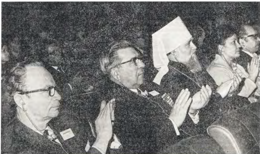
Всемирная ассамблея за мир и независимость народов Индокитая. В зале заседаний