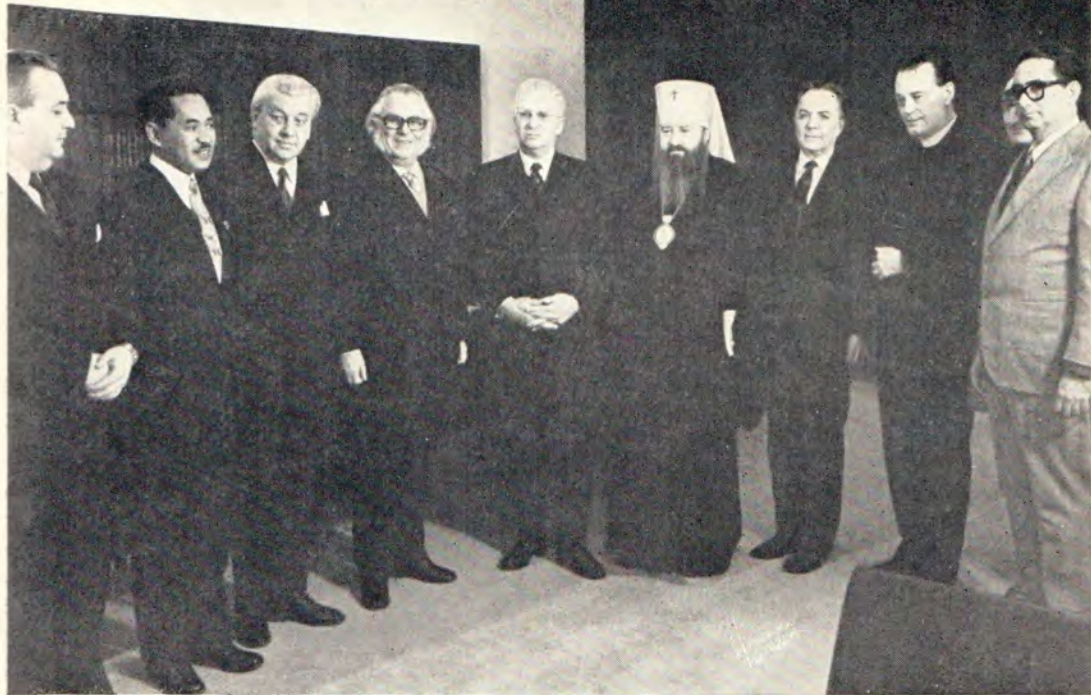
Деятели ХМК на приеме в Кремле 7 марта 1972 года. Слева направо: ген. секретарь ХМК д-р К. Тот (Венгрия), вице-президенты ХМК: пастор Р. Андриаманджато (Малагасийская Республика), д-р Г. Мохальский (ФРГ) и д-р Г. Хельштерн (Швейцария), заместитель председателя Президиума Верховного Совета СССР В. П. Рубен, президент ХМК митрополит Никодим (СССР), председатель Совета по делам религий при Совете Министров СССР В. А. Куроедов, вице-президенты ХМК: епископ Тибор Барта (Венгрия), д-р Я. Маковский (Польша) и проф. д-р С. Арсе-Мартинес (Куба)