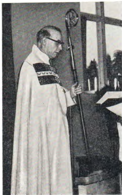
Архиепископ д-р Мартти Симойоки

В беседе с корреспондентом Агентства печати «Новости» глава делегации Евангелическо-Лютеранской Церкви Финляндии Архиепископ Турку и Финляндии д-р Мартти Симойоки сказал: