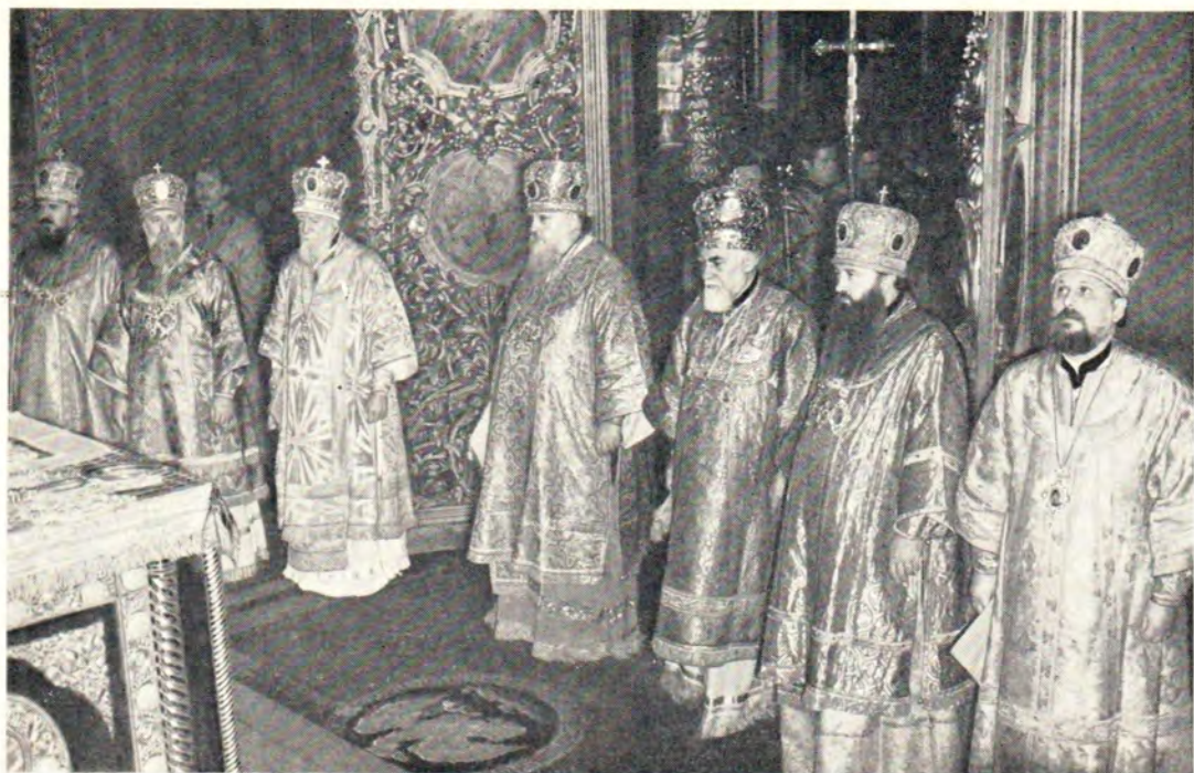
За Божественной литургией в Богоявленском патриаршем соборе 19 марта 1972 года. Справа налево: митрополит Старозагорский Панкратий, митрополит Ленинградский и Новгородский Никодим, Патриарх Болгарский Максим, Патриарх Московский и всея Руси Пимен, митрополит Сливенский Никодим, митрополит Киевский и Галицкий, Экзарх Украины, Филарет, митрополит Таллинский и Эстонский Алексий.