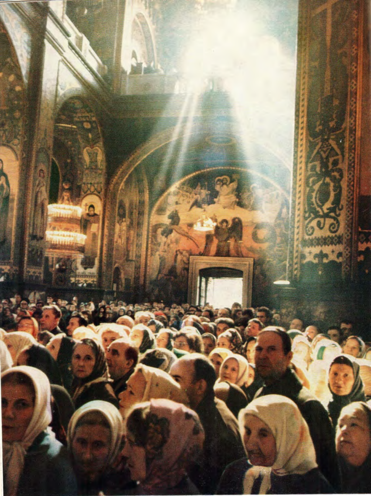
За Божественной литургией в Свято-Владимирском кафедральном соборе в Киеве