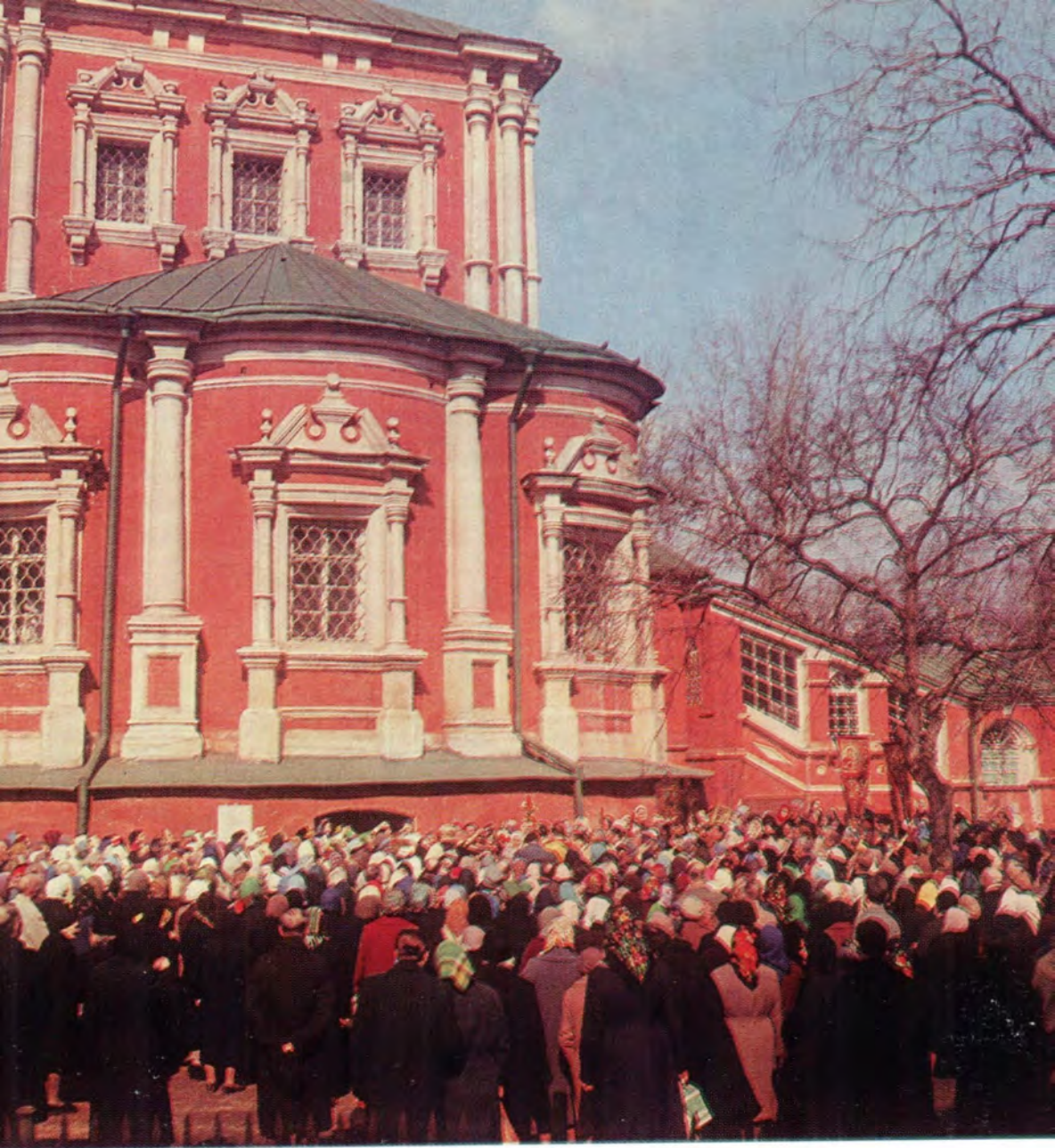
Пасхальный крестный ход вокруг Успенского храма в Новодевичьем монастыре в Москве