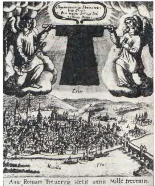
Изображение Хитона Господня на рисунке 1655 г. для паломников — посетителей г. Трира