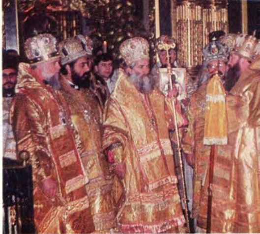
На снимке слева: Святейший Патриарх Пимен в храме во имя апостола и евангелиста Иоанна Богослова в Ленинградской духовной академии 18 декабря 1971 года; справа: митрополит Ленинградский и Новгородский Никодим приветствует Блаженнейшего Патриарха Антиохийского и всего Востока Илию IV в Николо-Богоявленском кафедральном соборе в Ленинграде 19 января 1972 года