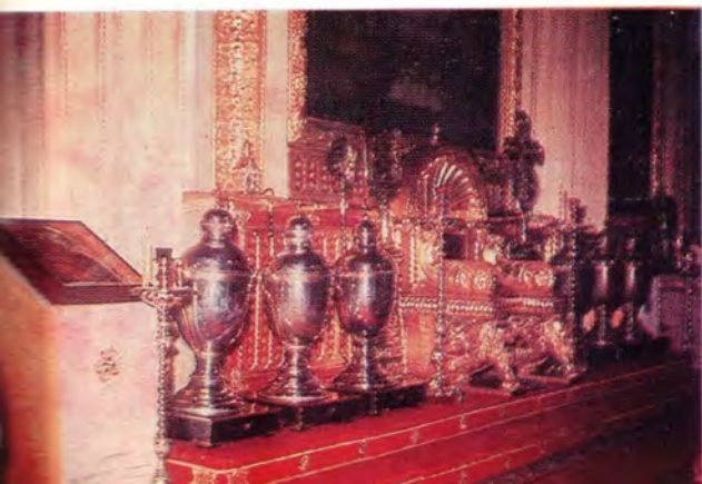
На фото слева: Горнее место в алтаре Богоявленского патриаршего собора в Москве; справа и слева от Патриаршего трона — сосуды со святым миром. На фото справа: святой престол в алтаре Николо-Богоявленского кафедрального собора в Ленинграде