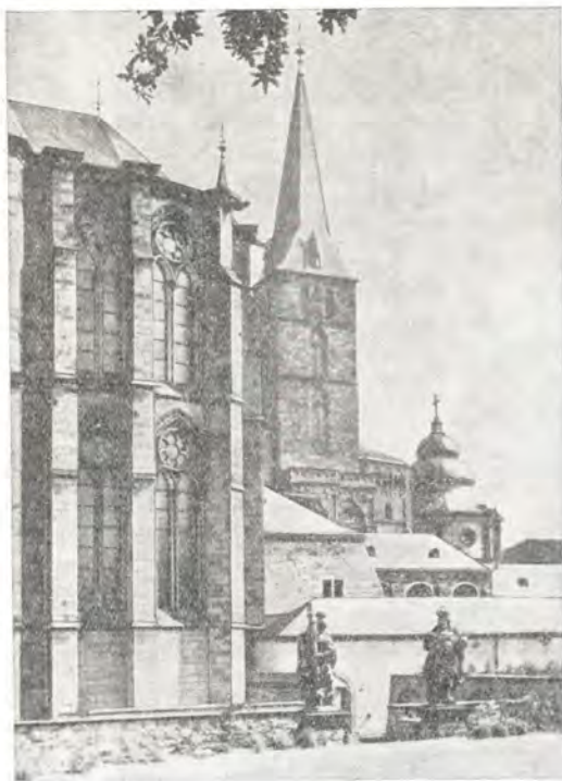
Трир. Кафедральный собор св. ап. Петра (справа) и храм Пресвятой Богородицы (слева). На переднем плане — скульптуры свв. равноапостольных Константина и Елены