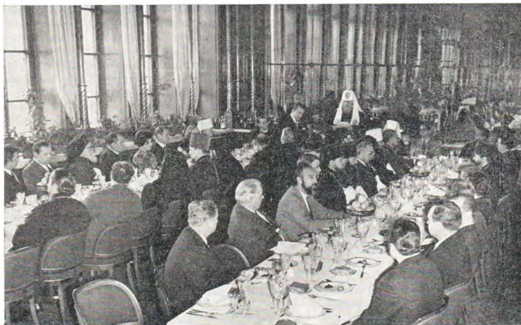
Святейший Патриарх Пимен произносит речь на приеме в честь деятелей ХМК

В тот же день Святейший Патриарх Московский и всея Руси Пимен устроил большой прием в честь деятелей ХМК, на котором присутствовали постоянные члены Священного Синода митрополит Крутицкий и Коломенский Серафим, митрополит Таллинский и Эстонский Алексей, а также архиепископ Волоколамский Питирим, председатель Издательского отдела Московского Патриархата, архиепископ Тульский и Белевский Ювеналий, заместитель председателя Отдела внешних церковных сношений Московского Патриархата, архиепископ Дмитровский Филарет, ректор Московской духовной академии, представители московского духовенства, работники синодальных учреждений, представители Всесоюзного Совета евангельских христиан-баптистов. На приеме были председатель Совета по делам религий при Совете Министров СССР В. А. Куроедов, заместители председателя П. В. Макарецов и В. Г. Фуров. Святейший Патриарх Пимен обратился к участникам приема с речью, текст которой опубликован ниже. С ответным словом выступил президент ХМК митрополит Ленинградский и Новгородский Никодим. Выступали также вице-президенты ХМК д-р Сергио Арсе-Мартинес (Куба), д-р Генрих Хельштерн (Швейцария) и д-р Януш Маковский (Польша). Деятелей ХМК приветствовал председатель Совета по делам религий при Совете Министров СССР В. А. Куроедов.