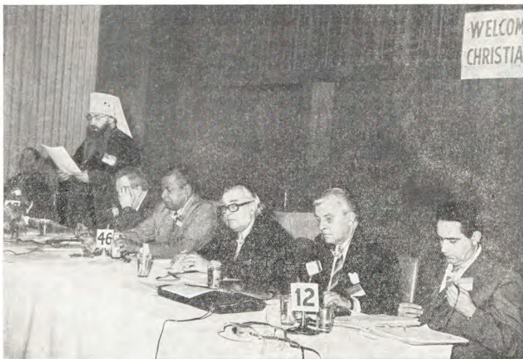
Выступает президент ХМК митрополит Ленинградский и Новгородский Никодим

4. Рабочий комитет выразил надежду, что Китай сыграет свою полную и ответственную роль, как член Организации Объединенных Наций, в содействии миру во всем мире, и что улучшение отношений Китая с определенными западными странами, печально известными агрессивной и эксплуатацией в Азии, не окажется помехой солидарности, безопасности и процветанию других стран Азии, и что эти отношения не примут антисоветский оборот. Рабочий комитет подтвердил принцип, что судьба азиатских стран должна определяться свободной волей самих народов этих стран, а не через их головы другими. Это особенно важно в Индокитае и Южной Азии.