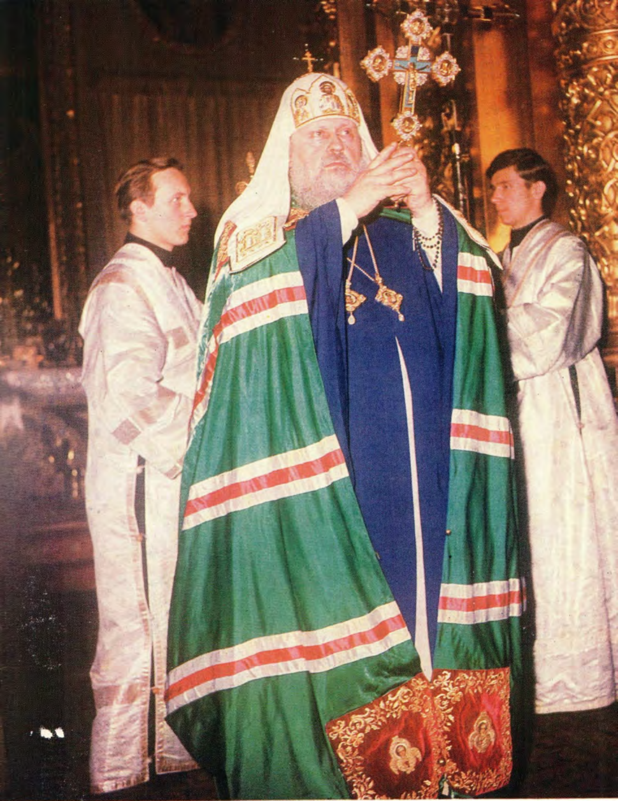
Патриаршее благословение верующему народу после отпуста Божественной литургии в Богоявленском соборе