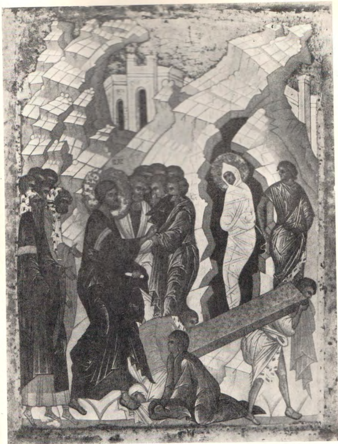
Всех радость, Христос, истина, свет, живот, и мира Воскресение сущим на земли явися Своею благостию, и бысть образ Воскресения, всем подая Божественное оставление (Кондак субботы Лазаревой)