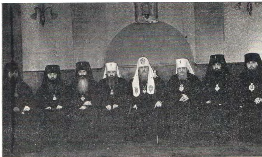
После богослужения 5 марта 1972 года. Слева направо: епископ Подольский Серапион, архиепископ Тульский и Белевский Ювеналий, архиепископ Волоколамский Питирим, митрополит Ленинградский и Новгородский Никодим, Святейший Патриарх Пимен, митрополит Крутицкий и Коломенский Серафим, архиепископ Дмитровский Филарет, епископ Новосибирский и Барнаульский Гедеон

уже готовы произнести: «Да мимондет от мене чаша сия» (Мф. 26, 39), «яко муж грешен есмь, Господи» (Лк. 5, 8).