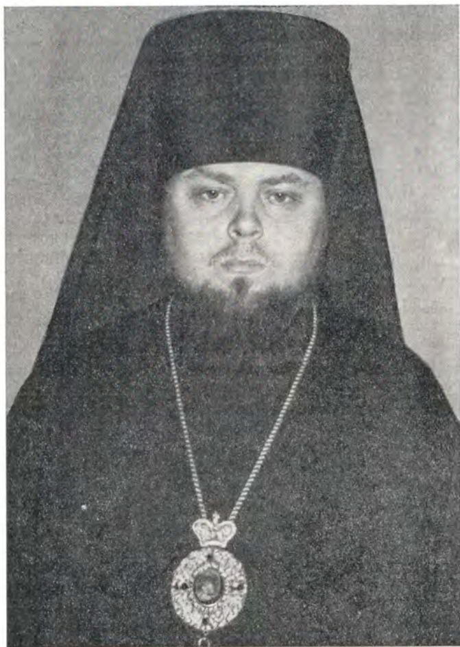
СЕРАПИОН, епископ Подольский

Через епископа Дух Святой «глаголет, дает, разделяет дарования», а у Престола Живоначальной Троицы решает вечную участь человека по неложному слову Самого Господа, сказавшего: «Примите дух Свят: имже от-