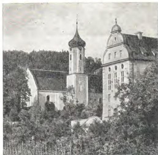
Бенедиктинский монастырь Бойрон

использования листов для совершенно иной записи. В настоящее время стертый текст обычно удаётся прочесть при помощи специальных способов фотографирования.