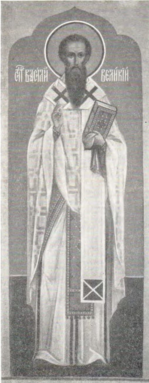
Святой Василий Великий

Аннотация к беседам, публикуемым на русском языке