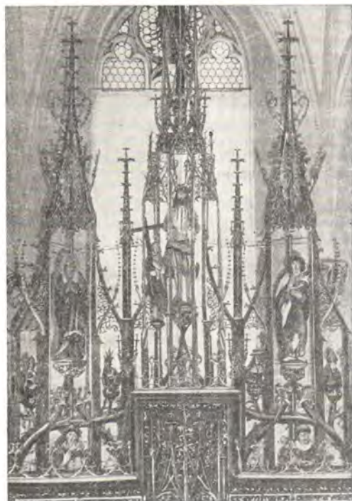
Верхняя часть главного алтаря церкви св. Иоанна Крестителя в г. Блаубойрен

гого Михаила, избравшее этот уголок в качестве места для устройства духовного центра своей деятельности. Братство святого Михаила — одно из многих евангелических братств и сестричеств (общее число их в Федеративной Республике Германии составляло в 1964 году не менее 50), поставивших себе целью оживление духовной деятельности, развитие миссионерства и благотворительности, структурное преобразование внутри Евангелической Церкви в соответствии с новыми потребностями общества. Братство святого Михаила, усвоившее себе имя Архистратига Михаила в знак своего стремления быть верным Богу, как бы постоянно взирая на Него, возникло в 1931 году в Марбурге, выйдя из недр так называемого «Бернойхенского движения», сложившегося еще в 20-х годах нашего столетия. Это движение, в свою очередь, получило название от поместья Бернойхен в Неймарке, где были организованы духовные встречи сторонников церковного обновления. Избрав Кирхберг в качестве нового центра своей деятельности, братство святого Михаила превратило древний монастырь в дом молитвы, братского общения и экуменических встреч, назвав его в память о разрушенном в годы войны Бернойхене «Бернойхенским домом».