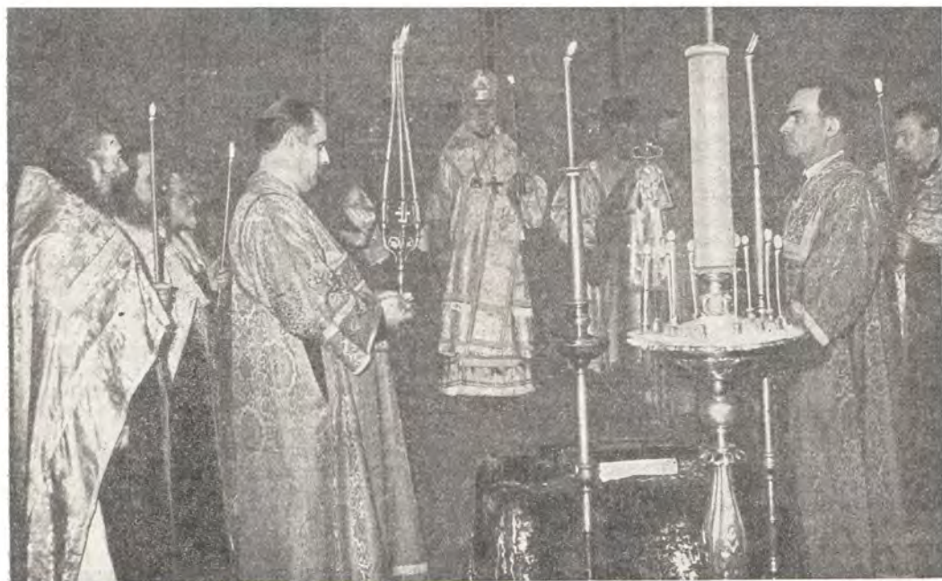
Архиепископ Волынский и Ровенский Дамиан за богослужением в день своего юбилея

Постановлением Святейшего Патриарха Алексия и Священного Синода от 16 марта 1961 года протоиерею Черновицкой епархии