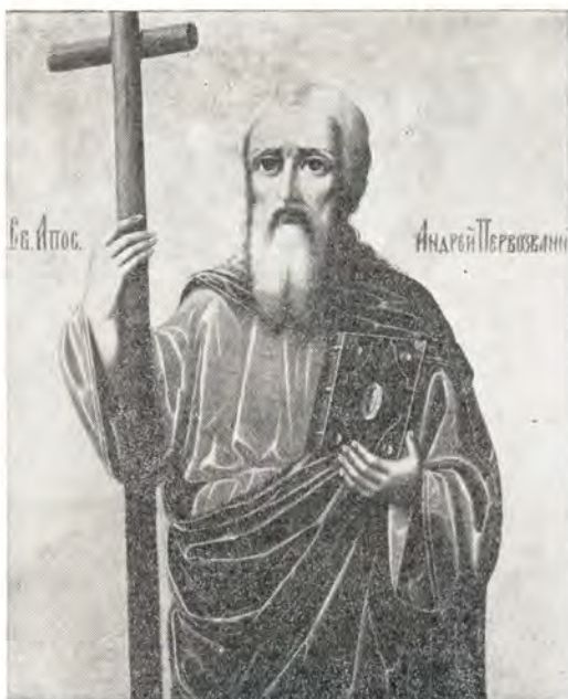
Святой апостол Андрей Первозванный — небесный покровитель Одесской духовной семинарии. Икона XIX века

По инициативе и благословию архиепископа (ныне — митрополит) Херсонского и Одесского Сергия при Одесской духовной семинарии в августе 1967 года был организован церковноархеологический кабинет. Его цель — собрать и сделать более доступными для учащихся предметы церковноархеологического характера, рассказывающие об истории Церкви, ее жизни, искусстве, ближе ознакомить воспитанников со всем многообразием древней русской иконы, с развитием иконописания, с иконографией.