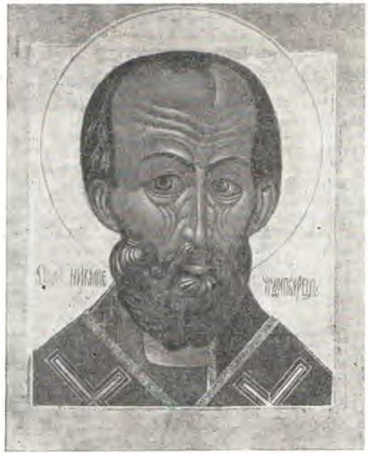
Святитель Николай «оплечный». Икона XVIII века

В витринах помещены образцы старинной и современной церковной утвари.