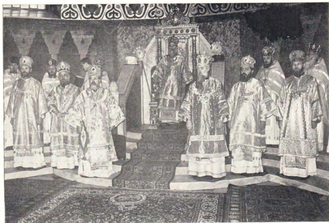
23 января 1972 года. Блаженнейший Патриарх Антиохийский и всего Востока Илия IV за Божественной литургией во Владимирском кафедральном соборе в Киеве.