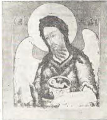
Деисусный чин. XVII век. Из собрания Церковноархеологического кабинета Одесской духовной семинарии (к статье на 16 с.)