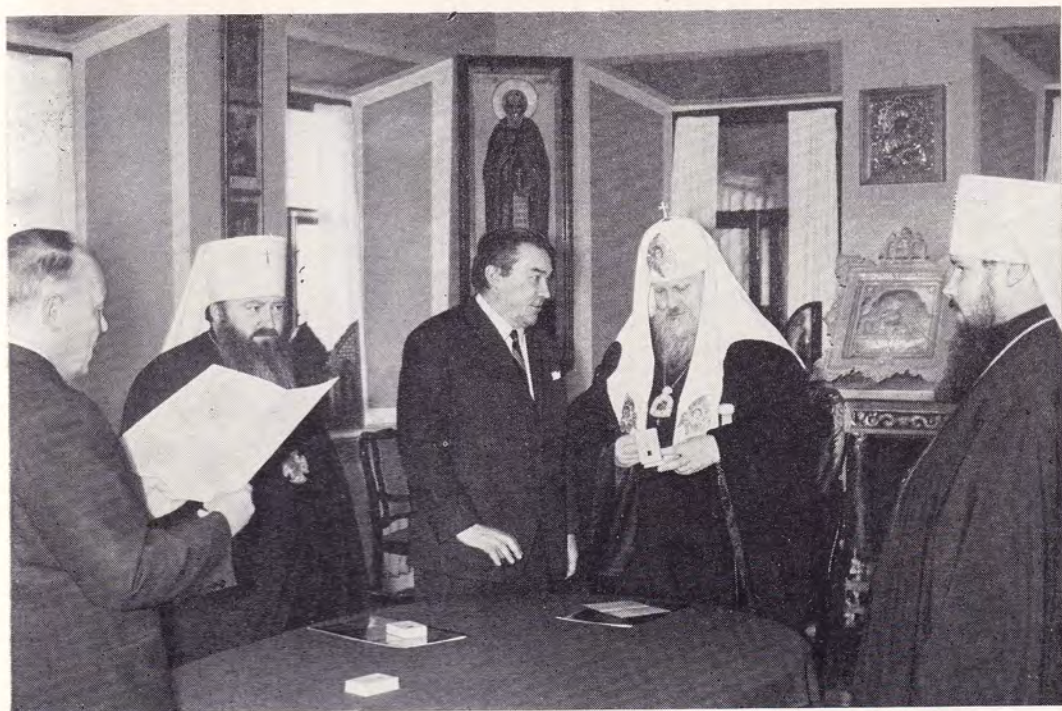
14 декабря 1971 года. Председатель правления Советского Фонда мира Б. Н. Полевой вручает Святейшему Патриарху Московскому всея Руси Пимену почетную грамоту и медаль Советского Фонда мира.