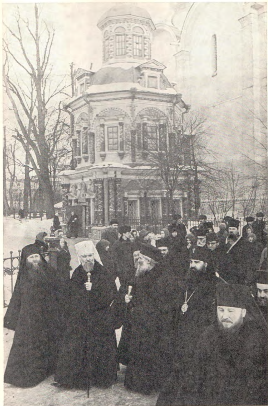
Блаженнейший Патриарх Антиохийский и всего Востока Илия IV в Троице-Сергиевой Лавре