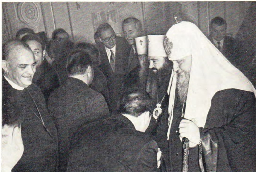
Святейший Патриарх Московский и всея Руси Пимен приветствует участников приема, данного 5 февраля 1972 года в честь деятелей ВСЦ, посетивших Советский Союз проездом в Новую Зеландию на очередное заседание Исполнительного комитета ВСЦ. На фото внизу: на приеме.