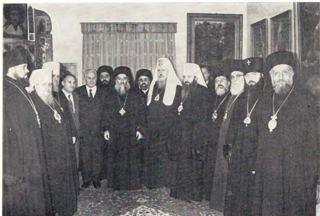
17 января 1972 года. Блаженнейший Патриарх Антиохийский и всего Востока Илия IV и Святейший Патриарх Московский и всея Руси Пимен на приеме, данном в честь Предстоятеля Антиохийской Церкви митрополитом Ленинградским и Новгородским Никодимом.