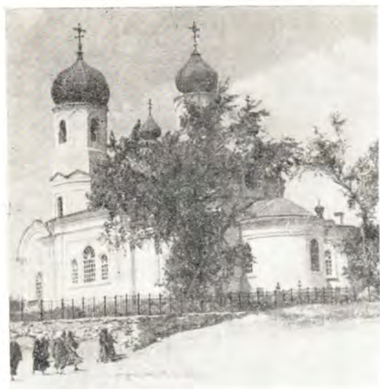
Свято-Димитриевский храм в г. Троицке Челябинской епархии

14 октября, в день праздника Покрова Пресвятой Богородицы, Преосвященный Климент совершил Божественную литургию, а накануне — всенощное бдение в Троицком храме в г. Миассе. 15 октября Владыка молился в Петропавловском храме в г. Коркино, а после литургии совершил молебен Божией Матери и блаженному Андрею, Христа ради юродивому, память которого совершалась в тот день.