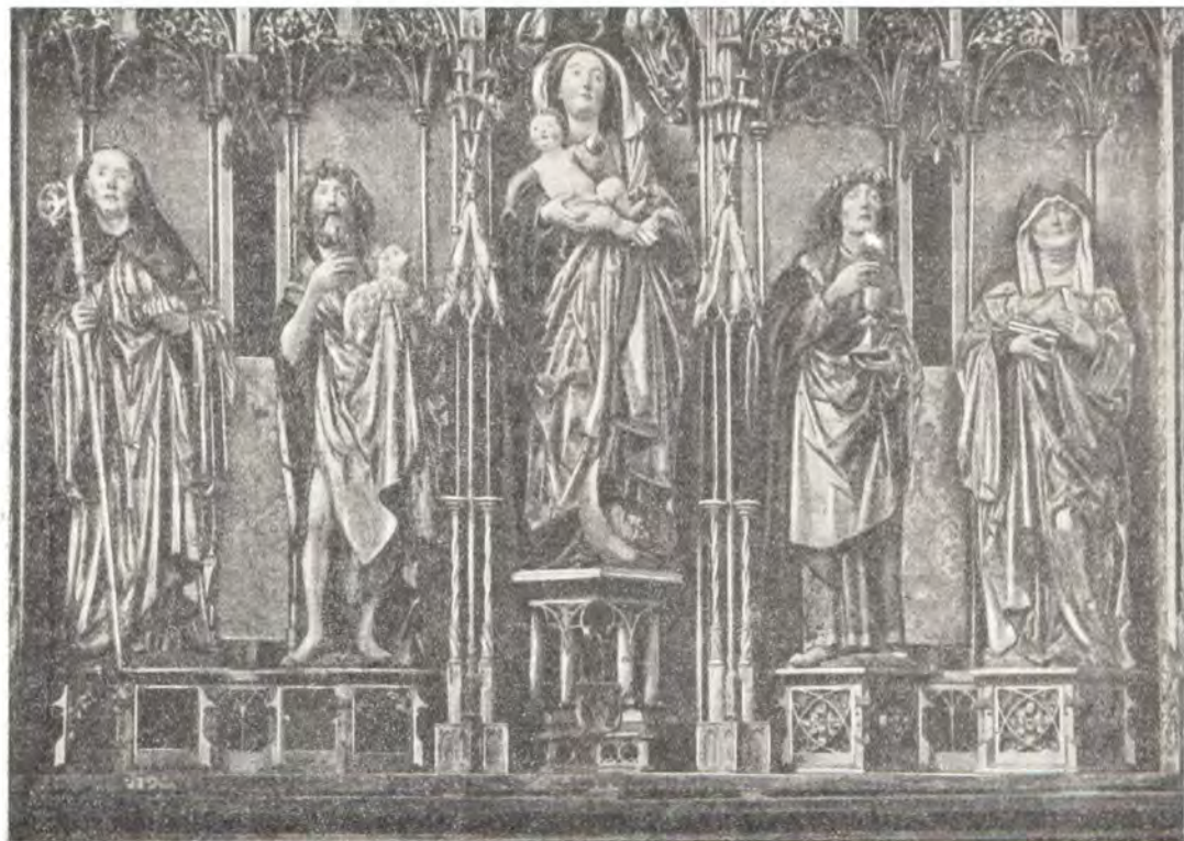
Фрагменты резного иконостаса церкви св. Иоанна Крестителя в г. Блаубойрен

Пия X (1903—1914) благодаря его «Моту проприо» от 1903 года, восстановившему традиционное употребление григорианского пения в литургии, его декретам, рекомендовавшим частое, — и даже ежедневное, причащение (1905 г.) и причащение детей (1906 г.) и другим мероприятиям. Одной из практических задач движения стало обучение мирян с целью дать им более глубокое понимание общественного богослужения, сделать сознательным их участие в богослужении посредством совместного чтения или пения ответов во время мессы и других церковных служб, помочь им установить более тесную связь между общественным богослужением и домашней молитвой. Монастырь Бойрон знаменит своими торжественными богослужениями, органическими концертами, заботой о религиозном искусстве. Многих посетителей привлекает его роскошный храм в стиле барокко и часовня с «пниетой», т. е. с изображением Богоматери, скорбно склонившейся над бездыханным телом Сына. Монастырь славится также своей богатейшей библиотекой и двумя научно-исследовательскими институтами: институтом «Ветус Латина» и институтом палимпсестов. Первый из них представляет собой учреждение для содействия изданию полного собрания всех сохранившихся остатков древнелатинских переводов Библии, находящихся в рукописях и цитатах у древних писателей. Второй институт занимается изучением палимпсестов, т. е. древних манускриптов из пергамента или папируса, на которых первоначальный текст был стерт, смыт или выскоблен ради вторичного