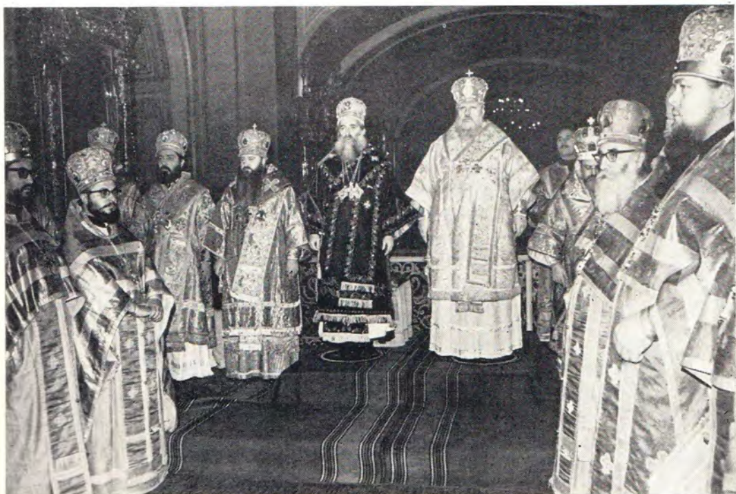
16 января 1972 года. Блаженнейший Патриарх Антиохийский и всего Востока Илия IV и Святейший Патриарх Московский и всея Руси Пимен в сослужении иерархов и клириков Антиохийской и Русской Церквей совершают Божественную литургию в Богоявленском патриаршем соборе.