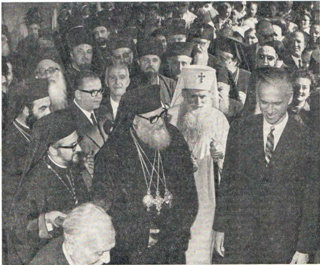
Освящение нового здания Александрийской Патриархии. Справа налево: губернатор Александрии д-р Фуад Мохиддин, Патриарх Румынский Юстиниан, Патриарх Александрийский Николай VI, епископ Елевсинский Тимофей. На втором плане — члены делегации Московского Патриархата: епископ Виленский и Литовский Гермоген и настоятель Александро-Невского храма в Александрии прот. А. Казновецкий

Освящение нового здания состоялось 21 ноября 1971 года. На торжество по приглашению Его Блаженства Патриарха Александрийского и всей Африки Николая VI прибыли делегации Православных Церквей: от Констан-