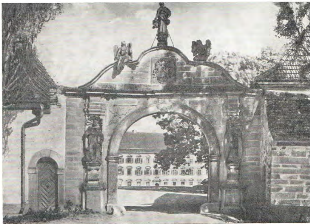
Бывший доминиканский монастырь Кирхберг — место собеседований «Арнольдсхайн-У»

Бывший женский монастырь доминиканского ордена Кирхберг был основан в 30-е—40-е годы XIII века в уединенной местности среди лесистых холмов, в отдалении от ближайших селений не менее чем на один час ходьбы. Он и поныне лежит в стороне от дорог, и характерную черту его составляют тишина и прекрасный вид на горные хребты Шварцвальда и Швабских Альп. После почти шестивековой истории своего существования среди многих испытаний (из-за конфликтов между соседними владельцами, из-за эпидемии чумы и т. п.) монастырь пришел в упадок в связи с завоеваниями Наполеона и последовавшей за ними секуляризацией имущества. Последняя монахиня умерла в монастыре в 1856 году. Здания монастыря ветшали, а иногда использовались даже в качестве «каменоломни» для сооружения других зданий в окрестностях. Перемена наступила лишь столетие спустя, когда в 1958 году на здания монастыря обратило внимание евангелическое братство свя-