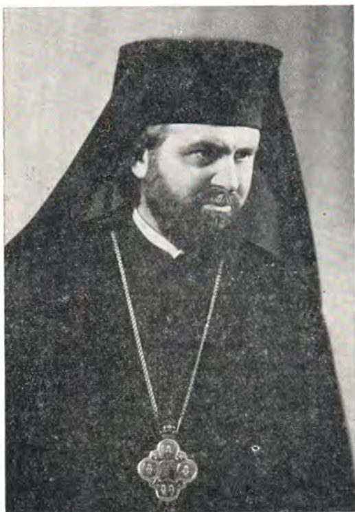
КАЛЛИНИК, епископ Величский

Болгарская Церковь. Епископская хиротония. 6 декабря 1971 года за Божественной литургией в патриаршем кафедральном соборе во имя св. благоверного великого князя Александра Невского и Софии Патриарх Болгарский Максим с находившимися в Софии архиереями Болгарской Церкви хиротонисал во епископа Величского — викария Сливенской митрополии — протосингела этой митрополии архимандрита Каллиника.