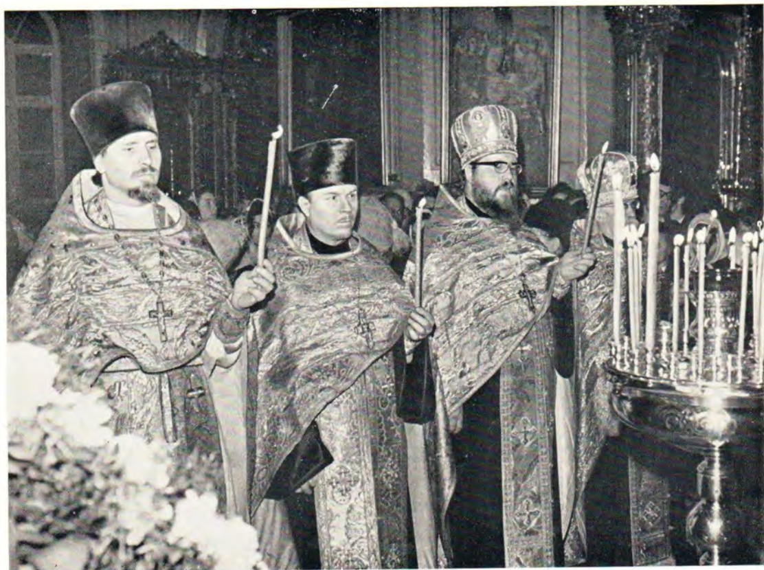
Рождественскую утреню в ночь с 6 на 7 января 1972 года в Богоявленском патриаршем соборе