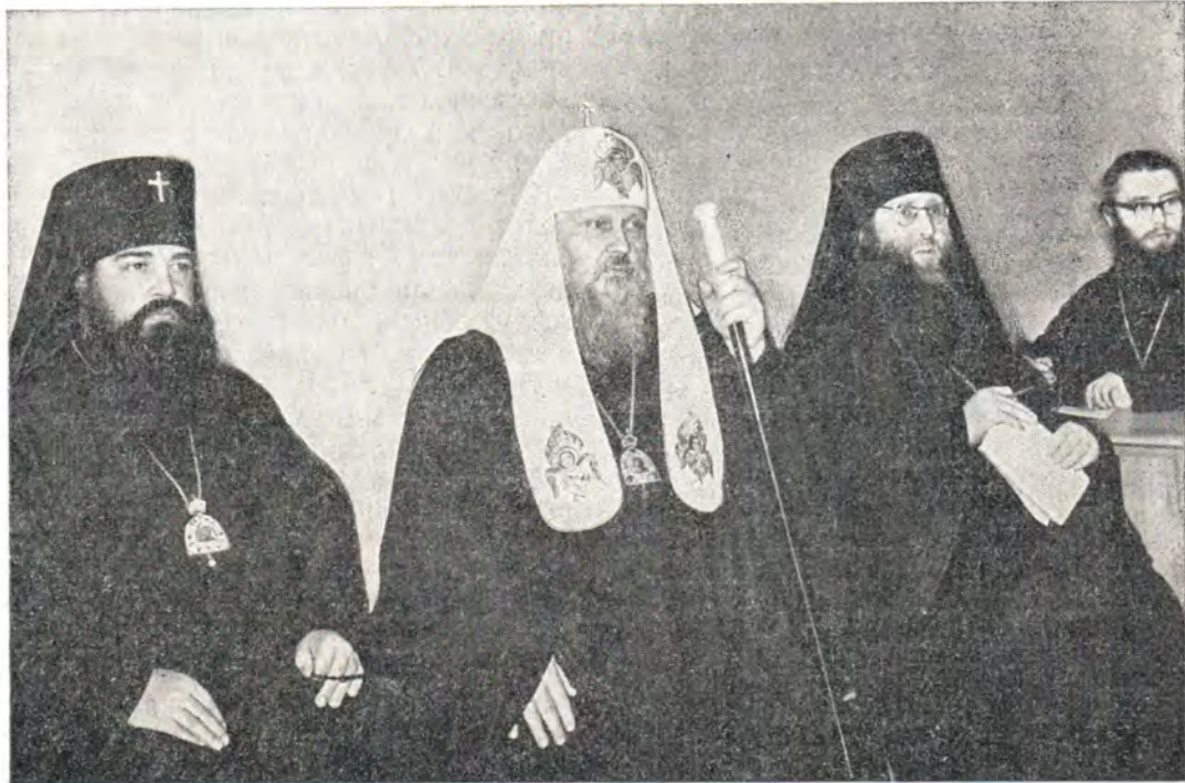
Святейший Патриарх Московский и всея Руси Пимен

Радушные приема, общая трапеза, само общение с Предстоятелем Церкви оказали глу-