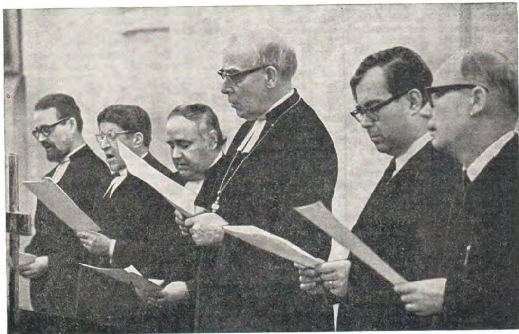
Делегаты Евангелическо-Лютеранской Церкви Финляндии во время пения гимна «Te Deum laudamus» [Тебе, Бога, хвалим] в день открытия собеседования в Загорске

В соответствии с этим пожеланием обе стороны в ходе настоящего собеседования продолжали изучение евхаристической проблемы и, заслушав соответствующие доклады обеих сторон, обсудили их в духе взаимного внимания и христианской любви.