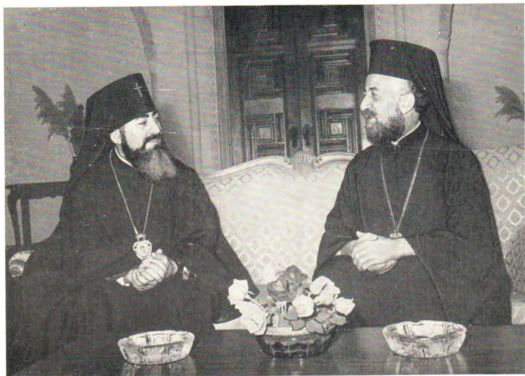
Архиепископ Ростовский и Новочеркасский Владимир на приеме у Президента Республики Кипр Блаженнейшего Архиепископа Макария 5 ноября 1971 года