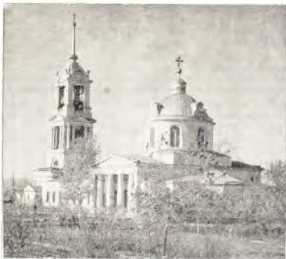
Успенский собор в г. Задонске