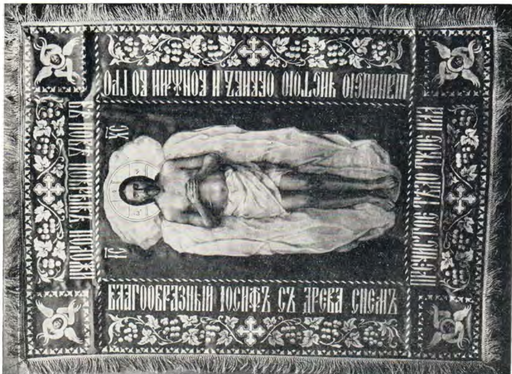
Святая Плащаница из Боявленского патриаршего собора. XIX век.