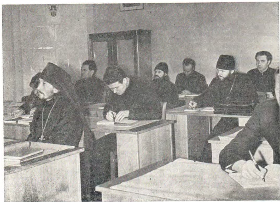
на лекциях в Московской духовной академии