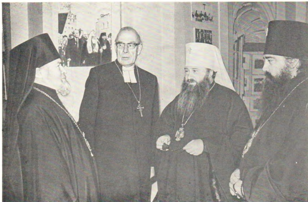
Участники собеседований: епископ Михаил, архиепископ Мартти Симойоки, митрополит Никодим, архиепископ Филарет