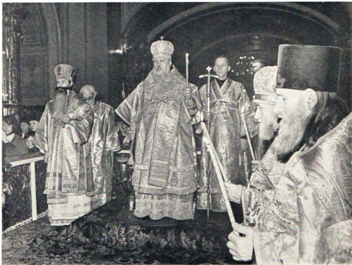
совершают Святейший Патриарх Пимен и архиепископ Волоколамский Питирим