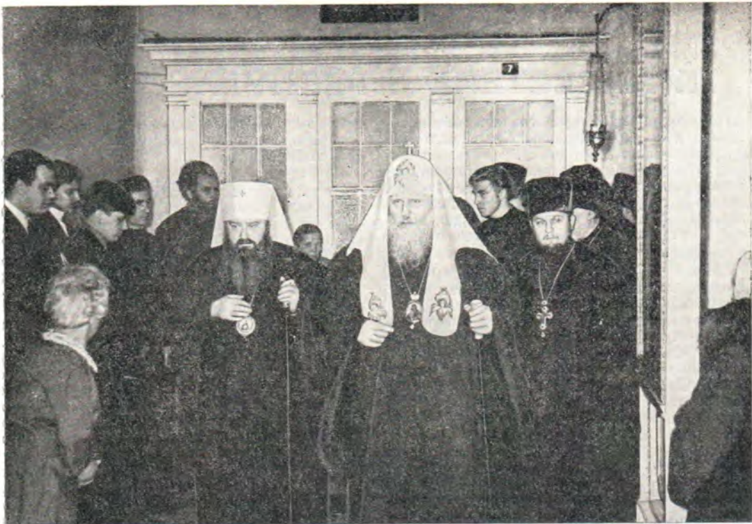
Святейший Патриарх Пимен и митрополит Ленинградский и Новгородский Никодим в Ленинградской духовной академии 20 декабря 1971 года

Ленинградской епархии в дело подготовки и проведения Поместного Собора Русской Православной Церкви 1971 года.