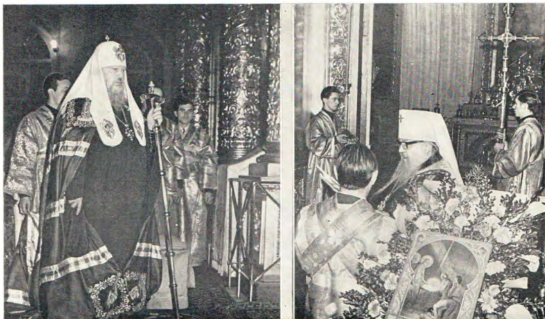
9 января 1972 года в патриаршем соборе. Митрополит Крутицкий и Коломенский Серафим поздравляет Святейшего Патриарха Пимена с праздником Рождества Христова