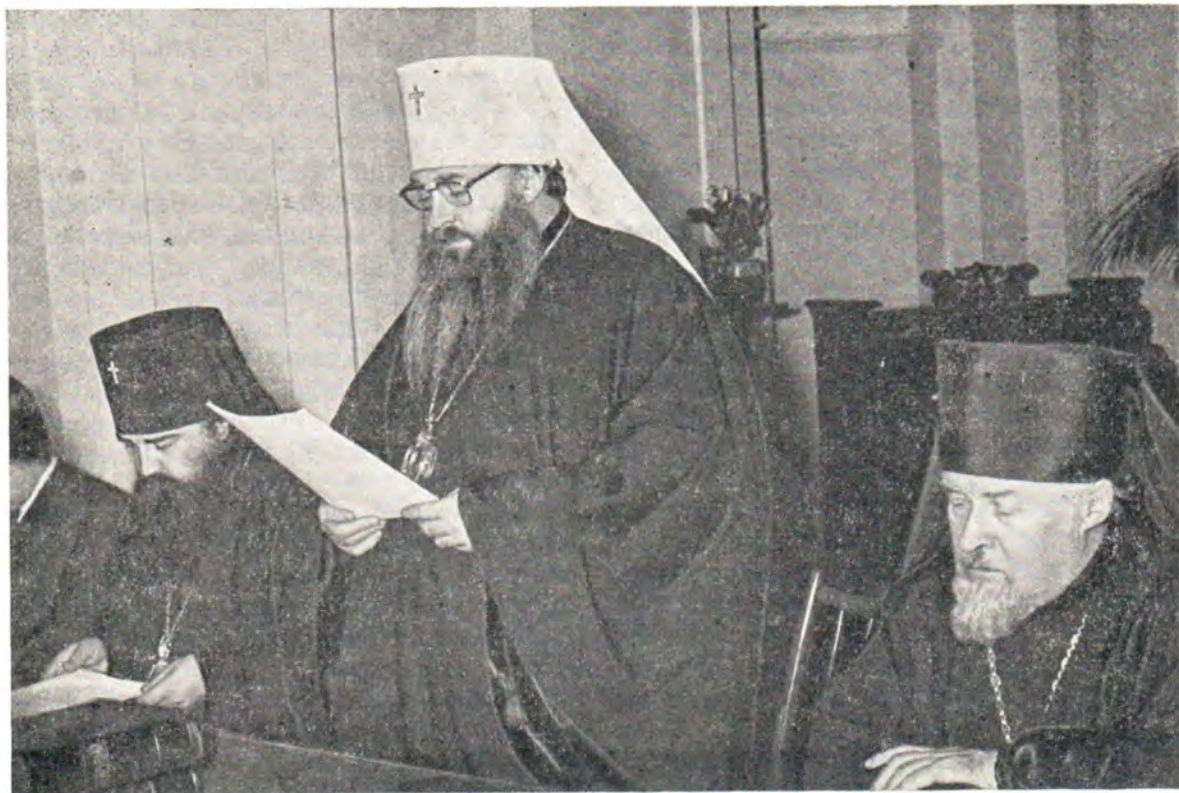
Митрополит Ленинградский и Новгородский Никодим выступает с речью перед участниками II богословского собеседования в Загорске

присущ православному сознанию в соответствии со Священным Преданием Церкви, и особенно отчетливо отражается в литургической практике. Уже до начала евхаристического богослужения, в так называемых входных молитвах, священник молится об укреплении его к совершению бескровного священнодействия, а в первой молитве верных и в других молитвах говорится о бескровной жертве и жертве хваления, приносимой о наших грехах и о людских неведениях (Евр. 9, 7). В молитве Херувимской песни литургия названа священнодействием бескровной жертвы, в которой Спаситель мира является Первосвященником и Жертвой, Приносящим и Приносимым. В одной из Херувимских песен поется о том, что «Царь царствующих и Господь господствующих приходит заклатися и датися в снедь верным». Наконец, возглас «Твоя от Твоих, Тебе приносяще» указывает, что эта жертва «о всех и за вся». Она, эта жертва, всеобъемлюща, ибо не ограничена пределами пространства, и она вечна, ибо