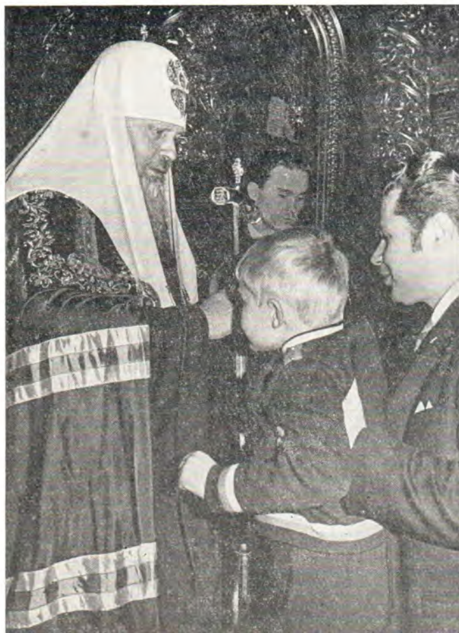
9 января 1972 г. в Богоявленском патриаршем соборе. Традиционное поздравление Святейшего Патриарха Пимена с праздником Рождества Христова

тая окружающий мир духом единения и любви, молитвенным вниманием к его нуждам и постоянными заботами о нравственном просветлении. Она служит делу спасения мира своим сочувствием человеческим страданиям, посильной помощью в народных бедствиях, осуждением несправедливости, участием в борьбе за международный мир и постоянным напоминанием о тех условиях, в которых люди и народы могут быть друзьями и братьями.