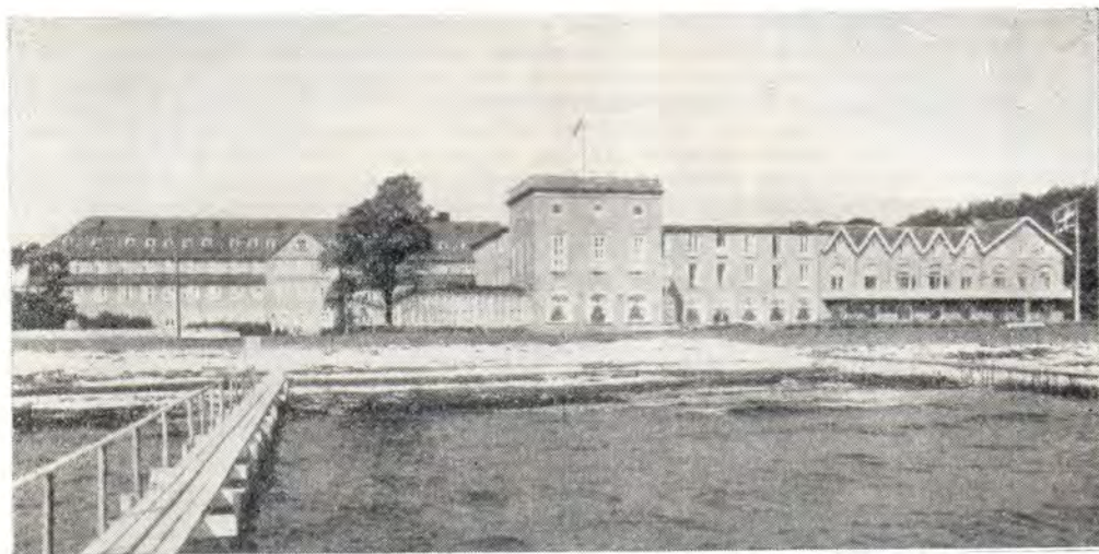
Гостиница «Ниборг Странд», где проходила Ассамблея «Ниборг-VI»

На следующий день предстояло совершить путешествие на автобусе от Копенгагена до Ниборга. Это была интересная поездка по стране, через морской пролив на пароме, по острову Фюн, на котором расположен Ниборг — средневековая столица Дании, а теперь небольшой курортный городок с 12 тысячами жителей. Ниборг, история которого длится уже около семи столетий, стал символическим наименованием для европейских церковных ассамблей со времени первого, организационного заседания здесь учредителей Конференции Европейских Церквей, среди которых были представители Русской Православной Церкви и Евангелическо-Лютеран-