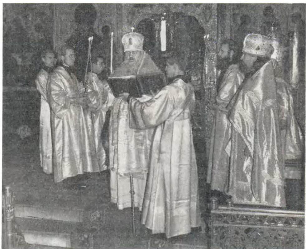
30 мая 1971 года. Патриарший Местоблюститель Митрополит Пимен произносит слово перед молебном Преподобному Сергию в Троицком соборе

Троицкой Лавре у гробницы Преподобного Сергия Радонежского и вся Россия чудотворца, чтобы испросить у него небесное благословение и помощь Божию на предстоящие деяния Поместного Собора, на котором нам предстоит обсудить и решить вопросы, назревшие в настоящее время в нашей Церкви, и прежде всего избрать Патриарха Московского и всея Руси на вдовствующую Патриаршую кафедру. Преподобный Сергей в жизни Русской Церкви—явление величайшее. Святость жизни, его труды на благо Церкви, его вклад в объединение русских земель вокруг Москвы и защита мирной жизни нашей Родины имеют непреходящее значение. Всем своим обликом, делами евангельской любви, словом христиан-