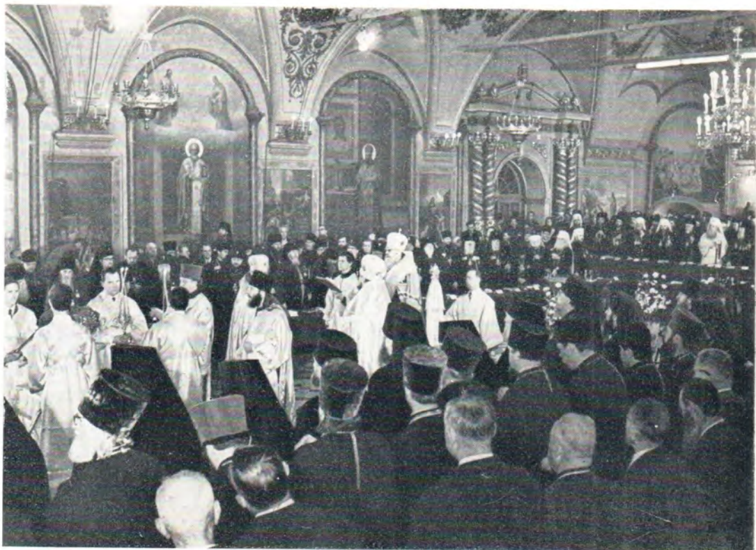
30 мая 1971 г. Сергиевский трапезный храм. Торжественный молебен перед началом работы Поместного Собора