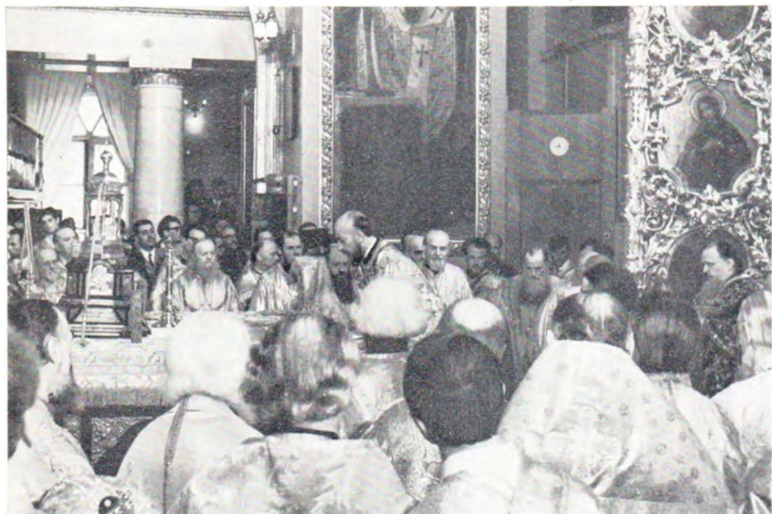
3 июня 1971 г. За Божественной литургией в алтаре Богоявленского патриаршего собора