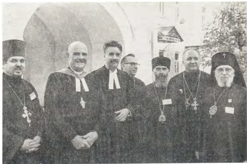
30 мая 1971 года. Участники Поместного Собора (справа налево): архиепископ Дюссельдорфский Алексей, протоиерей Василий Кречик, митрополит Сурожский Антоний, протоиерей Георгий Бурдыков (Московский Патриархат); д-р Глен Г. Вильямс, генеральный секретарь КЕЦ; д-р Юджин К. Блейк, генеральный секретарь ВСЦ; протоиерей Павел Соколовский (Московский Патриархат)