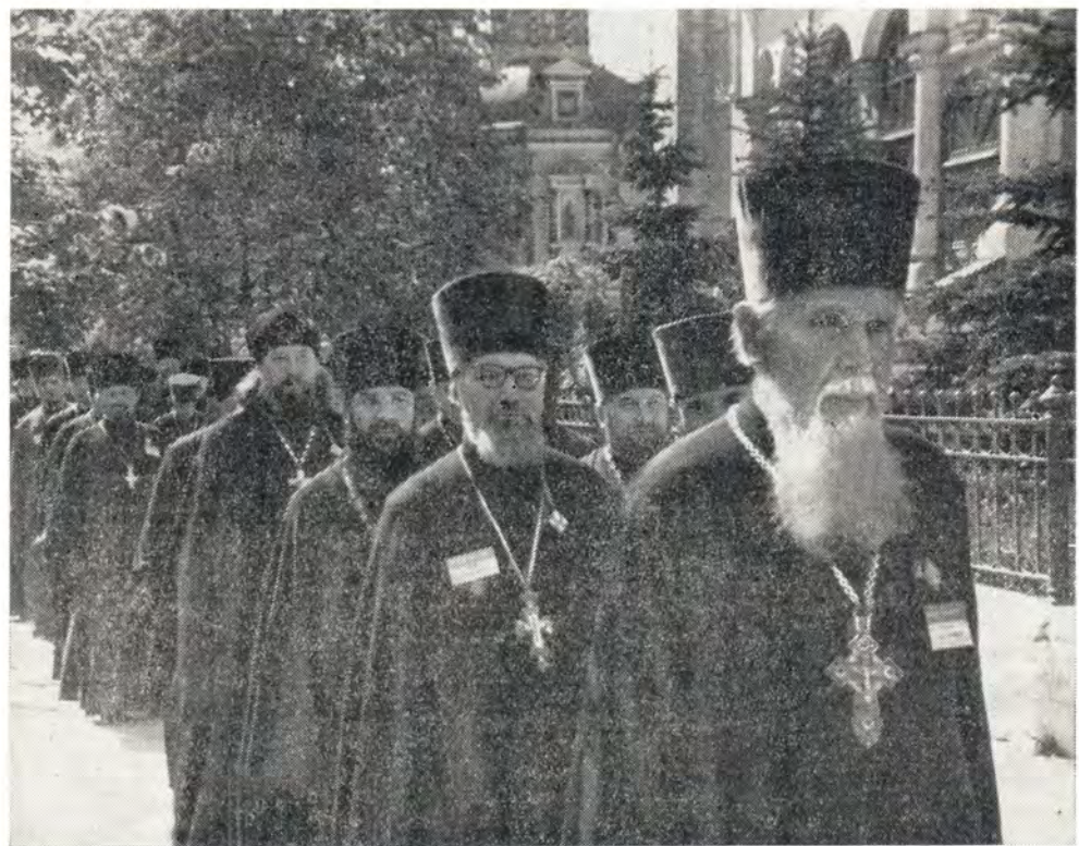
Клирики — члены Поместного Собора направляются к Святым вратам Троице-Сергиевой Лавры на встречу почетных гостей Собора 30 мая 1971 года