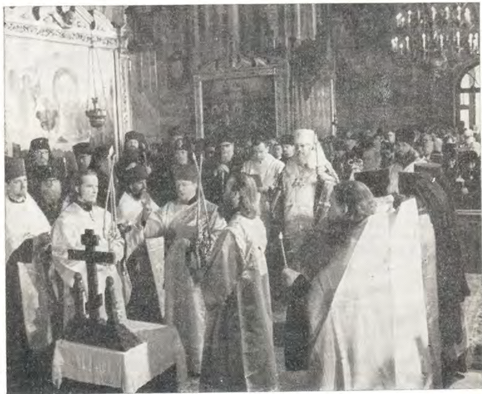
31 мая 1971 года. Патриарший Местоблюститель Митрополит Пимен совершает панихиду по почившим Всероссийским Патриархам

Участники заседания вышли на галерею, огибающую трапезный храм, — гульбище. Гульбище стало своеобразными кулуарами третьего заседания Собора. И, как водится в подобных случаях, когда все в сборе и можно найти любого человека, непроизвольно и легко возникали то тут, то там небольшие группы оживленно беседовавших