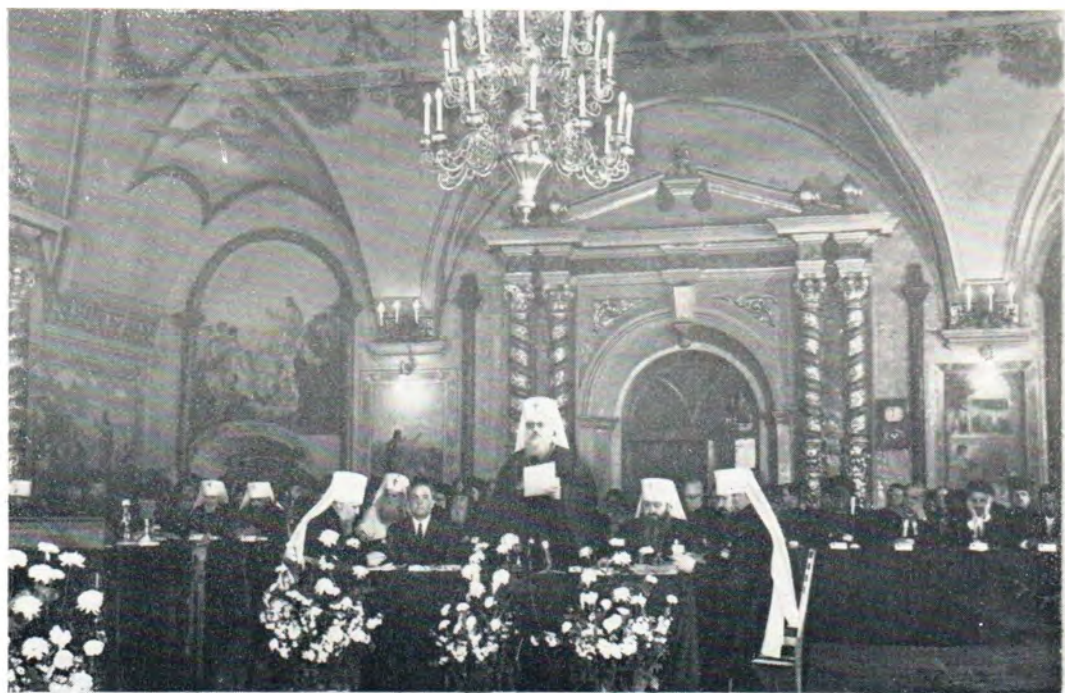
30 мая 1971 г. Патриарший Местоблюститель Митрополит Крутицкий и Коломенский Пимен произносит слово перед открытием Поместного Собора