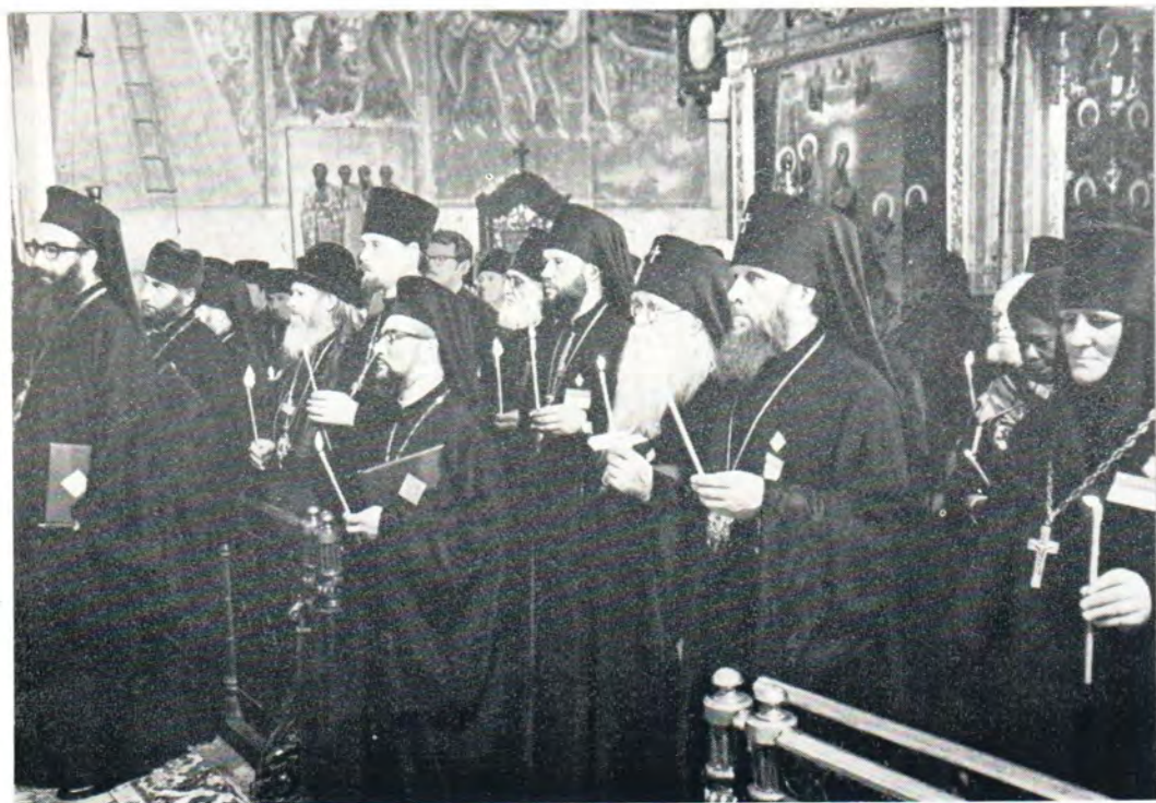
31 мая 1971 г. Участники Поместного Собора в Успенском храме Лавры на панихиде по почившим Всероссийским Патриархам