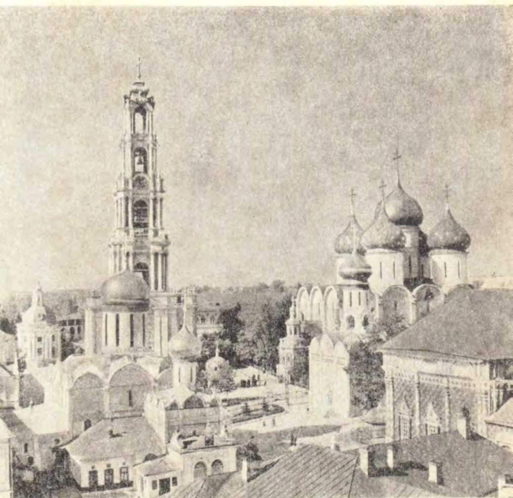
Общий вид Троице-Сергиевой Лавры