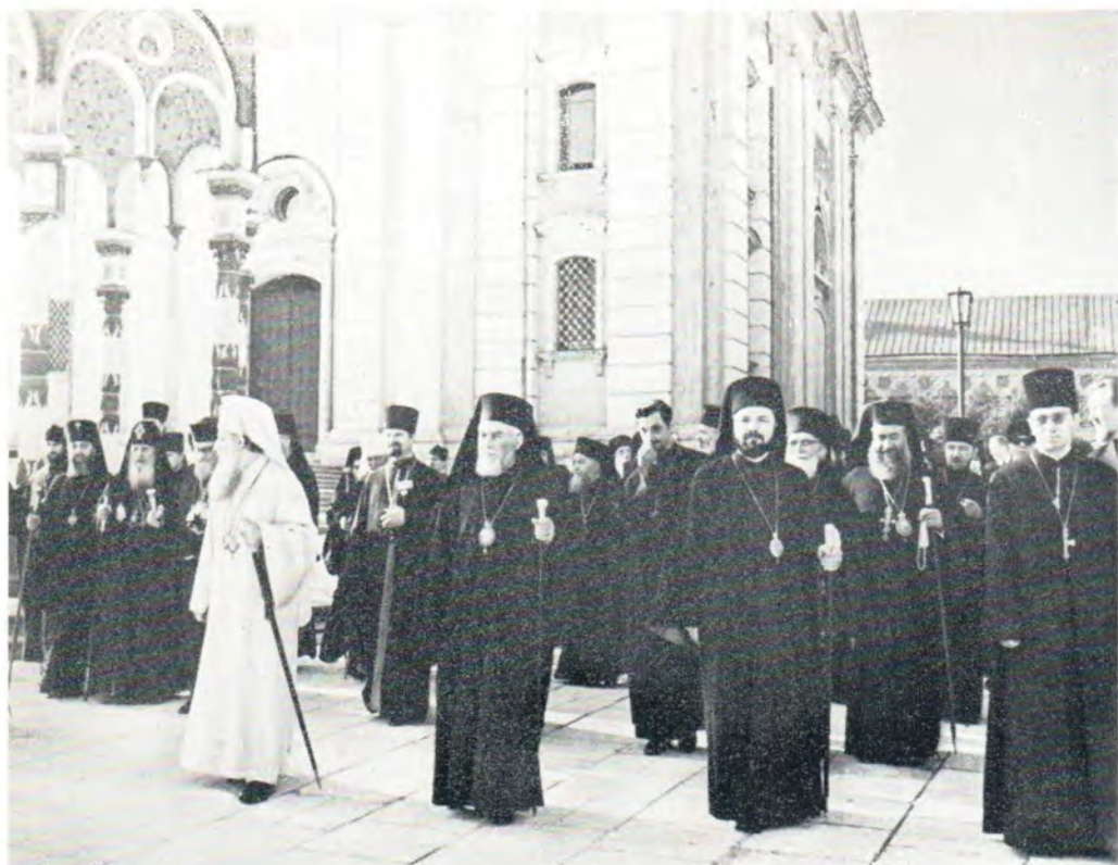
30 мая 1971 г. Почетные гости — Главы и представители Православных Церквей направляются в Сергиевский трапезный храм на первое заседание Поместного Собора