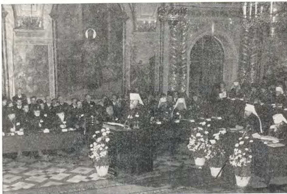
31 мая 1971 года. Второе заседание Поместного Собора. Патриарший Местоблюститель Митрополит Пимен выступает с докладом

Богомудрые святейшие Патриархи, хотя и жили в различные времена истории нашей Церкви, требовавшие от каждого из них особых первосвятительских забот и трудов, однако всех их, преданных слу-