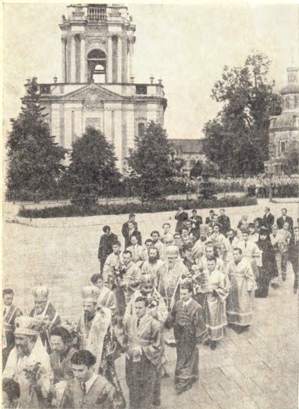
Шествие участников Поместного Собора