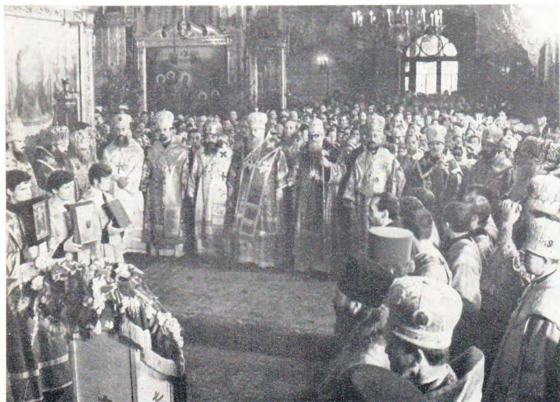
Главы и представители Православных Церквей в праздник Святой Троицы за литургией в Успенском соборе Троице-Сергиевой Лавры 6 июня 1971 года