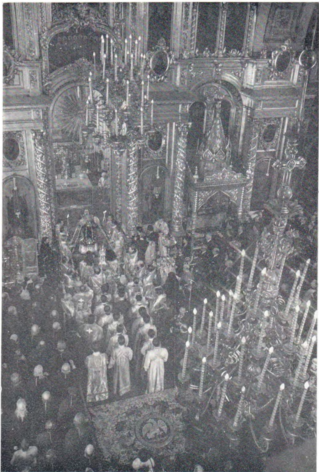
В день интронизации, 3 июня 1971 г., Святейший Патриарх Московский и всея Руси Пимен за Божественной литургией в Богоявленском патриаршем соборе в Москве