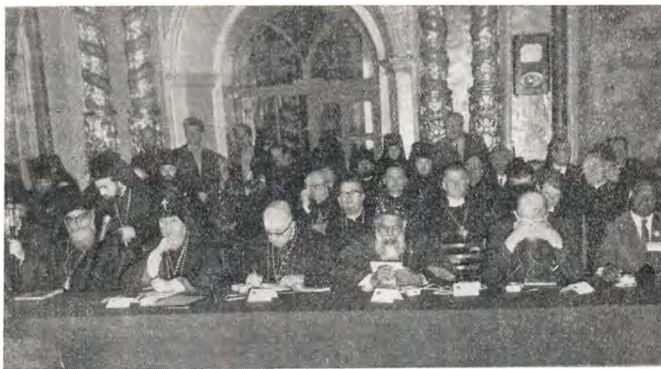
Почетные гости на шестом заседании Поместного Собора 2 июня 1971 года. В первом ряду (слева направо): Патриарх Александрийский Николай VI; Верховный Патриарх-Католикос всех армян Вазген I; кардинал Иоанн Виллебрандс; митрополит Мар Теофинос Филиппос; д-р Ю. К. Блейк; г-н С. Амиссах