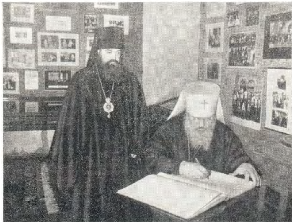
Патриарший Местоблюститель Митрополит Пимен делает запись в книге почетных посетителей. Слева — епископ Дмитровский Филарет