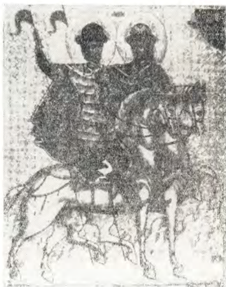
Святые благоверные князья Борис и Глеб