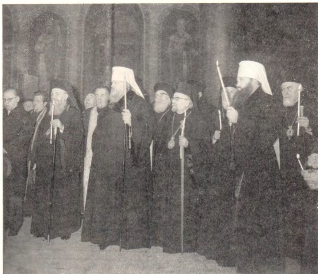
Погребение Святейшего Патриарха Болгарского Кирилла. Заупокойное богослужение в соборе св. Марины в Пловдиве 10—11 марта 1971 года