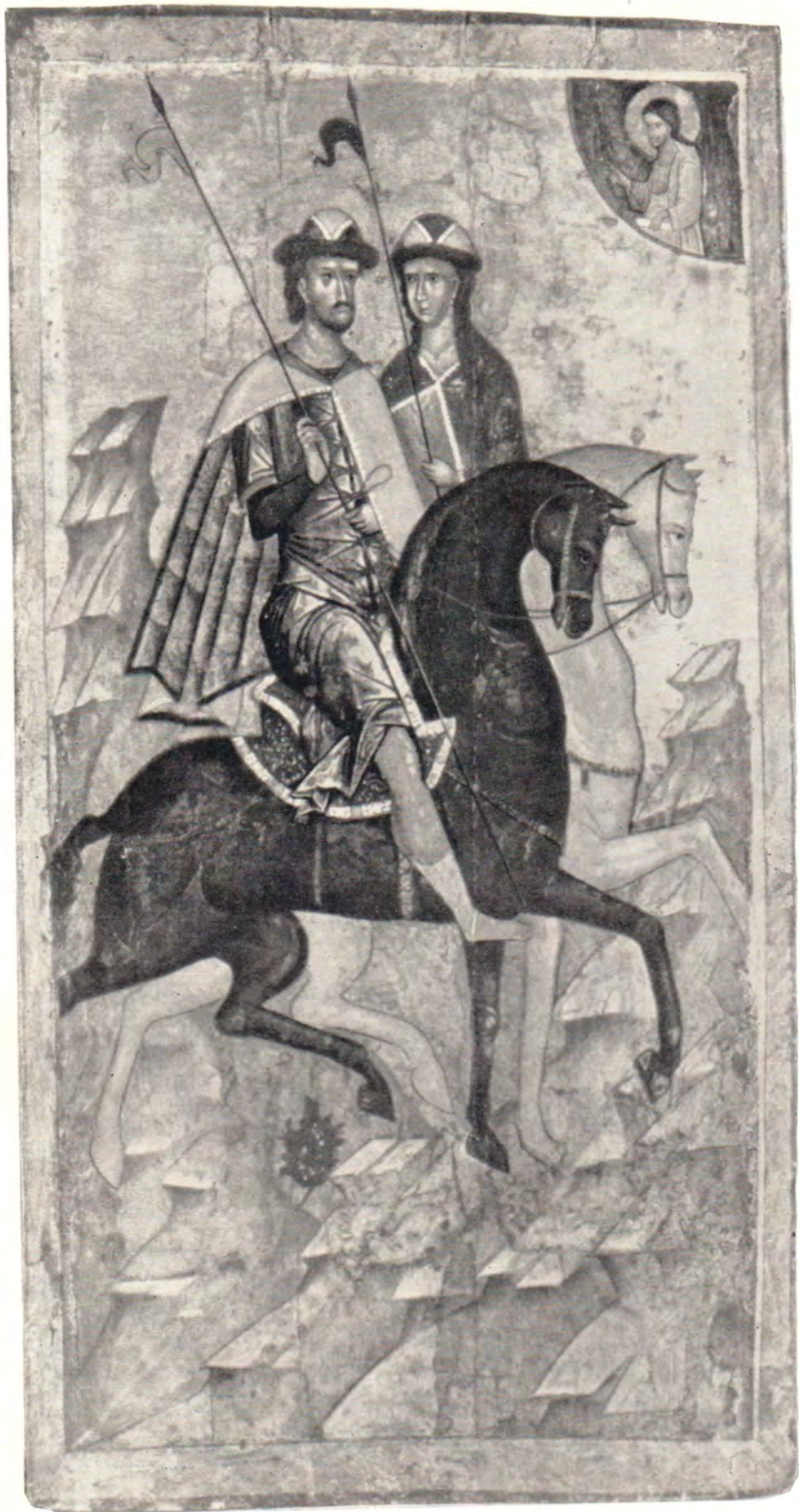
Святые страстотерпцы Борис и Глеб

Московская икона первой половины XIV века