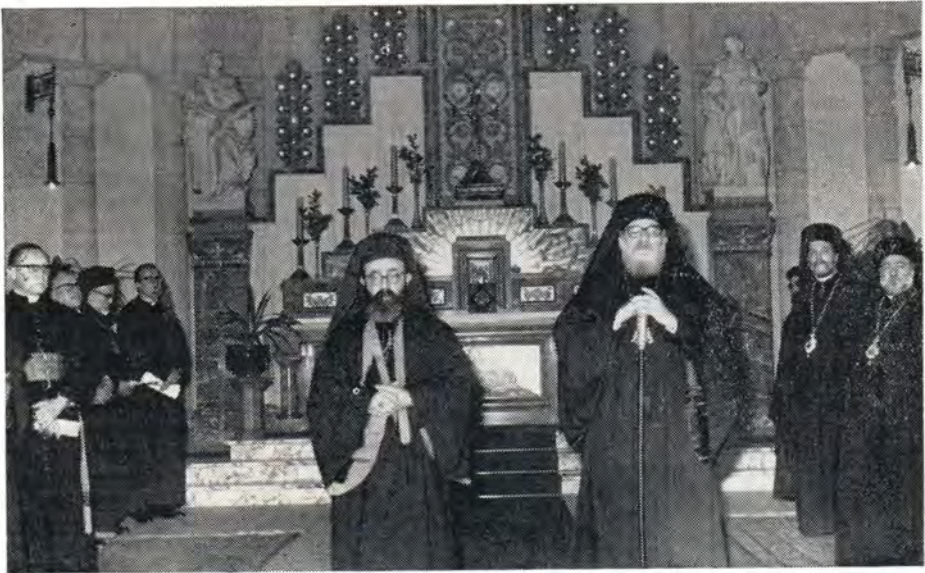
Экуменическая молитва в католическом храме св. апостола Марка в Александрии 22 января 1971 года. В центре справа: Блаженнейший Николай VI, Папа и Патриарх Александрийский и всей Африки

Главной его задачей является подготовка и проведение ежегодной совместной молитвы. Эта экуменическая молитва, совершаемая каждый раз в разных храмах го-