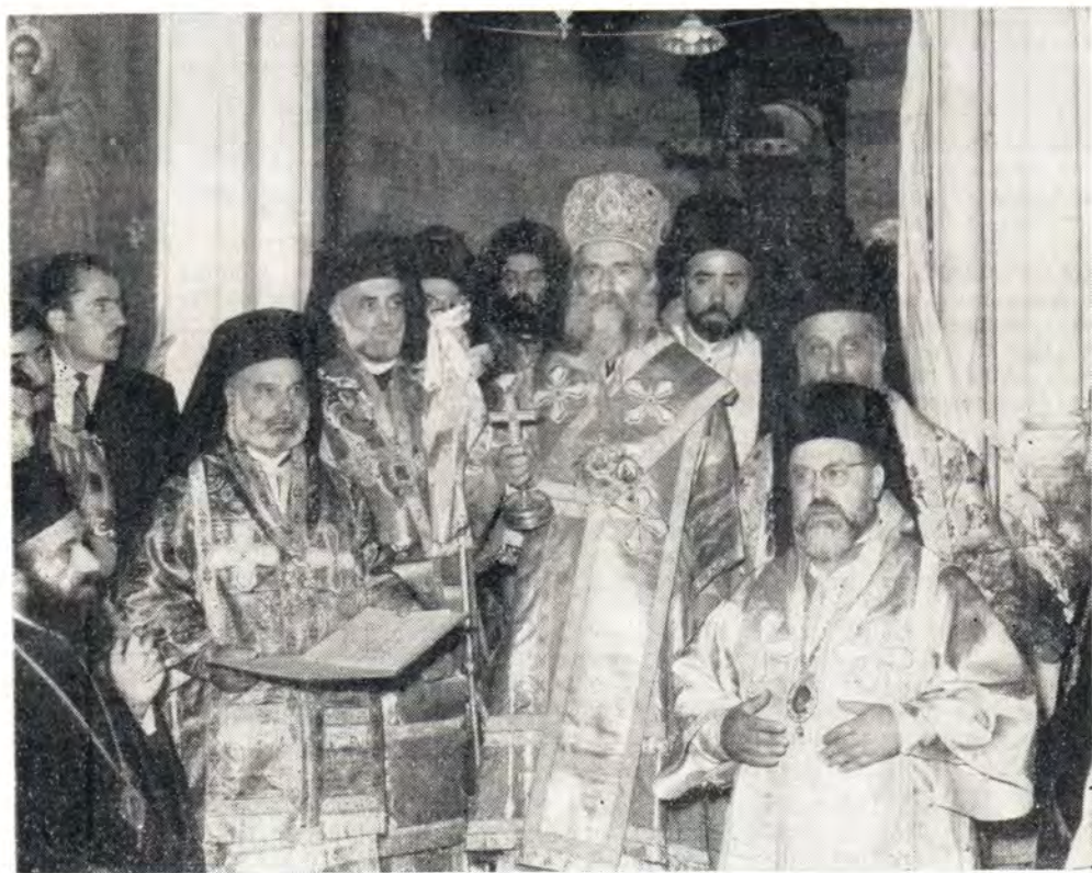
В кафедральном соборе в Дамаске в день интронизации Блаженнейшего Патриарха Антиохийского Илии IV 27 сентября 1970 года (см. «ЖМП», 1971, № 2, с. 48—53)