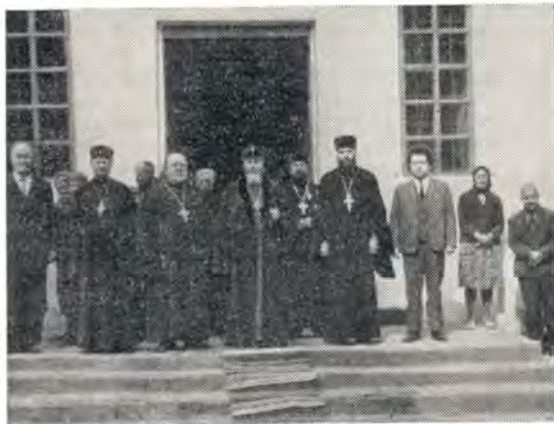
У входа в Крестовоздвиженский храм в пос. Кодыма