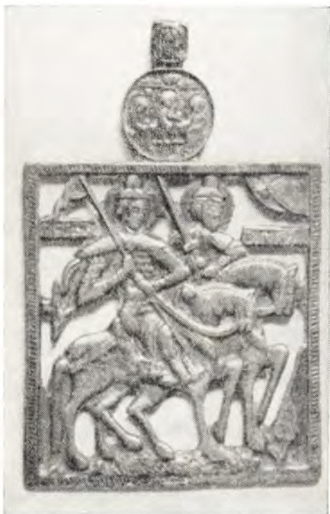
Святые Борис и Глеб Прозрезное литье XV века

Русские церковные месяцесловы под 2 мая отмечают перенесение мощей святых князей русских Бориса и Глеба, празднование которым установлено в 1072 году. Это знаменательное событие особенно способствовало распространению изображений первых русских стратотерпцев 1 .