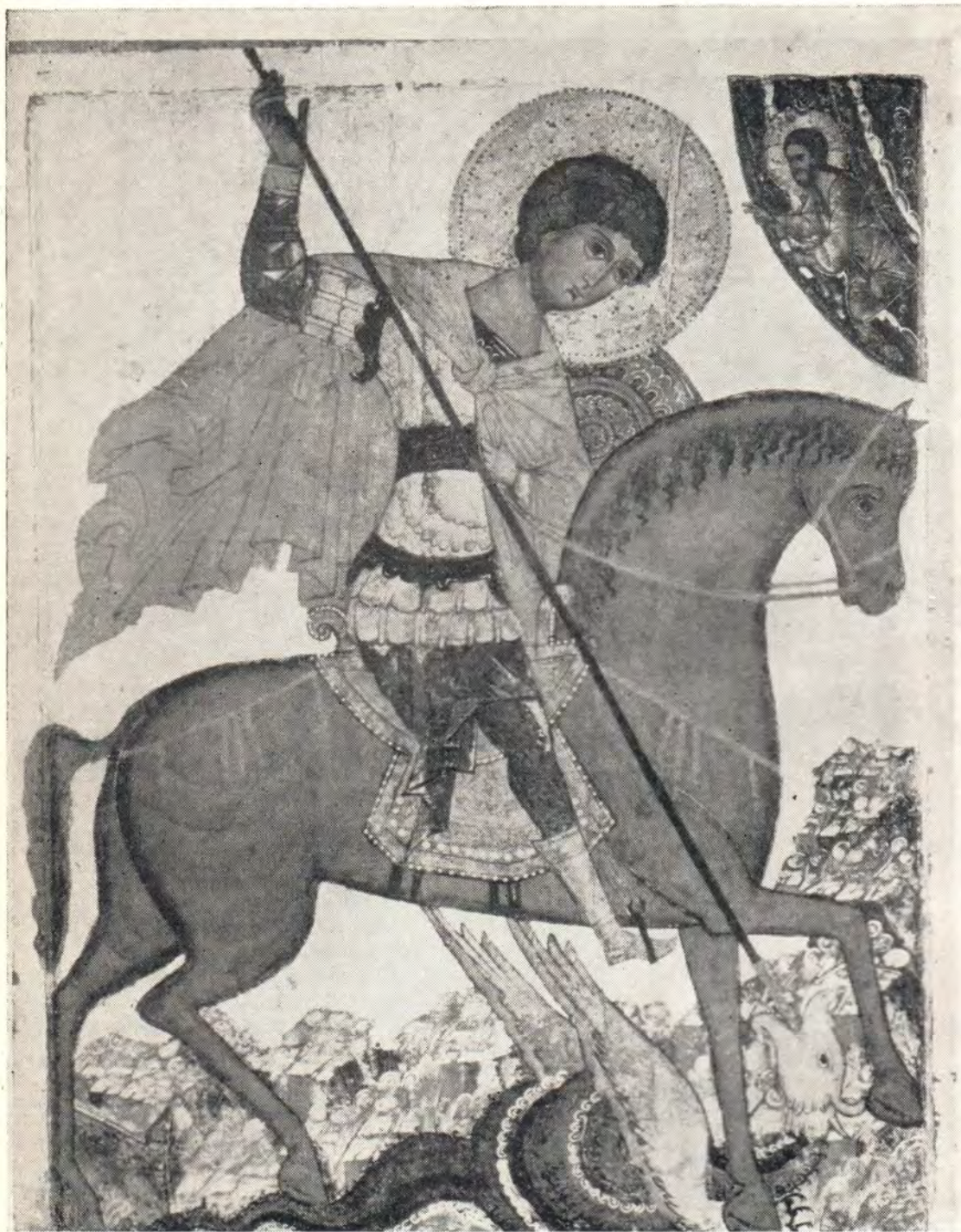
Святой великомученик Георгий Победоносец Икона из собрания Церковноархеологического кабинета МДА, XV в.