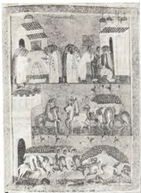
Битва новгородцев с суздальцами