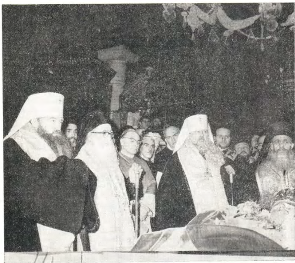
У гроба Святейшего Патриарха Кирилла в пловдивском соборе св. Марины

В соборе св. Марины гроб с телом почившего Патриарха оставался для всенародного прощания до 9 час. 30 мин. следующего утра, четверга 11 марта. И здесь, как и в Софии, непрестанно возносились