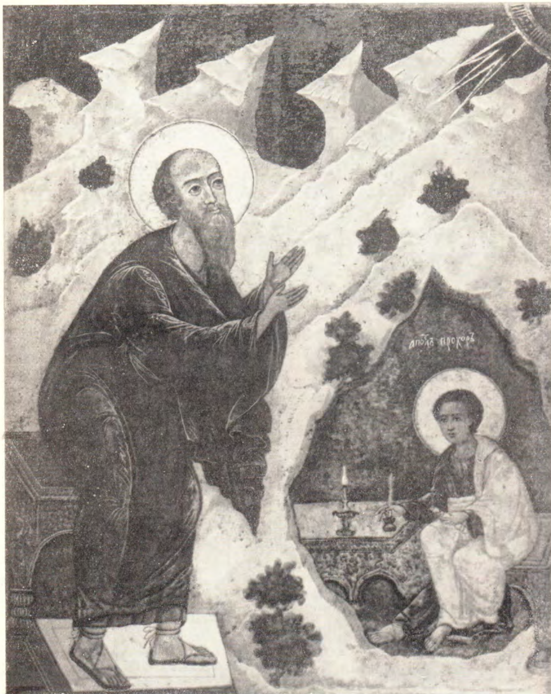
Апостол и евангелист Иоанн Богослов с учеником своим Прохором

Икона из Успенского Псково-Печерского монастыря