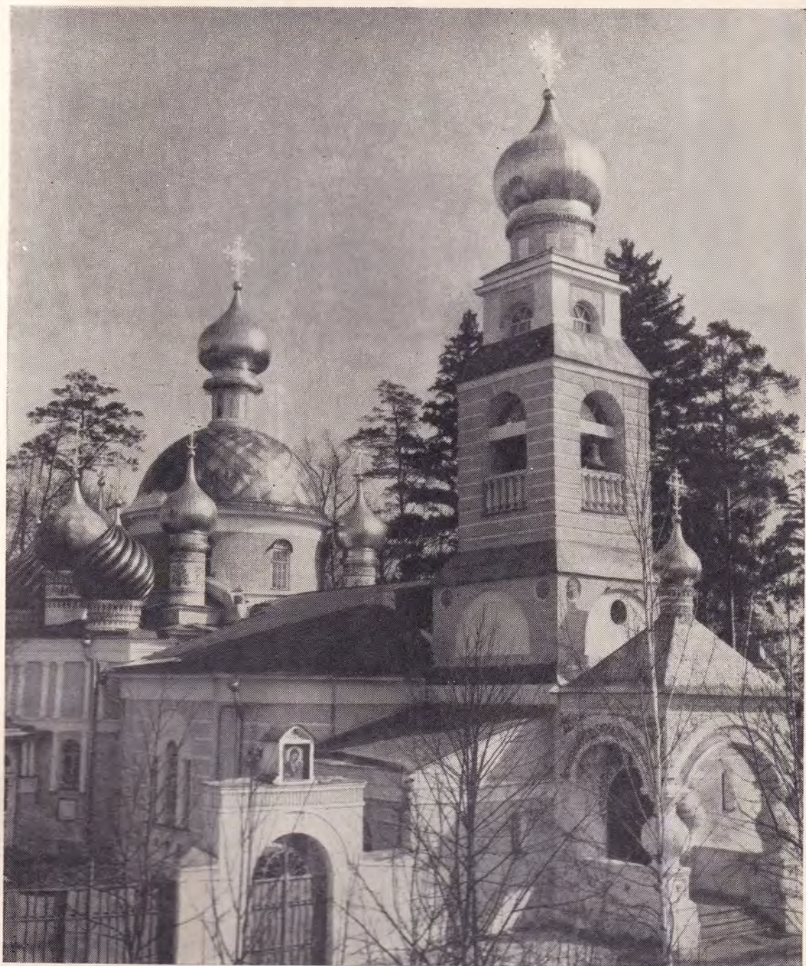
Храм в честь Преображения Господня Троицкого Патриаршего подворья в с. Лукино (Подмосковье, ст. Переделкино)

Вблизи этого храма трудился и в Бозе почил Святейший Патриарх Алексий. Его заботами в с. Лукино, на земле, освященной трудами святого митрополита Филиппа, создано Троицкое Патриаршее подворье, где прошли многие дни жизни Патриарха. Здесь, на исторической Земле, и поныне всё го ворит о глубокой любви Первосвятителя к Церкви и церковному благолепию.