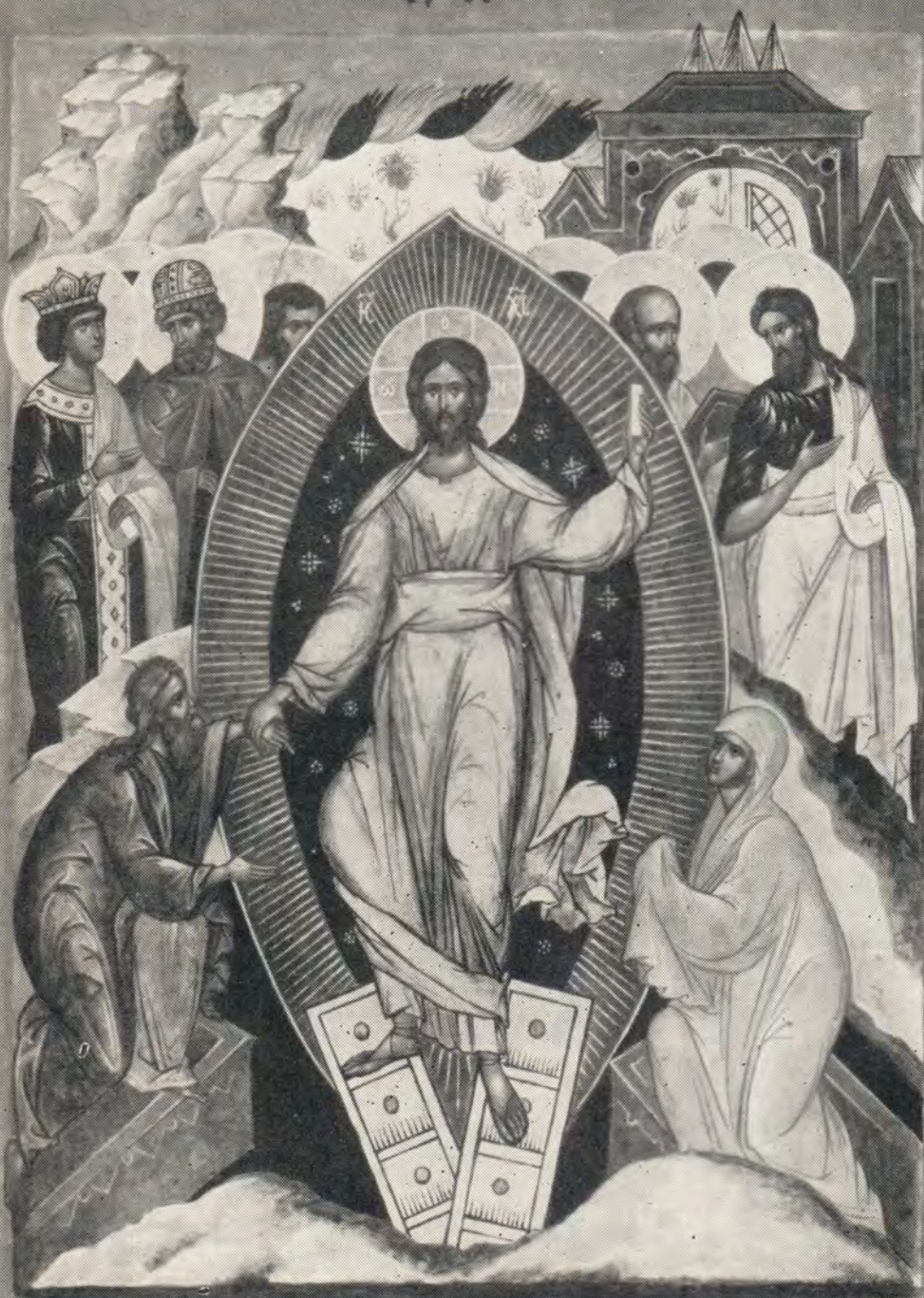
Сошествіе во ад Господа нашего Іисуса Христа Икона из иконостаса Покровскаго храма МДА