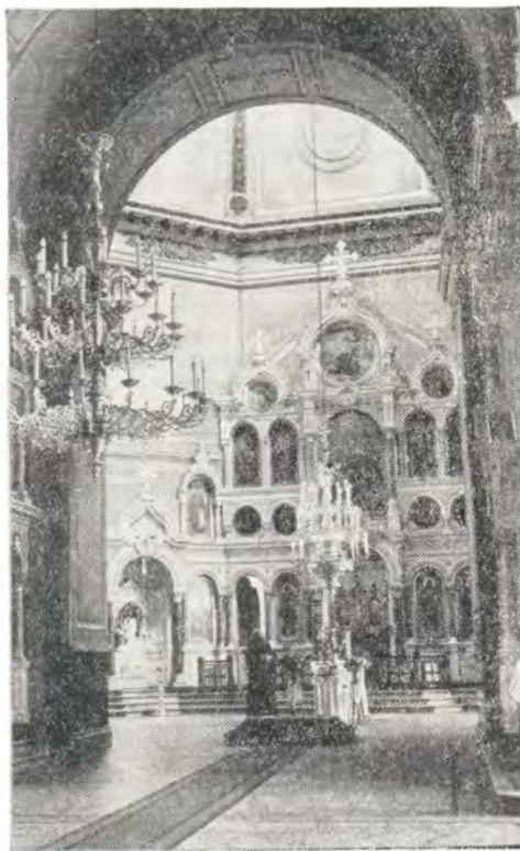
На фото: слева — Спасо-Преображенский кафедральный собор в г. Сумы; справа — внутренний вид Преображенского собора