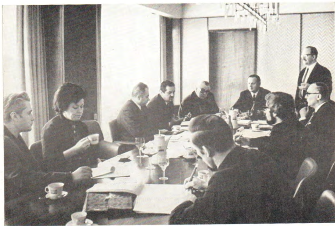
Заседание Международного секретариата Христианской Мирной Конференции в Москве, 16—17 февраля 1971 года