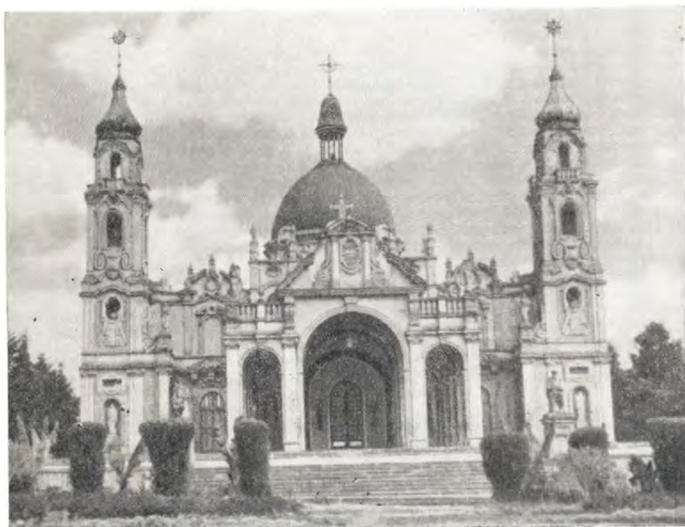
Кафедральный собор Св. Троицы в Аддис-Абебе