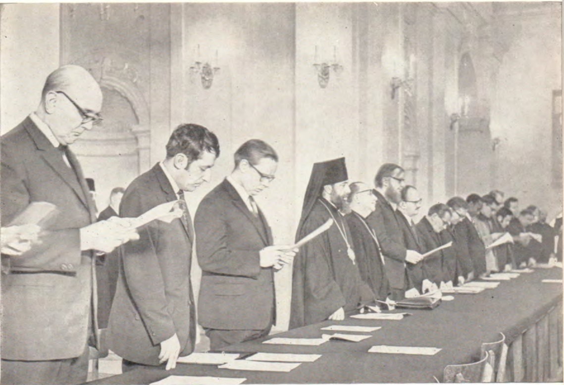
3—5 февраля 1971 года в Троице-Сергиевой Лавре проходило заседание Международной комиссии ХМК. На фото: молитва перед началом заседания