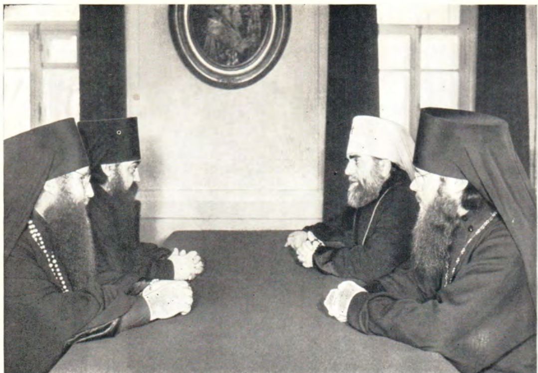
1 марта 1971 года Митрополит Токийский и всей Японии Владимир посетил Московскую духовную академию. На фото: инспектор академии архимандрит Симон, ректор епископ Дмитровский Филарет, Митрополит Владимир и игумен Евлогий