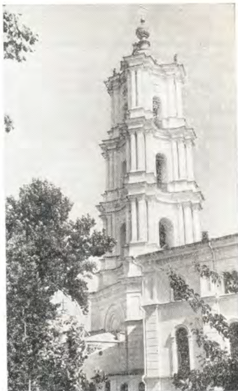
Колокольня Спасо-Преображенского кафедрального собора в г. Сумы