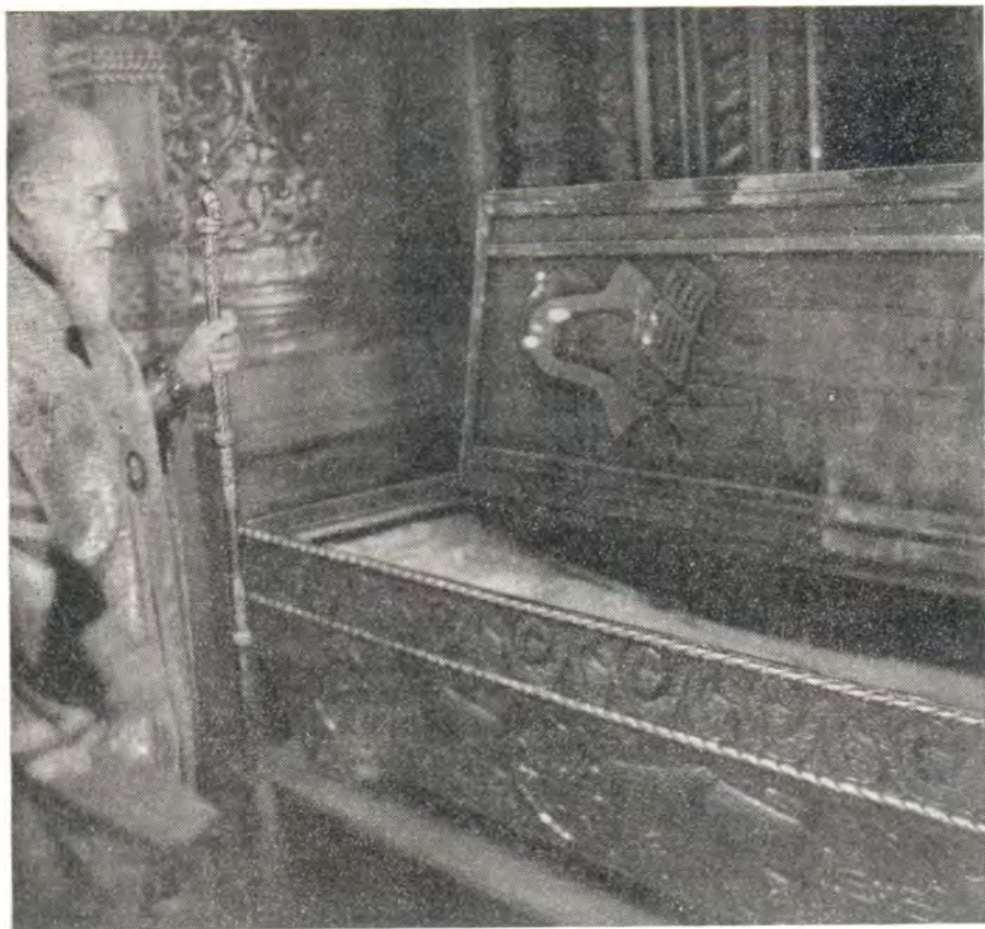
Святейший Патриарх Алексий у раки с мощами его небесного покровителя — святителя Московского Алексия