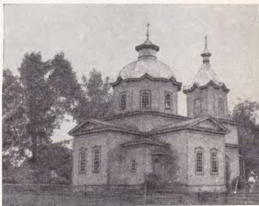
Храм в честь Покрова Божией Матери в с. Халма Климовского р-на Орловской епархии