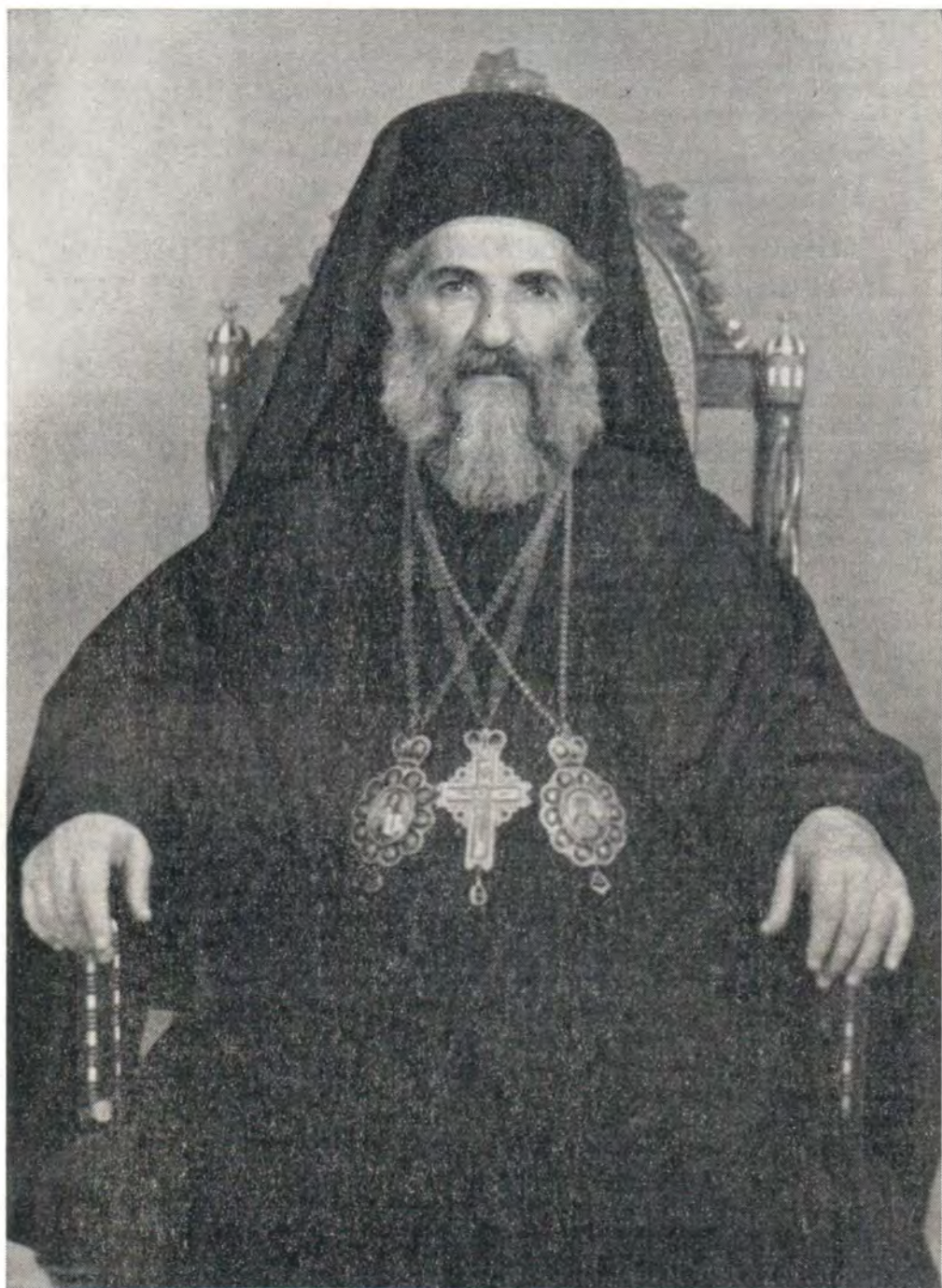
БЛАЖЕННЕЙШИЙ ИЛИЯ IV, Патриарх Великой Антиохии и всего Востока