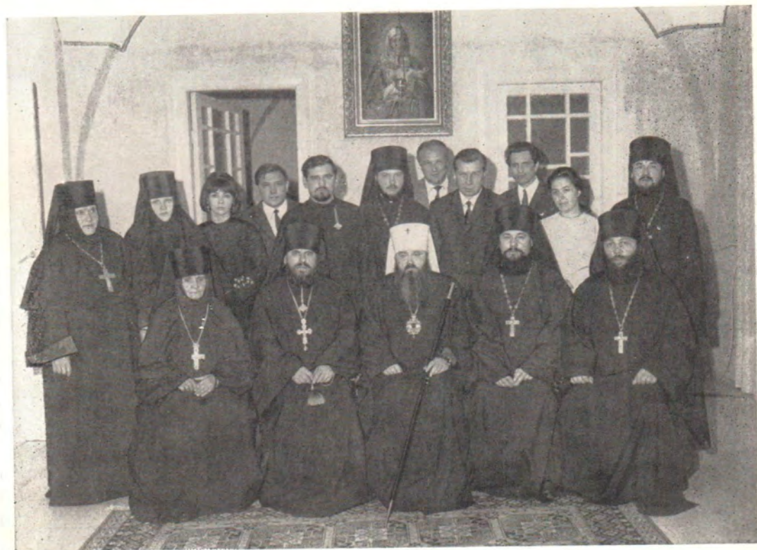
Группа паломников во главе с митрополитом Ленинградским и Новгородским Никодимом среди членов Русской Духовной Миссии в Иерусалиме