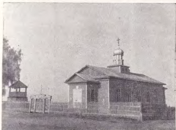
Храм во имя Святителя Николая в с. Старая Потьма Зубово-Полянского р-на Пензенской епархии