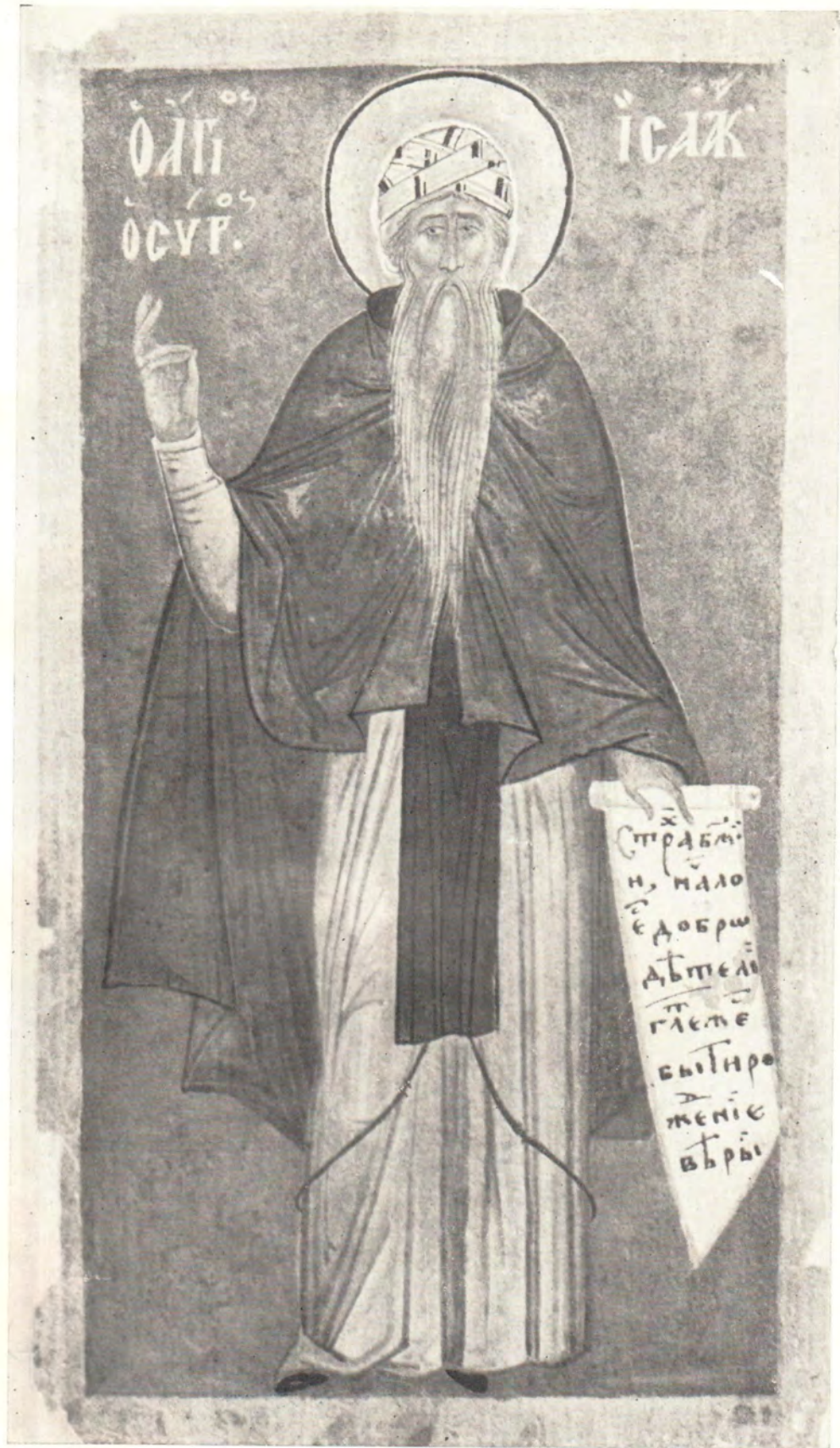
Преподобный Псаак Сирий

Миниатюра из афонской рукописи XIV в. (ГБЛ, ф. 214, л. 452)