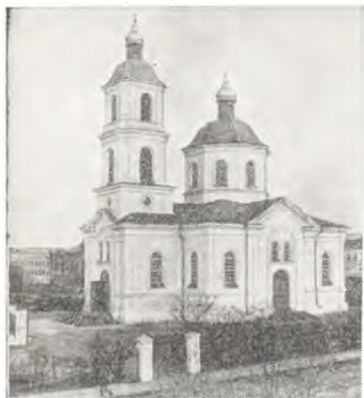
Кафедральный собор в Омске в честь Воздвижения Креста Господня

ном служении делу спасения, которому они посвятили свою жизнь.