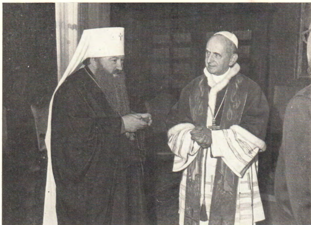
Папа Павел VI и митрополит Ленинградский и Новгородский Никодим