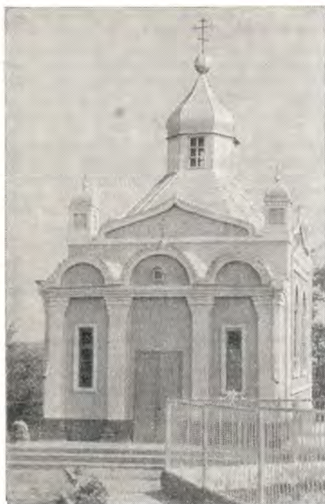
Монастырский храм в честь Рождества Богородицы