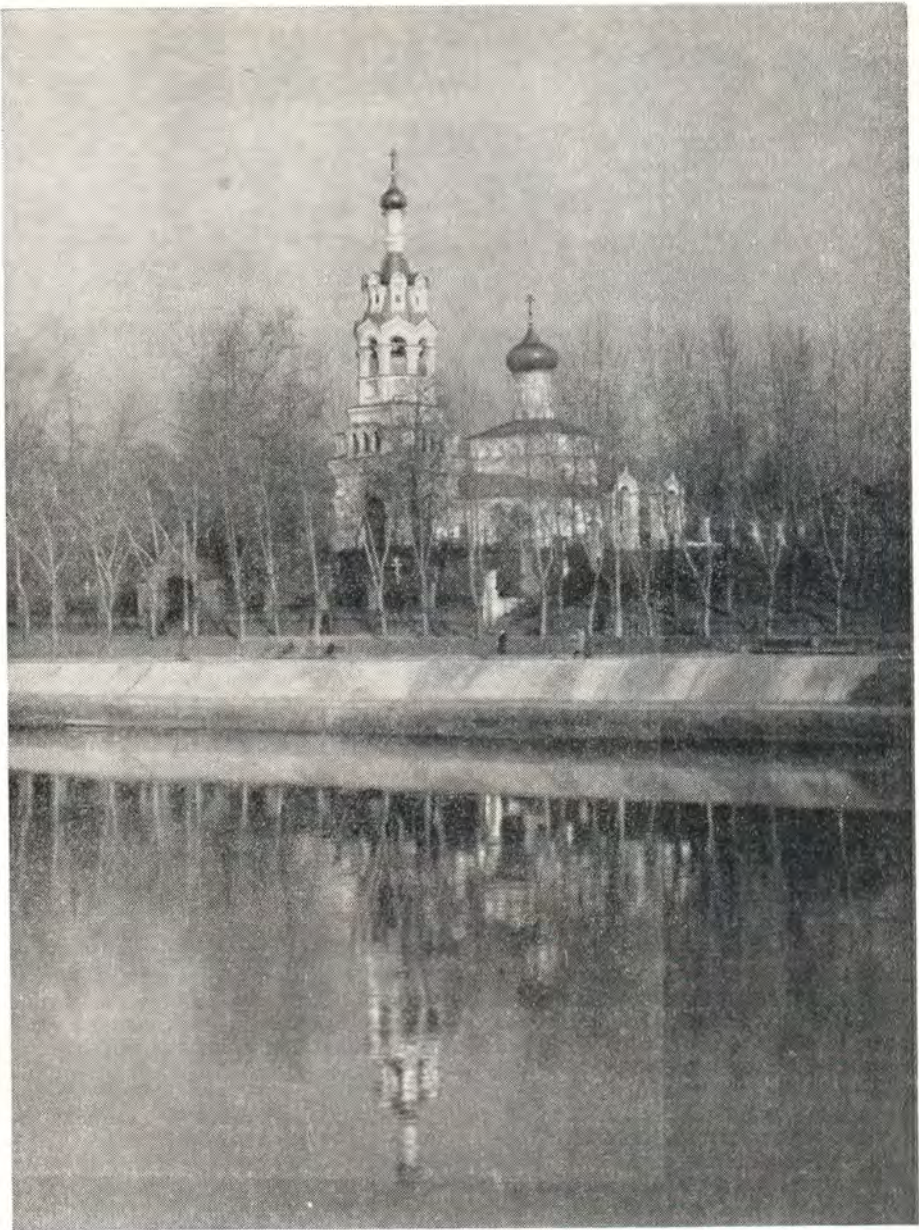
Храм в честь Воздвижения Креста Господня (во имя пророка Или) в Черкизове в Москве

ли Русской, святитель Алексей как пастырь, наставник и долгие годы фактический правитель России все свои силы отдавал укреплению целостности и авторитета Русской Церкви, на утверждение единства и могущества русского государства. При выполнении этой исторической миссии ему приходилось тратить много времени и усилий на устранение стоявших перед ним препятствий. Кстати будет заметить, что для достижения указанных целей он подчас обнажал свой духовный меч, но пользовался им с разумной осмотрительностью и предпочитал действовать убеждением и кротостью. Во многих случаях, не прибегая к крайним мерам, ему удалось мирить враждующих князей, увещавать ослушных иерархов. «Словесы благими и кроткими» сумел он снискать расположение и милость хана Джанибека, отвести от родной земли лютый гнев неистового Бердибека.