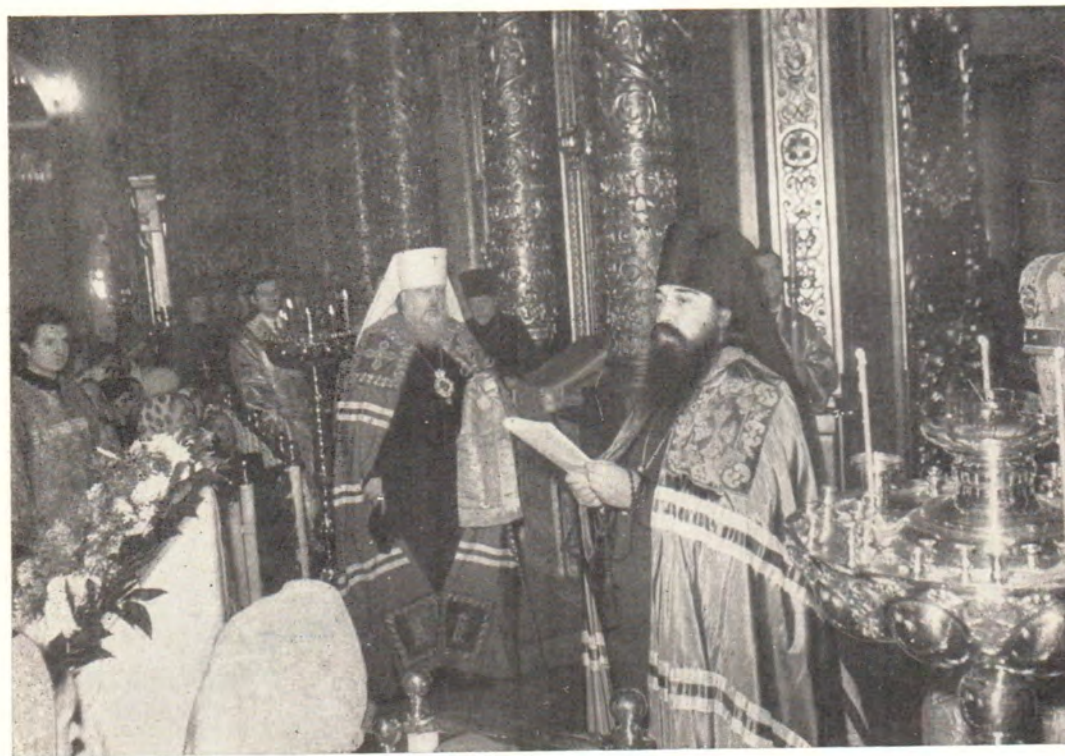
Епископ Дмитровский Филарет оглашает Рождественское послание Патриаршего Местоблюстителя Митрополита Крутицкого и Коломенского Пимена