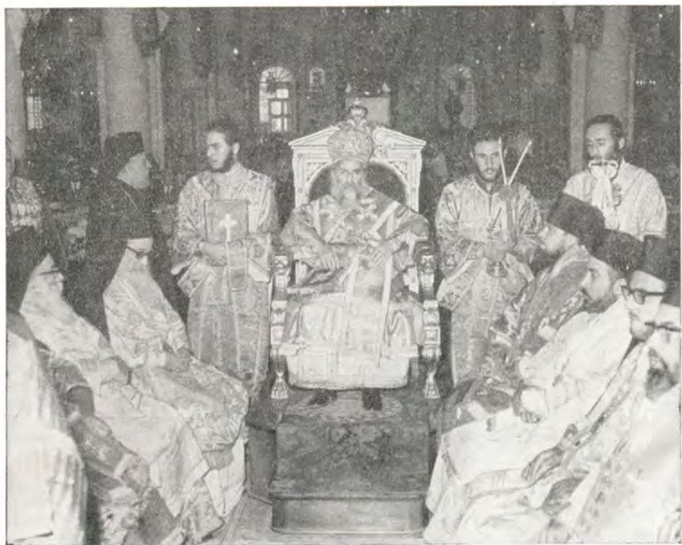
За Божественной литургией в день интронизации 27 сентября 1970 года