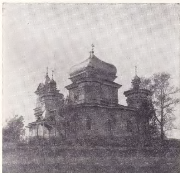
Храм Святителя Николая в с. Журавкино Зубово-Полянского р-на Пензенской епархии