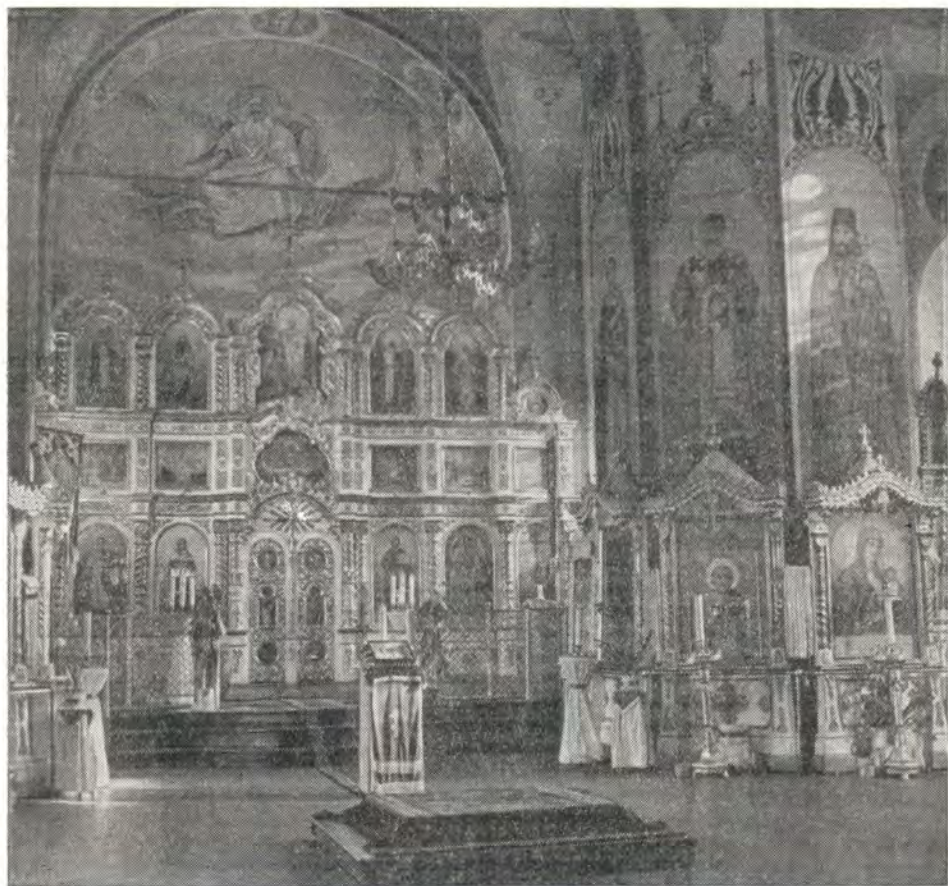
Внутренний вид кафедрального собора в Омске

В 1918 году, по благословию архиепископа Омского и Павлодарского Сильвестра, храм был украшен росписью по образцу стенной живописи киевского Владимирского собора. В росписи отразилась и характерная решительность сибирских мастеров в выражении основной христианской идеи — спасения. Если в киевском соборе изображение Голгофской Жертвы и Господа Саваофа с Духом Святым Утешителем расположено в западной части храма, то здесь оно вынесено на горнее место (см. «ЖМП», 1971, № 1, 2-я стр. обл.), подчеркивая этим смысл Искупления и указывая на голгофский подвиг крестоношения. Справа и слева от иконостаса взору молящихся предстают первые свидетели Истины — апостолы Петр и Павел. На восточных колоннах запечатлены образы просветителей славян равноапостольных Мефодия и Кирилла и первых просветителей Сибири — Иннокентия, епископа Иркутского, и Иоанна, митрополита Тобольского. Через эти изображения они и теперь ниспосылают свое благословение всем входящим в храм. На западных колоннах образы защитников Православия — равноапостольного князя Владимира; святого благоверного князя Александра Невского; священномученика Ермогена, патриарха Московского; святителя Димитрия, митрополита Ростовского; Преподобного Сергия Радонежского; Святителя Николая Мирликийского и других — напоминают о ревност-