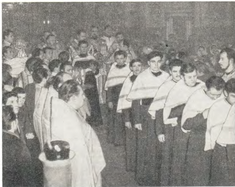
Поставление учащихся выпускного класса ОДС во чтецов совершает митрополит Алексий