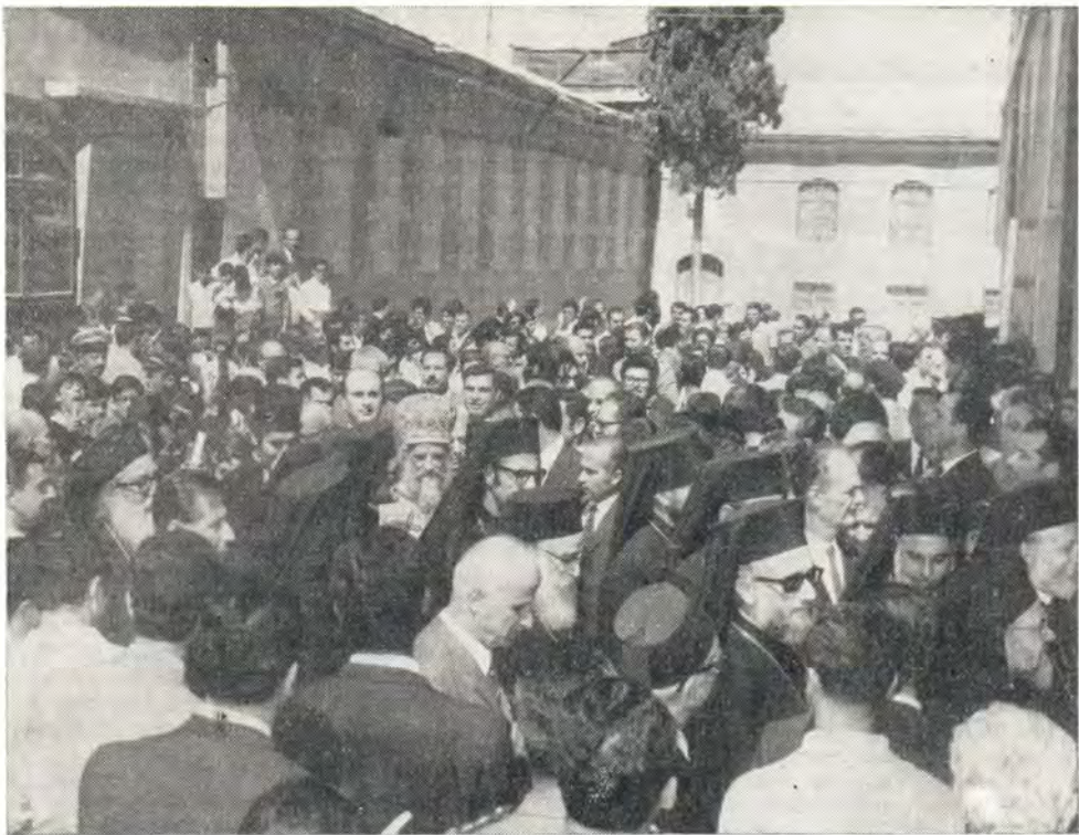
Торжественная процессия у Успенского патриаршего кафедрального собора в Дамаске в день интронизации Блаженнейшего Патриарха Илии IV 27 сентября 1970 года

кование, издают своеобразные высокие звуки вроде трели.) Перед самой Патриархией раздавались выстрелы: это был традиционный салют в честь нового Патриарха. Процессия вошла в здание Патриархии, а народ еще долго ликовал во дворе, устраивая народные танцы и различные увеселения.