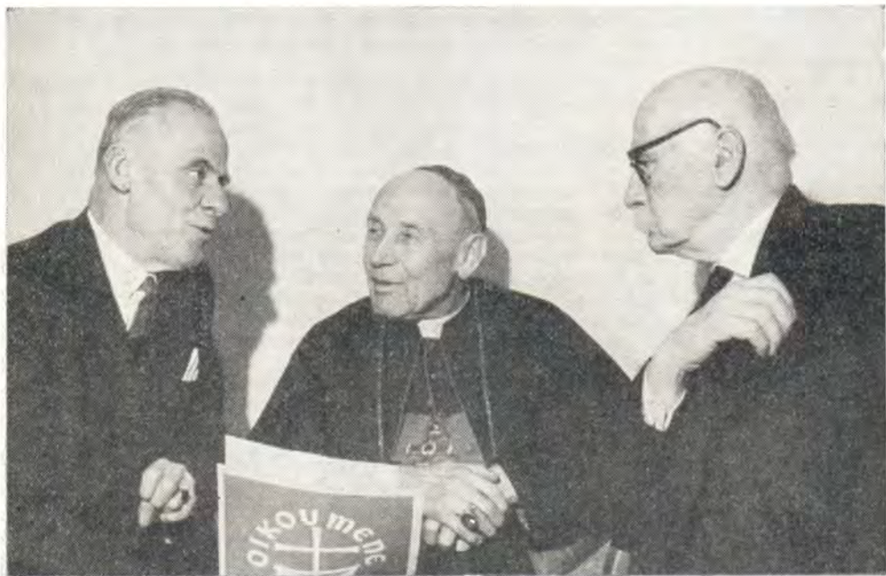
Слева направо: д-р В. А. Виссерт-Хуфт, кардинал Августин Беа, д-р М. Бёгнер

Пастор Марк Бёгнер пользовался большим и заслуженным уважением не только в протестантской среде, но и у православных, англикан и католиков. Он был почетным гостем на Втором Ватиканском Соборе, и автор настоящих строк имел честь встречаться с ним во время третьей сессии Собора в 1964 году.