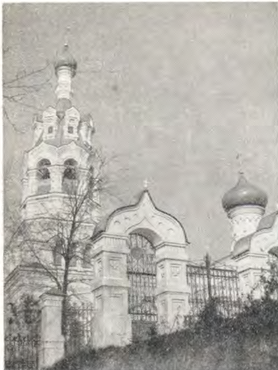
Ильинский храм в Черкизове. Вид с юга, от входных ворот.

дошли три его учительных послания. Надо думать, что для поставления его в 1354 году в Константинополе в митрополита всея Руси немалое значение имели его отличное знание греческого языка и богатая эрудиция. Но свой всесторонний глубокий ум, духовный опыт и блестящие администраторские и дипломатические способности он полностью смог проявить лишь по возвращении в Москву, когда, приняв, по существу, бразды правления, сделался ближайшим советником великого князя Ивана Ивановича Красного, а после его смерти — наставником и опекуном малолетнего великого князя Дмитрия Ивановича — славного Дмитрия Донского. Государственную службу святитель Алексей нес с тем большим усердием, что для него она была нераздельной частью его архипастырского служения, ибо вне Церкви он не мыслил спасения ни для отдельного человека, ни для всего народа. Выполняя свой первосвятительский долг, он был для верной ему паствы не только отцом и руководителем, но и подавал ей личный пример «словом, житием, любовью, духом, верою и чистотою».