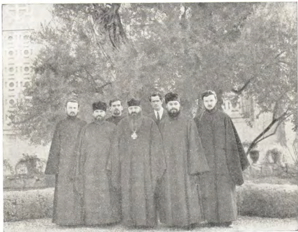
Паломники во дворе Русской Духовной Миссии в Иерусалиме

23 декабря 1970 года в Берлин отбыл архиепископ Леонтий (Гудимов), б. Харьковский и Богодуховский, назначенный Священным Синодом Патриаршим Экзархом в Средней Европе с титулом «Архиепископ Берлинский и Среднеевропейский».