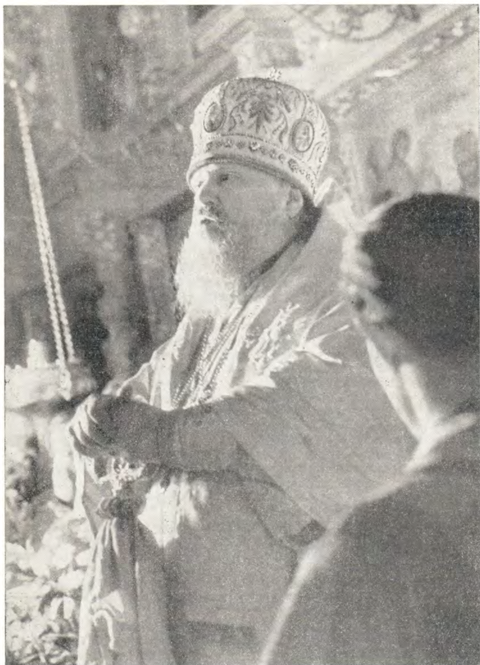
Патриарший Местоблюститель Митрополит Пимен произносит надгробное слово о почившем Святейшем Патриархе Алексии 21 апреля 1970 года

епископ Балтский Пимен был переведен в Москву викарием Московской епархии с титулом епископа Дмитровского. Спустя два с половиной года епископ Пимен был назначен на должность управляюще-