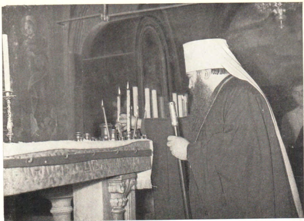
Митрополит Ленинградский и Новгородский Никодим возжигает свечу на Голгофе