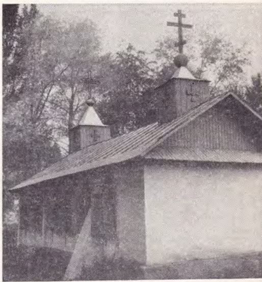
Молитвенный дом в пос. Узунагач Алма-Атинской епархии