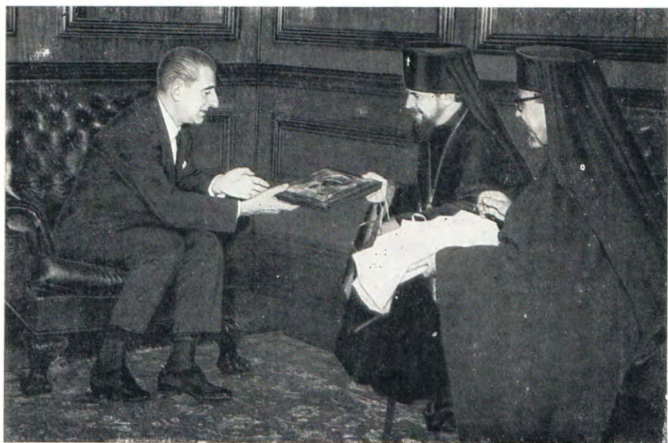
Архиепископ Аргентинский и Южноамериканский Никодим на приеме у Президента Республики Чили д-ра Эдуардо Фрея Монтальва 4 декабря 1968 года. Рядом с архиепископом Никодимом епископ Ларисский Антиохийского Патриархата в Чили Афанасий Скаф. Архиепископ Никодим вручает Президенту икону Свят. Николая