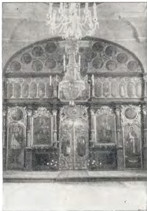
Храм во имя Святителя Николая в г. Сентеш