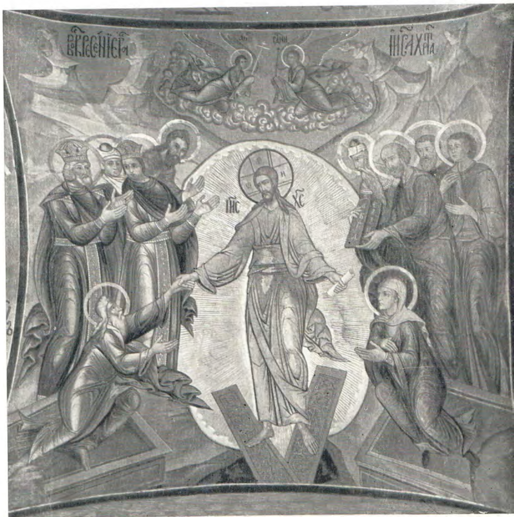
Фреска Успенского собоора Троице-Сергиевой Лавры

Въспостіларій: Плѣтїю оуспѣвъ ѣакъ мѣртвъ, црѣю ѣ гдѣ, трѣднѣвенъ воскресъ єсѣ, адама воздвѣгъ ѿ тлѣ, ѣ оупразднѣвъ смѣртъ: пасха неглѣнѣа, мѣра спѣсѣнїе.