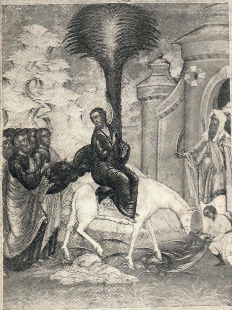
Икона «Входъ Господень в Перусалимъ»