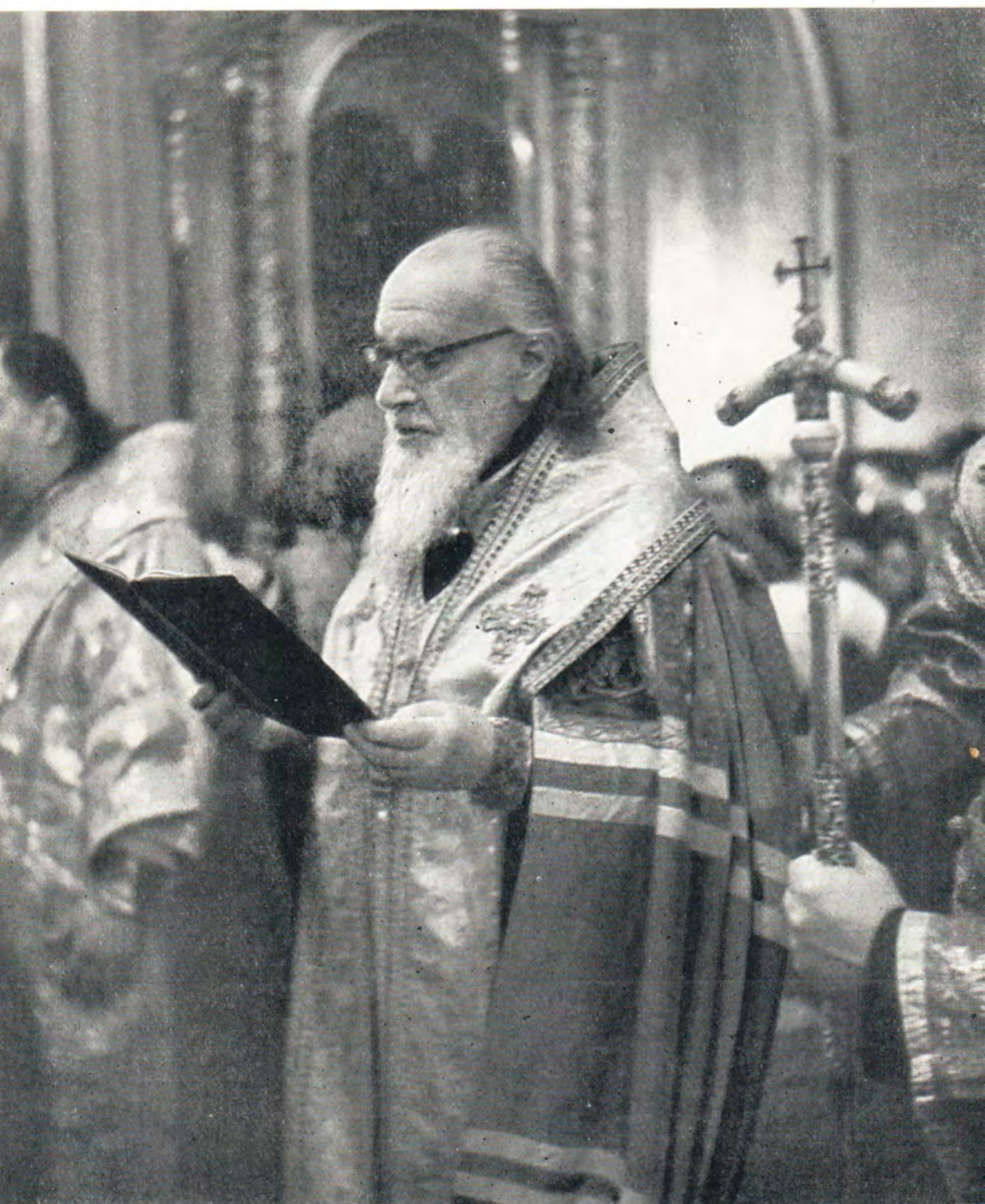
Чин Православия в Богоявленском патриаршем соборе 2 марта 1969 года. Святейший Патриарх Алексий читает молитву