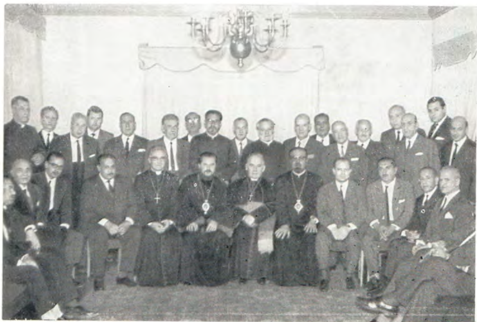
На приеме, устроенном епископом Ларисским Антиохийского Патриархата в Чили Афанасием Скаф в честь архиепископа Аргентинского и Южноамериканского Никодима 28 ноября 1968 г. Слева от епископа Афанасия: архиепископ Сантьяго, Чили, кардинал Рауль Сильва Генригез, архиепископ Никодим, архиепископ Абарийский Карло Мартини, апостолический нунций в Чили