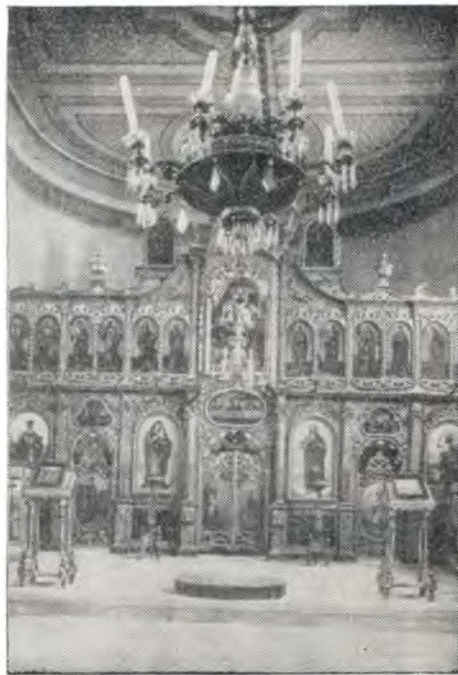
Храм во имя Святой Троицы в г. Кечкемет