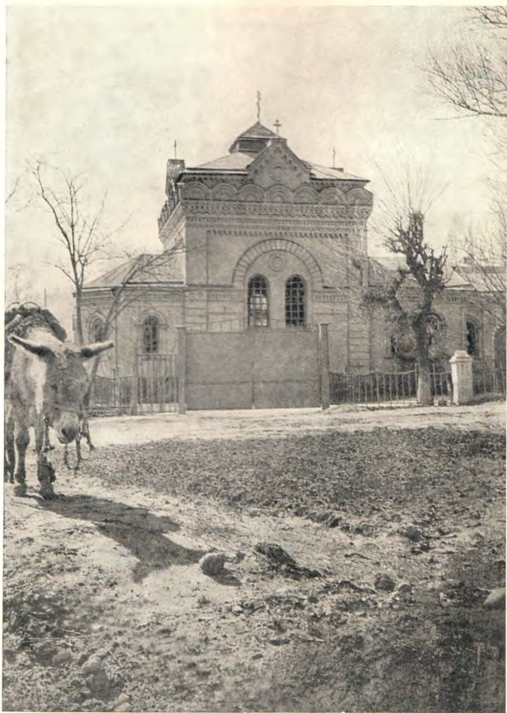
Храм в с. Троицком, Ташкентской епархии