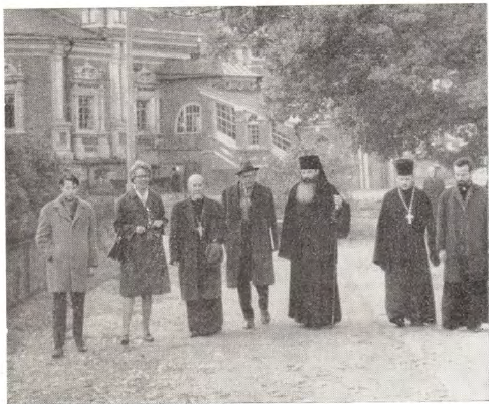
Паломники из Венской епархии в Новодевичьем монастыре в Москве

Так, тепло встреченные Владыкой Филаретом и получив от него ценные подарки, напоминающие о столице Украины — Киеве, мы отбыли самолетом в Ленинград. Наше кратковременное пребывание в Ленинграде совпало с приездом туда Святейшего Патриарха Болгарского Кирилла, которого митрополит Никодим торжественно встречал вместе с корпорацией духовной академии и семинарии. В этой встрече принимала участие и наша группа, которая также была приглашена разделить вместе с Патриархом и другими гостями вечернюю трапезу у митрополита Никодима. Перед началом трапезы хор студентов академии и семинарии исполнил несколько духовных песнопений, преимущественно старых монастырских распевов, которые были прослушаны с большим интересом и вызвали всеобщее одобрение. На следующий день мы знакомились с Ленинградом. К сожалению, густой туман и дождь не благоприятствовали нашему обозрению Ленинграда. Однако с Исаакиевским собором мы ознакомились довольно подробно и были поражены не только его грандиозным