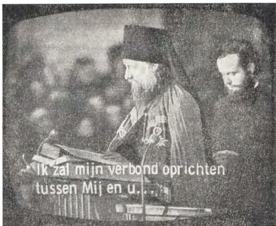
Епископ Дионисий читает по-славянски текст из Библии на экуменическом богослужении в Роттердаме 24 декабря 1968 г. Текст телевидения: «Я поставлю завет Мой между Мною и тобою» (Быт. 17, 7)

да (свыше 3 тыс. человек). Огромный собор был переполнен. Служба началась торжественным шествием через храм всех участников служения. Епископ Дионисий следовал в архиерейской мантии с жезлом. После вступительной молитвы пастора храма Преосвященный Дионисий проследовал в сопровождении своего иподиакона к кафедре и прочитал по-церковнославянски текст из Библии (Быт. 17, 1—8).