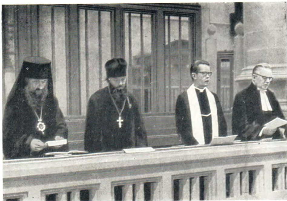
В дни Недели молитв о христианском единстве епископ Роттердамский Дюнией и священник Н. Озолин участвовали в экуменическом богослужении. Роттердам, Голландия, 20 января 1969 года