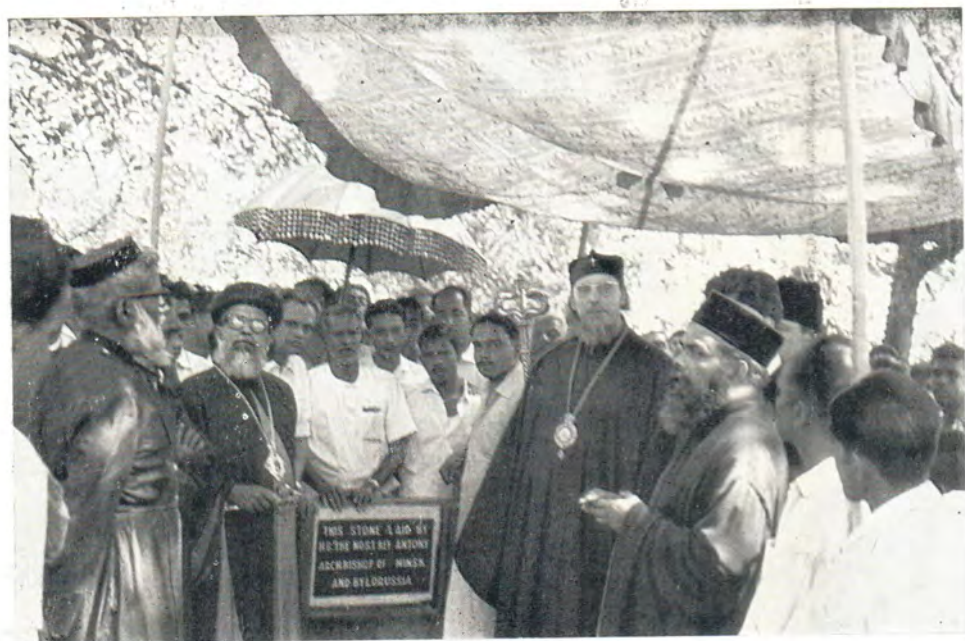
Во время ответного визита делегации Русской Православной Церкви Сирийской Церкви Востока (Индия) глава делегации архиепископ Минский и Белорусский Антоний участвовал в церемонии закладки нового церковного здания в г. Алвае (штат Керала). На мемориальной доске надпись: «Этот камень положен Его Высокопреосвященством Антонием, архиепископом Минским и Белорусским»