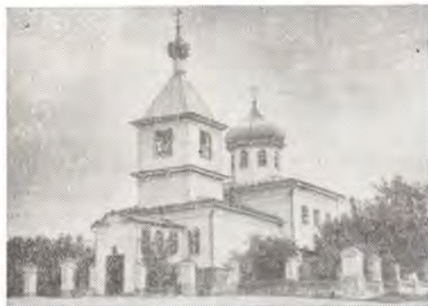
Кафедральный собор в Уфе