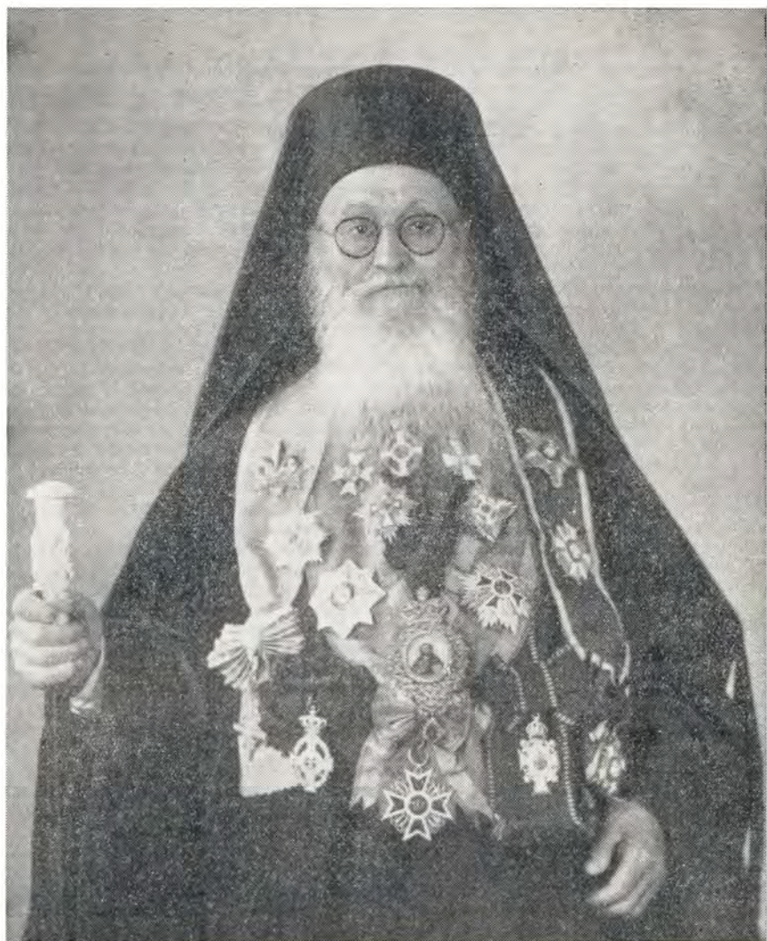
Архиепископ Синайский и Раифский Порфирий III

ного наставника. Даже в последние месяцы своей земной жизни, когда болезни и возраст стали для него тяжелым бременем, он напрягал последние силы, чтобы посетить школу и давать указания. И когда я заходил в Синайское подворье, чтобы навестить больного Архипастыря, я не всегда заставал его дома. Близкие отвечали, что Владыка в школе.