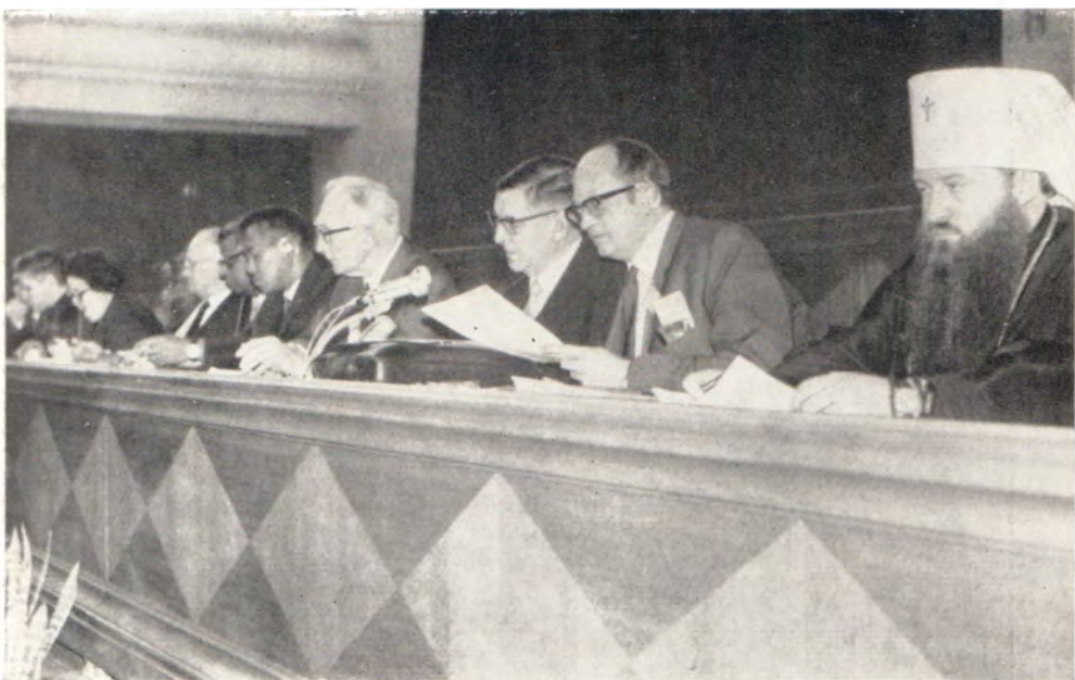
В президиуме Конгресса