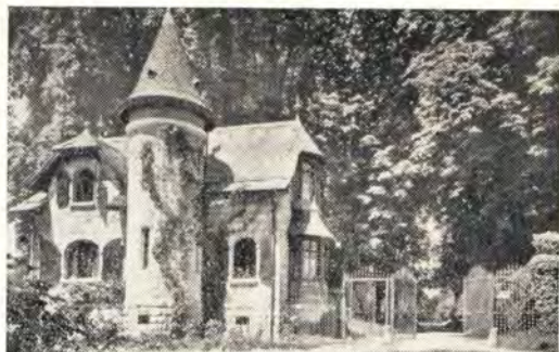
Одно из зданий Экуменического института

Еще в самом начале занятий все студенты распределяются на шесть континентальных групп. Каждая группа в специально отведенный для этого день делала доклады о религиозно-социально-политическом положении в своих странах и об их проблемах. Затем члены группы знакомили других с своими национальными традициями, искусством и т. д. Все это проходило обычно очень интересно.