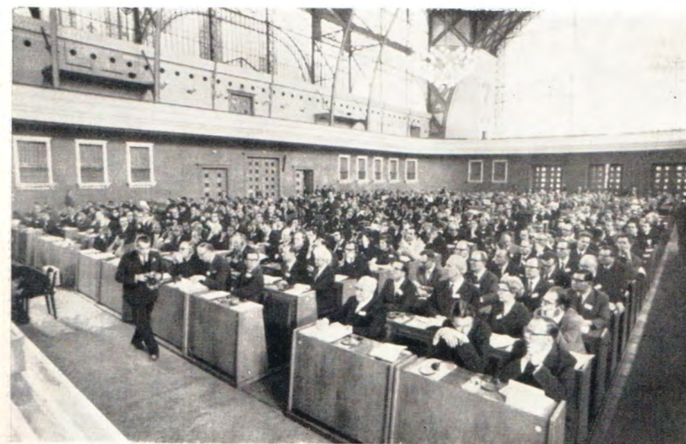
В зале заседаний