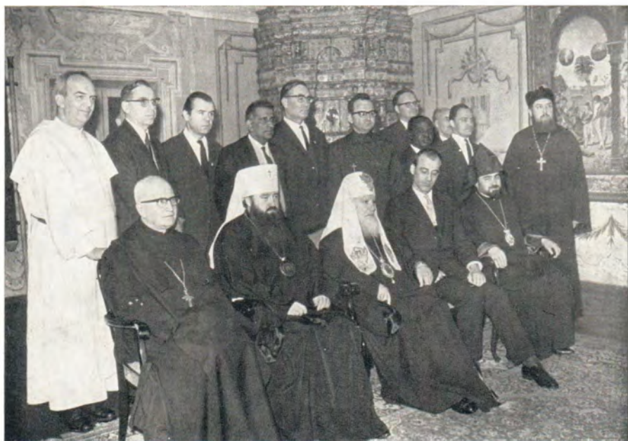
Вверху — группа участников консультации на приеме у Святейшего