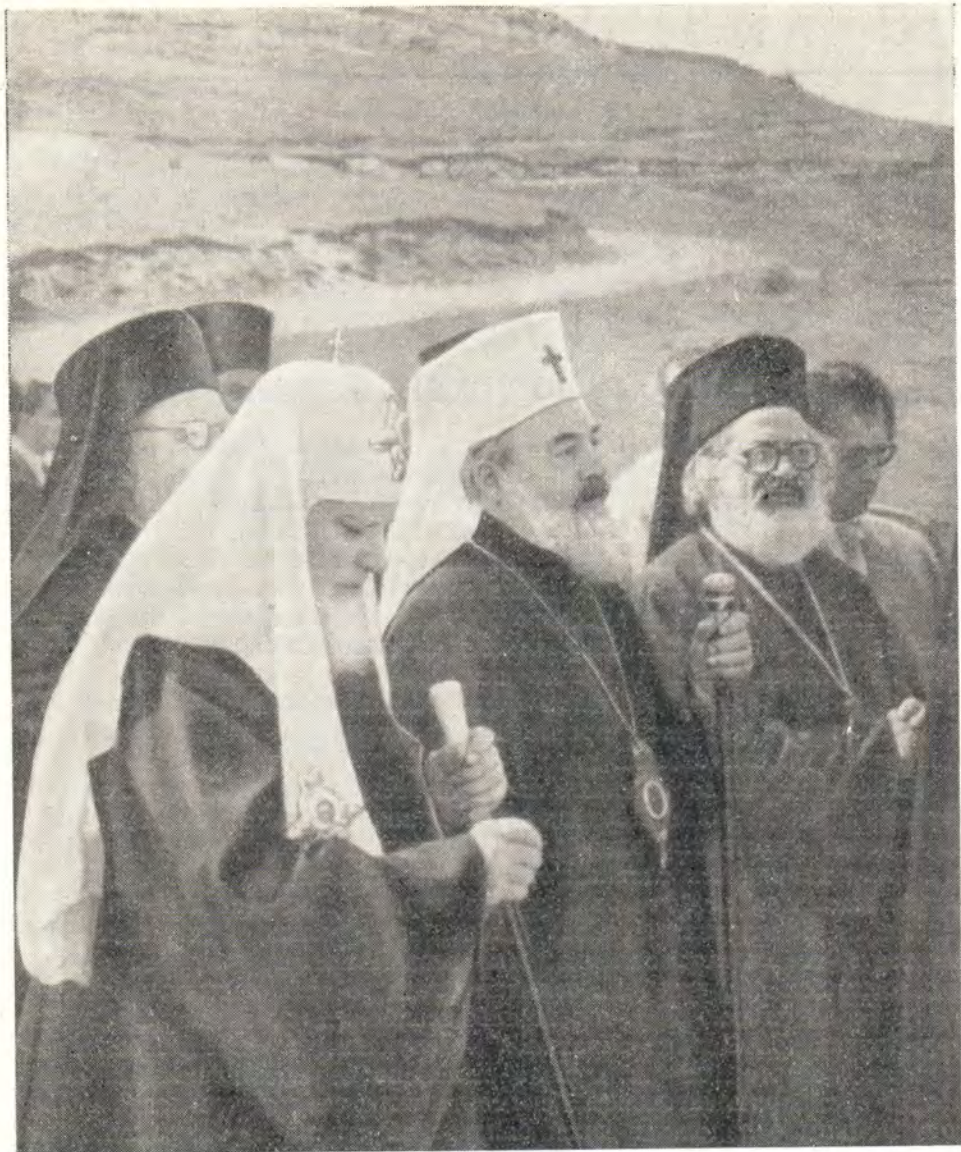
Святейший Патриарх Алексий и Святейший Патриарх Кирилл на Шипке перед могилой русских воинов, павших за освобождение Балкан. Май 1957 года

ботителями и Болгария на глазах всего мира была возведена на голгофу кровавого распятия, ее предсмертные стоны нашли отклик в русских сердцах. Вся русская общественность, весь русский народ поднялись на защиту человеческих прав и свободы болгарского народа, и после того, как были исчерпаны все мирные средства облегчения его участи, Россия объявила войну Турции и освободила Болгарию от пятивекового оттоманского владычества. Много русских воинов пало на поле чести. Немало и болгарских добровольцев с готовностью отдали свою жизнь за вожделенную свободу любимой отчизны. Велик их подвиг, величава их жертва! Как говорится в конце Послания, «достойно вознаградить их может только один Бог и за проявленную ими на земле жертвенную любовь воздать им небесной любовью. Нам же не остается ничего иного, как низко склониться перед их бессмертным подвигом».