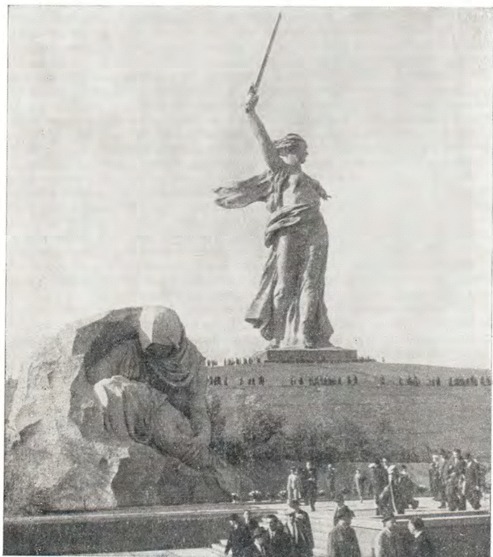
Мамаев курган. Скульптурная группа «Скорбящая мать»

Площадь Героев. Посредине — зеркальная гладь водного партера.