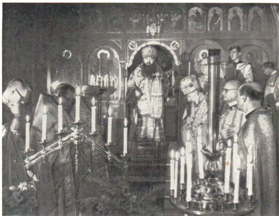
Богослужение в храме Воскресения Христова в Чикаго 26 ноября 1967 года