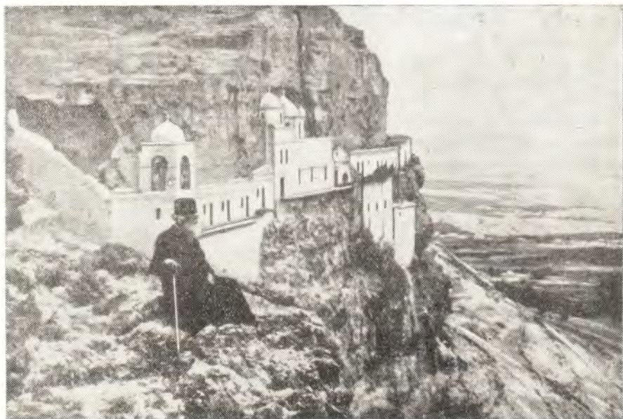
Виды Святой Земли. Монастырь на Сорокадневной горе