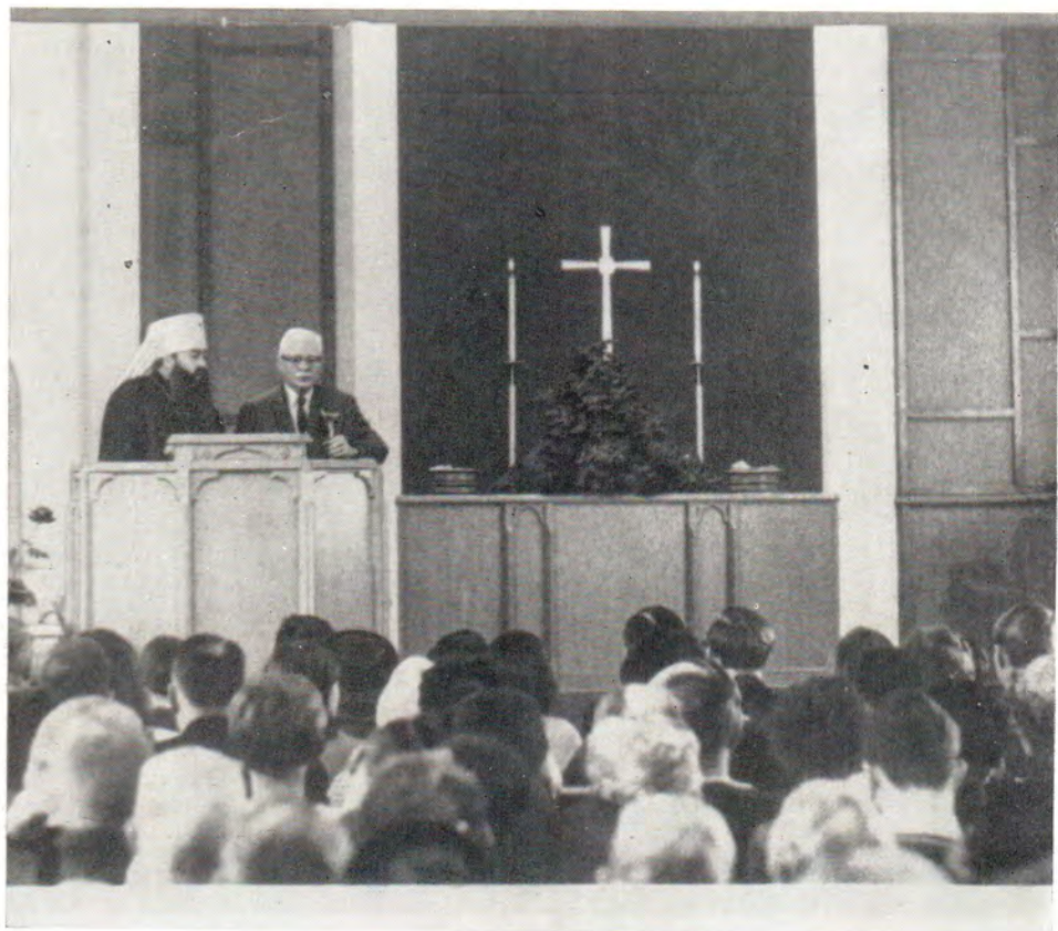
Митрополит Никодим произносит проповедь в храме Церкви Братьев в Эдджине