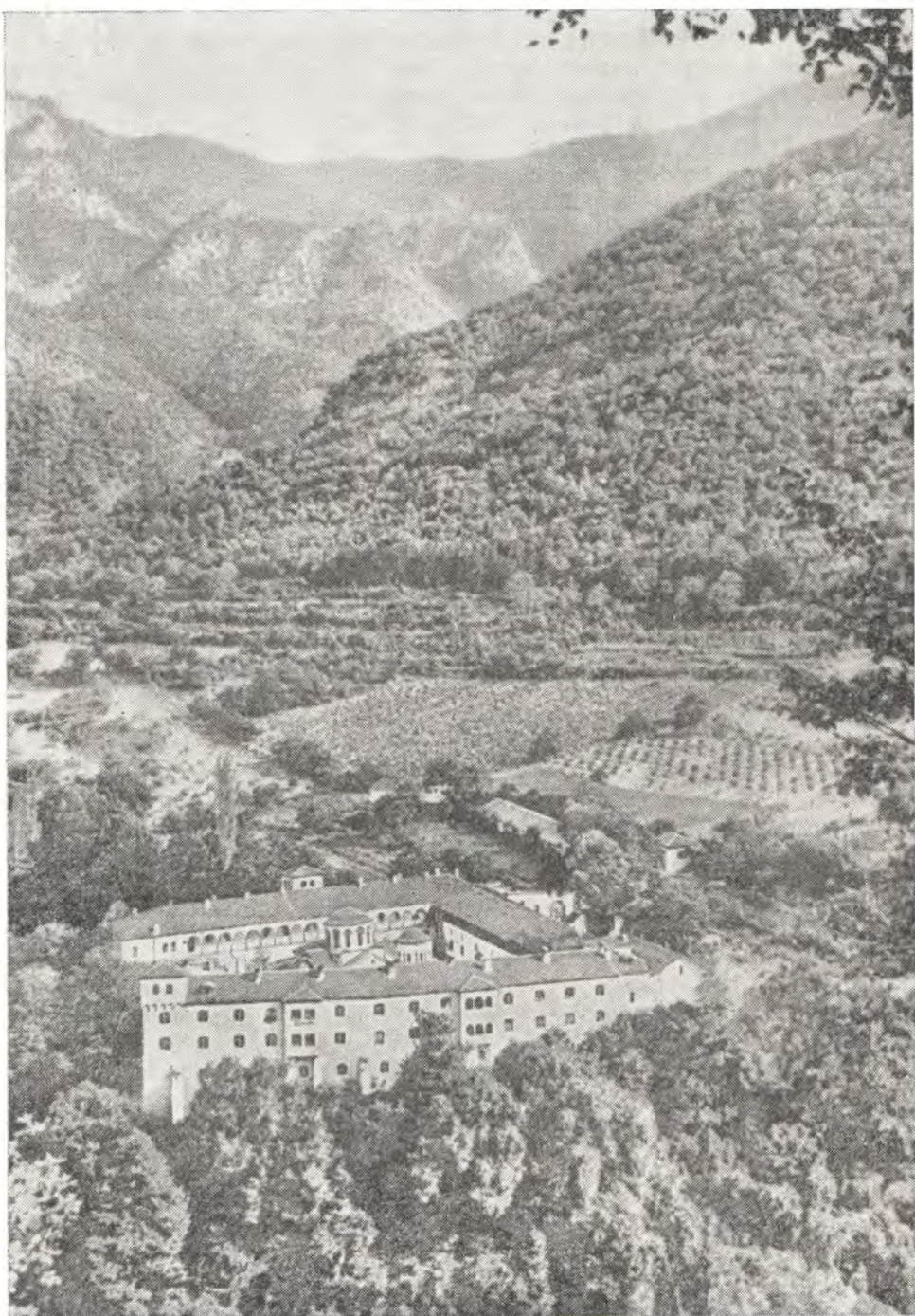
Общий вид Бачковского монастыря

ниже со стороны государства и патриарха...» Признавая каноническое главенство Константинопольского патриарха, монастырь не состоит в юрисдикции местного митрополита или кого-либо из епископов, и за богослужениями в его храмах вместо возношения их имен произносится возглас: «О всем епископстве православных, право правящих слово Твоя истины».