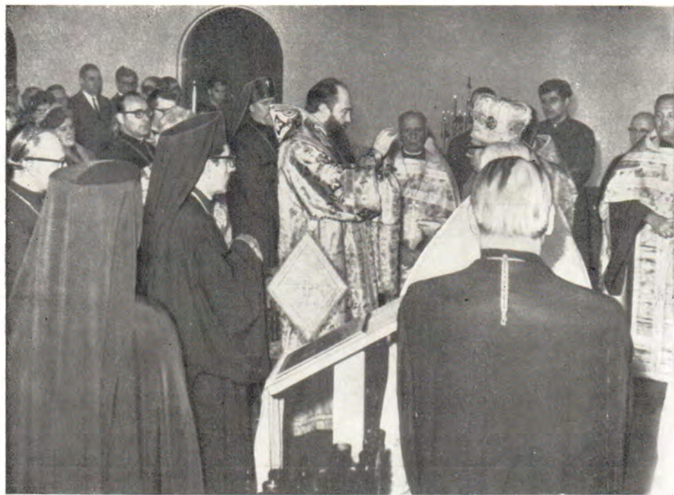
Всенощное бдение в Св.-Андреевском храме в г. Ист-Лансинге, Мичиган, 15 ноября 1967 года