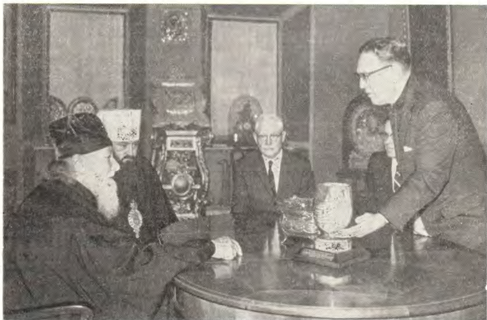
Делегация Церкви Братьев на приеме у Святейшего Патриарха Алексия

Последние два дня пребывания в нашей стране — дни празднования памяти Преподобного Сергия — делегация Церкви Братьев провела в Троице-Сергиевой Лавре. Она посетила Московскую духовную академию и семинарию и была принята ректором епископом Филаре-