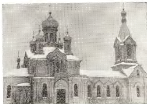
Преображенский храм пос. Киквидзе