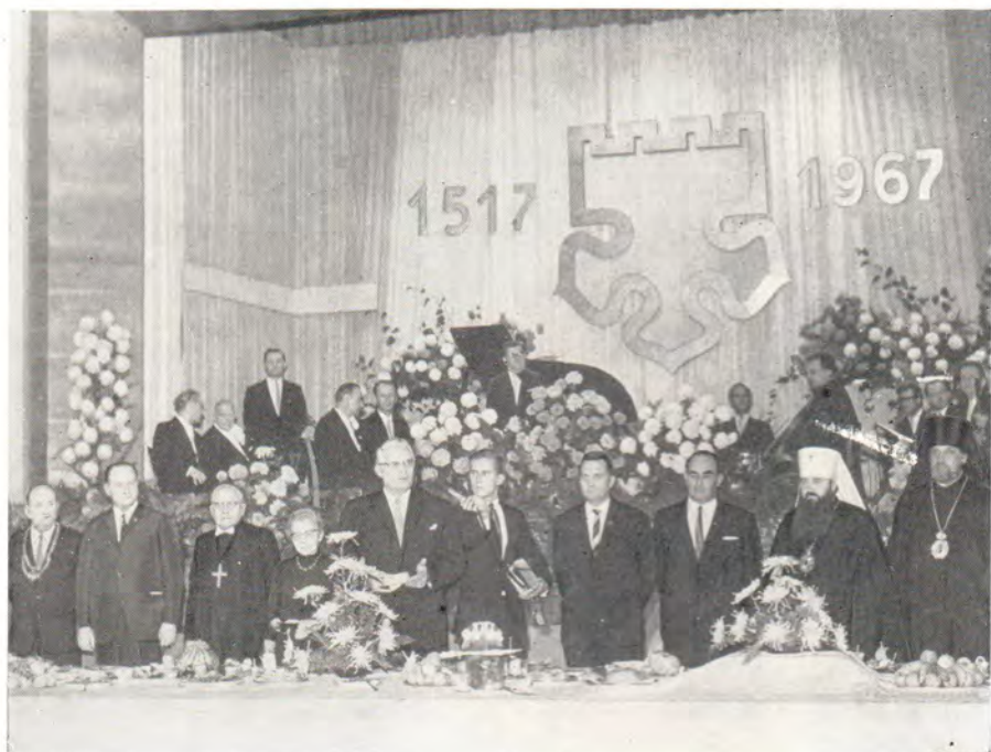
Выступление председателя Комитета ГДР по проведению торжеств 450-летия Реформации Геральда Геттинга 31 октября 1967 года на торжественном приеме в Виттенберге (ГДР) по случаю юбилея