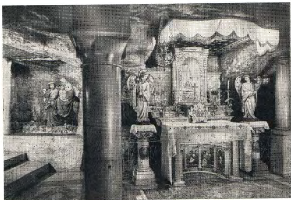
Вифлеем. Вверху: место в пещере, где родился Христос. Внизу: грот млекопитания,