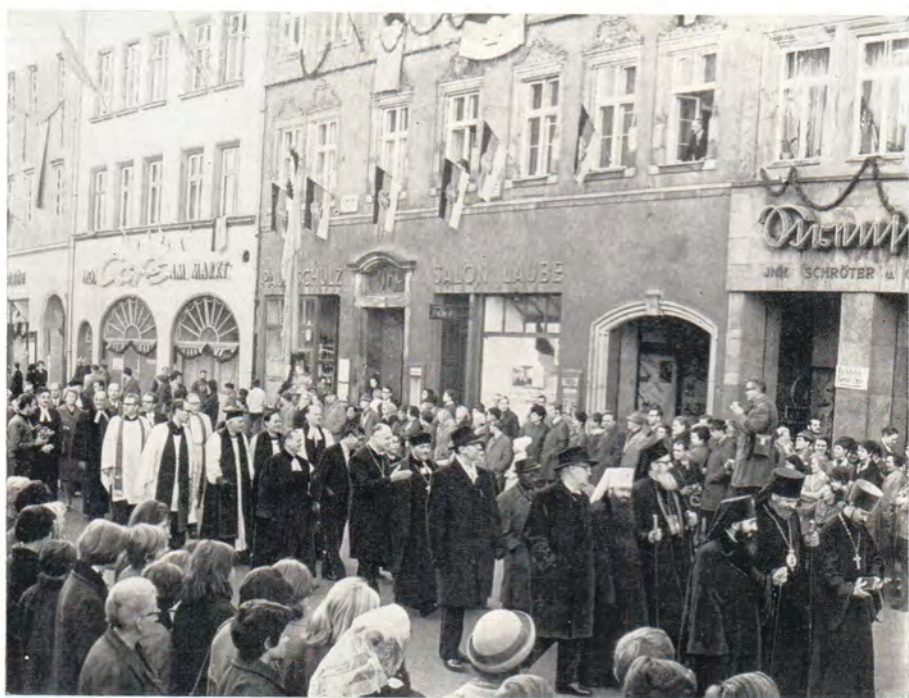
Шествие участников юбилейных торжеств 450-летия Реформации на богослужение в дворцовой церкви Виттенберга 31 октября 1967 года