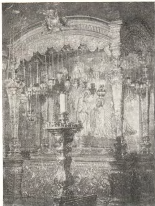
Рака с мощами Преп. Сергия Радонежского

Из 78 лет своей жизни 55 лет Преподобный провел в иночестве, в великом подвиге и трудах. За свои труды, смирение, чистоту и веру он сподобился явления Богоматери. Сама Царица Небесная пришествием Своим осватила обитель Сергиеву и изрекла благословенное обетование не оставлять Своей милостью это священное место.