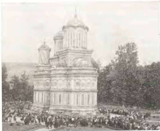
Успенский соборный храм монастыря Куртя-де-Арджеш

450 лет назад в румынском княжестве Валахия состоялось освящение великолепной соборной монастырской церкви в городе Куртя-де-Арджеш. По инициативе князя Нягое Басараба III (1512—1521) этот собор был сооружен совместными трудами мастеров из Константинополя, Армении и других мест Востока. Монастырь стал центром духовного просвещения страны, вступавшей в XVI веке в пору культурного расцвета, а монастырский собор остается и поныне признанным шедевром христианского зодчества, жемчужиной среди многочисленных старинных храмов Румынии.