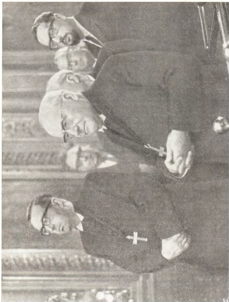
Делегация Евангелическо-Лютеранской Церкви ГДР во главе с епископом М. Митценхаймом в Богоявленском Патриаршем соборе