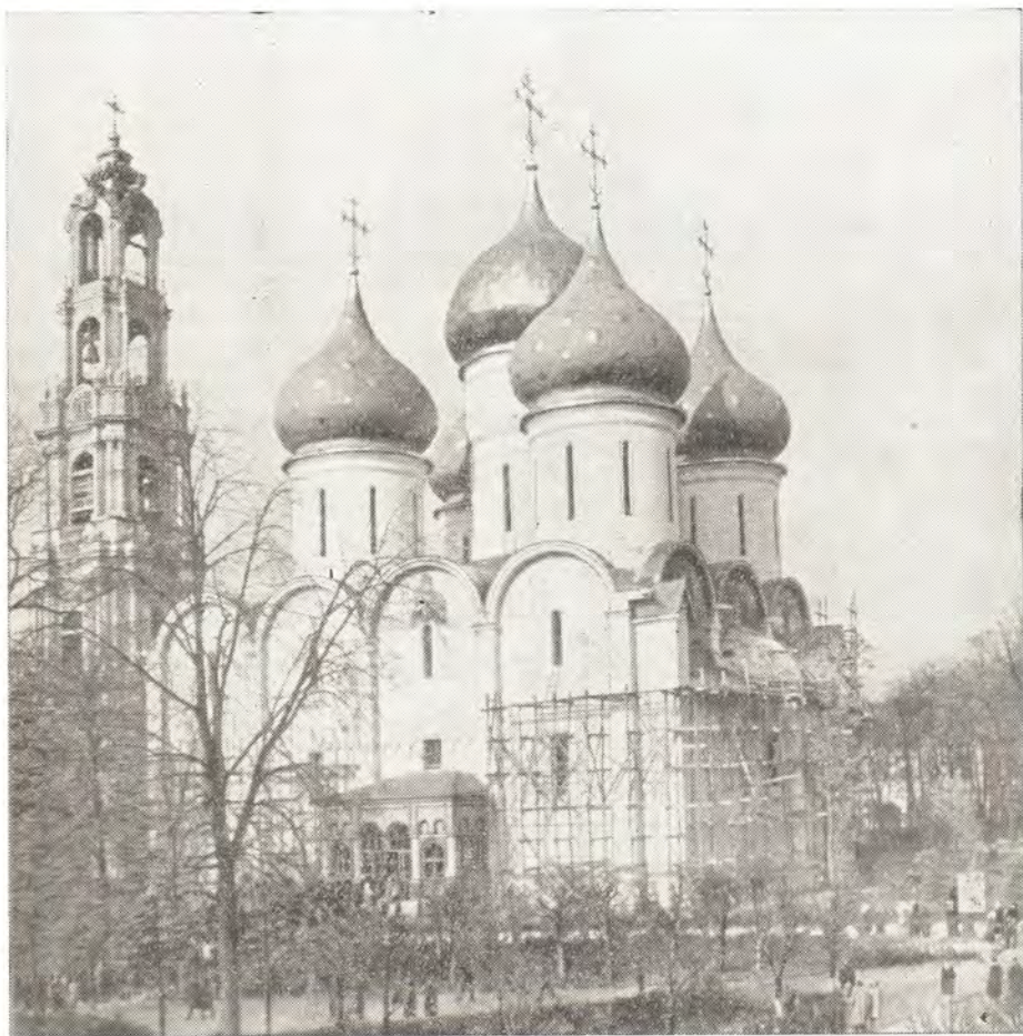
Успенский собор Троице-Сергиевой Лавры

Приходящие в эти праздничные дни в Лавру идут прежде всего поклониться мощам Преподобного. Тесно было в древнем Троицком соборе. Сюда в три часа дня накануне праздника пришли иерархи и