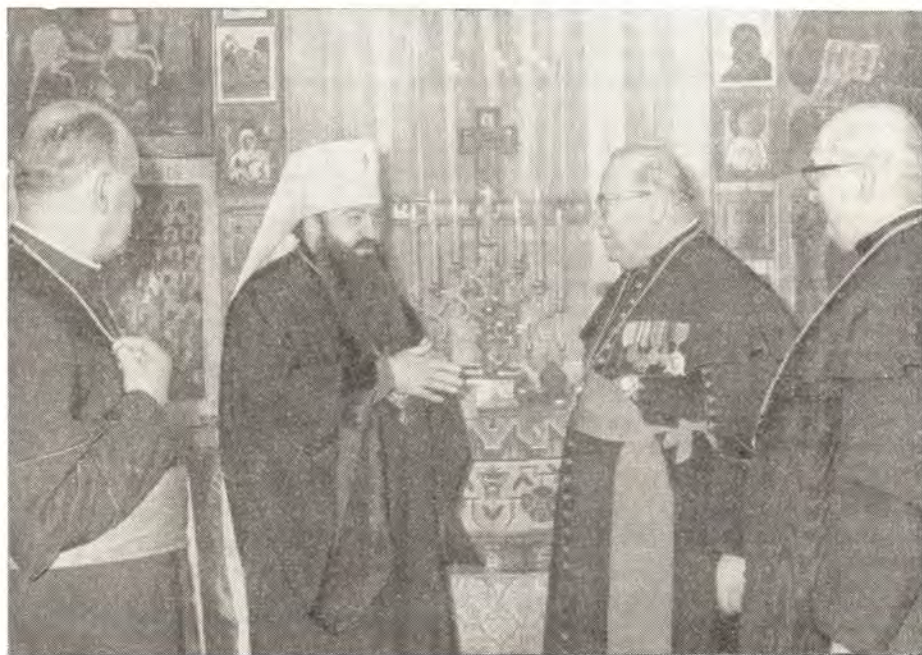
Митрополит Ленинградский и Ладожский Никодим и каноник д-р Иосиф Бенеш в домовй церкви митрополита

В тот же день, в 18 часов, делегация была принята в Ленинградской духов-