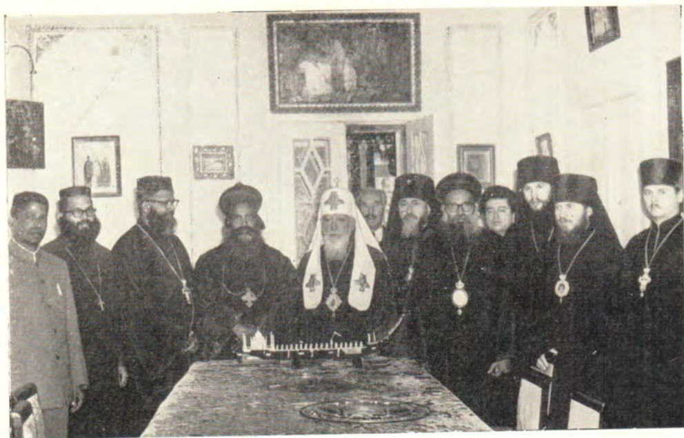
Прием Святейшим Патриархом Алексием делегации Малабарской Церкви в летней резиденции в Одессе 19 сентября 1967 года