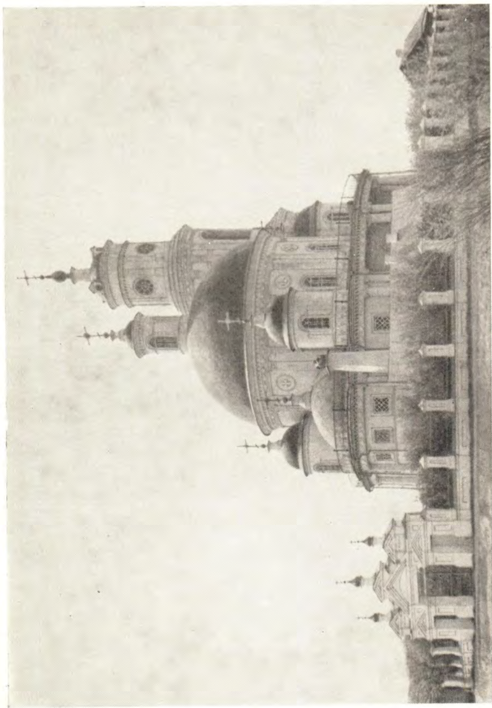
Храм в честь Казанской иконы Божией Матери в г. Тельма Иркутской епархии