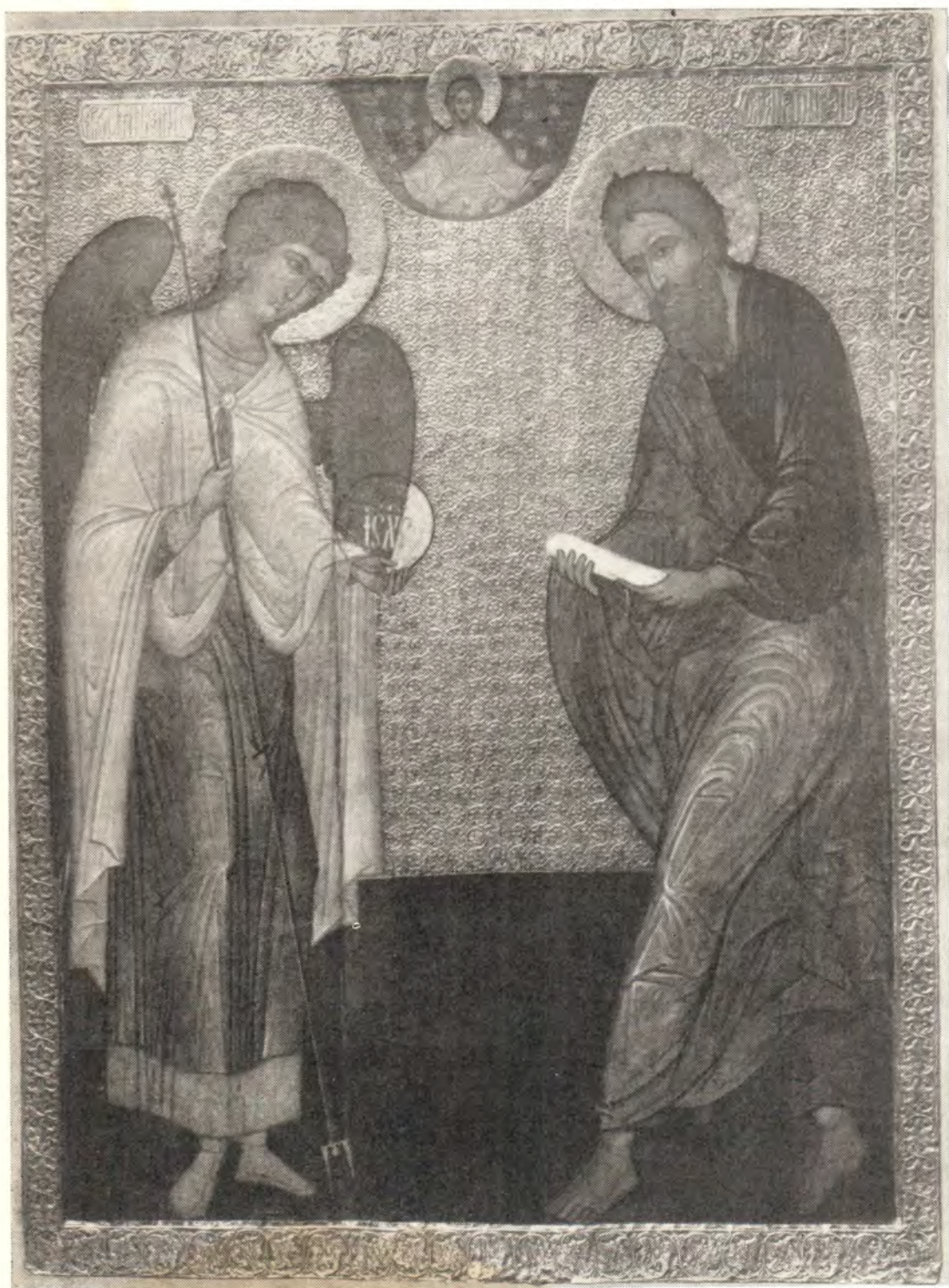
Архистратиг Божий Михаил и святой апостол Андрей Первозванный. Икона из собрания церн.-археол. кабинета МДА