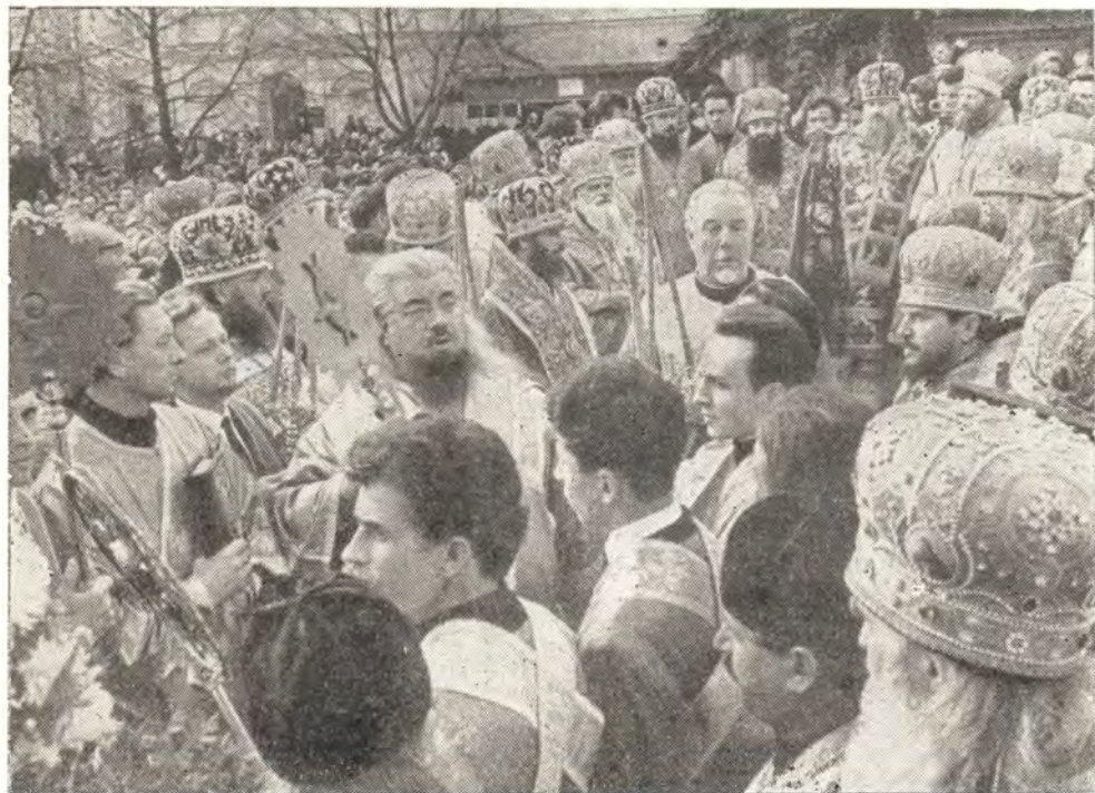
Праздничный молебен в Троице-Сергиевой Лавре 8 октября 1967 года

18 (5) октября. День памяти Святителей Московских Петра, Алексия, Ионы, Филиппа и Ермогена. Всенощное бдение накануне, Божественную литургию в день праздника и молебен Святейший Патриарх Алексий совершал в Богоявленском патриаршем соборе в сослужении митрополита Крутицкого и Коломенского Пимена, митрополита Ленинградского и Новгородского Никодима, архиепископа Таллинского и Эстонского Алексия, архиепископа Нью-Йоркского и Алеутского Ионафана, епископа Волоколамского Питирима, епископа Венского и Австрийского Мелхиседека и епископа Дмитровского Филарета. За литургией Его Святейшество рукоположил своих иподиаконов: иеродиакона Евлогия (Смирнова) — во иеромонаха и Вадима Смирнова — во диакона. Родные братья вместе трудятся и в Московской духовной академии. Первый — преподаватель ее, второй — студент IV курса.