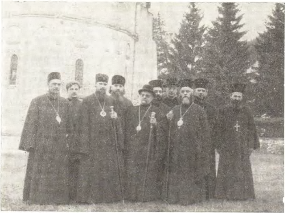
Делегация Русской Православной Церкви среди участников юбилейных торжеств

Божественную литургию. Блаженнейший Патриарх Юстиниан произнес здесь речь, в которой говорил о духовном единстве с предками, о патриотической роли монастыря Куртя-де-Арджеш, который на протяжении четырех с половиной веков был духовным и культурным центром Румынии.