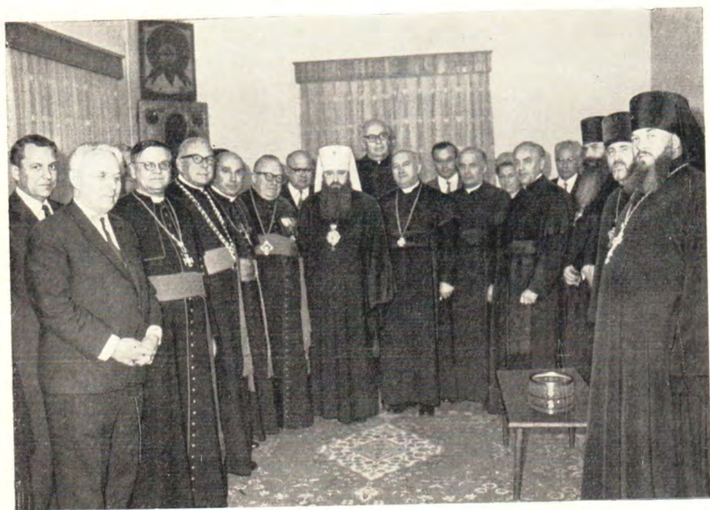
На приеме у митрополита Ленинградского и Ладожского Никодима в честь делегации Мирного движения католического духовенства Чехословакии