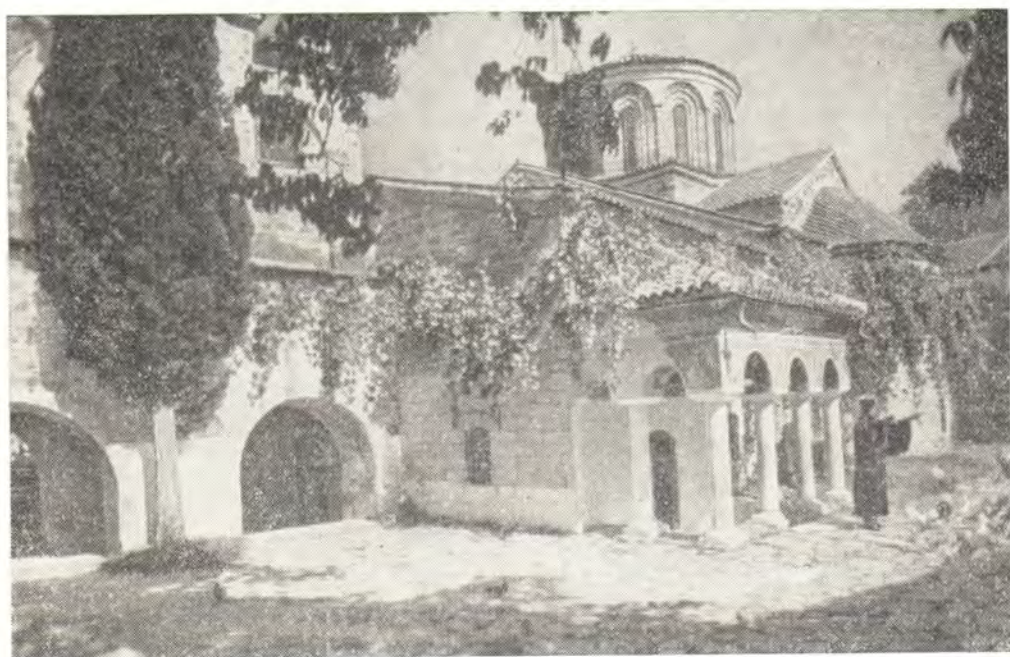
Соборный храм Бачковского монастыря

Присоединив унаследованное от Абаса имущество к своему, Григорий сделался одним из богатейших вельмож Византийской империи. За многие труды и ратные подвиги ему были пожалованы обширные земли в Македонии и Фракии. В частности, он был владельцем укрепленных пунктов, сёл и угодий по ущелью реки Чая (Чепеларская река), вверх по течению которой, прорезая Родопские горы, пролегалла дорога из Фракийской низменности на юг — к Эгейскому морю и на Адрианополь. Километрах в двадцати к югу от Филиппополя (Пловдива), неподалеку от села Стенимахос (позже Станимака, ныне г. Асеновград), над рекой, на высокой отвесной скале, охраняя вход в ущелье, высился Бакуриановский замок, который по близлежащему селу назывался Петритцким или Петричским. Грозная когда-то твердыня лежит ныне в развалинах; в вышине на фоне неба вырисовываются лишь очертания полуразрушившейся крепостной церкви во имя Пресвятой Богородицы. Место это теперь называют Асеновой крепостью, по имени возобновлявшего замок в XIII веке болгарского царя Ивана Асеня II.