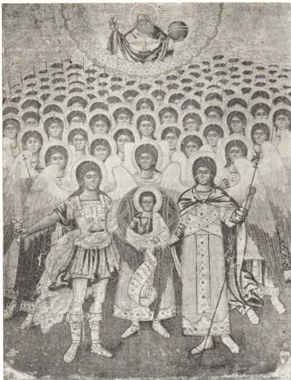
Собор Архистратига Михаила и прочих сил бесплотных

Итак отвечаю. Ангел есть слуга Божий, а не твой: итак смеешь ли ты желать, чтобы он приходил к тебе как раб, небрегомый в своем служении, а не как посланник, честно сретаемый и приемлемый? А как пойдешь навстречу приходящему с небес, если не восходя умом и сердцем к небу, посредством молитвы? Аз приидох в словесах твоих, говорит небесный посланник Даниилу пророку (10, 12),— без сомнения, в словесах молитвы: молитвою своею Даниил проложил стезю, или поставил лестницу, по которой нисшел к нему небесный посланник. Но если ты не пролагаешь такого пути ангелу, если верный слуга Божий видит тебя, обращающего к Господу своему хребет, а не лице, то берегись; правда и святость его потребует, чтобы он сильнее возревновал за славу Господа своего, нежели за тебя; и не удивительно, если он вознегодует, удалится