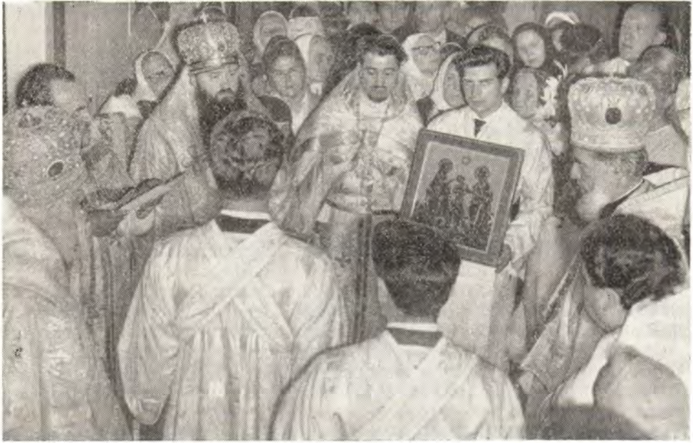
Настоятель Болгарского подворья в Москве архимандрит Филарет приветствует Патриарха Болгарского Кирилла