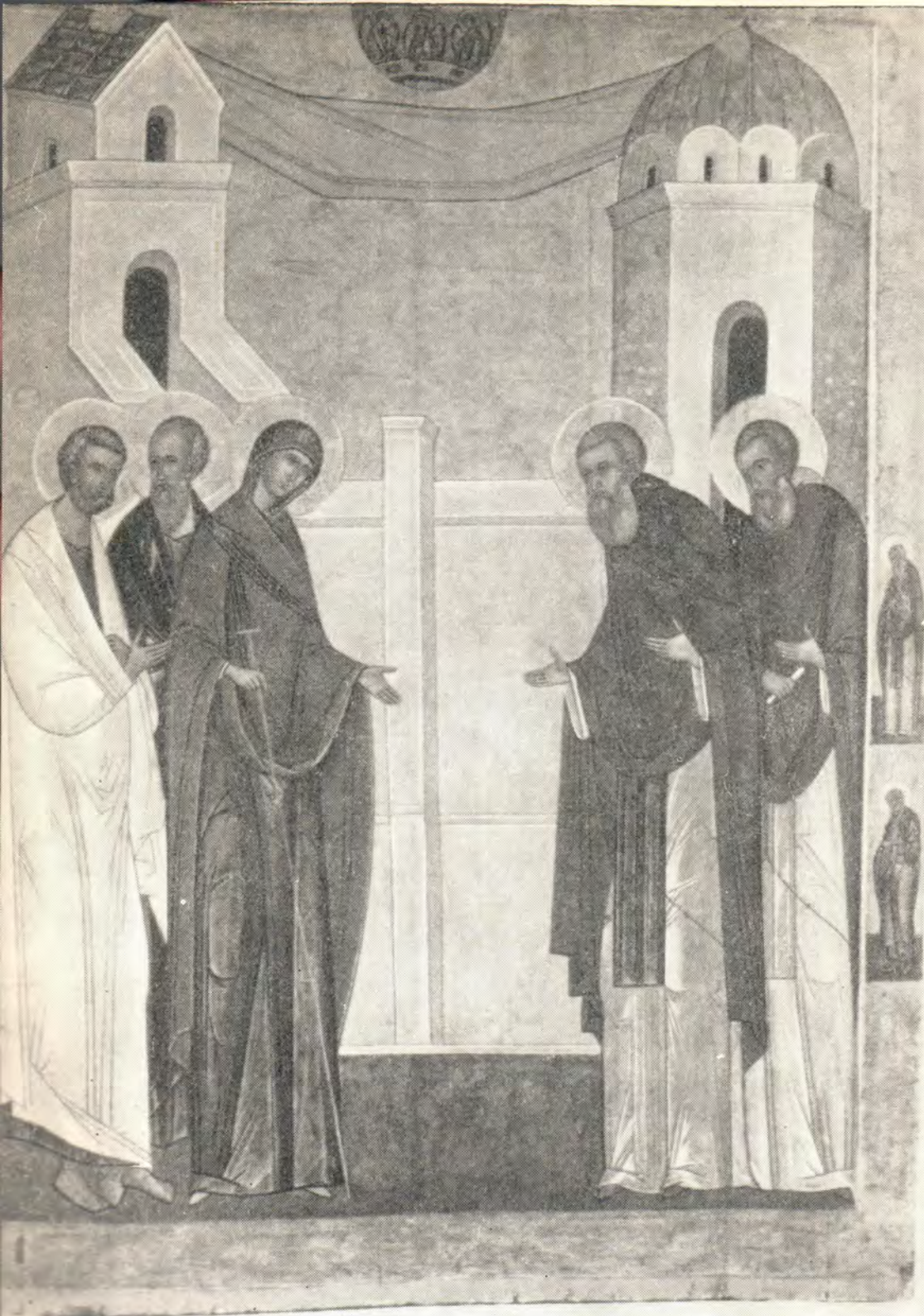
ЯВЛЕНИЕ БОЖИЕЙ МАТЕРИ ПРЕПОДОБНОМУ СЕРГИЮ РАДОНЕЖСКОМУ