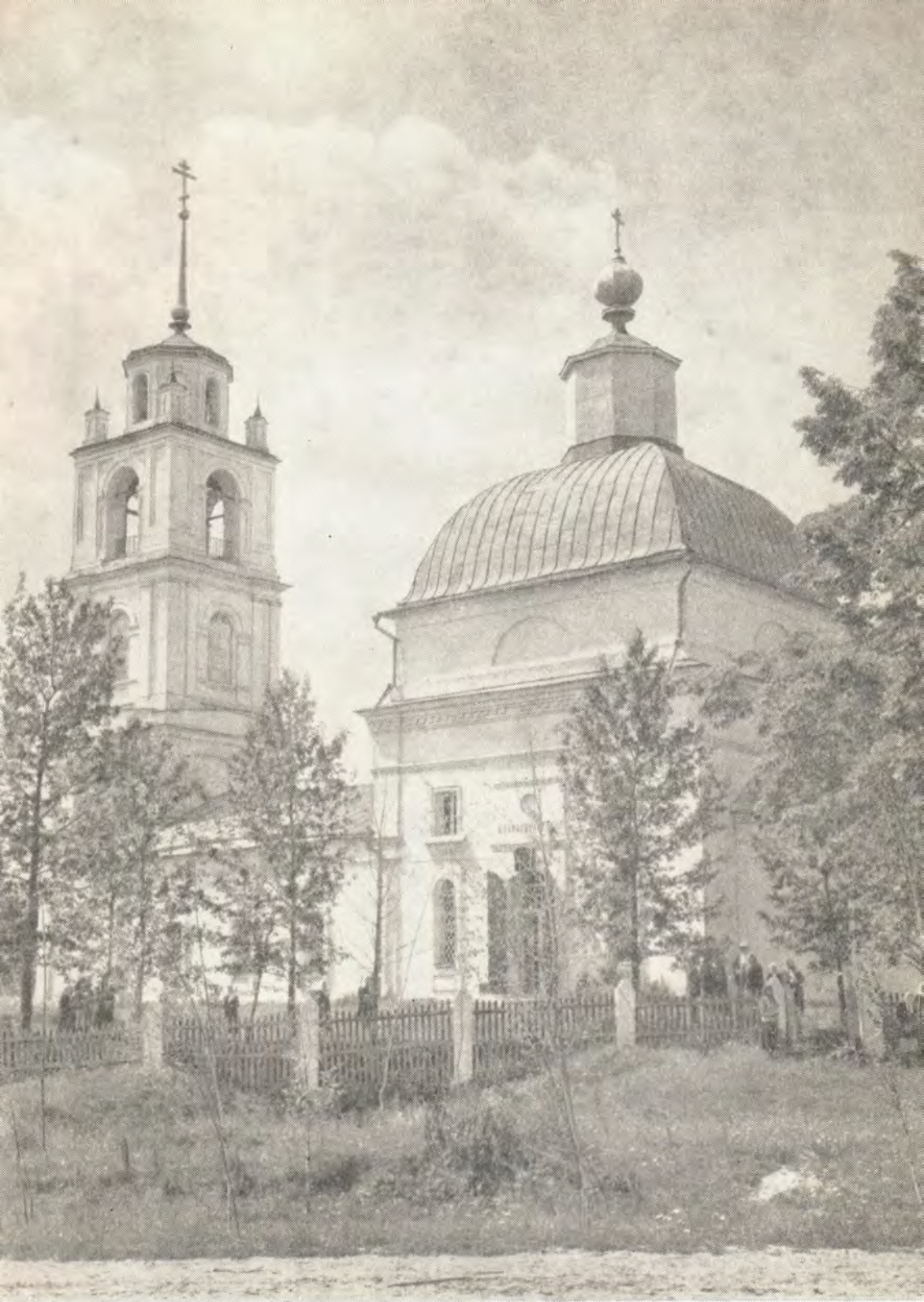
ПРЕОБРАЖЕНСКИЙ ХРАМ с. СПАС (Волоколамское благочиние Московской епархии)