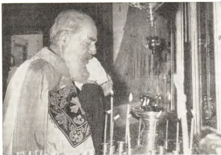
Святейший Патриарх Болгарский Кирилл читает входные молитвы перед началом литургии в церкви Болгарского подворья в праздник Вознесения 8 июня 1967 года

При встрече архимандрит Филарет произнес приветственное слово от имени священнослужителей Болгарского подворья в Москве, прихожан храма и от себя лично.