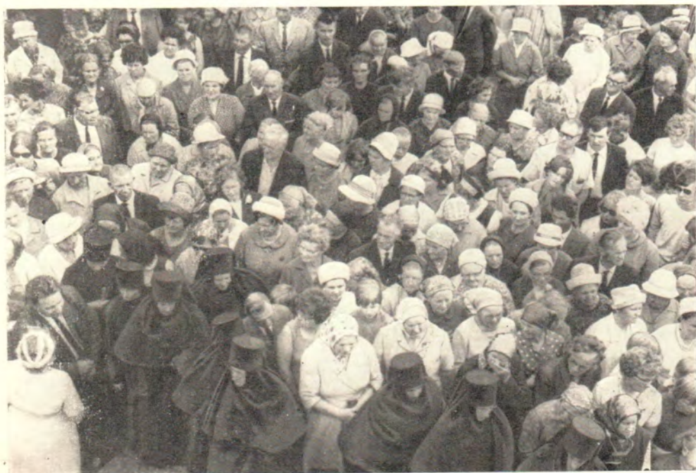
Праздник в Линтуловском монастыре