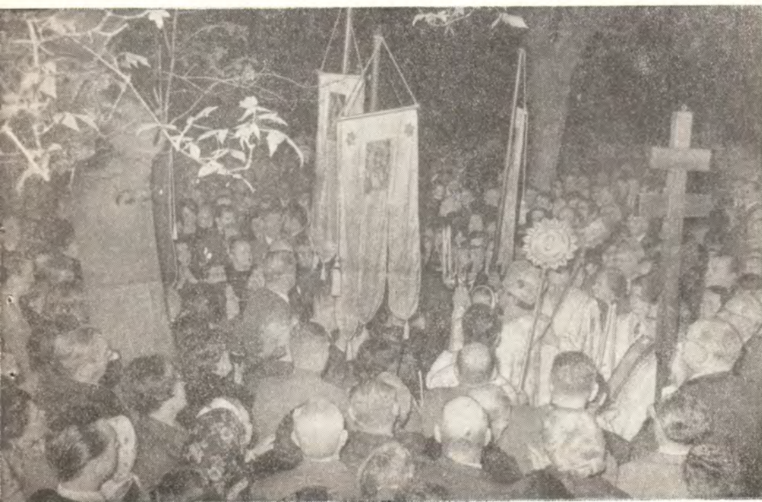
сения в Аргентине. Крестный ход