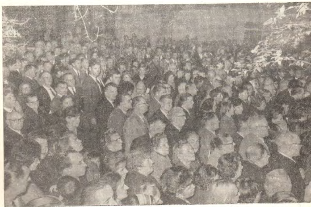
Празднование Светлого Христова Воскре

Хотя в южном полушарии Пасха Христова всегда совпадает с здешней осенью, но в эту Светлую ночь, казалось, пронеслось эхо первого