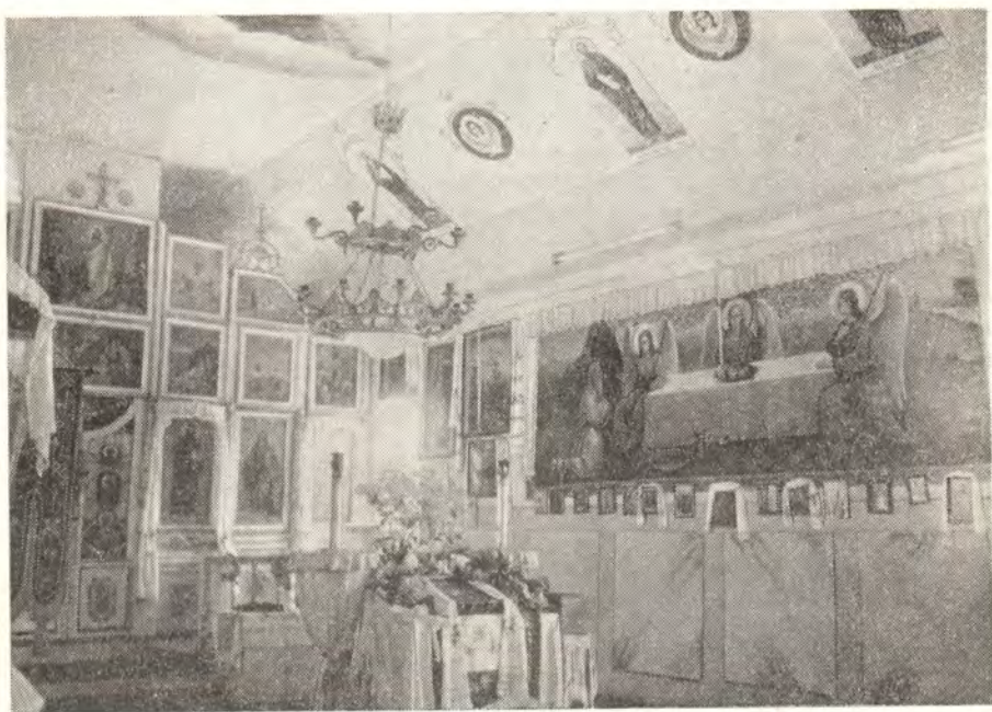
Молитвенный дом во имя Святителя Николая в пос. Станично-Луганское (внутренний вид)