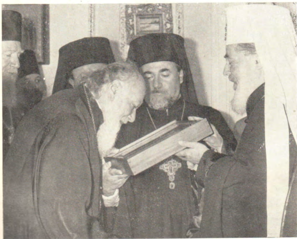
К пребыванию Святейшего Патриарха Болгарского Кирилла в Одессе 9—10 июня 1967 года