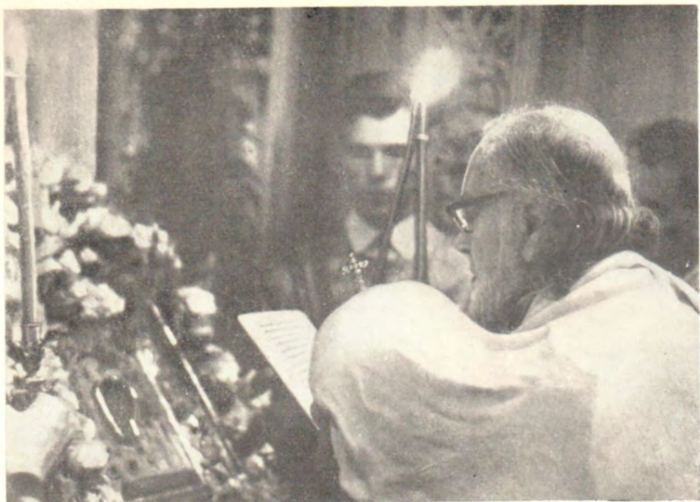
Святейший Патриарх Алексий читает молитву перед Казанской иконой Божией Матери в Богоявленском соборе 21 июля 1967 года