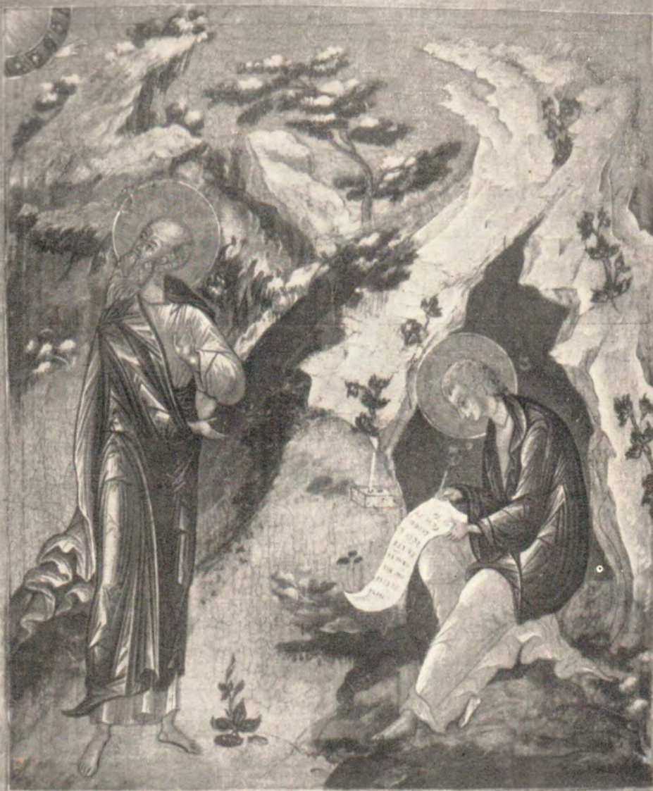
Святой апостол Иоанн Богослов с учеником его святым Прохором