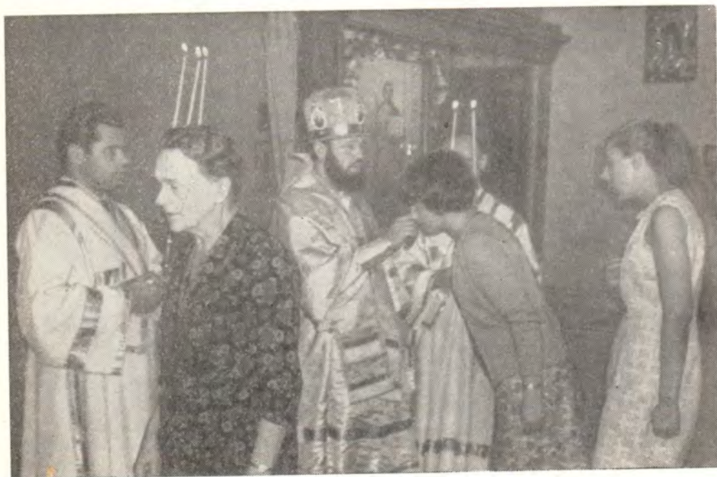
Богослужение в храме Рождества Богородицы в Женеве

Женевский приход, посвященный Рождеству Пресвятой Владычицы нашей Богородицы, был основан небольшой группой прихожан, оставшихся верными Русской Православной Церкви после зарубежного раскола и вошедших в Западноевропейский Экзархат Московского Патриархата с центром в Париже. В течение нескольких лет этот приход не имел постоянного священника и испытывал местные трудности, но он неуклонно оставался верным Матери-Церкви. Прежде всего у прихода не было своей церкви. Из четырех русских храмов в Швейцарии только небольшой храм в Цюрихе был и остается патриаршим.