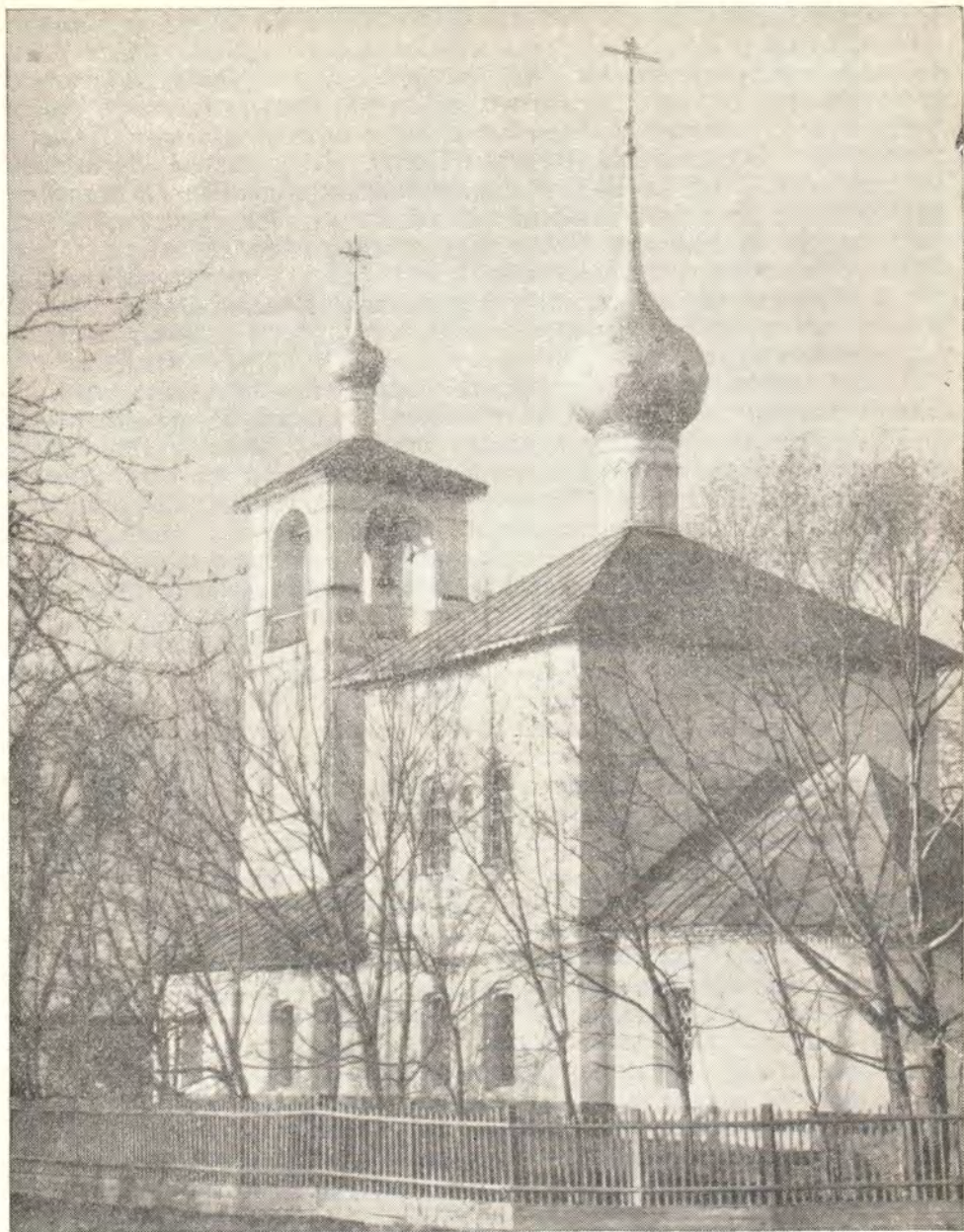
Толгская церковь в Ростове