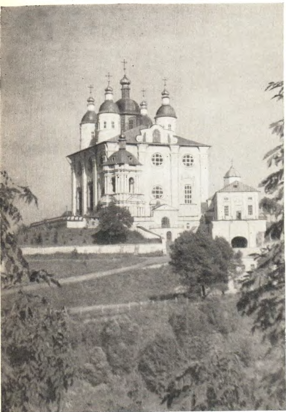
УСПЕНСКИЙ КАФЕДРАЛЬНЫЙ СОБОР В г. СМОЛЕНСКЕ