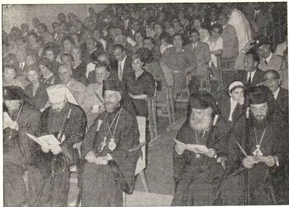
В гимназическом зале в Пафосе. Слева направо: архиепископ Минский и Белорусский Антоний, митрополит Ленинградский и Ладожский Никодим, Блаженнейший Архиепископ Макарий, митрополит Пафский Геннадий, епископ Тримифунтский Георгий

стыря. Он, ища уединения, своими руками ископал себе пещеру и храм в горе, недалеко от своего монастыря. Мы посетили этот пещерный древний храм XII века с фресками, написанными вскоре после кончины Преподобного, т. е. в XII веке.