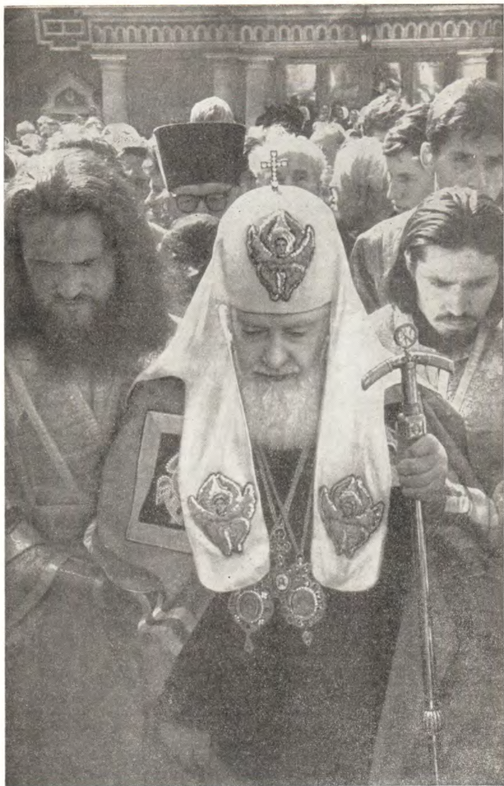
Святейший Патриарх Алексий в праздник обретения мощей преп. Сергия Радонежского следует в Троицкий собор Лавры