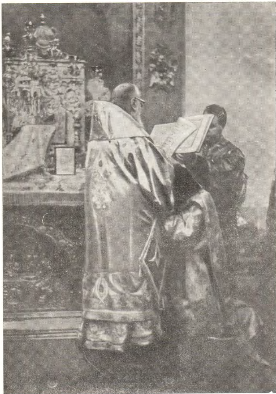
Святейший Патриарх Алексий совершает хиротонию иеродиакона Никодима (Деева) во иеромонаха

С 29 июля по 9 августа 1967 года в Бристоле (Англия) проходили заседания Комиссии Всемирного Совета Церквей «Вера и церковное устройство», в которых от Русской Православной Церкви принимал участие ректор Ленинградской духовной академии Преосвященный епископ Тихвинский Михаил.