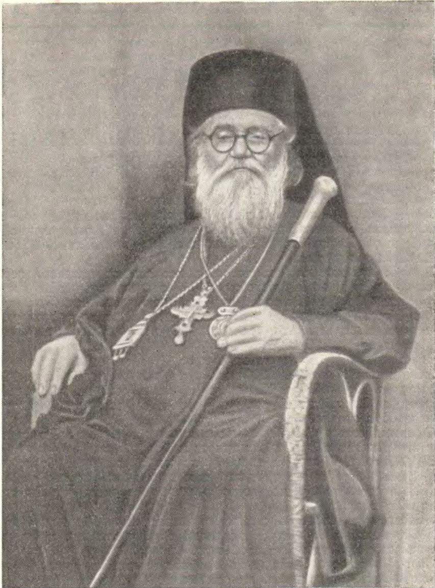
ХРИСТОФОР II, ПАПА И ПАТРИАРХ АЛЕКСАНДРИЙСКИЙ И ВСЕЯ АФРИКИ

В Эфиопии митрополит Христофор организывает несколько православных греческих приходов и нормализует там церковную жизнь, а затем переводится в г. Хартум (Судан).