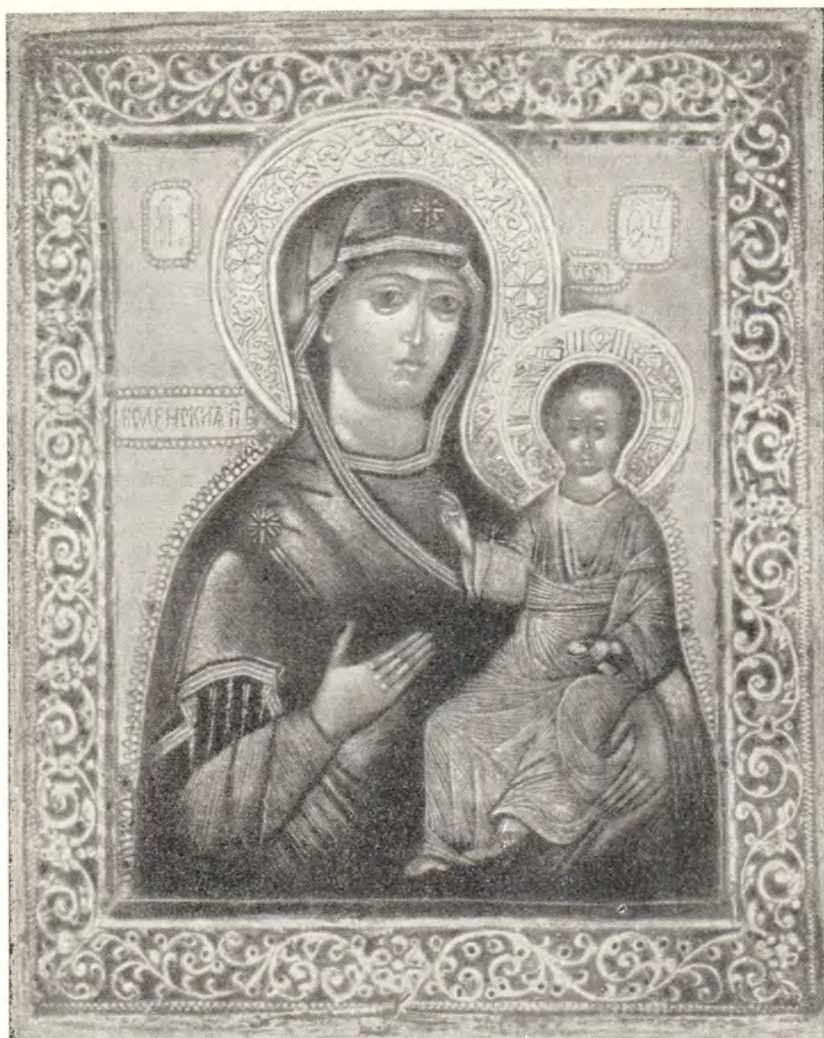
Смоленская икона Божией Матери «Одигитрия»

Как показали исторические исследования, а также археологические раскопки последних лет, установлено, что Смоленск — весьма древний город и по древности и культурному значению может соперничать с такими русскими городами, как Киев, Новгород, Чернигов и др.