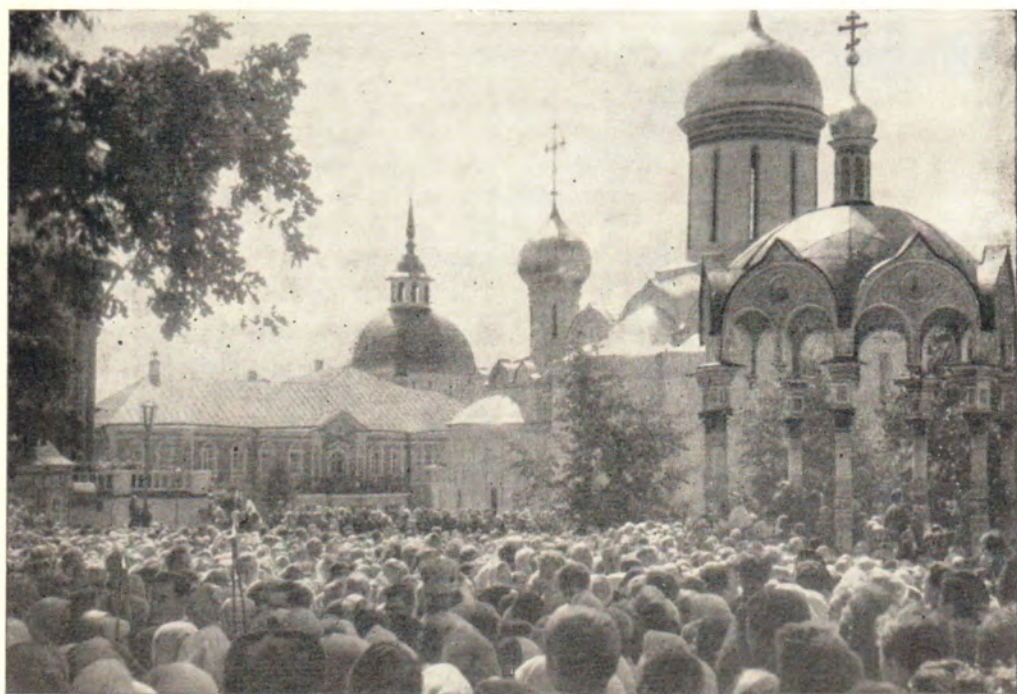
В праздник преп. Сергия Радонежского в Троице-Сергиевой Лавре. Вверху — Святейший Патриарх Алексий благословляет молящихся