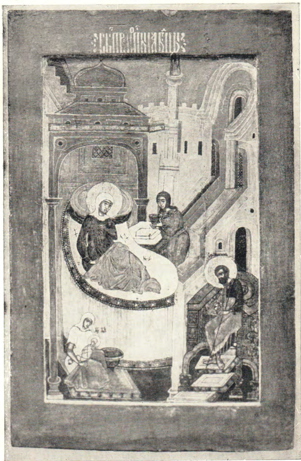
РОЖДЕСТВО ПРЕСВЯТОЙ БОГОРОДИЦЫ