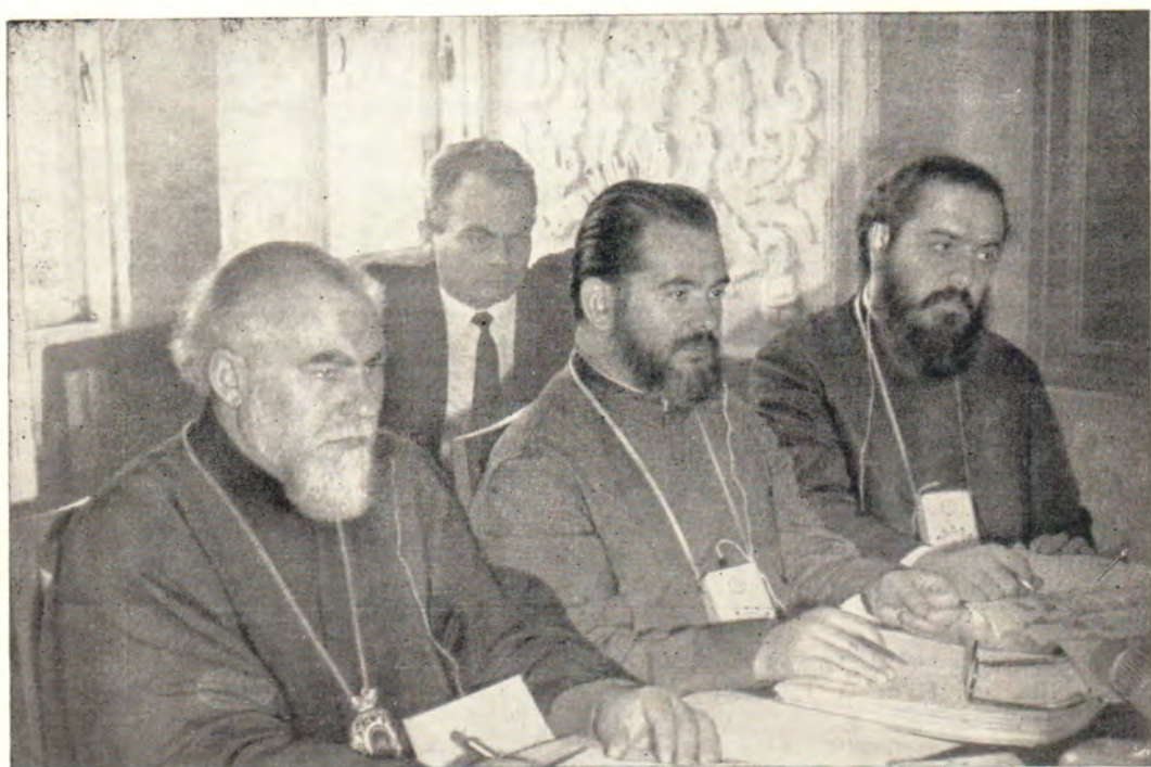
Участники сессии Рабочего комитета в Загорске 2—4 июля 1967 года. Слева направо: митрополит Ловчанский Максим (Болгарская Церковь), д-р Мирослав Меншик (ЧССР), епископ Игнатий Хазим и архимандрит Алексий Абдель Карим (Антиохийская Церковь)