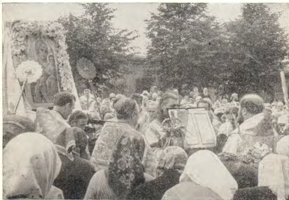
Крестный ход и молебен в праздник Смоленской иконы Божией Матери в Успенском соборе г. Смоленска

Современники Бориса Годунова называли Смоленск «ключом-городом». Первое испытание новой смоленской стене пришлось выдержать вскоре же после ее постройки. С 16 сентября 1609 года в течение 20 месяцев продолжалась осада Смоленска войсками Сигизмунда III. Лишь 3 июня 1611 года осаждавшим удалось сделать пролом в стене и ворваться в город. Большинство жителей (около 3000), не желая сдаваться в плен, закрылись в Успенском соборе, помолились перед чудотворным образом и взорвали себя и собор. Во время осады города икона «Одигитрия» была снова отправлена сначала в Москву, а затем