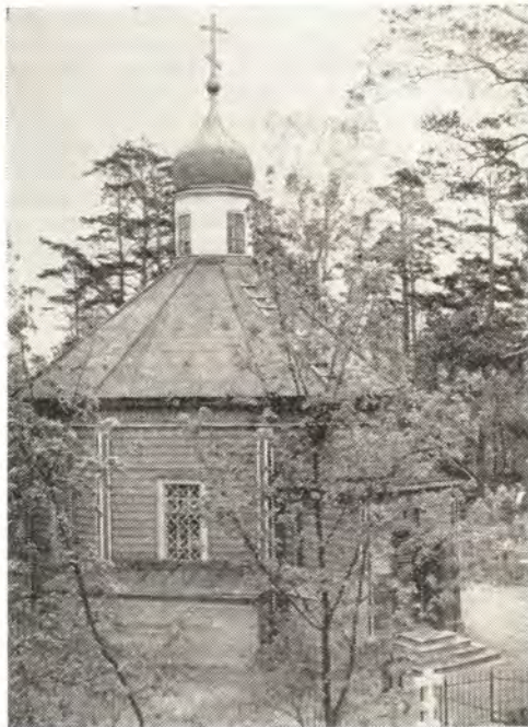
Храм св. Александра Невского

Вслед за тем священники подали на престольную доску. Владыка митрополит окропил ее с обеих сторон святой водой и при пении 144-го псалма «Вознесу Тя, Боже мой...» и 22-го псалма «Господь пасет мя, и ничтоже мя лишит...» положил ее на столпах престола. После возгласа «Благословен Бог наш...» ключарь принес четыре гвоз-