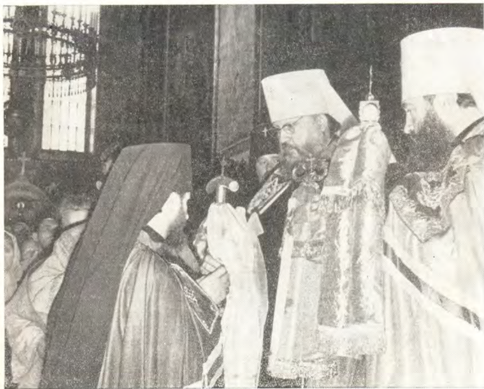
Митрополит Крутицкий и Коломенский Пимен вручает архипастырский жезл епископу Переяслав-Хмельницкому Феодосию

«Возлюбленный брат, Преосвященный епископ Феодосий! В нынешний знаменательный для тебя день, когда ты, будучи избранным Святейшим Патриархом и Священным Синодом на епископское служение, воспринял благодать архиерейства и по молитвам чрез возложение рук собратьев-епископов получил всегда спешествующую епископскому служению благодать Божию, я позволю себе для братского на-