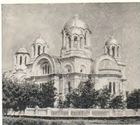
Никольский собор в г. Прохладном