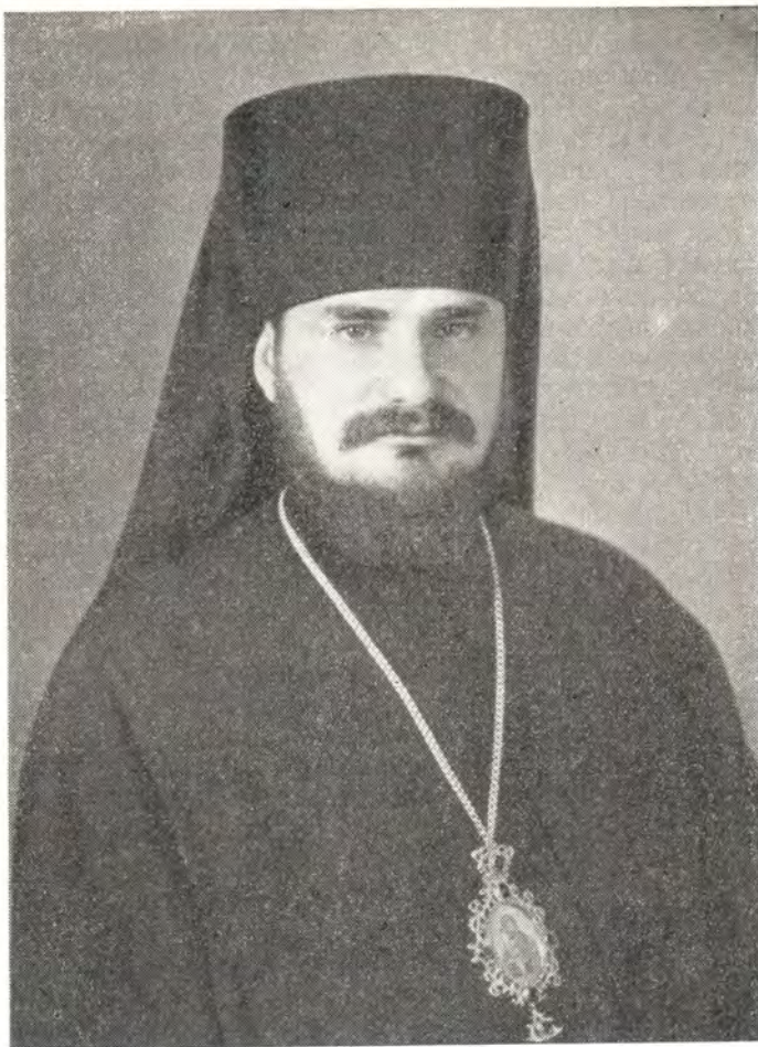
ФЕОДОСИИ, ЕПИСКОП ПЕРЕЯСЛАВ-ХМЕЛЬНИЦКИЙ, ВИКАРИЙ КИЕВСКОЙ ЕПАРХИИ

меньший между братьями моими и юнейший в доме отца моего», и Господь «послал вестника Своего, и взял меня от овец отца моего, и помазал меня елеем помазания Своего. Братья мои прекрасны и велики, но Господь не благоволил избрать из них» вождя народу израильскому (Псал. 151, 1, 4—5). Почему не благоволил? Здесь тайна Святого Провидения. Господу иногда бывает угодно низлагать сильных со престолов и возносить смиренных (Лк. 1, 52), оставлять в стороне красноречивых ораторов и избирать для Своей проповеди гугнивых Моисеев и простых рыбаей, утаивать Себя от премудрых века сего и открываться младенцам (Мф. 11, 25). Чтобы дела Божии в мире были еще более явны и дабы не было повода к превозношению человеческого, Бог часто избирает для Своего дела людей слабых, но покорных Его святой воле, желая тем самым показать миру, что сила Его «в немощи совершается» (2 Кор. 12, 9).