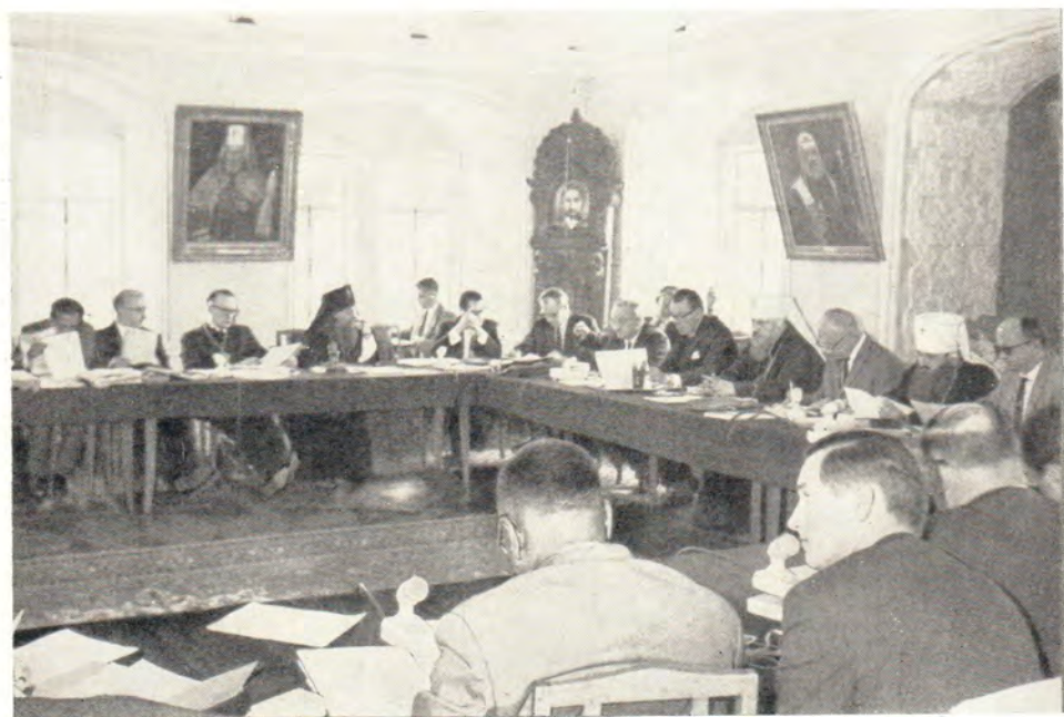
В зале заседаний Рабочего комитета Христианской Мирной Конференции в Загорске 2—4 июля 1967 года