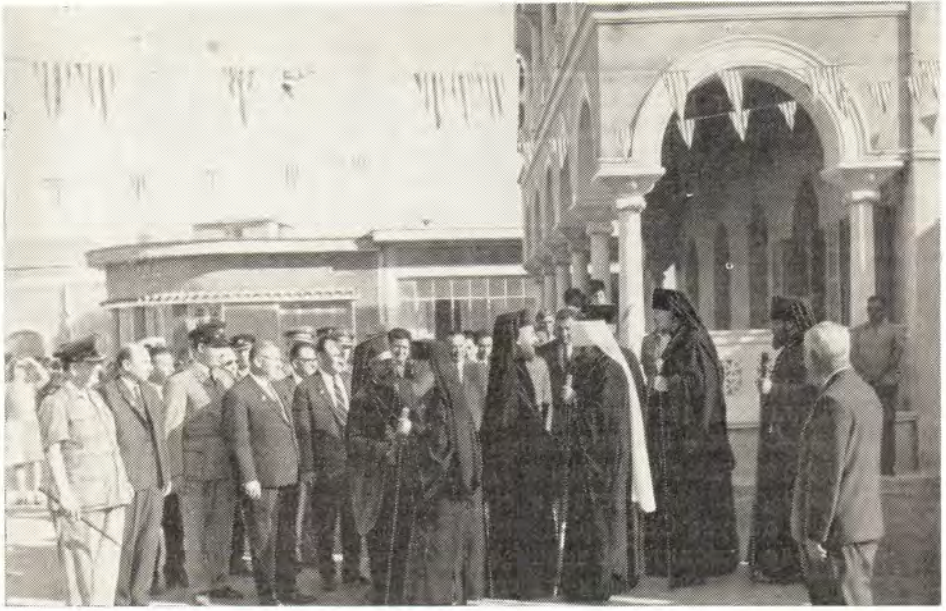
Делегация Русской Православной Церкви в резиденции митрополита Пафского Геннадия

шей Церкви с глубоким удовлетворением воспринимают и отмечают, что руководство настоящим прогрессивным движением в вашей стране осуществляется Предстоятелем Святой Кипрской Православной Церкви Блаженнейшим Архиепископом Макарием, который является одновременно и Президентом Республики Кипр.