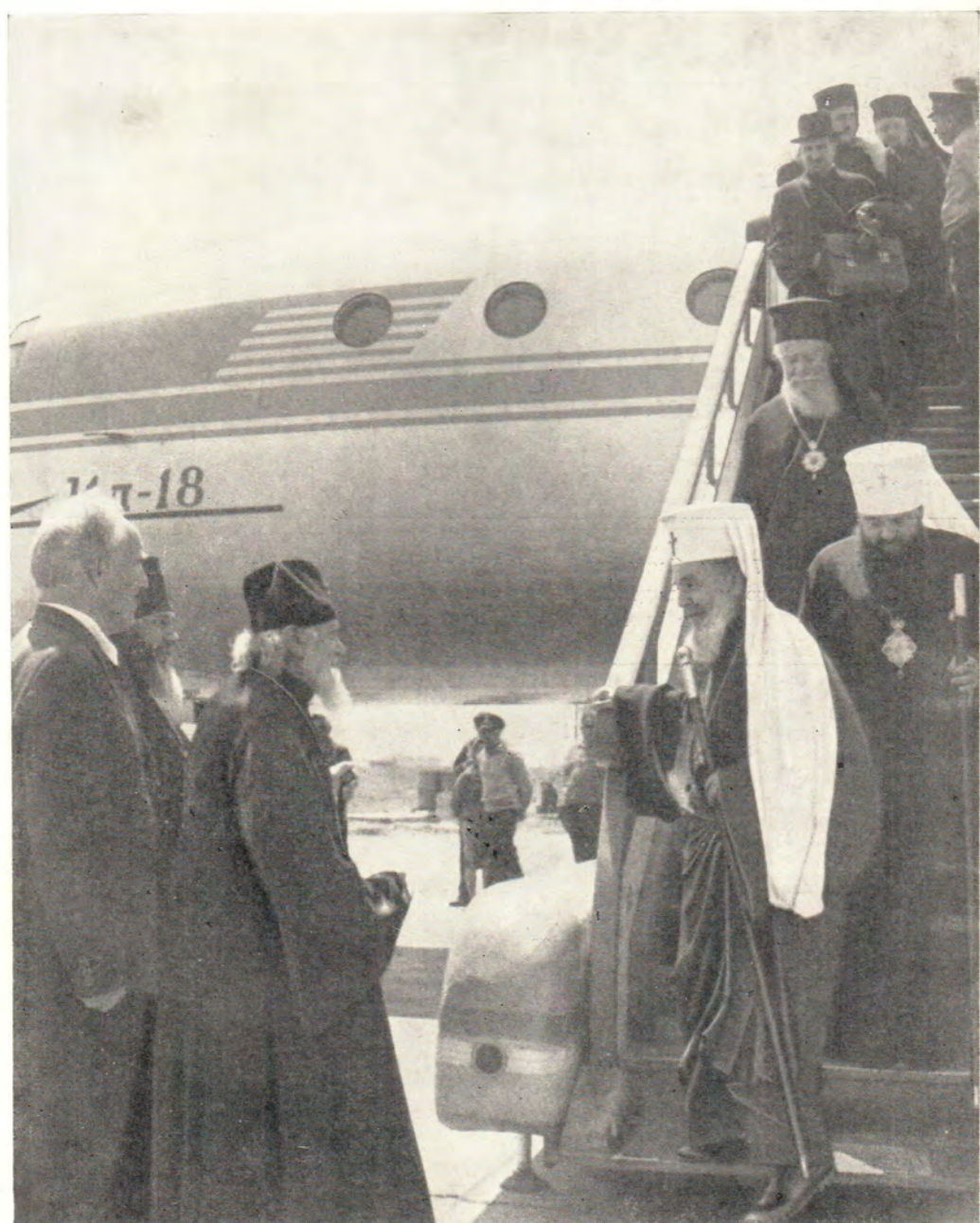
Святейший Патриарх Алексей и Святейший Патриарх Болгарский Кирилл в Одесском аэропорту 9 июня 1967 года