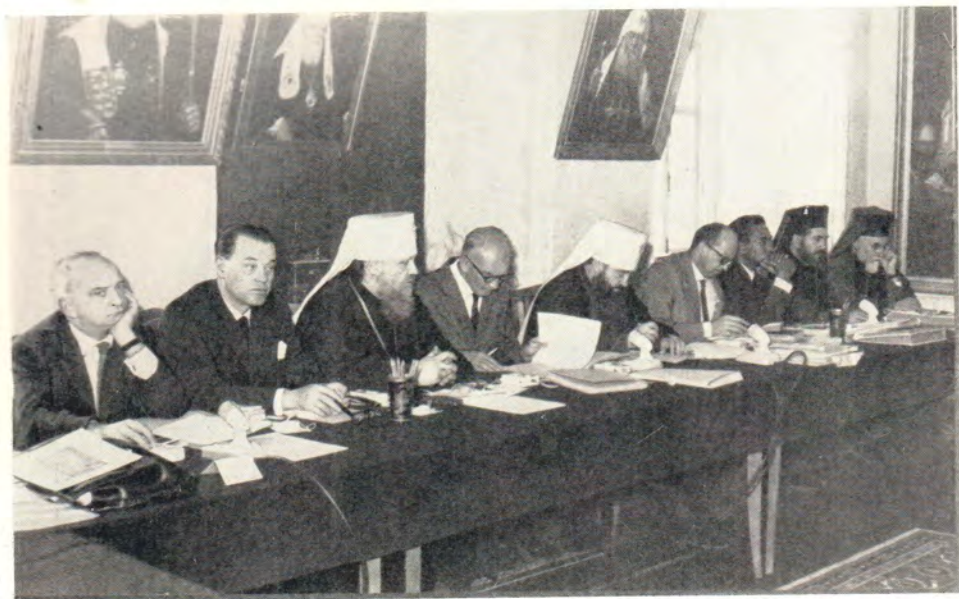
На открытии сессии Рабочего комитета Христианской Мирной Конференции в Загорске 2 июля 1967 года