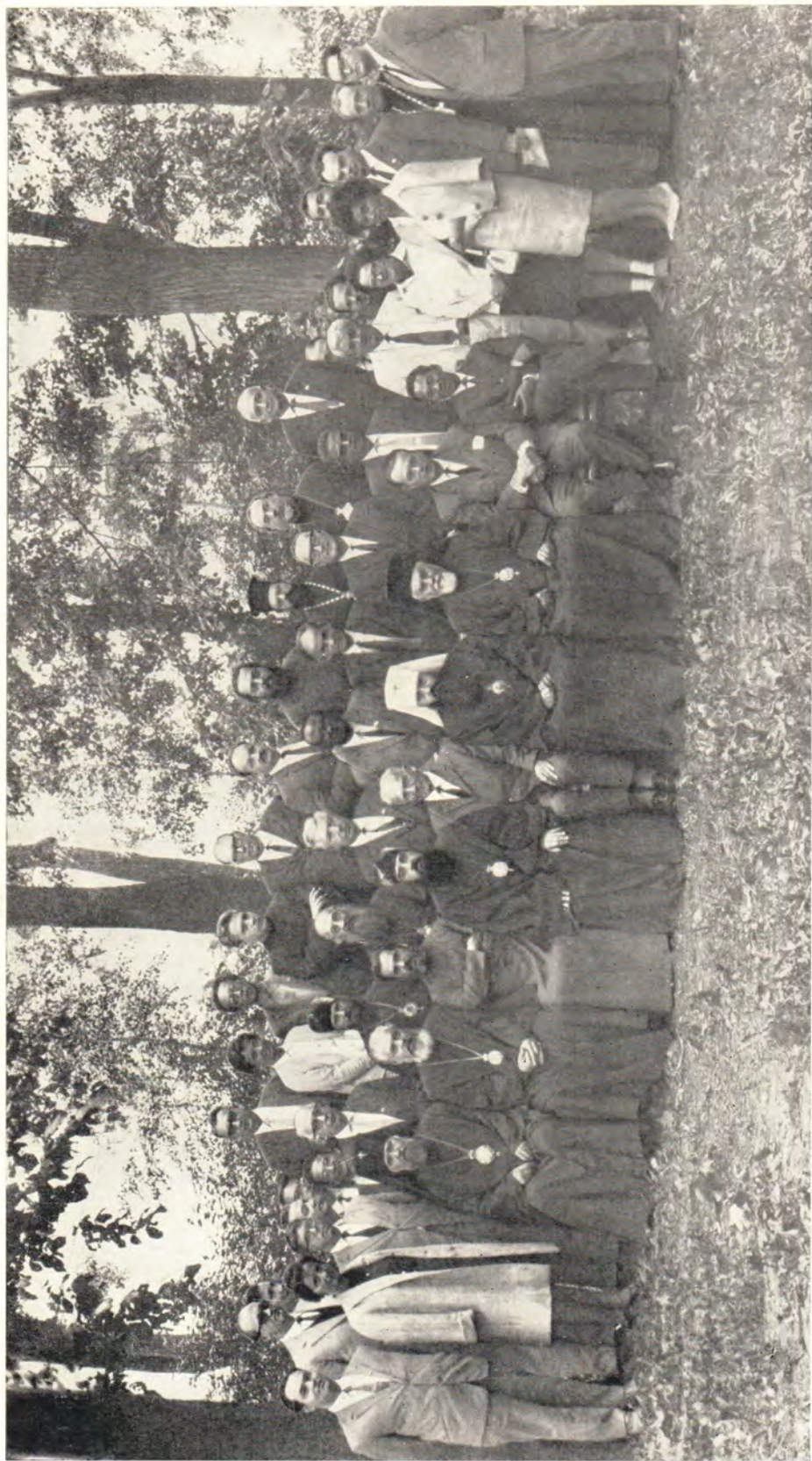
Участники сессии Рабочего комитета Христианской Мирной Конференции в Загорске