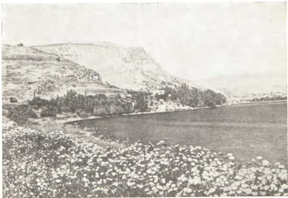
Берег Галилейского озера в окрестностях Магдалы