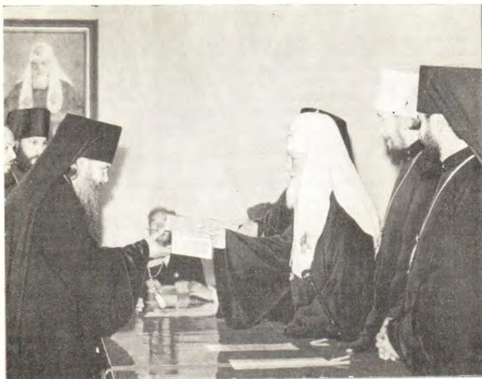
Святейший Патриарх Алексий вручает аттестаты выпускникам Одесской духовной семинарии

торые много труда положили для того, чтобы преподать вам те знания, которые необходимы для будущих пастырей».