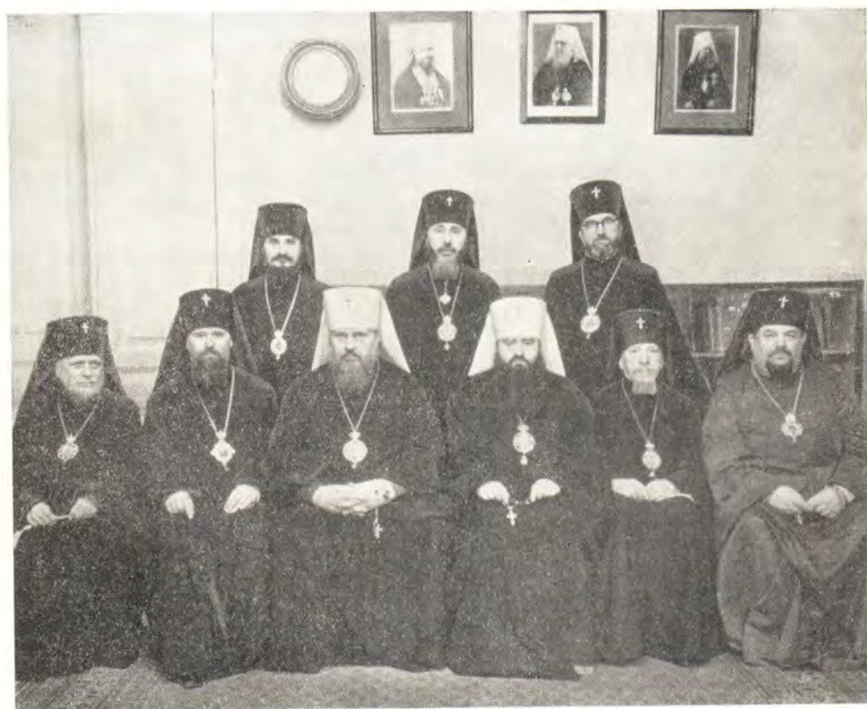
Архиереи — участники хиротонии епископа Переяслав-Хмельницкого Феодосия. В первом ряду, слева направо: Вениамин, архиепископ Иркутский и Читинский; Филарет, архиепископ Киевский и Галицкий, Экзарх Украины; Пимен, митрополит Крутицкий и Коломенский; Никодим, митрополит Ленинградский и Ладожский; Пантелеимон, архиепископ Эдмонтонский и Канадский; Иосиф, архиепископ Ивано-Франковский и Коломыйский. Во втором ряду: Феодосий, епископ Переяслав-Хмельницкий; Сергей, архиепископ Херсонский и Одесский; Николай, архиепископ Львовский и Тернопольский.

Тебе еще не широкое поле деятельности предоставлено Церковью. Твои святительские труды должны будут проходить под руководством