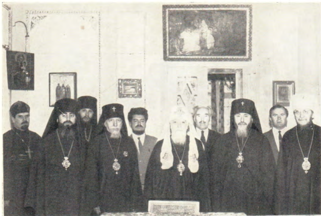
5 июня 1967 года Святейший Патриарх Алексий принял архиепископа Эдмонтонского и Канадского Пантелеимона в своей летней резиденции в одесском Успенском монастыре