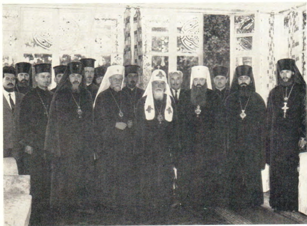
Архиепископ Карельский и вся Финляндии Павел на приеме у Святейшего Патриарха Московского и всея Руси Алексия в летней резиденции Патриарха в одесском Успенском монастыре 23 июня 1967 года