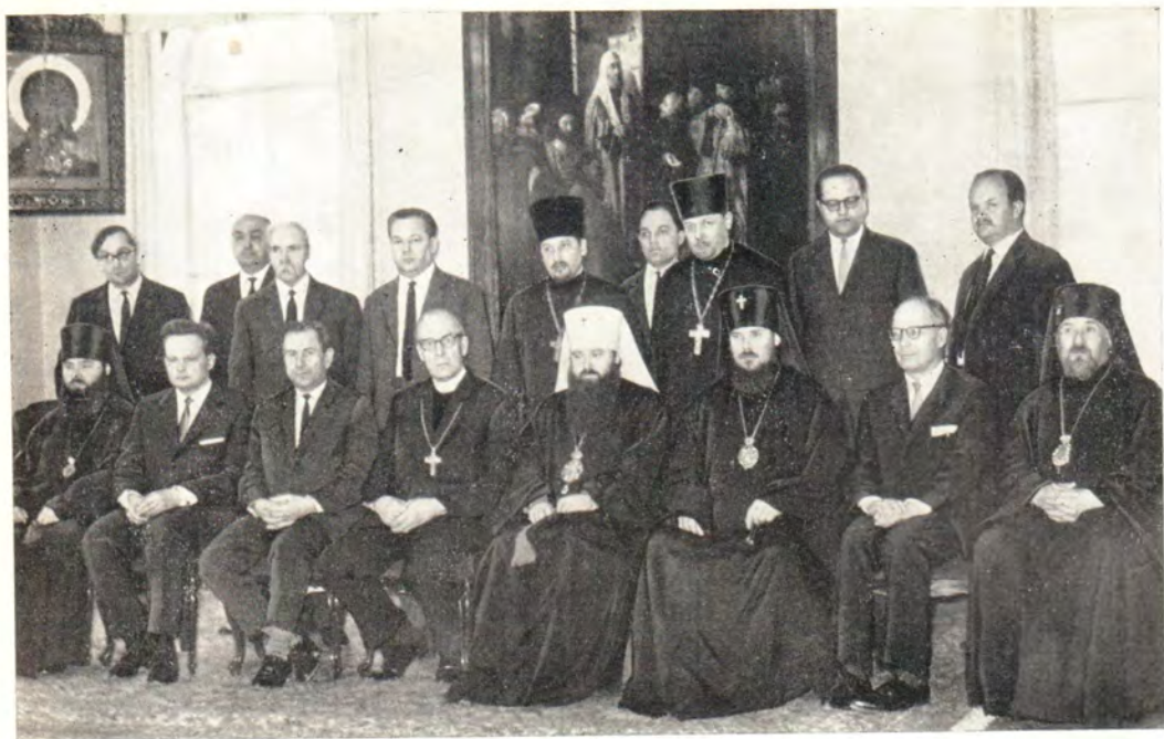
5 мая 1967 года в Отделе внешних церковных сношений Московского Патриархата состоялся прием в честь Главы Евангелическо-Лютеранской Церкви Финляндии Архиепископа д-ра Марти Симоёкки. На фото — участники приема