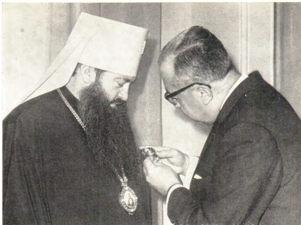
Посол Ливанской Республики г-н Наим Амиуни вручает митрополиту Ленинградскому и Ладожскому Никодиму, председателю Отдела внешних церковных сношений Московского Патриархата, орден Кедр Ливанского 6 апреля 1967 года