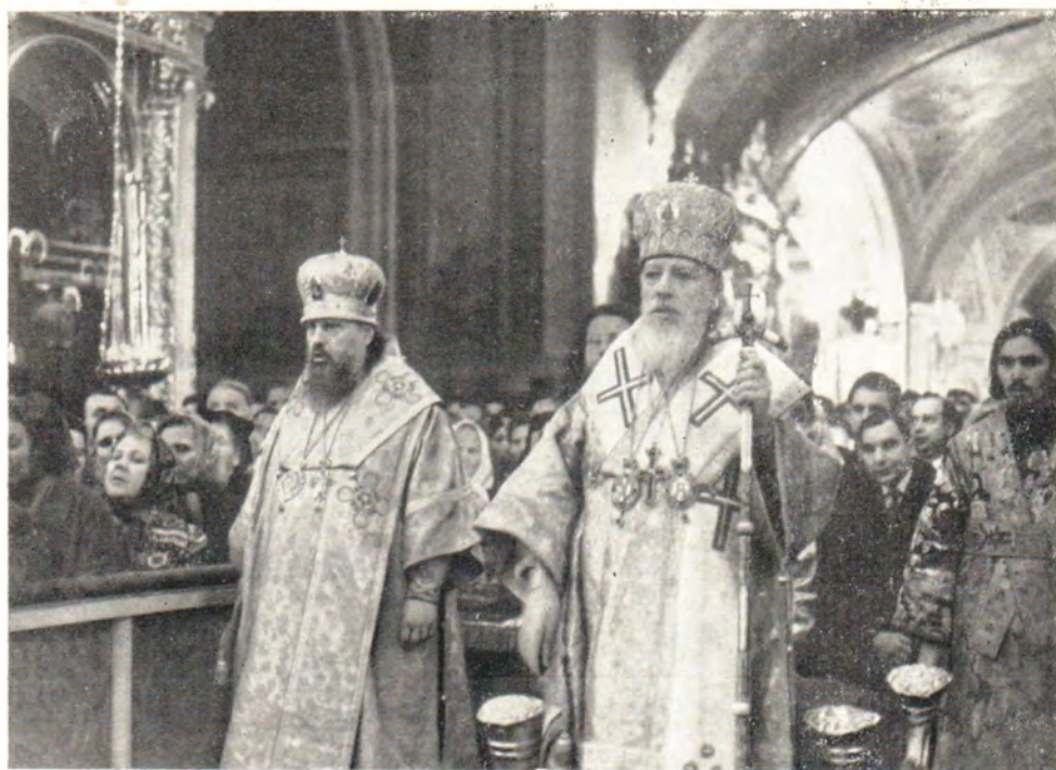
Светлая утренняя в Богоявленском патриаршем соборе 30 апреля 1967 года