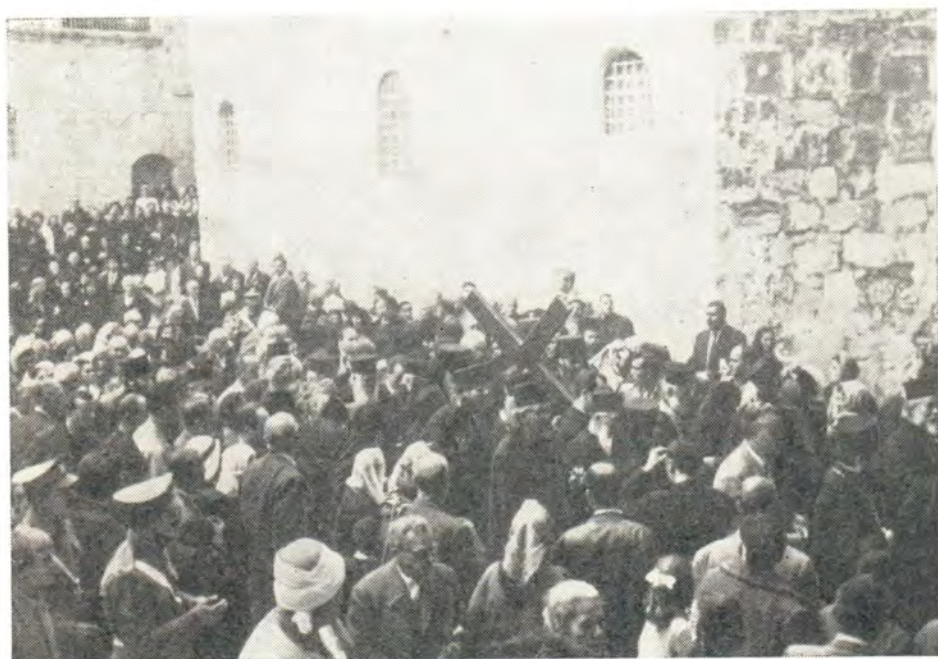
Чин «несения Креста» по «крестному пути» в Иерусалиме (Иордания) в Великую пятницу 28 апреля 1967 года. В процессии участвуют и паломники Русской Православной Церкви, прибывшие в Иерусалим на Пасху 1967 года.