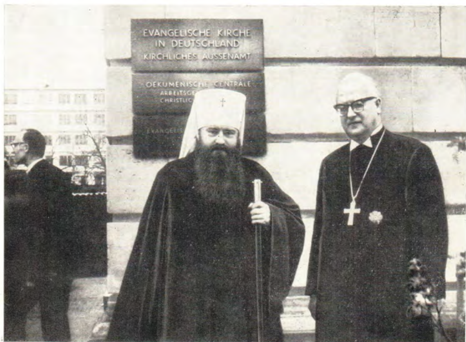
Председатель Отдела внешних церковных сношений Московского Патриархата митрополит Ленинградский и Ладожский Никодим и президент Отдела внешних церковных сношений Евангелической Церкви Германии д-р А. Вишман (см. информацию в «ЖМП» № 5, стр. 10—13)