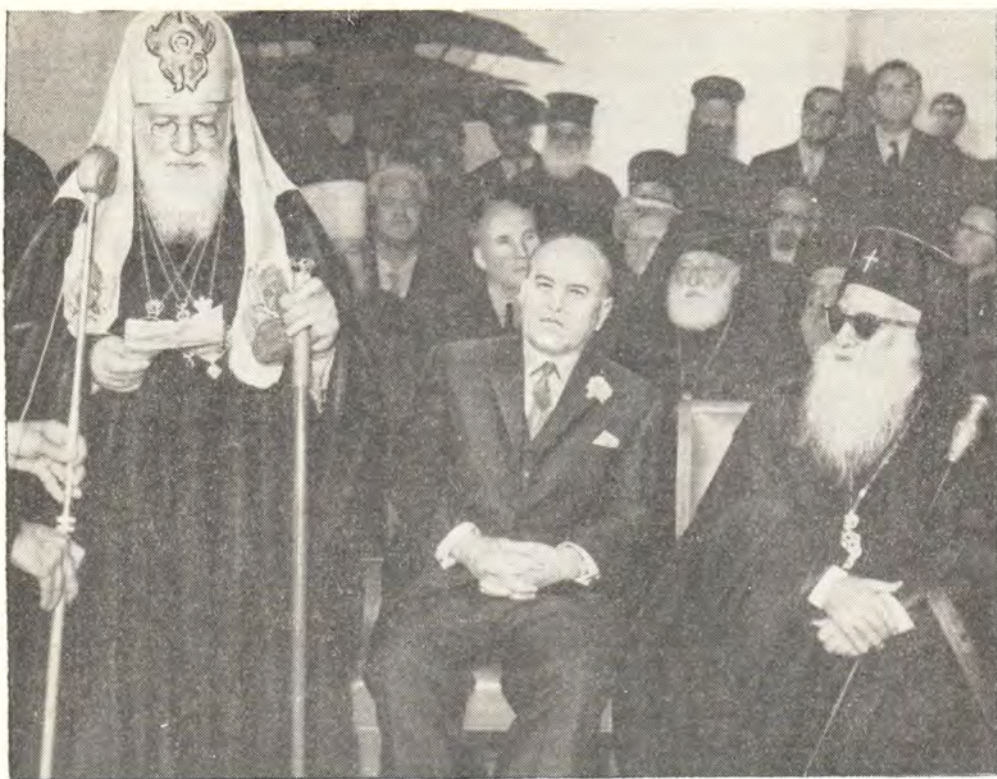
На церемонии закладки госпиталя св. Георгия в Бейруте 11 декабря 1960 года: Святейший Патриарх Алексий, Премьер-министр Ливана Саиб-Салам и митрополит Бейрутский Илия Салиби

Русской Церкви за ее соучастие в этом великом предприятии. Великое спасибо также русскому Правительству, способствовавшему в деле приобретения предметов оборудования и обеспечения их доставки в установленные сроки». В письме Святейшему Патриарху Алексию митрополит Илия Салиби писал, что госпиталь «по свидетельству всех без исключения, считается самым превосходным госпиталем на Востоке благодаря имеющимся в нем современным медицинским принадлежностям, инструментам, приборам... Торжество освящения госпиталя было весьма важным событием в истории Ливана. В нем усилилась слава Православия».