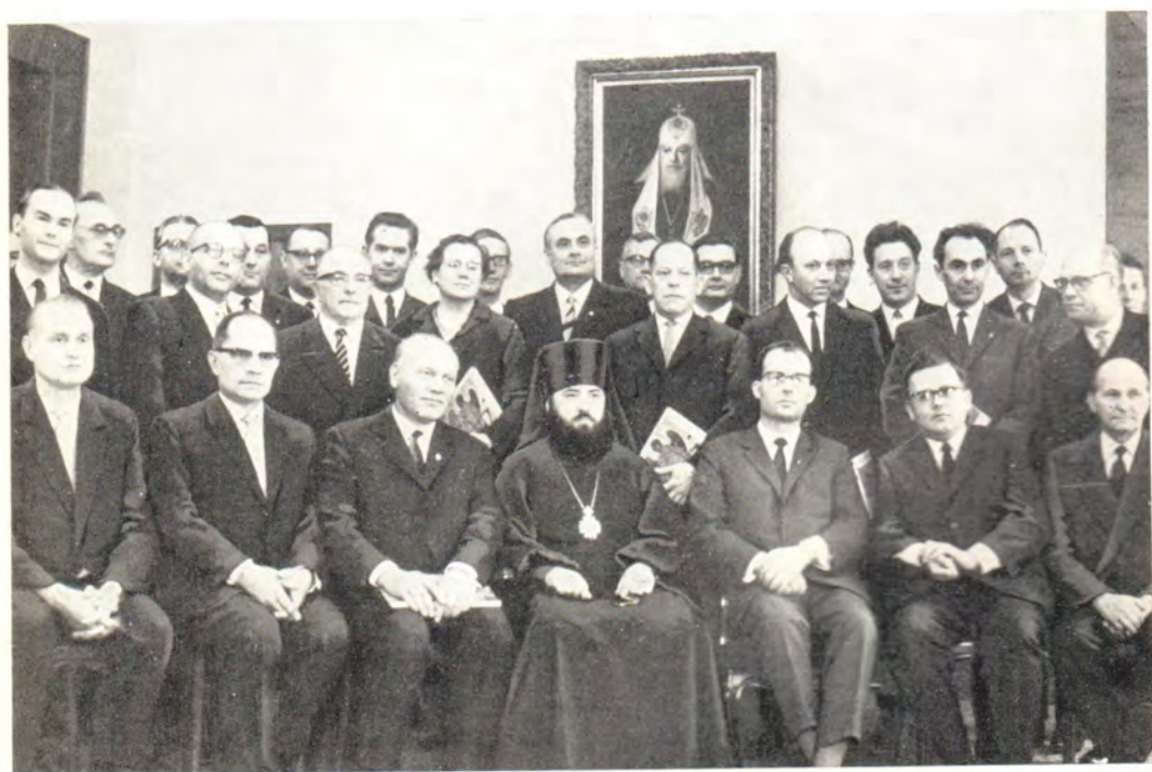
Заместитель председателя Отдела внешних церковных сношений Московского Патриархата епископ Зарайский Ювеналий с делегацией Христианско-демократического союза ГДР, 4 апреля 1967 года