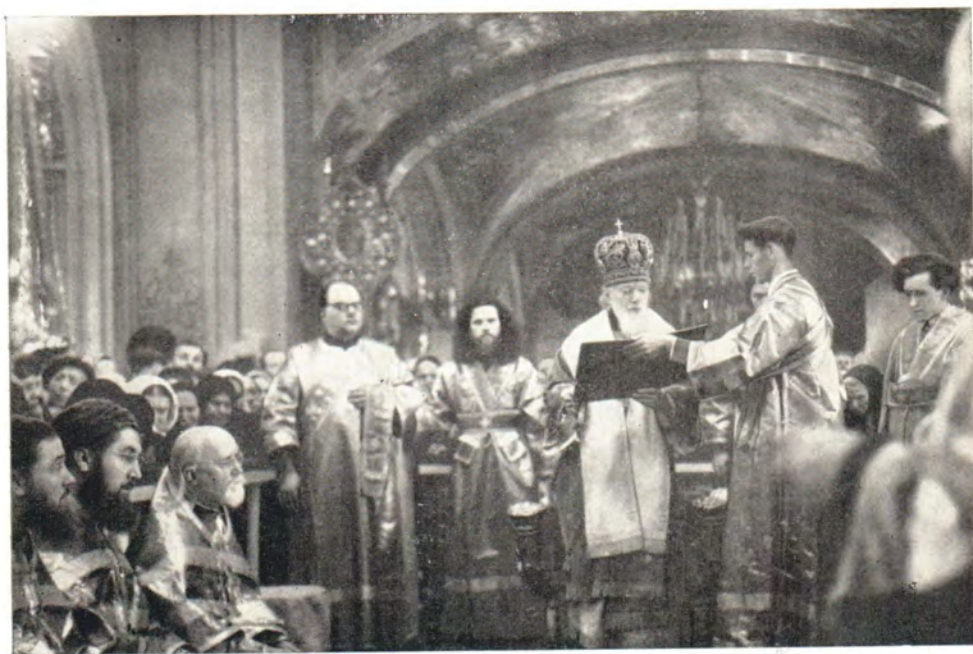
Святейший Патриарх Алексий совершает чин умовения ног в Великий четверг