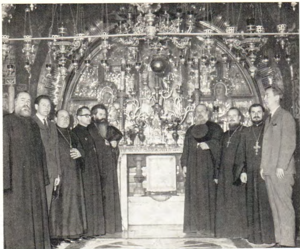
Паломники Русской Православной Церкви у Голгофы 26 апреля 1967 года