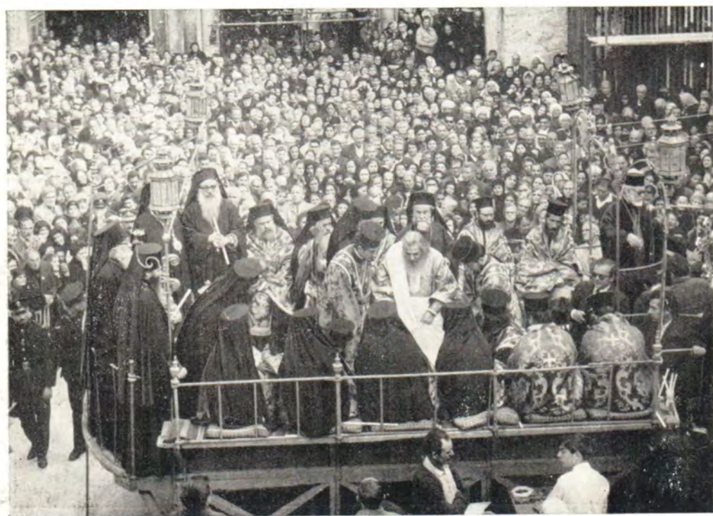
Чин умовения ног в Иерусалиме на площади у храма Воскресения в Великий четверг 27 апреля 1967 года