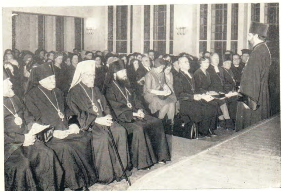
Торжественный акт 19 февраля 1967 года