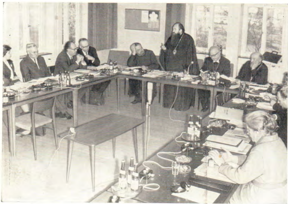
Богословский диалог между богословами Русской Православной Церкви и Евангелической Церкви Германии 3—8 марта 1967 г. в Хёхсте (ФРГ) — «Арнольдсхайн-III» На собеседовании