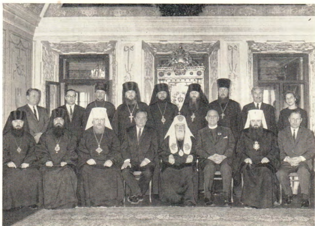
Участники приема в честь генерального секретаря Всемирного Совета Церквей Ю. К. Блейка у Святейшего Патриарха Алексия в патриарших покоях в Троице-Сергиевой Лавре 29 марта 1967 года