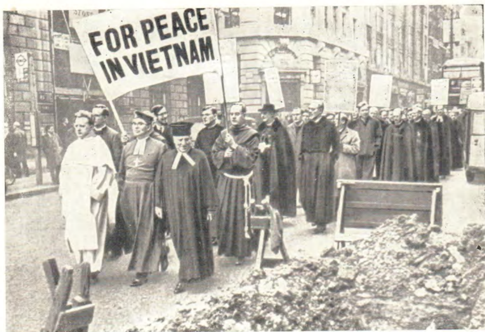
Процессия христианских священнослужителей и иудейских раввинов «За мир во Вьетнаме» 10 февраля 1967 г. проходит по Флит-стрит по направлению к собору св. Павла в Лондоне