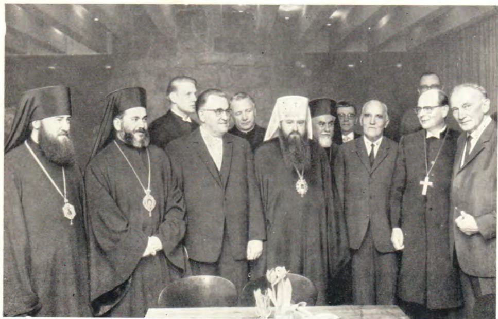
Прием в Ганновере. Слева направо (в первом ряду): епископ Зарайский Ювеналий, митрополит Латтакийский Игнатий Хазим (Антиохийский Патриархат), обербургомистр Ганновера д-р Холвег, митрополит Ленинградский и Ладожский Никодим, митрополит Ловчанский Максим (Болгарский Патриархат), оберкирхенрат д-р Гейнц Клоппенбург, председатель Всесоюзного Совета евангельских христиан-баптистов И. Г. Иванов, земельный епископ Брауншвейгской Евангелическо-Лютеранской Церкви д-р Герхардт Гейнце, д-р Иосиф Громадка, президент ХМК