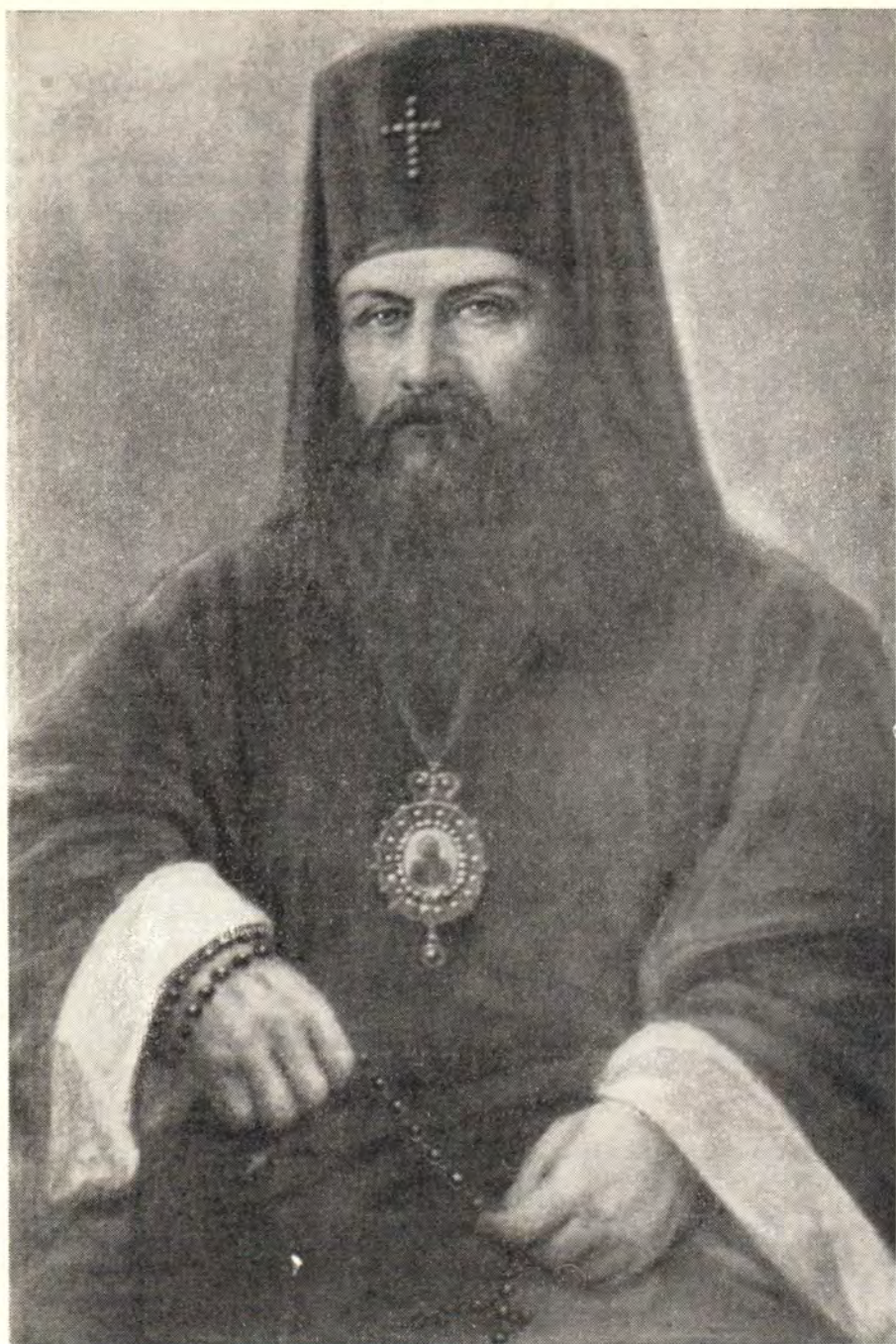
ИННОКЕНТИЙ, АРХИЕПИСКОП ХЕРСОНСКИЙ

Хорошо подготовленный, он был принят в 1810 году сразу во второй класс Воронежского училища. В сентябре того же года переведен в третий, а в январе 1811 года — в четвертый класс.