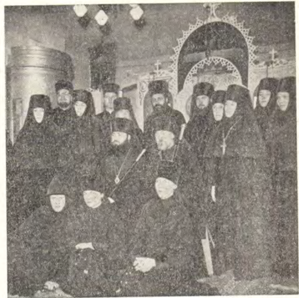
Делегация Московского Патриархата в Лентуловском женском монастыре