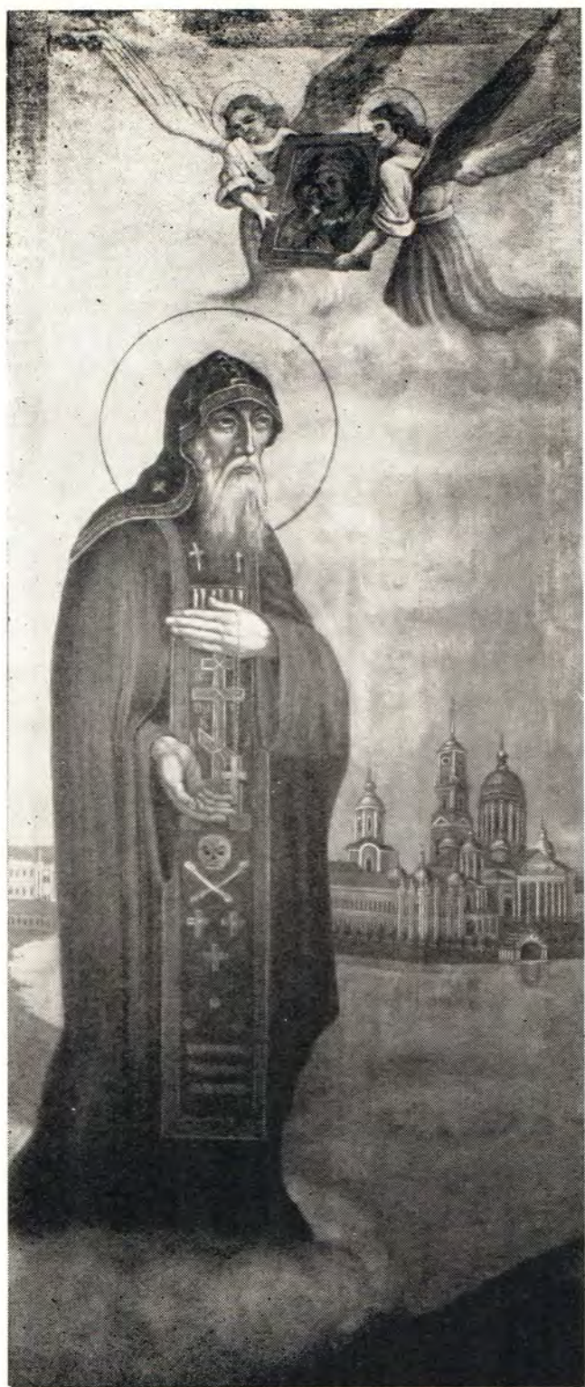
ПРЕПОДОБНЫЙ НИЛ, «иже на езере Селигере, на острове Столбное» Икона XIX века