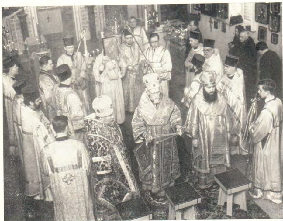
Божественная литургия в Никольском храме г. Хельсинки 19 февраля 1967 года. Малый вход