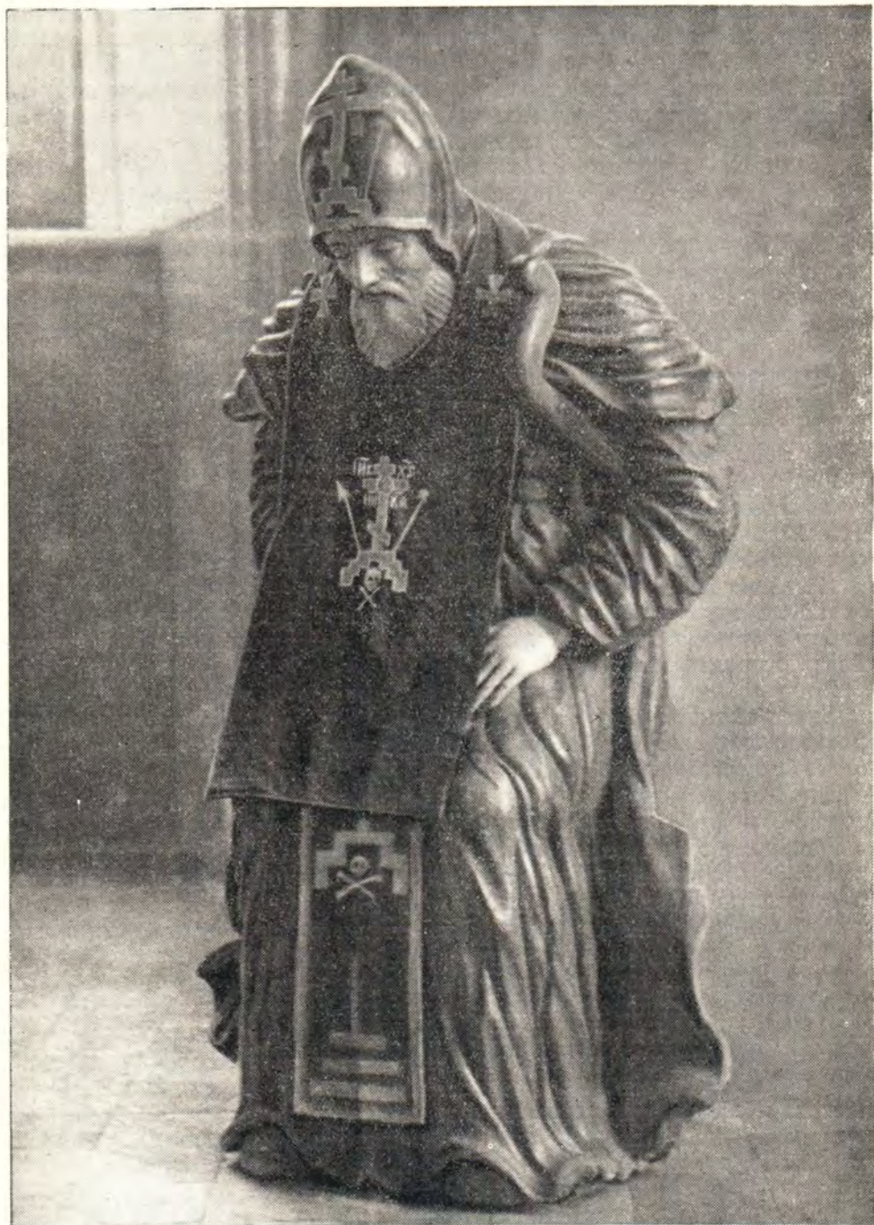
ПРЕПОДОБНЫЙ НИЛ СТОЛОБЕНСКИЙ (деревянная резная скульптура XVII века)

стью Преподобный устремился в пустынное место, «яко птица на гнездо свое», по выражению писателя его Жития. Полагаясь всецело на Промысл Божий, он обошел много мест, пока, по указанию свыше, не остановился на берегу реки Черемхи (в Ржевском уезде). Преподобный в усердной молитве испросил Божия благословения на это место. Здесь он поставил себе небольшую хижину и начал новый подвиг