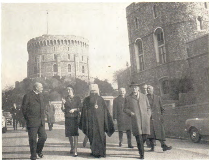
Участники сессии Исполнительного комитета Всемирного Совета Церквей в Виндзорском замке (Англия, 13—16 февраля 1967 г.). Слева направо: д-р Ю. К. Блейк, митрополит Ленинградский и Ладожский Никодим, д-р И. Громадка, пастор М. Нимёллер, д-р Нортем, д-р Р. Чандран