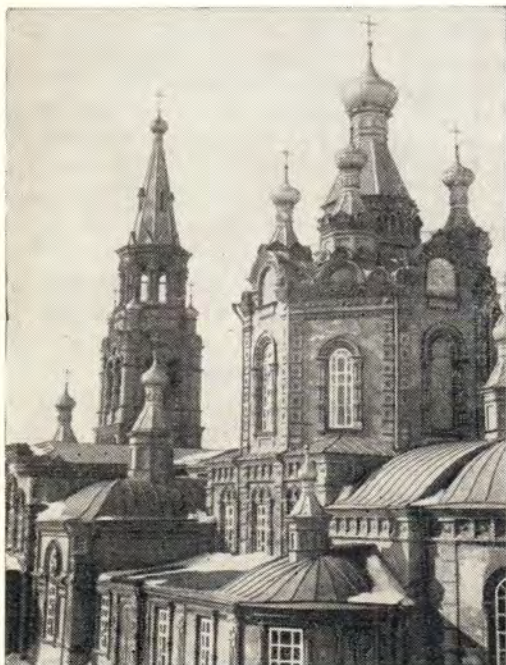
Знаменский храм в Осташкове