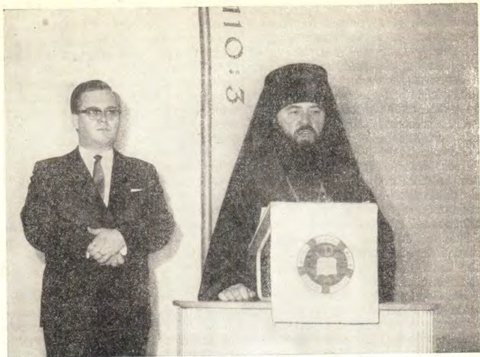
Епископ Зарайский Ювеналий оглашает Послание Святейшего Патриарха Алексия на торжественном акте, посвященном 40-летию патриарших общин в Финляндии, 19 февраля 1967 года

ловек. В числе гостей были Глава Финской Православной Церкви Архиепископ Павел, епископ Гельсингфорский Александр, епископы Евангелическо-Лютеранской Церкви Карл Эрих Форсел и Элис Гулин с супругой, православное духовенство города, члены церковных советов собора и наших общин и представители их прихожан, профессора университета, представители прессы.