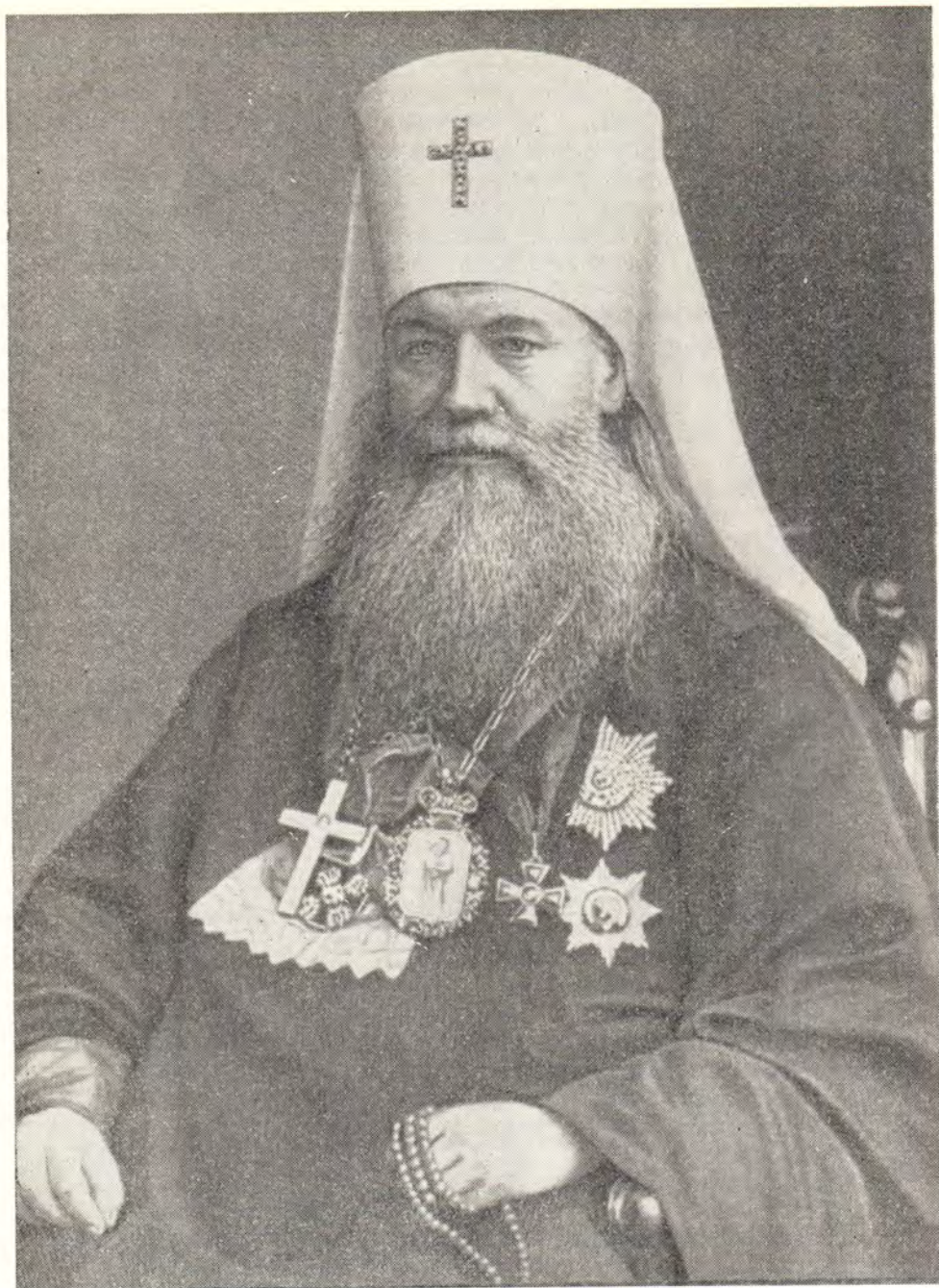
МИТРОПОЛИТ МАКАРИЙ (Булгаков)

веровавшего человека, одного из ученейших богословов и историков нашей Церкви, митрополита-академика Макария (в мире Михаила Петровича Булгакова).