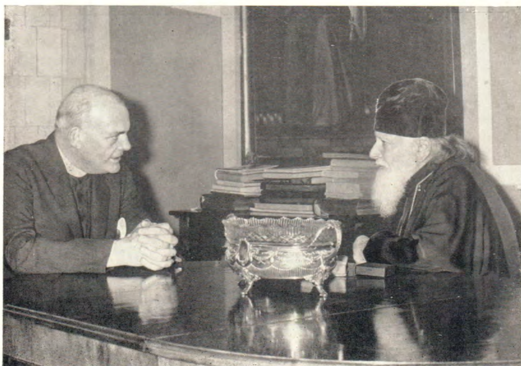
29 марта 1967 года Святейший Патриарх Алексий принял в патриарших покоях в Троице-Сергиевой Лавре генерального секретаря Всемирного Совета Церквей Ю. К. Блейка и имел с ним беседу