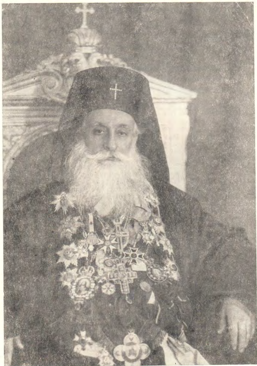
ВЫСОКОПРЕОСВЯЩЕННЫЙ ИЛИЯ САЛИБИ, МИТРОПОЛИТ БЕИРУТСКИЙ