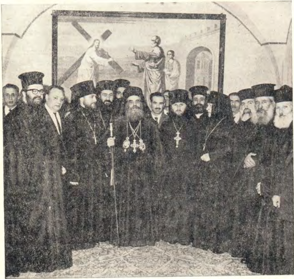
ПРИЕМ ПО СЛУЧАЮ ДНЯ ТЕЗОИМЕНИТСТВА СВЯТЕЙШЕГО ПАТРИАРХА АЛЕКСИЯ В РУССКОЙ ДУХОВНОЙ МИССИИ В ИЕРУСАЛИМЕ. БЛАЖЕННЕЙШИЙ ПАТРИАРХ СВЯТАГО ГРАДА ИЕРУСАЛИМА И ВСЕЯ ПАЛЕСТИНЫ ВЕНЕДИКТ I В ОКРУЖЕНИИ ГРЕЧЕСКОГО, АРАБСКОГО ДУХОВЕНСТВА И ЧЛЕНОВ РУССКОЙ ДУХОВНОЙ МИССИИ.

Речь митрополита Исидора дополнил архиепископ Хрисанф, сказав, что на него возложена почетная миссия представлять на этом торжестве Блаженнейшего Патриарха Иерусалимского Венедикта и что он прибыл из Старого Города, чтобы помолиться за Святейшего Патриарха Алексия. «Наше сердце всегда открыто, и мы всегда с Вами. Мы