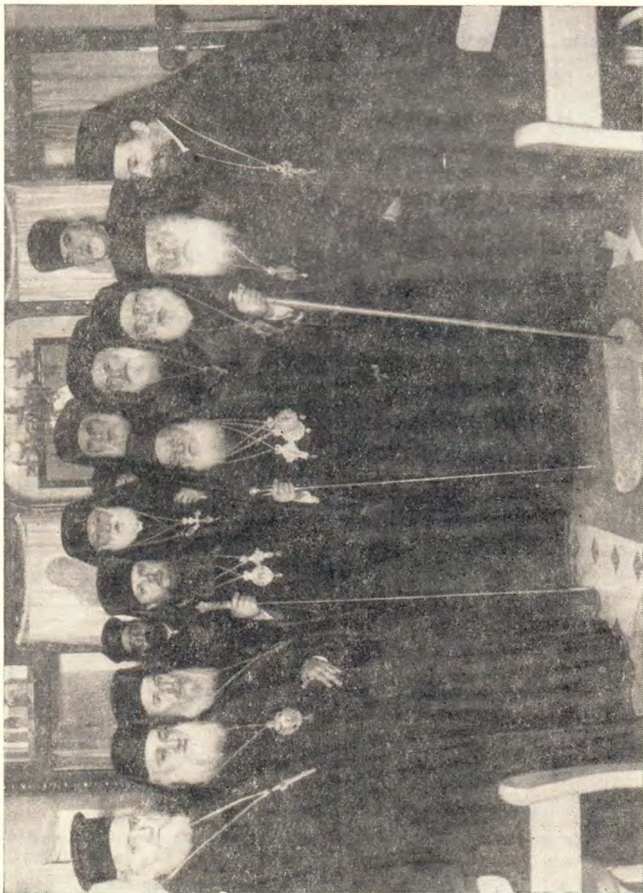
ИЕРАРХИ АНТИОХИЙСКОЙ ЦЕРКВИ В ХРАМЕ ПРЕДСТАВИТЕЛЬСТВА МОСКОВСКОЙ ПАТРИАРХИИ В ДАМАСКЕ В ДЕНЬ ПРАЗДНОВАНИЯ ТЕЗОИМЕННИТСТВА СВЯТЕЙШЕГО ПАТРИАРХА АЛЕКСИЯ (25 февраля 1963 г.)