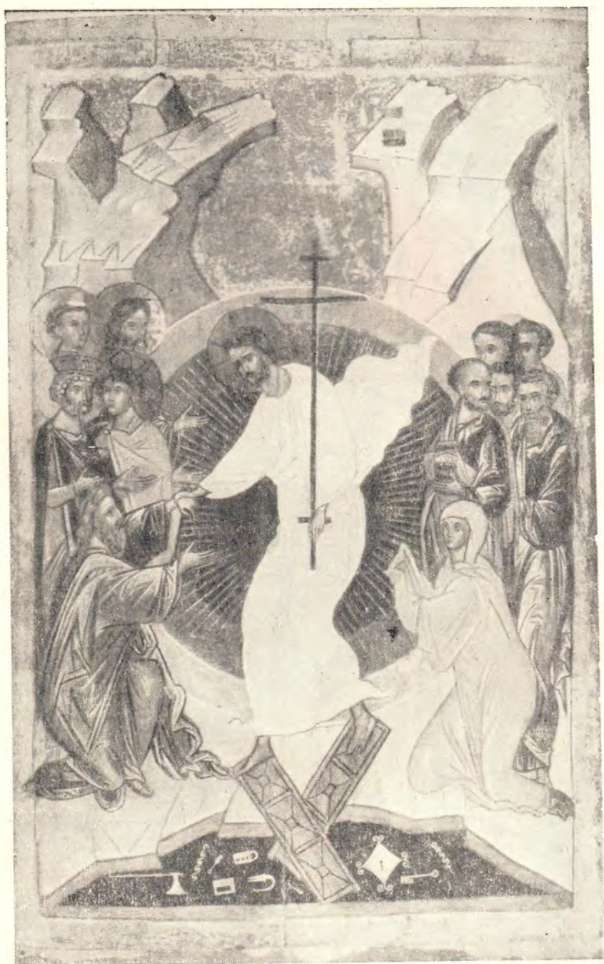
ВОСКРЕСЕНИЕ ХРИСТОВО Икона Новгородской школы (XV век)