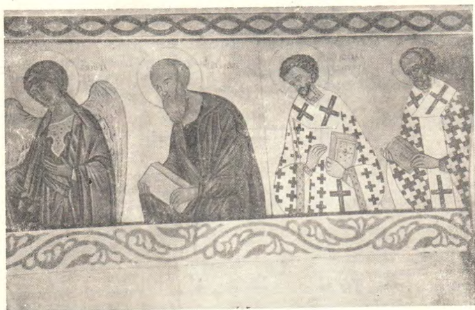
ДЕИСИС (правая сторона). Из росписи иконостаса в приделе храма св. ап. Филиппа в Новгороде