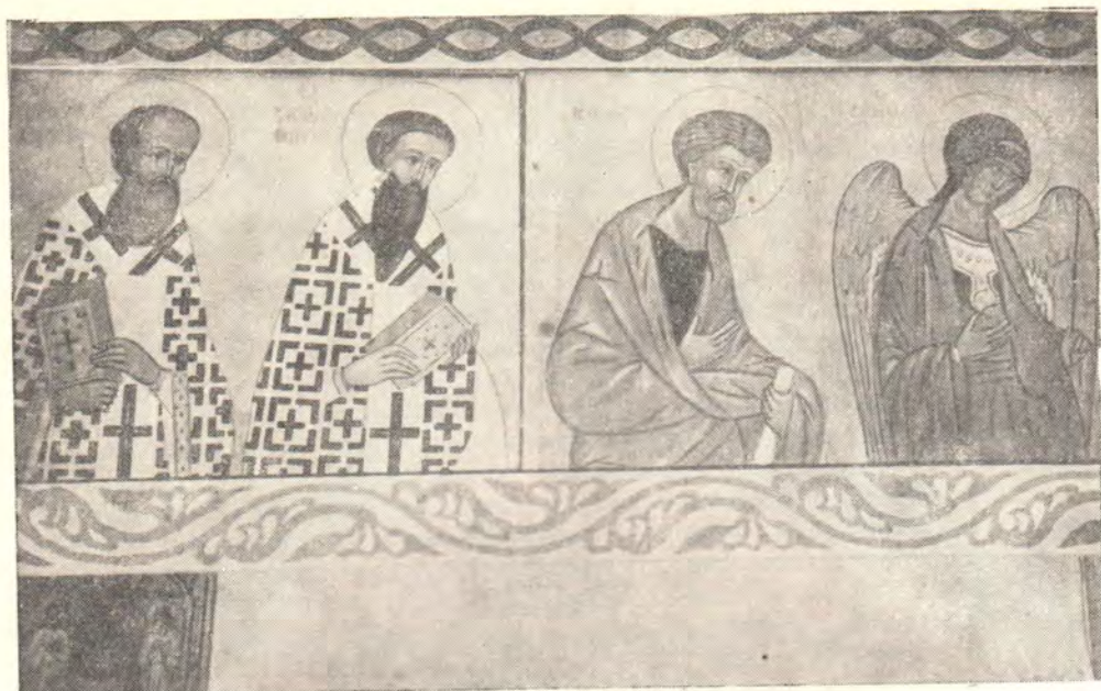
ДЕИСИС (левая сторона). Из росписи иконостаса в приделе храма св. ап. Филиппа в Новгороде