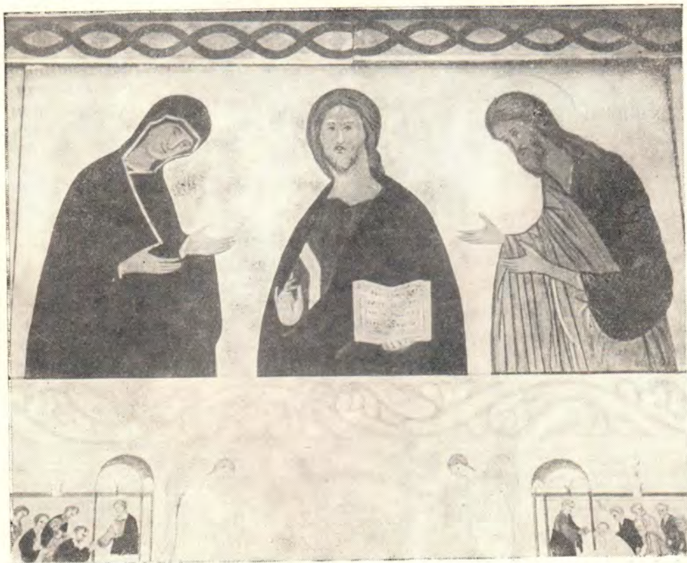
ДЕИСИС (центральная часть).

Изображения заключены в декоративные рамки. По аркам расположены широкие пояса декоративных украшений в виде сплошного листовенного орнамента. В барабане помещены монументальные фигуры архангелов Михаила, Гавриила и др., представленных стоящими на постаментах декоративного характера. Под ними изображена декоративная балюстрада. Ниже, среди декоративного орнамента, представлены в кругах изображения Иисуса Христа, Богоматери и Иоанна Предтечи. В парусах — изображения евангелистов. В левом, северном,