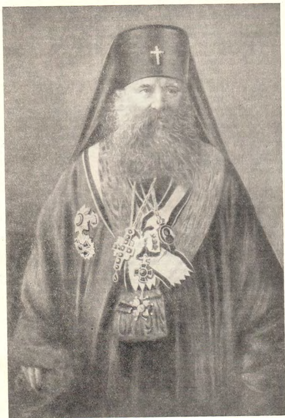
БЛАЖЕННЕЙШИЙ ГРИГОРИИ IV, ПАТРИАРХ АНТИОХИИ И ВСЕГО ВОСТОКА