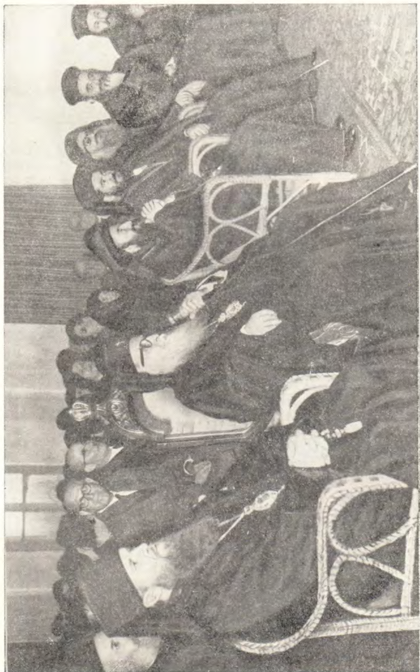
ТОРЖЕСТВЕННОЕ ЗАСЕДАНИЕ В ЧЕСТЬ МИТРОПОЛИТА БЕБРУТСКОГО ИЛИИ САЛИБИ. В ЗАЛЕ ВО ВРЕМЯ ЧЕСТВОВАНИЯ ЮБИЛЕЯ