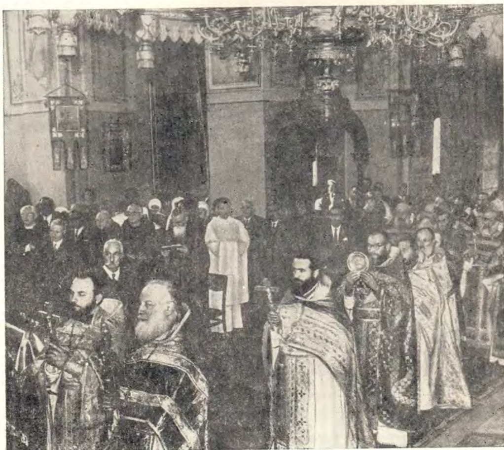
ЗА БОЖЕСТВЕННОЙ ЛИТУРГИЕЙ В СЯТО-ТРОИЦКОМ СОБОРЕ РУССКОЙ ДУХОВНОЙ МИССИИ В ИЕРУСАЛИМЕ ПО СЛУЧАЮ ДНЯ ТЕЗОИМЕНИТСТВА СЯТЕЙШЕГО ПАТРИАРХА АЛЕКСИЯ. ВЕЛИКИЙ ВХОД

В этот знаменательный день я не могу умолчать о высоком нашем юбиларе. Святейший Патриарх Алексий родился в Москве 85 лет тому назад. После окончания Московского университета и Московской духовной академии вся жизнь его, посвященная служению Церкви Христовой, представляет горение духа и стремление к Богу.