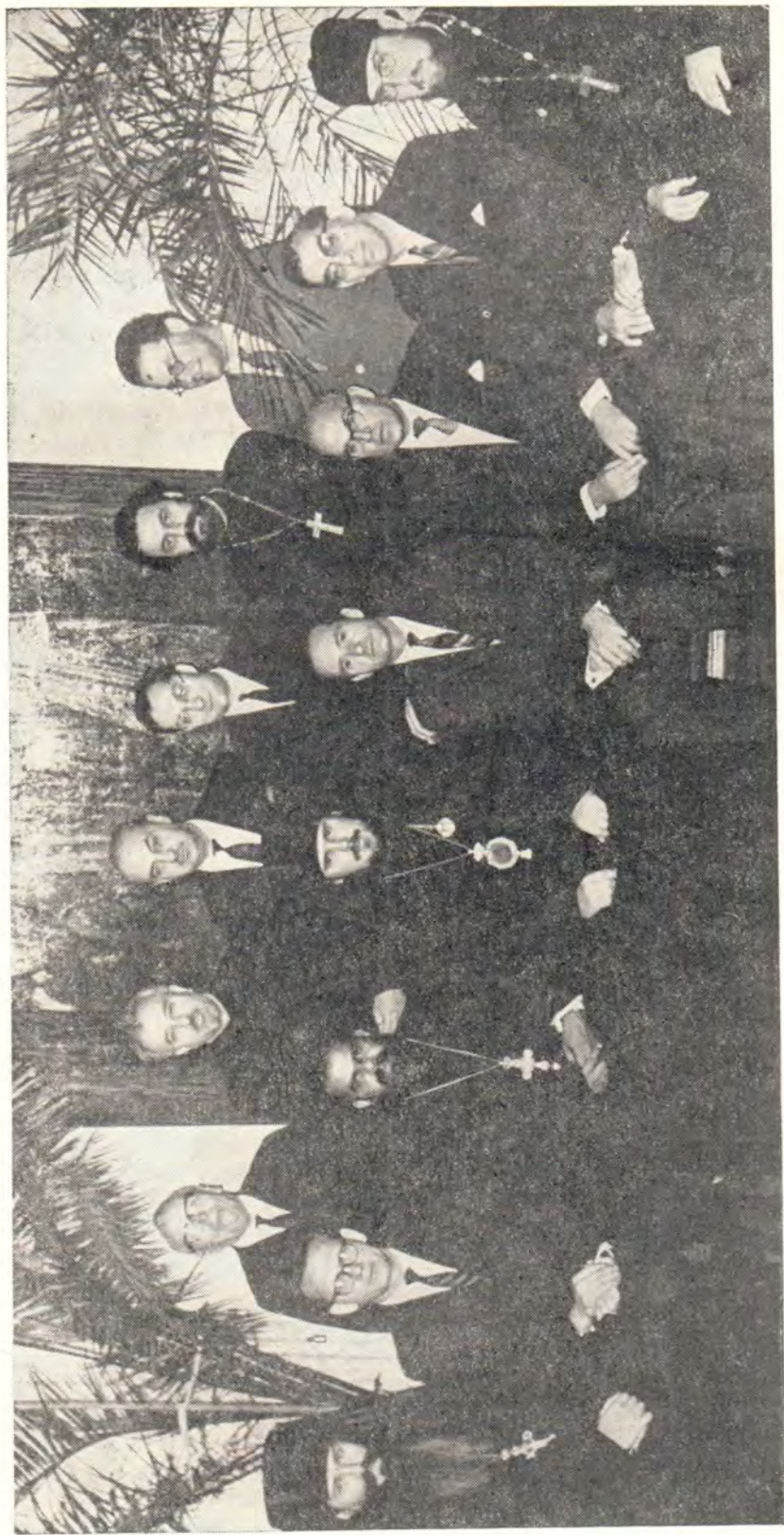
РАБОТНИКИ АППАРАТА ВСЕМИРНОГО СОВЕТА ЦЕРКВИ СРЕДИ СОТРУДНИКОВ ОТДЕЛА ВНЕШНИХ ЦЕРКОВНЫХ СНОШЕНИИ