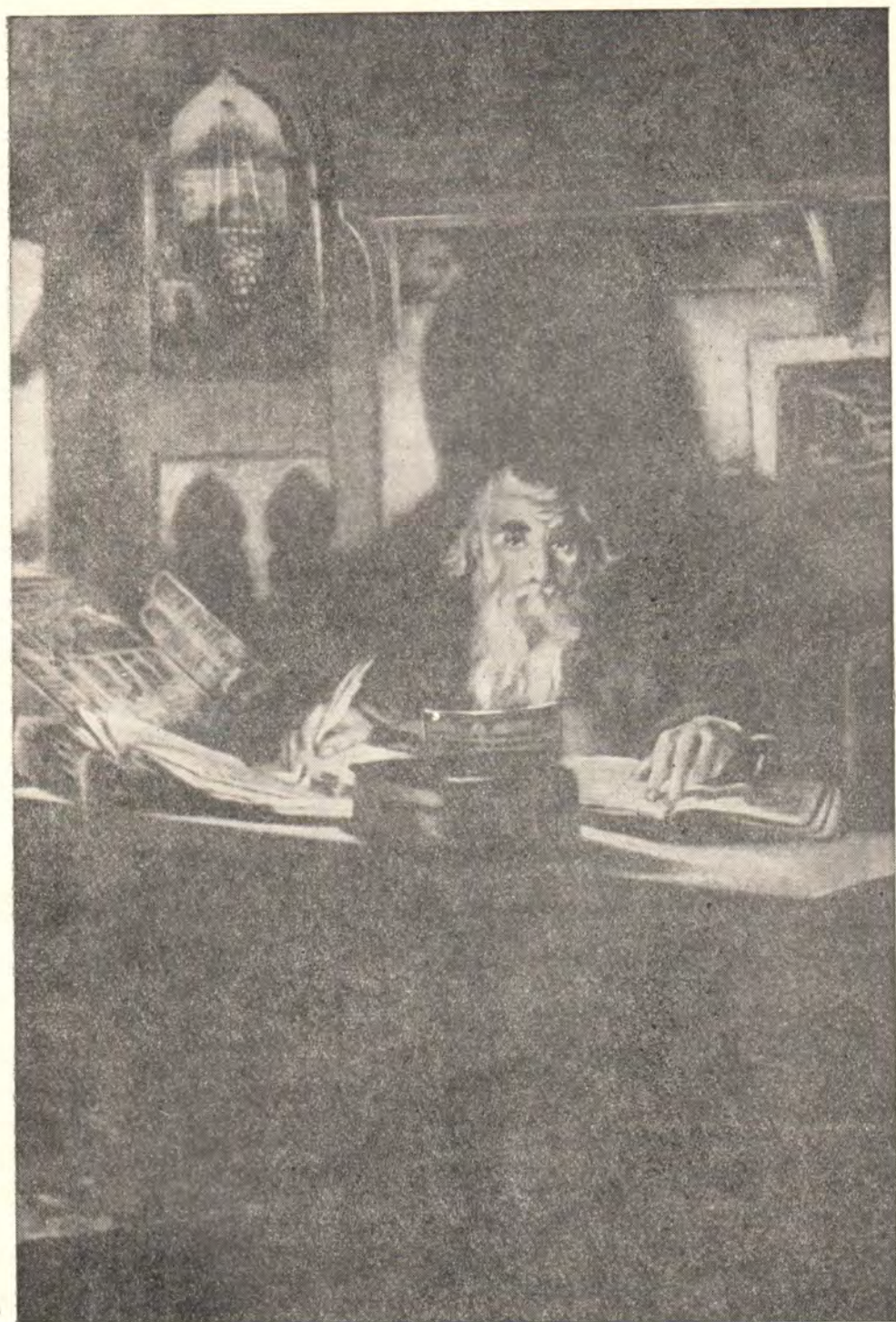
ИЕРОМОНАХ ПАИСИЙ ХИЛЕНДАРСКИЙ