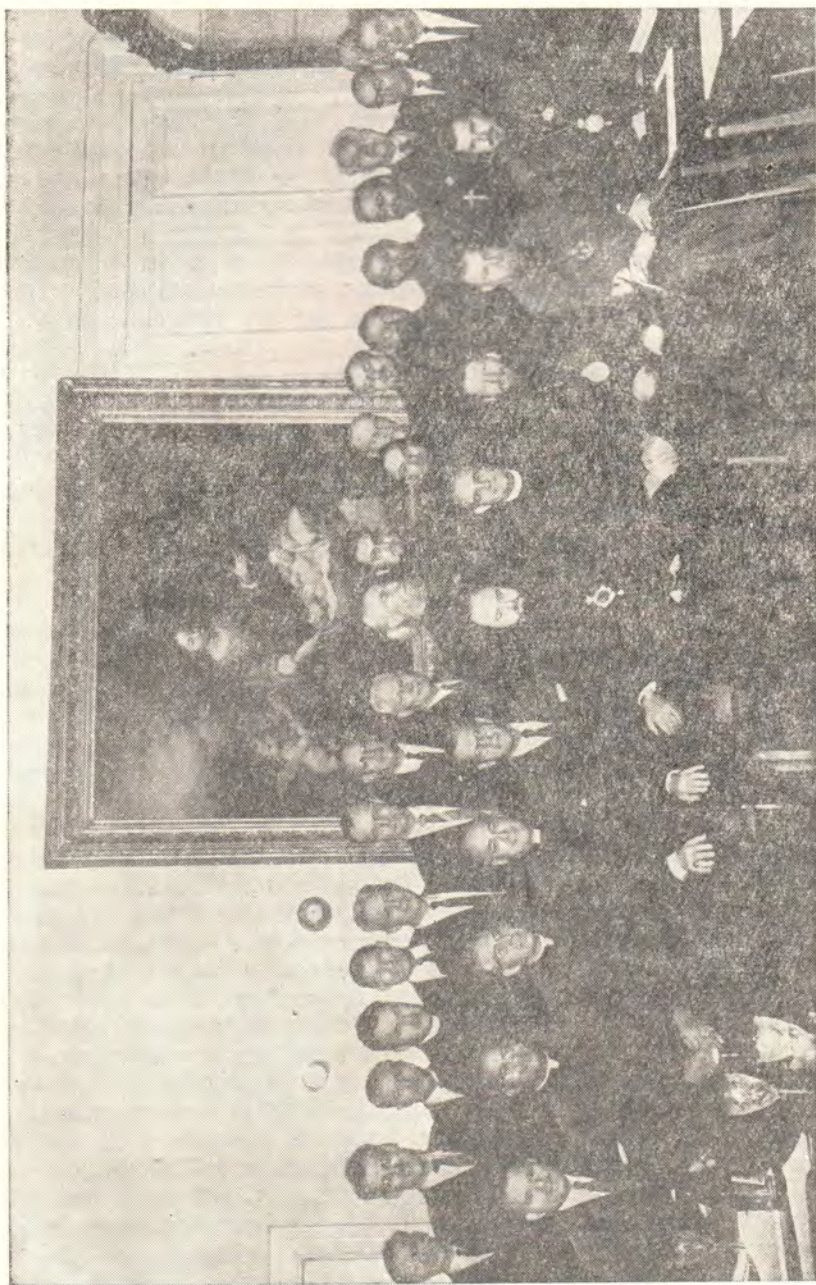
ДЕЯТЕЛИ РУССКОЙ ПРАВОСЛАВНОЙ ЦЕРКВИ И НАЦИОНАЛЬНОГО СОВЕТА ЦЕРКВЕИ ХРИСТА В США В ОТДЕЛЕ ВНЕШНИХ ЦЕРКОВНЫХ СНОШЕНИЙ МОСКОВСКОЙ ПАТРИАРХИИ