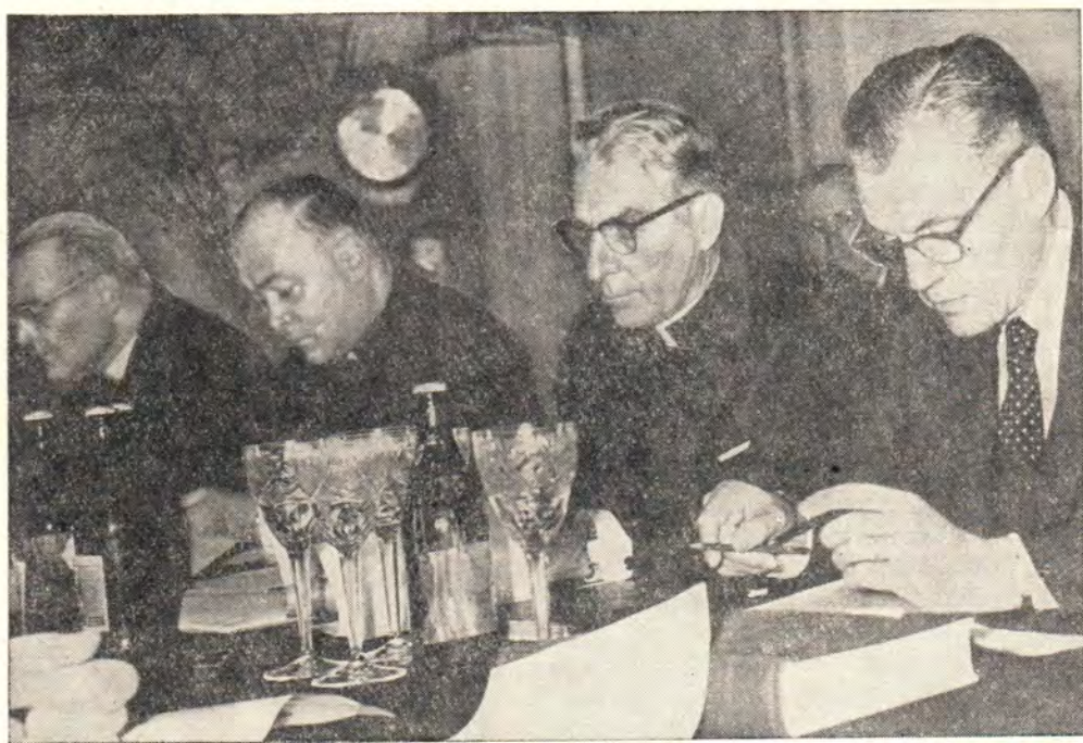
ГРУППА ЧЛЕНОВ ДЕЛЕГАЦИИ НАЦИОНАЛЬНОГО СОВЕТА ЦЕРКВЕИ ХРИСТА В США НА СОБЕСЕДОВАНИИ