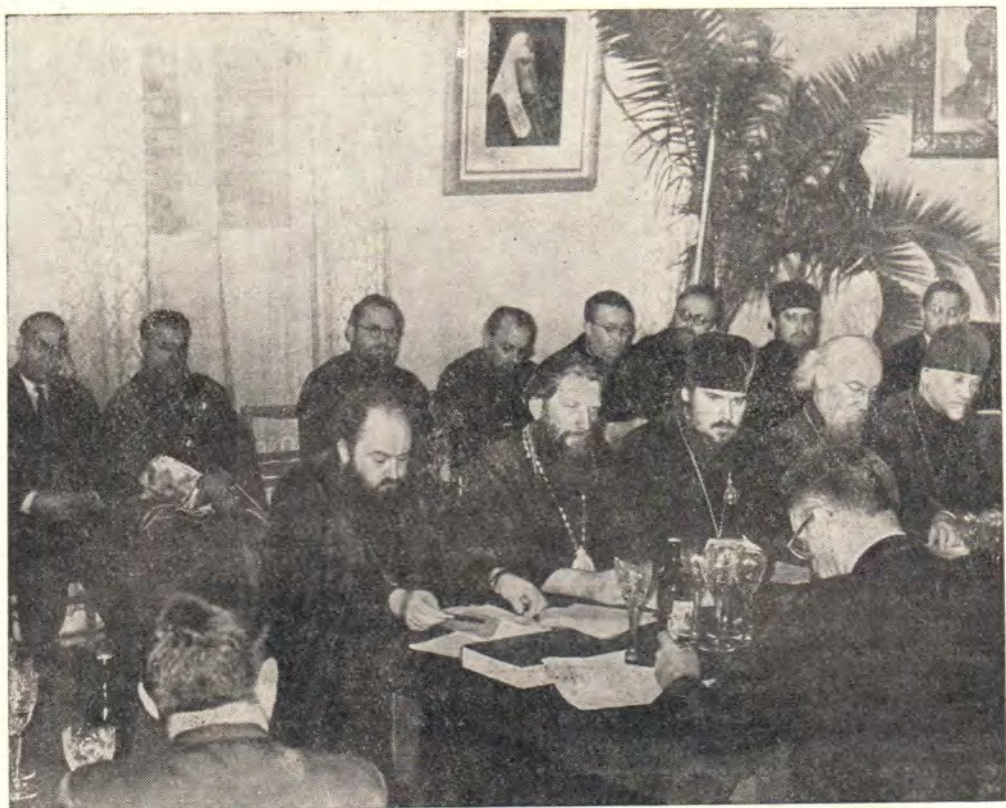
ДЕЛЕГАЦИЯ РУССКОЙ ПРАВОСЛАВНОЙ ЦЕРКВИ НА СОБЕСЕДОВАНИИ