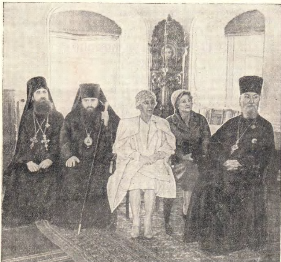
БЕЛЬГИЙСКАЯ КОРОЛЕВА ЕЛИЗАВЕТА В МОСКОВСКОЙ ДУХОВНОЙ АКАДЕМИИ

Затем состоялось выступление студенческого хора. Приветливо по-дав руку каждому хористу в отдельности, королева Елизавета и сопровождавшие ее лица ознакомились с достопримечательностями академии: побывали в академическом храме в честь Покрова Божией Матери; осмотрели выставку памяти Московского митрополита Филарета, комнату, в которой провел студенческие годы ныне здравствующий Святейший Патриарх Алексий, и церковно-археологический кабинет.