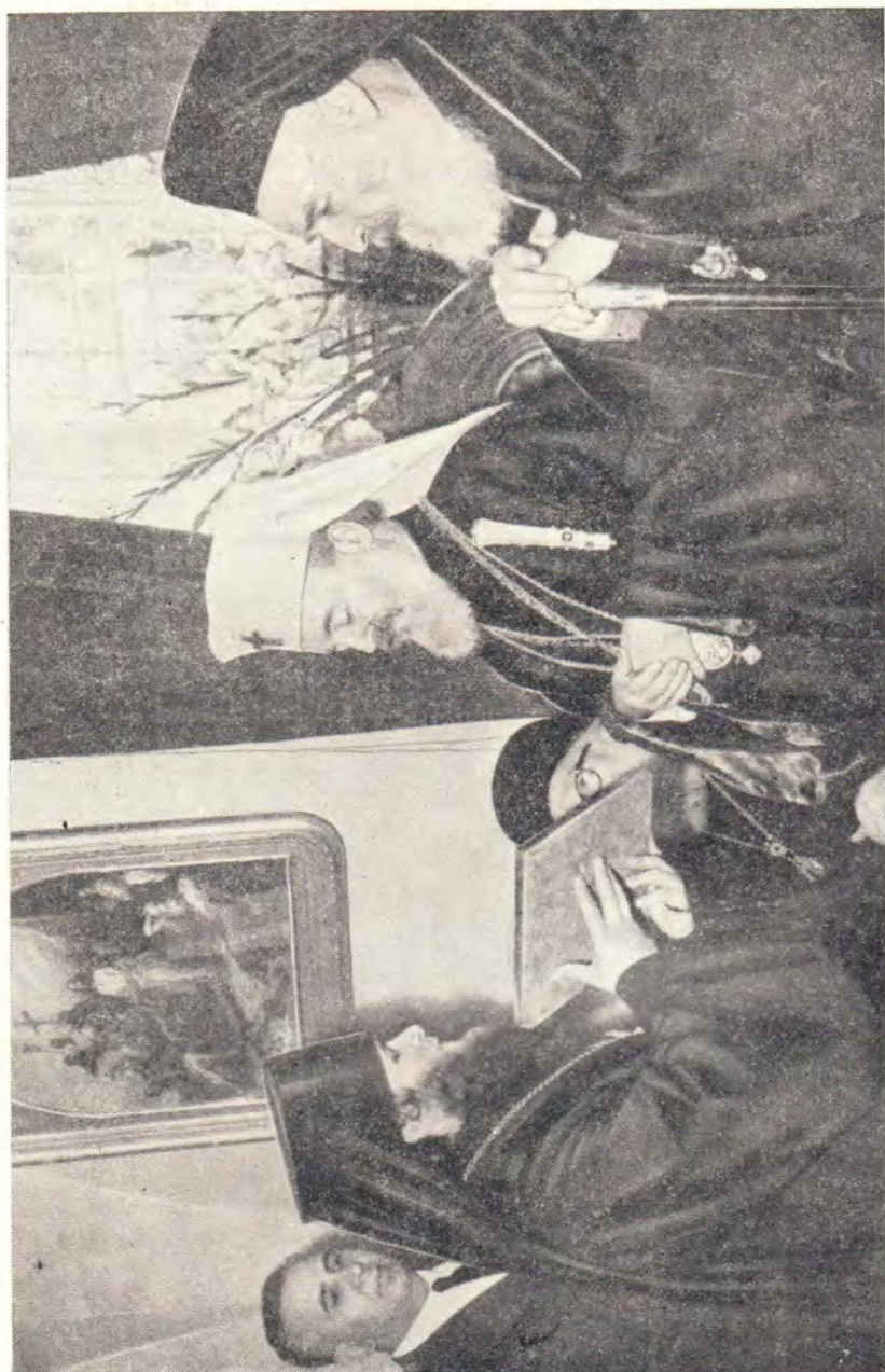
АРХИМ. ВАРФОЛОМЕЙ ПРЕПОДНОСИТ СВЯТЕЙШЕМУ ПАТРИАРХУ КИРИЛЛУ ОБРАЗ БОЖИЕЙ МАТЕРИ В ДЕНЬ ПОСЕЩЕНИЯ РУССКОЙ ДУХОВНОЙ МИССИИ В ИЕРУСАЛИМЕ 10 апреля 1962 года