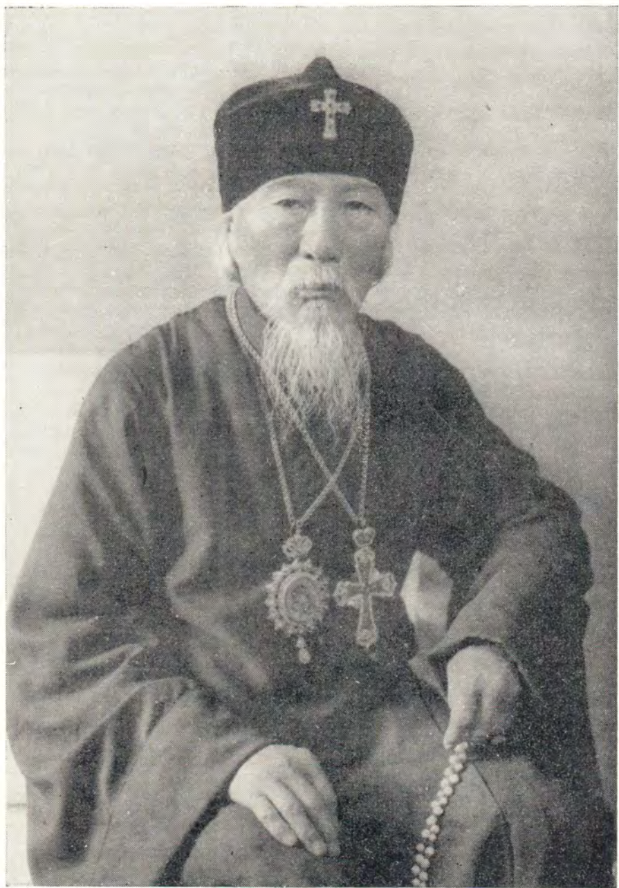
ВАСИЛИИ, ЕПИСКОП ПЕКИНСКИЙ