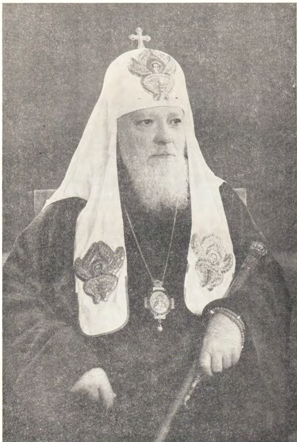
СВЯТЕЙШИЙ ПАТРИАРХ МОСКОВСКИЙ И ВСЕЯ РУСИ АЛЕКСИЙ