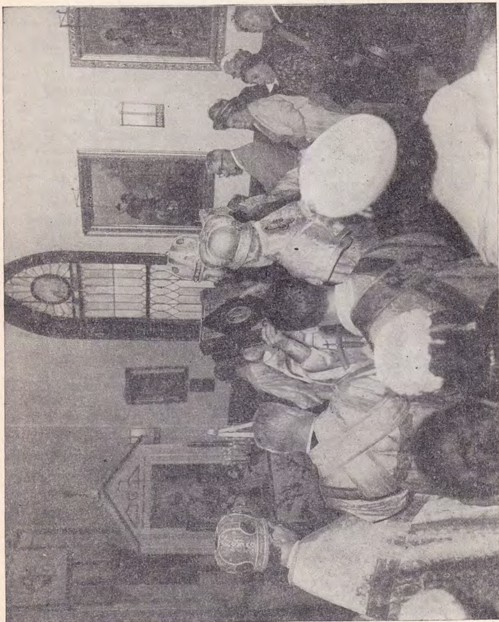
ЭКЗАРХ МИТРОПОЛИТ БОРИС СОВЕРШАЕТ БОЖЕСТВЕННУЮ ЛИТУРГИЮ В САН-ФРАНСИССКОМ СОБОРЕ ВО ИМЯ СВЯТ. НИКОЛАЯ