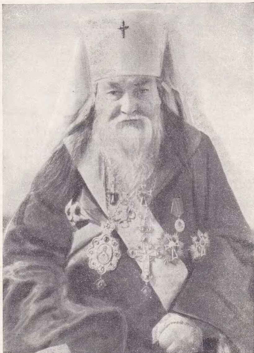
ВЫСОКОПРЕОСВЯЩЕННЫЙ ПИТИРИМ, МИТРОПОЛИТ КРУТИЦКИЙ И КОЛОМЕНСКИЙ