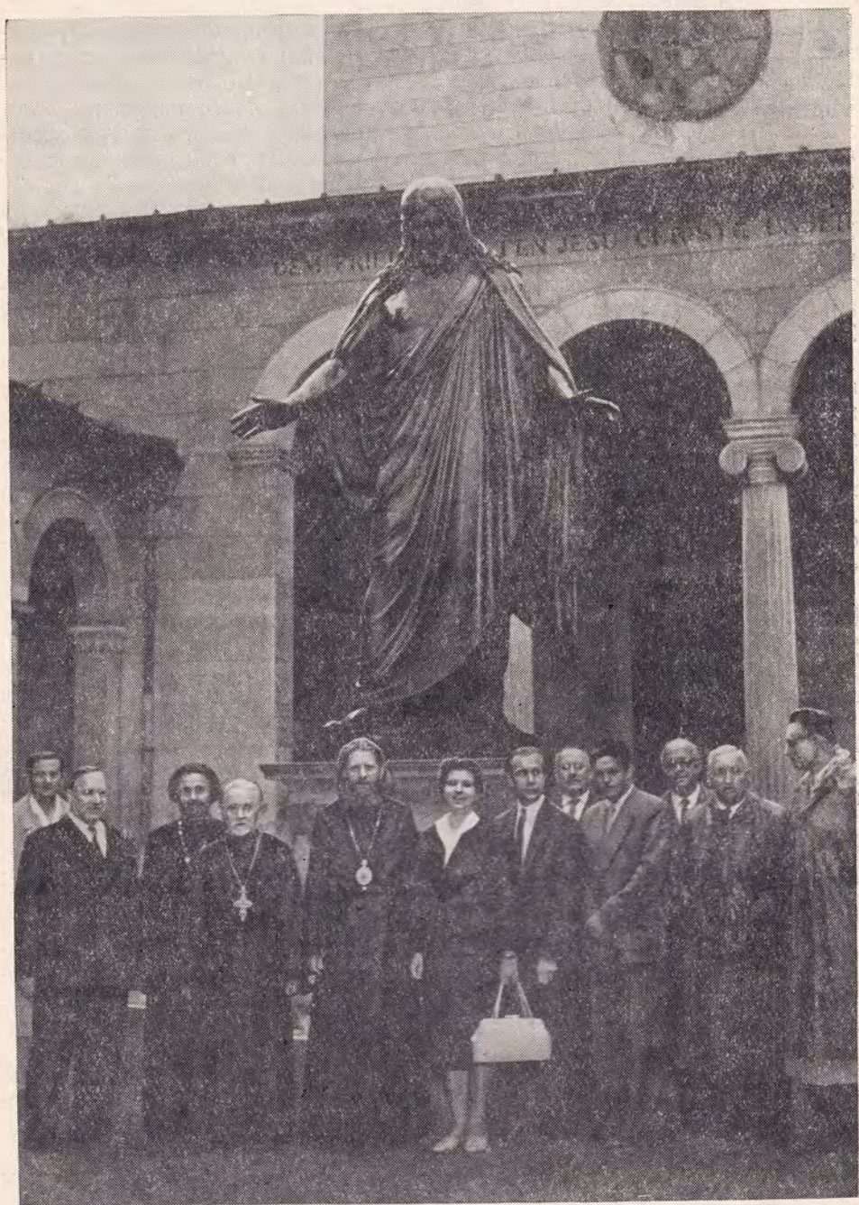
ГРУППА ДЕЯТЕЛЕЙ РУССКОЙ ПРАВОСЛАВНОЙ И ГЕРМАНСКОЙ ЕВАНГЕЛИЧЕСКО-ЛЮТЕРАНСКОЙ ЦЕРКВЕИ У ХРАМА МИРА В ПОТСДАМЕ (ГДР)