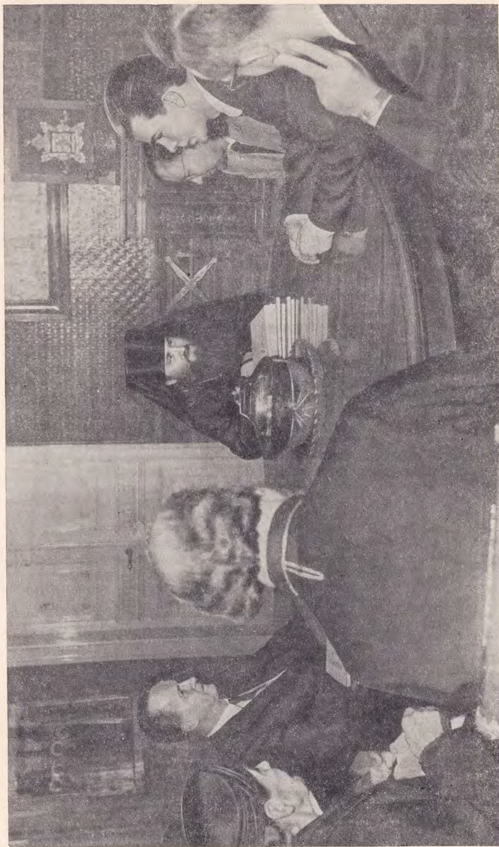
ДЕЛЕГАТЫ «СОЮЗА МОЛИТВЫ» РЕФОРМАТСКОЙ ЦЕРКВИ ФРАНЦИИ НА ПРИЕМЕ У ПРЕДСЕДАТЕЛЯ ОТДЕЛА ВНЕШНИХ ЦЕРКОВНЫХ СНОШЕНИИ МОСКОВСКОЙ ПАТРИАРХИИ ЕПИСКОПА НИКОДИМА