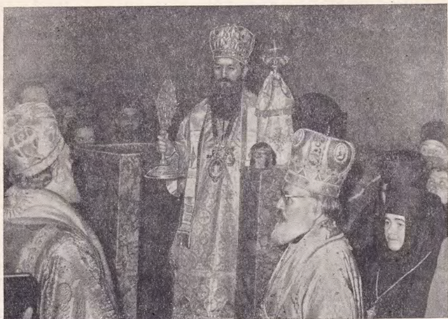
СВЯТЕЙШИЙ ПАТРИАРХ ГЕРМАН НА ДРЕВНЕМ ТРОНЕ СЕРБСКИХ ПАТРИАРХОВ В ЛАВРЕ ПЕЧСКОЙ ПАТРИАРХИИ ПОСЛЕ ИНТРОНИЗАЦИИ

Расписавшись, члены Собора перешли в переполненный храм Св. Спаса, где началась торжественная литургия, которую совершали Святейший Патриарх Герман, Митрополиты Дамаскин и Нектарий, епископы Емилиан (Тимокский) и Климент с шестью священниками и при четырех диаконах. Пел хор Первого белградского певческого общества.