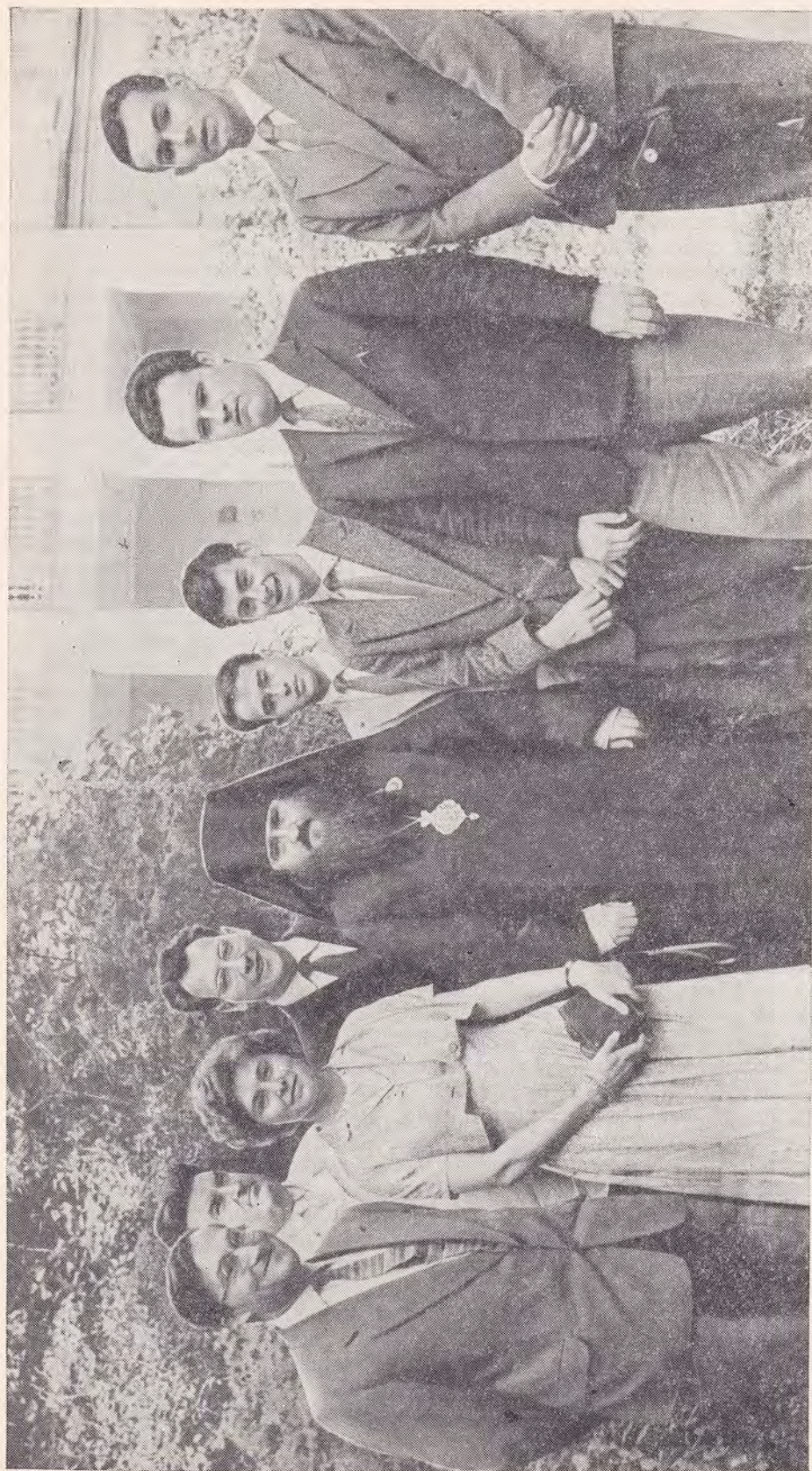
ЕПИСКОП НИКОДИМ С ГРУППОЙ ПРАВОСЛАВНОЙ МОЛОДЕЖИ ЗАПАДНОЕВРОПЕЙСКОГО ЭКЗАРХАТА В САДУ МОСКОВСКОЙ ПАТРИАРХИИ