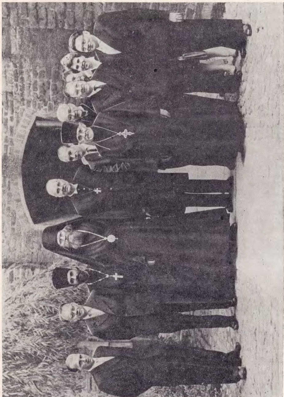
ГРУППА ПРЕДСТАВИТЕЛЕЙ РУССКОЙ ПРАВОСЛАВНОЙ ЦЕРКВИ ВО ГЛАВЕ С ЕПИСКОПОМ БЕРЛИНСКИМ И ГЕРМАНСКИМ ИОАННОМ СРЕДИ БОГОСЛОВОВ ЕВАНГЕЛИЧЕСКО-ЛЮТЕРАНСКОЙ ЦЕРКВИ У ВХОДА В ЦЕРКОВЬ СВ. МАРИИ В ГРЕЙСВАЛЬДЕ (ГДР)