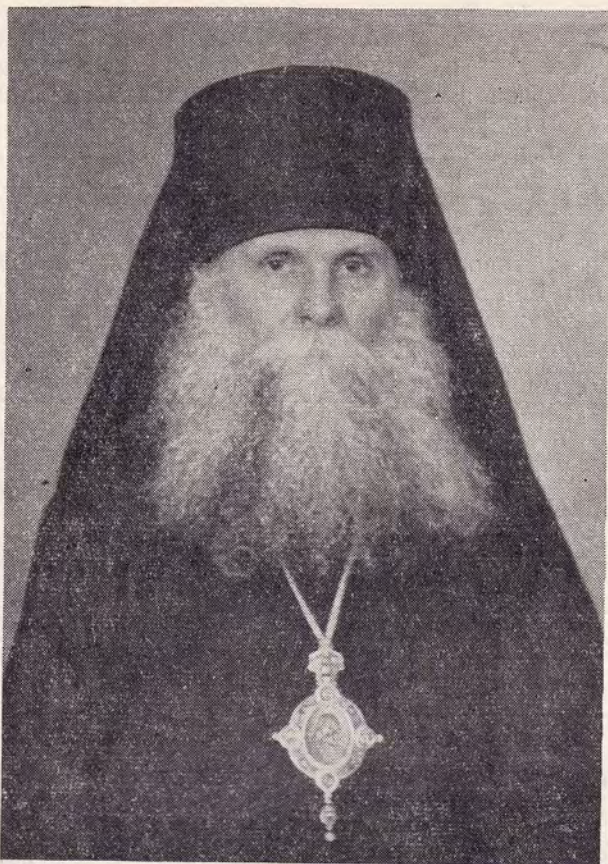
НИКОЛАЙ, ЕПИСКОП ЧЕБОКСАРСКИЙ И ЧУВАШСКИЙ